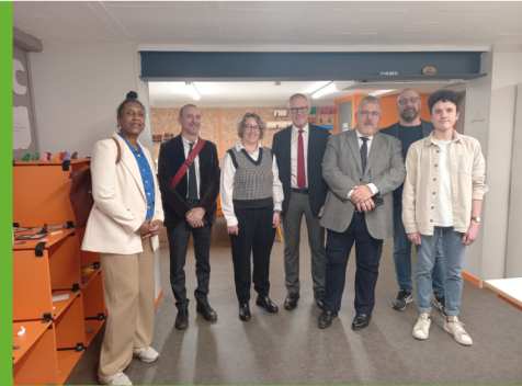
La MJC a reçu à cette occasion Mr Le Préfet de l'Aude et Mr le Maire