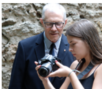
Ex. de prestations : chasse aux trésors pour Habitat Audois / séance photos de l'équipe municipale