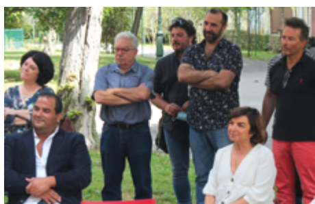
/ 10 juillet 2020 Inauguration de la CJS Job'Co à la MJC en présence des officiels et partenaires

Le projet s'appuie sur la construction d'un partenariat local avec un parrain jeunesse (la MJC de Lézignan-Corbières, avec l'implication de plusieurs bénévoles et de l'équipe salariée), un parrain économique (la coopérative d'activité et d'emploi SCIC SAPIE de Limoux qui assure le portage juridique), et un comité local de suivi (composé d'acteurs du monde de l'entreprise et de l'éducation et de partenaires financiers).