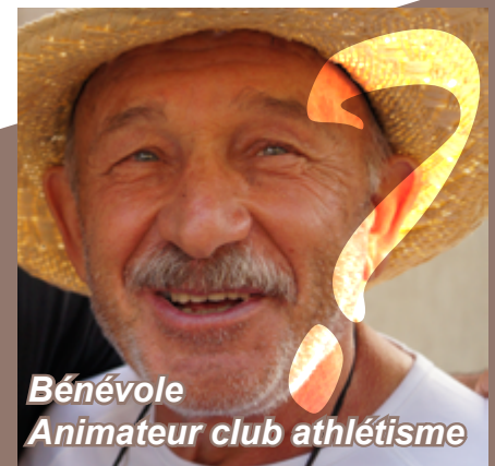
Bénévole Animateur club athlétisme