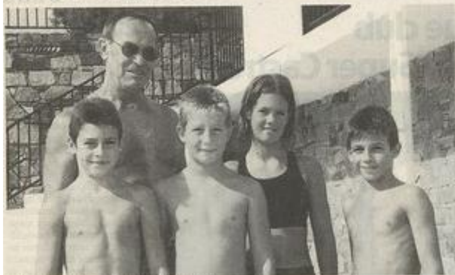
De bonnes places pour les Lézignanais. NDS

Pour la dernière "Traversée de Collioure" avant l'an 2000, lundi dernier, cinq nageurs Lézignanais ont pris le départ de la course des jeunes, soit un kilomètre de la plage au port de la célèbre station de la Côte Vermelle.