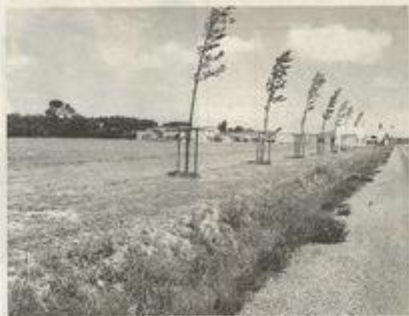
Une parcelle de 2 ha a été acquise par la SA St Auriol à Gaujac.

Dernière séance avant les vacances : urbanisme, économie et vie culturelle.