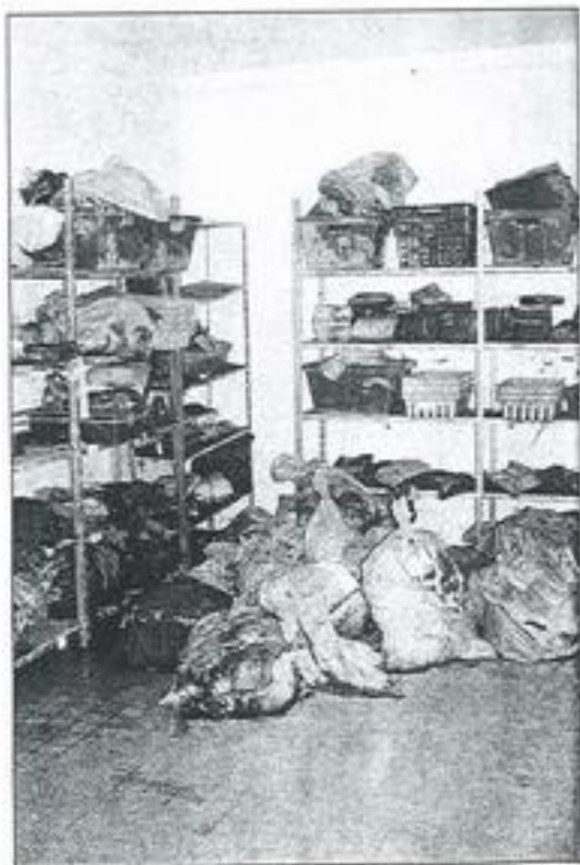
Le centre de tri s'est installé dans les locaux de la MJC.

Depuis ce matin, le courrier noyé dans les inondations est distribué dans les boîtes aux lettres. Le centre de tri a été déplacé à la MJC pour une période indéterminée.