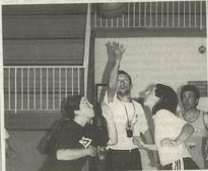
Douze néophytes ont participé à la première rencontre. N.D.-B.

Pour que les parents des jeunes basketteurs comprennent toutes les subtilités du sport, rien de mieux que de le pratiquer soi-même.