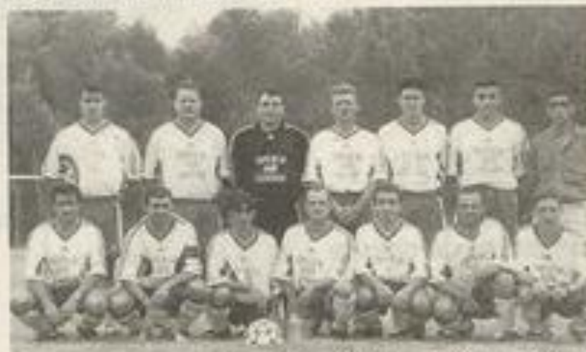
Le LFC a baissé les armes face à Clermont-l'Hérault (0-3), pas les bras.

Bon arbitrage de M. Abdelmoumen et de ses deux assistants au cours d'un match qui a vu s'opposer deux bonnes équipes qui évoluent à trois divisions d'écart.