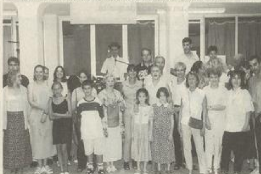
Ils furent 6 500 à participer aux 60 activités proposées tout au long de l'été par les premières Estivades lézignanaises. Les trois-quarts étaient des autochtones.

Dans l'élan. Le partenariat entre la Ville et le service de la Jeunesse et des Sports a permis de proposer un panache d'activités