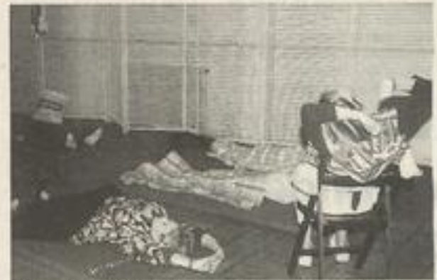
Les cours de sophrologie ont lieu tous les lundis à la MJC.

Vin primeur : Comme le veut la tradition depuis dix ans maintenant, la MJC participe à la fête du vin primeur en organisant le mercredi des ateliers artistiques pour enfant. Au programme cette année : dessin, peinture, poterie, théâtre, danse... un goûter clôture