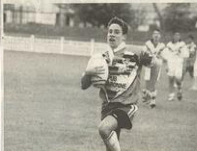
Les Lézignans ont superbement négocié cette rencontre.

Les minimes du FCL XIII ont battu le XIII Catalan au stade du Moulin 28 à 4. Mi-temps 14 à 0. Arbitre M. Sicre du comité de l'Aude. Délégué M. Guy Boutet.