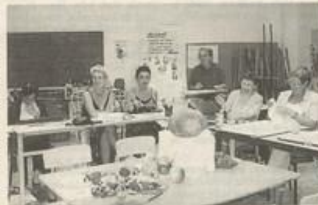
De nombreuses activités sont proposées.