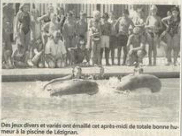
Des jeux divers et variés ont émaillé cet après-midi de totale bonne humeur à la piscine de Lézignan.

Après les traditionnelles courses à l'australienne (avec élimination directe des moins rapides), les vainqueurs, mais aussi les autres... eurent droit à des cadeaux et un goûter.