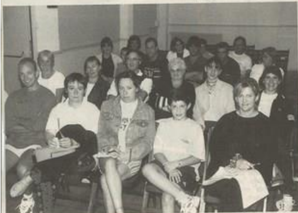
Le club envisage un voyage en Andalousie.

Au terme d'une saison bien remplie, bilan du club de natation. Pendant l'hiver 1998/1999, le club a accueilli 110 enfants (cinq de plus que la saison précédente) parmi eux nous comptons 56 licenciés à la fédération française de natation. Le club a participé à treize compétitions cette année : - deux meetings à Trèbes, - un avenir pousain à Trèbes, - une compétition départementale à Trèbes, - un triathlon à Castelnaudary, - un avenir pousain à Limoux, - trois meetings à Castelnaudary, - un avenir pousain à Castelnaudary,