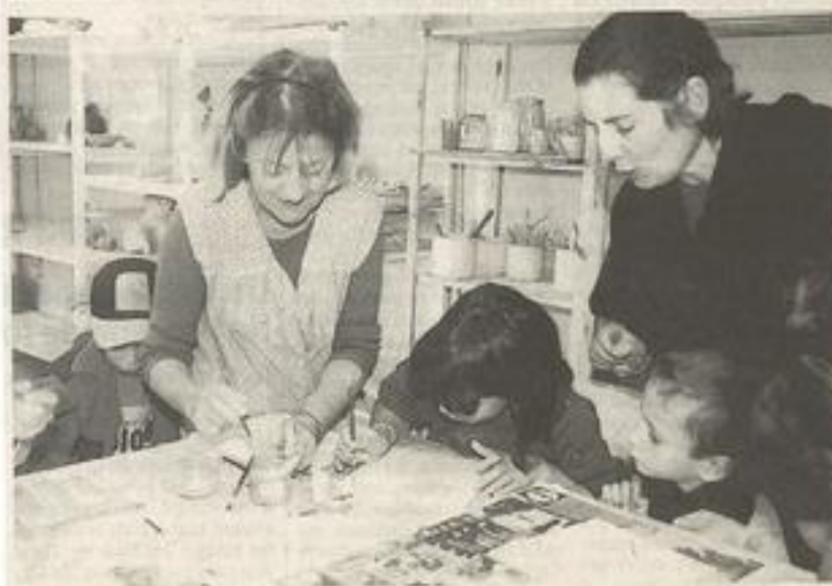
Des crus hauts en couleurs.