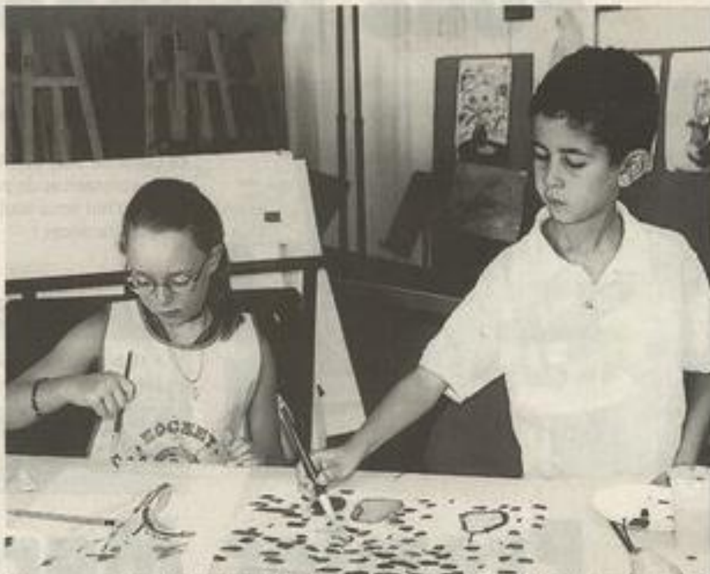
Ces cours, gratuits, ont lieu de 10 h à 12 h à la maison Gibert et à la MJC selon les jours.

tour ». Suggestion acceptée. Jordi retourne à sa place le visage éclairé d'un sourire radieux.