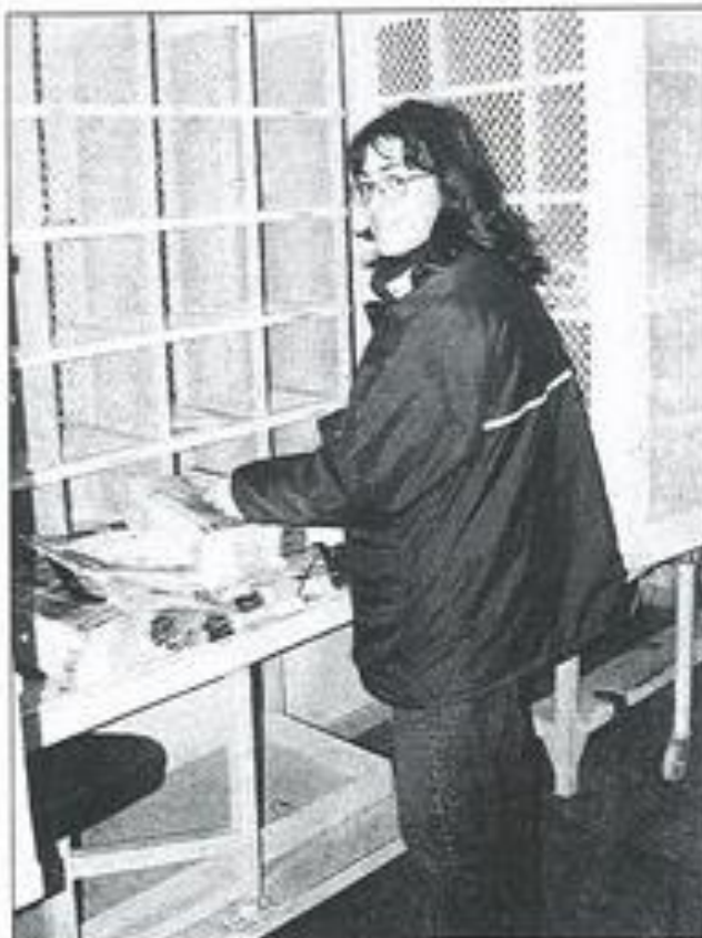
4.000 lettres ont été séchées une par une.