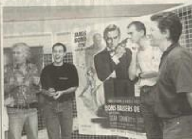
Déjà trente sept ans de carrière pour Mr Bond, et encore il ne vit que deux fois.