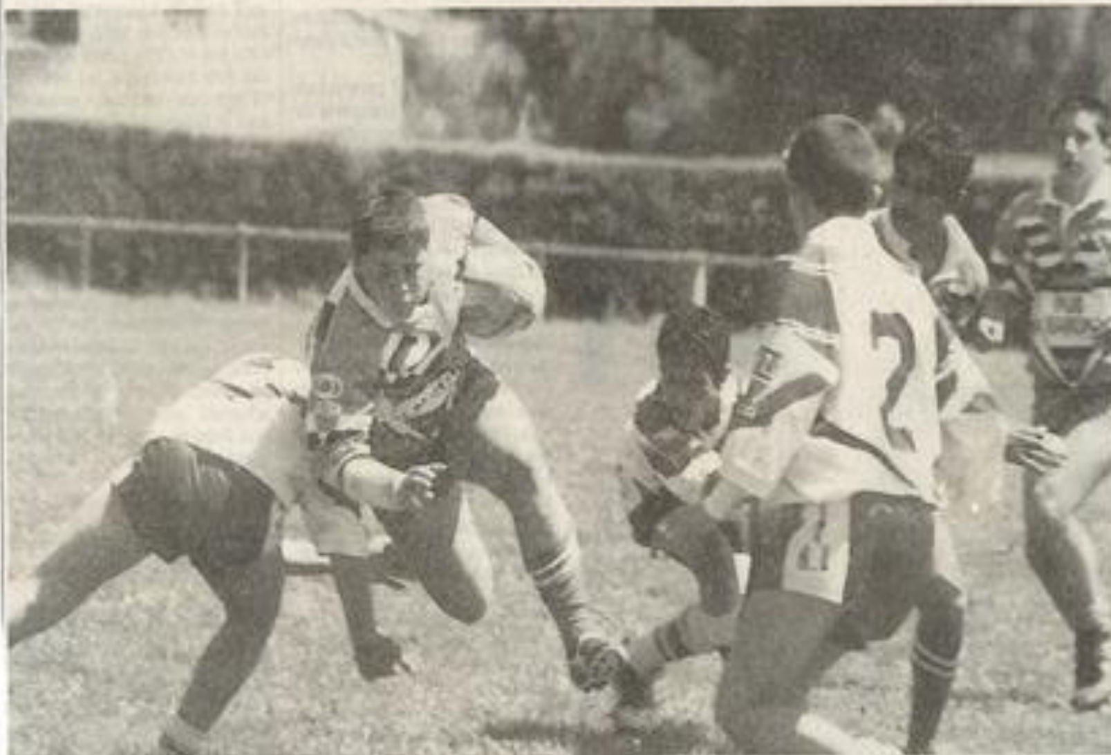
Les minimes ont marqué quatre essais lors de leur rencontre face à Saint-Paul de Fenouillet.

S amedi 11 décembre, se déroulait à Villalier le tournoi intercomité des écoles de rugby (pupilles, poussins, benjamins). L'école lézignanaise y participait et a enregistré les résultats suivants.