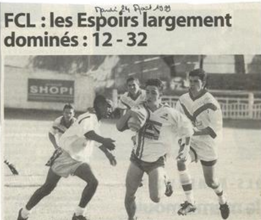
Les espoirs ont souffert du jeu plus élaboré de leurs adversaires.

La semaine dernière, les jeunes pousses lézignanaises, en ouverture de Perpignan - XIII de France s'étaient imposés face à leur homologue catalan.