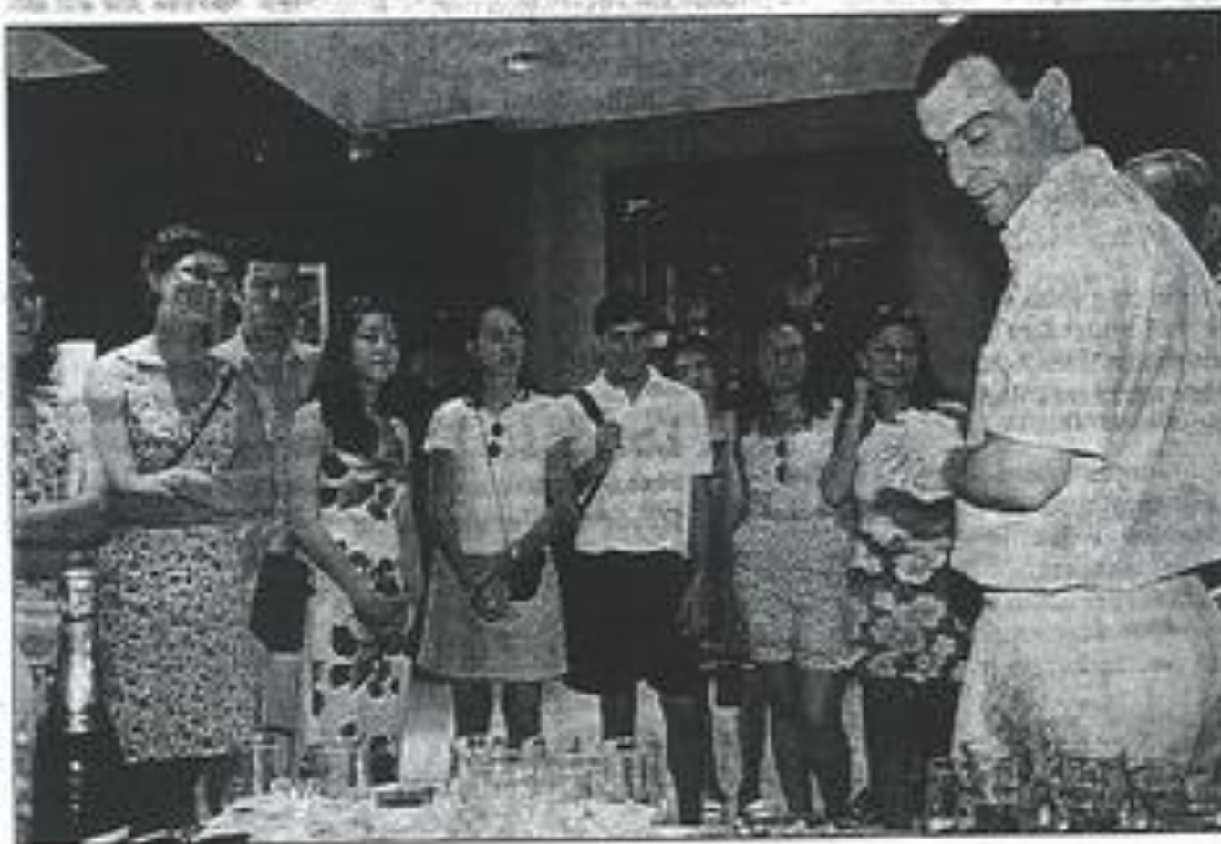
Les jeunes ont goûté aux olives de Bize et aux vins des Corbières.