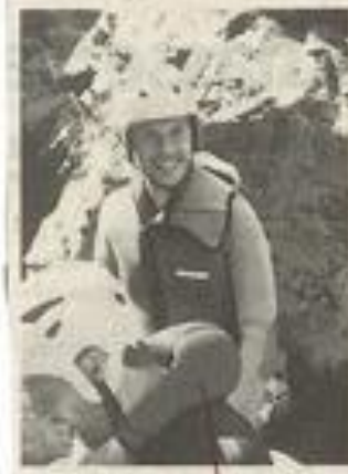
Un projet où chacun s'investit personnellement.

Les pionniers, garçons et filles, s'organisent comme une véritable entreprise. Ils choisissent un projet, un objectif, dans lequel chacun s'investit personnellement.