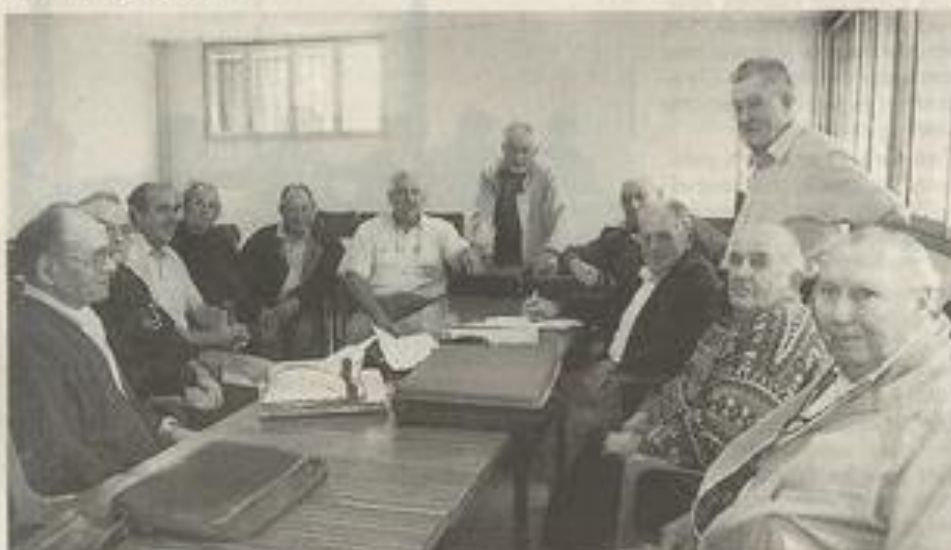
Les philatélistes lézignanaïses ont préparé cette exposition avec passion. NDB

Marc Torrèjon a effectué des recherches approfondies sur les