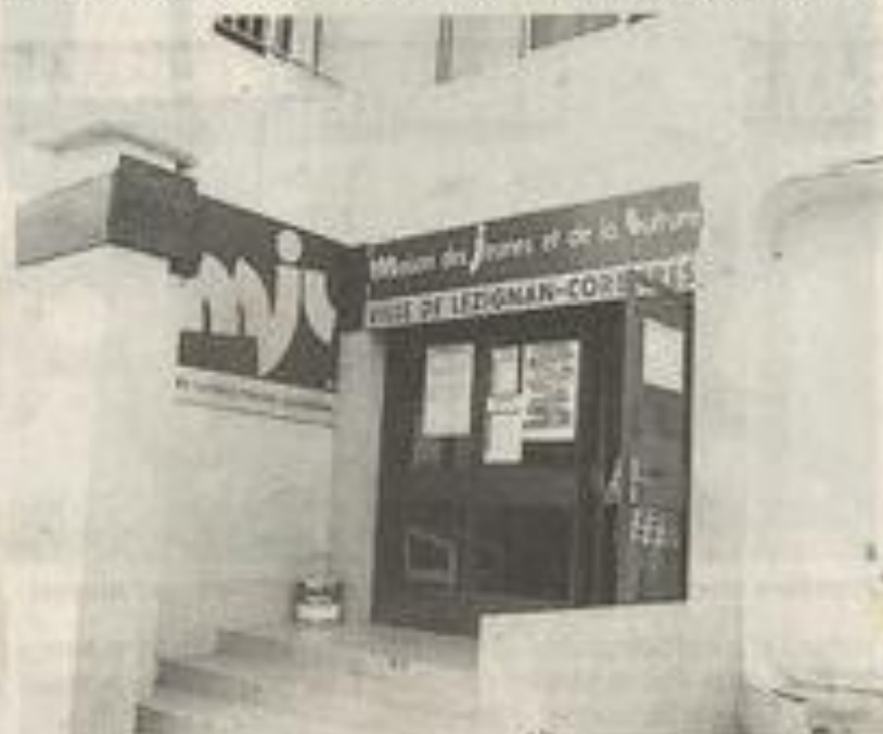
Avec l'aide du CAVE, l'entrée de la MJC sera transformée.