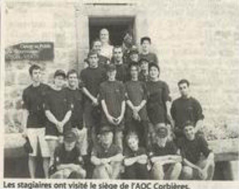
Les stagiaires ont visité le siège de l'AOC Corbières.

Pour cela et pour le reste, les non-dits, les émotions partagées, qu'ils soient remerciés.