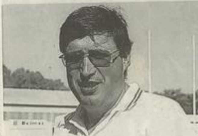
Un nouvel entraîneur pour les Espoirs... NOB

Difficile la fin de saison 98/99, où les espoirs, par manque de sérieux, auront déçu leur public et leurs dirigeants. Pourtant dotés d'une équipe de qualité, légèrement fantaisie, les marçais vont alterner le bon et le moins bon. S'ils arrivent à s'imposer quatre fois, ils vont s'incliner à cinq reprises. Les défaites à domicile face à Avignon et surtout face à Saint-Gaudens, une des lanternes rouges du classement, surprendront. La place de 6e ne sera guère élogieuse pour cette équipe. Les phases finales ne furent guère brillantes. Déjà éliminés en 1/8e de Coupe Luc Nitard, contre les Spacers de Toulouse, 50 à 8, les "vert et blanc" ne dépasseront pas les 1/4 de finale du championnat. Jouées en match aller retour, les lézignanais s'imposeront de justesse à domicile 36-30 pour s'incliner au stade Ambert 18-30 après une rencontre des plus houleuses. Seule grande satisfaction de cette fin de saison 98/99, la réussite en équipe 1 de Laurent Ferrères et de