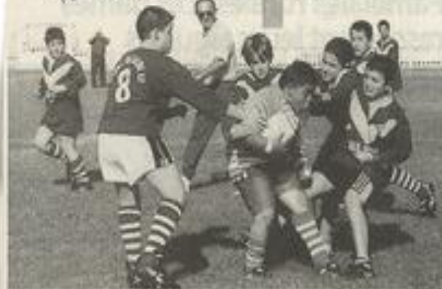
Des parties très disputées.

Réunions. Les responsables de la section des jeunes treizistes se réuniront ce mardi 19 octobre au club house du Moulin à 18 h 30. Le mercredi 20 octobre, au club house, à partir de 18 h 30, réunion du comité directeur du XIII "vert et blanc".