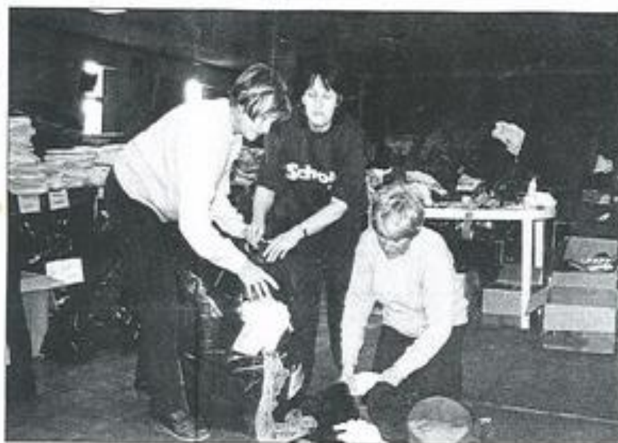
Plus les bénévoles donnent, plus elles reçoivent des dons.

Maintenant, la solidarité doit s'organiser. Ainsi, à Lézignan, une cellule a été mise en place, lundi soir. Elle a pour but de dé-