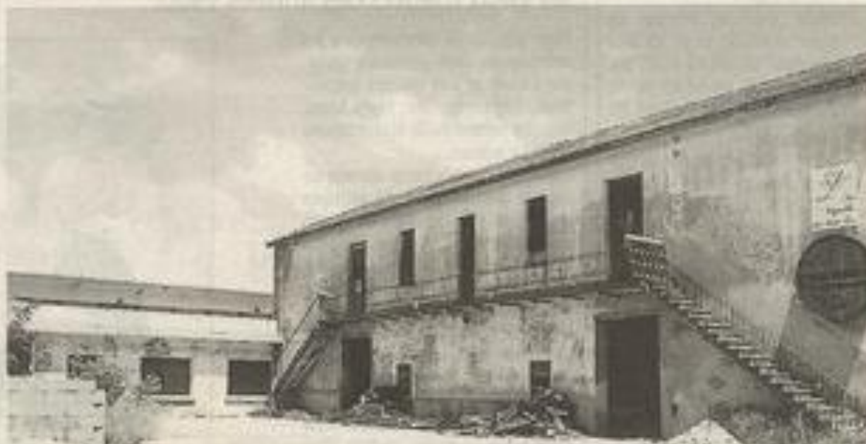
La cave des Trois Lys sera bientôt aménagée.

La protection de la forêt reçoit l'attention qu'elle mérite, notamment par l'adhésion de la commune à l'association départementale des comités communaux contre les feux de forêts. Le but recherché est de partager les expériences et de représenter un poids plus important auprès des instances concernées. A Lézignan-Corbières, la surveillance quotidienne de la Pinède par les pompiers de la