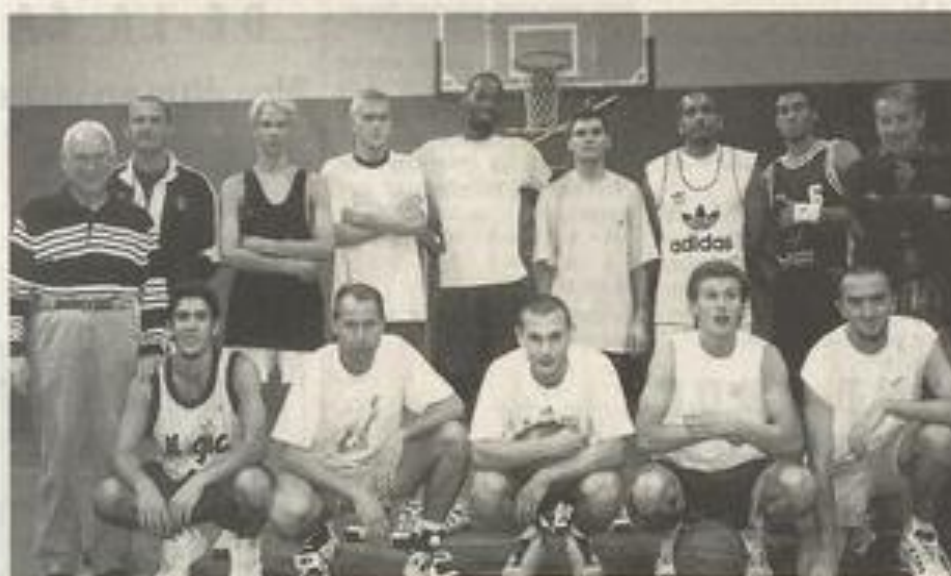
Dimanche prochain, il leur faudra affronter Toulouges.

L'Union-Basket-club des Corbières a joué son premier match de la saison à Narbonne le 3 octobre dernier : résultat, une victoire sans équivoque, 68 à 59, contre le club de la Croix d'Argent de Montpellier, un des favoris de la poule. Dimanche dernier, les "vert et blanc" sont allés à Castelnaudary, une autre grosse pointure, sans complexe. Et ils ont eu raison, puisqu'ils y ont glané une seconde victoire, par 63 à 53. Ils se retrouvent donc en tête du classement.