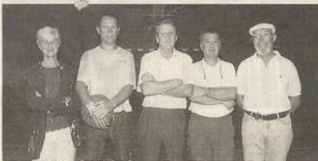
Le nouveau bureau du BCL.

La stratégie proposée par le nouveau président « pour que le