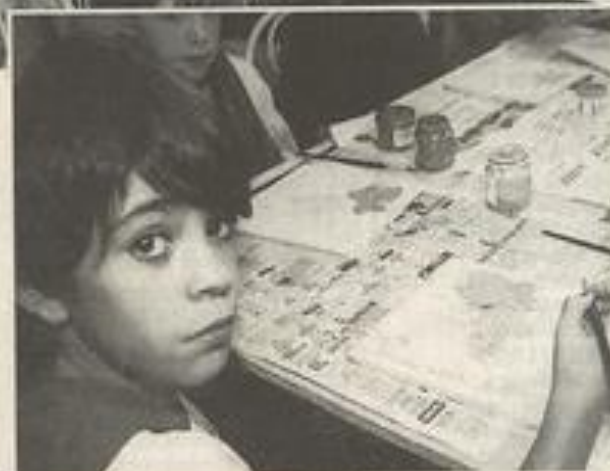
Des peintres en herbe pour fêter la vigne.