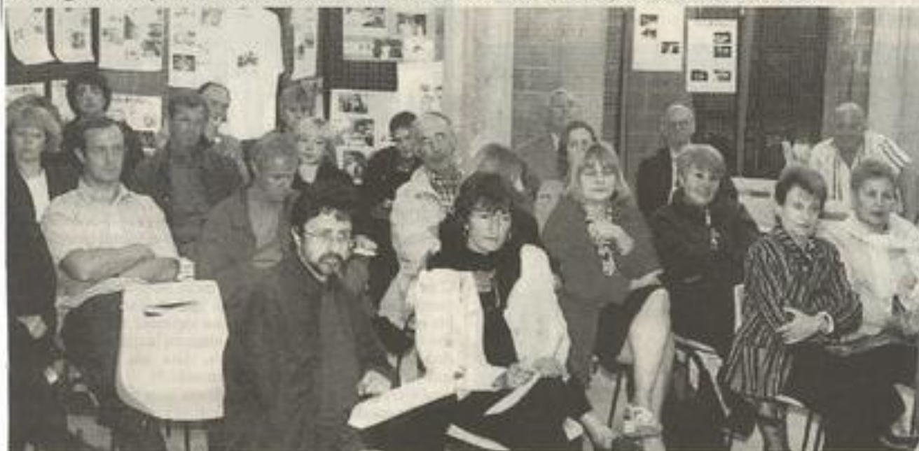
Le bilan départemental était dressé au cœur de l'Aude. NDB

Jeudi 14 octobre 1999 A Lézignan les promoteurs des Estivades ont dressé le bilan départemental de l'été.