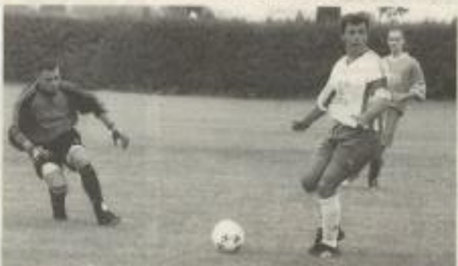
Lézignan s'est imposé dimanche à Gascq contre Villardonnat.

Première victoire de Lézignan dimanche à Gascq contre Villardonnat.