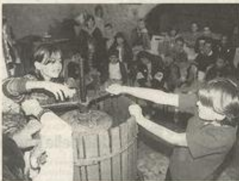
Douze classes participeront à un défilé à travers la ville.