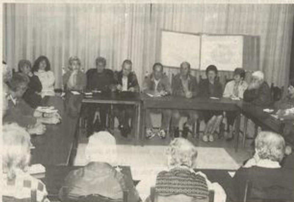
Toutes les associations de la ville participeront aux fêtes de l'an 2000.

Les sportifs se sont employés à organiser des manifestations de prestige : championnat de l'Aude de cross (9 janvier) et course pédestre qualificative pour les championnats de France en ce qui concerne la JSL, un championnat de France de tir, les 75 ans du club