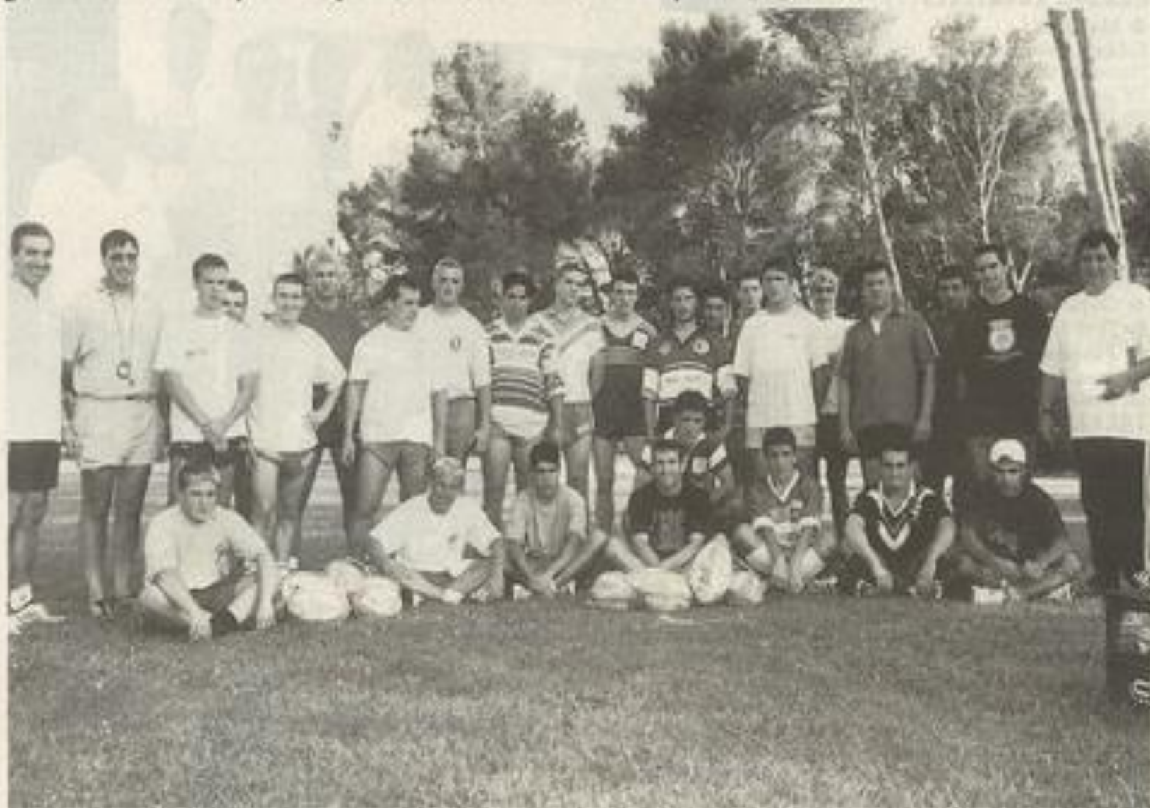
Premier décaissage pour le groupe des jeunes du FCL. La relève est en marche.

Groupe de 35 seniors. Pour ce premier training, 25 joueurs ont répondu présents. « Si l'on tient compte des aînés qui se sont entraînés avec l'équipe fanion, cela fait déjà un groupe de 35. On peut travailler dans de bonnes conditions. » Pour cette reprise, les joueurs ont eu droit à quelques tests physiques. « Il me faut évaluer le degré de chacun pour adapter le travail de préparation nécessaire à l'ensemble. » La politique sportive, il veut l'adapter à celle définie par le