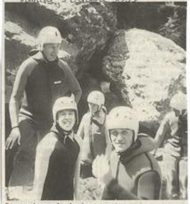
Du canyoning avec les pionniers.

Les pionniers de Léznignan préparent leur rentrée. « Vous avez de 14 à 18 ans, vous êtes au lycée ou en apprentissage, vous voulez être responsables du monde qui vous entoure, vous voulez donner un sens à votre vie, vous voulez réaliser vos rêves entre copains ?