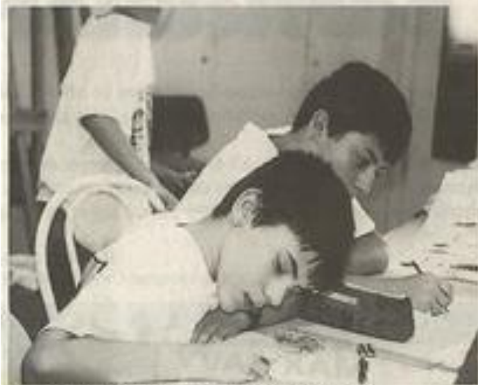
Dans ces cours, on peint d'après des modèles nature.

Avec notamment des volets culturels et sportifs, les Estivades consacrent une part importante de leur programme aux activités d'initiation et de formation.