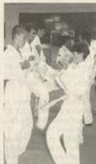
Un sport qui allie la maîtrise de soi, à la volonté et l'assurance.

Renseignements : 04 68 27 41 99 ou 06 83 27 72 53.