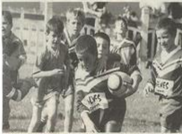
Une belle percée en puissance.