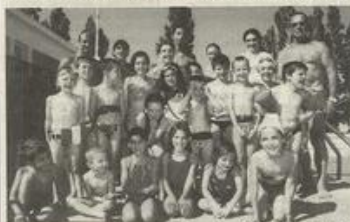
Les amateurs peuvent se retrouver tous les matins, sauf le week-end.

Les inscriptions à la piscine de Léznigan sont prises depuis le lundi 5 juillet à 9 h.