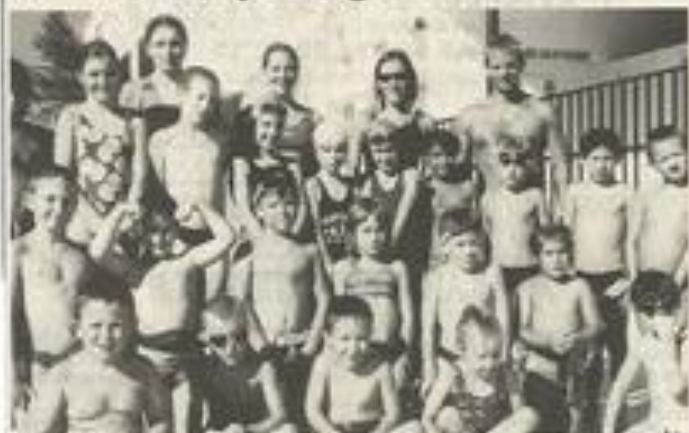
Dix sept brevets sur 50 m brasse et neuf sur 400 m 4 nages ont été attribués en juillet.

Dix sept brevets de 50 mètres brasse ainsi que neuf brevets de 400 mètres 4 nages ont été passés avec succès par les élèves de la piscine. Pour le mois d'août, les inscriptions se poursuivent toujours à la caisse de la piscine.