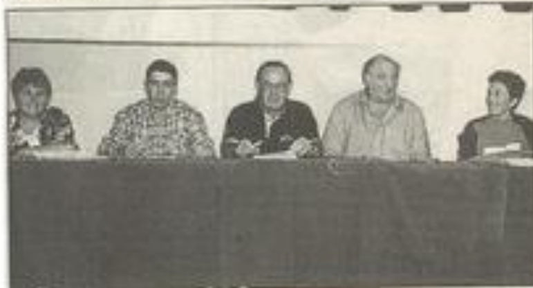
Le bureau prépare les prochaines compétitions.