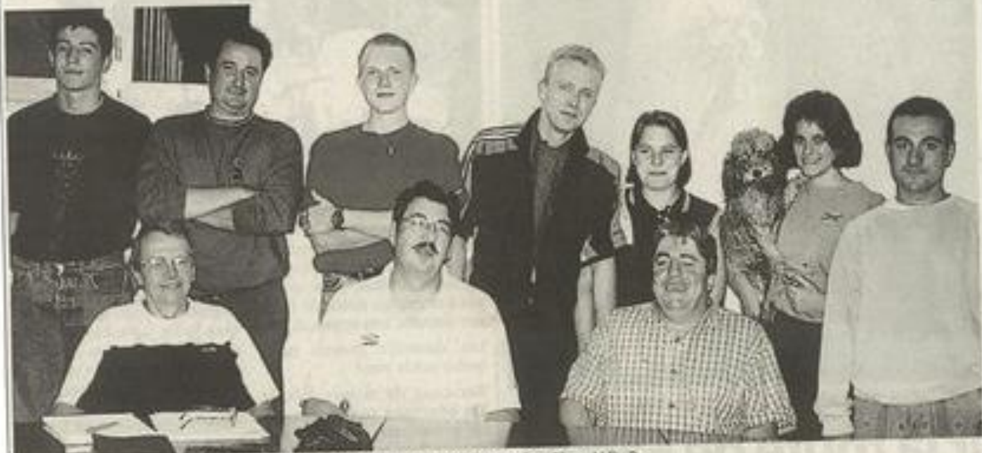
La MJC section tennis de table entame la nouvelle saison avec le sourire.