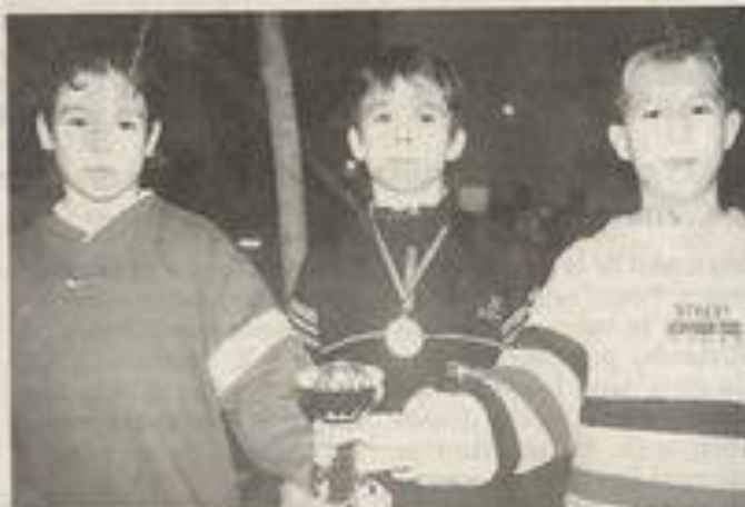
De jeunes champions.