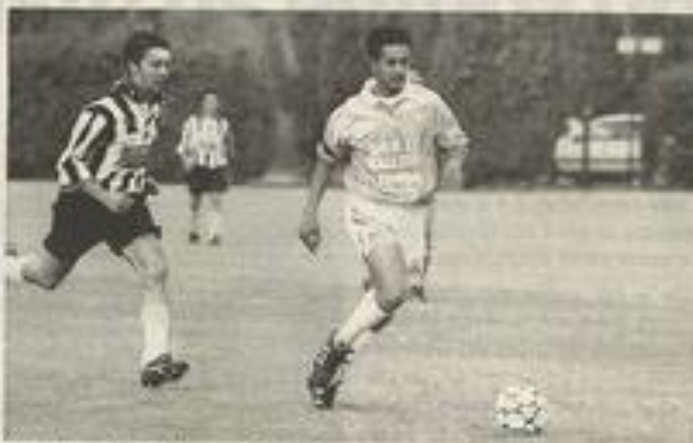
Bouthouyak toujours aussi efficace.

Deux grosses erreurs et c'est bien là le plus regrettable ! L'adversaire n'a pas à forcer son talent, Lézignan offre les buts et se met en difficulté. A l'heure de jeu, les verts vont réduire le score par Bouzar, avant que ce dernier ne manque l'égalisation. Les visiteurs manquèrent un penalty, stoppé par Marti-