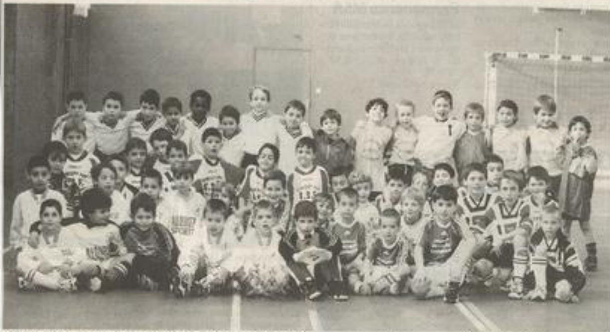
Une soixantaine de participants de tout le canton pour le premier tournoi en salle des débutants.

Samedi 30 janvier a eu lieu le premier tournoi en salle de la section débutants.