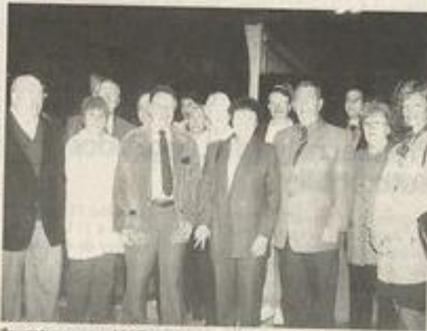
Ils vont rapporter 100 litres de primeur à Lauterbach.

Tous les ans, nos amis jumeaux viennent à l'occasion de la fête du primeur. D'abord parce qu'ils aiment ça mais aussi parce qu'ils "remontent" du vin pour leur propre fête du primeur : une fête très appréciée qui se déroulera cette année les 24 et 25 octobre prochains, sur la place du marché à Lauterbach. Le petit groupe de