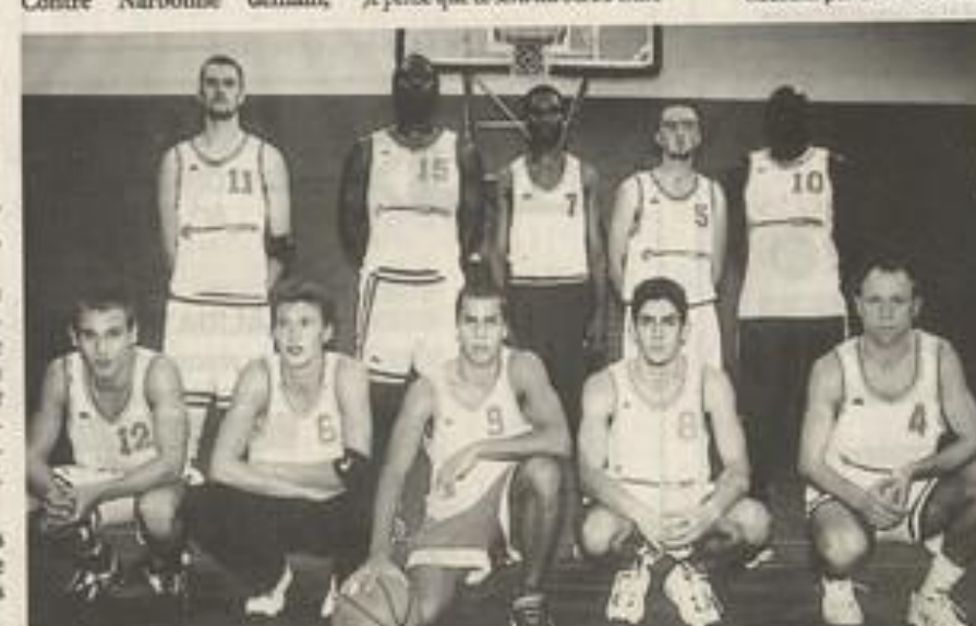
La formation du BCL Lézignan presque au complet, qui sera alignée demain soir à Narbonne pour un derby historique et que l'on annonce serré. Comme un derby...