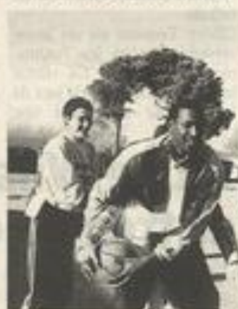
Permettre aux élèves de se tourner vers la culture générale.