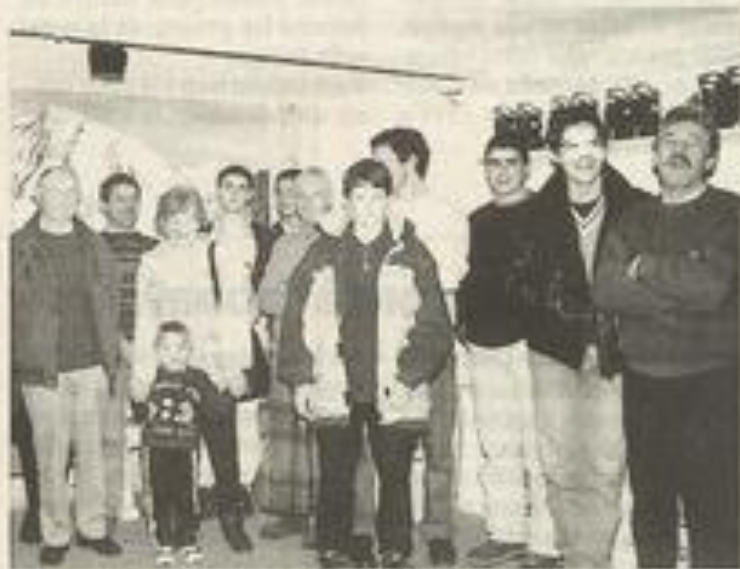
La section du ski-club part ce week-end aux Angles.

Ski. La section ski organisait récemment une journée portes ouvertes pour lancer la saison en présence de plusieurs personnalités. La première sortie à Font-Romeu, dimanche, s'est formidablement déroulée. Dimanche prochain les skieurs se retrouveront aux Angles.