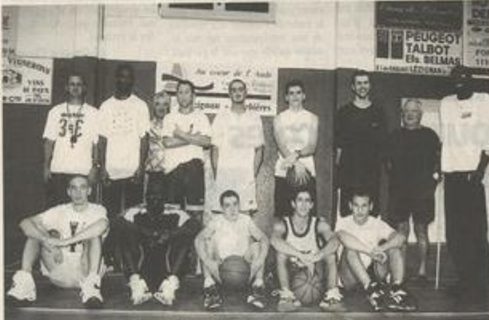
Les joueurs ont posé pour leur premier entraînement.

Les premières rencontres sont prévues : le vendredi 11 contre Panniers et le samedi 12 contre Fonçegrives. Nous aurons alors un aperçu de l'équipe 98-99 du BCL.