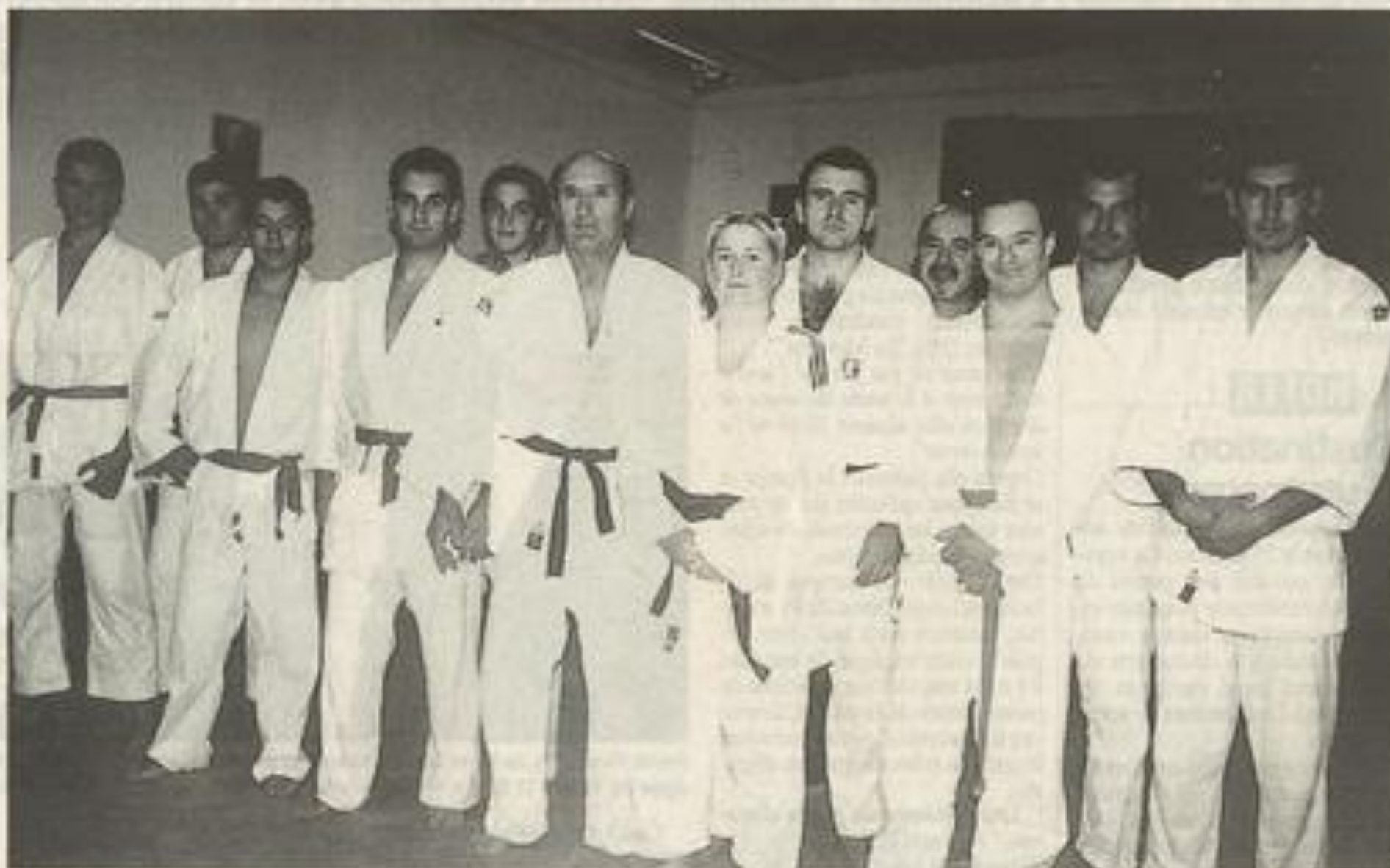
Les champions du tatami.

Le club de judo de la Maison des Jeunes et de la Culture a son dojo dans la rue Hoche.