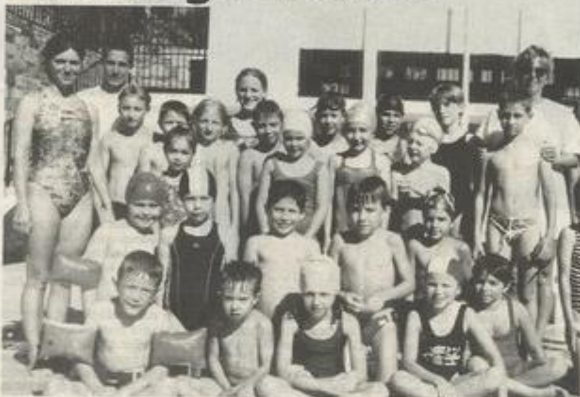
Les petits champions.