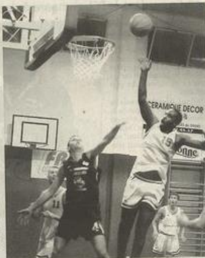
A.L. Le BCL a montré ses faiblesses.

La part de chaque club - BCL : 9/10 à 3 points, 2/5 à 3m, 17/27 dessous, 1/8 RC, 4/5 CA, 12/20 LF, 24 fautes. - Horsarieu : 3/9 à 3 points, 2/5 à 3m, 20/30 dessous, 4/4 RC, 2/2 CA, 16/27 LF, 23 fautes.