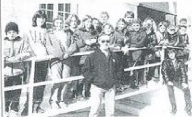
Les Lézignanais qui ont participé à ce meeting.

le 30 janvier à Castelnaudary, s'est déroulé le 3 e meeting départemental de natation avec la participation des nageurs lézignanais. Les résultats sont les suivants :