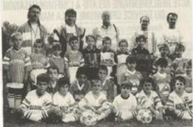
Le FC Lézignan alignait trois équipes.