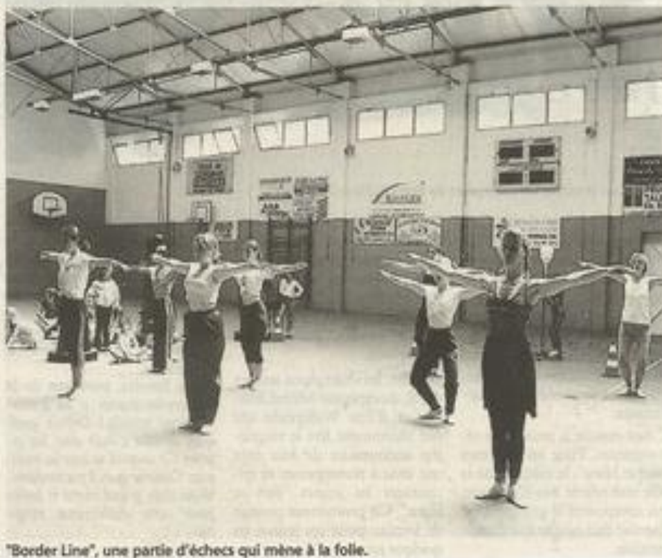
"Border Line", une partie d'échecs qui mène à la folie.

"Border Line", gala de la section danse de la MJC. Samedi 27 juin à 21 h 30 au Palais des Fêtes de Lézignan. Prix des places : 50 francs, gratuit pour les enfants.