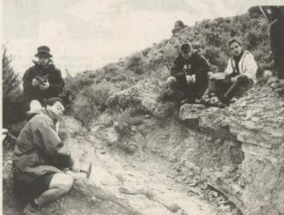
Il y a 50 millions d'années, la mer recouvrait ce site.