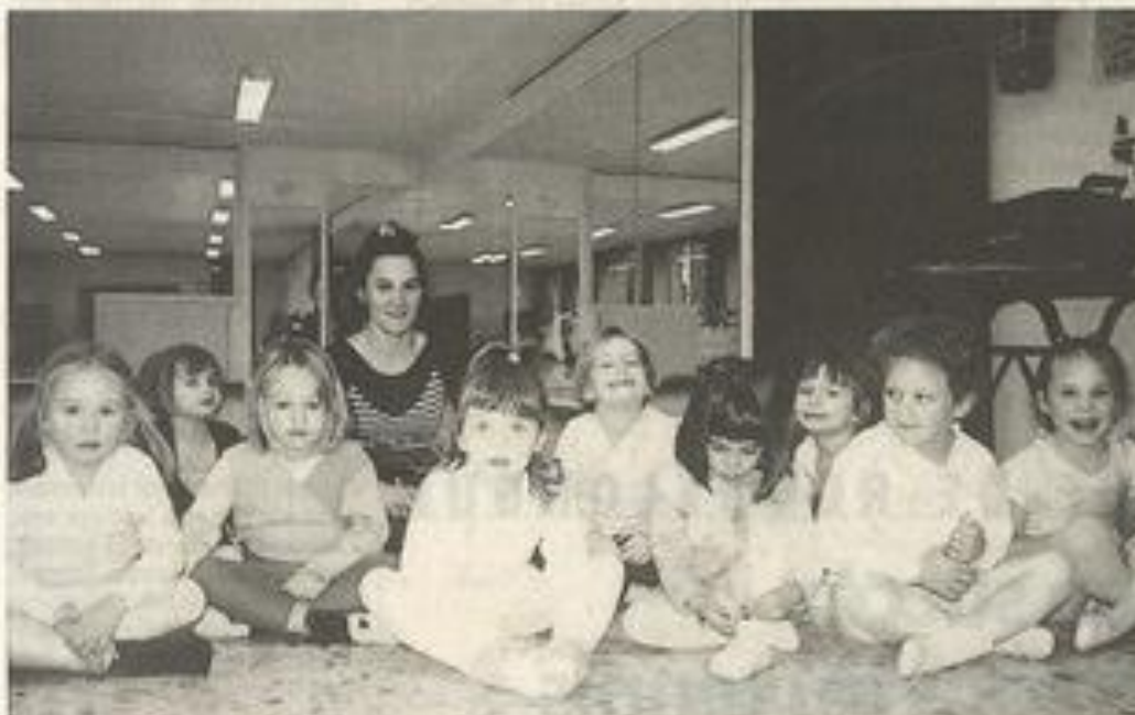
L'éveil corporel par la danse...

Un cours d'éveil corporel est proposé à la maison des jeunes de Lézignan pour les enfants âgés de quatre à cinq ans.