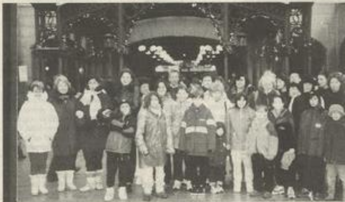
Eurodisney a été l'occasion de passer un bon moment.