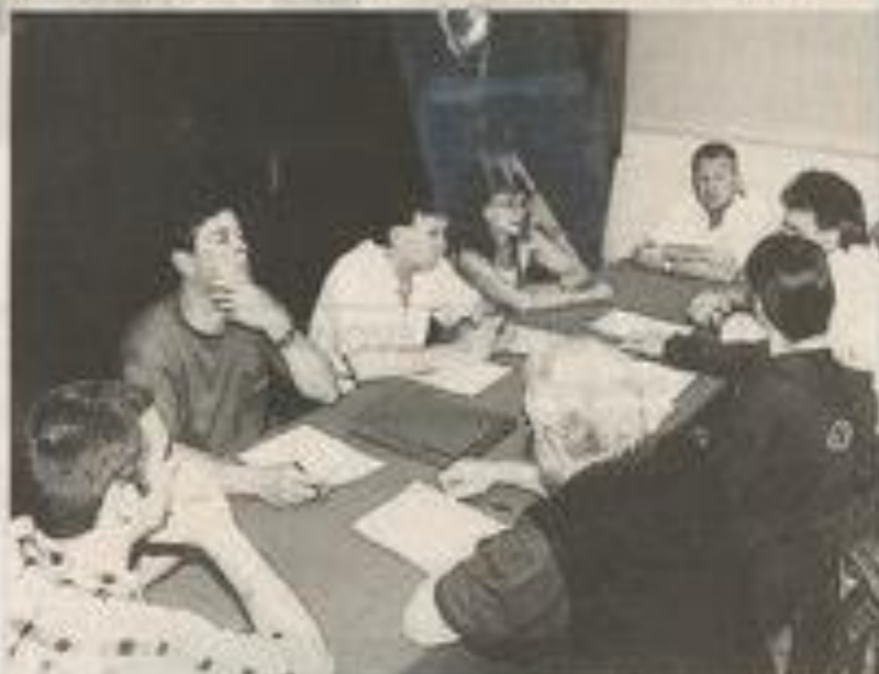
Lors du rapport moral présenté par le bureau.

Après sa quatrième saison consécutive au niveau national, l'équipe fanion du BCL jouera pour la première fois dans l'histoire de club en Nationale III. L'année dernière, elle avait obtenu la 7 e place en Nationale IV.