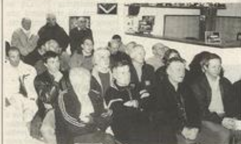
Le bilan de la saison passée a été largement évoqué.