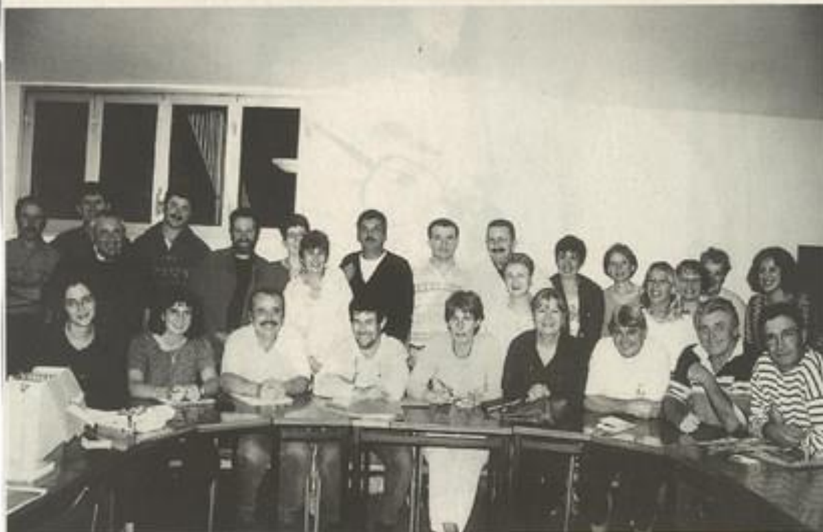
Les randonneurs au grand complet lors de l'assemblée.

Vendredi a eu lieu l'assemblée générale du club rando-montagne.