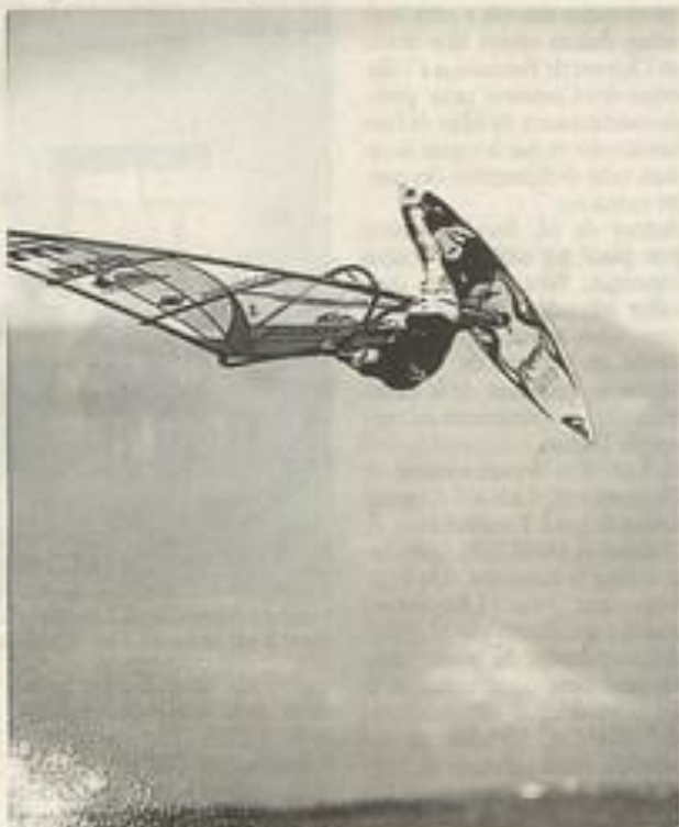
Des séances à couper le souffle

Les films présentés font la part belle aux éléments : la neige bien avec « des séquences à cou-