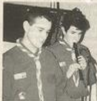
Les préparatifs vont bon train.

Pour ce qui concerne les inscriptions, il faut se manifester avant le lundi 14 décembre dernier délai et pour les renseignements, il faut téléphoner au 04 68 27 04 33.