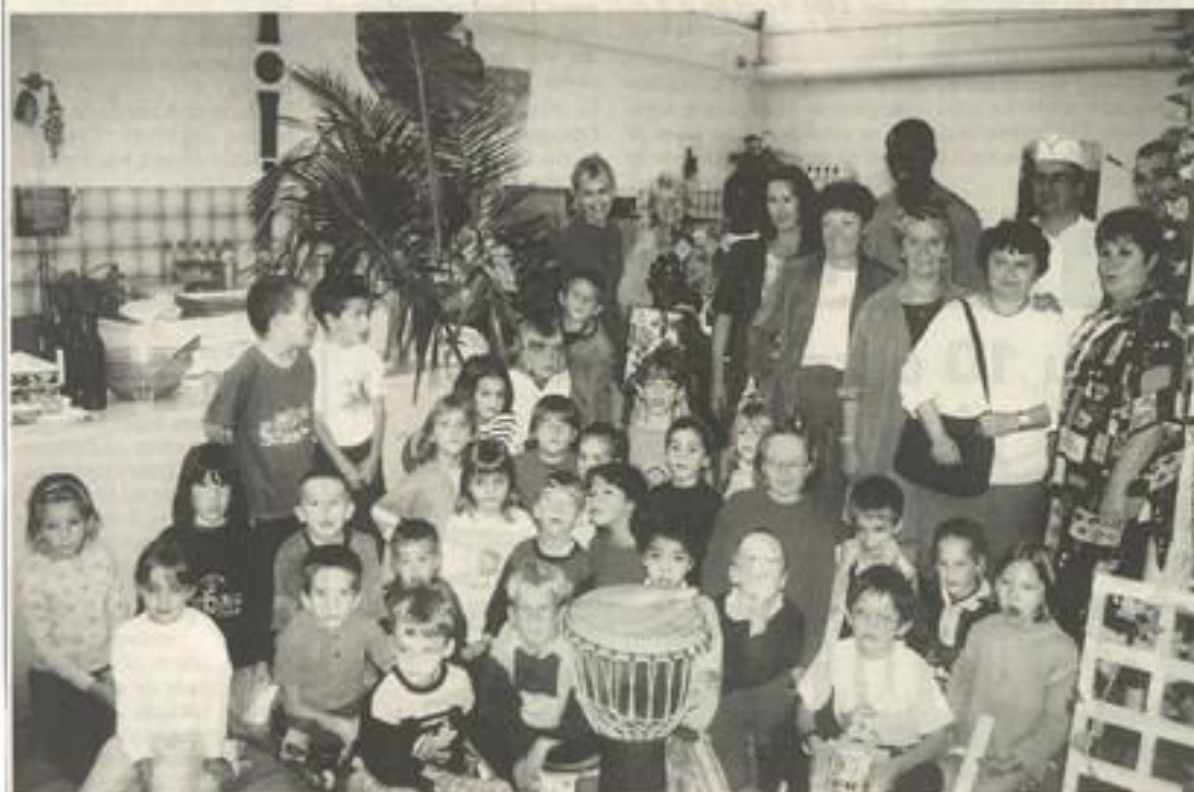
Menu exotique pour une joyeuse assemblée.

C'était le premier menu "extraordinaire" confectionné dans le cadre de la découverte de cuisines du Monde, opération mise en place par un partenariat associant la ville, la MJC (qui assure la réalisation des repas) et l'ensemble des écoles primaires et maternelles.