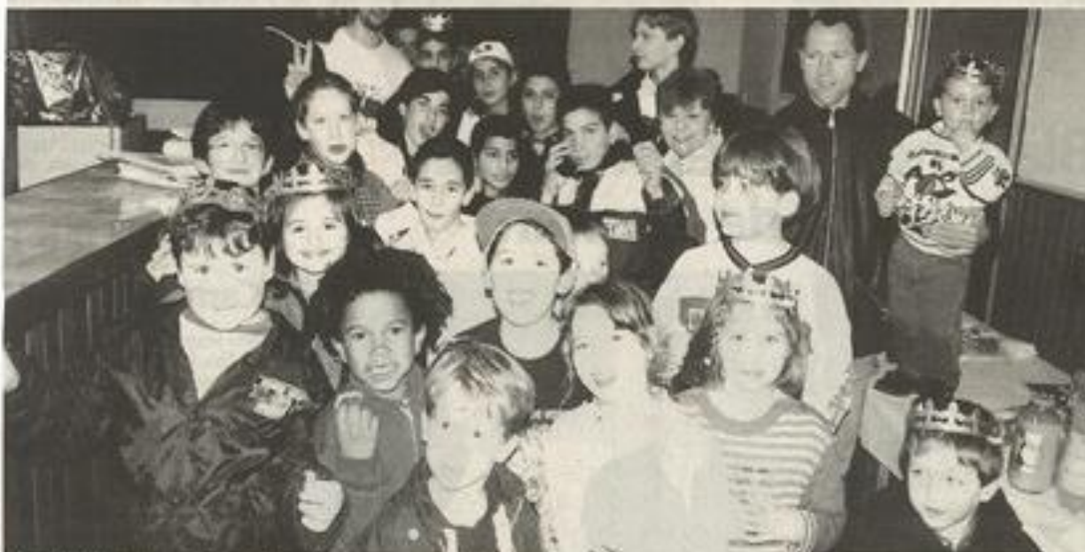
Les rois du basket avec leurs champions.

Les enfants du club de basket entourés de quelques grands de l'équipe fanion et de certains parents ont dégusté mercredi dernier d'excellentes galettes des Rois à la MJC de Lézignan-Corbières. Leur bon appétit était à la hauteur de leur enthousiasme pour le sport cher à Michael Jordan. D'ailleurs, ils montreront leur amour pour le basket, demain dimanche, à l'occasion d'un grand tournoi qui se déroulera tout l'après-midi au stade Léo Lagrange.