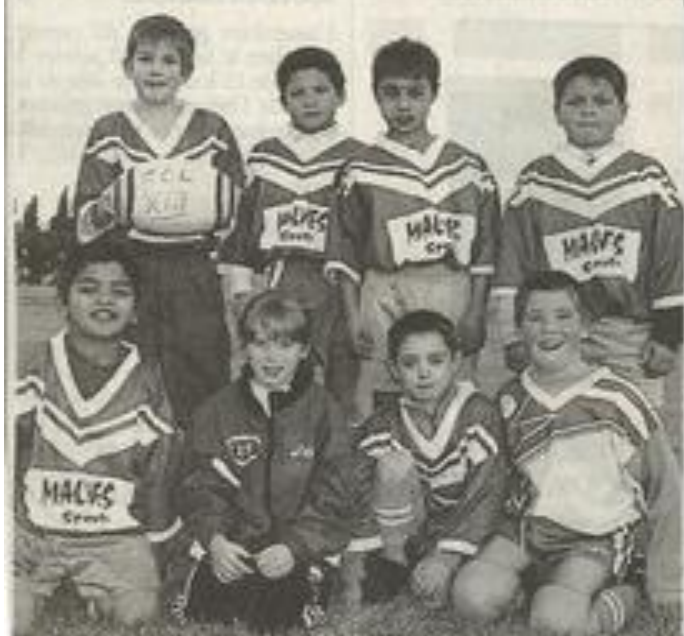
Les poussins du FC Lézignan, futurs champions treizistes.

Plus de cent cinquante petits crampons répartis en une dizaine d'équipes, pupilles, poussins, benjamins, représentant les clubs de Limoux, Carcassonne, Cabardès, Montpellier, Villalier, Ornaisons et Lézignan, ont foulé samedi après-midi les pelouses du complexe sportif de Gaujac.