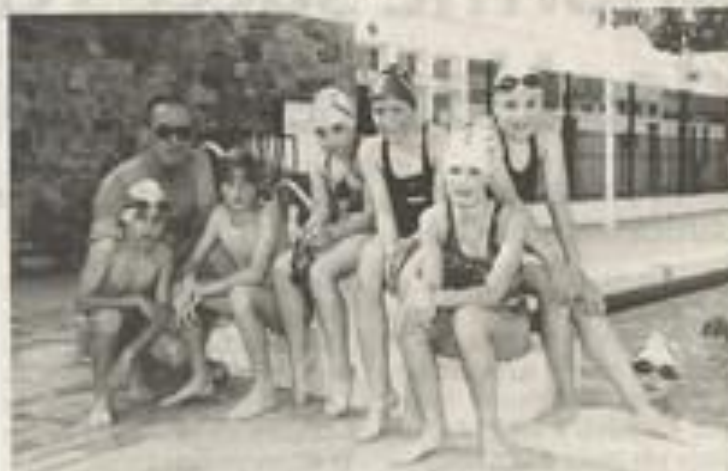
Six jeunes lézignanais ont défendu les couleurs de la ville. Lapami

Dernièrement s'est tenu à la piscine municipale de Lézignan-Corbières, la Coupe du Languedoc-Roussillon des départements.