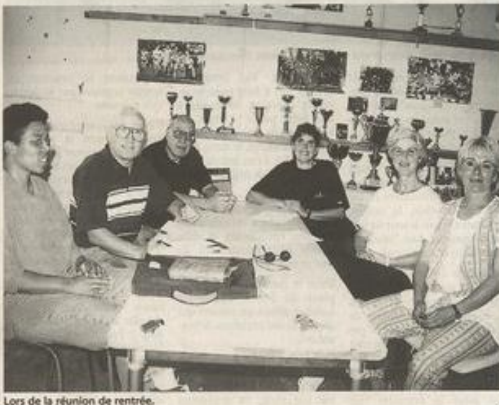
Lors de la réunion de rentrée.