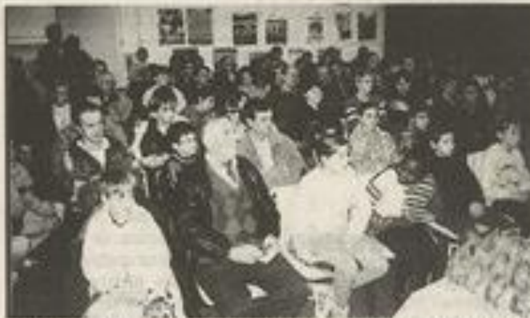
Le club vert et blanc réalise un travail en profondeur.

Les résultats nationaux font ressortir le classement de 37 athlètes dont un en nationale 3, deux en régionales 1, dix en régionale 3, neuf en départementale 1, quatre en départementale 2 et onze en départementale 3. Avant de lever le verre de l'amitié, les dirigeants ont lancé un appel aux bonnes volontés pour former le bureau 98/99 de la JSL. Jean Tarbouriech avait le mot de la fin, en félicitant l'ensemble des présents pour la tenue de cette assemblée, soulignant le travail effectué en 98. Vint ensuite la remise des prix et une cinquantaine de jeunes recevaient leur trophée.