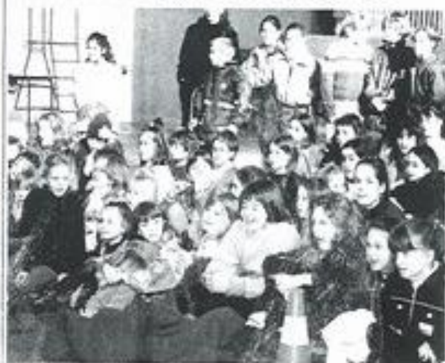
Un bel après-midi pour tous.

C'était juste avant les vacances scolaires, les enfants de toutes les sections de la maison des jeunes, se sont retrouvés à l'invitation du conseil d'administration autour de succulentes galettes des rois.