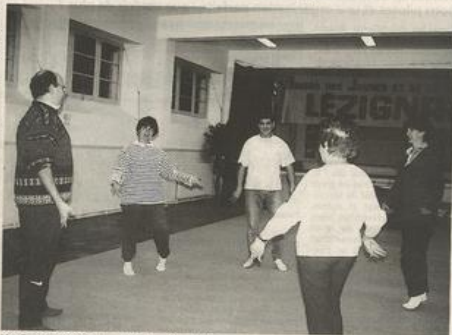
L'atelier permet de bien se contrôler...

de s'affirmer, de créer. C'est un lieu de confrontation. » S'y mêle aussi l'expression corporelle qui permet d'être bien dans sa peau.