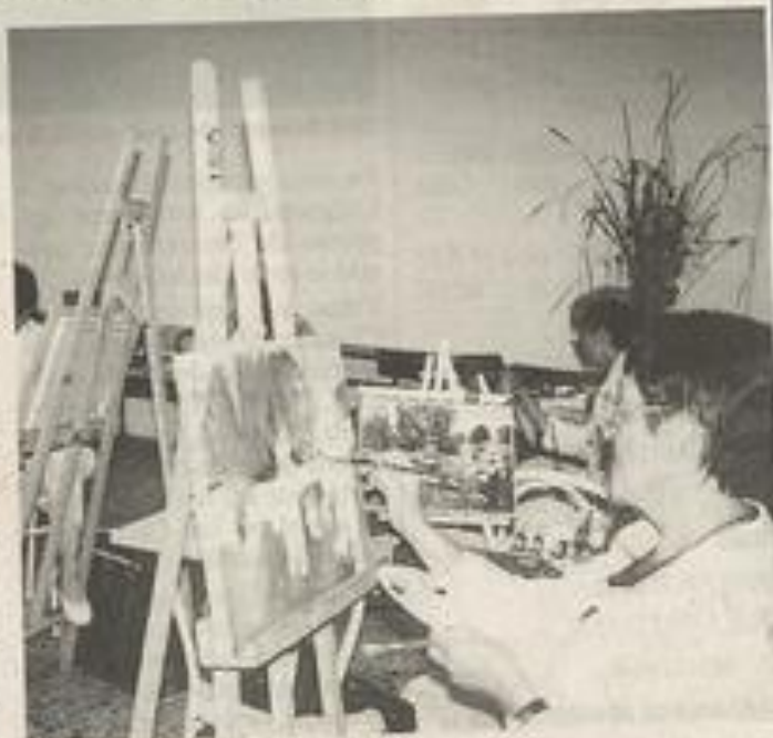
Le dessin est une affaire de fluidité du geste, de détente.