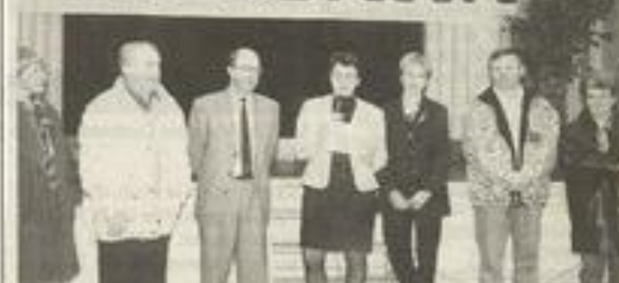
Les difficultés sont passées.

La tradition veut qu'en début d'année, la Présidente de la Maison des jeunes et de la Culture présente à tous ses adhérents et amis, ses vœux de bonheur, de santé et de prospérité.