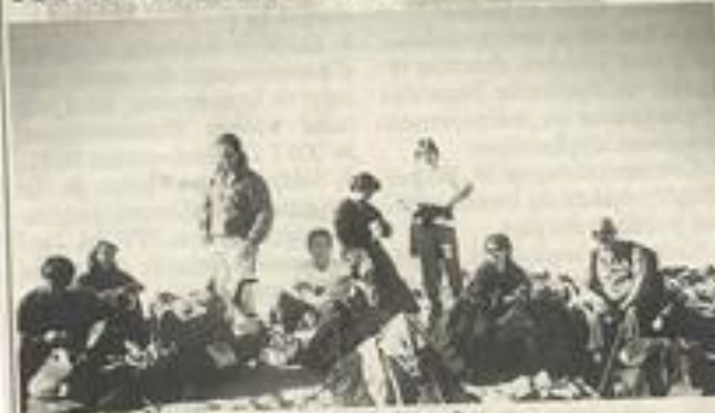
Une des dernières randonnées de l'année.

Le club de rando s'est adonné aux joies de la marche et de la découverte de la faune et de la flore sur les crêtes, et les pentes escarpées du Carlit, 2921 m, soleil, isard et neige étaient au rendez-vous pour quinze passionnés de nature. Les mêmes passionnés et d'autres encore qui vont se retrouver pour clore une année riche d'émotions, dans la convivialité. Les adhérents au club rando montagne