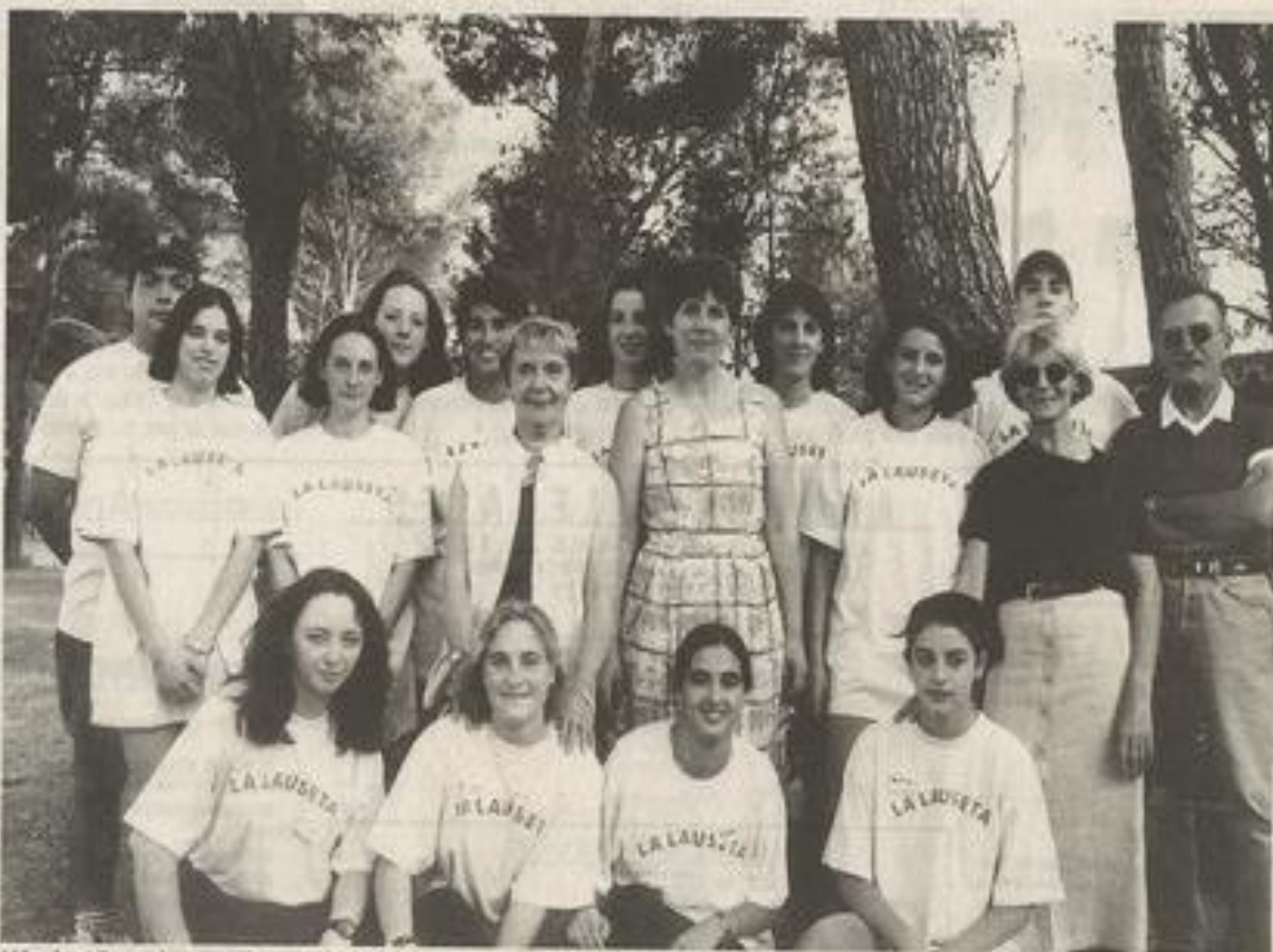
L'équipe d'encadrement du centre de loisirs.

«La Lauseta n'est pas une garderie», répètent avec insistance la responsable et les membres du conseil municipal. Les travaux