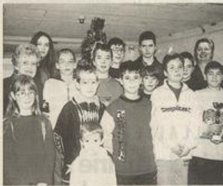
Noël a réuni les jeunes adhérents de la Patriote.