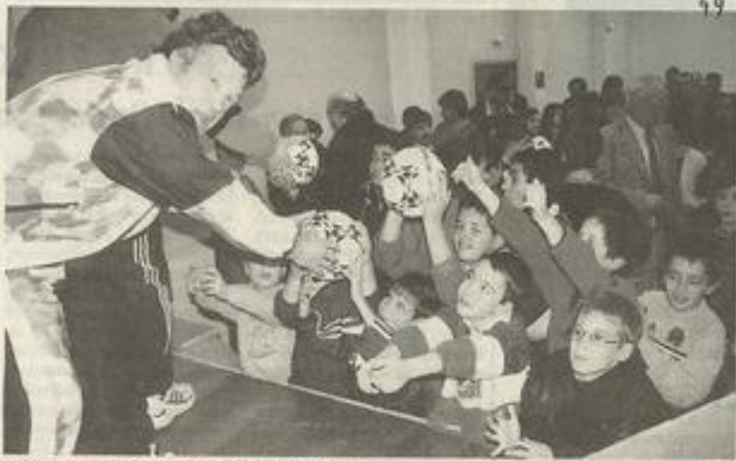
La relève est assurée à l'école de foot.

Les galettes des Rois et le vin d'honneur clôturaient cette manifestation conviviale, qui concernait la relève footballistique de notre commune.