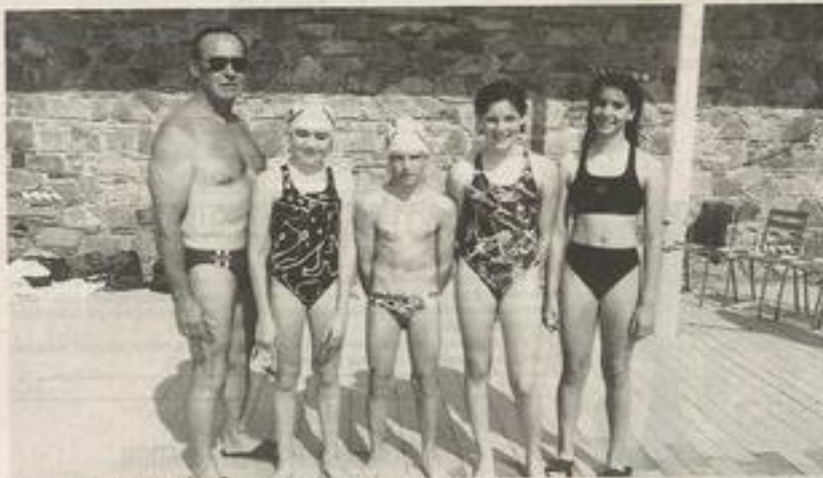
Les quatre nageurs entourés de leur professeur.

qui a très honorablement représenté son département et la ville de Lézignan puisqu'elle s'est classée 12 e sur 42 en nageant le 100 m. nage libre en 1' 07" 42