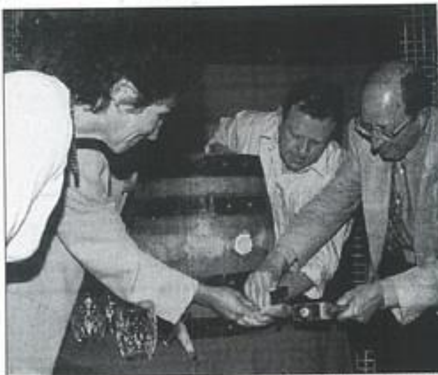
La fête de la bière a vécu. Prochaine rencontre gouléyante à l'automne, avec la fête primeur.

Gernot Schobert a rappelé que les fêtes agricoles de Lauterbach permettent de vendre du vin de Lézignan, dans sa ville allemande. « Probablement entre 600 et 1.000 bouteilles », a-t-il précisé. Le bénéfice de la vente ira aux écoles de Lauterbach, pour qu'elles puissent envoyer des élèves à Lézignan. Une noble cause, en somme.