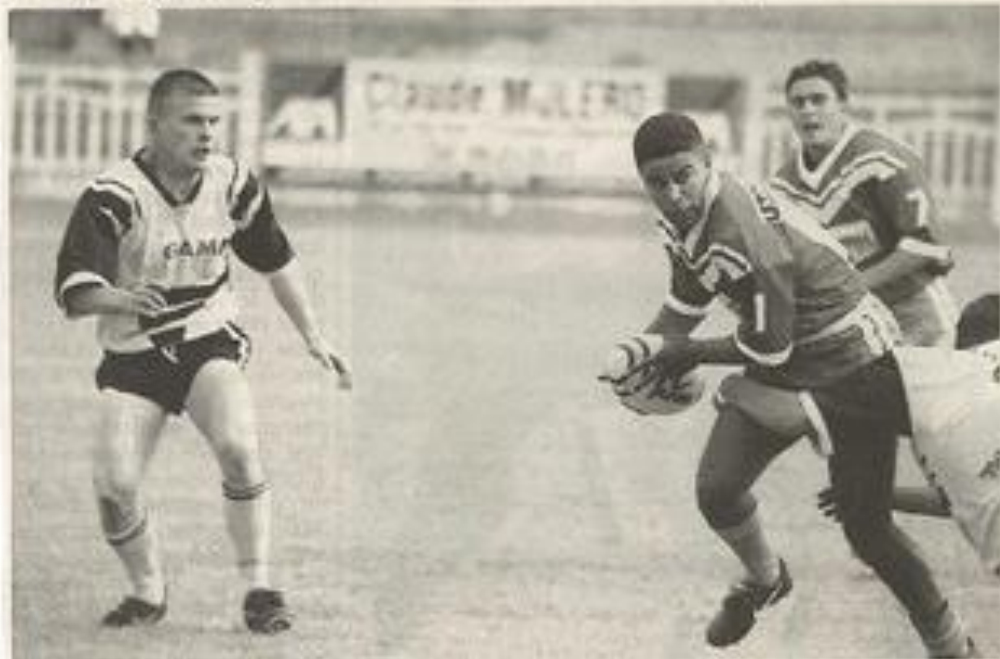
Sans contrefaçon, les Lézignanais se sont avérés bien plus efficaces que leurs adversaires sur le plan technique.

Domage que cette rencontre (36 à 12) ait été entachée par autant de vilains gestes qui ne ressemblent en rien à la discipline treiziste.