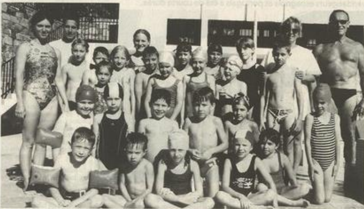
L'ensemble de l'équipe de natation espère réaliser une aussi bonne prestation que celle réalisée l'année dernière.

Logique victorieuse pour la nouvelle saison du club de natation.