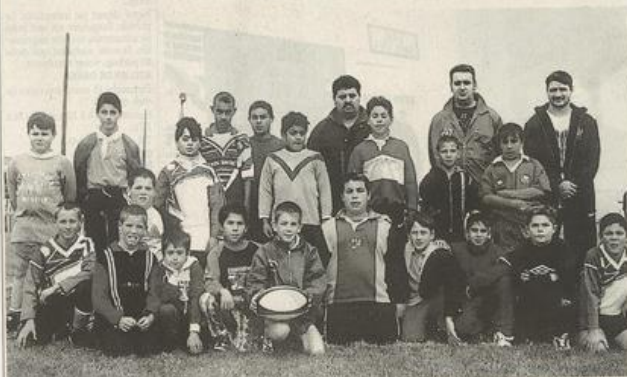
L'école de rugby du FCL XIII MJC et son encadrement.

Dimanche 15 novembre, à l'occasion de la 9 e journée de championnat (phase aller), le XIII "vert et blanc" se déplace à Tonneins.