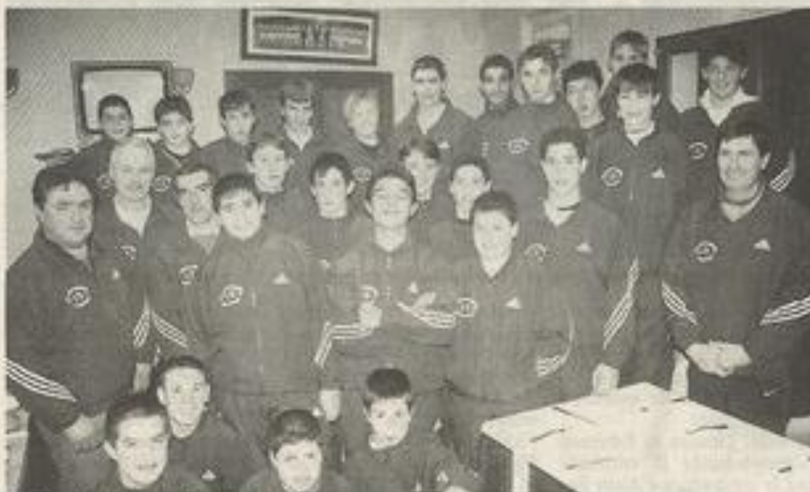
Le père Noël les a gâtés.

Ces minimes au grand cœur ont tenu encore à aller s'imposer le dimanche suivant le XIII Catalan sur le score de 28 à 8. Minimes, entraîneurs, soigneurs, responsables vont connaître d'autres succès.