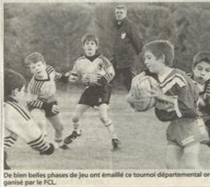
De bien belles phases de jeu ont émaillé ce tournoi départemental organisé par le FCL.