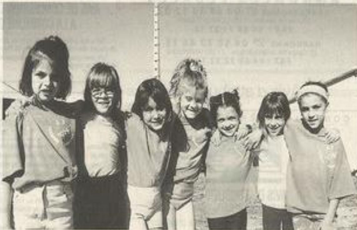
Les oisillons de la JSL.