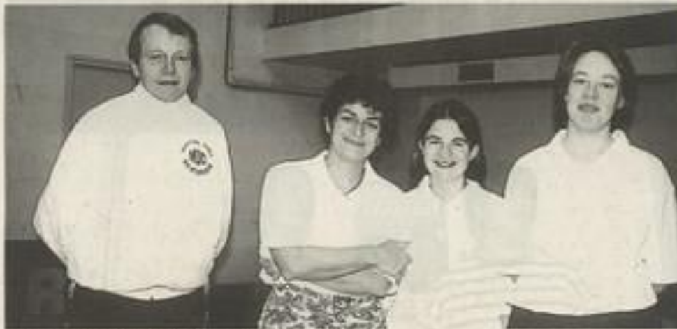
Beau succès des pongistes lézignanaises.

En Départementale 1 : après Moissan, Trèbes et Carcassonne : 9 points sur 9 au compteur. La dernière rencontre con-