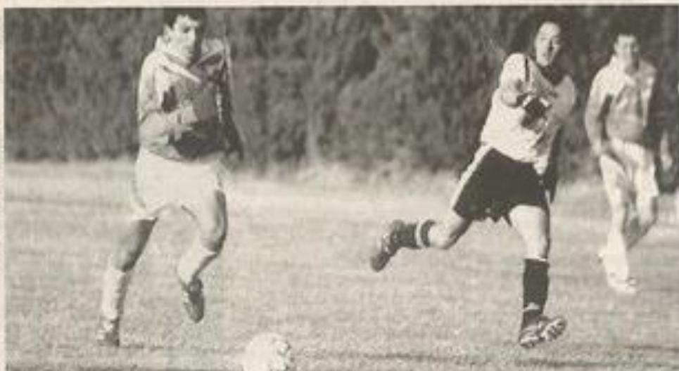
Une victoire à portée de la main... N.D.-R.

Mieux même : dans la même minute. Bouzar, dans un premier temps, puis Couissy sur le corner qui suivit, seront à deux doigts d'ouvrir le score, le gardien adverse s'interposant cha-