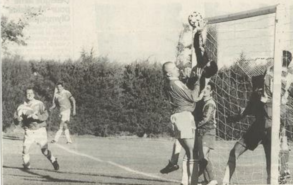
Deux tentatives échoueront successivement.

Le match contre Limoux, on le sait avait retardé en raison du deuil qui frappe l'équipe.