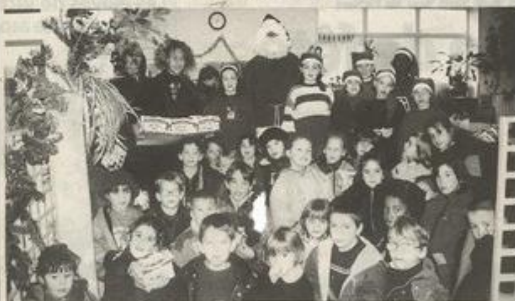
Le Père Noël a offert les cadeaux de sa hôte aux enfants du restaurant scolaire.

Traditionnel repas des festivités de Noël offert par la ville aux jeunes gens qui fréquentent le restaurant scolaire avec au menu du jour : le rôti de dinde aux cépes et une farceuse et traditionnelle bûche pâtissière en