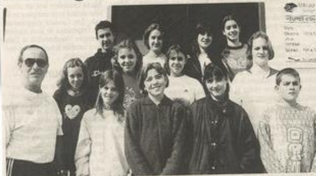
De bons résultats pour les nageurs Lézignanais.

Le meeting départemental de natation de Castelnaudary s'est déroulé dimanche dernier, avec la participation d'une quinzaine de Lézignanais, toutes catégories confondues des cadets aux benjamins.