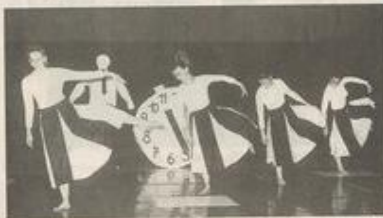
Le temps s'écoule, mais la partie contre la folie n'est pas perdue.

Dans un décor fait de noir et de blanc rappelant sans cesse l'échiquier, "Border Line" a offert 1 h 30 de féerie à des spectateurs comblés.