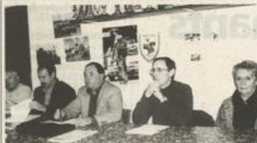
Pour redynamiser les sorties dominicales...