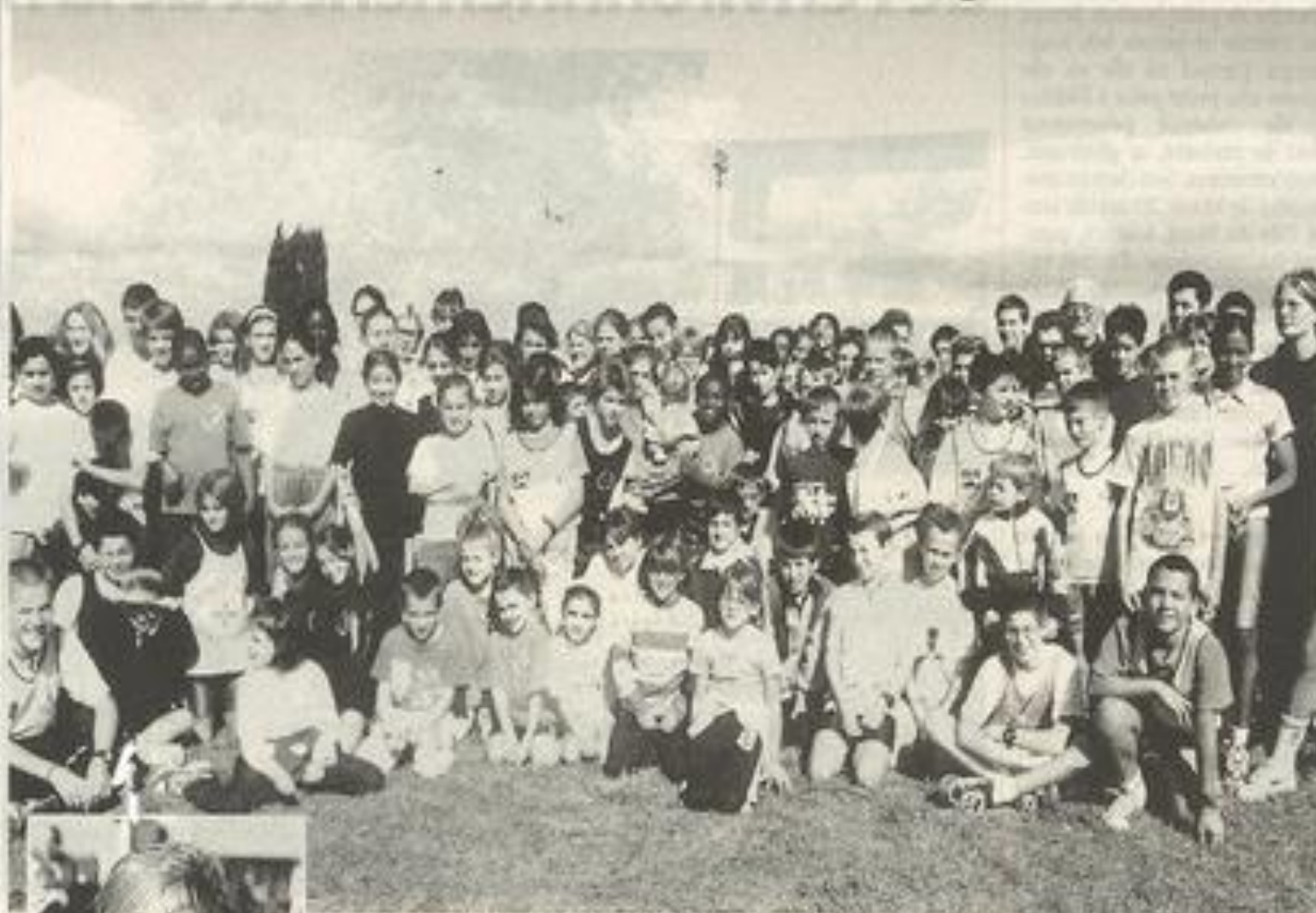
Les participants à ce meeting de la JSL.

En cette splendide journée de Meeting de la JSL, les jeunes sportifs lézignanais se sont retrouvés sur le stade de La Roumenguière.