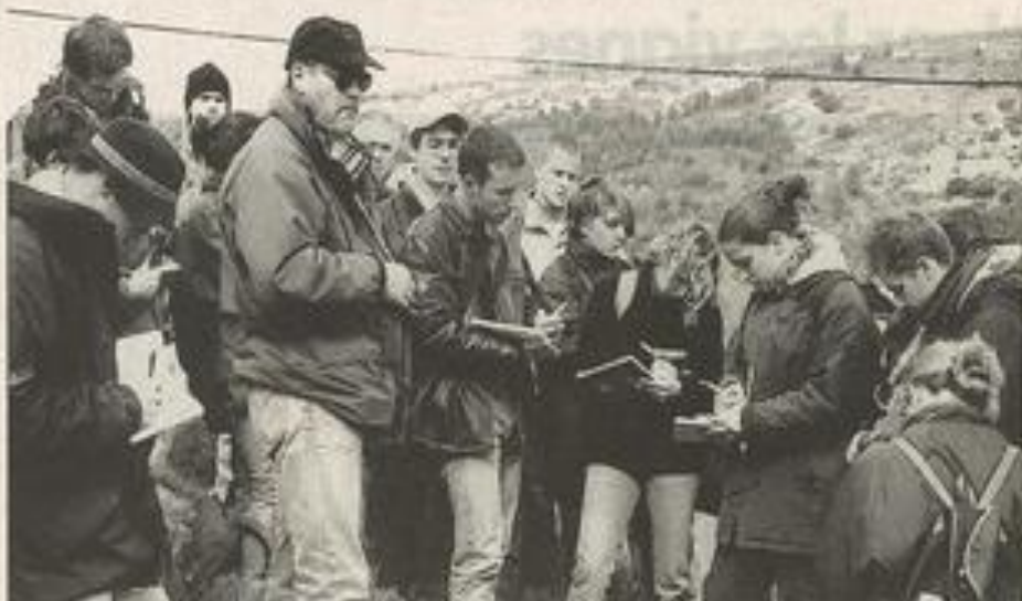
L'équipe sur le terrain apprend le métier.

A l'occasion, en fin de stage, les professeurs ne manquent pas d'emmener les étudiants déguster quelques bons crus des Corbières.