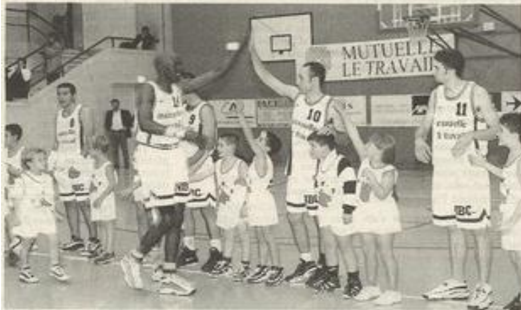
Le Narbonne Basket Club aura besoin du soutien de tous ses supporters, les plus petits compris, demain soir au Palais du travail. Les Narbonnais reçoivent le leader Horsarrieu.

C'est le choc du basket audois de cette journée de championnat entre Narbonne et Horsarrieu. C'est demain au Palais du travail à 20 h 30.