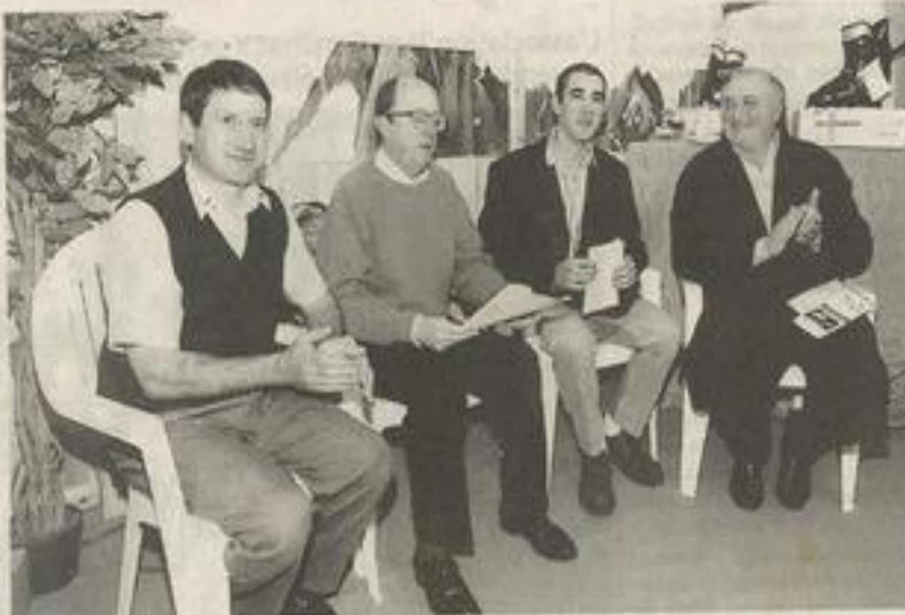
Tout est prêt pour la saison. On n'attend plus que la neige.

D'ailleurs le club exigera une attestation d'assurance pour être