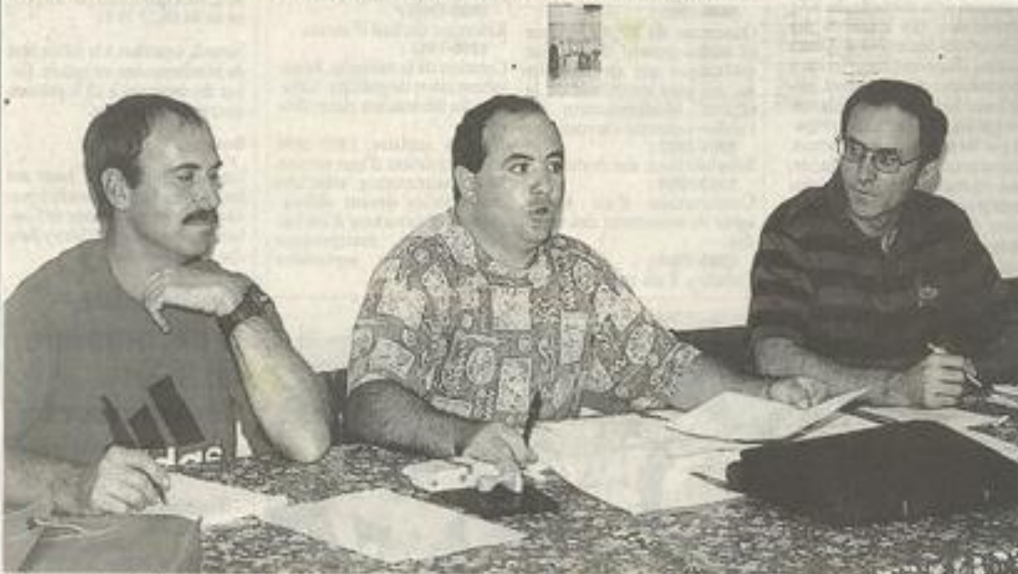
Ultimes préparatifs pour les cyclistes.

Le 25 octobre prochain se déroulera la randonnée "Les kilomètres des primeurs". Les coureurs se rendront dans les villages qui participent à la fête du vin nouveau.