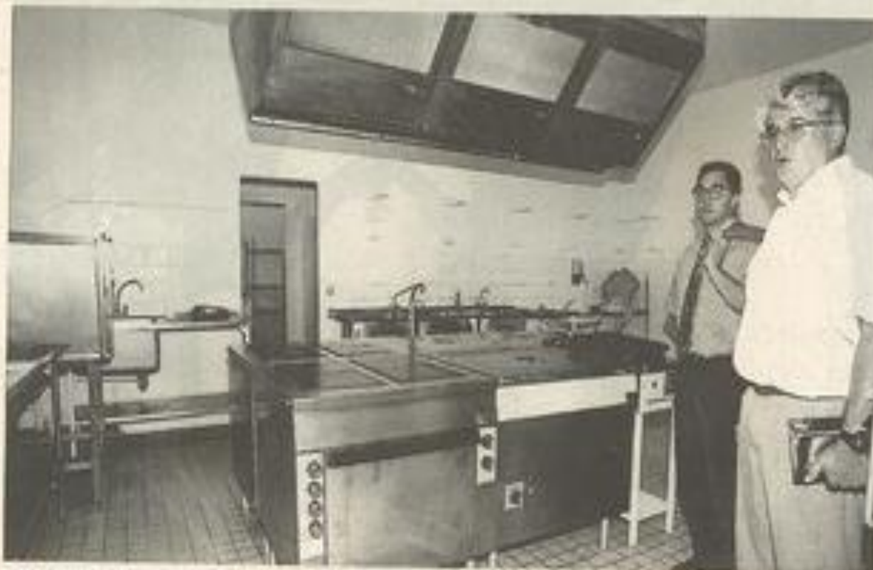
200 000 F d'investissement pour la remise aux normes, respect impératif de la "marche en avant".

En revanche, il a fallu repenser entièrement l'organisation, redistribuer les lieux et rationaliser les flux dans le respect du cir-