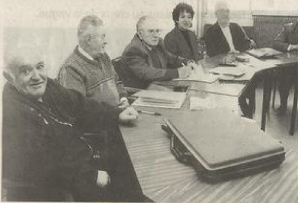
L'assemblée de philatélistes avec son nouveau bureau.

"L'année 1998 sera prolifique en émissions avec le mondial de football", prévoit Marc Torrejon. Ajoutons, qu'elle sera riche en activités. Au programme est inscrit en outre une journée du timbre à Narbonne et une sortie amicale à Mirepoix, le 31 mai prochain.