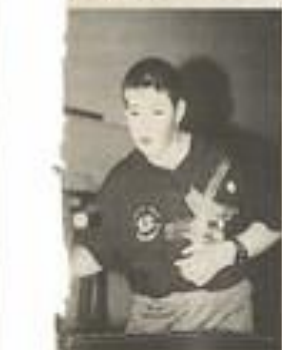
Préparation et entraînement, méthode gagnante.

La départementale 1 où le premier aura accès à la régionale 3 et le dernier classé descendra en départementale 2. La départementale 2 où le premier aura accès à la départementale 1 et le dernier descendra en départementale 3. Et enfin la départementale 3 où le premier aura accès à la départementale 2. La départementale 4 (championnat jeunes) qui permettra aux meilleurs jeunes d'accéder à la D3 et même à la D2. En D1, on trouve les équipes de Narbonne (2 équipes), Castelnaudary (1 équipe), Trèbes (1 équipe), Lézignan (1 équipe), Carcassonne (2 équipes), Moussan (1 équipe). En D2 figurent Ventenac-Cabardès (1 équipe), Trèbes (2 équipes), Castelnaudary (1 équipe), Moussan (1 équipe), Narbonne (1 équipe), Lézignan (1 équipe), Carcassonne (1 équipe), Limoux (1 équipe). En D4 (championnat jeunes), 9 équipes sont engagées, seul Carcassonne ne participe pas cette saison. D'autres compétitions sont organisées dans l'Aude : le critérium fédéral, les interclubs départementaux, le balbutop, le trophée national, la coupe de l'Aude et enfin le challenge Paul-Castang : il aura lieu le 24 avril prochain à Trèbes en souvenir du jeune pongiste tragiquement disparu.