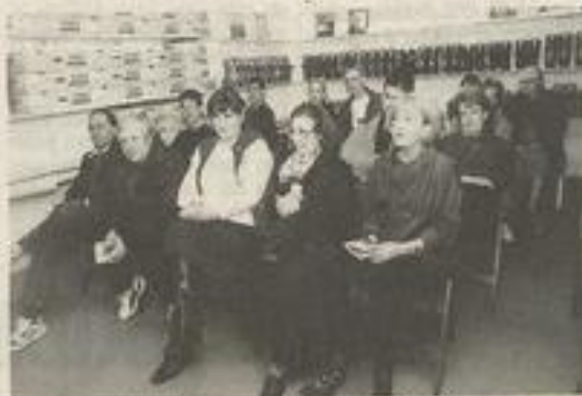
Le public a assisté à l'annonce du programme de ski.

Renseignements, inscriptions, location, carte neige, boue aux vêtements et matériel de ski, stage de ski exclusivement au local : jusqu'au 30 avril ; lundi, mardi, jeudi, vendredi de 18 h à 19 h, mercredi de 14 h à 19 h et samedi de 14 h à 16 h.