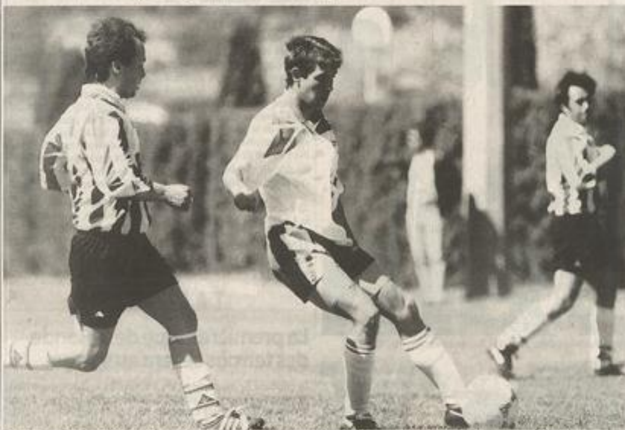
La saison prochaine réserve quelques changements : un recrutement extérieur est à l'ordre du jour.

En battant Fleury, Lézignan conserve sa place en 2 e division.