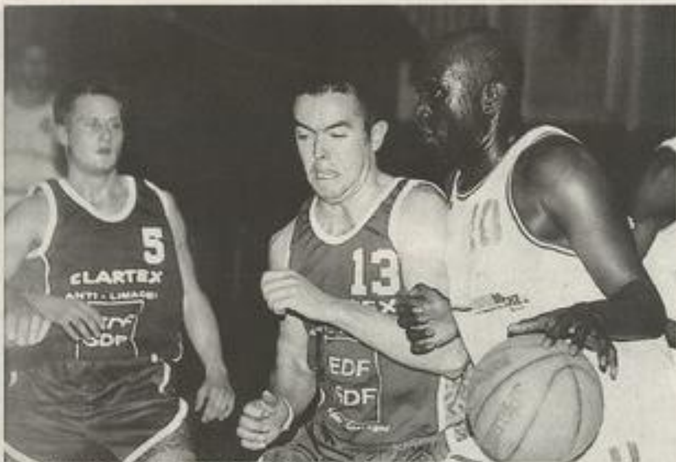
En cas de victoire les Lézignanais s'assuraient l'accession en Nationale 3.

A la dixième minute, le score étant de 10/14, Ameziame, lui aussi dans un mauvais jour, "offre" trois remises en jeu consécutives à Castera qui, grâce à ces "cadeaux" fait avancer la marque à 10/20.