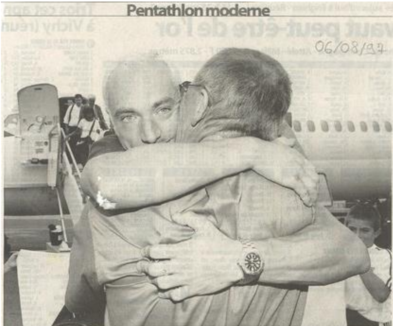
L'émotion est à son comble, à la descente de l'avion. De Lézignan, Amélie-les-Bains, Canet-en-Roussillon et Perpignan, ils étaient une bonne soixantaine à avoir voulu accueillir le champion de toute une région amoureuse de pentathlon moderne.