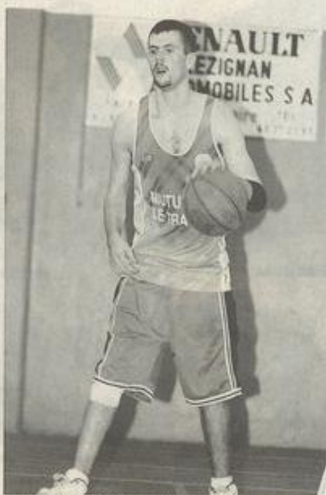
Le championnat débute samedi prochain Laguen photosvideo

Et samedi prochain, les choses sérieuses débiteront pour le BCL à domicile.