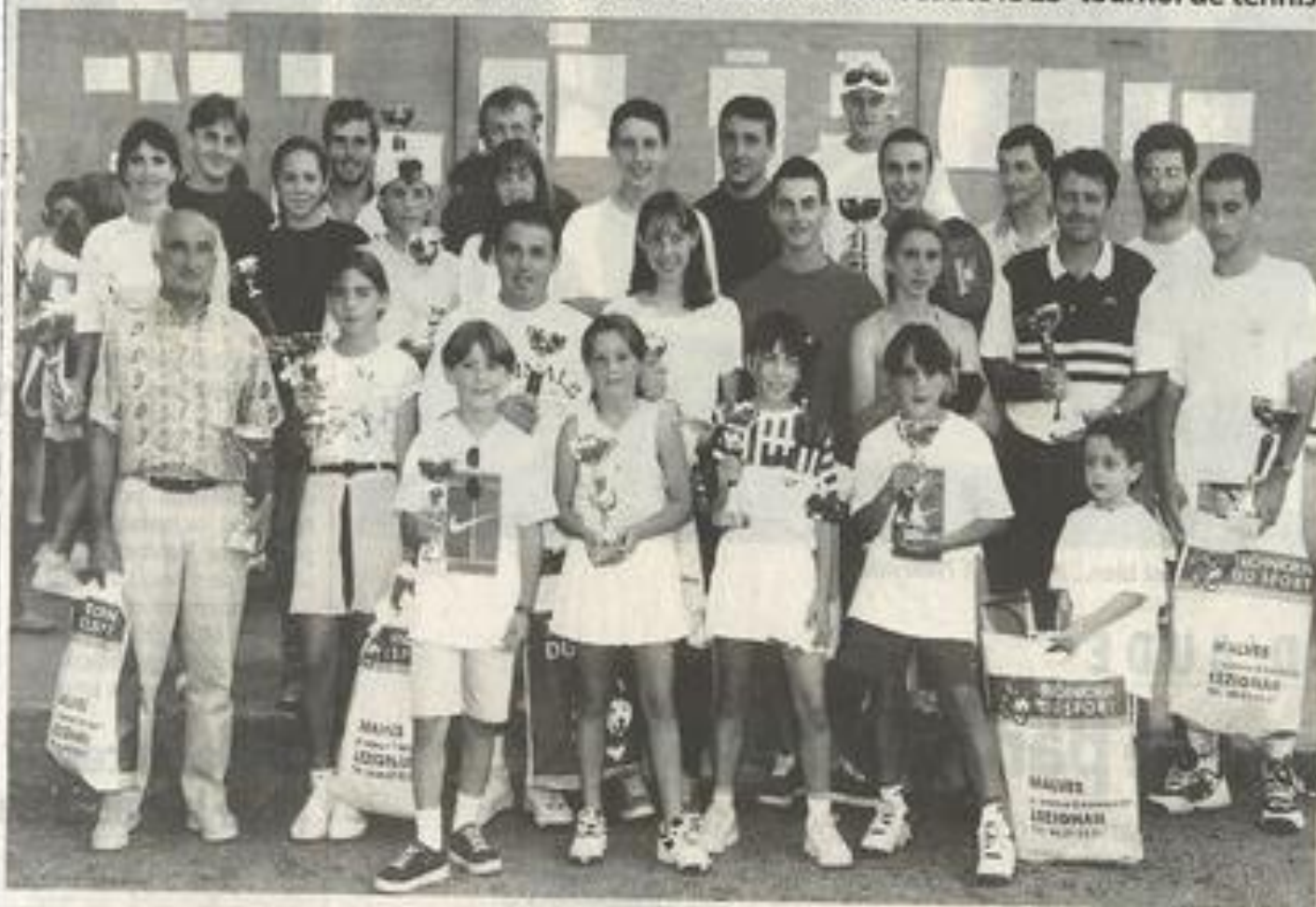
Les gagnants d'un tournoi fort apprécié, et à juste titre.

Quatre-vingt-dix minutes d'échanges tantôt violents tantôt subtils, toujours corrects en dépit de quelques contestations de décisions d'arbitre ont clôturé en beauté le 23 e tournoi de tennis.