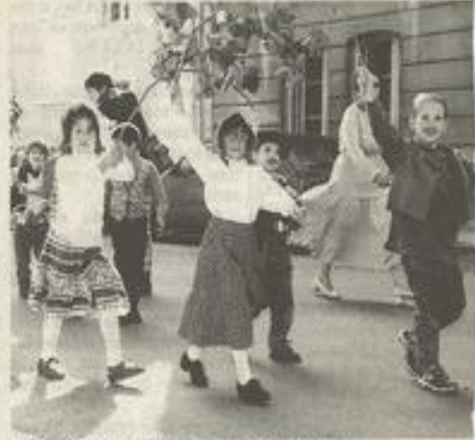
Après-midi de danse sous le soleil des Corbières.