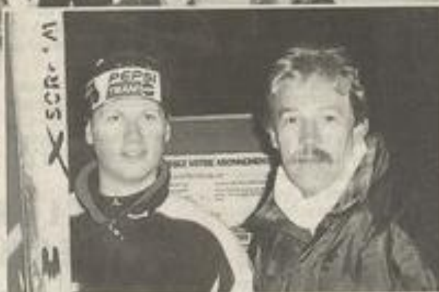
Edgard Grosperon s'est montré particulièrement chaleureux.

Mais l'événement majeur sera la rencontre d'Edgard Grosperon, médaillé d'or de ski acrobatique aux Jeux Olympiques