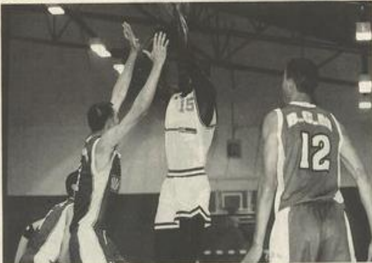
Si l'attaque hésite encore, la défense tient ses promesses. Encore quelques matches et le BCL sera prêt pour le championnat.

Une fois de plus le démarrage s'est fait lentement, et si la défense de zone est bien opérationnel-