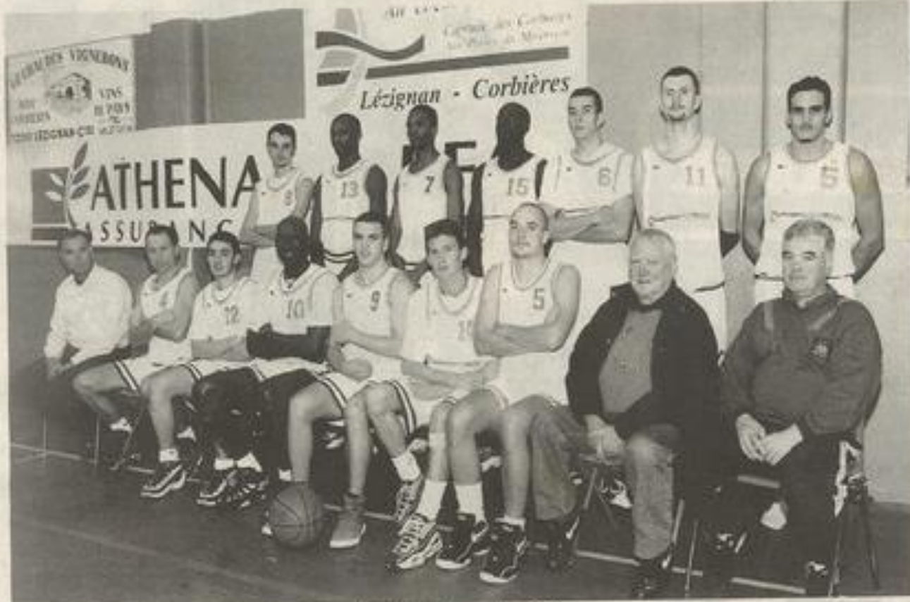
L'équipe du B.C. Lézignan qui sera au repos ce week-end.

A signaler que les sélections de l'Aude benjamins, benjamines seront au tournoi inter-comités ce week-end à Vauvert et Vergèze. Ils rencontreront leurs homologues de l'Hérault, du Gard et des PO.