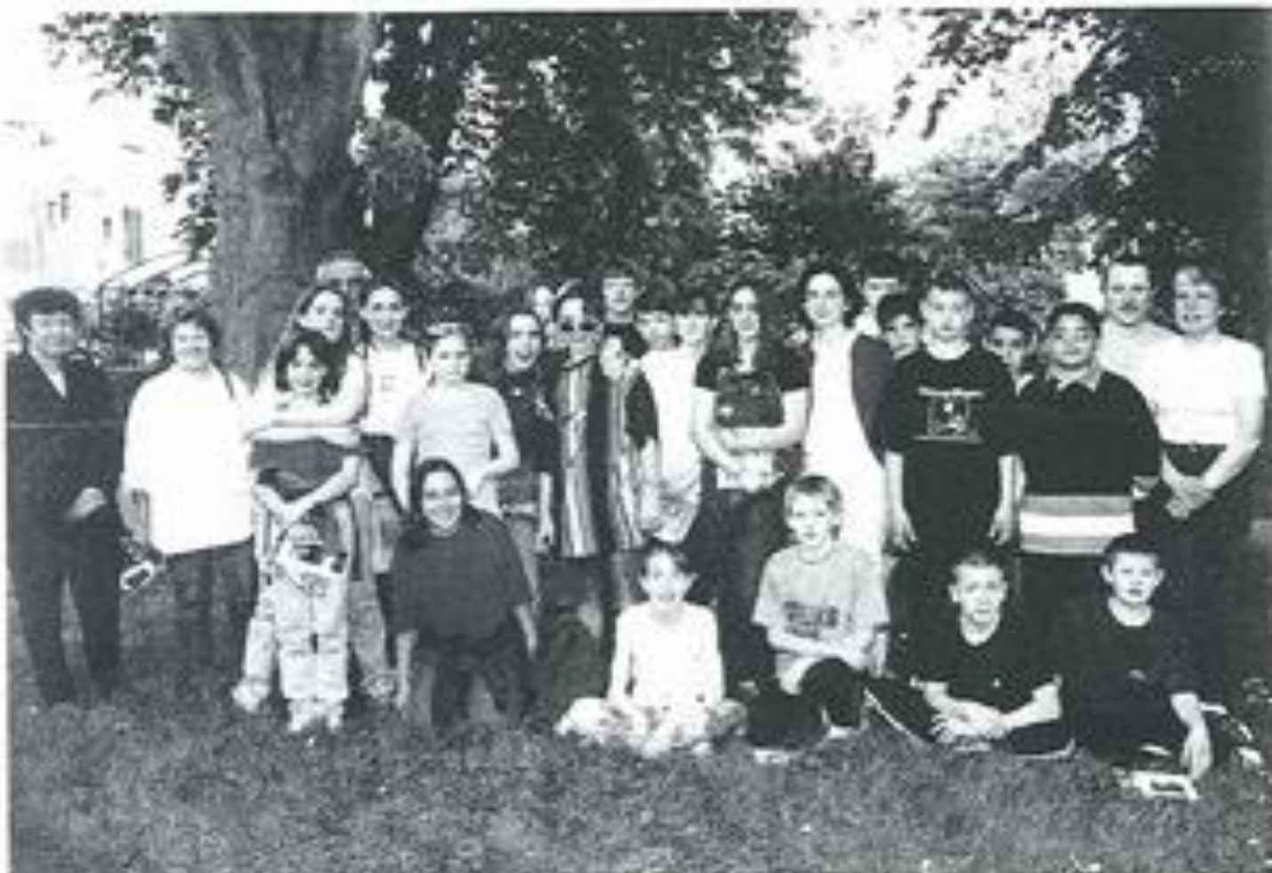
La classe de SèB du Collège La Bruyère : « Tout voir une première fois pour revenir plus tard avec les parents Laquens Photovideo »

Ils vont à Douzens, au Musée des Oiseaux, visitent les carrières de marbre à Caunes-Minervois, grimpent pour le déjeuner jusqu'à Notre-Dame du Cros, font le tour de la Cité de Carcassonne, empruntent le petit train, participent à une soirée