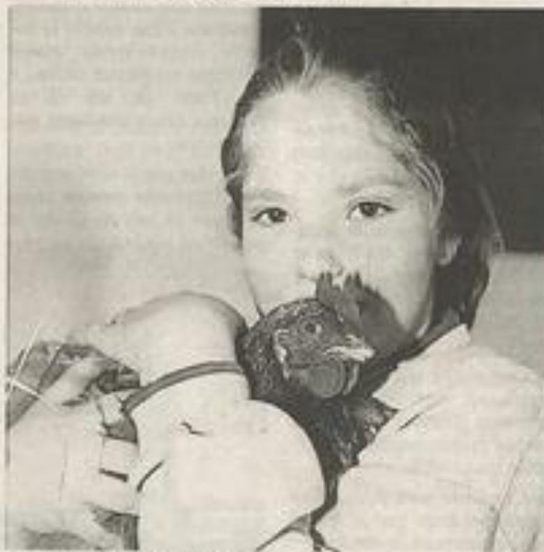
Une poule bien affectueuse !

Ce joyeux échange inter-générationnel de Pâquettes s'est prolongé dans l'après-midi par des chants.