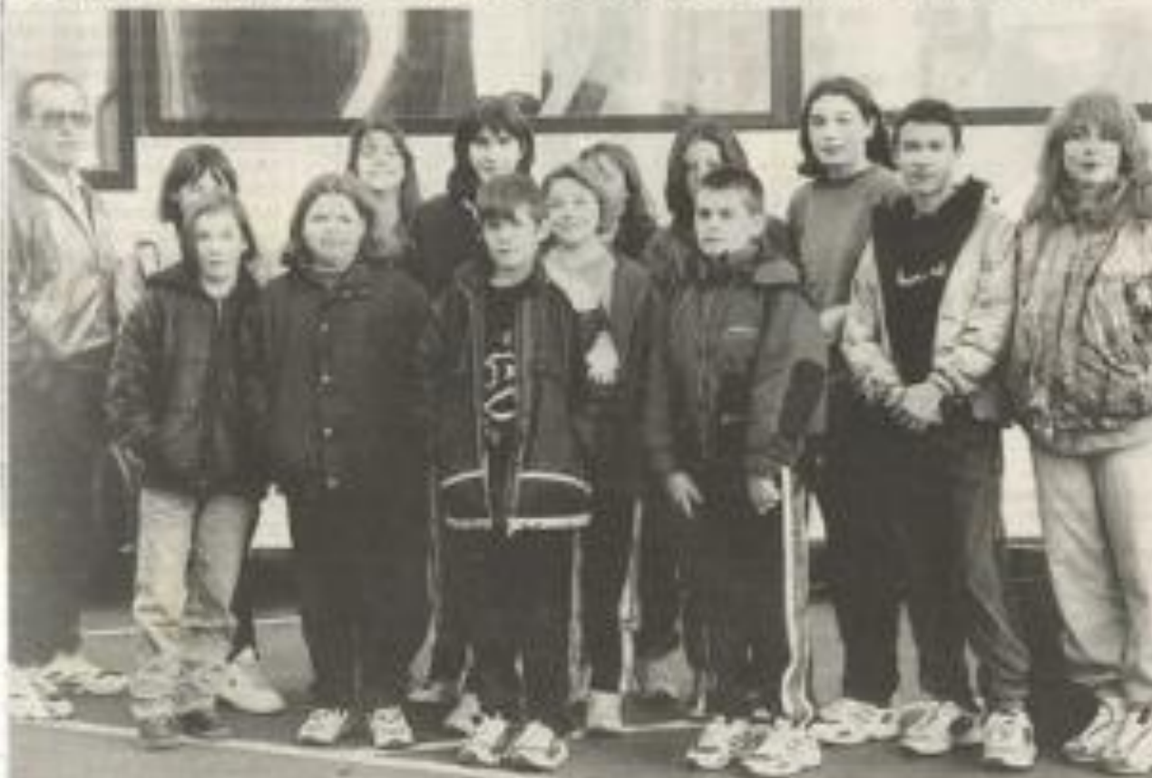
Les nageurs du club Corbières-Minervois en route vers Carcassonne.

Les six clubs de natation de l'Aude se sont retrouvés dans le même bassin.