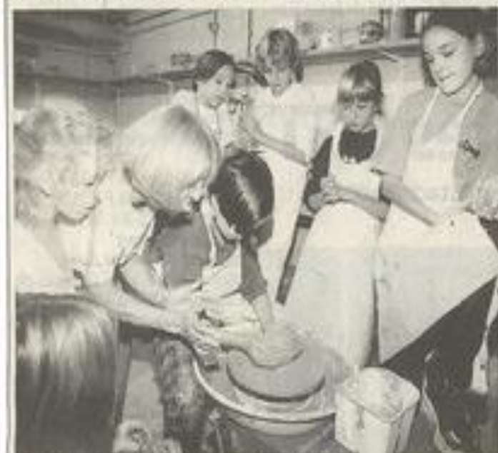
Les ateliers tournaient autour du vin primeur.