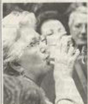
Certains se sont délectés des plaisirs du vin.