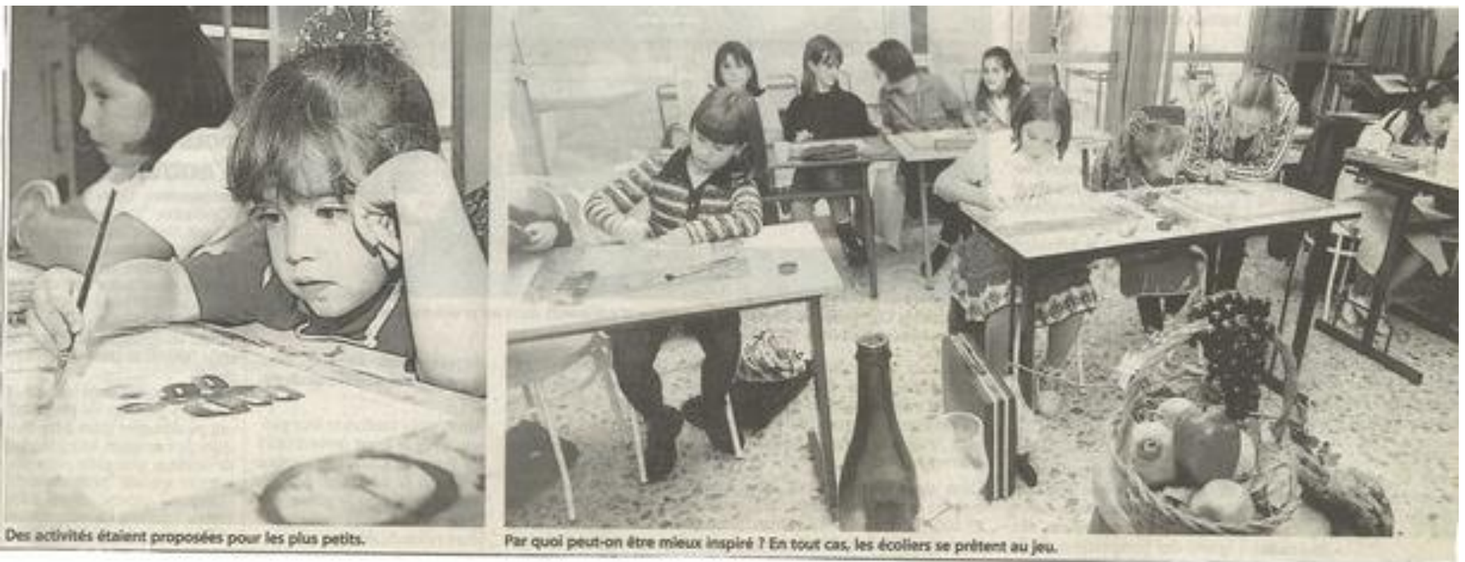
Des activités étaient proposées pour les plus petits.