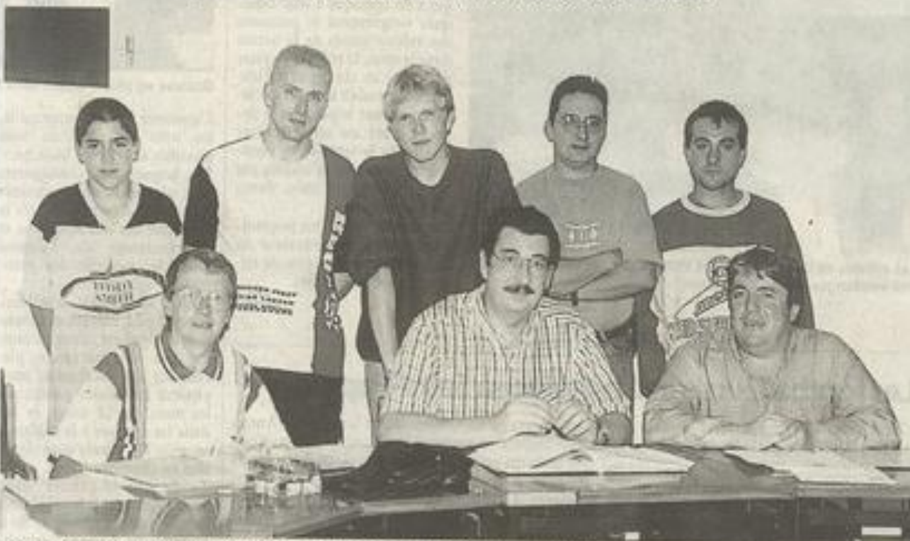
Les membres du bureau ont fait le point sur la saison à venir.