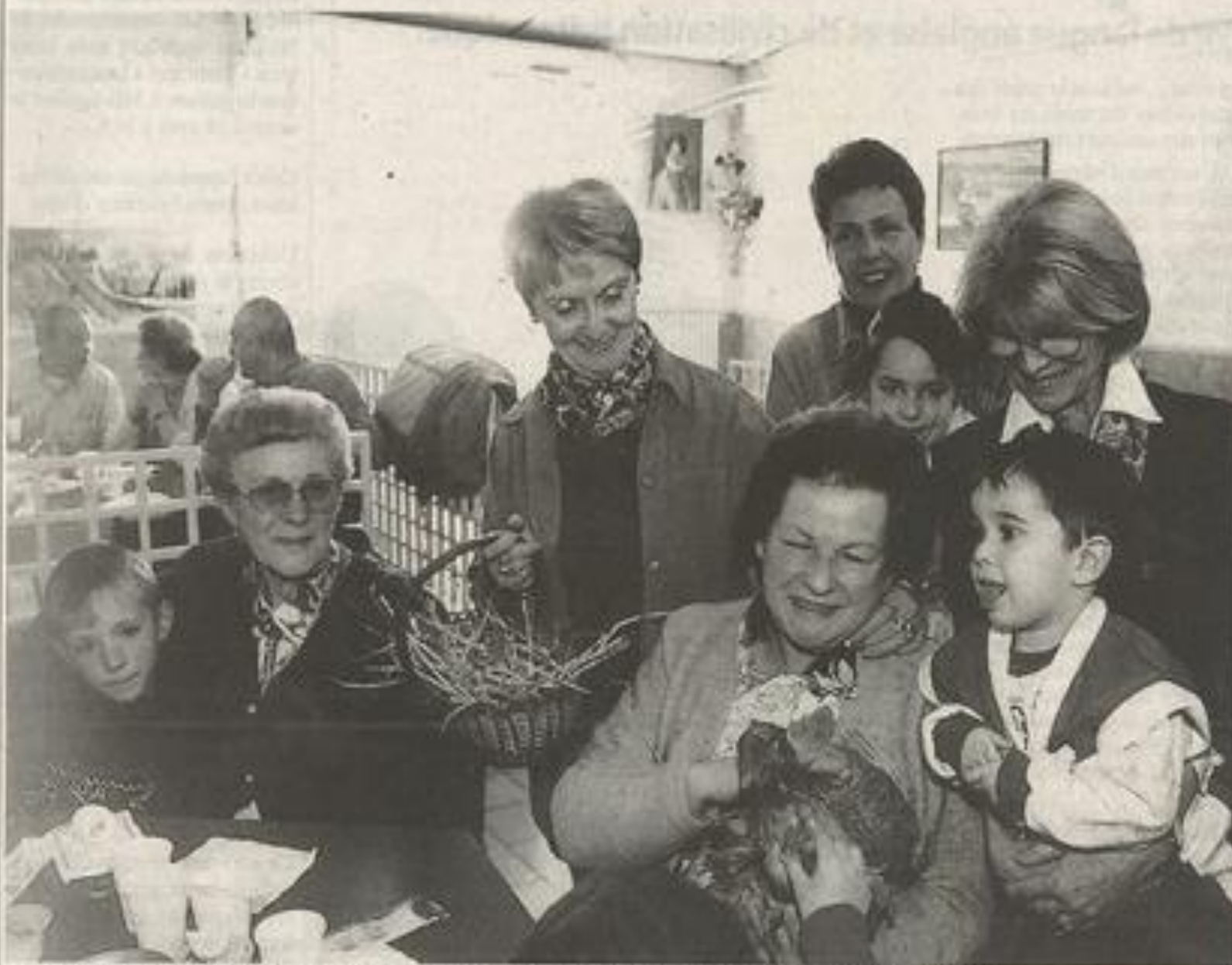
Le club des Jonquilles et la Lauseta se sont retrouvés pour une rencontre gourmande et pleine de surprises.

On le sait bien, le temps du week-end pascal n'a pas favorisé les activités de plein-air.