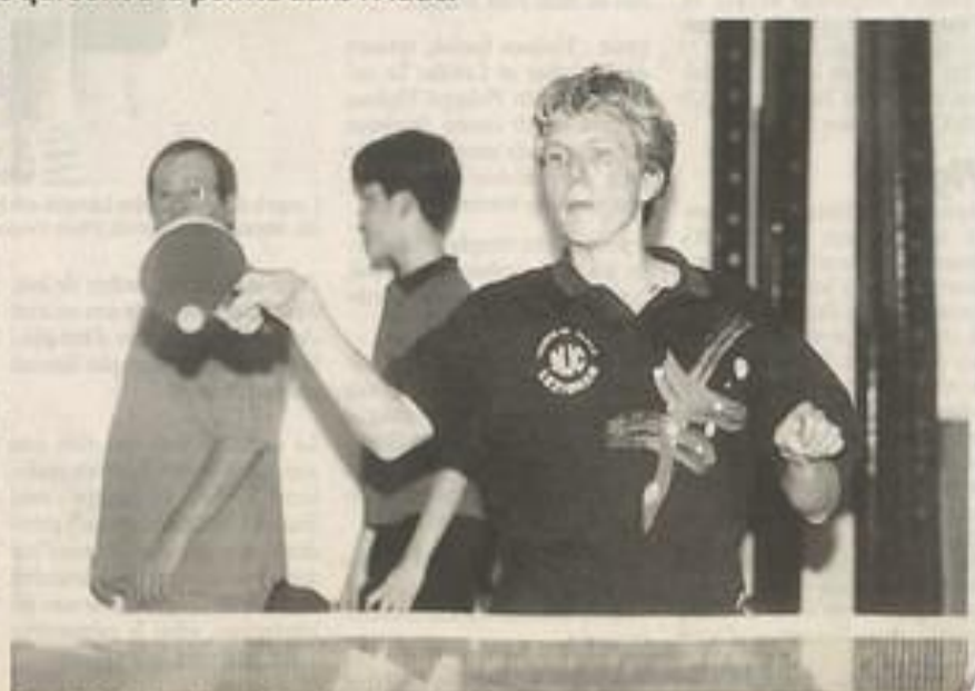
Depuis 1995, le nombre de licenciés et de clubs n'a pas cessé d'augmenter.

Sur le plan individuel 40 licenciés contre 14 en 95, participent aux championnats individuels. Quand d'autres clubs, comme Lézignan, auront atteint leur vitesse de croisière, ces chiffres devraient être encore en augmentation.