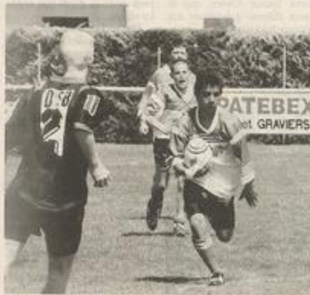
Face aux Catalans, les Lézignanais se sont bien défendus.