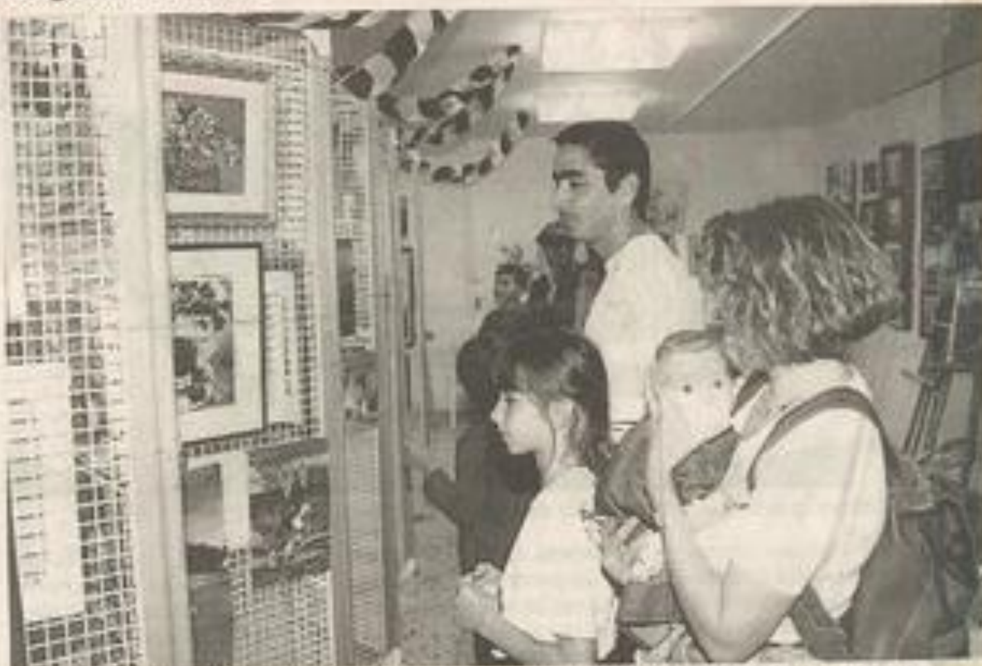
Grands et moins grands ont passé un bon moment. Comme seule la culture peut en procurer.

B eaucoup de monde, vendredi, dans les locaux de la Maison des jeunes et de la culture, rue Marat, à l'occasion de l'inauguration de la traditionnelle exposition réunissant l'ensemble des œuvres réalisées tout au long de l'année dans les différents ateliers. Cette sympathique manifestation a permis de découvrir le talent des adhérents dans plusieurs disciplines. Celle qui s'impose sans conteste est la photographie. Les membres du photo club présentent en effet un travail de qualité et donnent à voir le regard qu'ils savent porter sur tout ce qui nous entoure. Il ne faut surtout pas oublier la poterie, la peinture où là aussi, les "artistes" font preuve d'un véritable savoir-faire. Mais la liste des ateliers qui exposent est bien trop longue à énumérer. Mieux vaut s'y rendre. L'exposition se tient jusqu'au 21 juin prochain, du lundi au samedi de 15 h à 19 h.