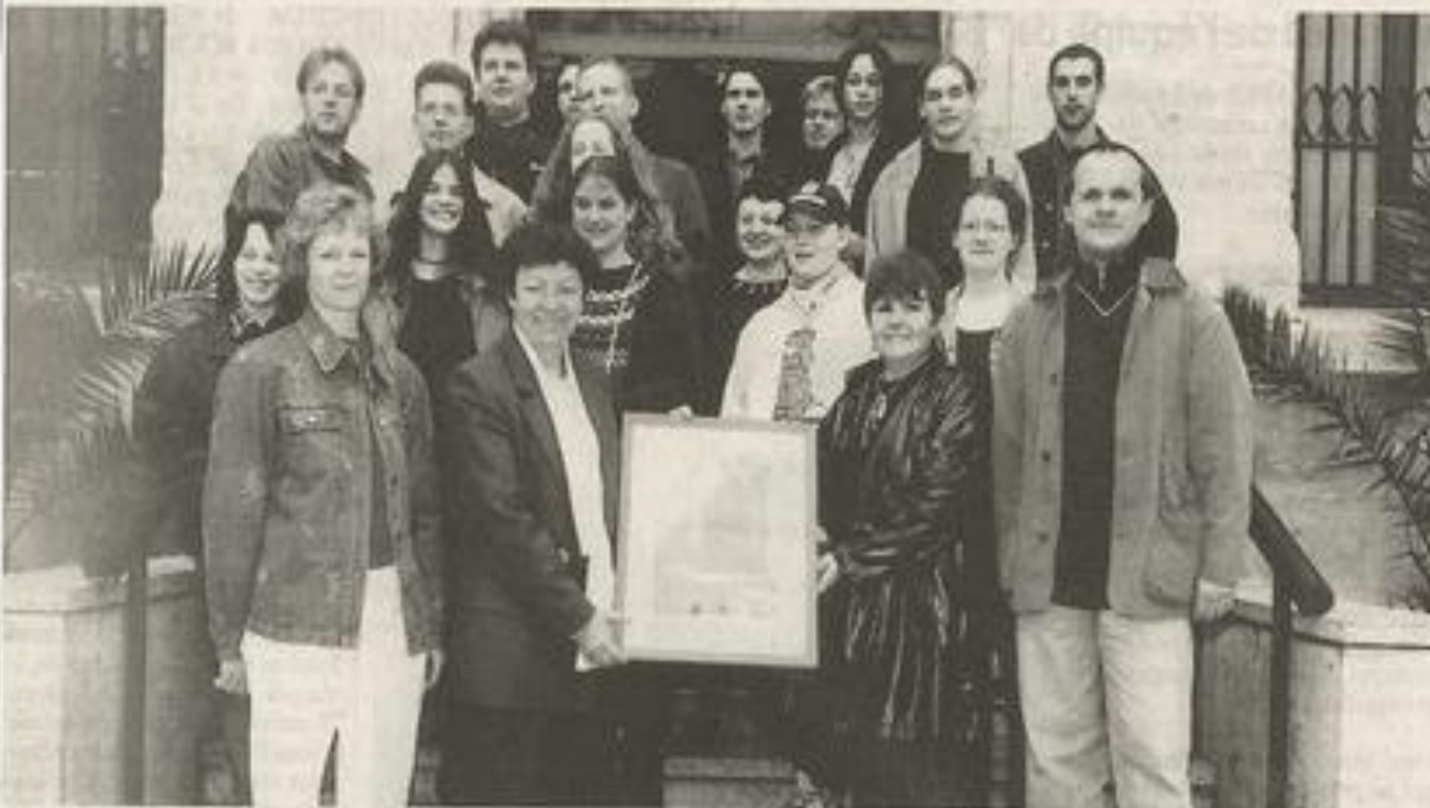
L'œuf de géant de Lauterbach en photo.

Arrivés en autocar pour deux concerts dans l'Aude, les deux groupes de musiciens de Lauterbach avaient choisi de séjourner dans leur ville jumelle. Composé de trois musiciens, le groupe "Armour" est dans le registre heavy metal . L'autre, "Tampoon" se situe avec ses cinq musiciens dans le funk rock .