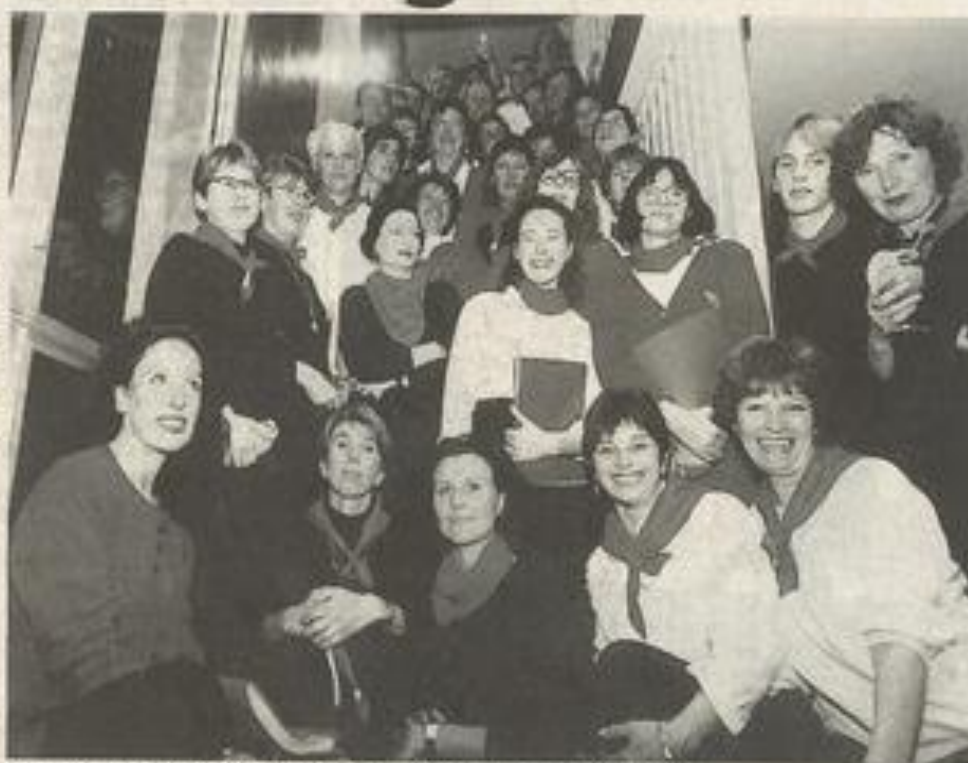
La chorale du Chiffon rouge a fait passer l'émotion.

L'hommage aux soldats du 17e qui, en retournant leur croix,