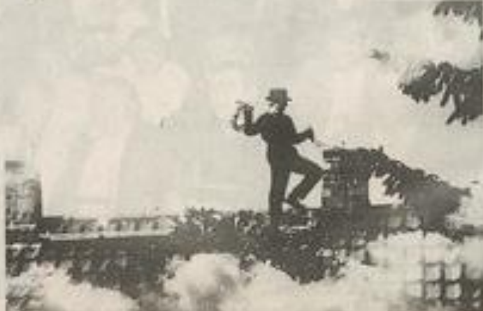
"Le Ramoneur de Lauterbach"