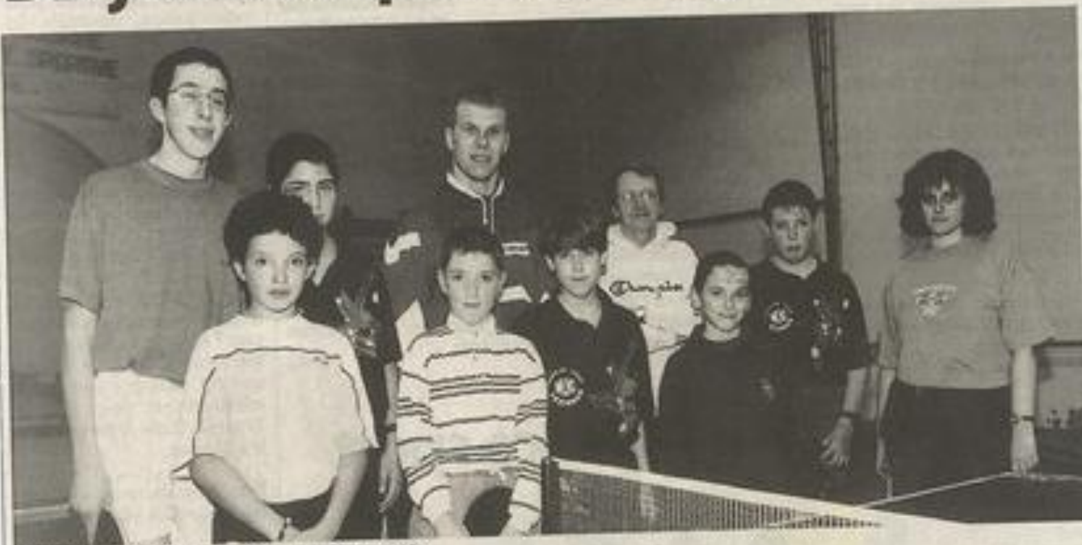
L'avenir du club c'est la jeunesse...

Un club sans jeunes est un club sans avenir. Le quantitatif (nombre de licenciés) est, bien entendu, important. Le "qualitatif" doit ensuite s'effectuer sans pression, dans une ambiance conviviale mais néanmoins rigoureuse.