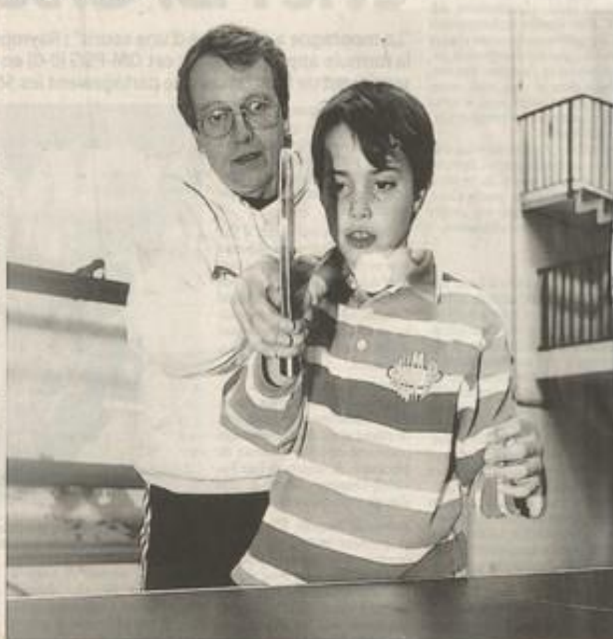
Les jeunes pongistes auront la possibilité de montrer leur talent lors du championnat.

C'est un paradoxe, si l'on considère que, toutes fédérations confondues, le nombre de licenciés est en perte de vitesse...»