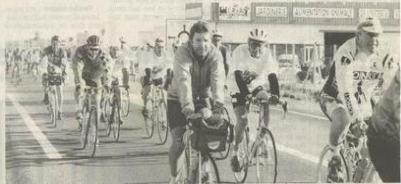
La traditionnelle randonnée cycliste a amené les sportifs à sillonner les Corbières. De cave en cave.