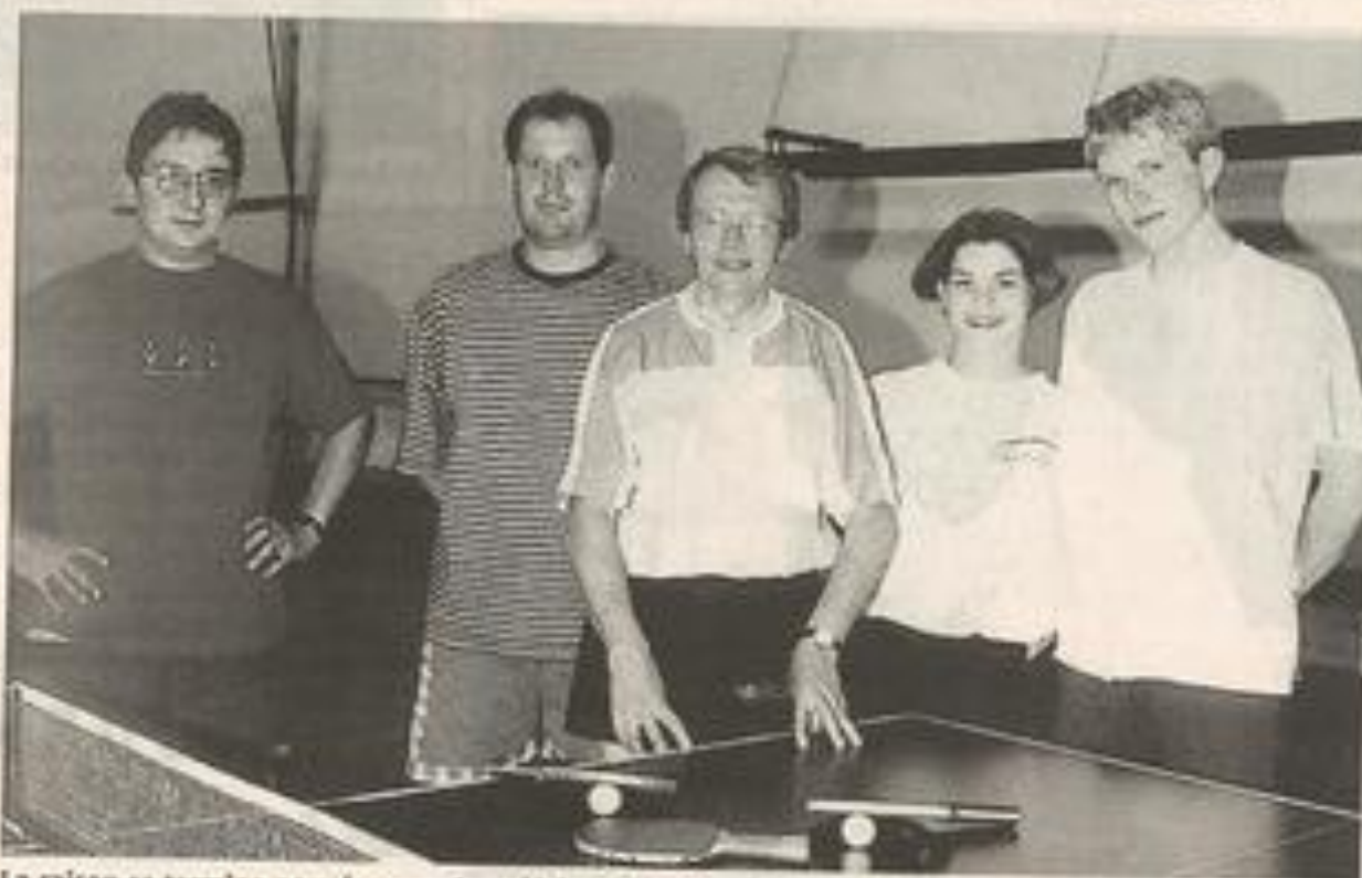
La saison se termine pour les pongistes lézignanais.

- Départementale II : Lézignan et Trèbes, invaincus, se rencontreraient pour le compte de la dernière journée. Match capital pour l'ascension en D1.