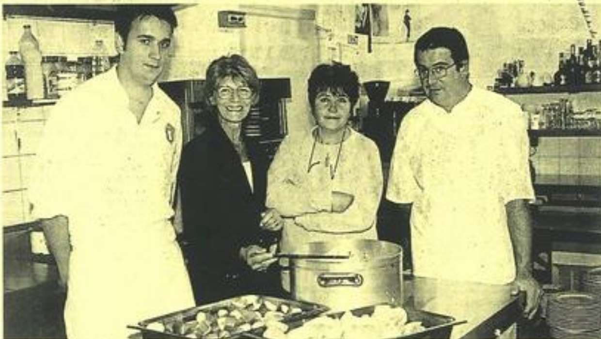
Une saveur d'aujourd'hui.

Cette année, l'événement revêt un caractère exceptionnel, nous disent les organisateurs, par le nombre de jeunes participants : toutes les écoles de Lézignan-Corbières participent, depuis la maternelle de l'école Françoise-Dolto jusqu'aux CM2 de Frédéric-Mistral et Marie-Curie.