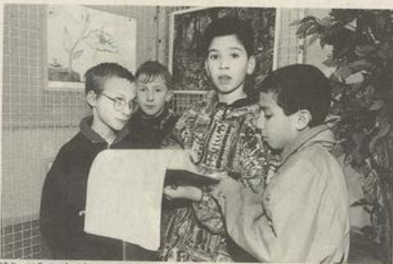
Visiter et lire, puis animer et commenter.

Efforts des visiteurs. Du coup, le visiteur est prié de fournir un effort assez inhabituel en pareilles circonstances. Il doit parfois se baisser, voire s'agenouiller et s'approcher beaucoup pour pouvoir lire toute cette abondance de textes qui accompagne les quelques ima-