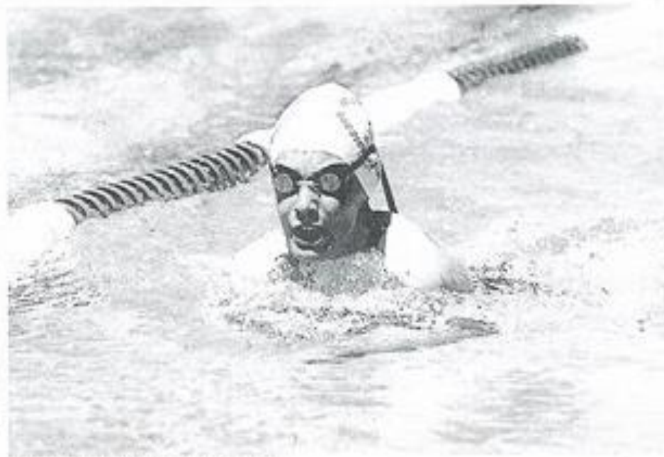
Dernière concentration avant le top départ.