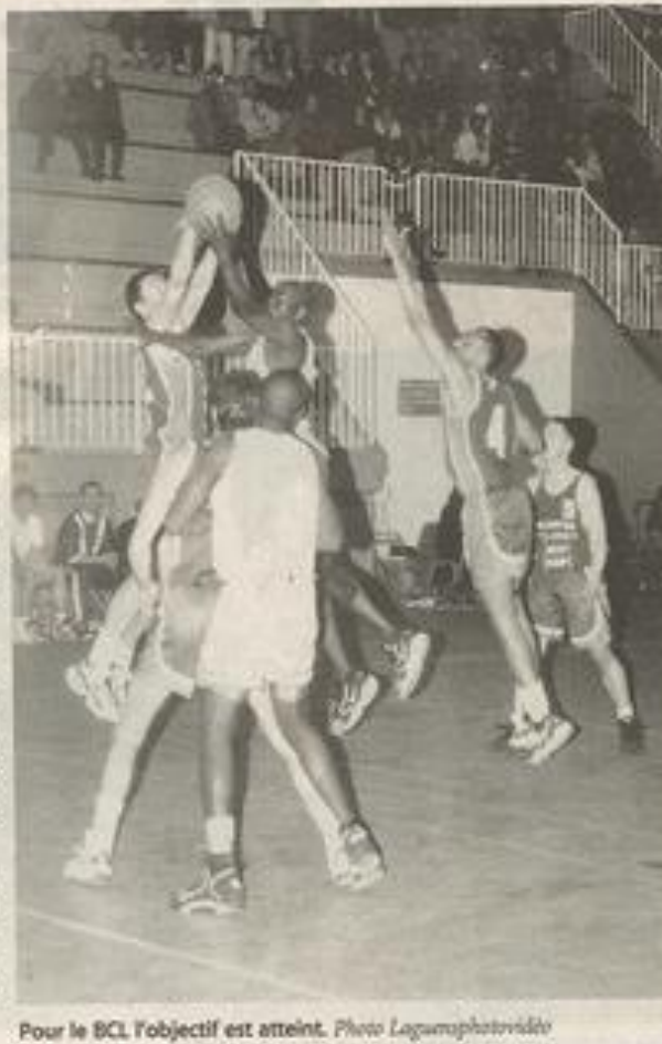
Pour le BCL l'objectif est atteint.

Pour ce championnat, le BCL a parcouru 6 800 km, visité trois ligues : Aquitaine, Languedoc, Midi-Pyrénées, et six départements : Ariège, Gers, Hérault, Landes, Lot et Garonne, Pyrénées Atlantique.