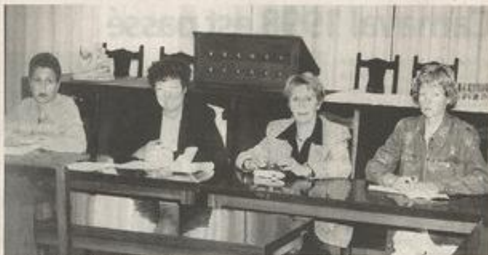
Bientôt le 30 e anniversaire pour le comité et ses membres.

Le 22 mai prochain, Lézignan accueillera la fête de la bière, accompagnée d'une succulente choucroute. Gernot Schobert