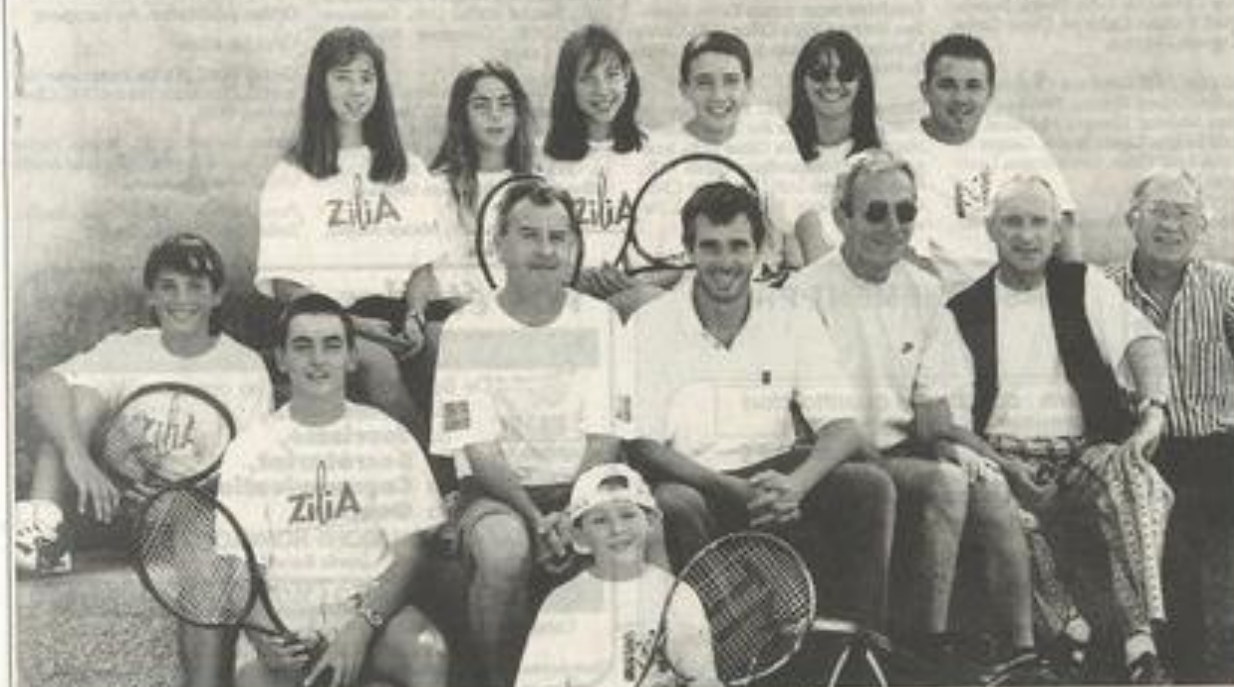
Les tennismen corses sont venus fouler les courts de la Pinède.

Ils sont sportifs, ils sont en vacances, quoi de plus naturel dans ces conditions que de participer au 23 e tournoi du TCL. Rien de bien original sauf qu'ils arrivent directement de l'île de Beauté.