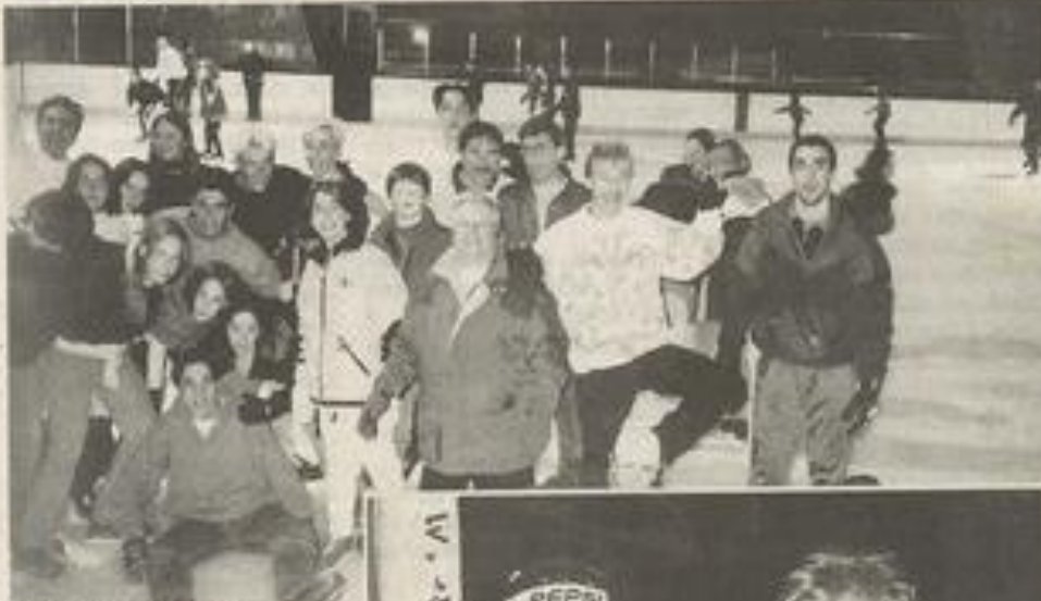
Les Lézignanais à la fête.

Un programme d'animations, pour éviter les temps morts, a été concocté par les organisateurs du voyage et par René, le dynamique gérant du chalet des Combes, où logeaient les Lézignanais.