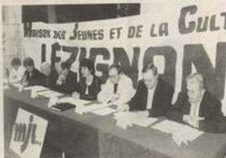
Il faudra mettre à plat les problèmes entre la fédération et la MJC.