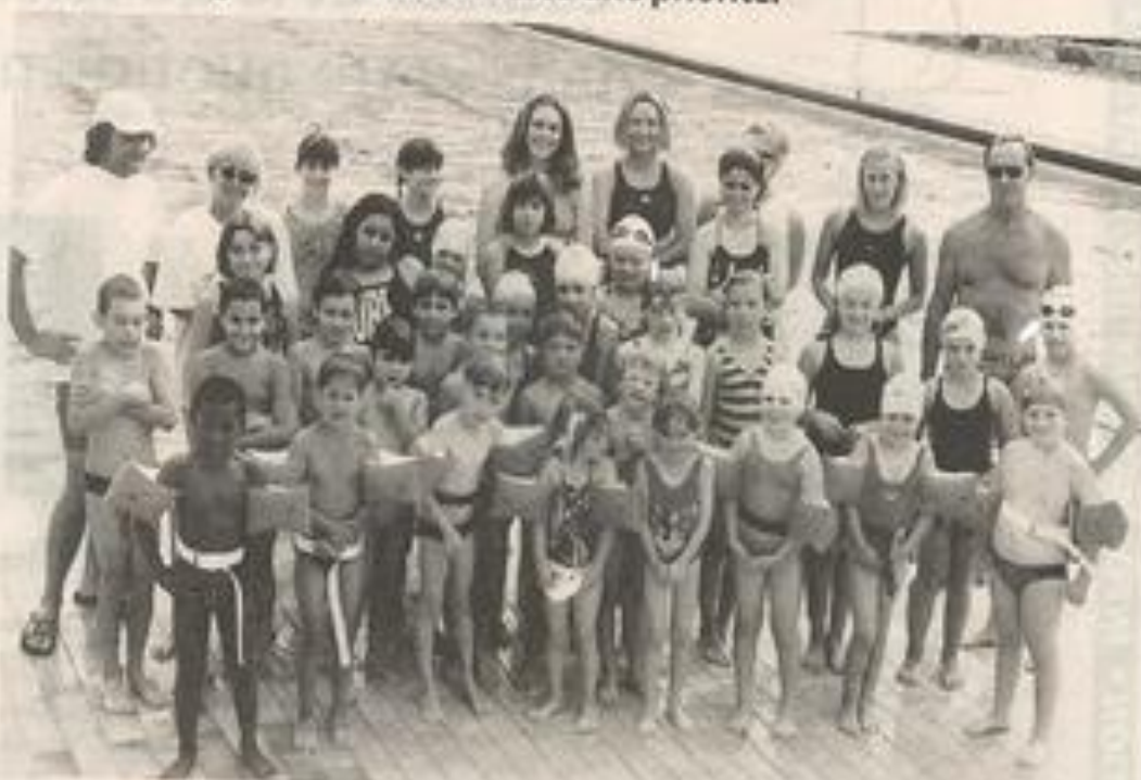
Ça "baigne" pour les élèves de l'école de natation.

Les nageurs du club plus avertis seront en compétition pour les