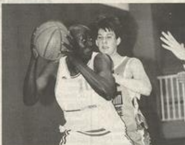
Le BCL est en bonne voie.

Mais Lézignan continuait à défendre sérieusement, gagnait des balles et comme son attaque, mobile à souhait, permettait à ses tireurs de conclure, le score restait toujours à l'avanta-