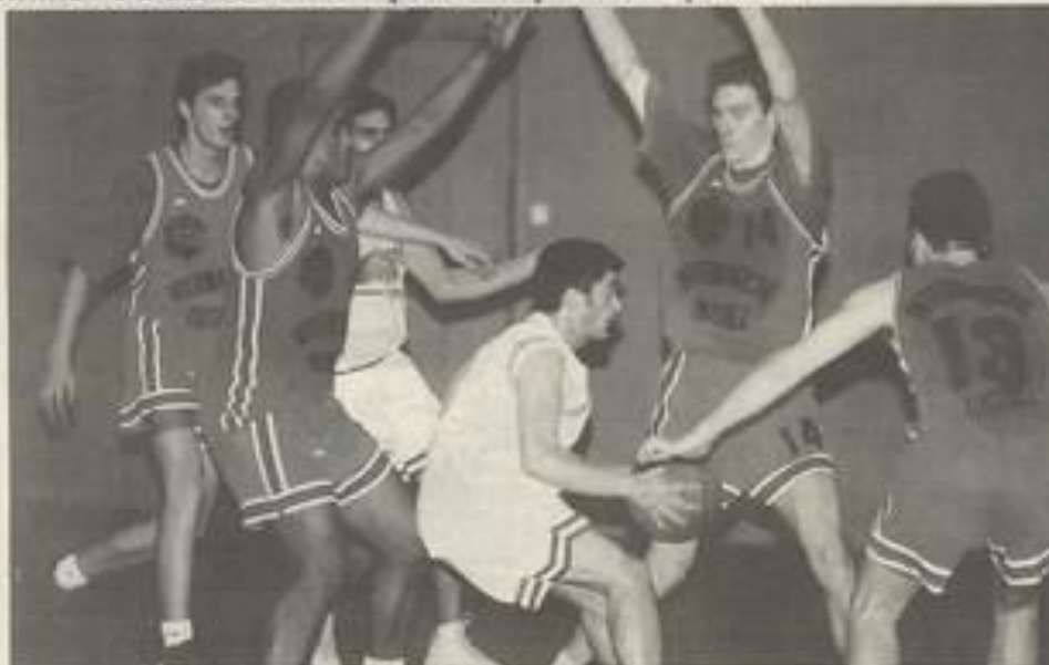
Une domination sous les paniers.

Il n'y a eu qu'une seule équipe sur le terrain, les jeunes peuvent être intégrés. Et bien non ! En basket, rien n'est joué jusqu'à la dernière minute.