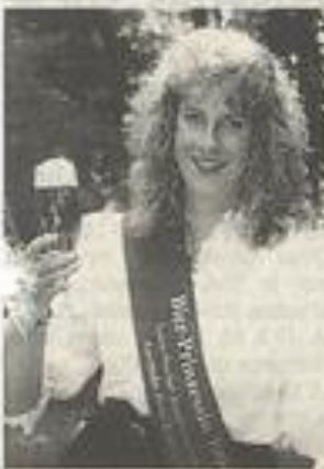
La bière est une fête.

Ils ne sont pas remués les mains vides : avec une dizaine de cartons de primeur rouge et blanc et puis aussi du vrac, ils