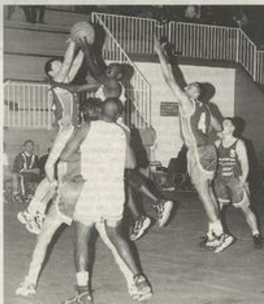
Il reste encore un espoir au BCL, aller vaincre samedi prochain à Penne d'Agen.