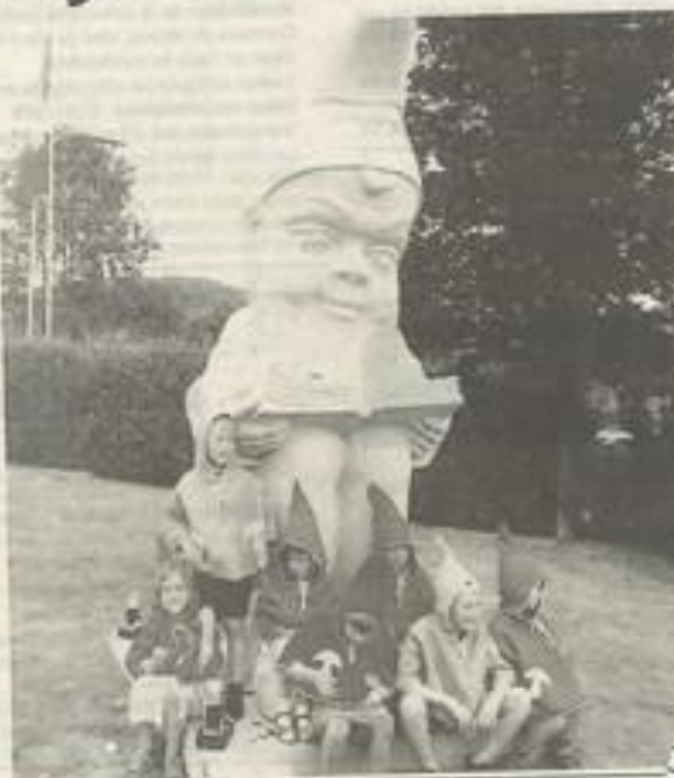
Trois mètres de haut pour un poids de huit tonnes.

Ce nain lisant est maintenant arrivé à sa destination : le jardin de l'entreprise Heissner où on peut, depuis, l'admirer.