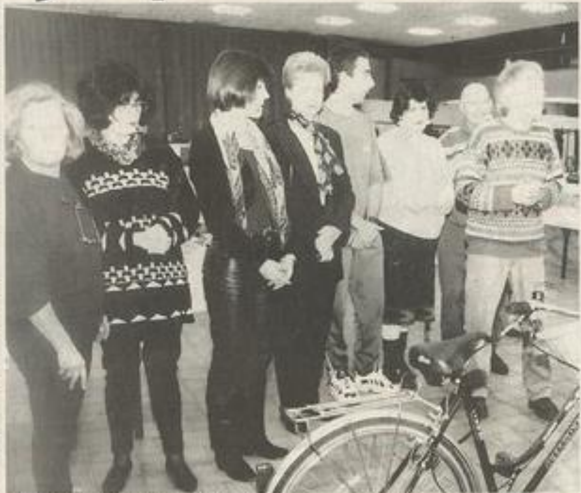
On trouve de tout à l'inutile. Lagueux Photovideo

Jusqu'à dimanche au Palais des fêtes : de 9 h 12 h et de 14 h 19 h.