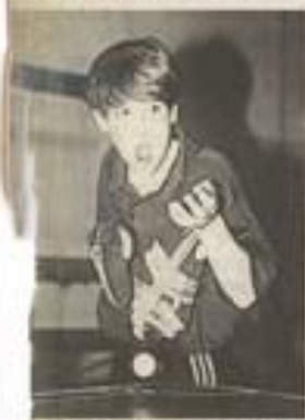
La préparation indispensable pour se mesurer aux adversaires.

Aujourd'hui, le championnat jeunes est un outil à la disposition des prospecteurs dans les localités qui veulent créer de nouvelles structures pongistes. Neuf clubs participent à cette nouvelle expérience qui connaît un grand succès.