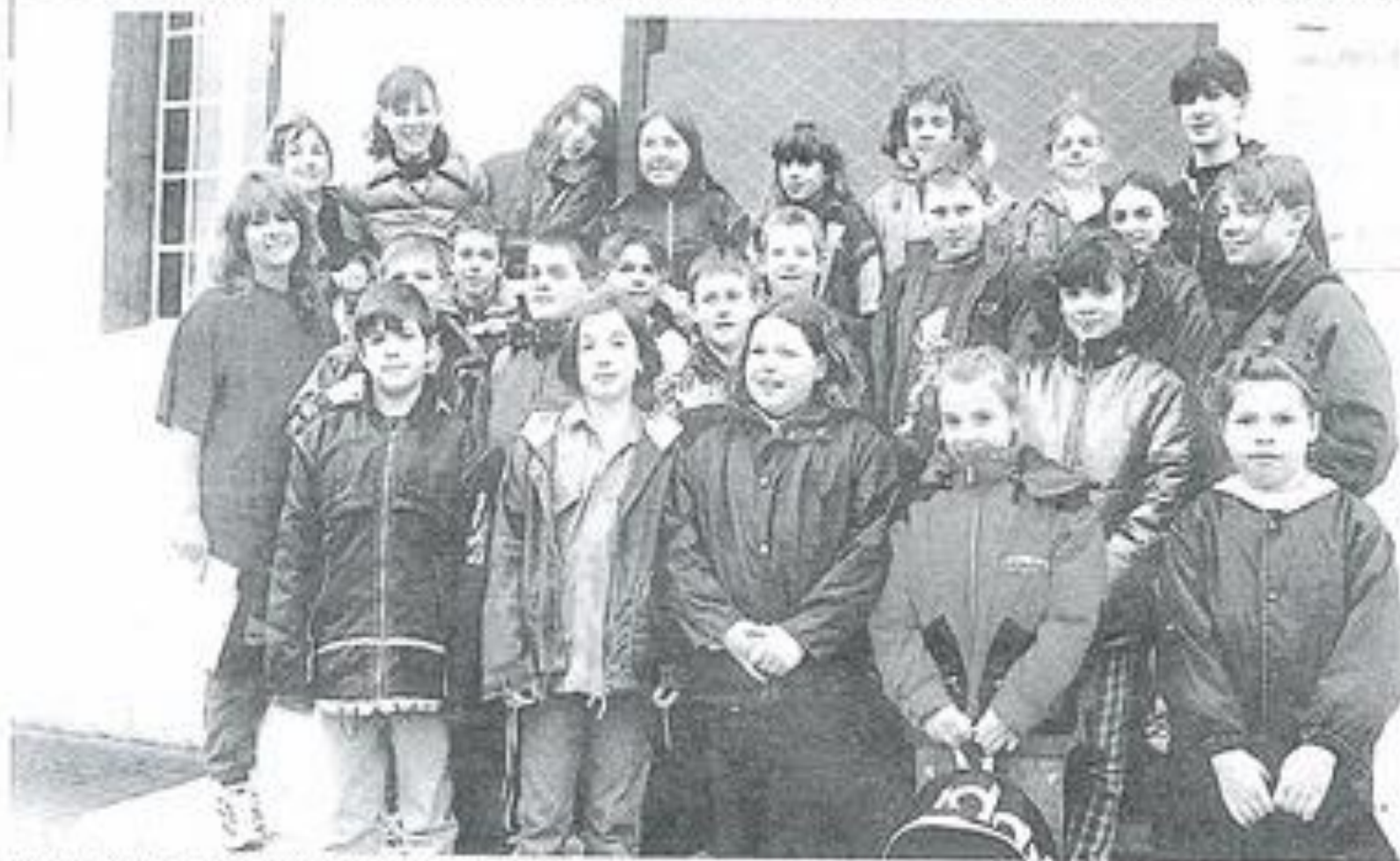
Le club vert et blanc se hisse à la quatrième place

Des lauriers pour une jeune naïade du club de natation Corbières-Minervois.