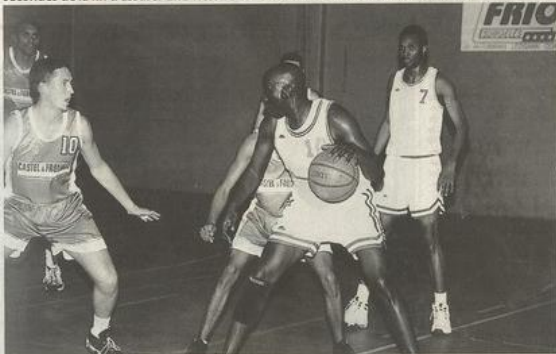
Le BCL a encore réussi l'exploit.

Samedi, dans une chaude ambiance créée par "l'éveil lézignanais", le BCL a réussi l'exploit à 8 secondes de la fin d'assurer une victoire contre Valence-Condom en Nationale 4.