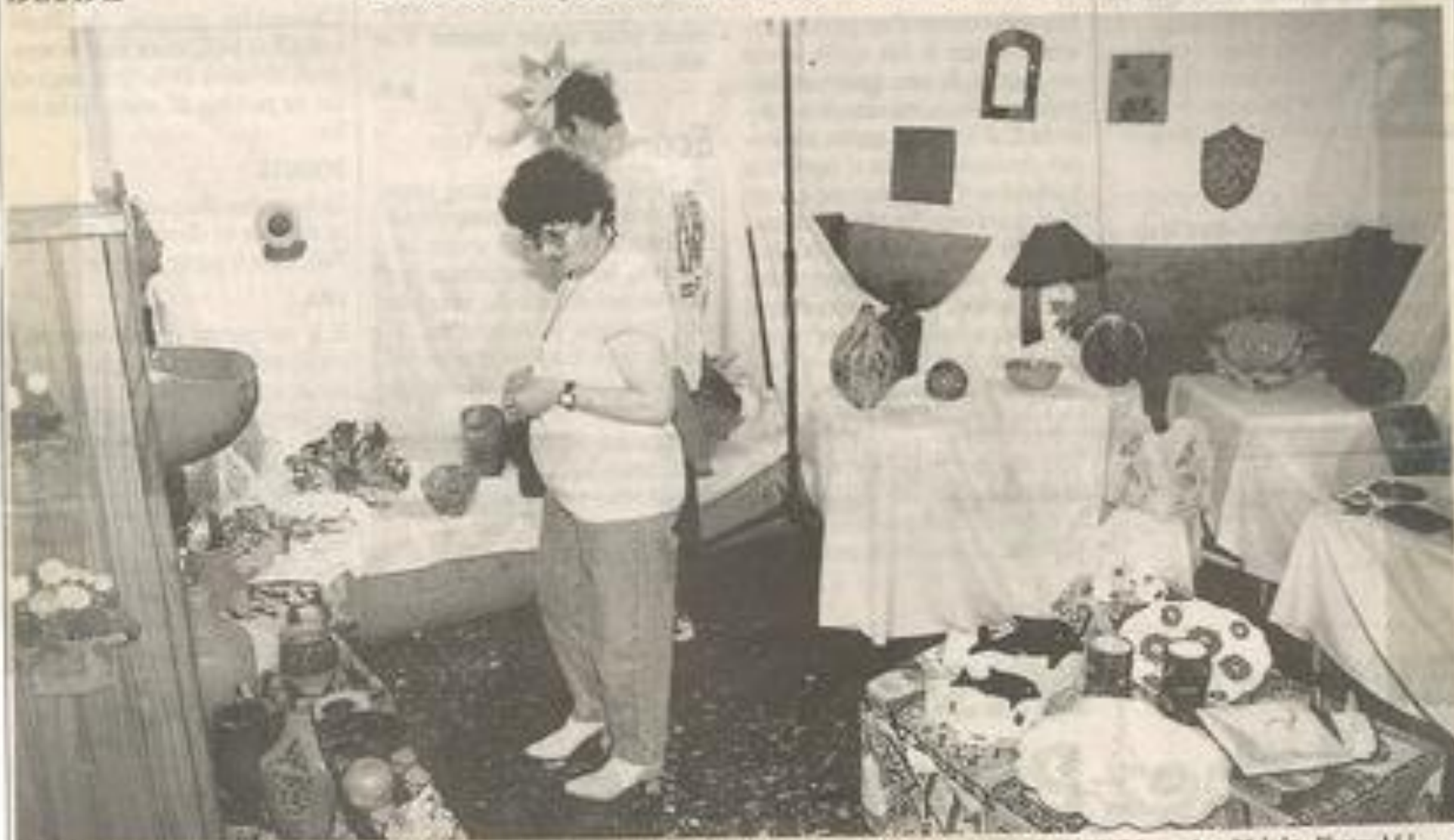
Les œuvres ont été conçues tout au long de l'année. Vous pouvez encore les voir dans les ateliers de la MJC jusqu'au 21 juin.