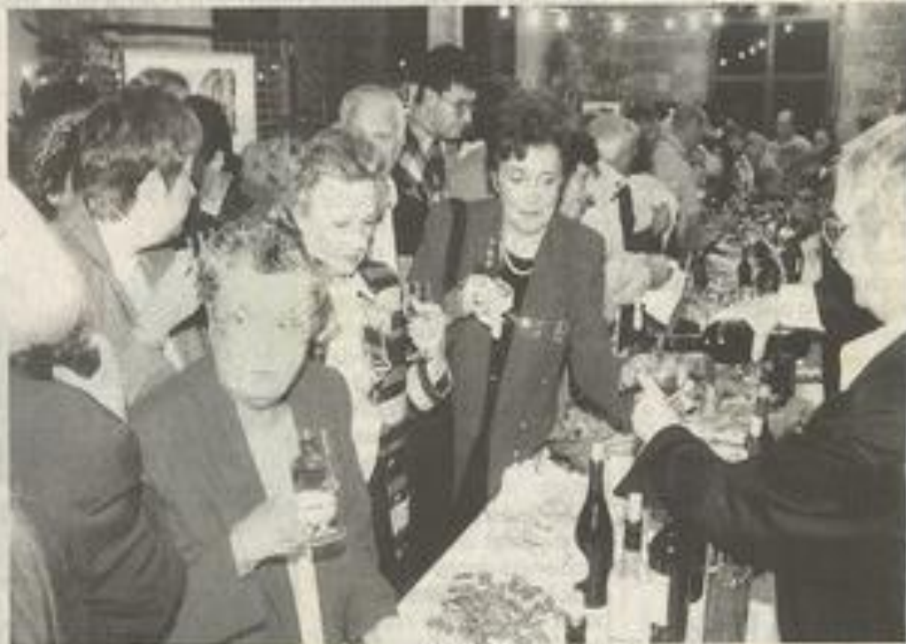
R. P. Un buffet automnal bondé de monde.

D'ores et déjà, rendez-vous est pris pour 98, à l'occasion du dixième anniversaire de cette fête du vin primeur.