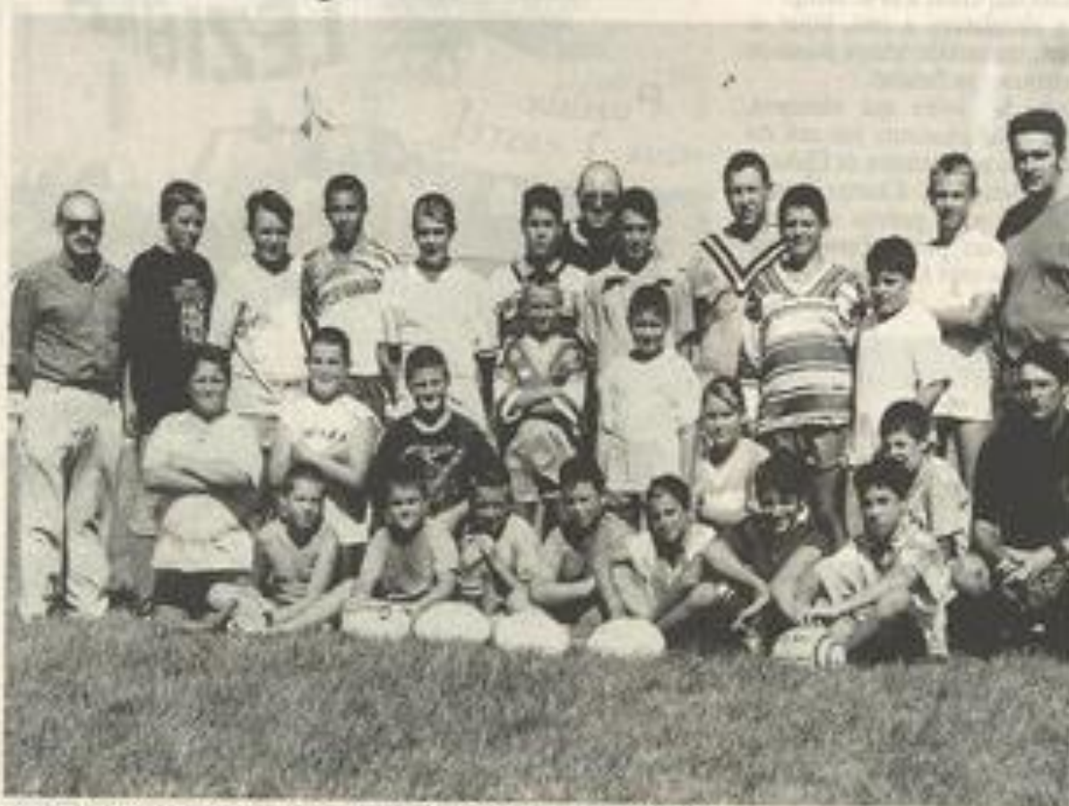
Il s'agit d'être prêt pour la compétition.

L'école de rugby compte une bonne douzaine de présents, quatorze pour les minimes. Les 13 cadets, eux, avaient cinq excusés pour cause de vendanges. Des chiffres qui devraient évoluer à la hausse au cours des prochains rendez-vous. Chose qui permettra aux responsables d'être parés pour le début de la compétition, cette dernière devant débiter en octobre prochain. La constitution des poules en toutes catégories, et les dates des rencontres seront communiquées ultérieurement.