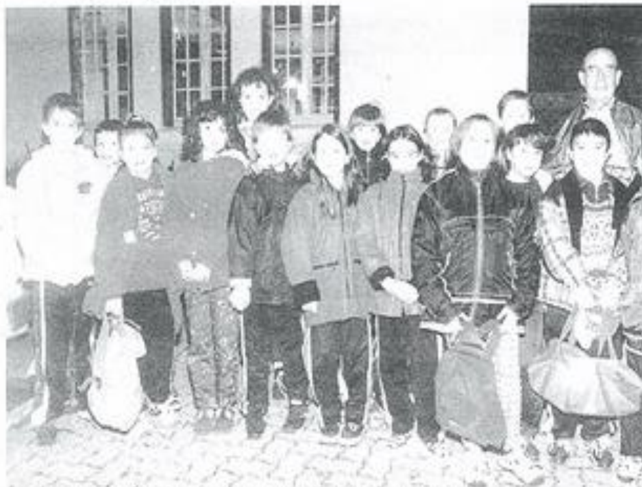
Les nageurs du club Corbières-Minervois ont montré de belles qualités à Trèbes.