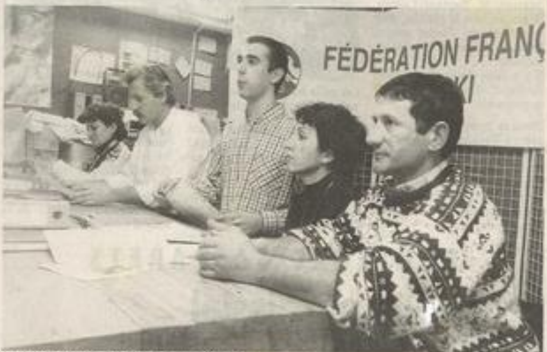
On s'organise pour le départ.

Les heureux vacanciers raconteront tout cela à leur retour prévu samedi prochain.