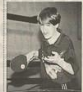
Depuis octobre, le championnat ouvre ses bras aux jeunes.

Le championnat départemental a démarré en octobre pour la saison 97/98 avec quatre niveaux de compétition (trois en 95).