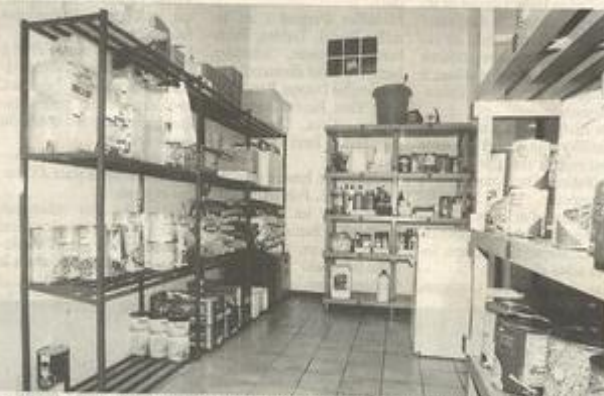
Des étagères en plastique alimentaire, un petit réfrigérateur pour conserver les repas-tests sur une durée de trois jours et destinés aux contrôles.

cuit que les spécialistes appellent la "marche en avant"... C'est-à-dire que les circuits ne doivent pas se croiser, l'entrée des aliments se fait par une porte et les produits "sales" sortent par une autre. Entre les deux, on trouve les salles de réfrigération et la cellule de refroidisse-