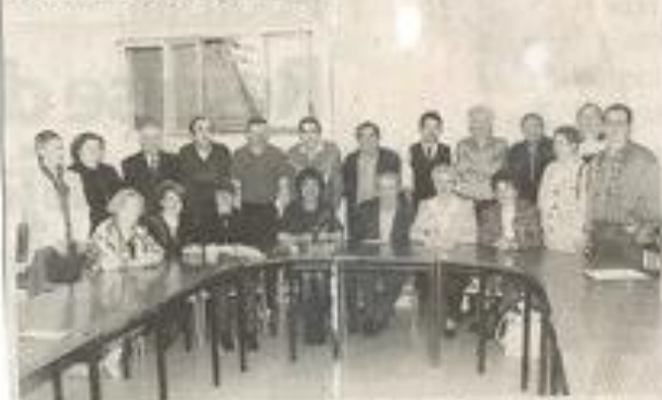
Le vote du conseil d'administration Lagum Photovideo

C'est dans la bonne humeur quasi-générale que s'est déroulée l'élection d'un nouveau bureau.