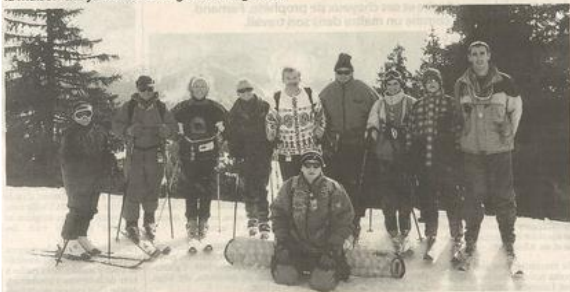
Un immense domaine skiable pour tous les amateurs de ski !

Après trois années passées à Wagrain dans le Tyrol autrichien, près de Salzbourg, le Ski-club de la Maison des jeunes va changer de villégiature.