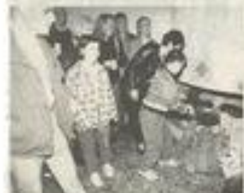
On se brûle un peu les doigts mais c'est si bon !