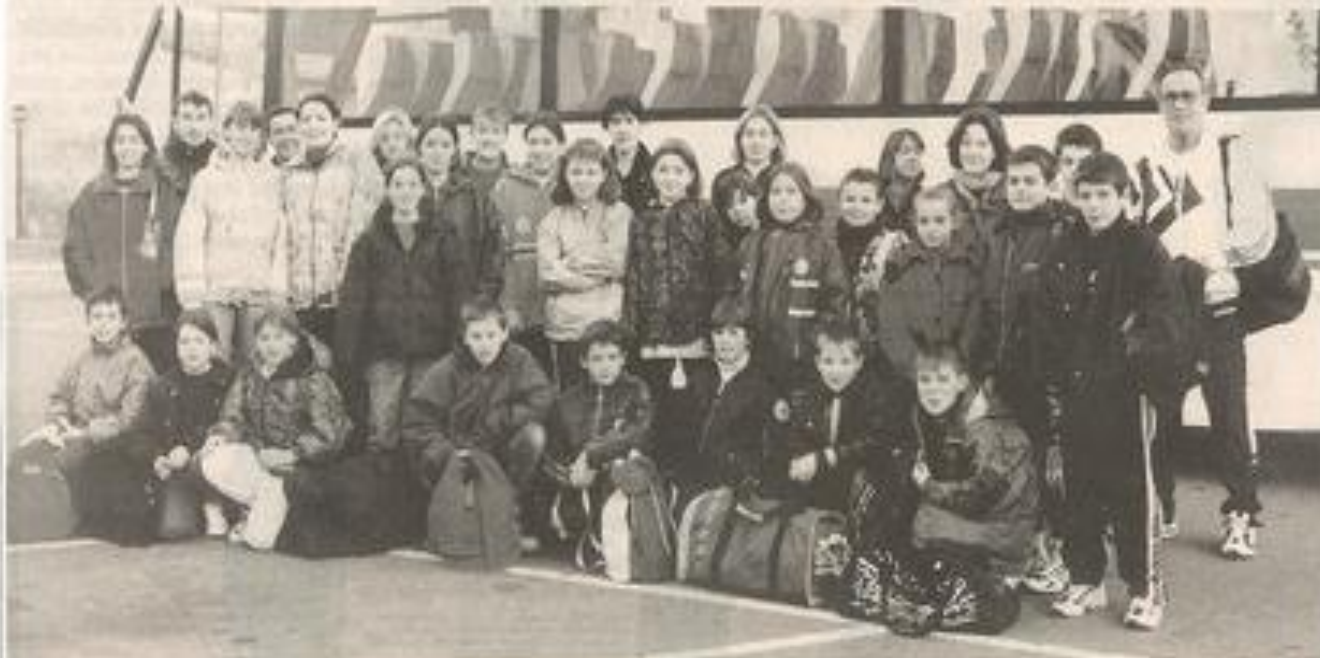
Les jeunes nageurs avant leur départ. Destination podium.

Les compétitions de natation viennent de reprendre et le club Corbières Minervois a commencé à engranger les victoires. Les nageurs se sont rendus dernièrement à Limoux et dimanche à Carcassonne à l'occasion d'une rencontre interclubs.