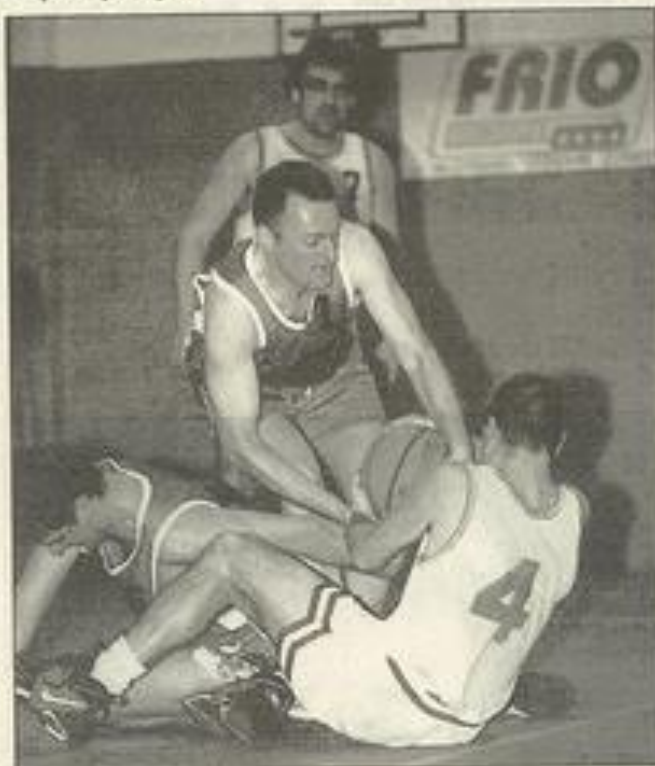
Le BCL doit revenir à une défense plus hermétique et plus collective où chacun sait ce qu'il doit faire.