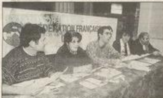
Le bureau donne les dernières explications.

C'est au cœur des Alpes autrichiennes, à Wagrain plus exactement, que les membres de la MJC de Lézignan-Corbières se retrouveront pour y passer un séjour d'une semaine. 320 km de pistes et 120 remontées mécaniques. Tout un programme.