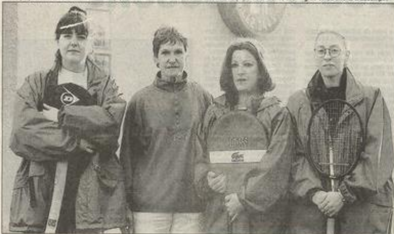
Une belle équipe .

Un week-end difficile en perspective qui permettra à ces deux équipes de mesurer leurs progrès et les efforts à accomplir.