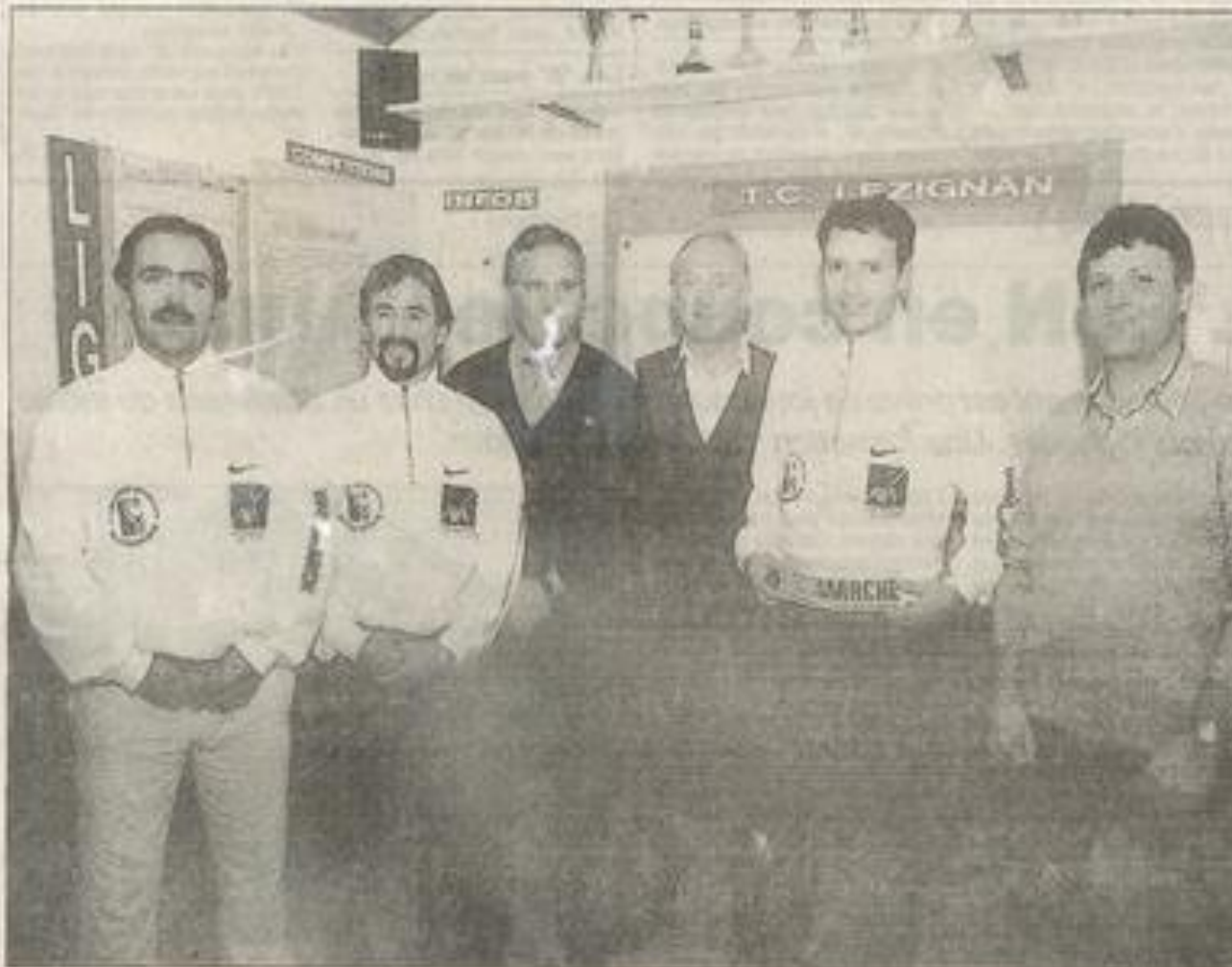
De nouveaux équipements pour les joueurs du Tennis-club.

au club de s'oxygéner autrement que sur les courts pour améliorer davantage leurs performances.