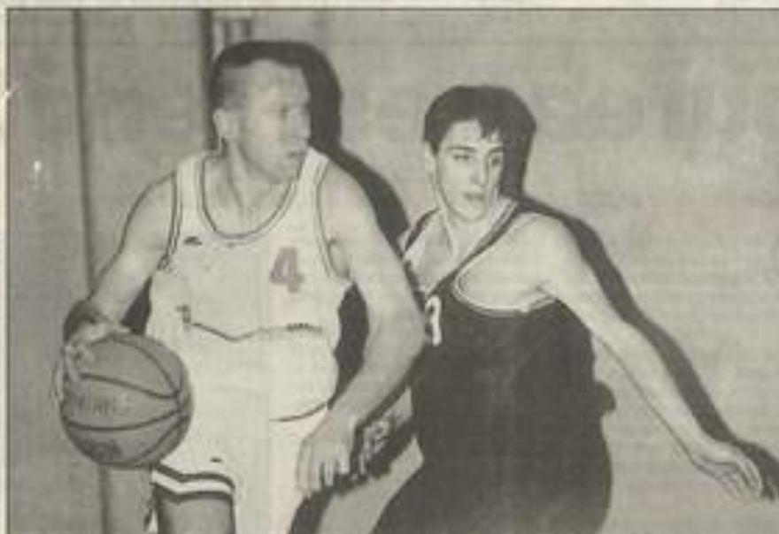
Les jeunes ont donné toute satisfaction.