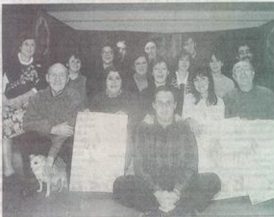
La compagnie du Tilleul repart de plus belle cette saison. Elle redonne le spectacle l'Arlésienne.

Le 1 er et le 2 février, ces bénévoles des coulisses sont invités