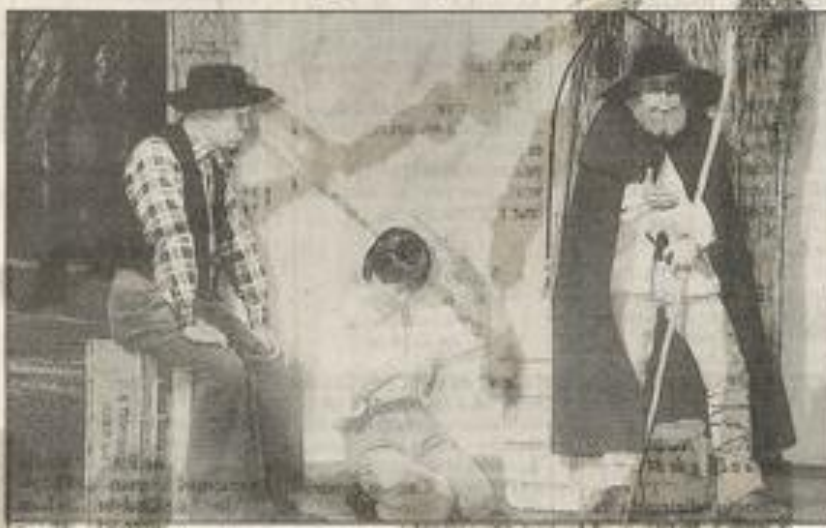
"L'Arlésienne", mise en scène par Roger Fabry.

Plusieurs pièces de théâtre sont en préparation pour une présentation au cours de l'année 1997.