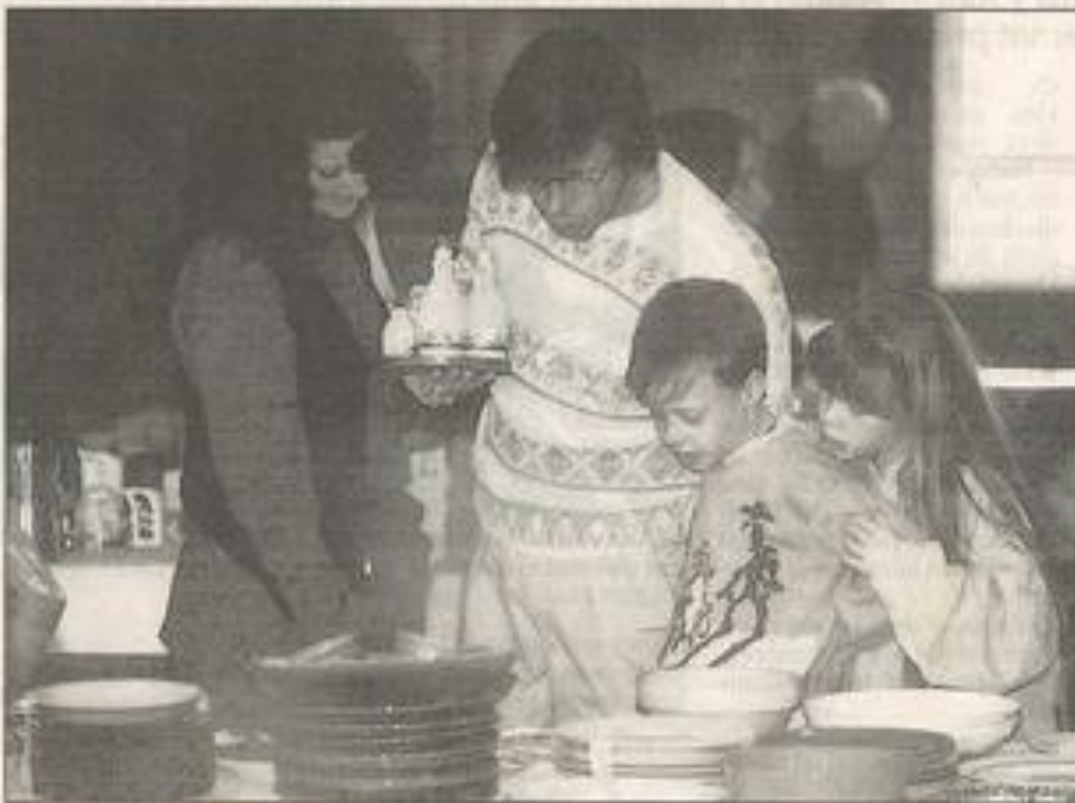
On est venu en famille pour dénicher l'objet rare. Et bien souvent on l'a trouvée, bien dissimulée...

Cette quatorzième édition de la Foire à l'inutile n'a d'ailleurs pas failli à sa tradition puisqu'il y en avait pour toutes les bourses et tous les goûts, du matériel électro-ménager quasiment neuf aux "vieilles" en tout genre. Et dans la multitude d'objets qui recouvraient les tables installées dans la salle du Palais des fêtes, il est impensable que quelqu'un n'y ait pas trouvé son bonheur.