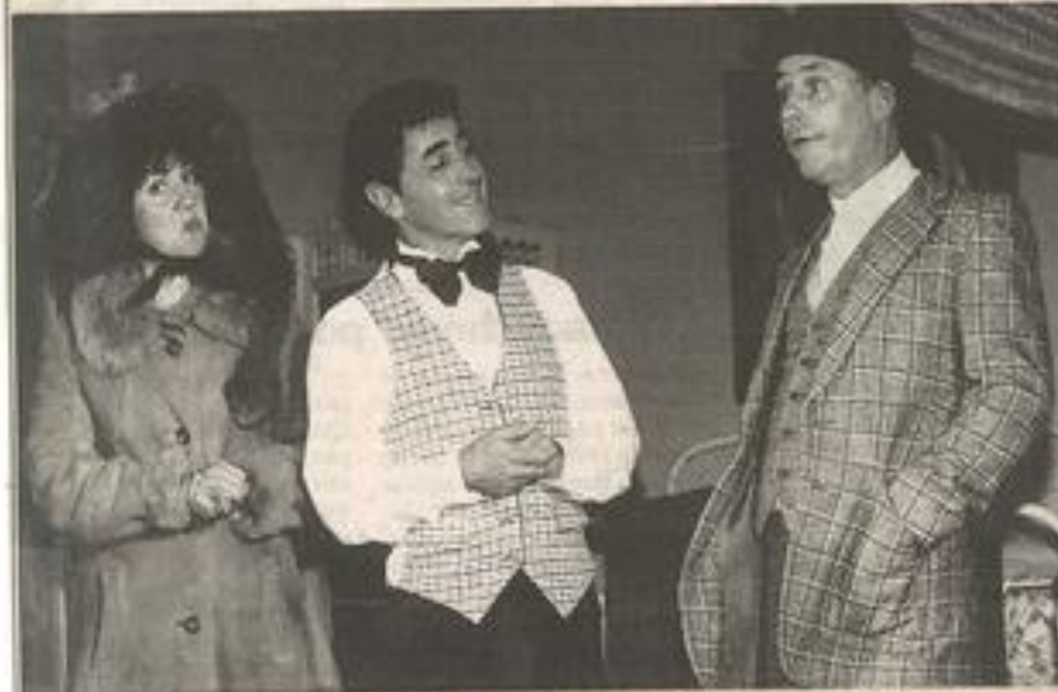
Une pièce qui a fait basculer le public dans l'hilarité.

Malgré la difficulté, énergie, imagination, volontarisme ont servi la mécanique implacable du texte et fait basculer la salle dans une cascade de rires ininterrompus pendant plus d'une heure.