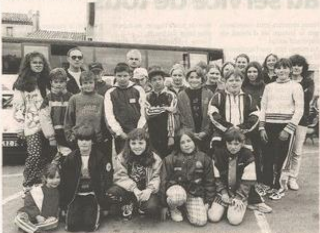
Les voyageurs et nageurs des Corbières et du Minervois ont particulièrement apprécié leur séjour en Tunisie.

Déjà très en forme avant leur départ, ce voyage les a certainement encore plus motivé et c'est une véritable moisson de médailles qu'ils vont ramener au club lors des prochaines compétitions.