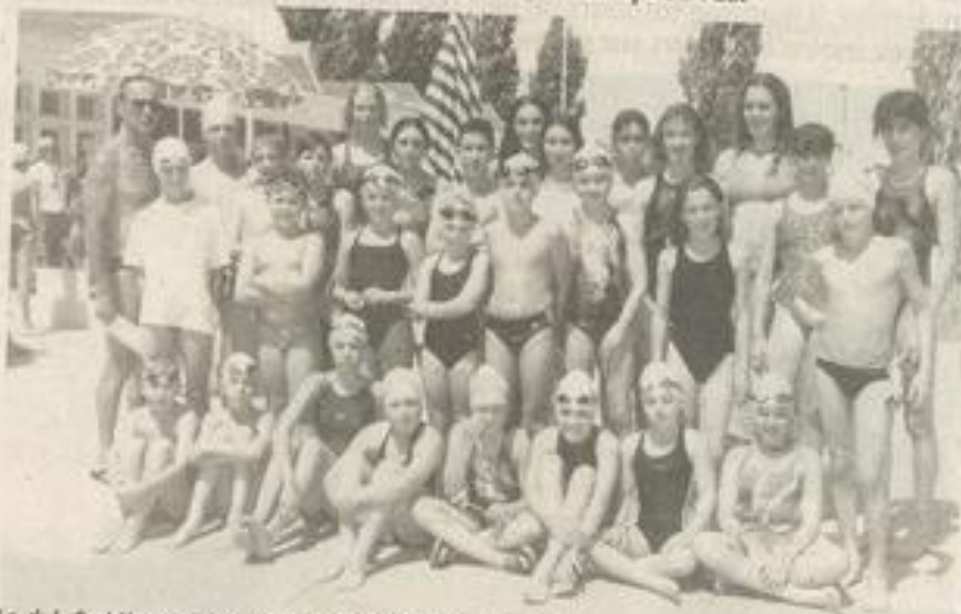
Le club Corbières-Minervois remporte vingt-trois médailles.