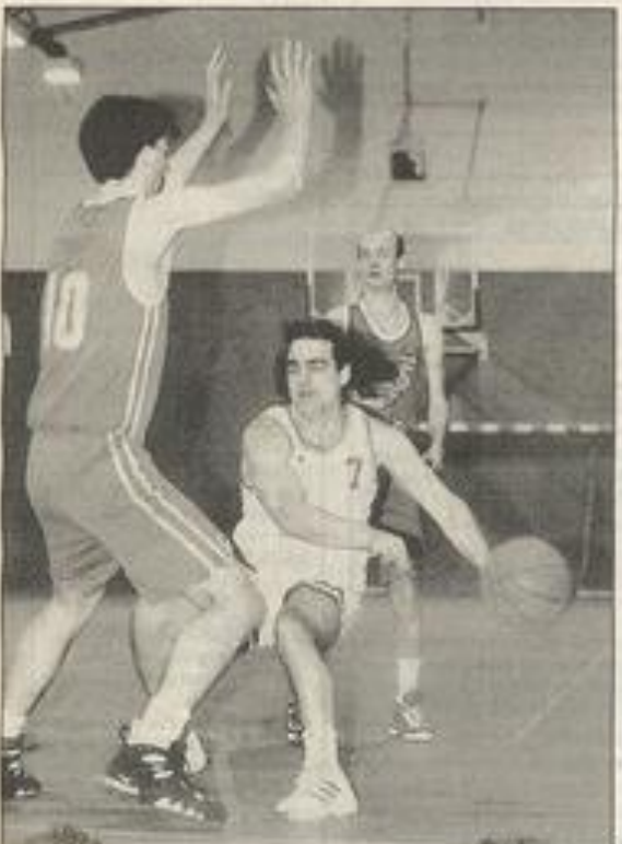
Un petit point d'écart qui fait toute la différence pour un BCL victorieux.

La fin du championnat risque d'être très dure.