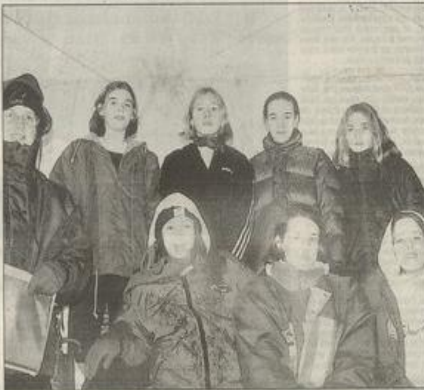
Les huit valeureuses participantes aux championnats de France-UNSS qui se sont déroulées sous une pluie battante.