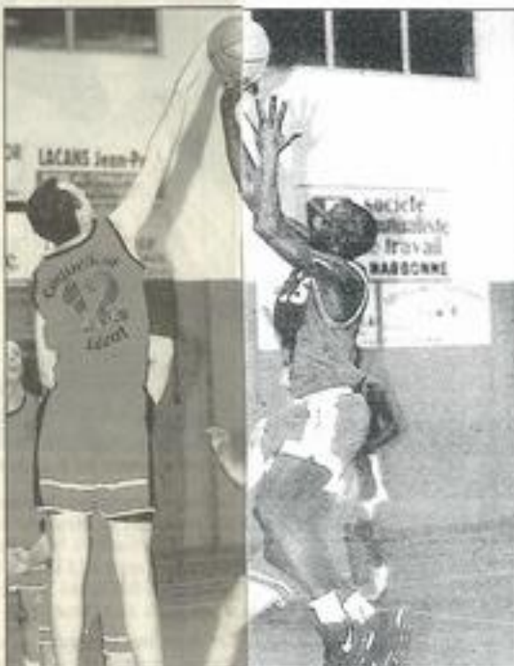
Le BCL a retrouvé le chemin du panier.

Grâce à cette victoire, Lézignan revient donc à la hauteur des premiers, et comme il doit rencontrer ses principaux adversaires, tout est encore jouable.