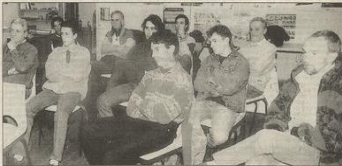
Athlètes et triathlètes en attendant la saison...