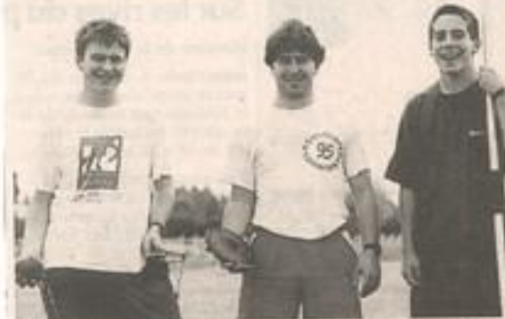
Les jeunes athlètes de la JSL ont réalisé une véritable moisson de médailles.

Ces brillants résultats prouvent s'il en était que la JSL est un club formateur, un des meilleurs de la région. La saison continue avec mercredi les "Académies", samedi le meeting de Limoux, et surtout dimanche les championnats du Languedoc benjamins et minimes à Nîmes.