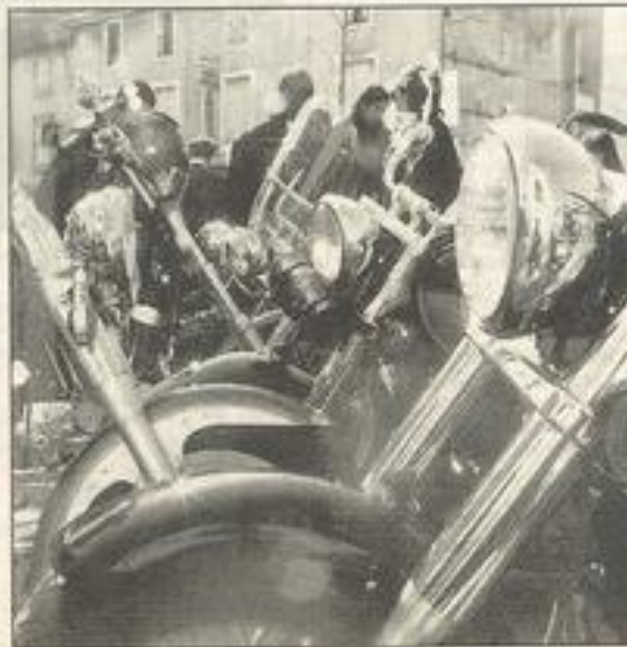
Les chromes ont été astiqués, le spectacle est sur la route. C'est aujourd'hui à Gaujac.

Créant ainsi l'événement dans les localités traversées.