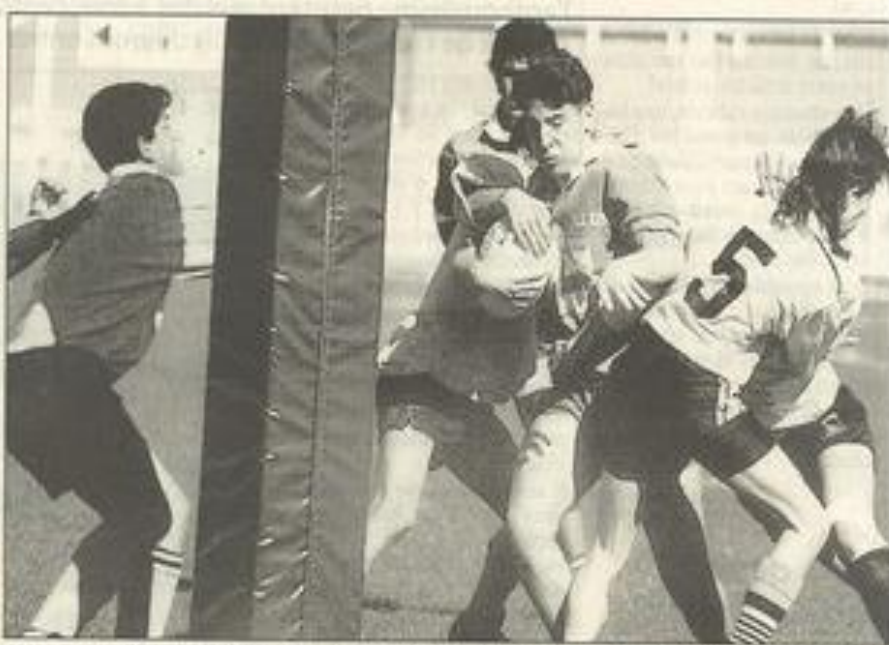
Les minimes "vert et blanc" ont témoigné de beaucoup de volonté et ont fait fort face aux carcassonnais.

Le début de la 2 e période leur sera profitable. En supériorité