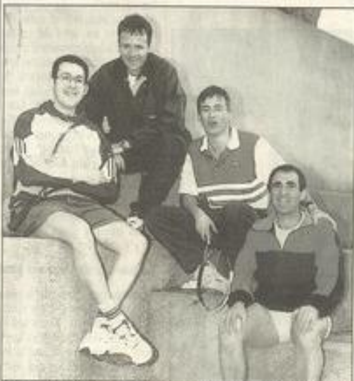
Les employés municipaux se sont inclinés. (Photo LAGUENS Photos-dés).

Pour ce dernier week-end de compétition avant une trêve d'un mois entier, le TCL alignait deux équipes.