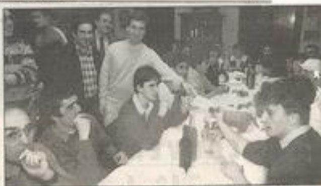
Les jeunes ont remercié les "Partenaires" d'un bon appétit.

En attendant, tous ces jeunes remercient vivement leurs généreux donateurs.