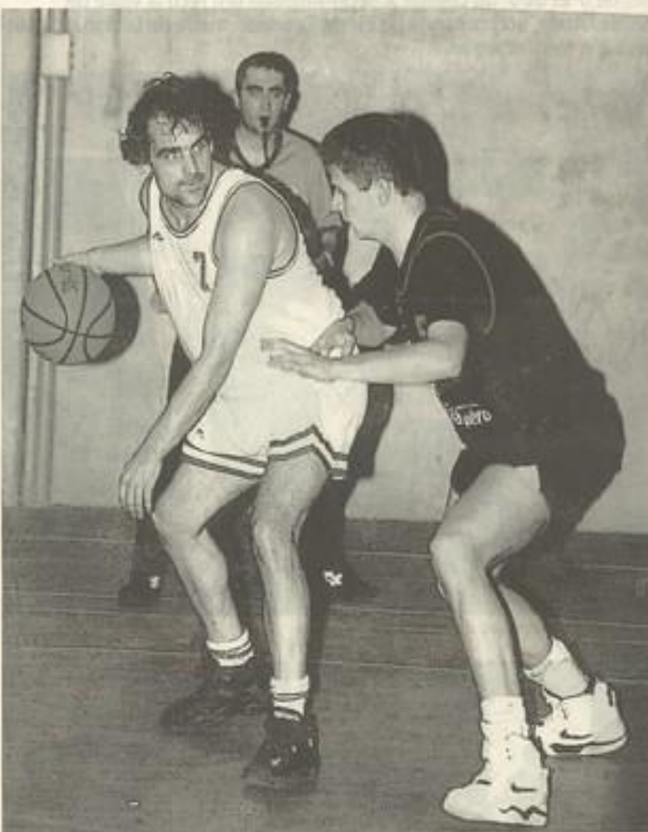
Avec sa victoire contre Pau, le BCL conserve des chances de monter en Nationale III. (Photo LA-GUENS Photovideo).

Un point- Mais Lézignan veut son match. Deux paniers à trois points de Ramos créent