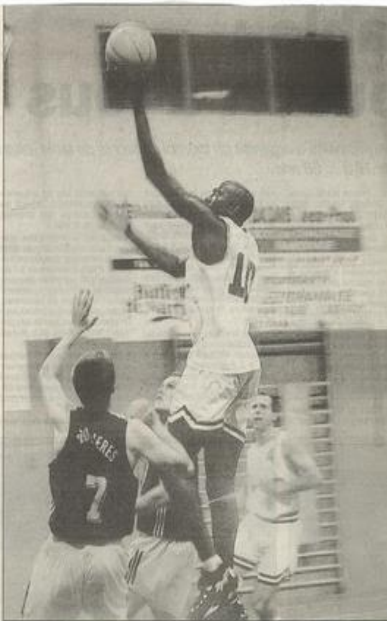
Le BCL s'incline et perd sa première place au classement.

Derrière, Colzyrac talonne avec une victoire en moins et Pamiers avec deux victoires en moins.