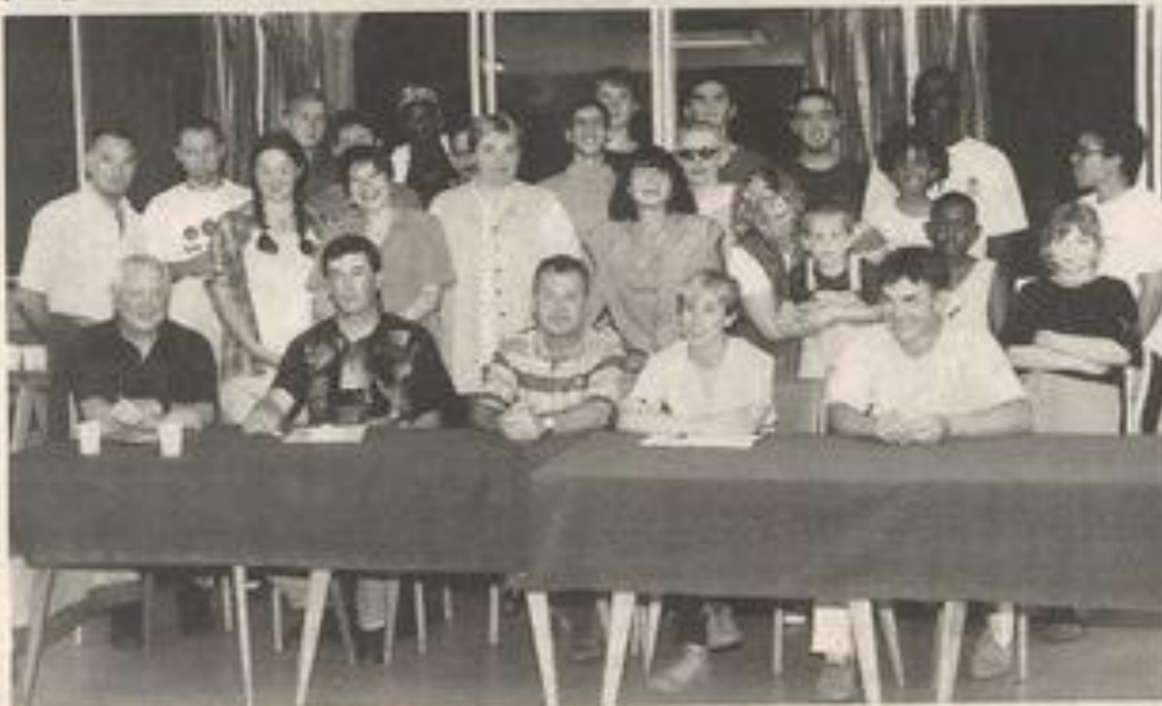
Une saison malgré tout positive, pour le Basket-Club de Lézignan même si tous les espoirs n'ont pas été concrétisés.

Le BCL, c'est aussi une école de basket animée par Corinne Ba-