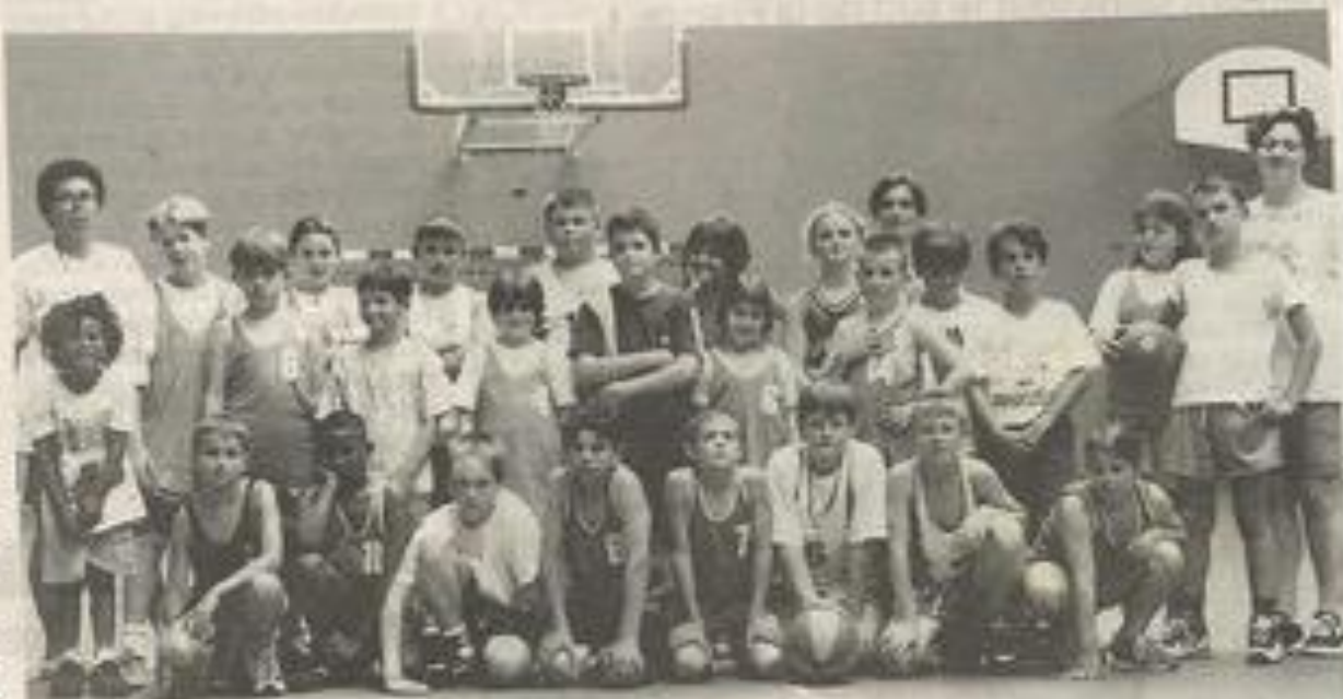
Les jeunes basketteurs se sont affrontés dans la joie et la bonne humeur.

Les équipes ont su démontrer, sur le terrain, que l'on pouvait jouer ensemble et dépasser les frontières culturelles et linguistiques.