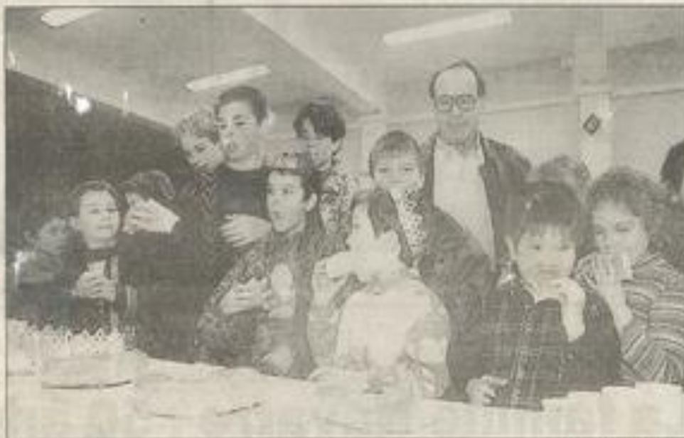
Le goûter des Rois pour les nageurs.