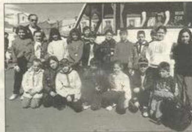
Les nageurs du club Corbières-Minervois à leur départ pour la capitale de la Blanquette.

25 avril, 42 natades du club Corbières-Minervois et de Trèbes participeront à un stage en Tunisie à l'auberge de jeunesse de Rades, ancienne localité jumelée avec Lézignan.