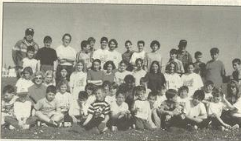
Tous présents à l'entraînement.

Un assistant rapide. Ainsi donc, ils étaient nombreux, ces derniers mercredis après-midi, à courir, lancer et sau-