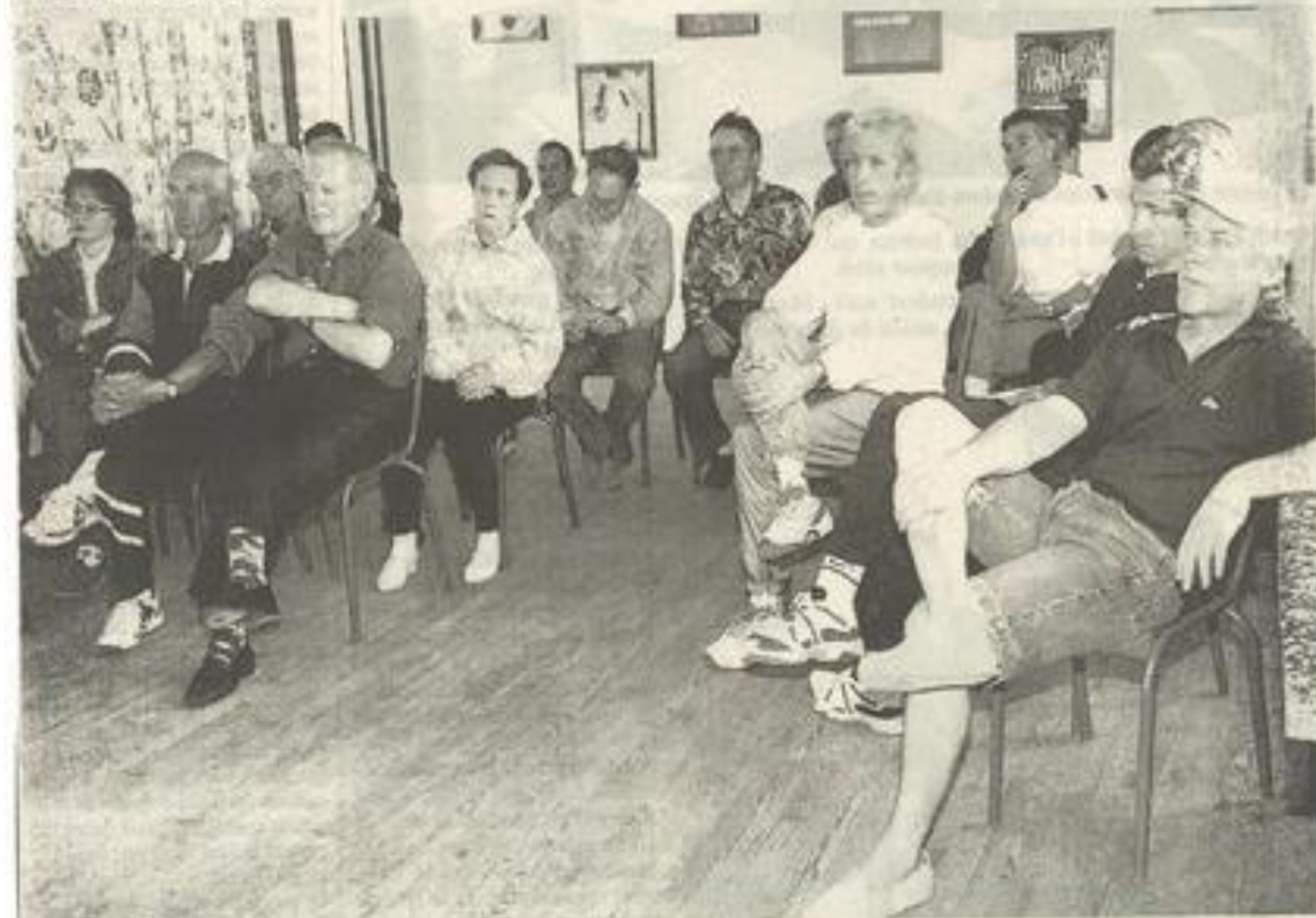
Les cyclotouristes sont venus nombreux pour débattre des projets de leur club.