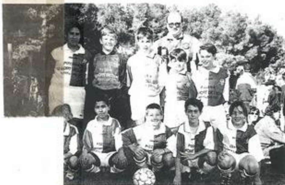
ate sont premiers devant Léznigan II.