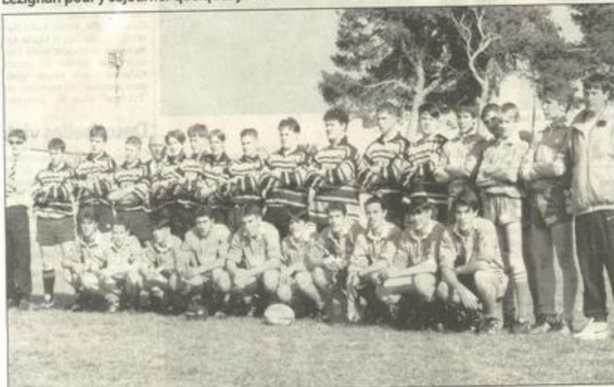
Les jeunes Gallois ont été les plus forts.

Après 24 heures de voyage, les équipes galloises de Newport ont été accueillies à la MJC de Lézignan pour y séjourner quelques jours.