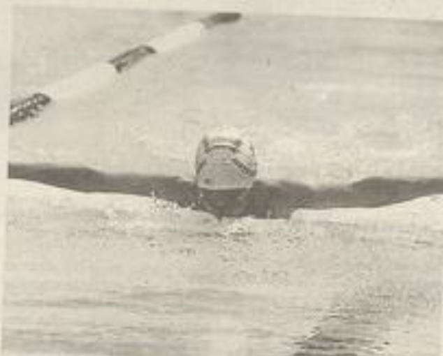
L'élégance d'une belle brasse papillon.

25 m papillons dames et messieurs 89, 88 : 1er Jérôme Vauchel, 3e Florian Limouzy, 3e