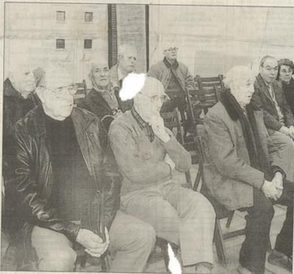
Les anciens combattants de Lézignan se sont réunis et veulent créer une union fédérale. Chacun a pu s'exprimer sur...