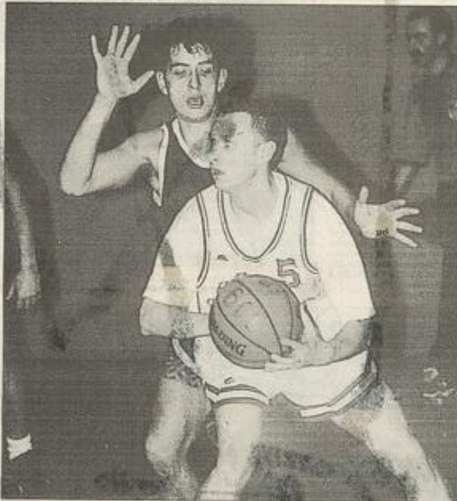
Slawick et ses coéquipiers vont avoir fort à faire samedi.

Léznigan a quand même l'avantage de jouer à domicile, d'avoir une grande expérience, de posséder un cinq majeur physique et