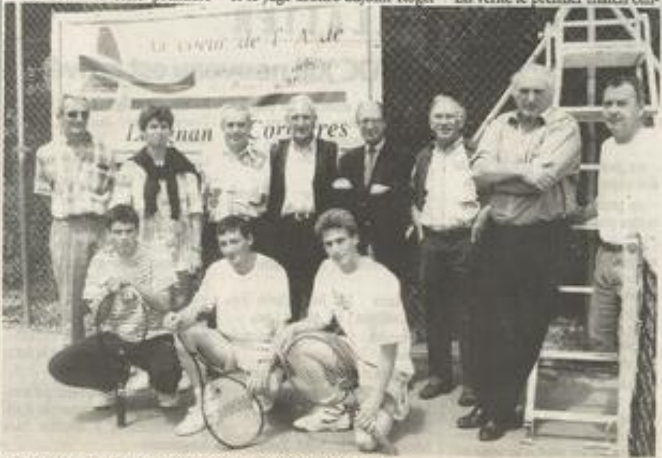
Le lancement officiel s'est fait avant l'arrivée de la pluie.