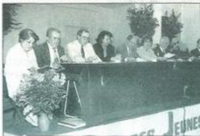
Un animateur serait le bienvenue pour l'association.

Le conseil d'administration se réunira dans le courant de la semaine prochaine pour élire le bureau de la MJC.