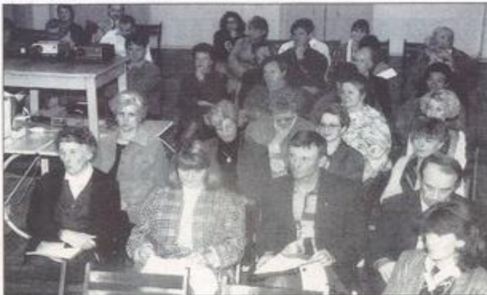
Les bénévoles, l'âme forte de la MJC.

animateur ce qui empêche la concrétisation d'un souhait : l'accueil des jeunes.