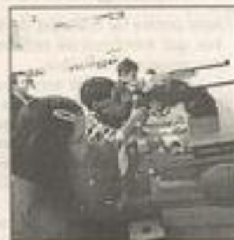
Les Lézignanais se sont bien comportés en compétition.

Par équipe, en benjamin : Marty, Obiols et Gispert terminent à la première place. Des prix ont récompensé les trois premiers de chaque catégorie.