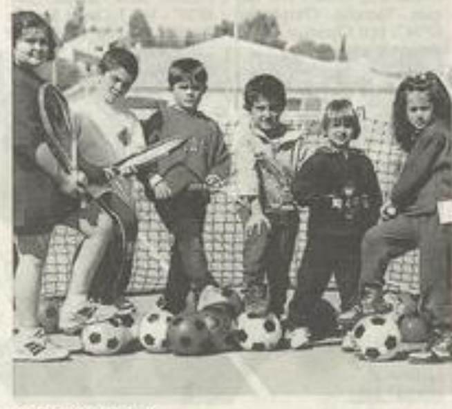
Les petits champions.

Pour tout renseignement, contacter le Tennis-Club au 04.68.27.30.39.