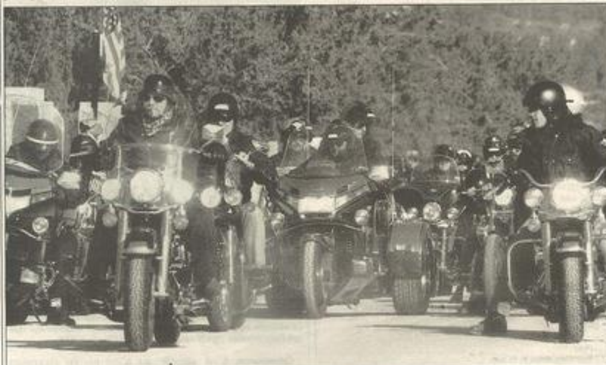
Une impressionnante colonne de motards s'est lancée à l'assaut des Corbières.

Samedi après-midi, de nombreux motards ont répondu à l'invitation du Moto-Club 11 et ont pris pour trois jours leurs quartiers sur le site de Gaujac.