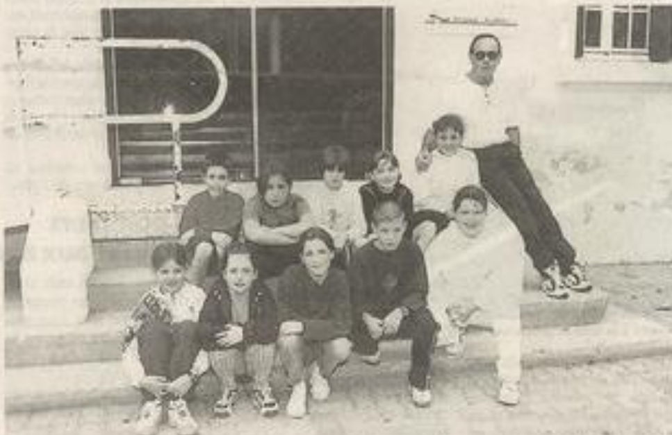
Les jeunes "avenir" et poussins qui ont concouru, lors de la compétition comptant pour le championnat de l'Aude.