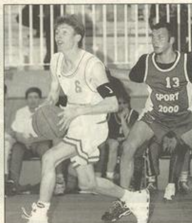
Il faudra gagner les deux prochaines rencontres!