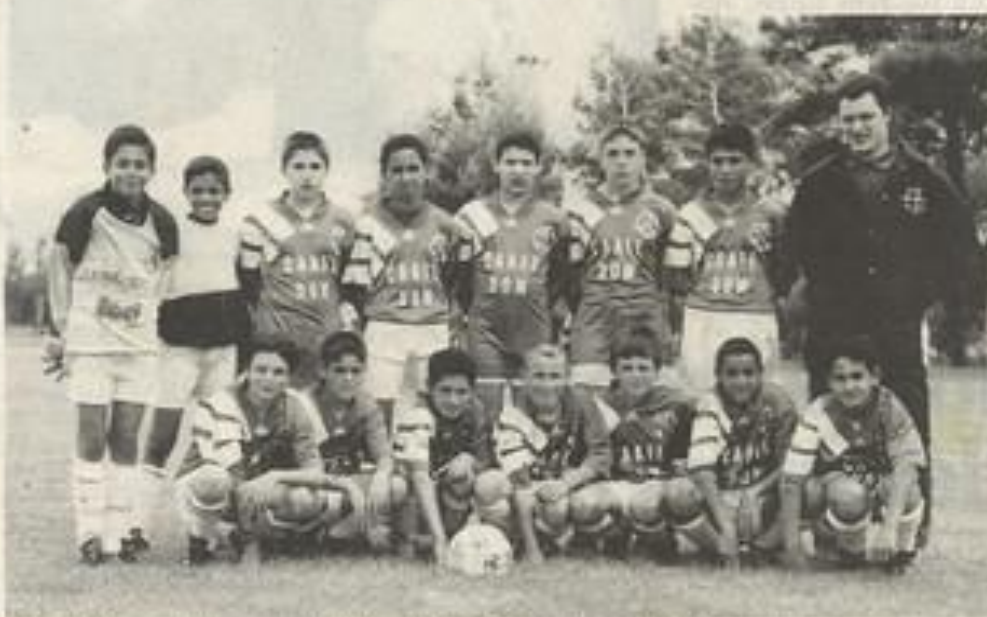
Une cinquième édition qui a réuni plus de 400 jeunes.

compenses le président a tenu à remercier et à féliciter les équipes participantes qui ont démontré leur attachement à cette grande manifestation d'amitié et sportive.