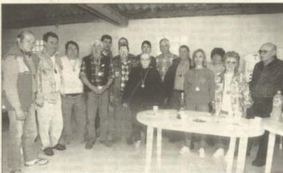
La poudre a parlé une fois de plus sur le stand de la Ginestasse.

Manton origine: 1er Francis Aguila 16, 2e Irénée Lassalle