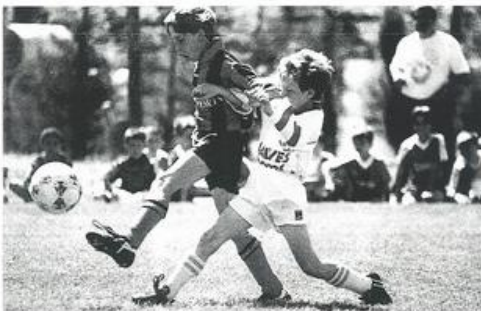
Un nouveau rendez-vous a été pris par les jeunes footballeurs pour la mi-juin avec les moins de 13 et les moins de 15 ans.

football est une grande famille à Léznigan, on a même vu tous les seniors - il viennent d'accéder, on