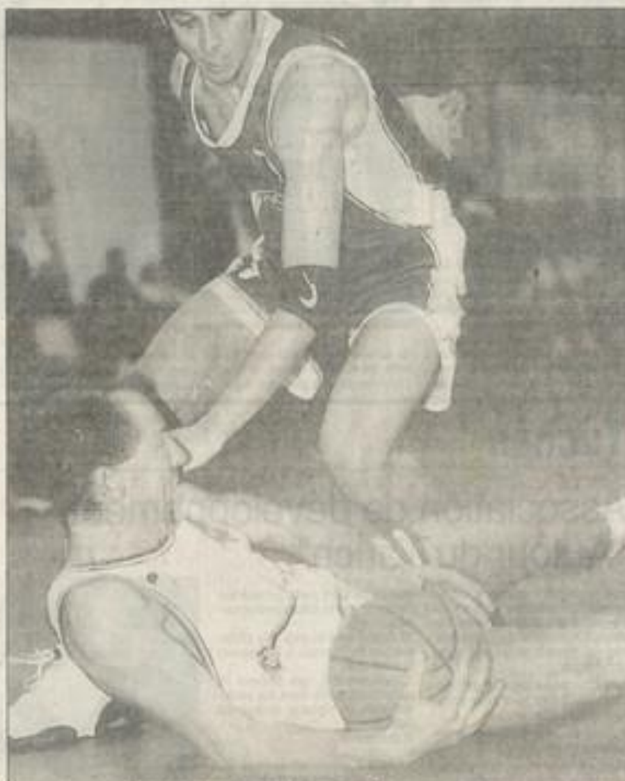
Mauvais pas pour le BCL qui est tombé face à Pamiers.

Le classement est le suivant : 1er Marmade 26 points ; 2e Mel-