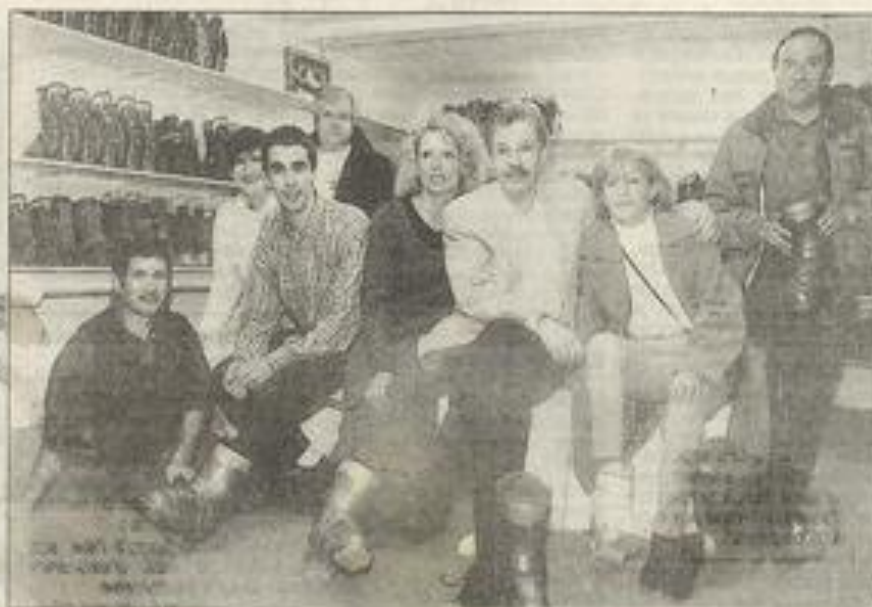
Un espace est réservé à l'essayage des chaussures.

Les bénévoles du Ski-Club n'ont pas fait les choses à moitié. Alors longue vie au club et rendez-vous dans cinquante ans.