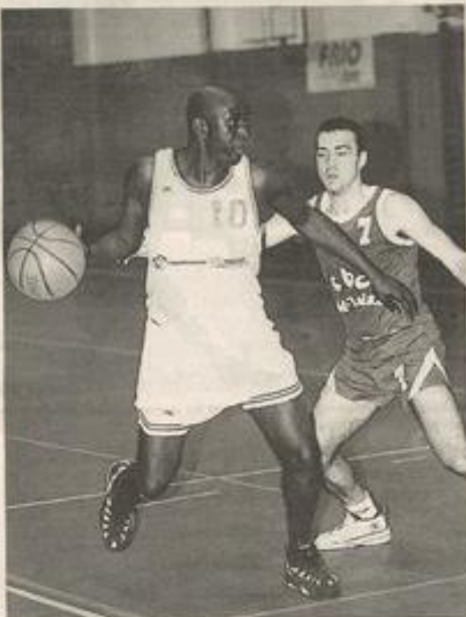
Dernière chance pour le BCL ce soir face à Marmande.

C'est à ce prix que le BCL privera de ballons les Bézo, Lapeyre et Loriaux. Ce soir, l'ambiance sera certainement très chaude à Marmande, compte-tenu de l'enjeu. Mais les Lézignanais disposent d'un