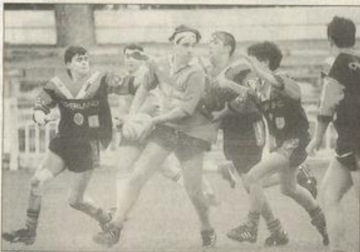
Prax dans la défense limouxine.