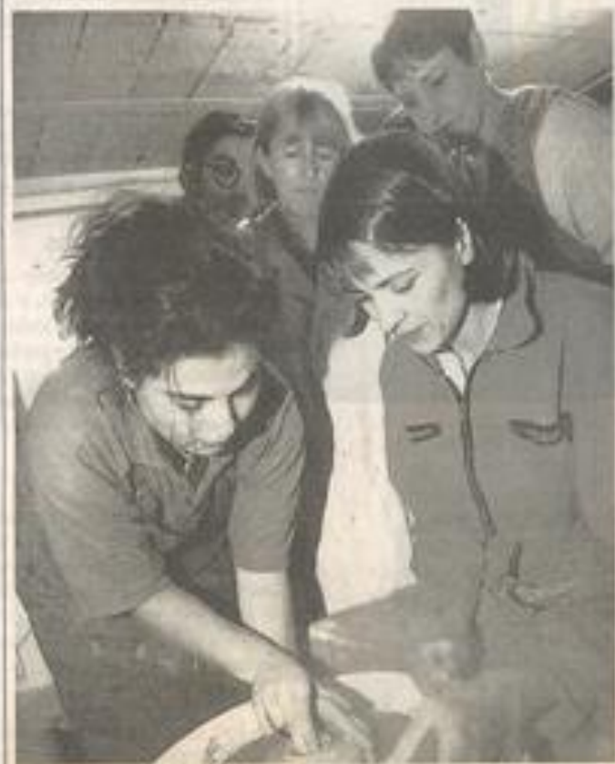
Un stage pour s'initier à la poterie.

Toutes les personnes qui sont intéressées par des stages de week-end peuvent se faire connaître à la Maison des jeunes, rue Marat (téléphone : 04.68.27.03.34.)