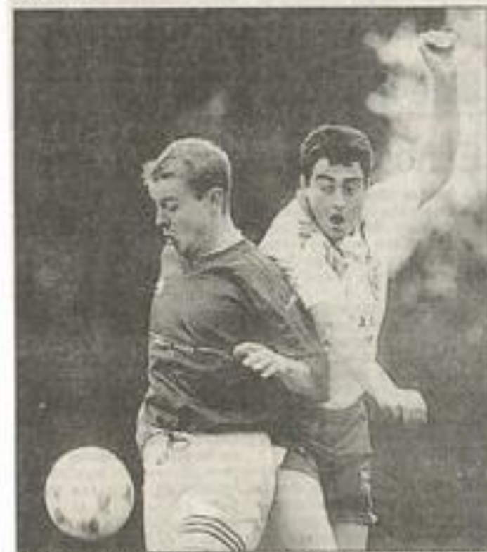
Le 2 mars, pour le compte des 1/8e de finale de la Coupe Favre, Lézignan se déplacera chez un des leaders de Promotion première, Souliho.

Un match qui s'annonce très difficile surtout au vue de l'infirmerie verto copieusement garnie, donc pas mal de soudo pour composer l'équipe et relever le défi que cette équipe languedocienne ne manquera pas d'opposer.