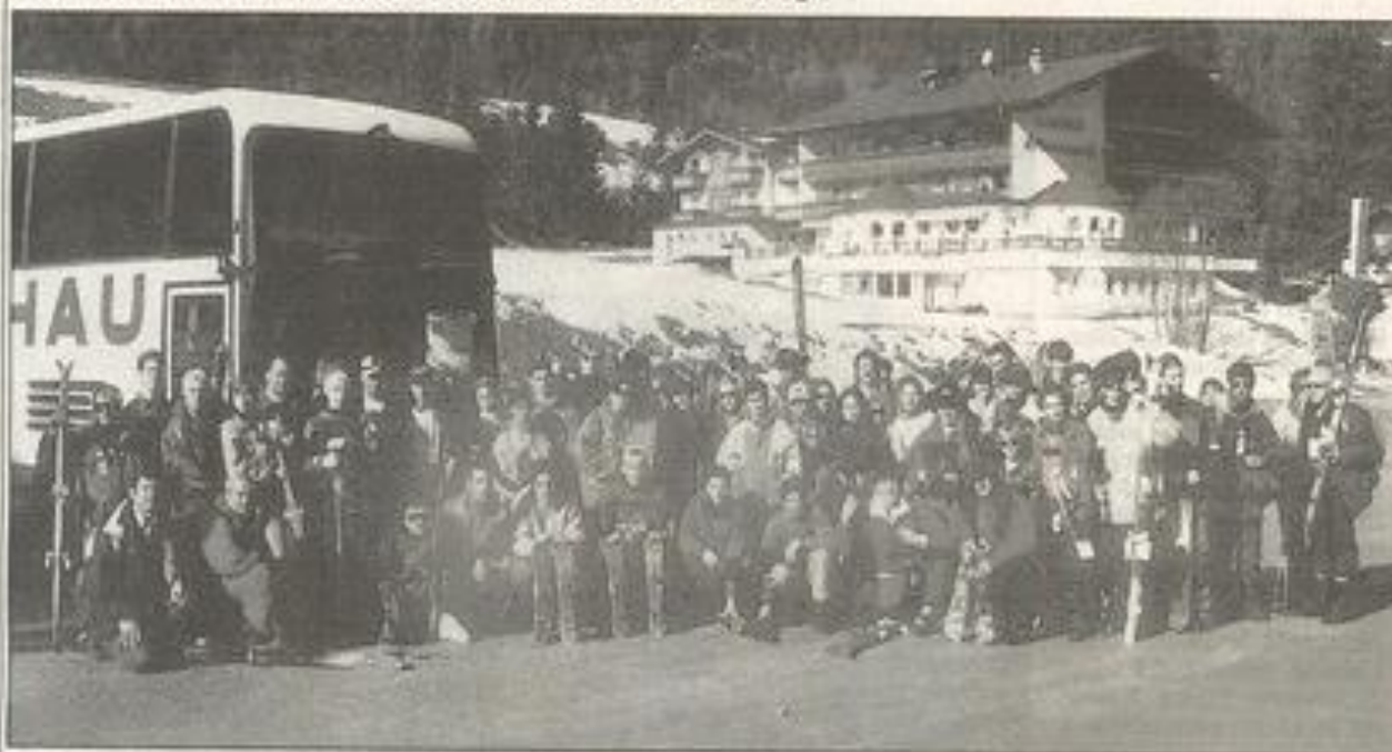
Le groupe de la MJC s'est promis de revenir dans les Alpes autrichiennes où les superbes paysages ont enchanté les jeunes skieurs lézignanais.

Quatre-vingts Lézignanais de la MJC et du Ski-club reviennent de Wagrain, en Autriche. Un séjour enchanteur à quelques kilomètres de Salzbourg.