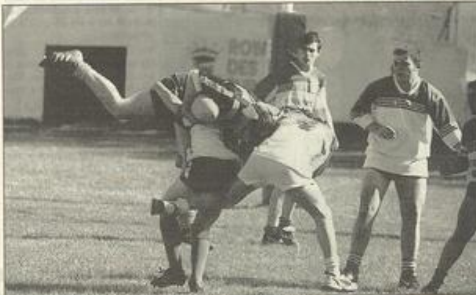
La défense lézignanaise à l'œuvre.

ment mené les débats, 16 à 4, 34 à 8, 44 à 14 pour terminer 60 à 22.