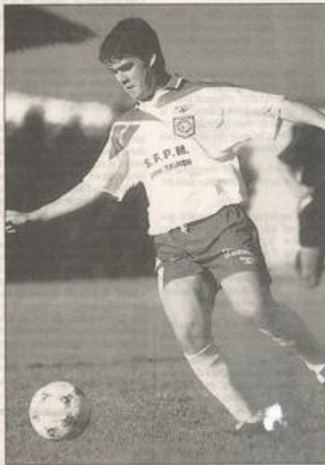
Sérieux et simplicité pour les footballeurs vert et blanc.

La réserve s'est inclinée quant à elle 1 à 0 en ouverture sur un but encaissé à 15 minutes du terme d'une rencontre où les réservistes handicapés par quelques absences ont fait mieux que se défendre. Il ne manque à cette équipe, très souvent battue par un but d'écart, que de renouer avec la victoire pour retrouver le moral et pourquoi pas dès dimanche à Gaujac face à Aigues-Vives, en lever de rideau de Lézignan-Pennautier. Cette rencontre s'annonce encore très délicate face à la lanterne rouge qui ne viendra certainement pas en terre lézignanais en victime résignée.