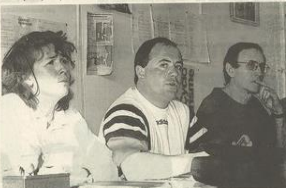
Le club des randonneurs cyclos au travail.

Le lycée la Providence a également émis le projet d'une sortie des élèves en cyclo, accompagnés par les randonneurs. La mise au point est en cours et ce projet devrait rapidement devenir une réalité.