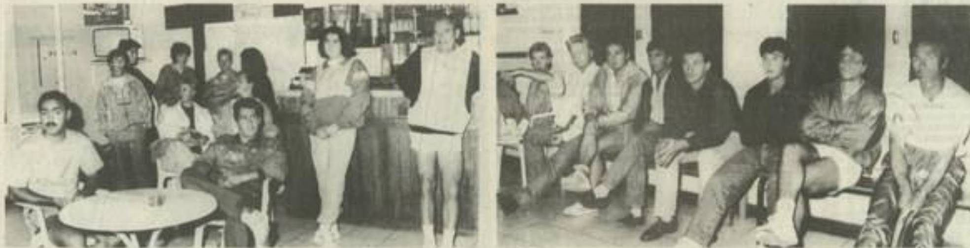
Les tennismen ont constitué leurs équipes.