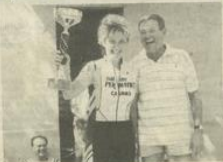
Une coupe pour les valeureuses féminines