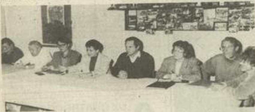
Les randonneurs autour de leur bureau