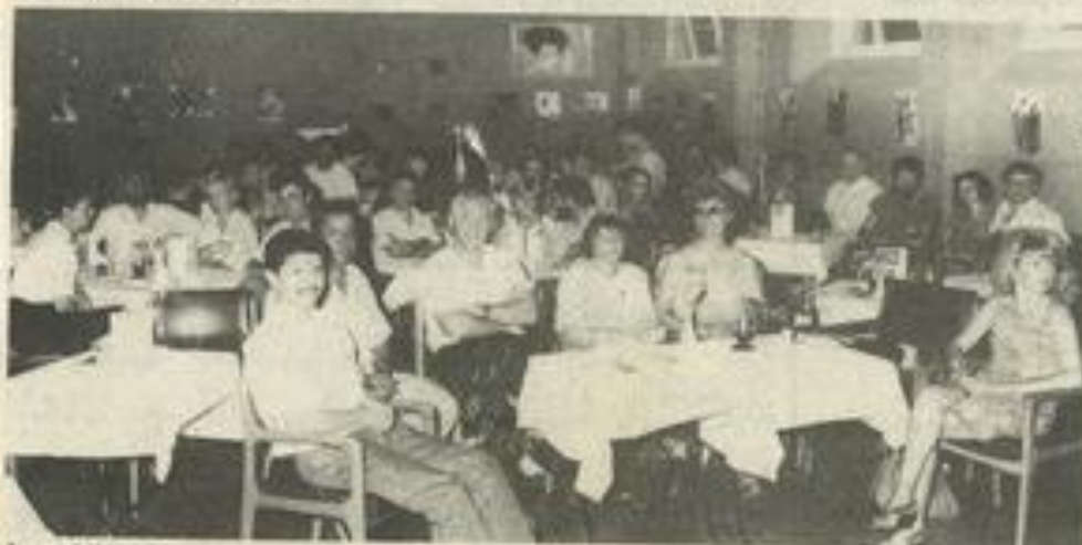
Le public du jazz

Une formation remarquable, un répertoire équilibré et diversifié, une pêche terrible ! Le Big-band Sol a offert un superbe concert l'autre soir à la MJC, un jazz flamboyant qui a enthousiasmé un public qui se cherche encore un peu mais devant lequel on a une base solide dans le domaine de la création d'un