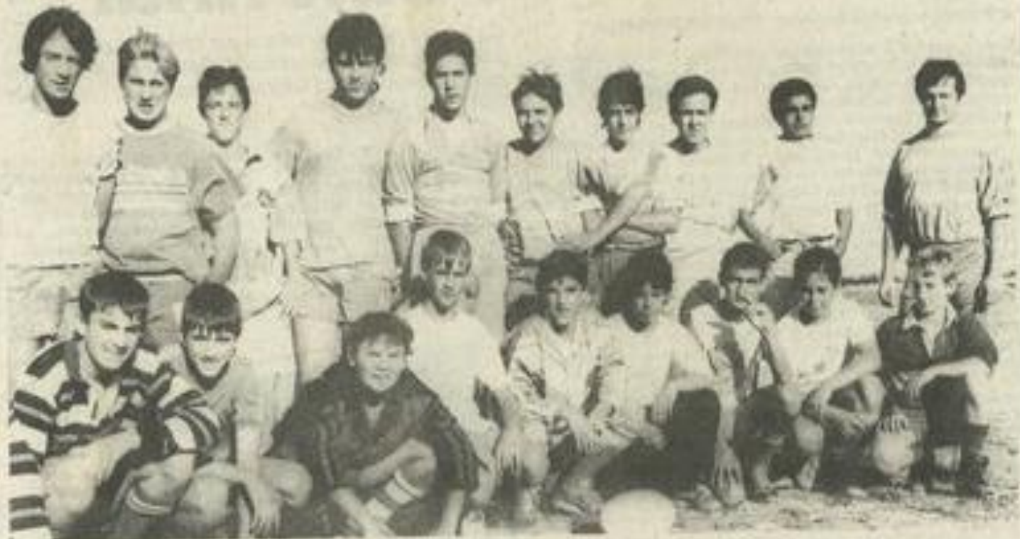
Les minimes ont repris le chemin du stade.