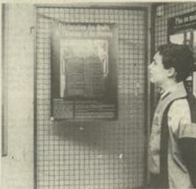
Un futur citoyen devant la déclaration des droits.

Diffusé par la Fédération régionale des maisons des jeunes, l'exposition sur les Droits de l'homme proposée depuis hier à la MJC de Léznigan, a été montée par Culture et loisirs et co-produite par la Fédération Léo-Lagrange.