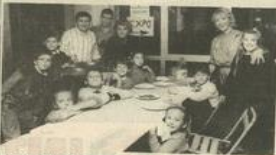
Une tradition de l'automne.

châtaignes se font moins rares que les champignons. A la poêle et autour d'un bon feu, il n'y a pas mieux pour conserver l'amitié et retrouver l'ambiance des veillées d'autrefois.