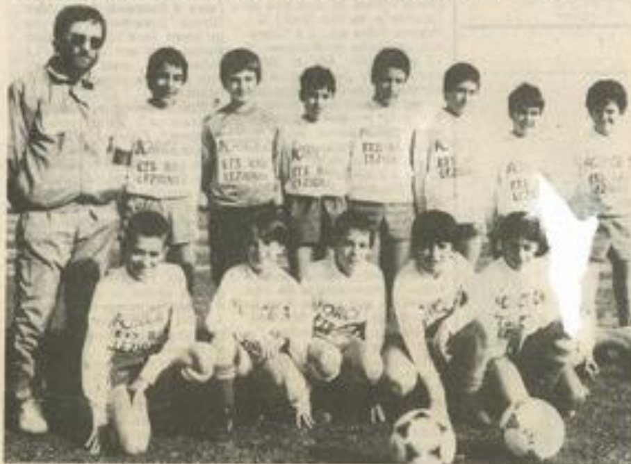
Les pupilles à XI stoppés dans leur élan