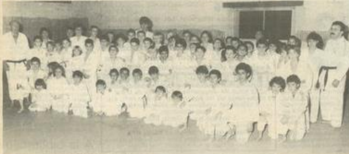
Les nouveaux promus encadrés par les moniteurs.