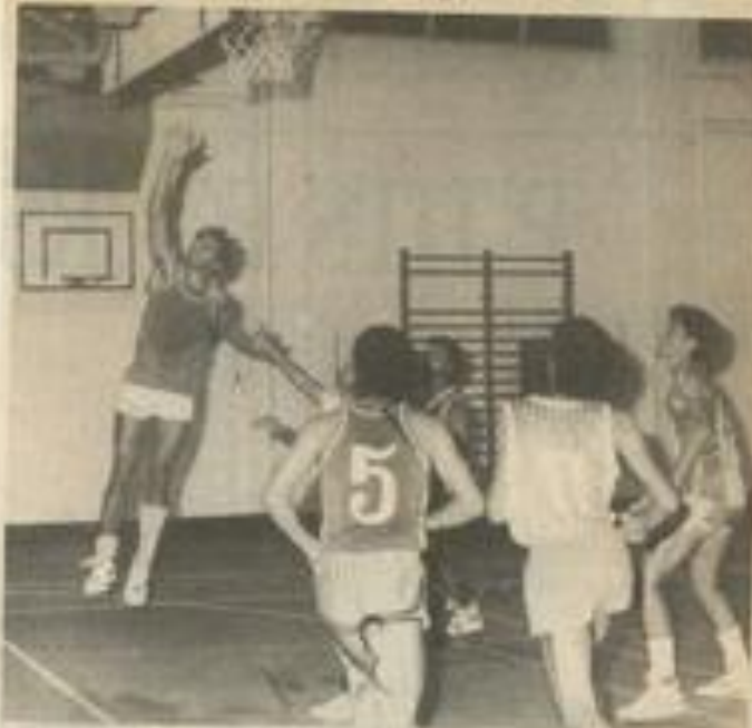
Les Lézignanais iront à Coursan.