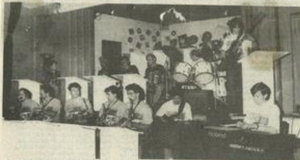
La formation narbonnaise