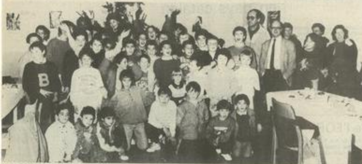
Ils ont laissé le ballon au vestiaire

C'est reparti ! le temps des goûters, des petites réjouissances de Noël est revenu. Samedi, les jeu-