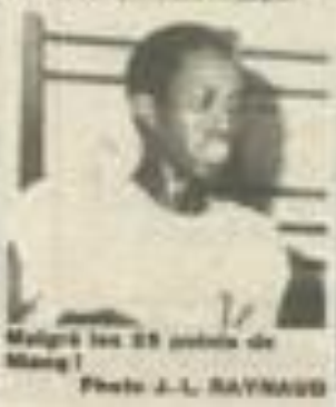
Malgré les 25 points de Nangi !