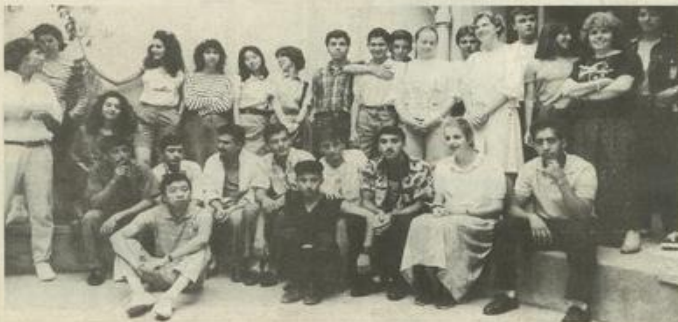
Un programme chargé pour les jeunes étrangers

Mais pour ces jeunes étrangers la journée phare de ce voyage en pays d'Aude restera la journée du 14 juillet, date-symbole des festivités du bicentenaire. A cette occasion, ils visiteront la cité de Carcassonne avant de plonger dans les animations, défilés, repas révolutionnaires et reconstitutions en tout genre. Géorgiens qu'ils n'oublieront pas de s'être cette page d'histoire nationale, de quoi ramener au pays des images inédites en compagnie d'un « J'y étais » plein de fierté. Avant ce beau jour de réjouissances, le groupe ne restera pas inactif. Après la réception officielle, hier en matinée, les jeunes visiteurs se sont dirigés du vin, à l'abbaye de Lagrasse, à Villeneuve-Termenès, à la Roque de Fa pour assister au dernier spectacle de la troupe « Avant-Quart ». Dimanche, ils découvriront le littoral, puis les châteaux cathares de Quiribus et Peyrepertuse le lendemain. L'abbaye de Fontfroide, Narbonne, Bages, le canal du Midi, Quillan et son spectacle médiéval en nocturne complèteront leur tour de l'Aude. Ouf ! Après cela, ils auront droit à des vacances pour se remettre du marathon touristique.