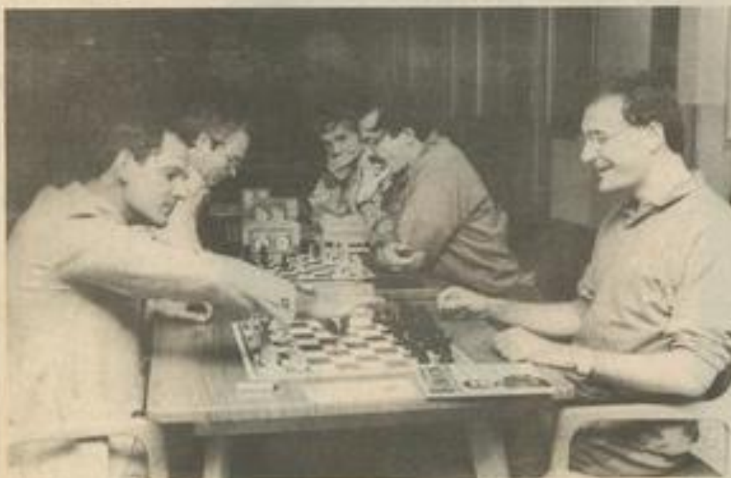
Les échecs ? Un succès...