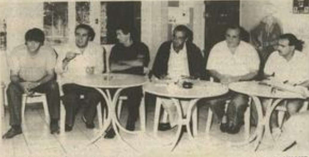
Les animateurs du Tennis lézignanais.