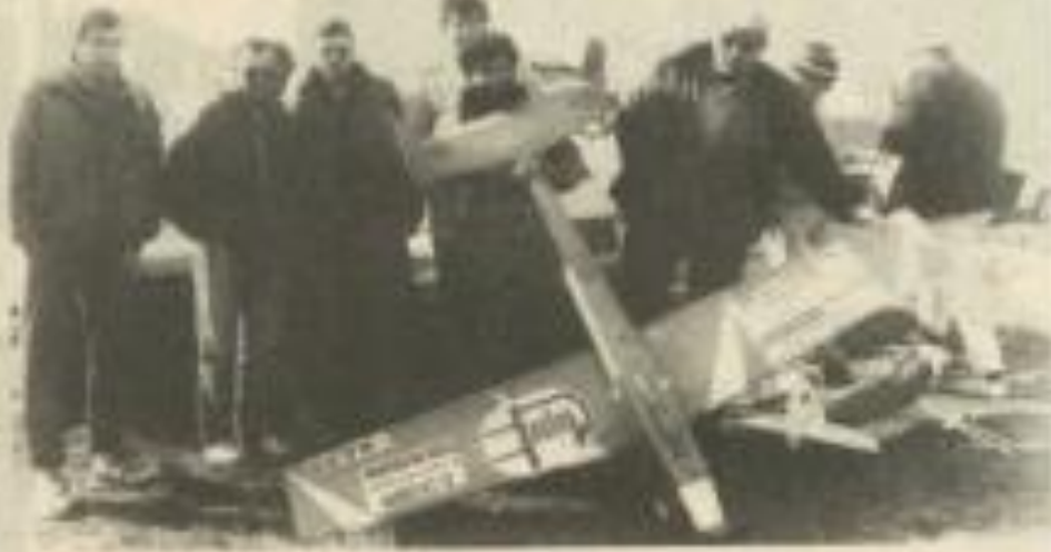
Quelques membres lézignais du club.