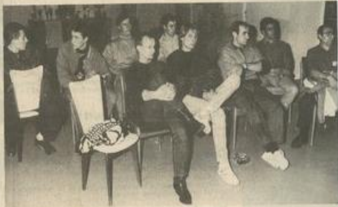
Quelques-uns des membres du Moto-club