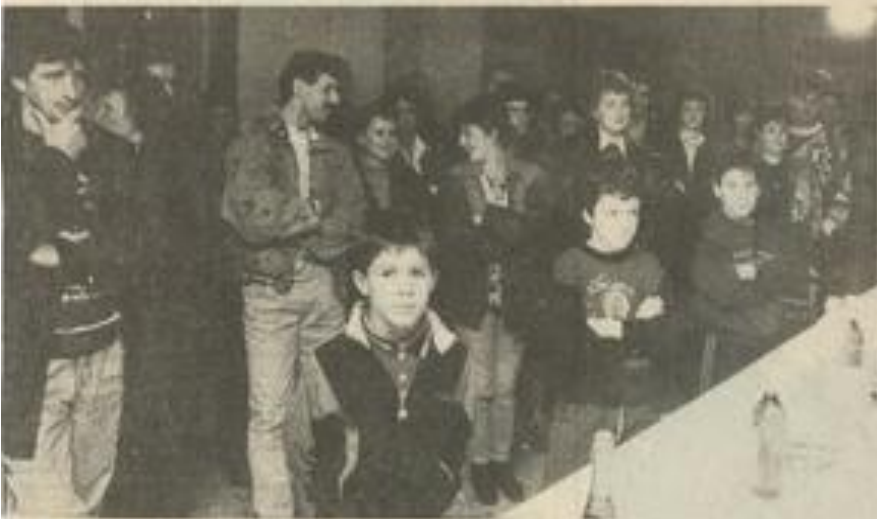
Apéritif au judo de l'Athlétic-club

Les membres de la section judo de l'Athlétic-Club se sont retrouvés en cette veille de Noël autour d'un apéritif dans les salons de la maison des jeunes. Les responsables du judo étaient entourés du président Amila et des