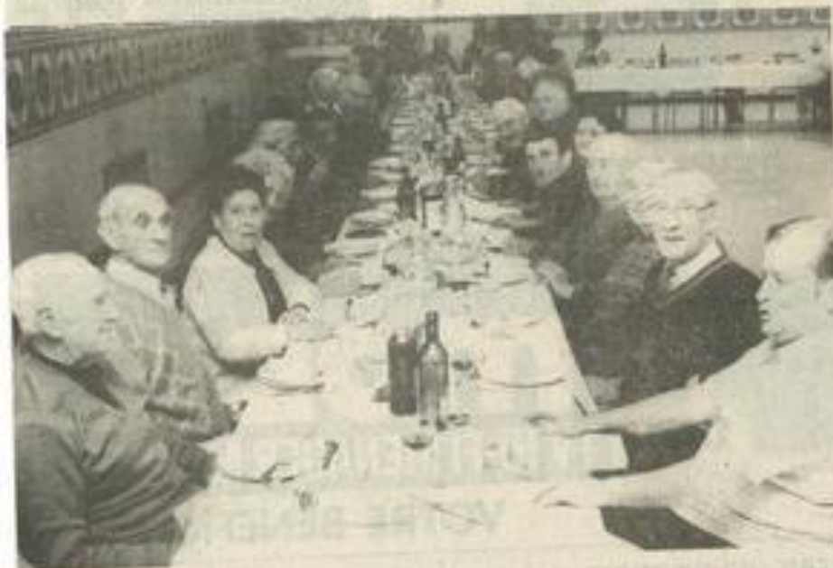
Le 3 e âge à table.

Le repas annuel organisé par le club du 3 e âge de Lézignan s'est déroulé mardi dans la salle Pelloutier.