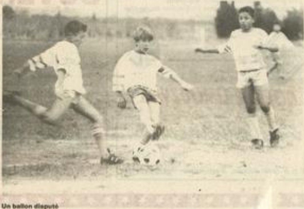
Un ballon disputé