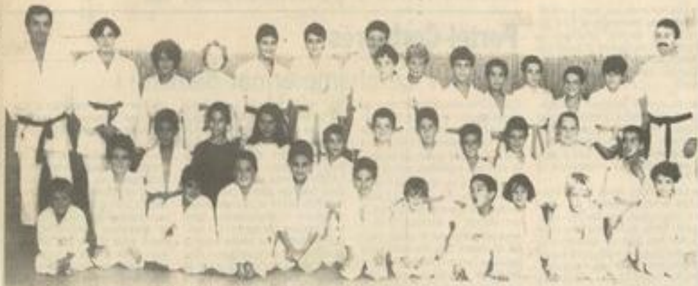
La reprise des judokas de l'Athletic

A noter également pour les adultes que Jojo Estébanes fera des cours de Ju Jitsu (self-défense) où le meilleur accueil vous sera réservé.