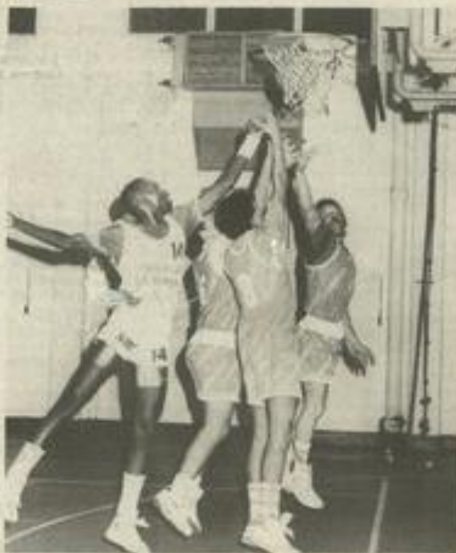
Une belle action sous le panier.

Match très équilibré donc où les égalités en début de partie ont été fréquentes et les défenses prenaient le pas sur les attaques 6-6 à la 5 e minute, des paniers faciles étaient souvent manqués et à la 10 e minute les Lézignaniens avaient 4 petits points d'avance 18-14 qui étaient maintenus jusqu'à 5 minutes de la fin 28-22, la sous la pression des vents et blancs Frontignan baissait un peu de régime et le score passait à 39-29 à la mi temps.