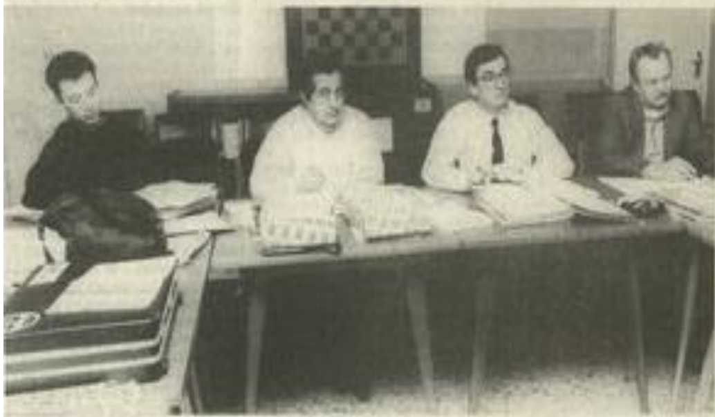
Le président de la ligue et son équipe.