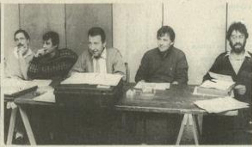
Quelques représentants de clubs du Languedoc-Roussillon.