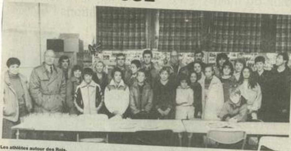
Les athlètes autour des Rois.