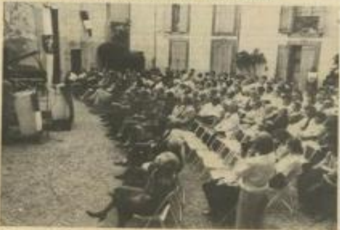
Tous assis, les jumelés pendant toute la cérémonie.