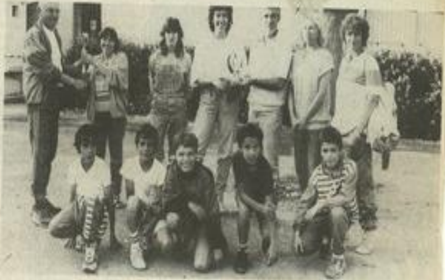
Un patient travail au service de l'athlétisme.

Aussi, pour marquer ces deux événements, les athlètes, leurs parents et amis étaient invités, lundi, à un apéritif d'honneur dans la salle de la JSL.