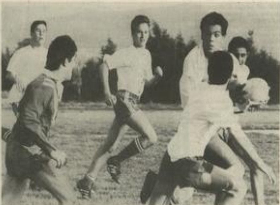
Minimes et cadets se sont entraînés ensemble, avec entrain.

Ce dimanche de la fête des mères sera jour de gloire pour les "petits" minimes et cadets de la section des jeunes du FCL XIII. En effet, ils disputeront la finale du championnat de France de leur catégorie. Une fin de saison en apothéose pour les "vert et blanc". De quoi faire un peu oublier les contre performances de leurs aînés de l'équipe I.