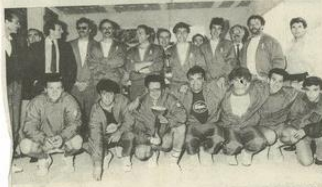
Les champions !

Les nombreux jours fériés du 1 er mai devraient nous permettre de faire un point plus précis dès la semaine prochaine.