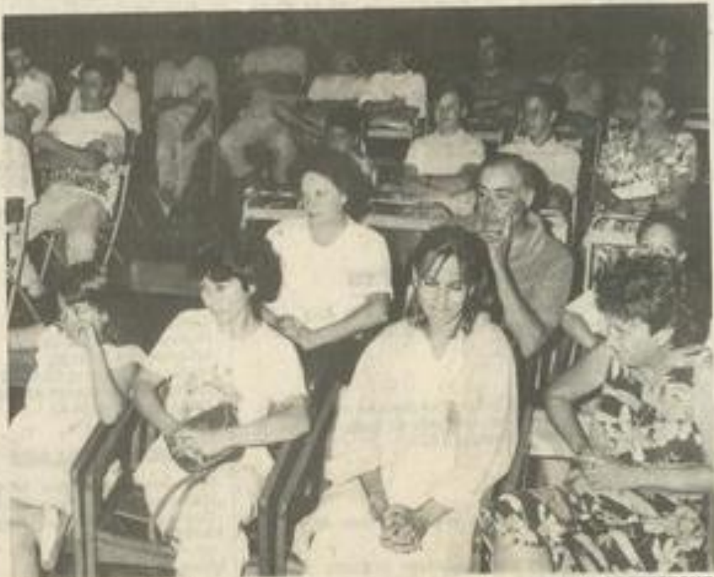
Les judokas à la M.J.C.