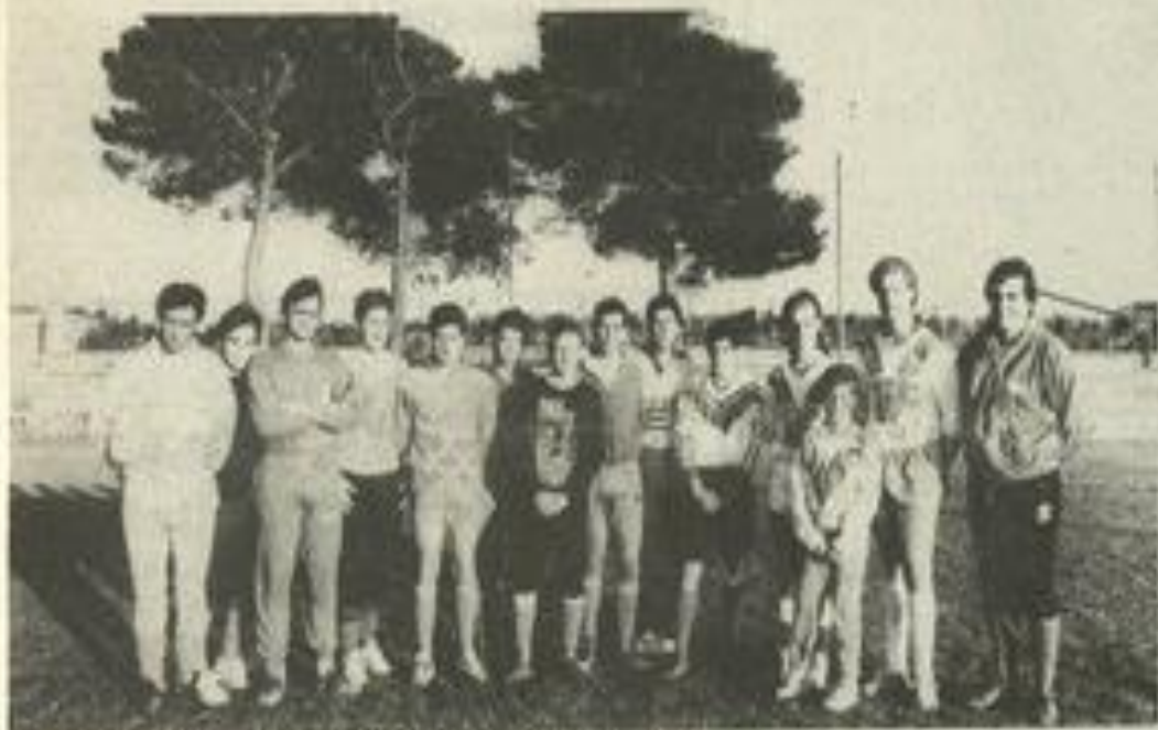
Une partie des juniors Lézignanais et leur entraîneur.