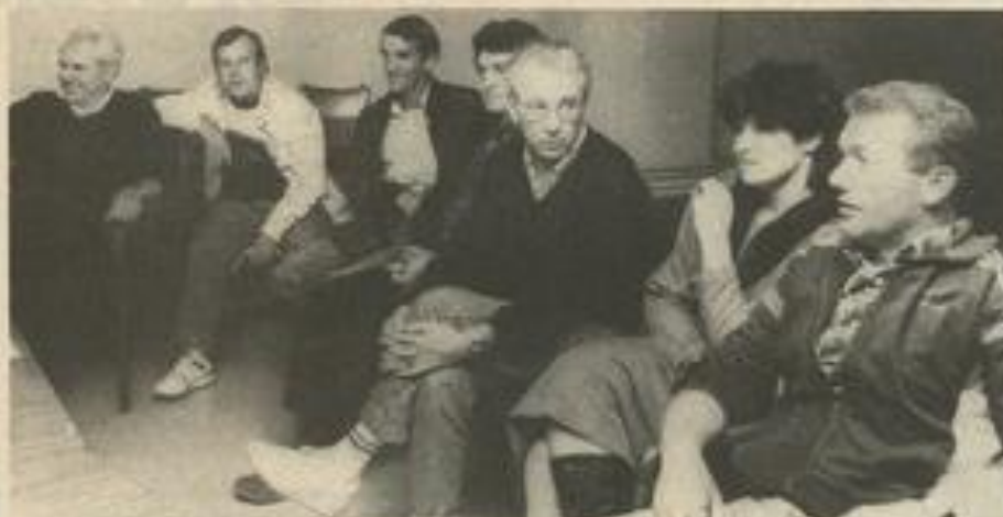
"Le club doit être soutenu".