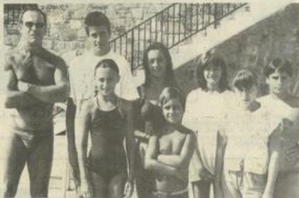
Aujourd'hui, la traversée de Port-Barcarès.

bonne-Plage. Ces deux jeunes nageurs honorent ainsi le club lézniganais par leurs supers performances.