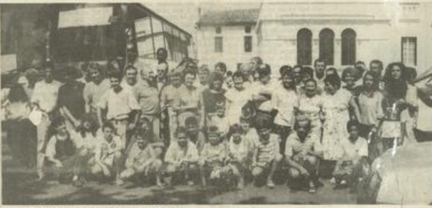
Les jeunes Lézignonnais en route pour Lauterbach