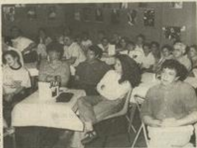
Une centaine d'amateurs autour des tables.

Vingt sur vingt. Sont autorisés à revenir !