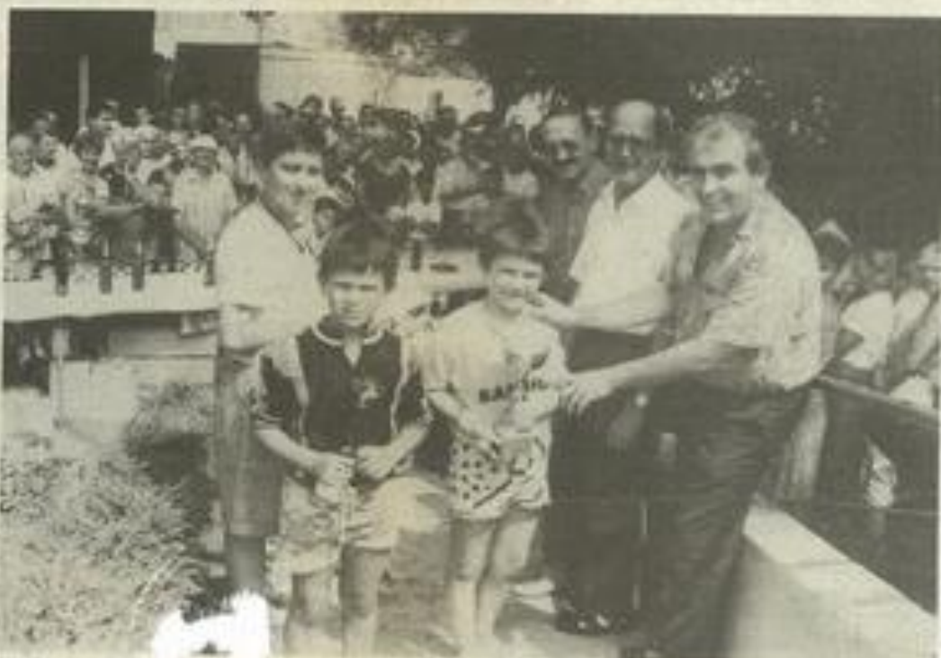
Les tout-petits récompensés

Le club lézignais tient à remercier le maire et son équipe pour l'aide apportée par la municipalité tant par la présence de ses représentants que par la participation des services municipaux et de la police municipale. Remerciements aussi à la Croix rouge et à tous les commerçants lézignais qui ont consenti d'une manière ou d'une autre à apporter leur aide.