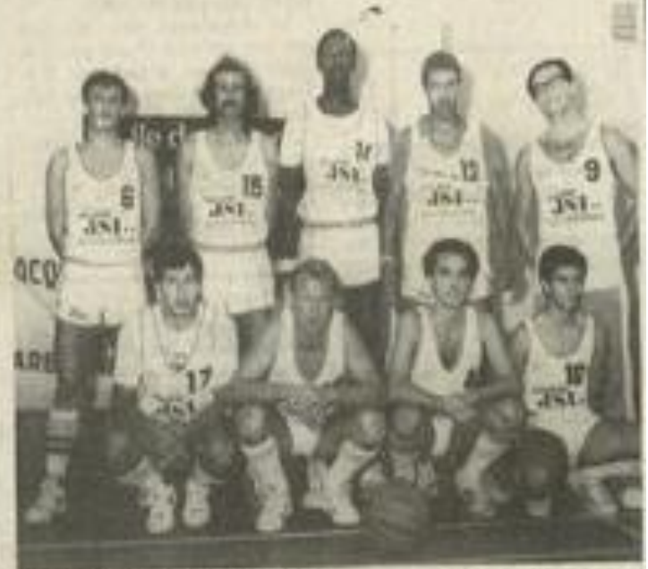
La formation "vert et blanc"

Les Lézignans veulent de leur côté jouer une fois de plus les outsiders dans ce tournoi qui leur tient à cœur afin de remercier leur sponsor J. Souallat. Les entraînements sont toujours autant fréquents ce qui permettra au club d'aligner deux équipes afin de faire jouer tout l'effectif et d'essayer certains joueurs qui peut-être évolueront la saison prochaine sous les couleurs "vert et blanc" si les diverses tactiques qui existent à l'intérieur du club et autour sont menées à bien afin de permettre au basket lézignans de franchir un nouvel échelon. Les sportifs sont conviés à la fête à partir de 9 h du matin. Finale vers 18 h.