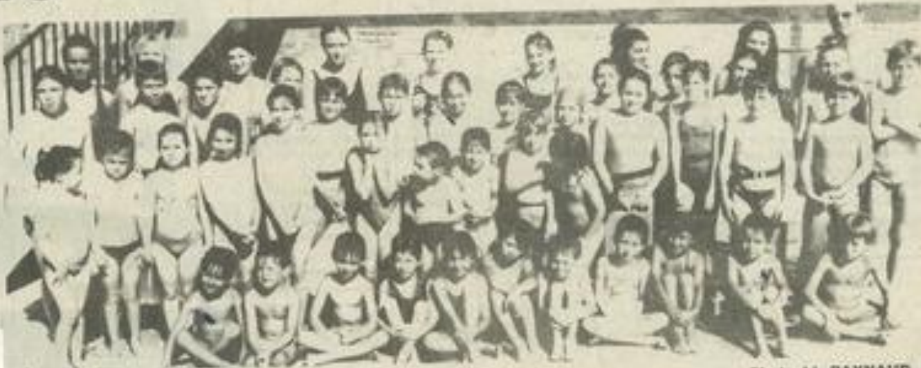
Ils vont nager tout l'été.

des confirmés. Le passage au "club" permettra aux meilleurs nageurs de suivre un entraînement plus soutenu. En août, les enfants participeront aux différentes traversées des port du littoral (Collioures, Barcarès, Narbonne-Plage, les Cabanes de Fleury). Les responsables souhaitent aussi, comme il y a deux ans, prendre part à une soirée organisée par les commerçants autour de la piscine. En attendant, ils se retrouvent tous les matins de 9 h 30 à 10 h 30 (10 h 30 à 11 h 30 pour le "club") sauf le week-end. N'hésitez pas à les rejoindre, il n'est pas trop tard.