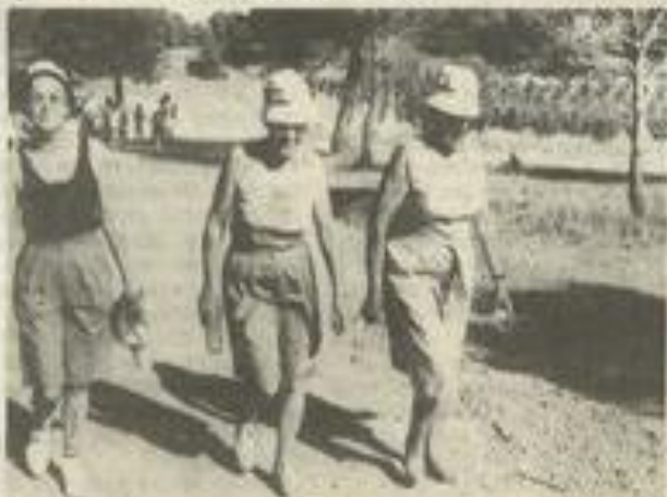
Dans la pinède... Ça marche !

Ils étaient près de 200 mais par un prompt renfort, ils se virent plus de 300 en arrivant... au dîner-musical organisé sur l'esplanade du Moulin : un succès sportif, médical et surtout amical.