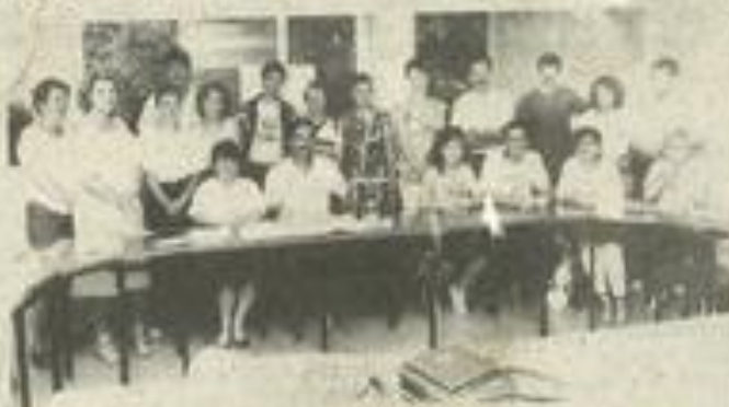
Préparer le triathlon !

L'animation sportive sera suivie par un concert du Big-band de Lézignan et un apéritif offert par la municipalité de Salles-d'Aude. Repas et danse permettront aux concurrents de partager et d'évoquer leurs aventures sportives.