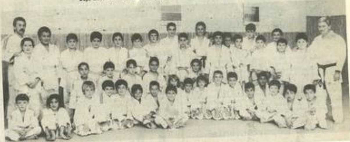
La vitalité des jeunes judokas.