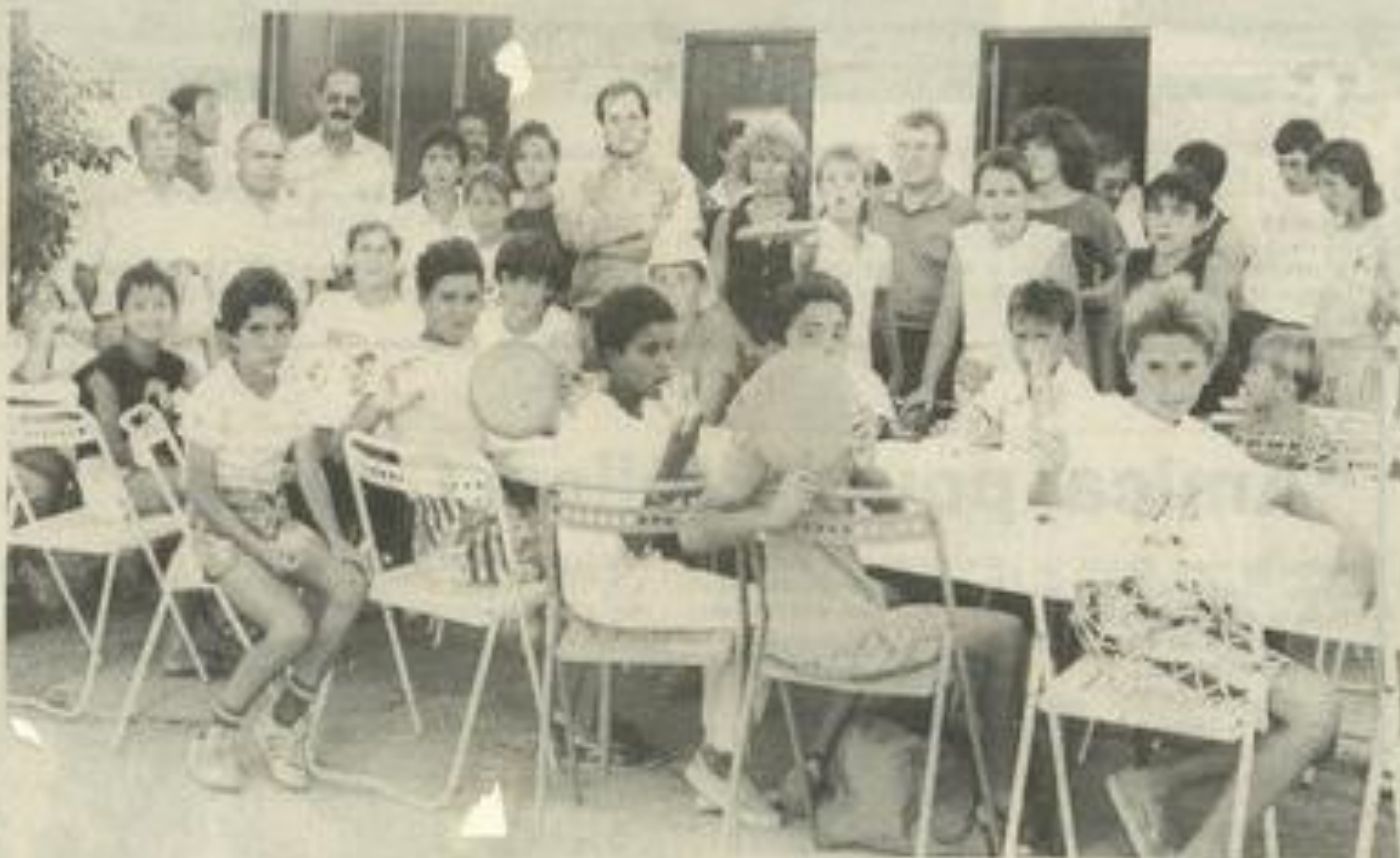
Excellente ambiance après le tournoi de samedi

importante après le FCL. De quoi voir venir et envisager un avenir souriant au football lézniganais.