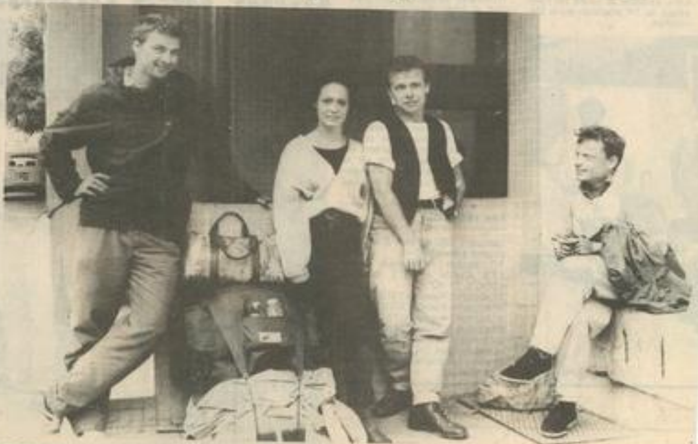
De Gracière ou d'Oxford... ils viennent à Lézignan pour le plaisir et pour l'argent grappillé en même temps que le raisin

Fidèles parmi les fidèles, les Polonais répondent régulièrement présents. Lucyne, étudiante en architecture à Cracovie, en est à son cinquième camp de vendanges, attirée par deux choses : l'argent et le tourisme. C'est le cas de tous les "vendangeurs d'ailleurs" comme Christophe et Marc de Varsovie qui ont fait le voyage jusqu'à Lézignan en stop ! Pour ces jeunes Polonais, l'évolution positive de leur pays est une excellente chose, mais ils le vivent sans trop de passion encore. La tension politique est moins forte, mais les assiettes sont toujours aussi vides. A Lézignan, ils oublient un peu les privations.