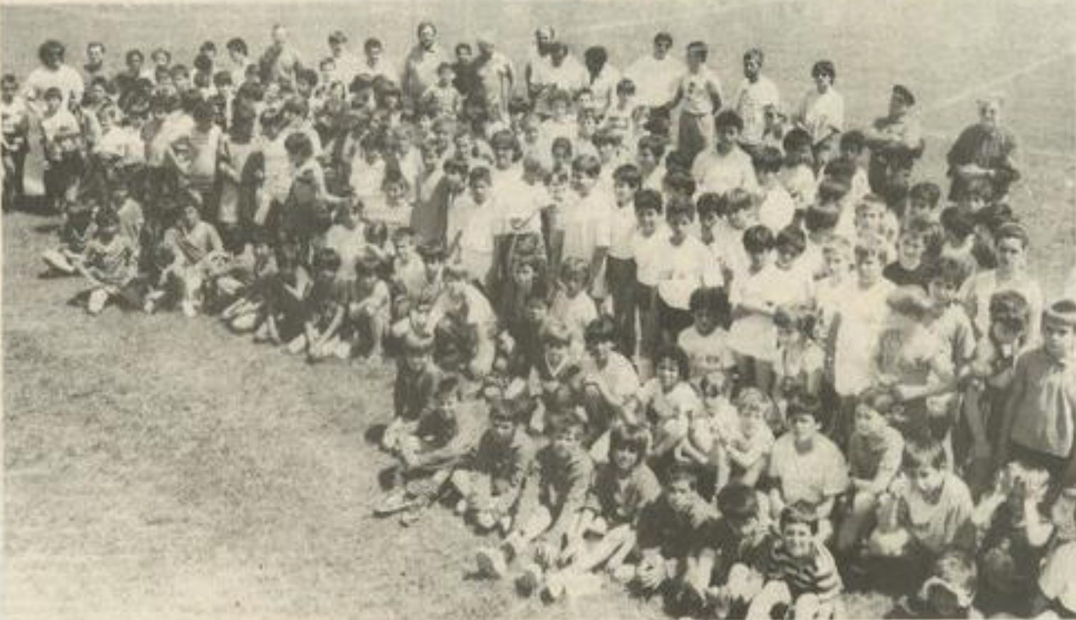
Du beau monde sur la pelouse