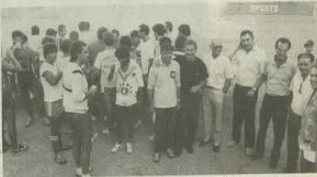
Les hommes du F.C.L. sont venus rendre visite aux hommes du T.C.L. Rugby et tennis : une longue amitié.