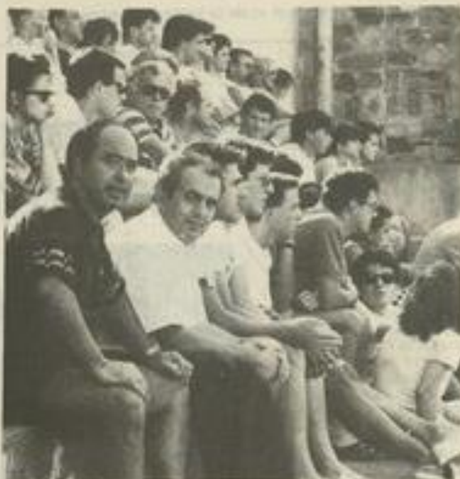
Beaucoup de monde dans les tribunes de la pinède.