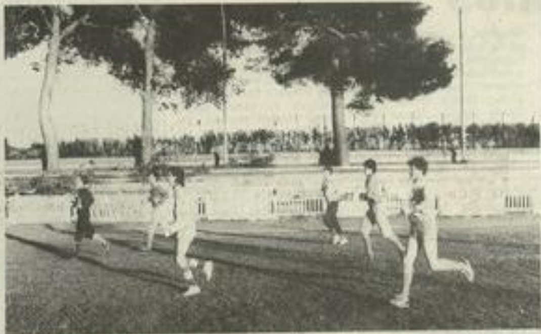
Les Lézignanais à l'entraînement.