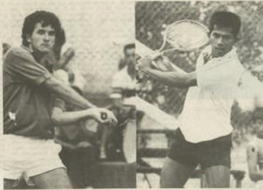
Boudeau et Lagloire : la détermination.