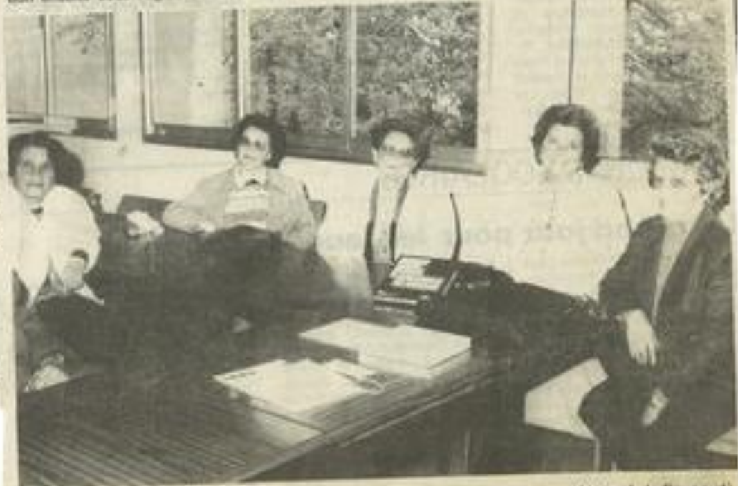
Pour jouer au scrabble.

Les personnes intéressées peuvent se mettre en rapport avec la Maison des jeunes en téléphonant au 68.27.03.34.