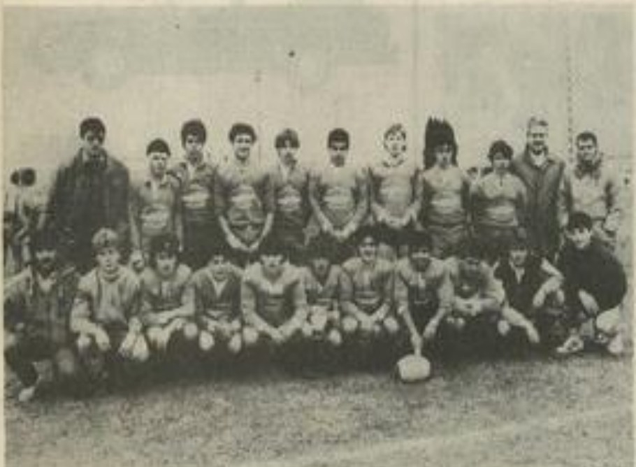
Les cadets lézignanais et leurs responsables.