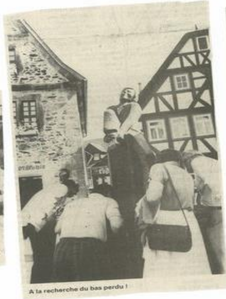
A la recherche du bas perdu !