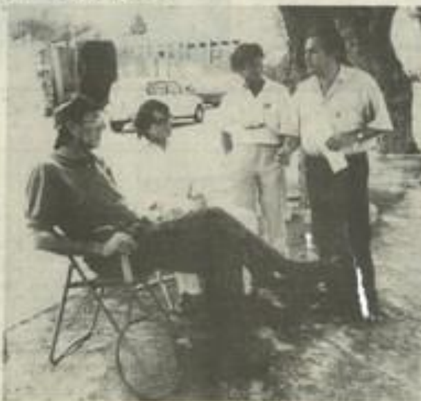
Moment de détente entre deux sets.