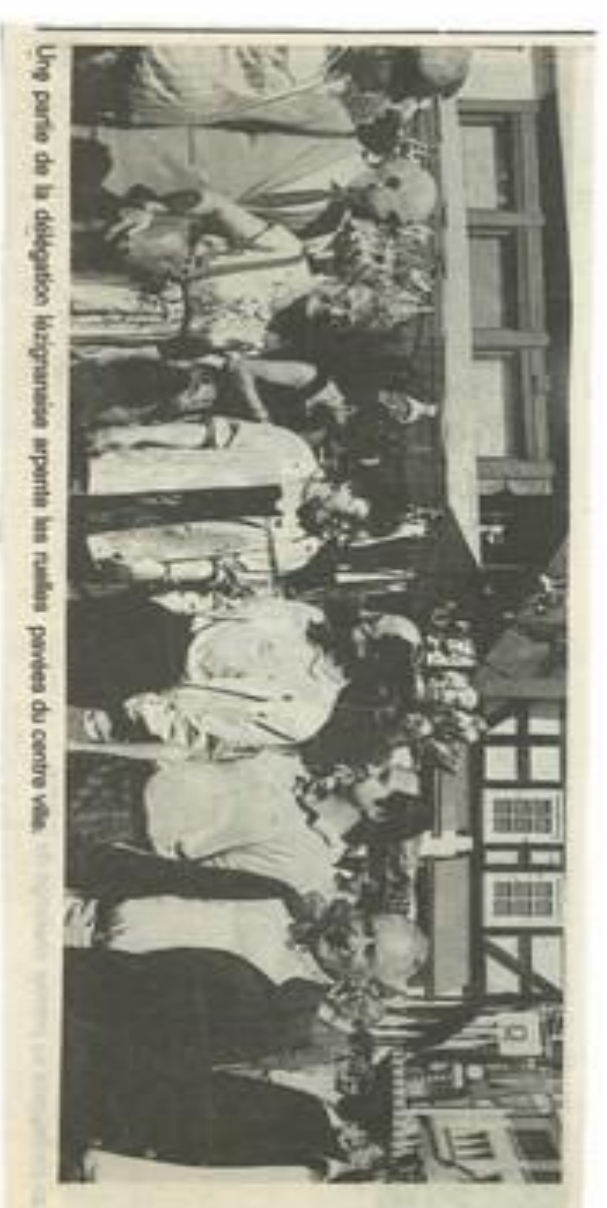
Une partie de la délégation lézignanaise reçoit les invités parvis du centre ville.

Demain : jumelage, un nouveau pont est jeté