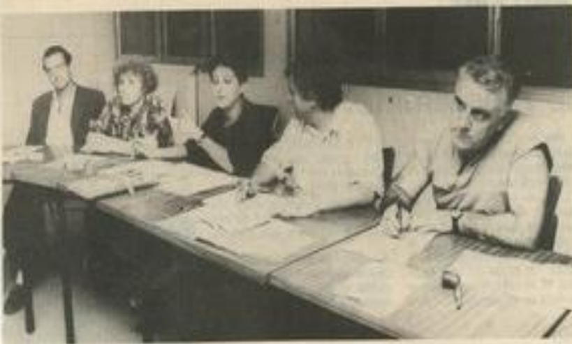
Pour préparer la Saint-Jean