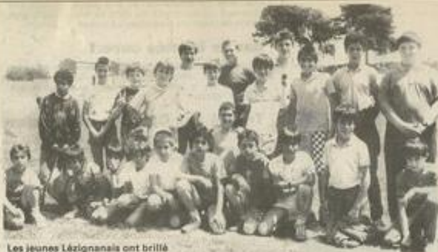
Les jeunes Lézignanais ont brillé