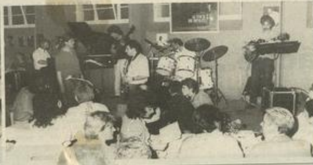
Autour de minuit, ils étaient encore là.