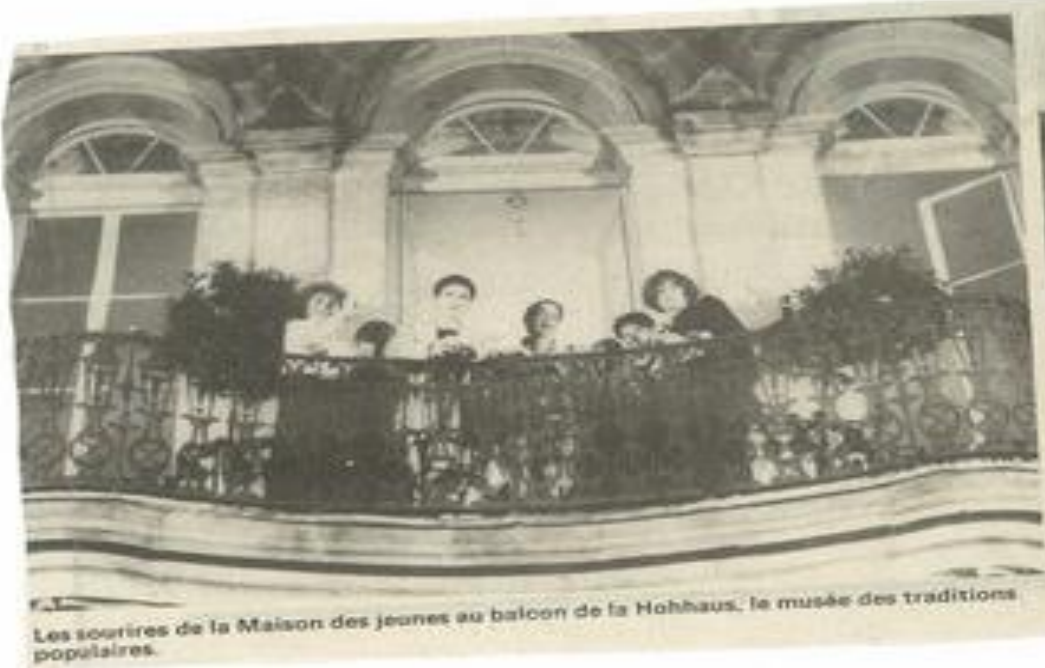
Les sourires de la Maison des jeunes au balcon de la Hohhaus, le musée des traditions populaires.