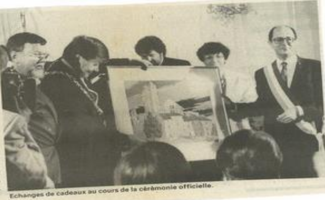
Echanges de cadeaux au cours de la cérémonie officielle.