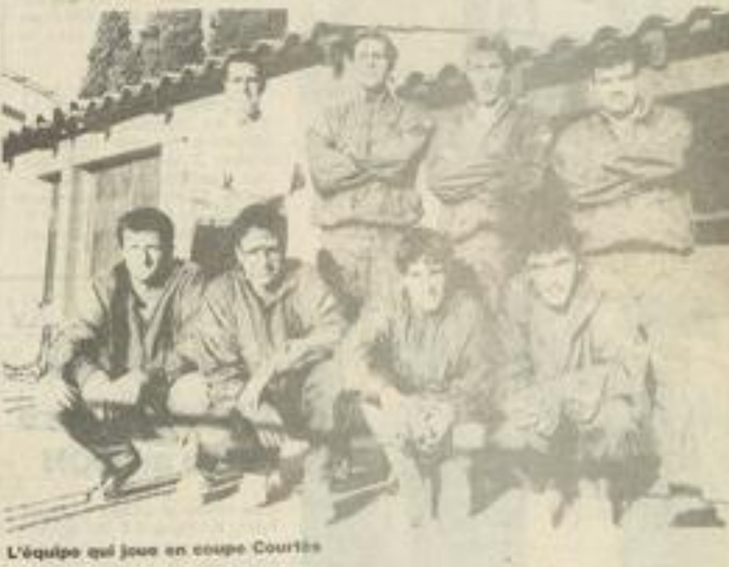
L'équipe qui joue en coupe Courtès

Le TC Lézignan, demi-finaliste en coupe Courtès rencontre ce dimanche le TC Bize, sur les courts de la Pinède à partir de 9 h.