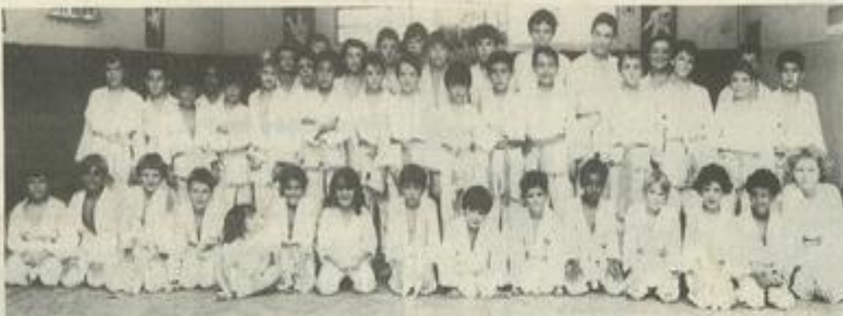
Des médailles au Judo-club