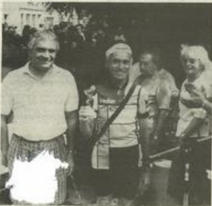
...Et le doyen aussi !