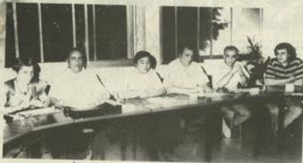
Deux aspects de la réunion du basket.