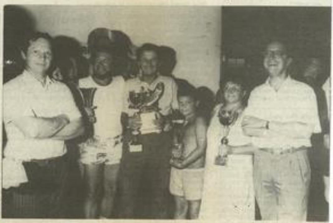
La pêche avec le...

La soirée se termina par un apéritif offert par l'Amicale lézignaise.