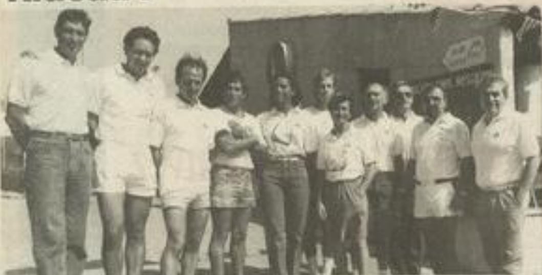
Les bénévoles : ils ont tous formidablement organisé le tournoi de la pinède !