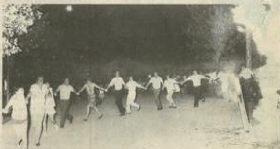
La ronde autour du feu : très convivial

Les plateaux-repas, préparés de mains de maître (et de mains de manchots) par les footballeurs aidés par quelques membres dévoués du Conseil d'administration, ont été dévorés avec un bel appétit. Le temps de laisser la