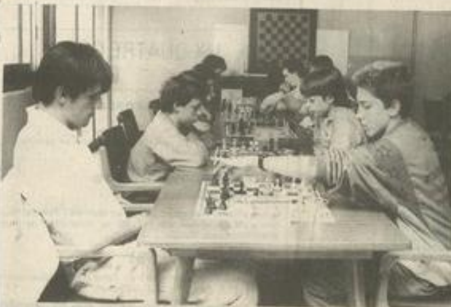
Patience et réflexion au programme

(deux équipes de huit, chacun marquant des points pour le groupe). A l'image de tout sport collectif, les parties d'échecs en équipe développent l'esprit de corps et évitent à l'enfant, de se sentir isolé et quelquefois impuissant face à son échiquier. L'expérience, concluante, devrait se renouveler à intervalles réguliers.