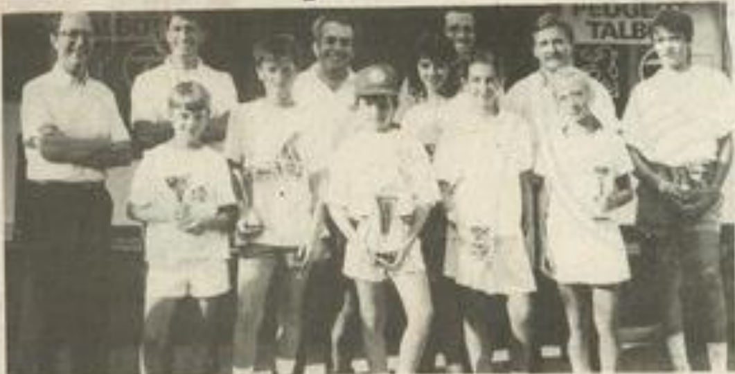
Les jeunes du tournoi.