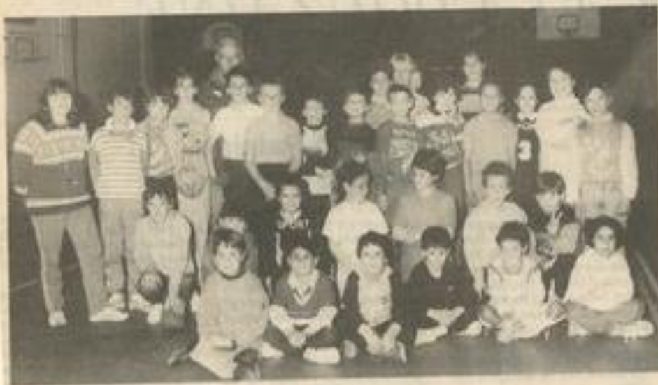
Les jeunes athlètes se préparent pour le challenge de samedi