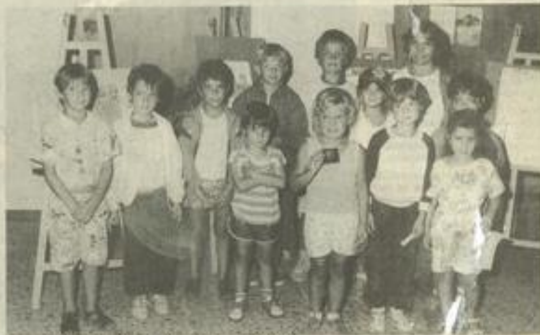
Les artistes en herbe récompensés par la M.J.C.