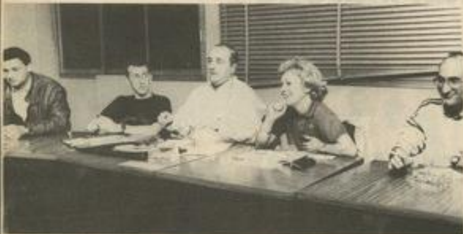
Le président de la J.S.L. et les membres du bureau.