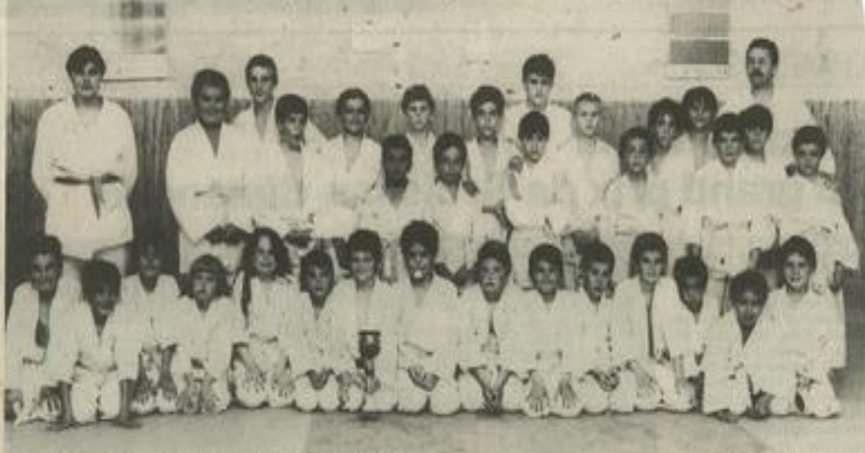
On ne compte plus les médailles à l'Athlétic-club judo.

Samedi 20 et dimanche 21 mai, à Leucate, a eu lieu une compétition des poussins, benjamins, minimes et cadets.