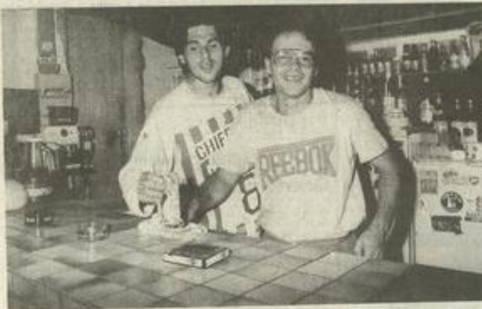
Au bar du club-house, des spécialistes.