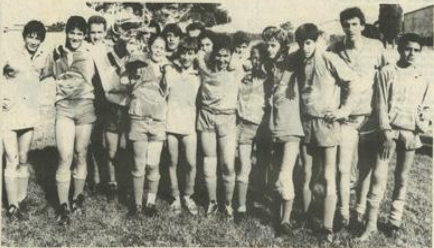
Nouveau titre pour les minimes