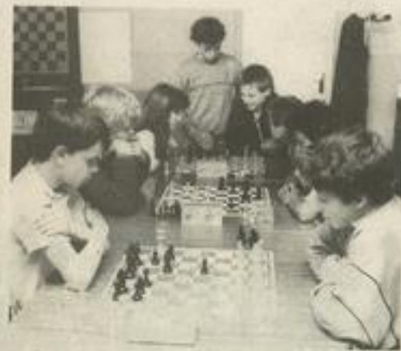
On réfléchit, mais on ne souffle pas

Une fois passé le stade du premier cycle, ils poursuivent leur scolarité à Narbonne ou ailleurs. Il n'est donc pas évident de