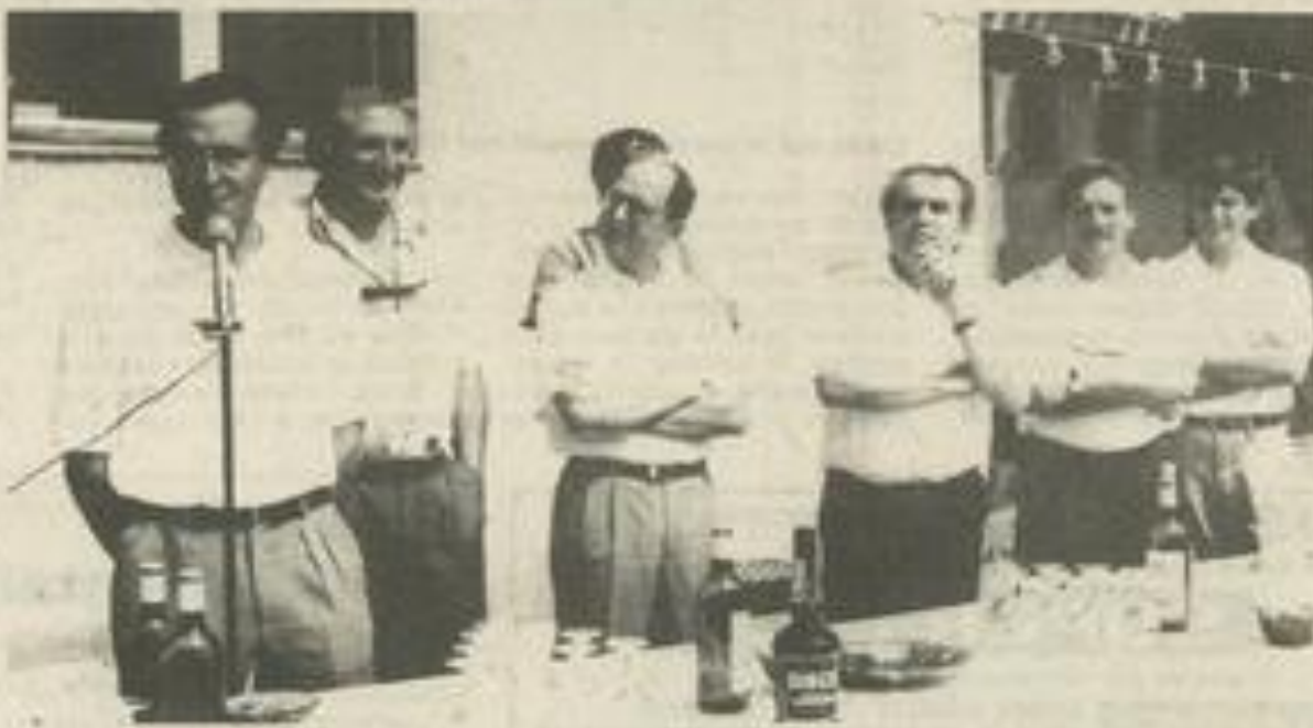
Le tennis à l'heure des discours.

Ce Tennis-Club lézignais, selon le premier magistrat lézignais, réunit à lui seul "un tryptique sur lequel nous nous reposerons: le sport bien