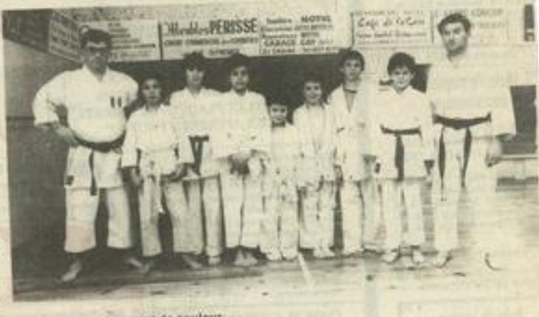
Les ceintures changent de couleur

Mais la récompense était au bout : une table bien garnie de galettes des rois !