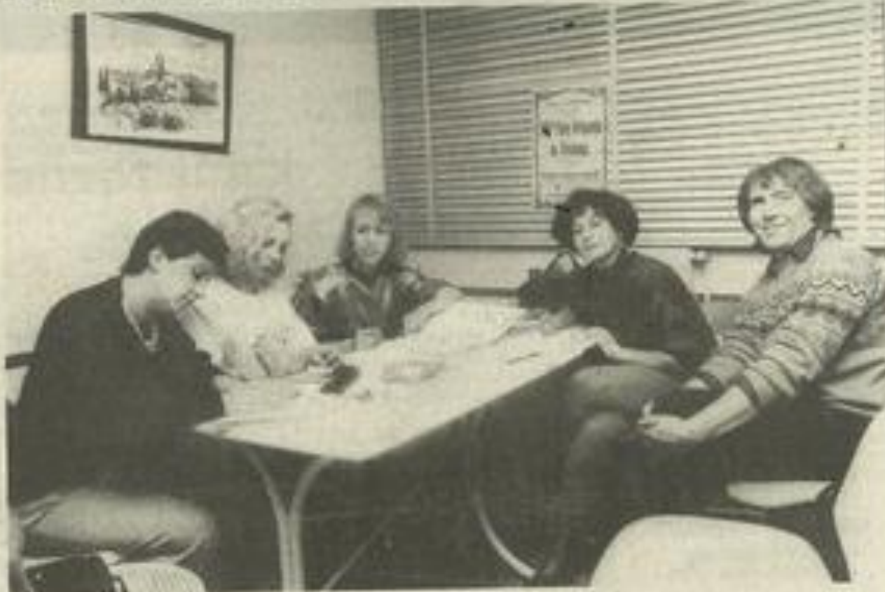
La commission culturelle au travail.