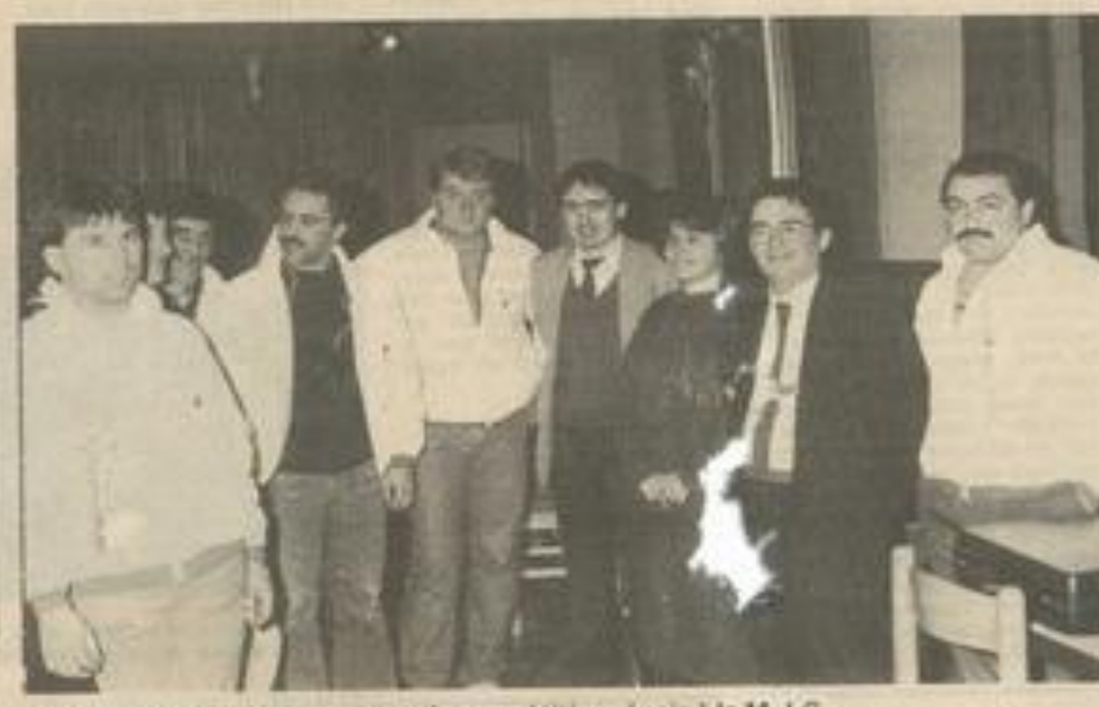
Les organisateurs de cette grande compétition réunis à la M.J.C.

Ces zones qui sont au nom-bre de quinze sur un circuit de 15 km à parcourir trois fois re-présentent tout l'intérêt de la compétition. Il s'agit de difficul-tés naturelles (rochers, pentes en terre, dévers, etc) que le pilote doit traverser sans appui ni des pieds ni des mains sous