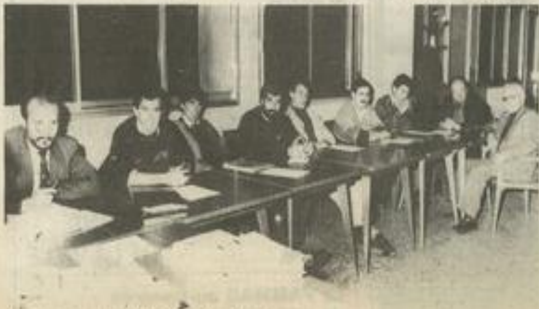
Des jeunes pour le CIVAM Corbières-Alaric.