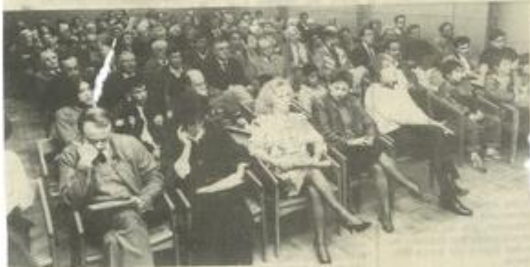
Dans la salle de la Maison des jeunes

Autant l'assemblée générale, 88 était morose et non dépourvue d'inquiétudes, dans la vaste salle du Palais des Mées, autant celle de l'exercice éboulé était sereine et détendue, dans la salle plus chaleureuse de la rue Marat. Avec de temps en temps quelques touffes sympathiques et des moments d'émotion virile et vraie. Avec aussi le petit côté "grand échiquier" (vous êtes formidables : mais je vous en prie... vous aussi...) inhérent à ce genre de manifestation où les bénévoles sont nombreux et méritants, c'est vrai !