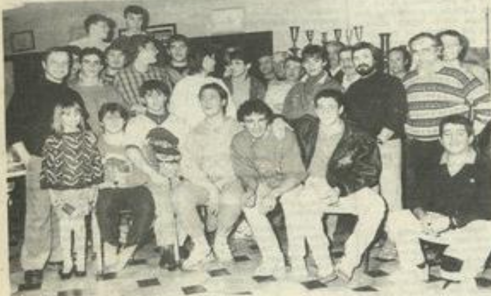
Les juniors du FCL au club-house