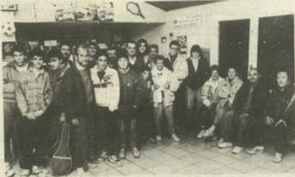
• Les participants à la réunion de lundi

Championnat de l'Aude poussins. Lézignan-Leucate.