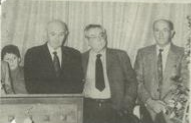
Trois présidents et (à gauche) le jeune espoir de la société de tir

travers deux membres, et même trois, c'est toute la société de gymnastique et de tir "la patriote" et "les Arquebusiers des Corbières" qui était reçue l'autre soir à la mairie. Et