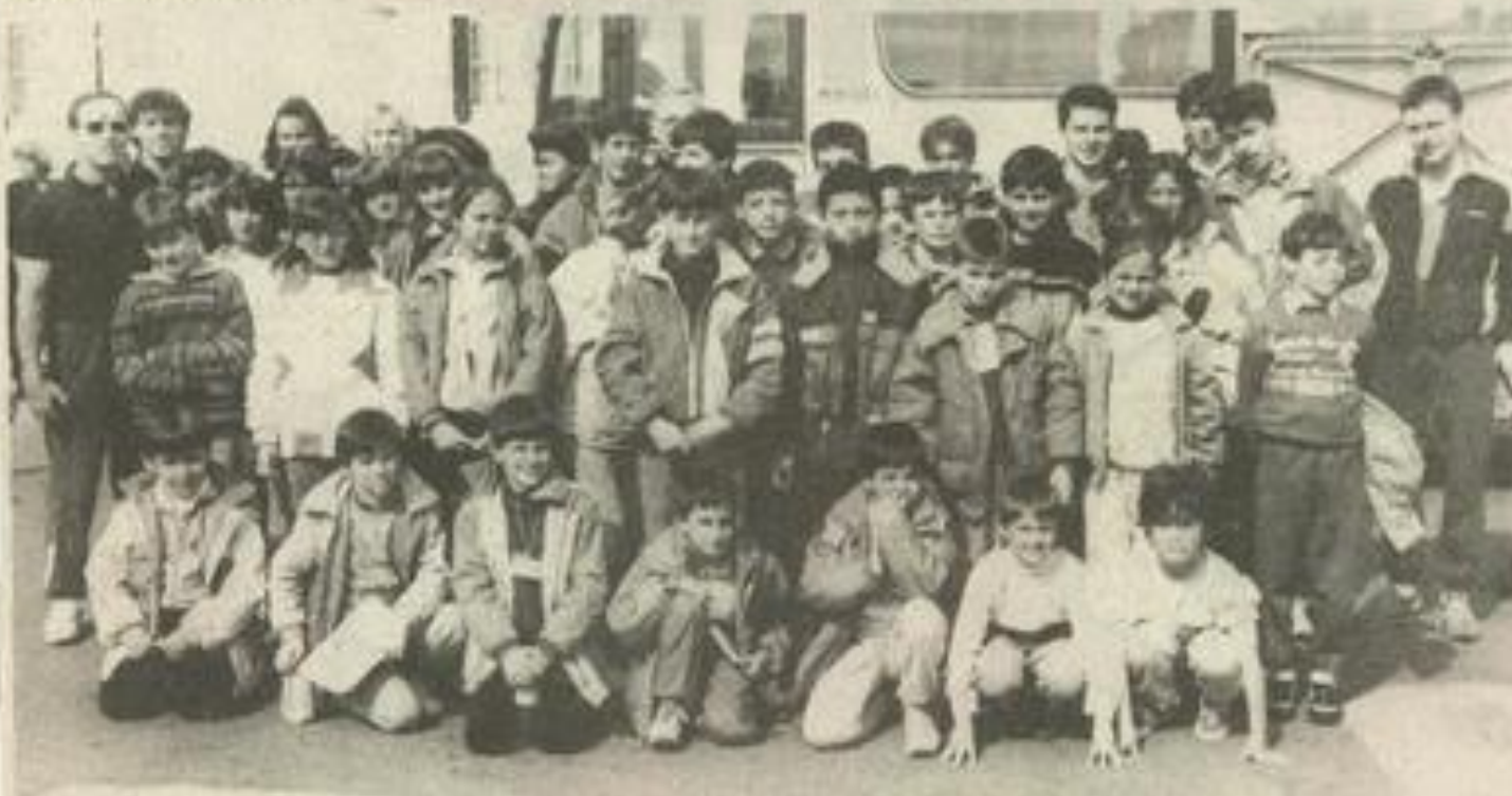
En route pour l'Allemagne.