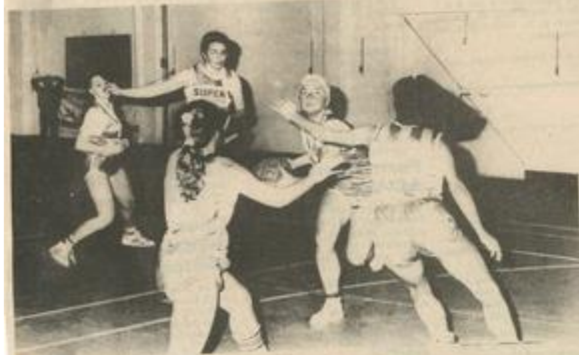
Les filles en forme.

Samedi, le gymnase Léo-Legrange était en fête, la JSI disputait deux imposantes rencontres. Pour débiter, remise d'un nouveau jeu de maillots à l'équipe féminine par la Sté Jacques Soufflet immobilier qui, depuis deux saisons, parraine les basketteurs lézignanais. Un nombreux public avait répondu présent. Les féminines de la JSI ouvraient la soirée en une rencontre capitale, en effet, l'adversaire du jour, l'AS Ville-neuve, première de la poule devait impérativement être battue par nos représentantes, à l'heure actuelle classées troisième, pour pouvoir espérer accéder à la deuxième place qualificative. D'entrée de jeu, l'engagement physique prévalait sur la technique, ce qui nous valut une rencontre brouillon avec de nombreux tirs manqués, mais à ce jeu, les Lézignanaises prirent l'ascendant pour atteindre la pose avec 8 points d'avance. La deuxième période fut plus difficile, mais la victoire revenait à l'équipe la plus motivée: la JSI, bien amenée par Sylvie Sarda avait rempli le contrat et s'im-