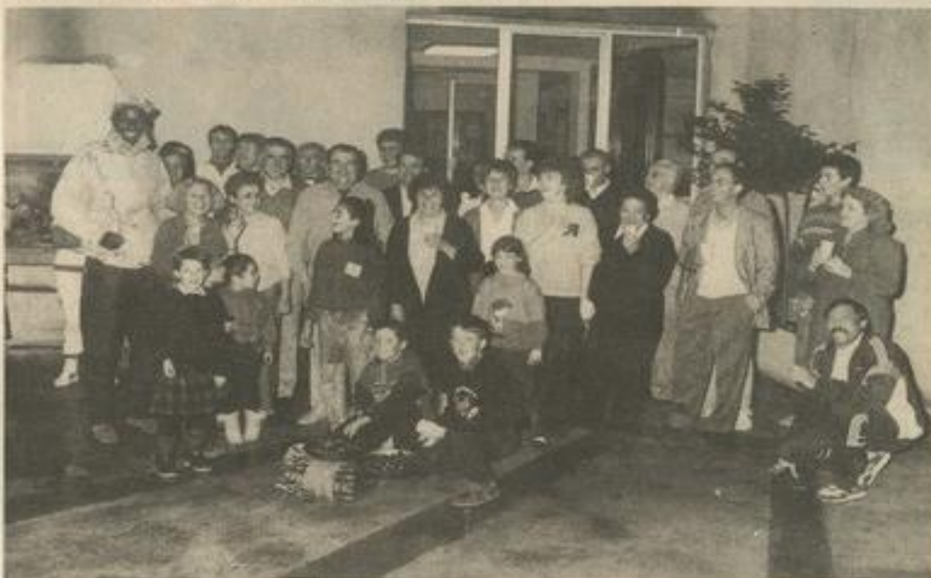
• La soirée à la M.J.C. (Photo Costesèque). Chaque ambiance l'autre soir à la Maison des jeunes, avec un temps de circonstance. Des châtaignes arrosées de vin nouveau, c'était le menu de la soirée à laquelle assistaient les membres du conseil d'administration et de nombreux adhérents. Un agréable moment d'amitié.