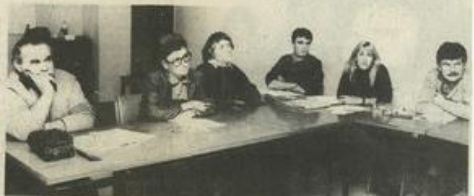
Les responsables des MJC du département