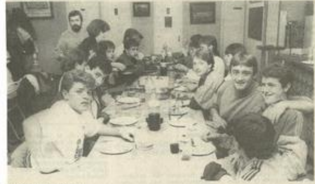
Une partie des juniors.

Ce fut également à l'occasion de cette manifestation, où l'ambiance ne faisait pas défaut, d'offrir un magnifique tee-shirt à chaque joueur.