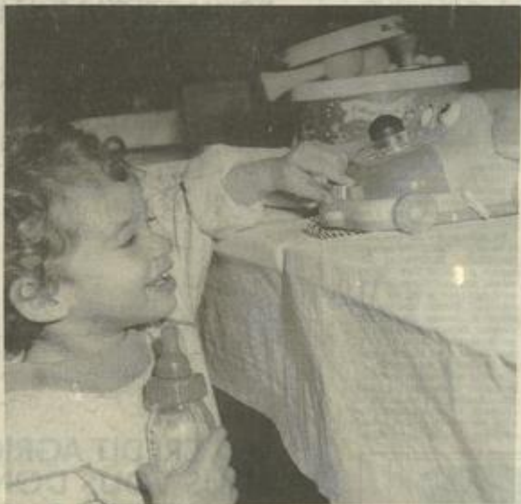
Les enfants étaient à la fête.