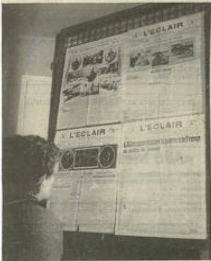
Une large part est faite aux journaux de l'époque.

Une exposition sur la Grande Guerre est actuellement accrochée aux cimaises de la M.J.C.