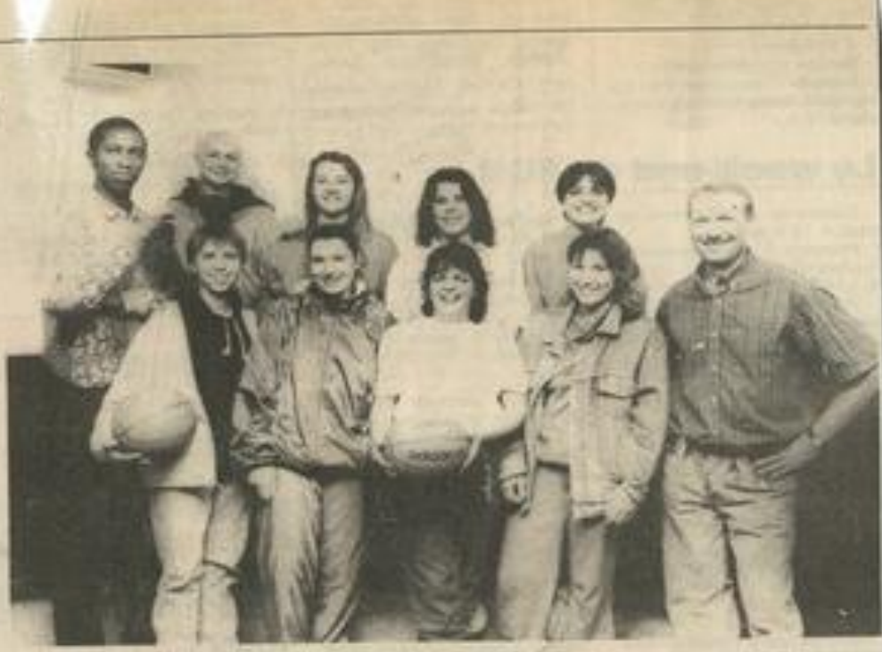
L'équipe féminine : une rencontre importante ce soir.

Pour cette rencontre très im-portante pour la JSI, nous fai-sions appel à tous les supporters parents amis et sympathisants pour venir encourager "Jules" et ses camarades dans cette rencontre difficile.