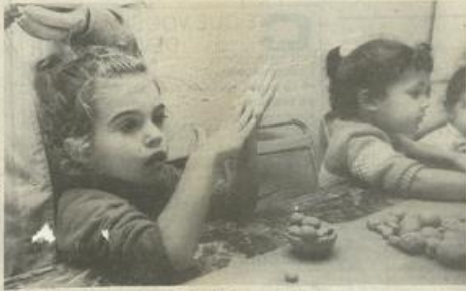
• Je roule, tu roules, il ou elle roule l'argile.