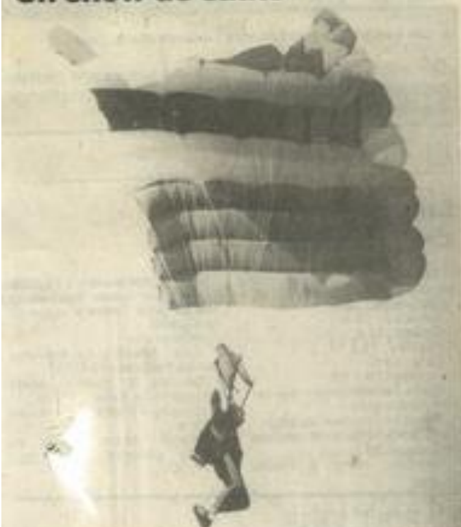
• Le grand saut en direct