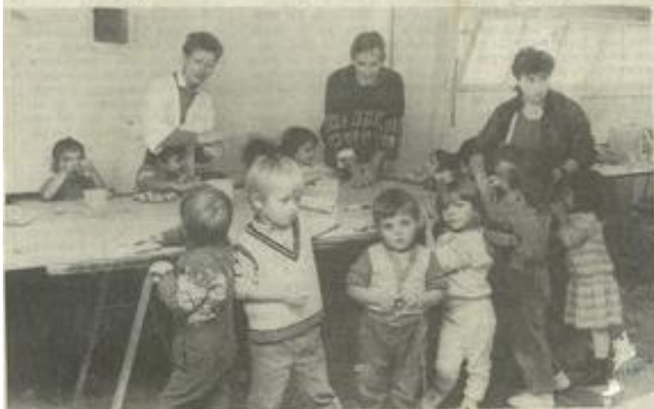
• Les bambins intéressés par la poterie.