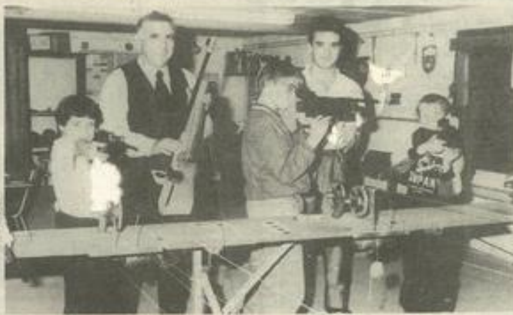
• Des armes de qualité à l'école de tir

La cible, à 10 m, n'est pas bien grande : 9 centimètres sur 9, avec un "dix", c'est-à-dire,