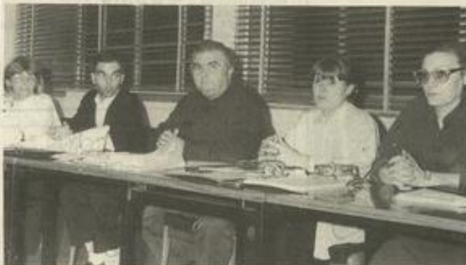
Le bureau de la Fédération des commerçants