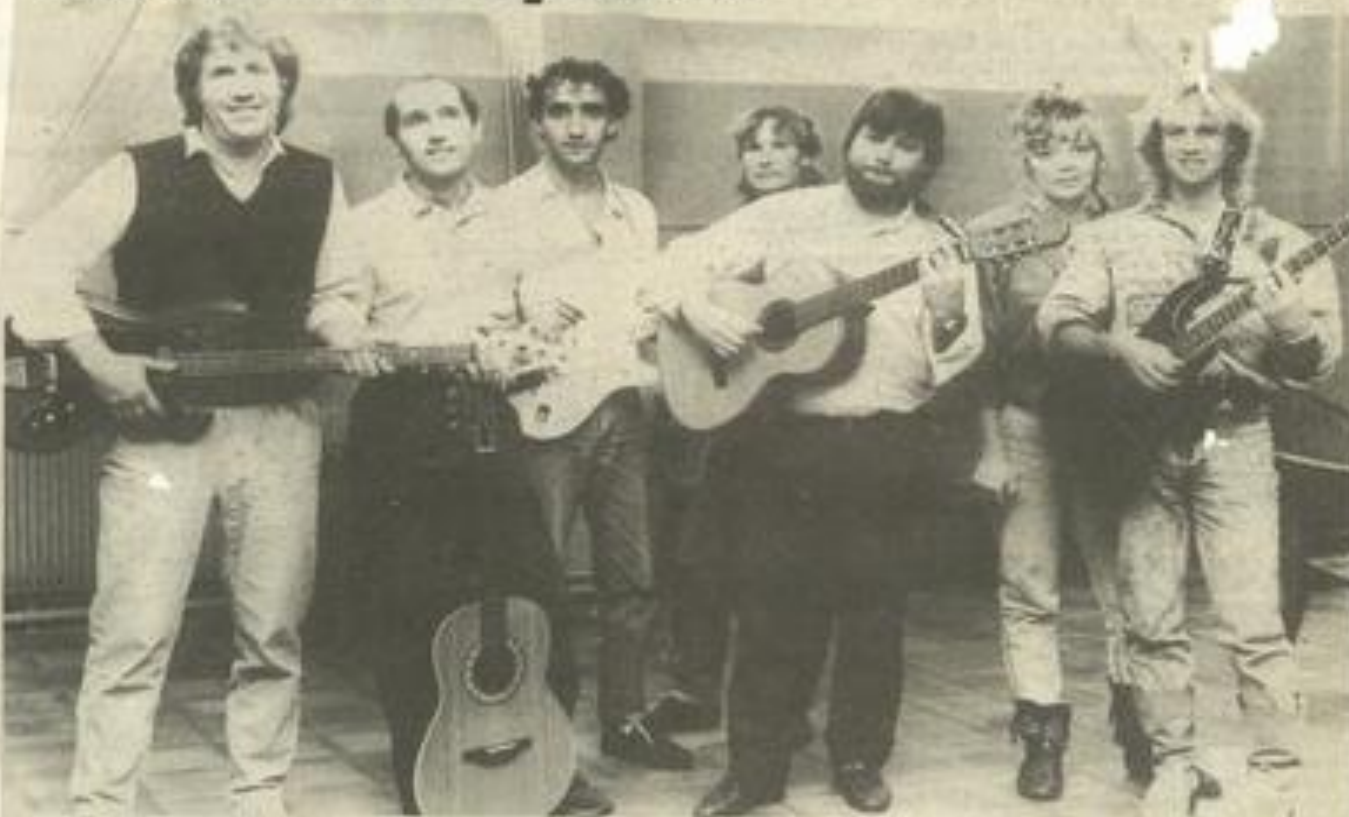
• Guitare, poésie et amitié.