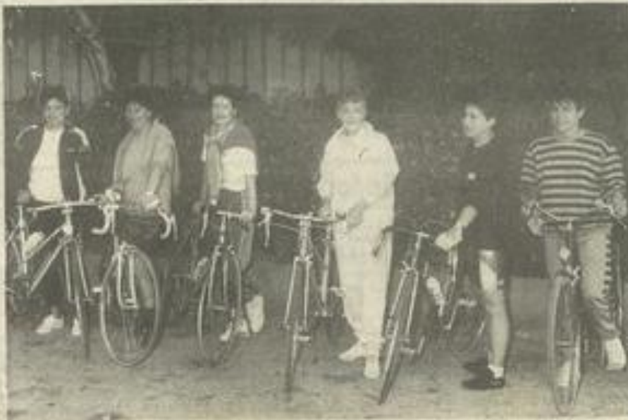
• Une petite sortie d'entretien.

Le dossier du POS est à la disposition du public à la mairie et en préfecture.