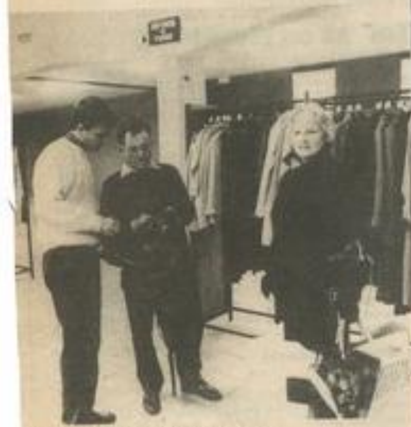
• Côté vêtements : un petit essayage.

Ils avaient déjà fait une apparition lors des dernières kermesses de l'inutile mais cette fois ils ont acquis droit de cité : la bourse aux vêtements est une réalité.