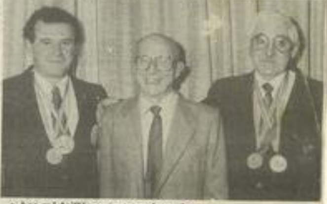
Les médaillés entourant le maire

Jeux méditerranéens et les Jeux Olympiques de Barcelone vont attirer dans nos régions un bon nombre de sportifs en entraînement. Il ne faut pas être pris au dépourvu et là je m'adresse à vous Messieurs les conseillers régionaux et départementaux en vous demandant d'aider financièrement par le canal de la municipalité la réalisation de la 2 e tranche des travaux de notre stand déjà très opérationnel grâce à l'appui de vous tous, ce dont je vous remercie bien sincèrement au nom de nos membres. Je compte sur vous comme vous pouvez compter sur moi et notre société."