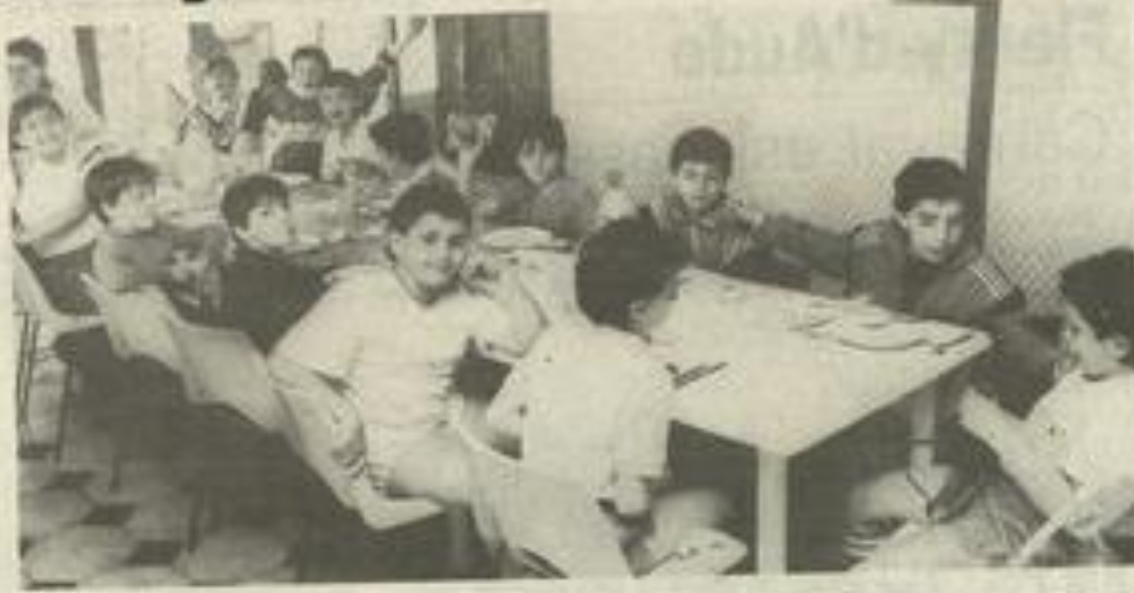
Bonne humeur à la table.