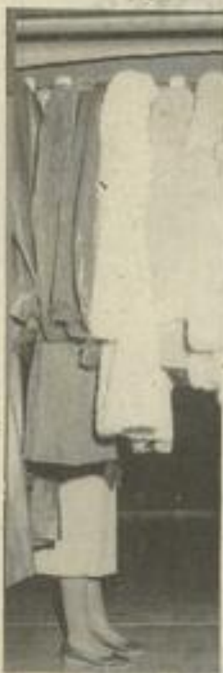
Même incognito, les dames purent faire de bonnes affaires.