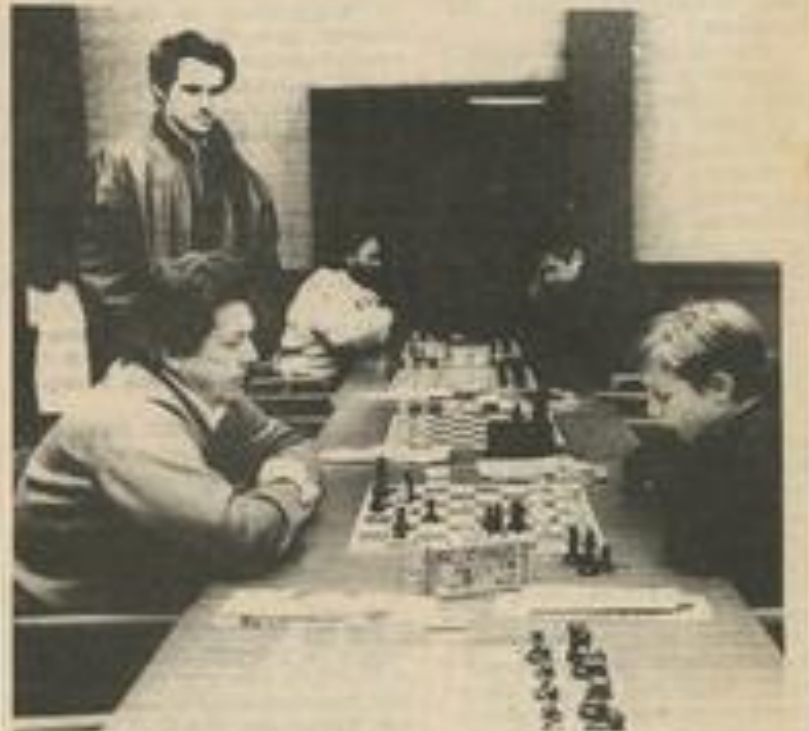
Le 2 e tournoi d'échecs organisé par la MJC a connu un succès... Sa venue a aussi attiré de...