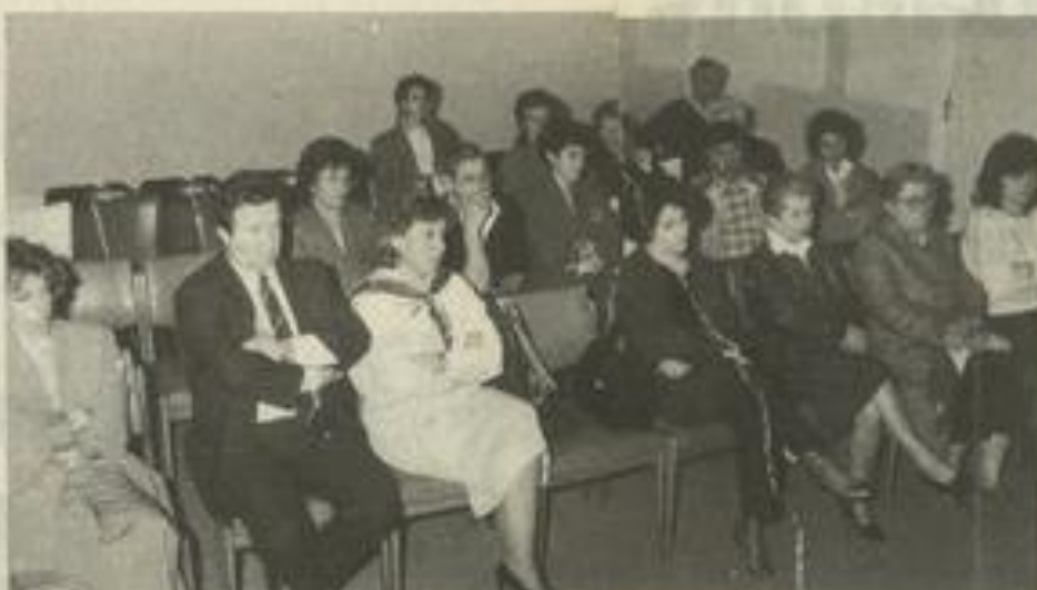
Une partie de l'assistance, à la M.J.C.