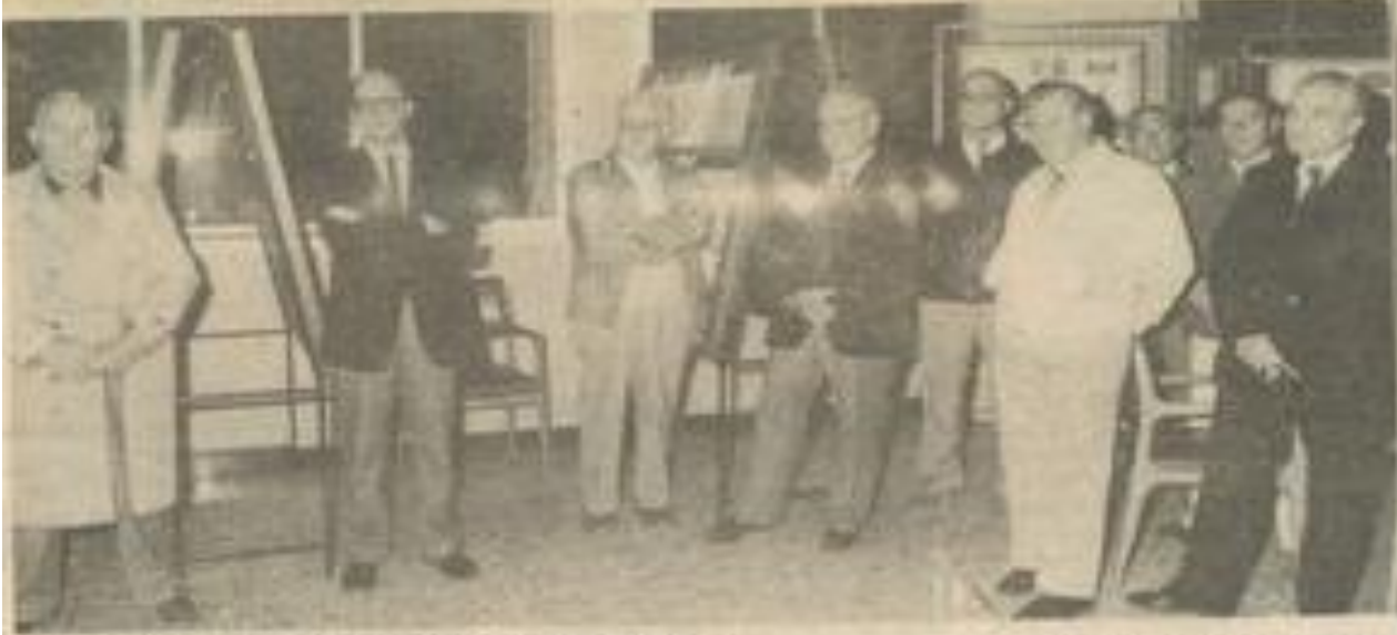
• La présentation de l'exposition à la M.J.C.