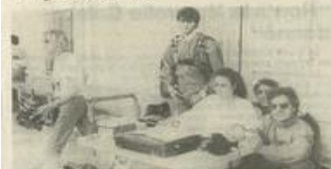
• A la table de contrôle