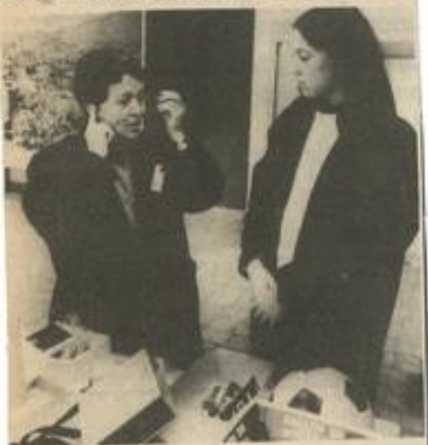
• Côté jouets : un walkman... qui marche.