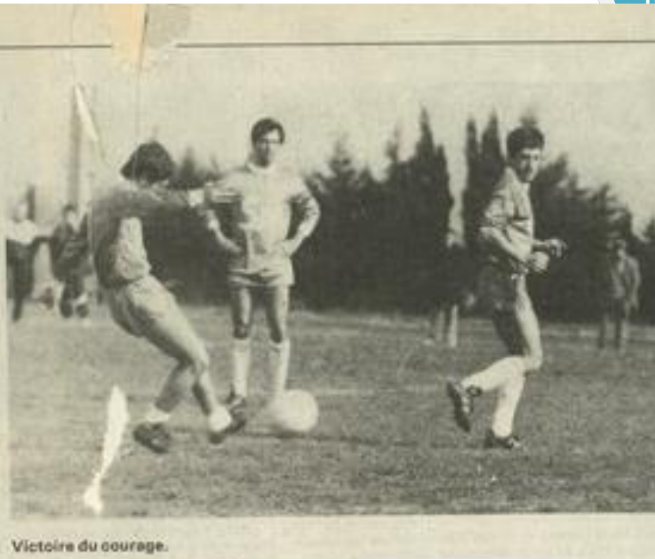
Victoire du courage.

Nos pupilles à 7 qui seuls chez les jeunes étaient sur la brèche, ont ramené de Rieux une très belle victoire par 4 buts à 1 qui leur permet de conserver la tête de leur poule. Félicitations à ces jeunes joueurs qui s'affirment au fil des semaines et à leurs dévoués entraîneurs.