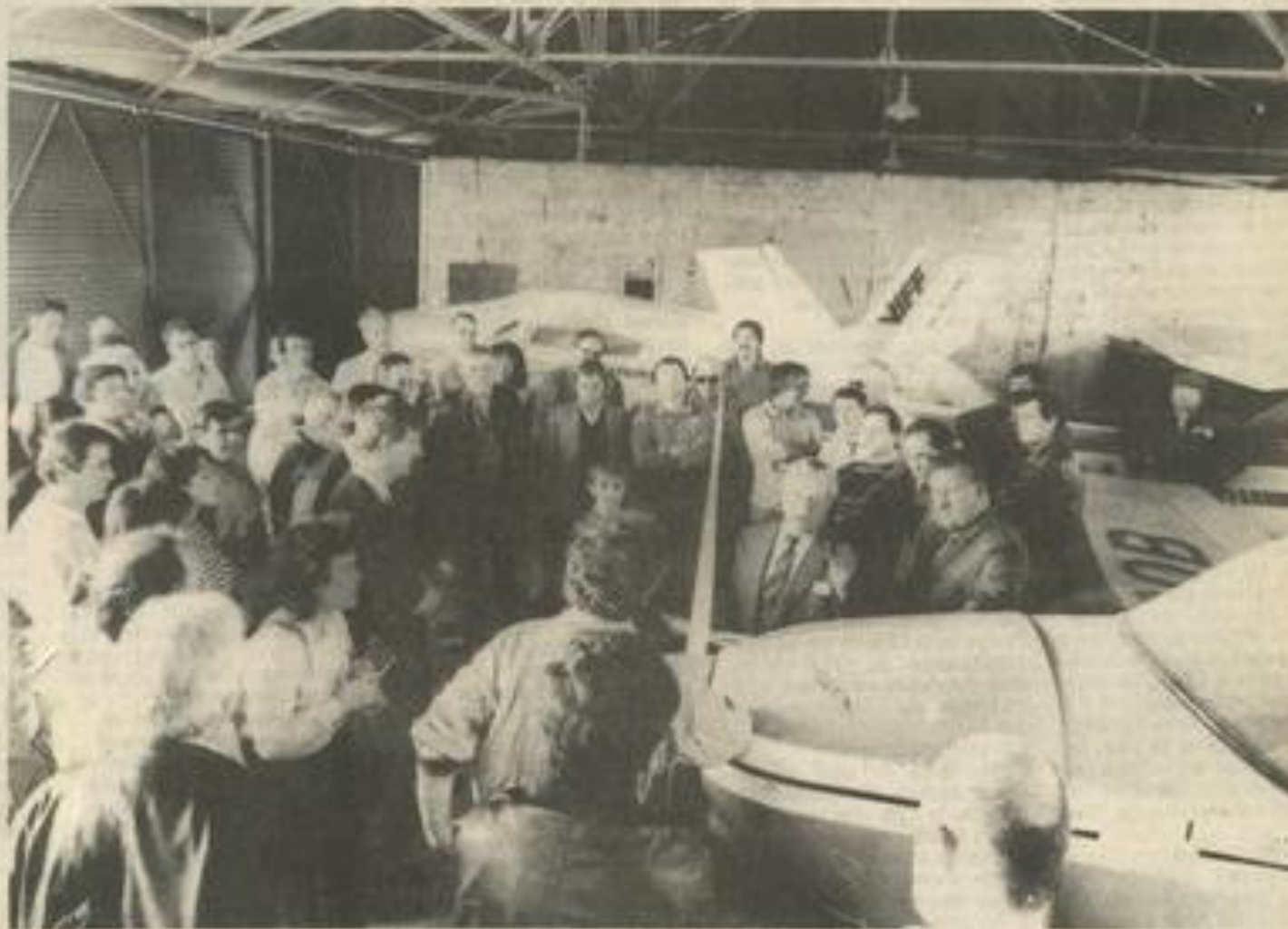
Des enchères sous la direction de M r Laudet.

"Ça fait mal au cœur répète l'ancien aviateur lézignanais. Mais moins que de voir ces avions cloûés au sol par les toiles d'araignées. Ils pourraient à nouveau voler!"