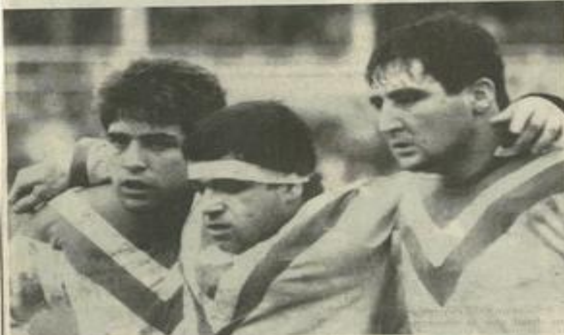
Le pack «vert et blanc» vaillant, mais jusqu'à quand? (Photos Costesèque).