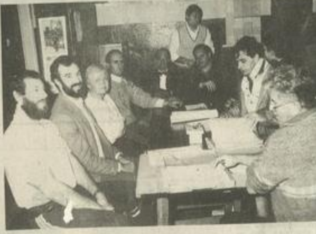
• Des projets en perspective.