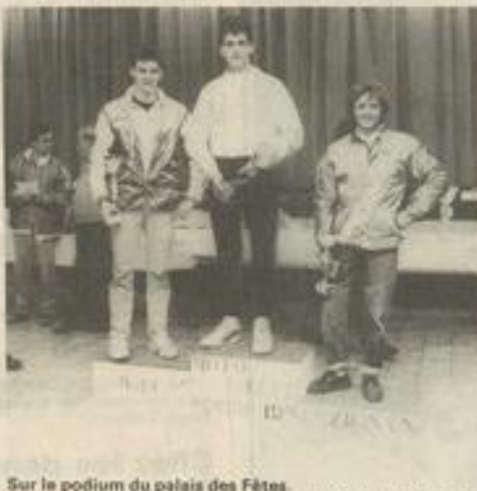
Sur le podium du palais des fêtes.

La remise des prix de cette compétition se déroulait en fin d'après-midi au Palais des fêtes.