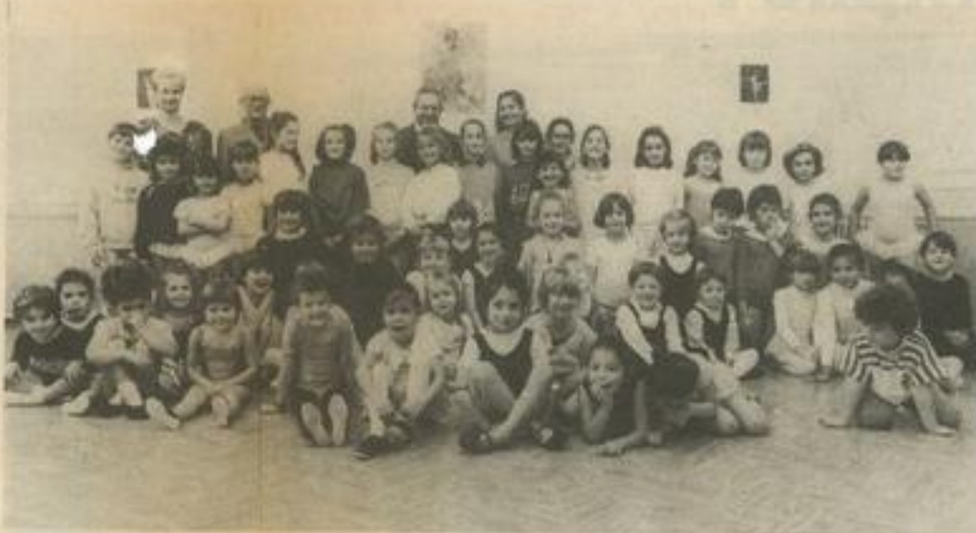
• Les petits rats...

Bien sûr, les cours sont divisés en plusieurs groupes. Il y a les plus petits d'abord, les élèves de 4-5 ans : c'est essentiellement un travail d'éveil, de l'expression corporelle. L'enfant, à partir de choses vues essaie de réaliser des figures