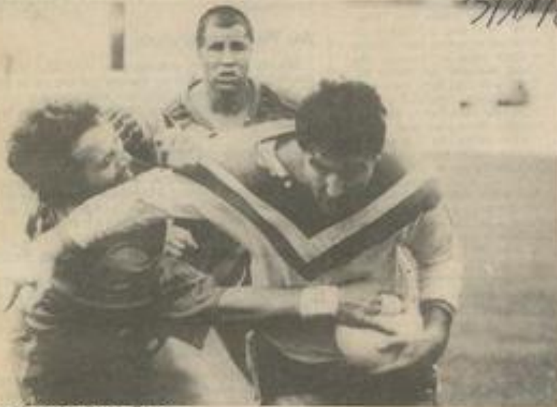
• Toute la détermination de Bosca.