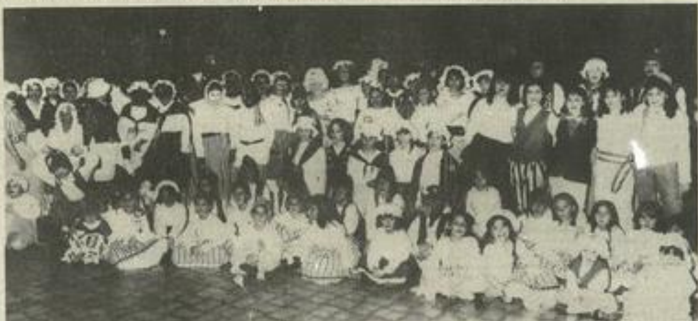
Les révolutionnaires léznagnais.

ainsi que celles qui les ont aidés à la décoration du palais des fêtes.