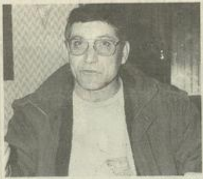
de Lézignanais des purs du FCL, qui attendent avec impatience, car redresser une situation financière en dilapidant le capital était à la portée de n'importe qui".

L'heure des comptes va bientôt arriver, je connais beaucoup