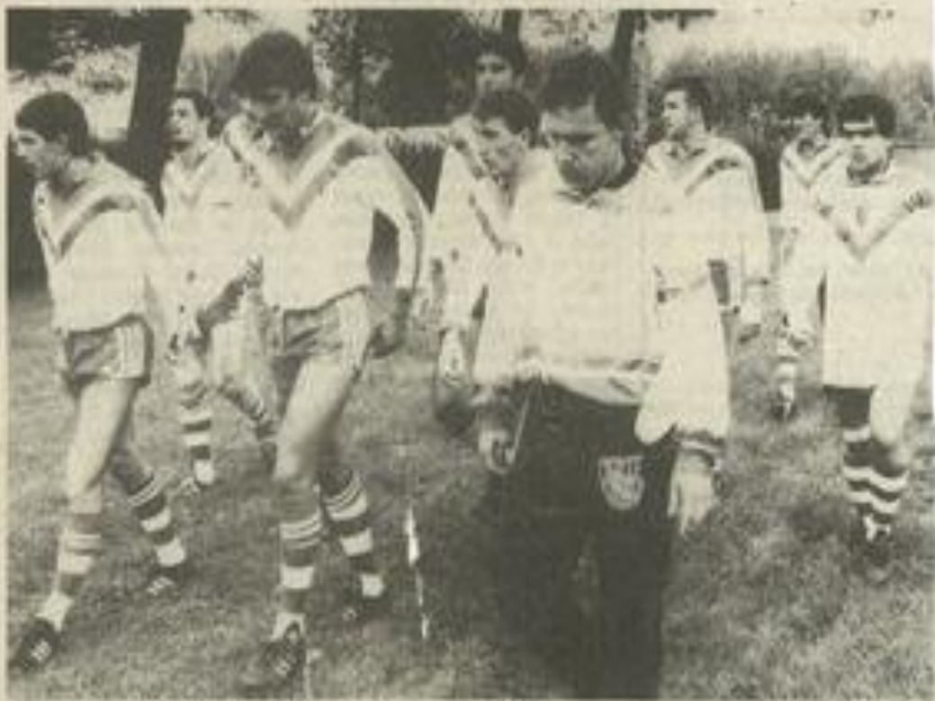
• Avant un match, les Perpignanais sont pensifs.

Dès ce matin au stade de la Rouminguère pour le compte du championnat de France de leur catégorie, les minimes face à St-Nazaire et les cadets (invalcus depuis le début de la compétition) face à Saint-Laurent-de-la-Salanque se produiront. Les supporters sont conviés à venir nombreux, soutenir ces méritantes formations de jeunes. Rendez-vous des joueurs à 9 h 15.