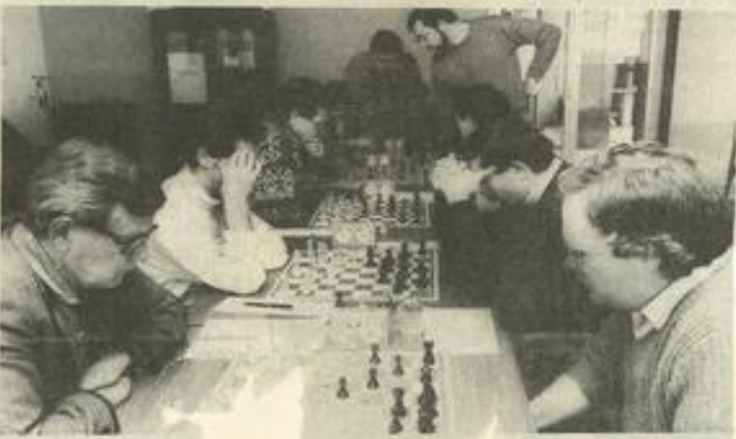
Tout le sérieux des éch.

Les deux dernières rondes se joueront à la MJC de Léznigan le 5 mars prochain.