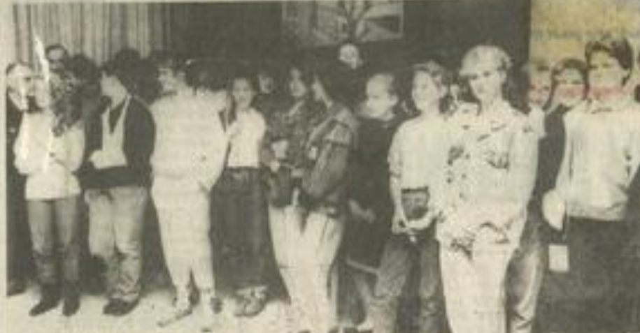
• L'amitié franco-allemande.