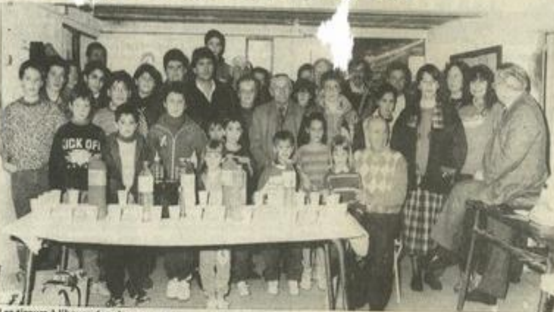
Les tireurs à l'heure des récompenses.