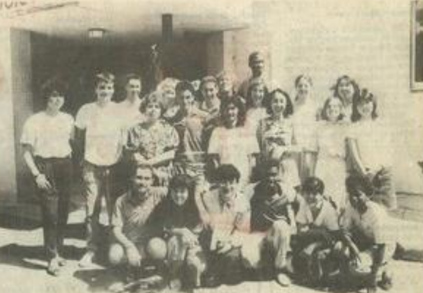
Des stagiaires de tous les pays.

Au programme des réjouissances de ces prochains jours: Quéribus et Peyrepertuse, Notre-Dame des Auzils, l'aménagement du littoral (Grissan), le musée de la vigne et du vin, et visite d'une cave coopérative, abbaye de Lagrasse, le château de Puivert et la blanquette de Limoux, l'abbaye de Fontfroide et la Narbonne romaine et gothique, l'Œil doux... Des visites