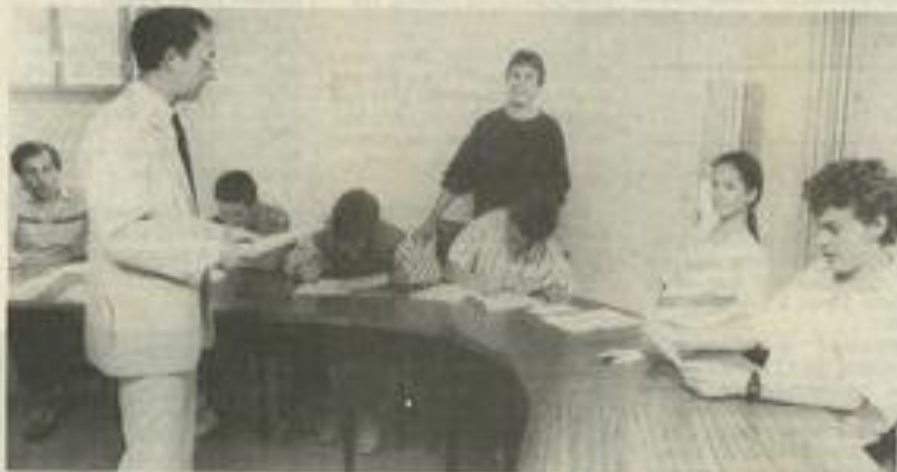
• Un voyage, ça se prépare...

Touristique enfin : visite de Brême et de Hambourg, visite d'entreprise (fabrication de