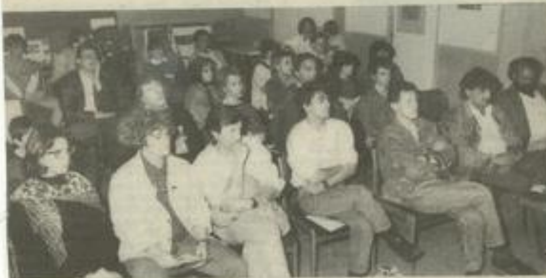
● Des humains face aux... humanoïdes.

Il ne serait pas le seul à avoir été victime de cette mystérieuse attaque... Un frisson passe.