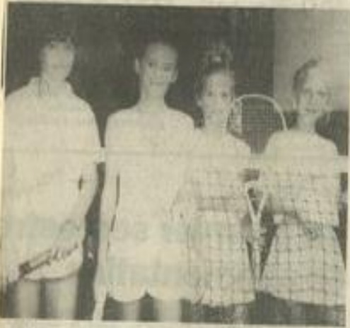
• Les "poussines" : gracieuses finalistes...

Ce tournoi de l'été s'est terminé hier soir par une grande fête du Tennis-club Lézignais.