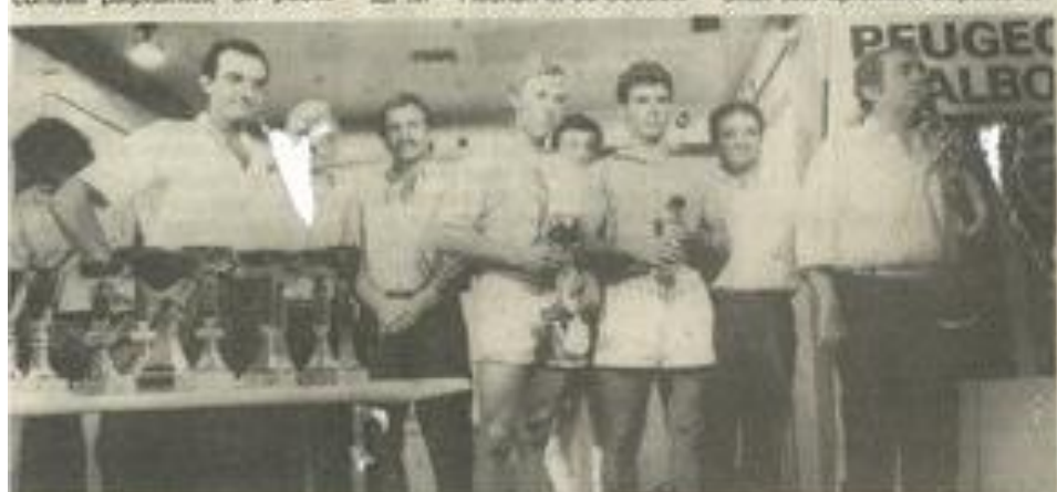
• Les champions "Messieurs"