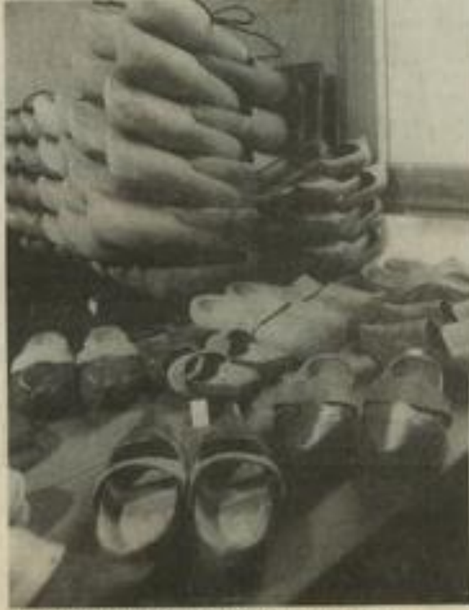
● Le côté bucolique de la foire des artisans...

Mais, décidément, ce n'était pas le même genre de visiteurs : Lézignan et Olonzac, ce week-end, c'étaient deux mondes différents !