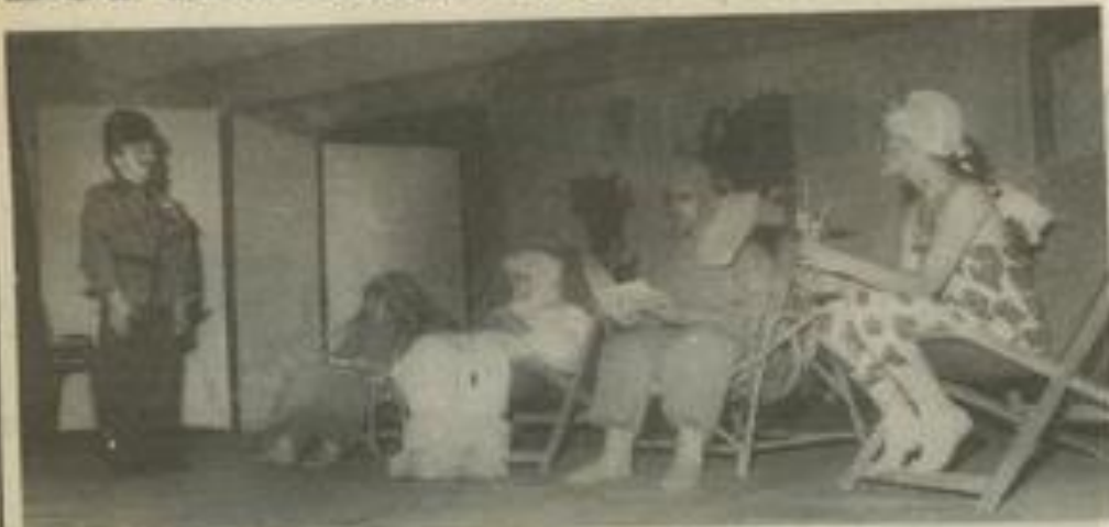
• Des animaux en conférence.