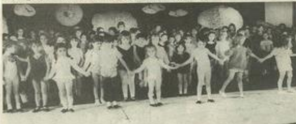
• Les petits acteurs sur la scène