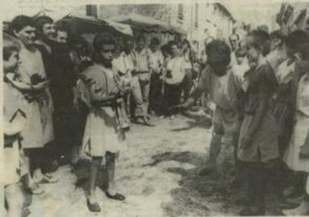
• Dès aujourd'hui à Villerouge : la fête médiévale.

Les repas sont aussi spectacle : leur mise en scène en sera différente et amplifiée. Le choix des plats sera plus étendu grâce à des recherches menées en Catalogne sur des recettes et tradi-