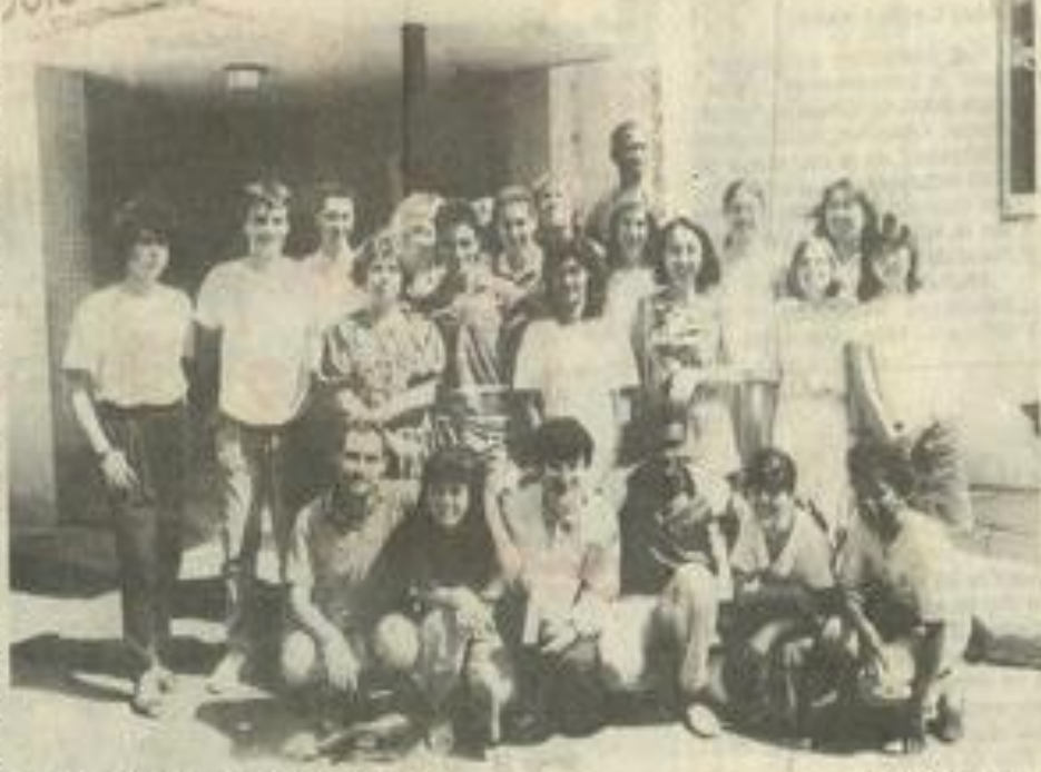
• Des stagiaires de tous les pays.

Au programme des réjouissances de ces prochains jours: Quiribus et Peyrepertuse, Notre-Dame des Auzils, l'aménagement du littoral (Grissan), le musée de la vigne et du vin, et visite d'une cave coopérative, abbaye de Lagrasse, le château de Puvert et la blanquette de Limoux, l'abbaye de Fontfroide et la Narbonne romaine et gothique, l'CEI doux... Des visites