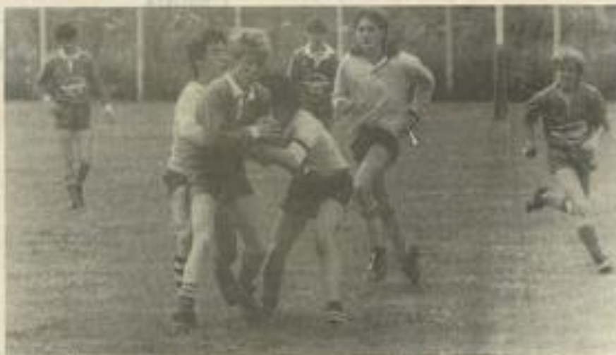
• Une phase de jeu