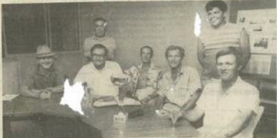
• Les modélistes lézignais réunis.

Ce sera l'occasion d'une démonstration d'aéromodélisme sur le terrain d'aviation de Lézignan, les vendredi 5 et samedi 6 août prochains, avant l'opération de réduction, c'est-à-dire la spécialité des deux clubs.