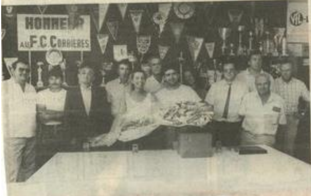
• Les jeunes époux ont reçu cadeau et fleurs.