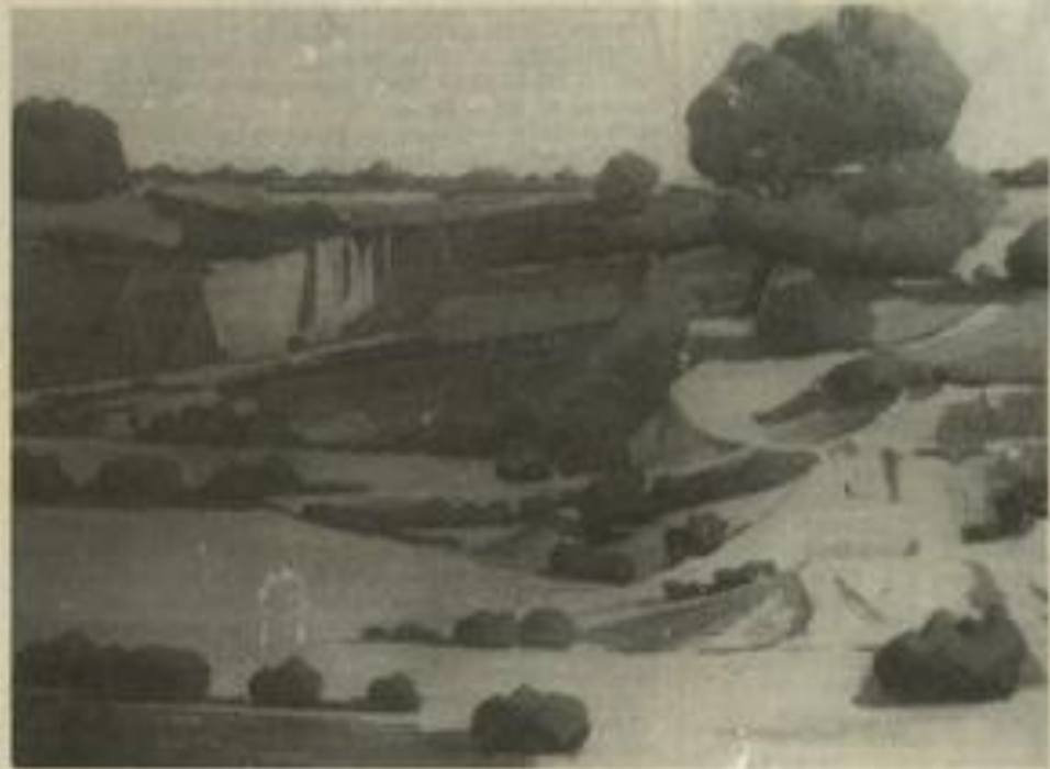
• Une des œuvres exposées

Et c'est avec Paul Eluard que le président termine son intervention : "une fraternité vint le peintre aux individus qui sont, sinon atteints de cécité mentale du moins incapables trop sou-