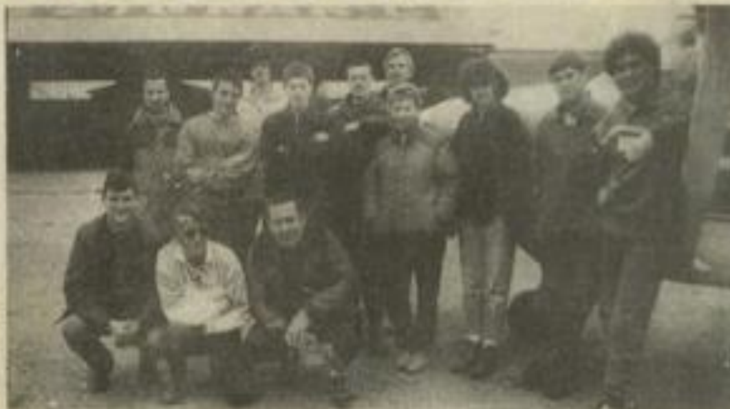
● Bientôt prêts...