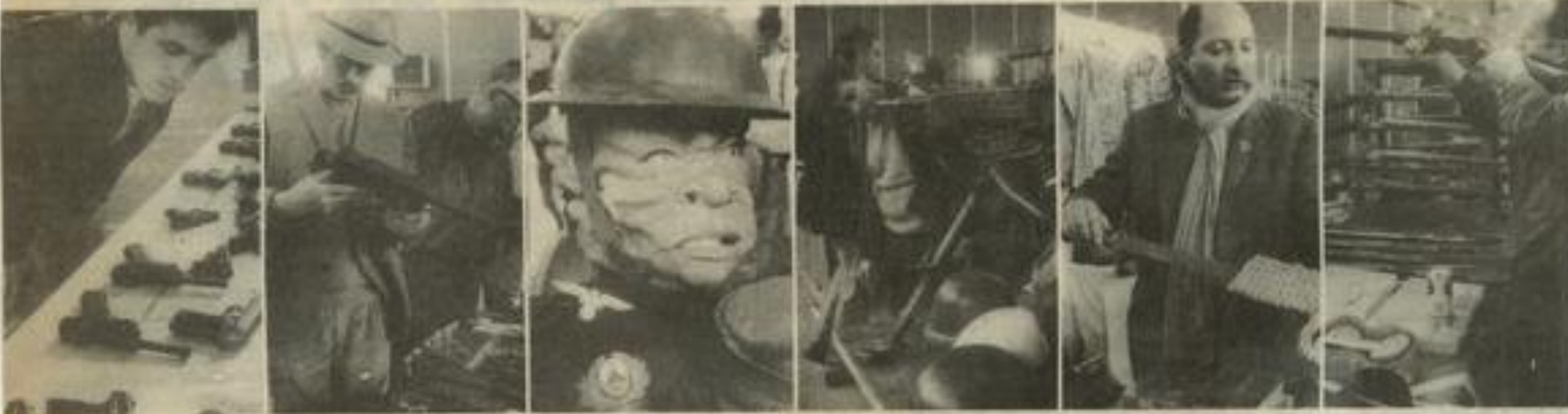
● L'insolite et la curiosité au rendez-vous d'Armadoc.

Quel point commun y a-t-il entre les fleurs séchées de cet artisan du Palais des fêtes de Lézignan et la mitrailleuse de la Première Guerre mondiale au gymnase d'Olonzac ?