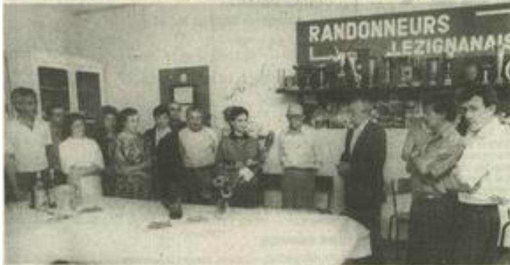
Les randonneurs dans leurs murs