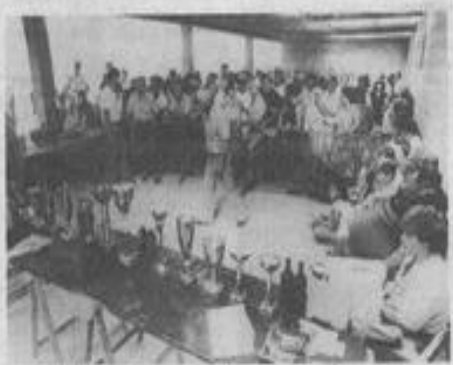
• Le plein de coupes et de vin.