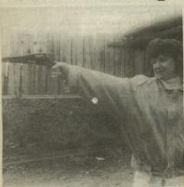
• La poudre a parlé... avec le sourire.