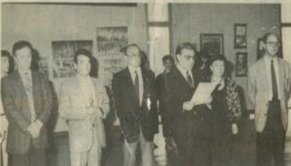
• Des élus amateurs d'art