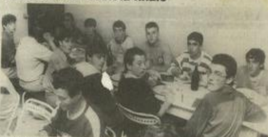
• Les cadets sur la route de la finale