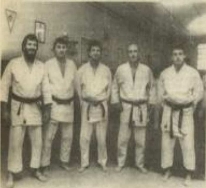
• Le nouveau président entouré des cadres du J.C.L.