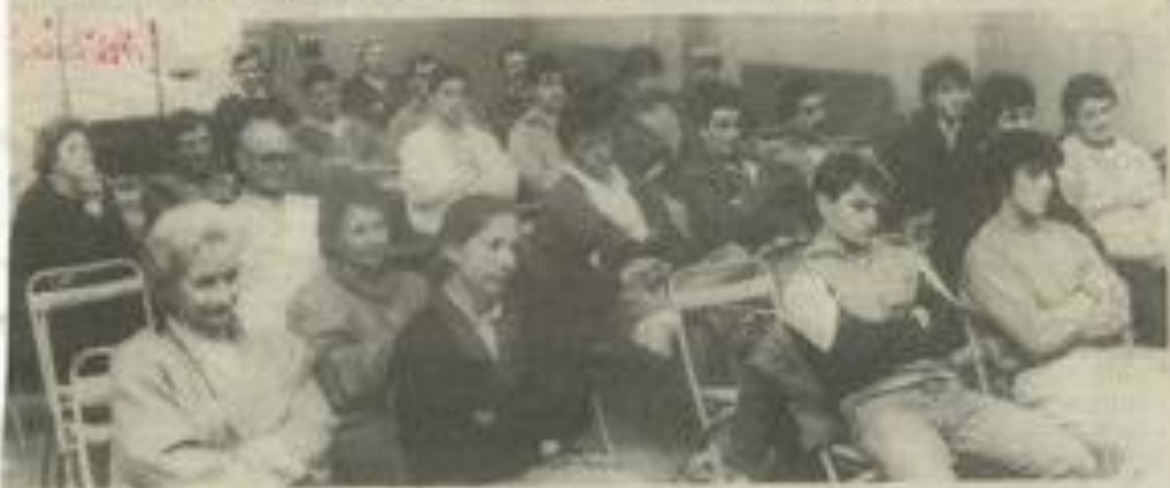
• A la Maison des jeunes.