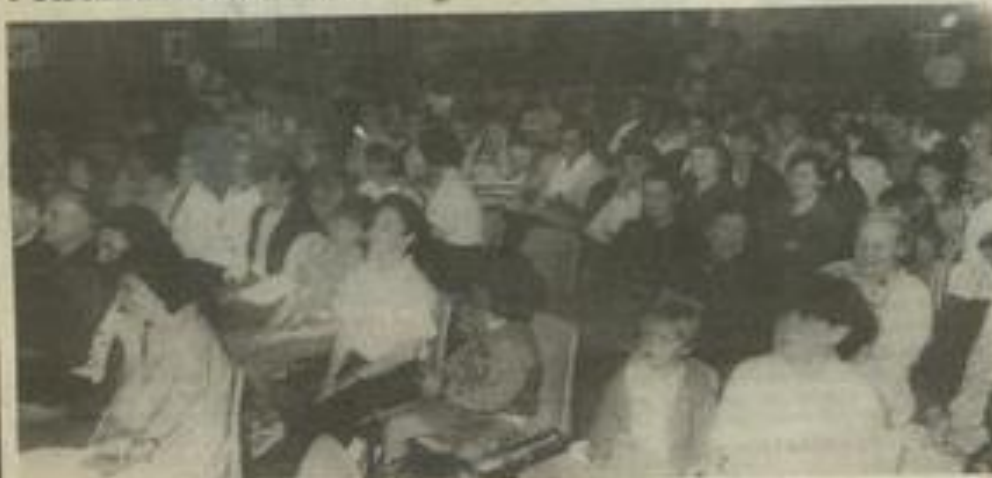
• Le public à Luc.