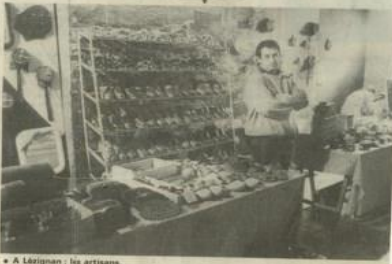
• A Lézignan : les artisans.

Un rendez-vous à ne pas manquer à l'initiative de la M.J.C.