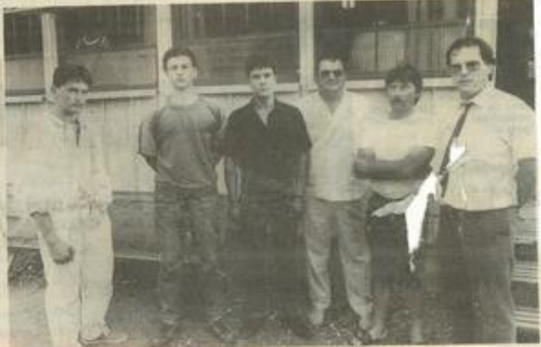
• Les nouvelles recrues du club.