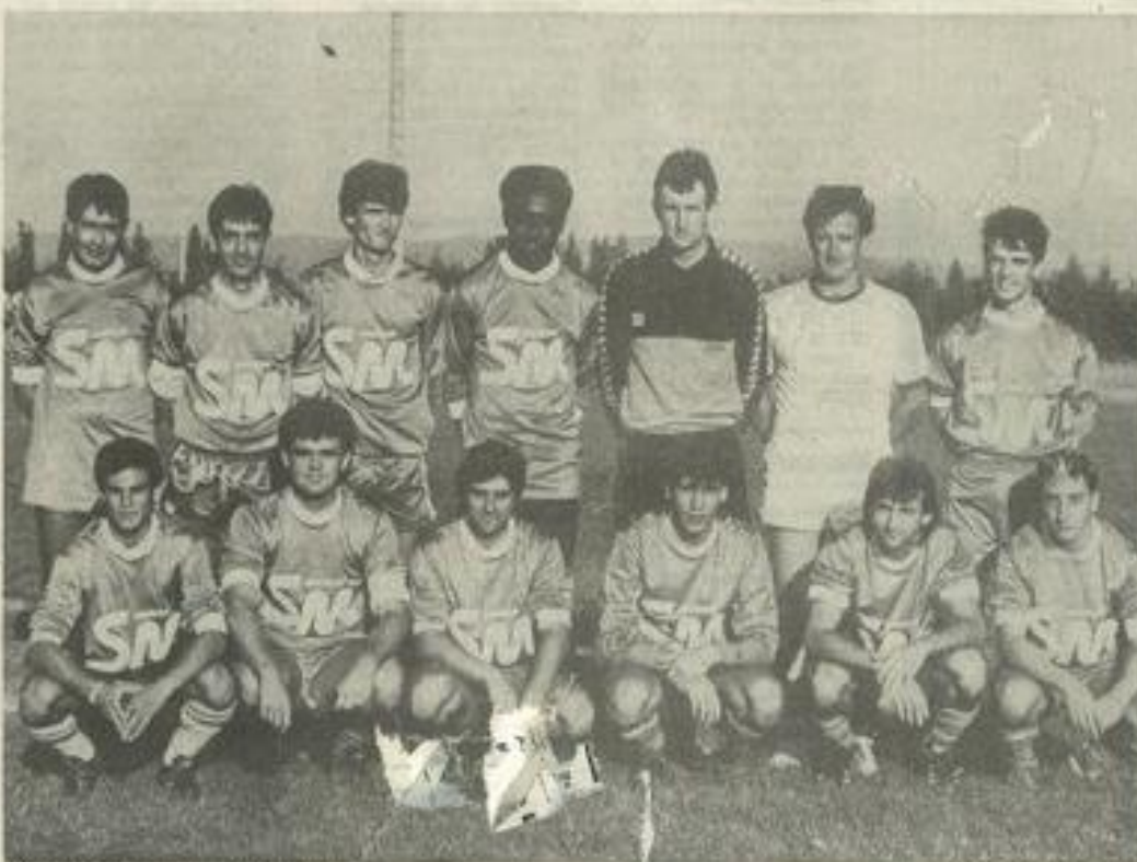
• Tous prêts pour une nouvelle saison.