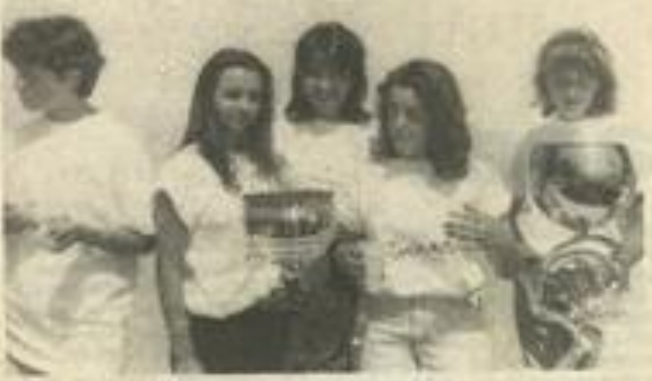
• C'est le charme du tennis léznignais.

Les résultats : - Hommes : 1 er tour 4 e série :