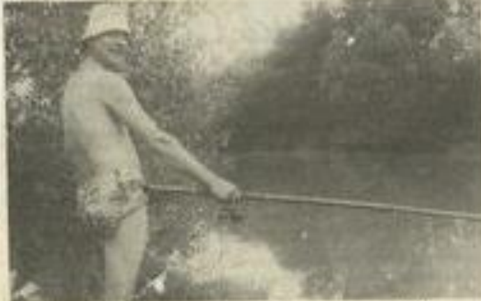
• Même si le poisson est rare... gardez le sourire !