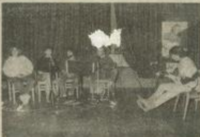
● Au service du texte

effet, pu le retrouver à travers une exposition de disques et de documents (hélas, photocopiés!) retraçant sa brillante carrière! "Brassens et le jazz", des photos du Sétois en compagnie de Clark Terry, Joe Newman, Lionel Hampton... etc. "Brassens et ses chats", "Georges et ses copains de Sète", "Georges dans son unique film: "Porte des Lilas" de René Clair tourné en 1956, Brassens en famille, sur scène, à Sète... etc... Samedi soir, quelques-uns des "copains d'après" ont offert un récital d'une vingtaine de chansons de ce grand bonhomme: "Les copains d'abord", "Cupidon s'en fout", "Les bancs publics", "J'me suis fait tout p'tit", "Le gorille"... Des textes éternels pour un public qui n'a pas oublié.