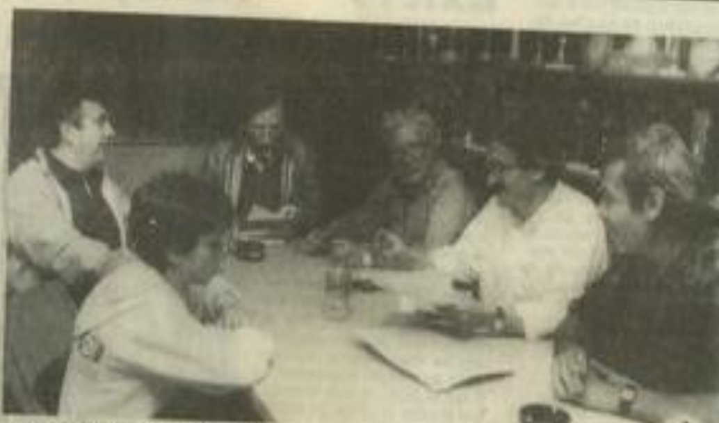
• Les footballeurs : pas contents...

Donc nous le répétons, voilà notre fête gâchée par le manque de sportivité envers les clubs d'une même ville.