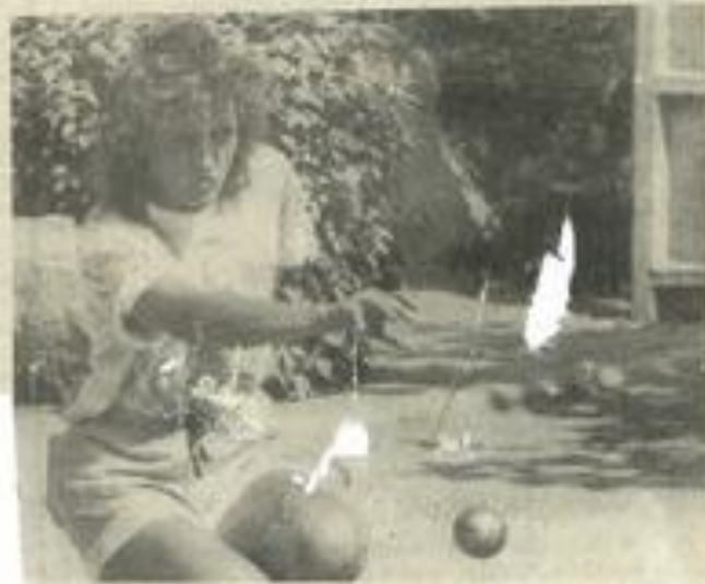
Tout est dans le regard

Enfin, la finale, agréablement disputée comme le score du 13 à 12 en témoigne, a été remportée par l'équipe Boulet face à l'équipe Brun. Bravo à toutes et à tous, et coup de chapeau à l'organisation sans faille de ce national !