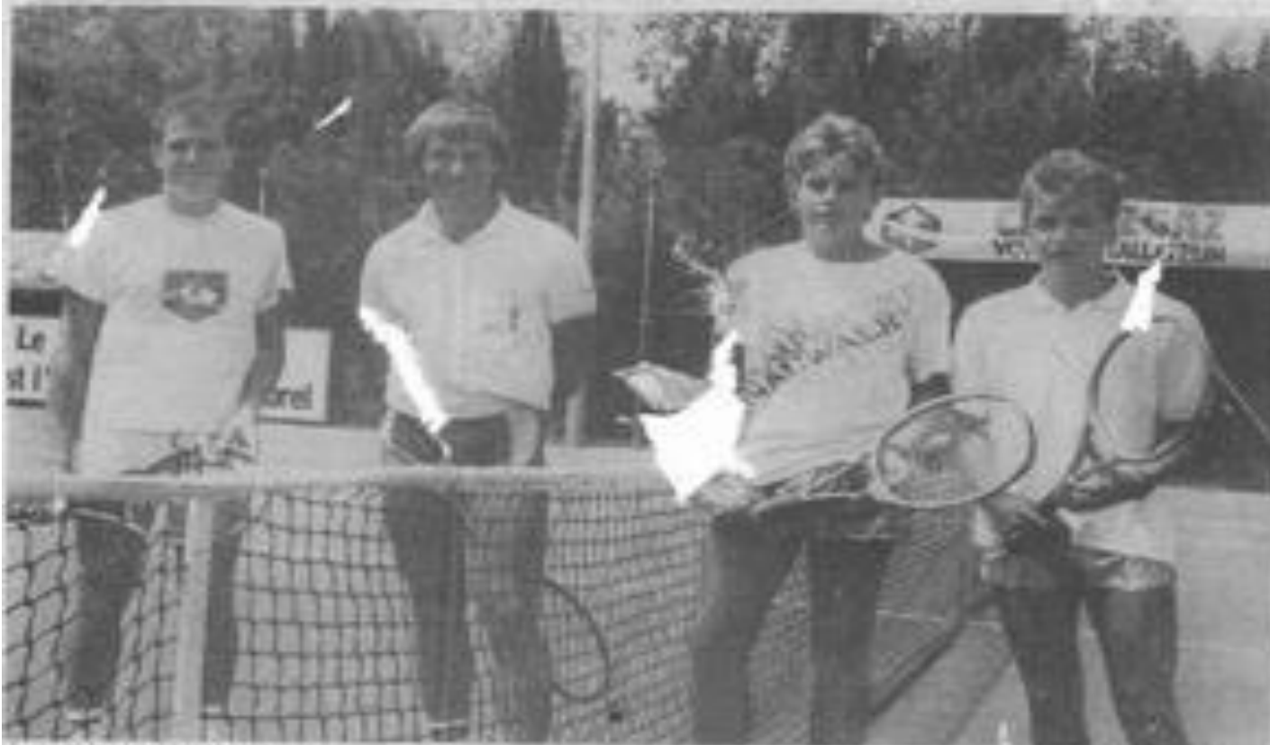
• Les locaux en force

D ERNIER point avant les finales de vendredi, dans les diverses compétitions, nous en sommes au stade des demi-finales.