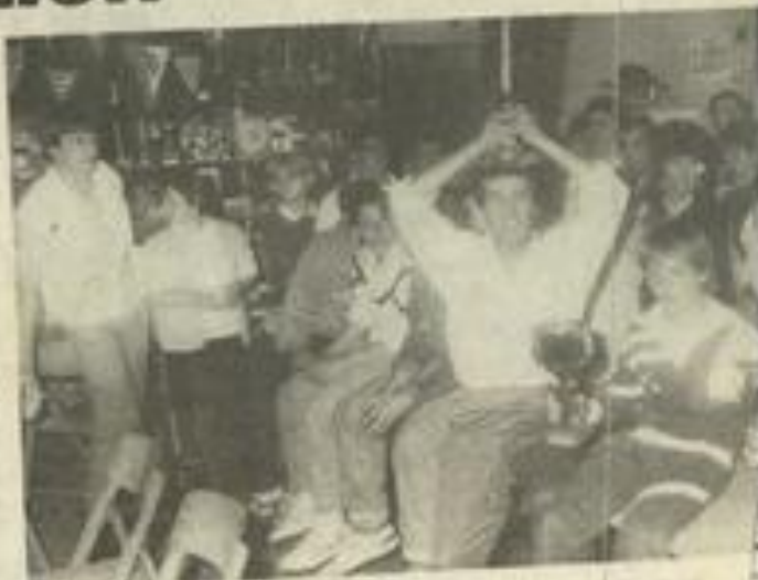
Bon week-end de foot pour les jeunes et les adultes.

Le tournoi de la Pentecôte a obtenu son succès traditionnel aussi bien du côté des jeunes footballeurs que de leurs aînés. En ce qui concerne les jeunes, pupilles et minimes, les débats ont été particulièrement intéressants et ont vu triompher respectivement Lézignan et