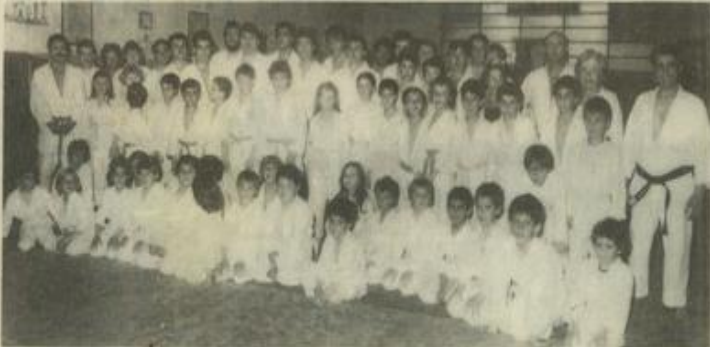
• Les judokas lézignonnais réunis sur le tatami.

traîneur. Le buffet était dressé, les élèves en kimono profitaient de la présence d'un public nombreux pour faire admirer la