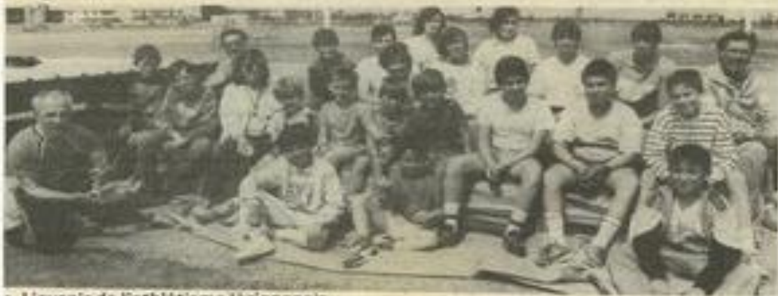
• L'avenir de l'athlétisme lézignanois.