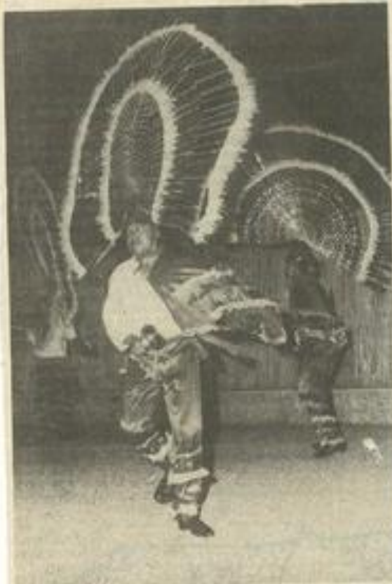
Rythmes et danses mexicains.

Quetzacoatl, au Mexique signifie "serpent emplumé". Un animal mythique mi-oiseau, mi-serpent à qui l'on prête d'immenses pouvoirs. Il est à la fois le dieu de l'air et le dieu de l'eau, l'animateur de la nature et l'inventeur des arts et des techniques. Ce personnage de l'époque précolombienne a donné son nom à la troupe de