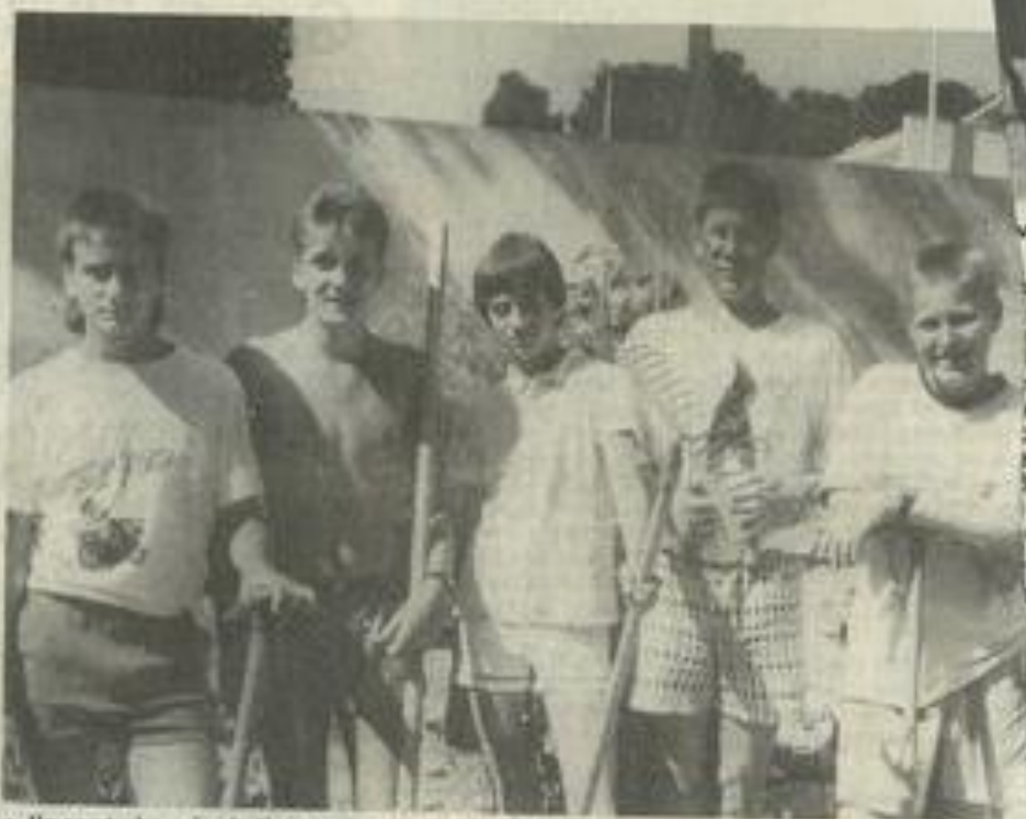
• Ils sont chargés de l'entretien du club pendant le tournoi.

3 e série hommes: Jorge bat Attard 6/1, 7/5. Proxi bat Diaz 6/4, 6/2. Gimenez bat Bousquet WO.