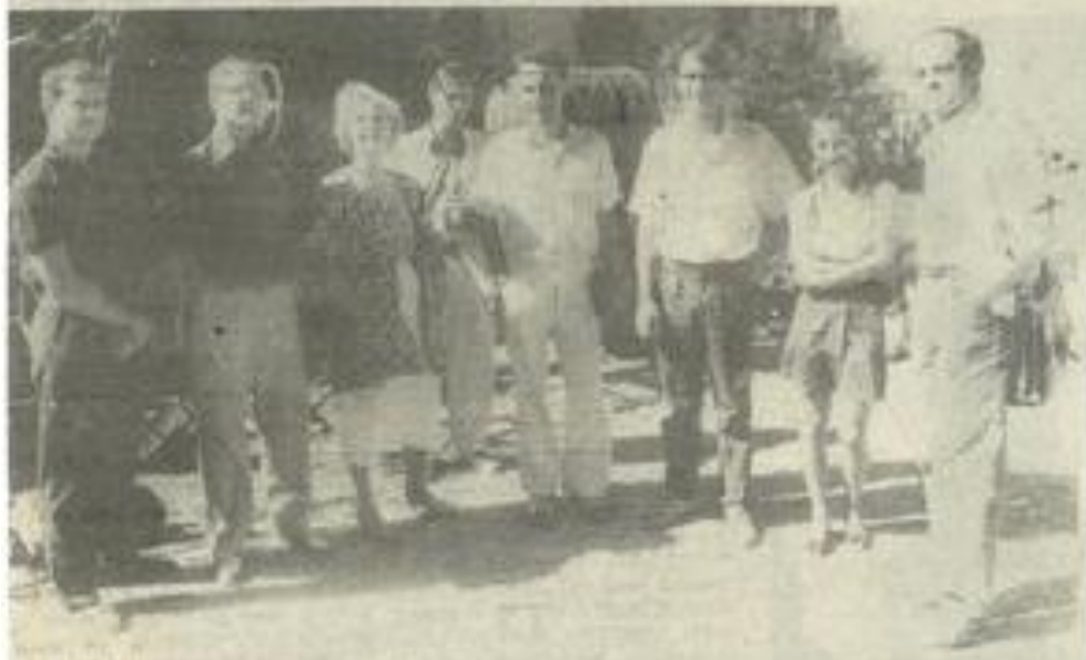
• Les "Berlinois" préparent déjà la troisième exposition.