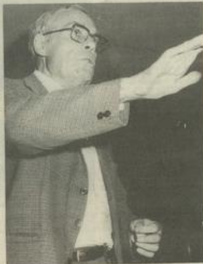
● Lui y croit...