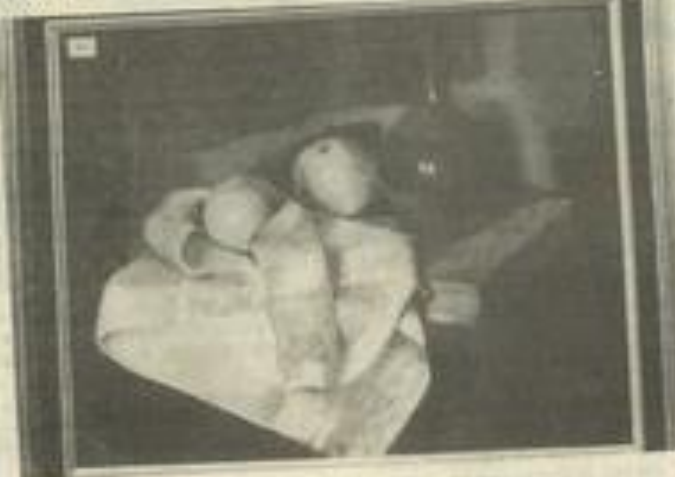
La nature morte de Jean Person qui a remporté tous les suffrages.