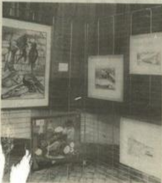
• C... es-unes des toiles exposées dès ce soir

Avant le vernissage, les amis des arts tiennent à remercier le personnel municipal et celui de la MJC qui "par leur compétence, volonté et bonne humeur ont aidé à l'organisation de ce Salon.