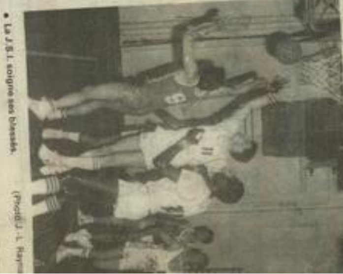
• La J.S.I. soigne ses blessés.