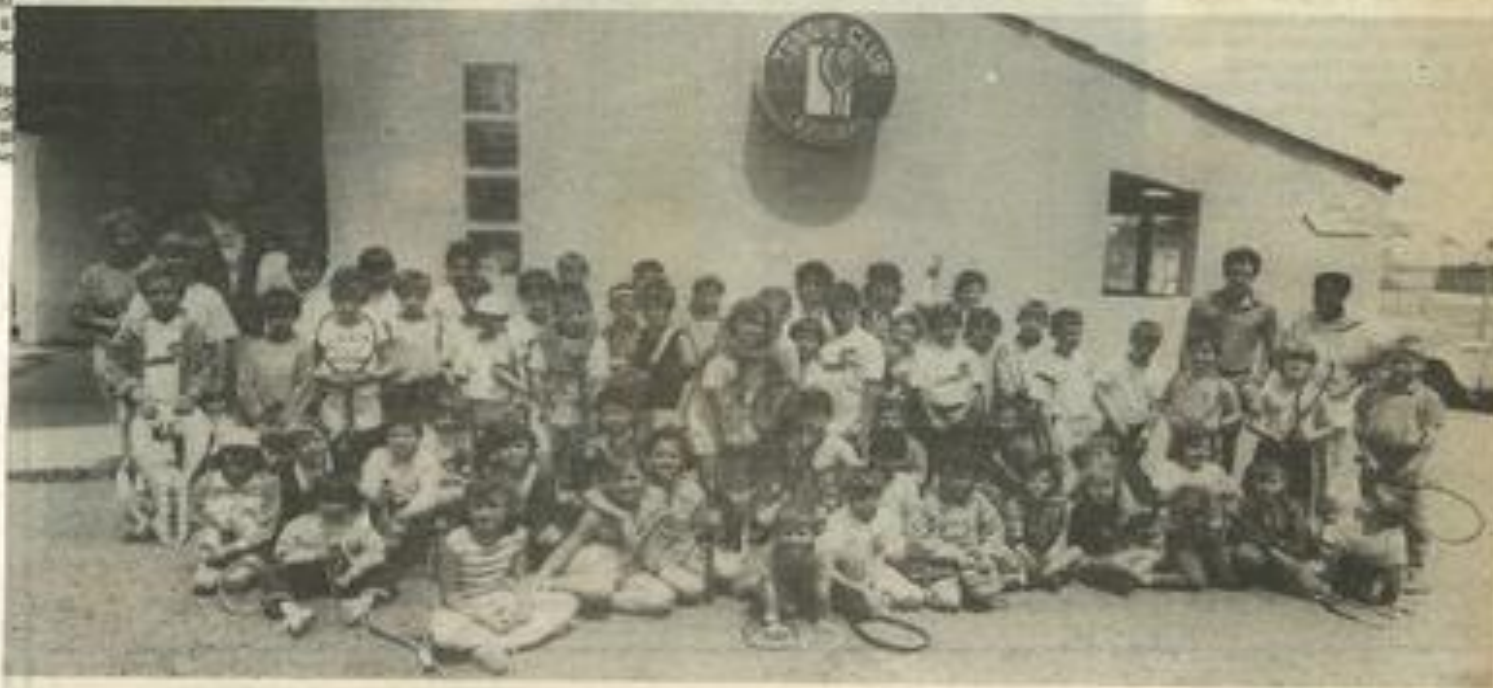
• La fête des enfants.