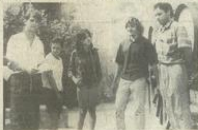
• Quelques artistes du Languedoc-Roussillon et de Midi-Pyrénées.

Ils vous donnent rendez-vous à partir de samedi prochain. Jusqu'au 20 octobre !