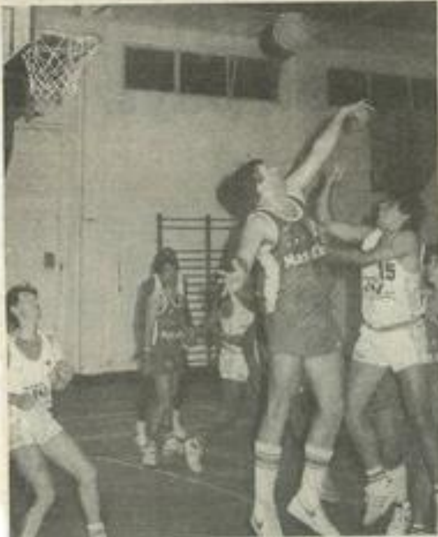
• Un rythme soutenu et de belles envolées sous le panier.