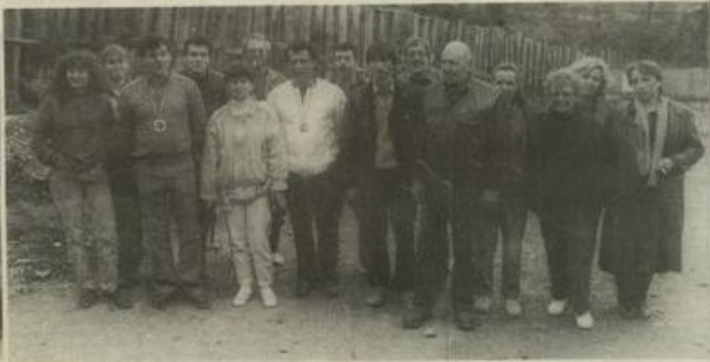
• Les participants à ce concours de tir.