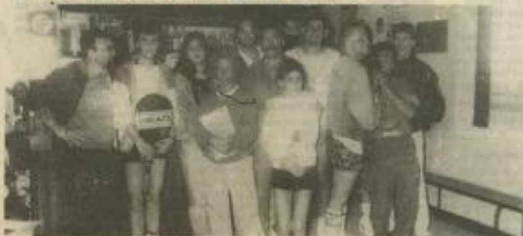
• Les gagnants au club-house