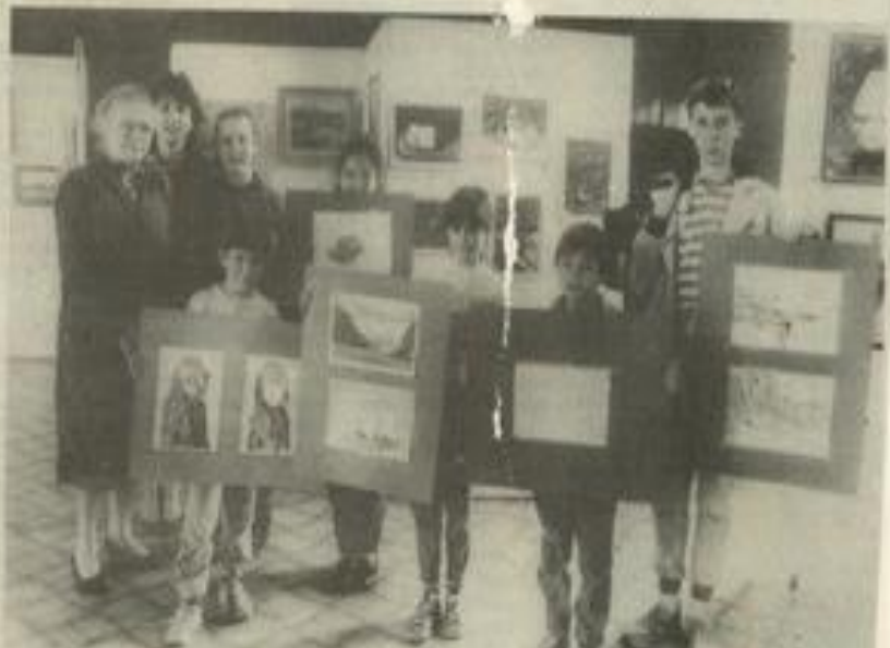
• Jeunes artistes...