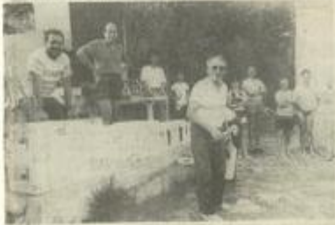
• A l'heure des récompenses.