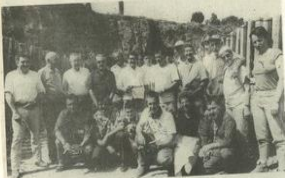
• Tous des passionnés !