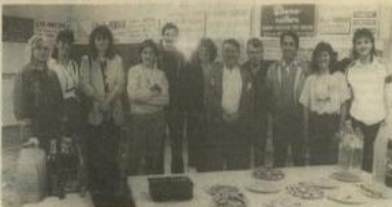
• Pour remercier les mécènes.

"Sponsor ! Le mot est lâché, ajoutait le président, c'est le mot-clé du sport de l'an 2000. Pour ma part, je préférerais mécénat au bénévolat, mais les bonnes volontés s'épuisent, s'étiolent et disparaissent. Vous, il vous a fallu allier le cœur du sportif et le cœur du mécène. Un peu trop souvent sollicité mais jamais délaissant puisque vous êtes là et, très