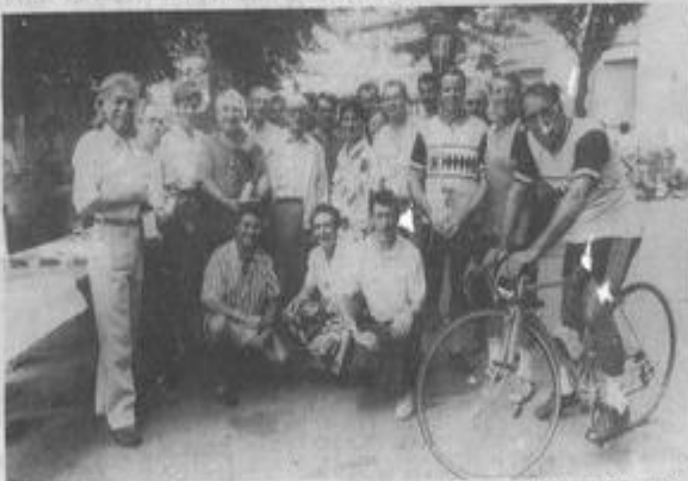
• Les cyclos, côté jardin...