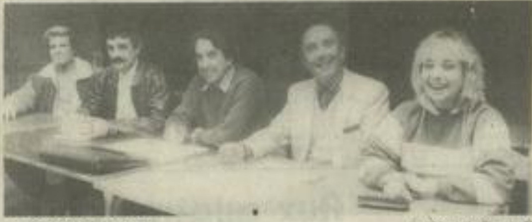
• Les dirigeants du club.