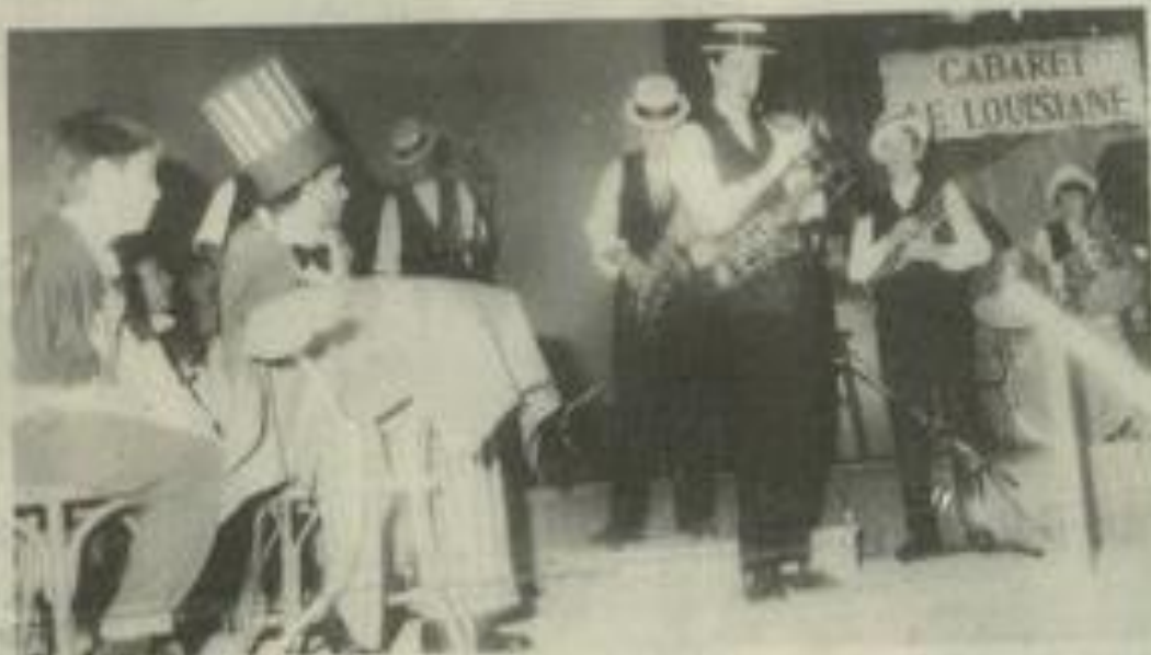
Voyage en jazziland