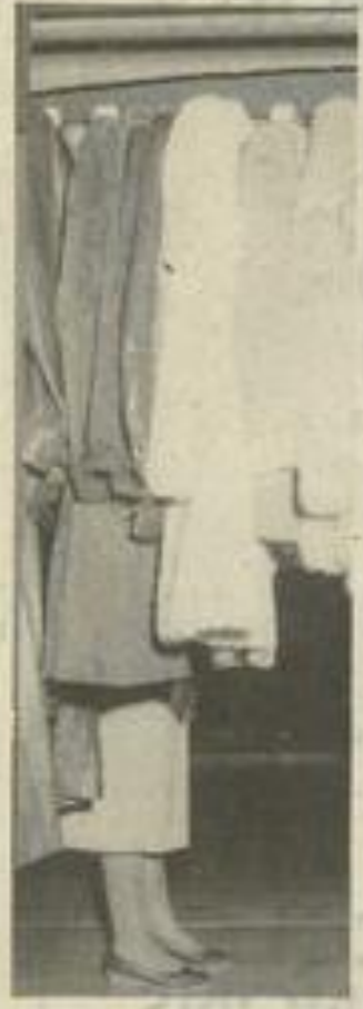
Même incognito, les dames purent faire de bonnes affaires.