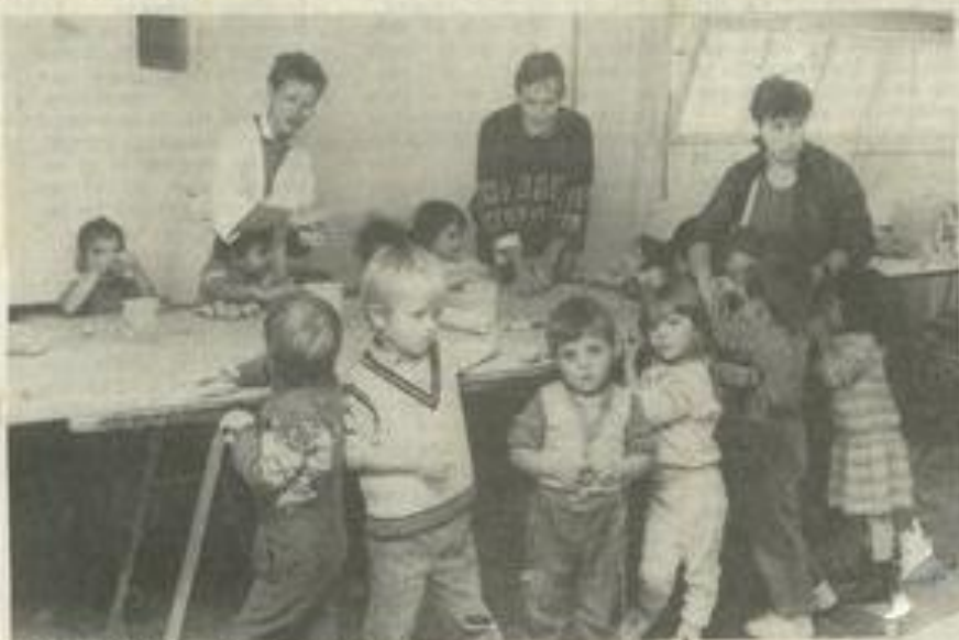
• Les bambins intéressés par la poterie.