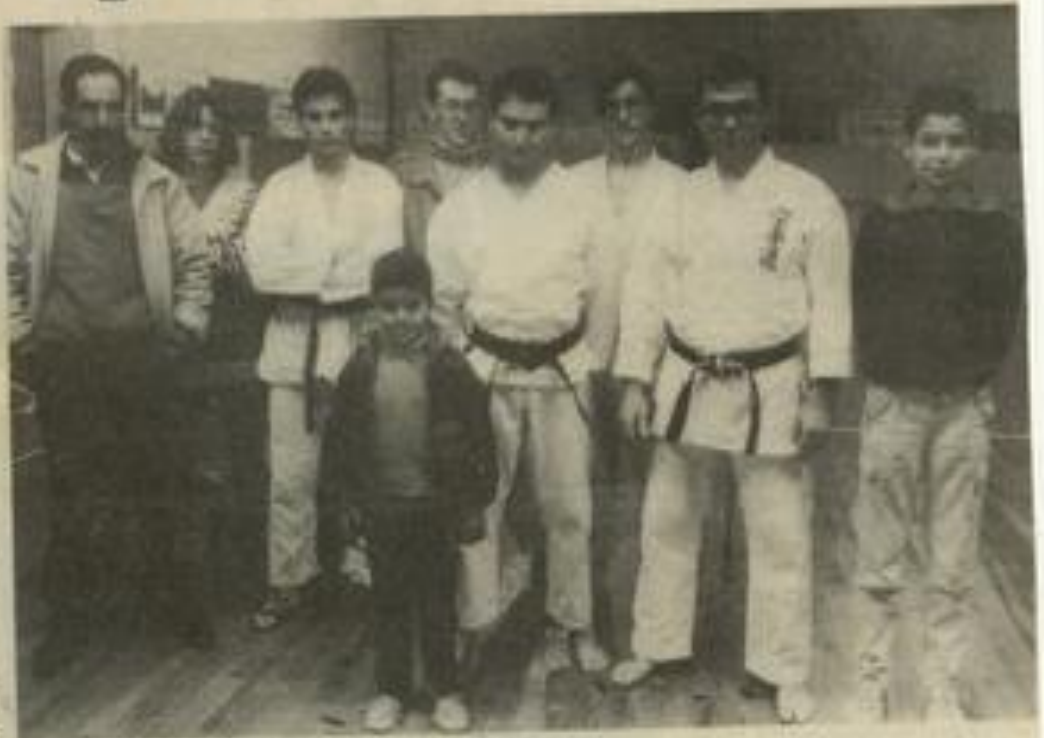
• Les premiers participants du karaté léznagnais

Nous allons maintenant essayer de faire redémarrer cette activité sur des bases plus conformes à la fédération de half-court, s'il en existe une. Sinon en fonction des directives de la fédération de tennis, il existe, paraît-il, un championnat de France de cette spécialité. Si c'est le cas, Léznagnan peut trouver une