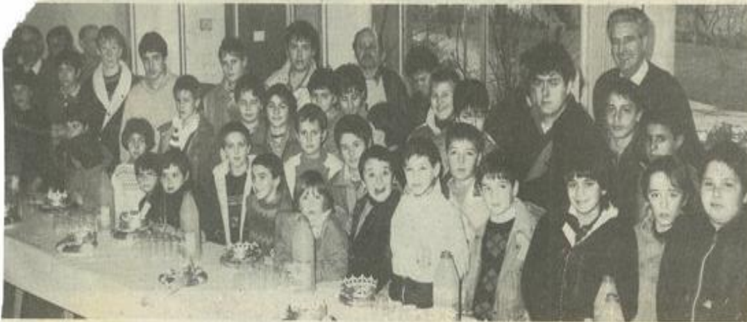
● Les jeunes treizistes couronnés.