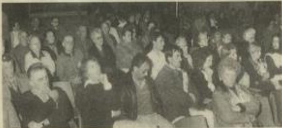
• Pas beaucoup de jeunes dans la salle...