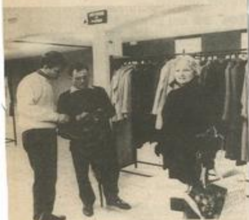
• Côté vêtements : un petit essayage.

Ils avaient déjà fait une apparition lors des dernières kermesses de l'inutile mais cette fois ils ont acquis droit de cité : la bourse aux vêtements est une réalité.