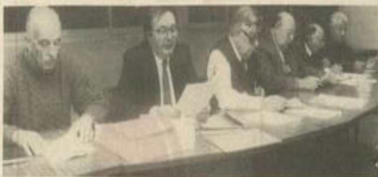
• Le bureau