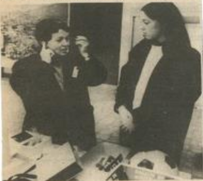
• Côte jouets : un walkman... qui marche.