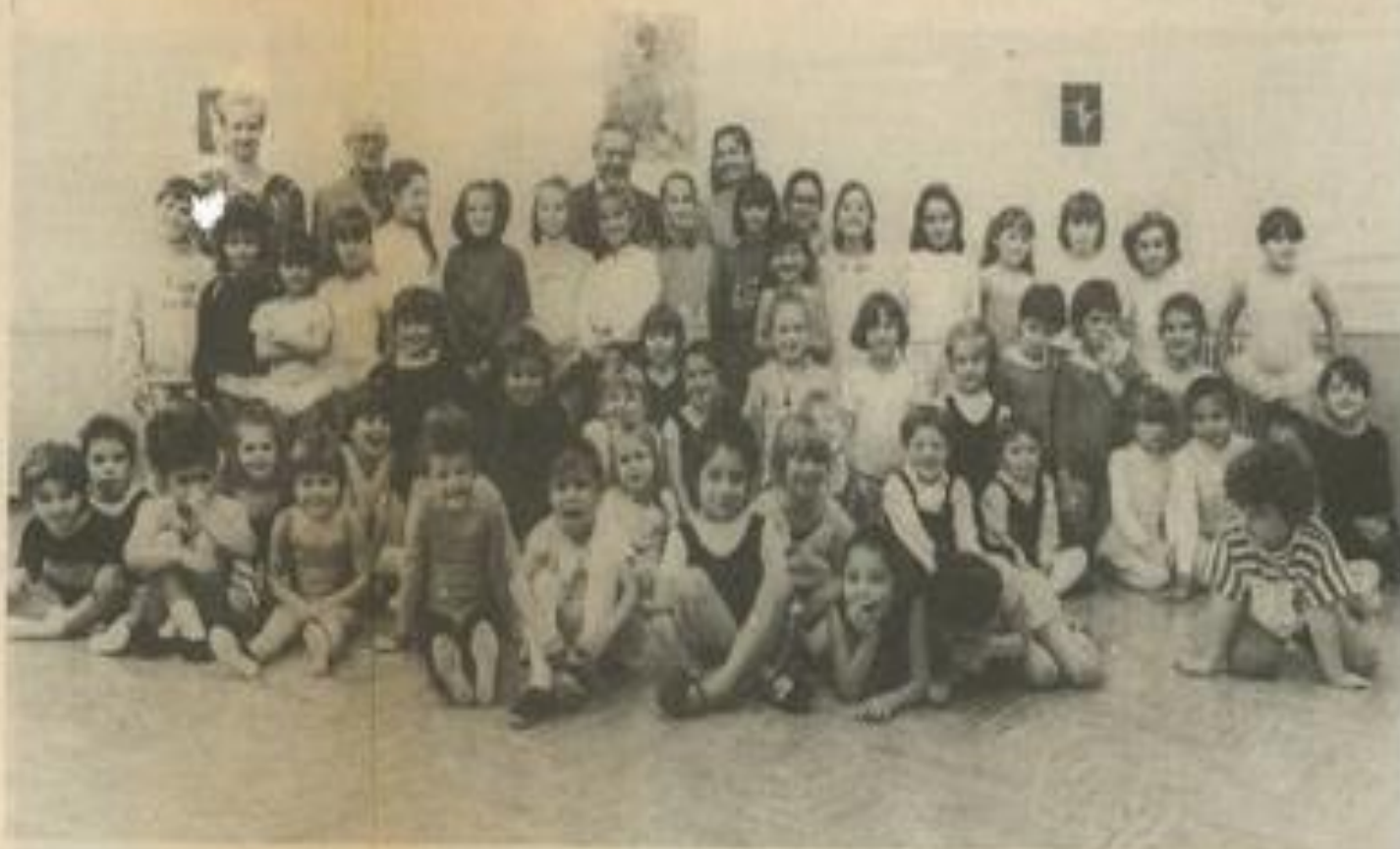
• Les petits rats...

Bien sûr, les cours sont divisés en plusieurs groupes. Il y a les plus petits d'abord, les élèves de 4-5 ans : c'est essentiellement un travail d'éveil, de l'expression corporelle. L'enfant, à partir de choses vues essaye de réaliser des figures