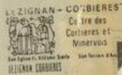
• La flamme lézignanaise.

ont été transportées par le célèbre aviateur disparu en mer à l'âge de 35 ans ! Tout ça de l'aviation.