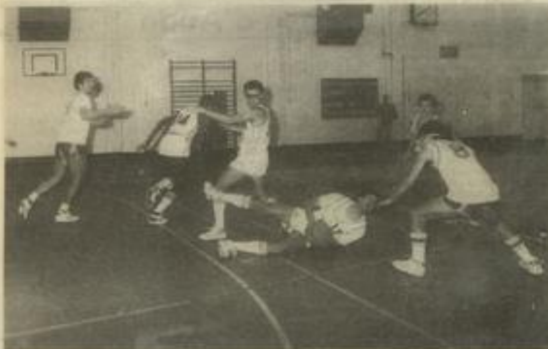
● Les basketteurs lézignanais lors d'un précédent match à domicile

Les basketteurs lézignanais continuent leur série victorieuse. Dimanche matin, ils se déplacent à Maurin. Bien que le score parle de lui-même, les hommes du président Chapeau n'ont pas réussi une super prestation. Les rencontres du matin ne leur sont guère favorables et il leur est toujours difficile de rentrer dans le match. Tout d'abord des absents qui nuisent au rendement collectif de l'équipe et d'un autre côté les faiblesses de l'équipe adverse. L'incorporation progressive des jeunes qui, s'ils progressent régulièrement, sont encore loin du top niveau des anciens. Durant la première mi-temps