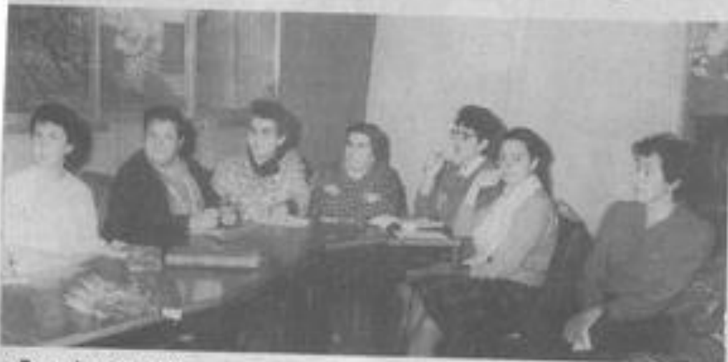
● Des mères attentives.