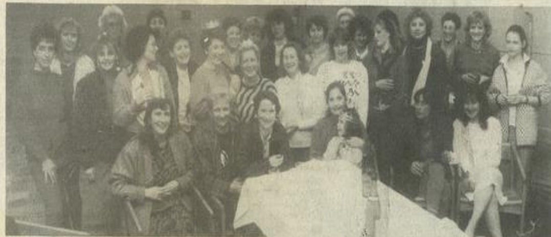
● Le G.V. avec le sourire.