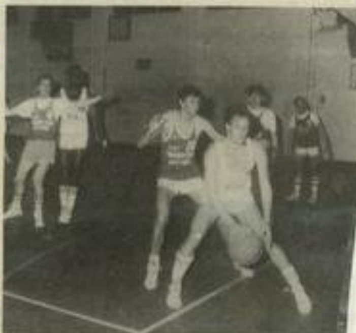
● Encore une victoire...

En général les Lézignonais sont rarement au top le dimanche matin, mais le calendrier est ainsi fait, de toute façon l'effectif est suffisamment riche en quantité et en qualité pour espérer deux nouvelles victoires.