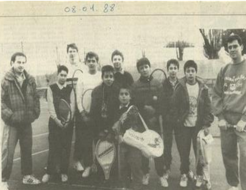
● Des tennismen en bleu...

consolantes. Les rencontres se déroulent obligatoirement en 9 jeux (2 jeux d'écart, tie-break à 9-9). Le championnat sera doté de plus de 3000 F de lots avec survêtements pour les vainqueurs. Tous les gagnants seront récompensés dans chaque division et finales de consolantes. Dans la mesure du possible, respectez le calendrier. Prévenez vos partenaires en cas d'absence. Les W.O. seront pénalisés.