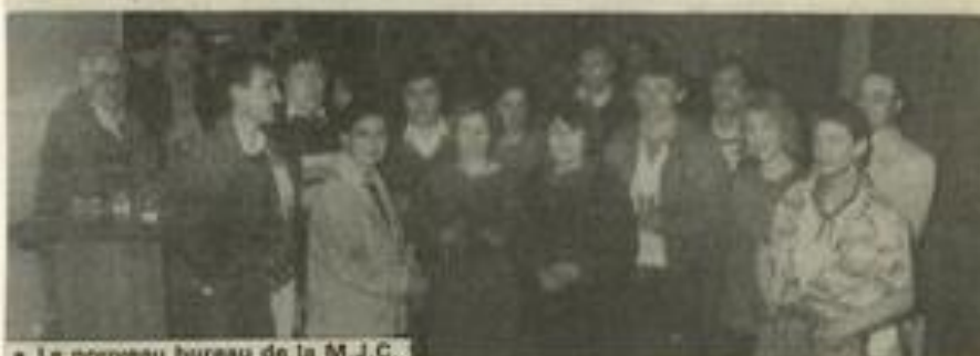
Le nouveau bureau de la M.J.C.

PAS de bouleversement dans la composition du nouveau bureau de la Maison des Jeunes (on ne change pas une équipe qui gagne !) qui se re-groupe cette année encore au-