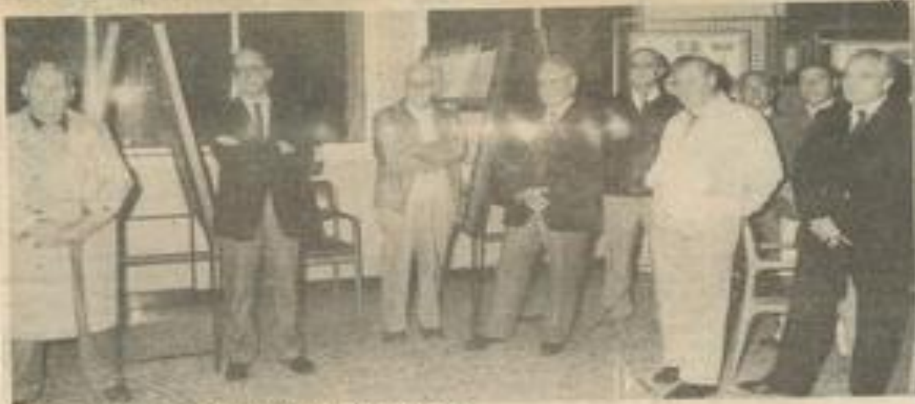
• La présentation de l'exposition à la M.J.C.