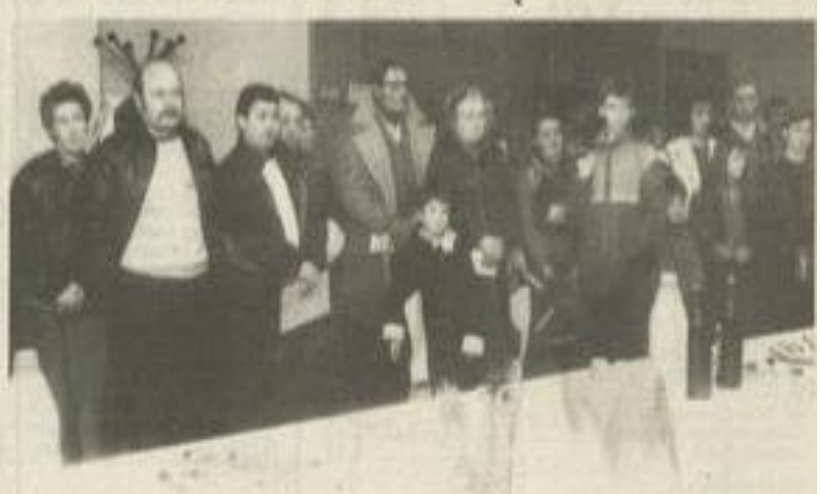
• Parmi les responsables de sections