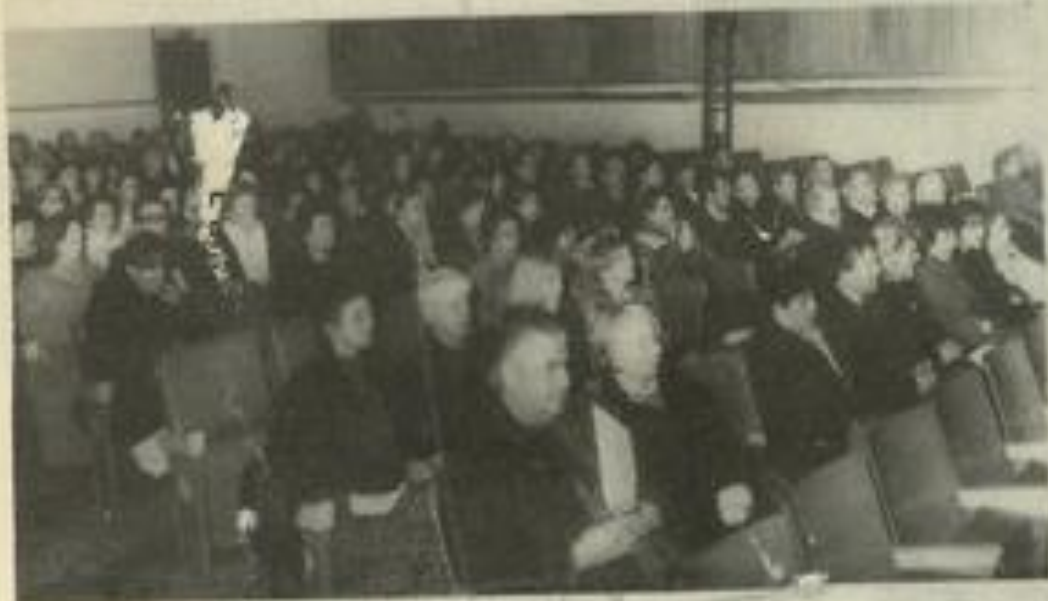
Il y en a encore au balcon