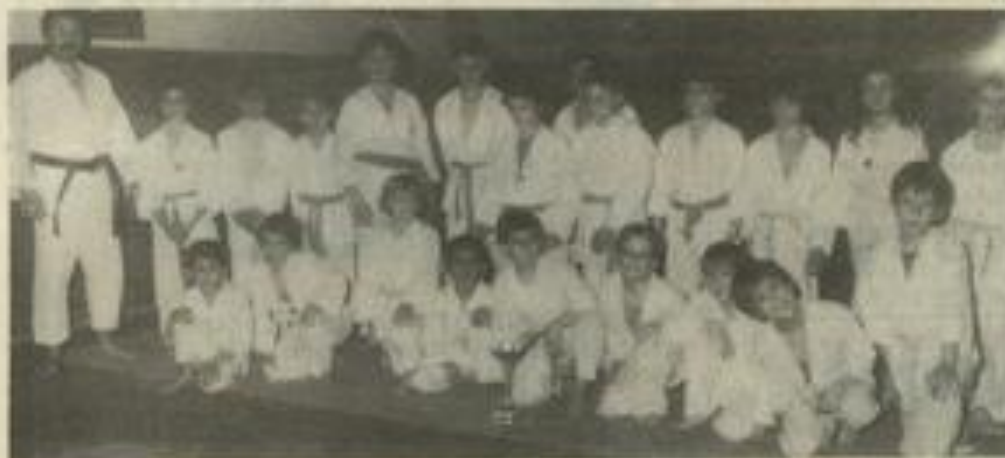
● Des récompenses pour les judokas lézignanais.