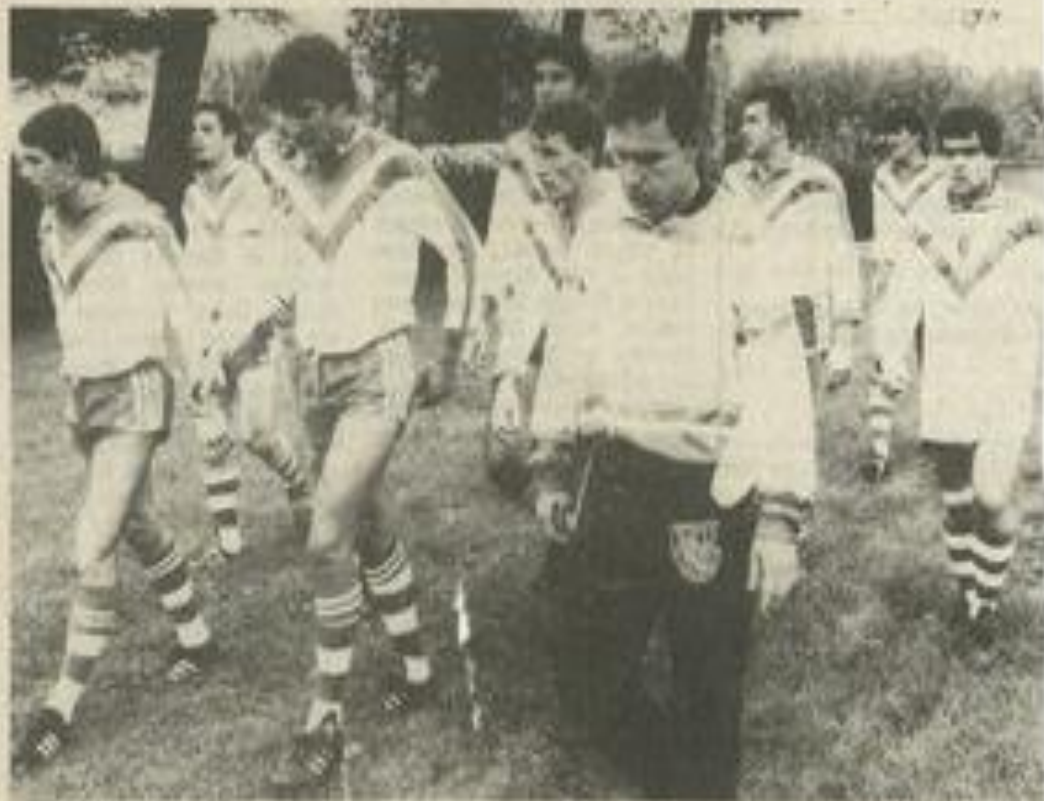
• Avant un match, les Perpignanais sont pensifs.

Dès ce matin au stade de la Roumiquière pour le compte du championnat de France de leur catégorie, les minimes face à St-Nazaire et les cadets (invaincus depuis le début de la compétition) face à Saint-Laurent-de-la-Salanque se produiront. Les supporters sont conviés à venir nombreux, soutenir ces méritantes formations de jeunes. Rendez-vous des joueurs à 9 h 15.