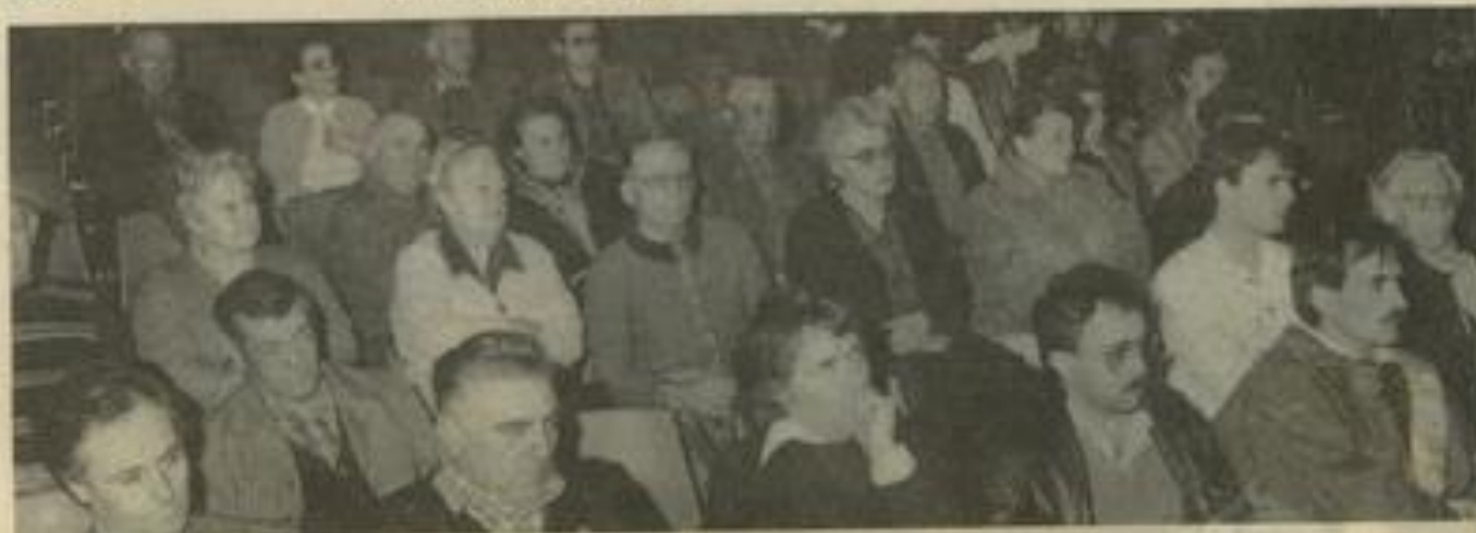
▲ Les responsables des sections, ont rapporté le bilan de leurs activités.

Cette année, les travaux de l'assemblée furent suivis d'une pièce de théâtre (jouée par le T.O.S. de Narbonne) et d'une soirée dansante. Histoire de montrer que la vitalité à la M.J.C. n'est pas un vain mot.