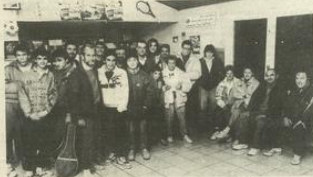
• Les participants à la réunion de lundi

Championnat de l'Aude poussins: Lézignan-Leucate.