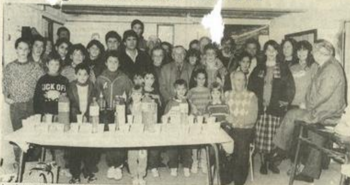
Les tireurs à l'heure des récompenses.