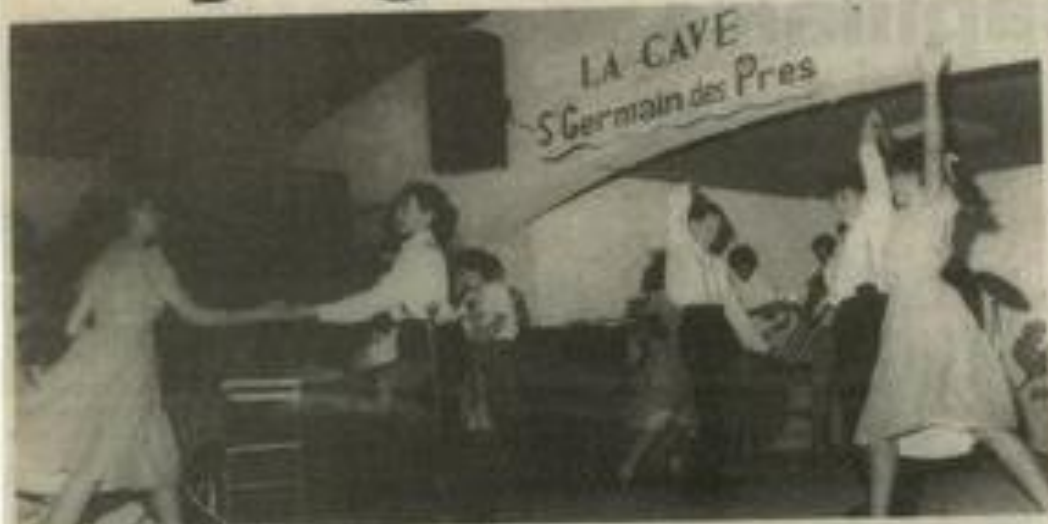
• Vichy "à la B.B." et bretelles "zazou"