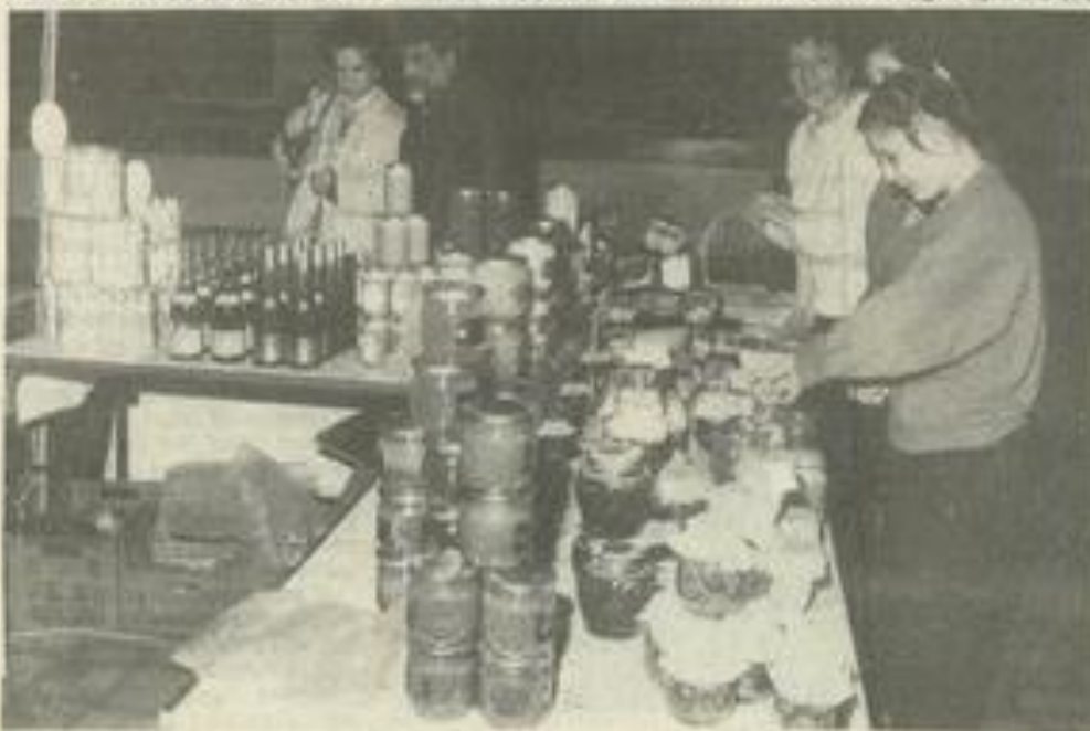
• Bientôt le rendez-vous des gourmands. L'écrivain M. Depestre l'avait apprécié l'an dernier.

Enfin, clou de la manifestation, également pur produit de la région, la présence du Musée des oiseaux de Douzens. Pour la première fois associé à la foire des produits régionaux, le Musée donnera au public l'occasion d'apprécier des spécimens particulièrement beaux. Des oiseaux naturalisés d'Europe de toutes les couleurs parmi les 2500 espèces que compte l'établissement de Douzens. De quoi ajouter incontestablement aux plaisirs de la table, le plaisir des yeux.