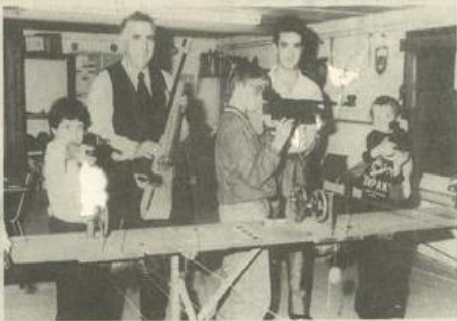
• Des armes de qualité à l'école de tir

La cible, à 10 m, n'est pas bien grande : 9 centimètres sur 8, avec un "dix", c'est-à-dire,