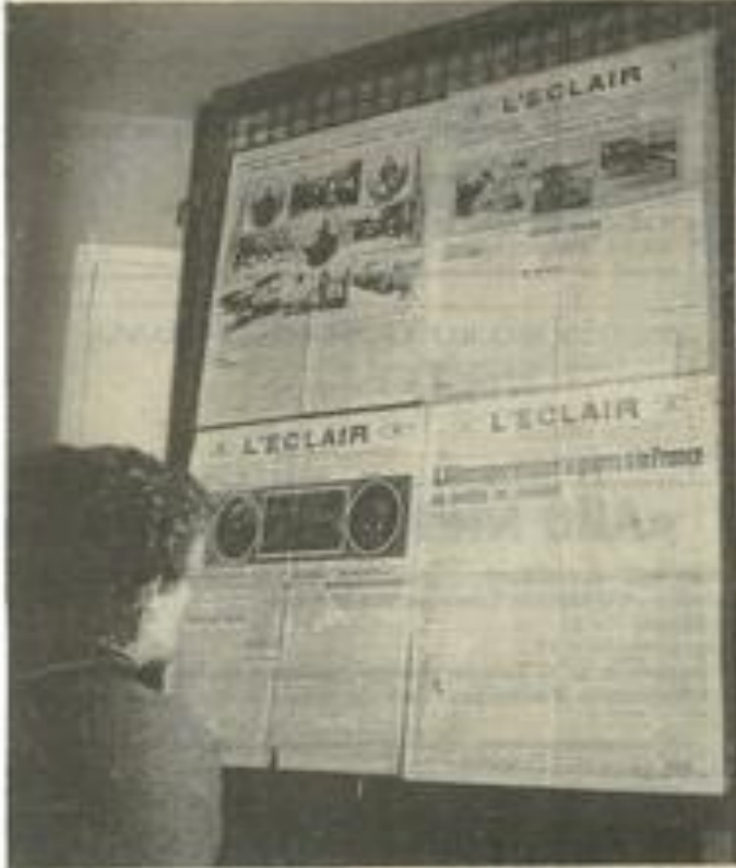
Une large part est faite aux journaux de l'époque.

Une exposition sur la Grande Guerre est actuellement accrochée aux cimaises de la M.J.C.