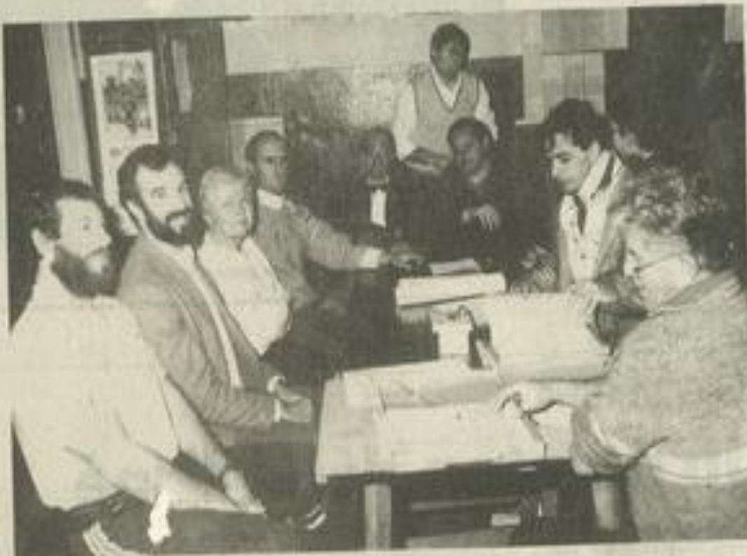
• Des projets en perspective.