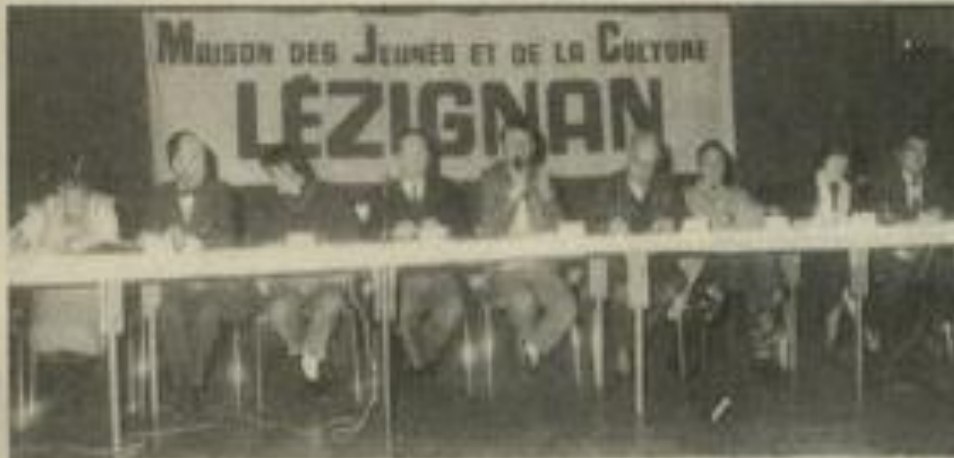
• Un C.A. pessimiste.