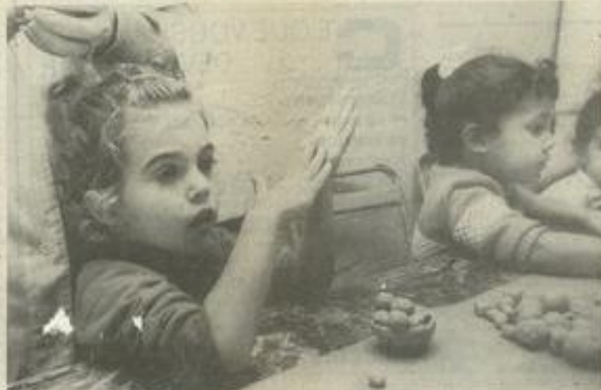
• Je roule, tu roules, il ou elle roule l'argile.