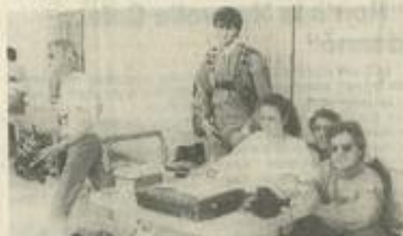
• A la table de contrôle