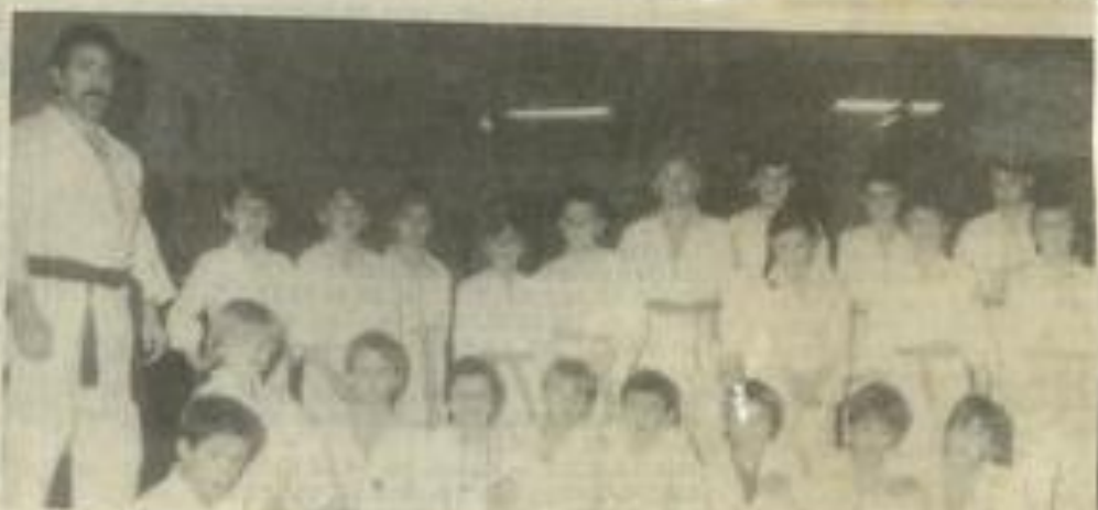
• Les médaillés du Judo-club.