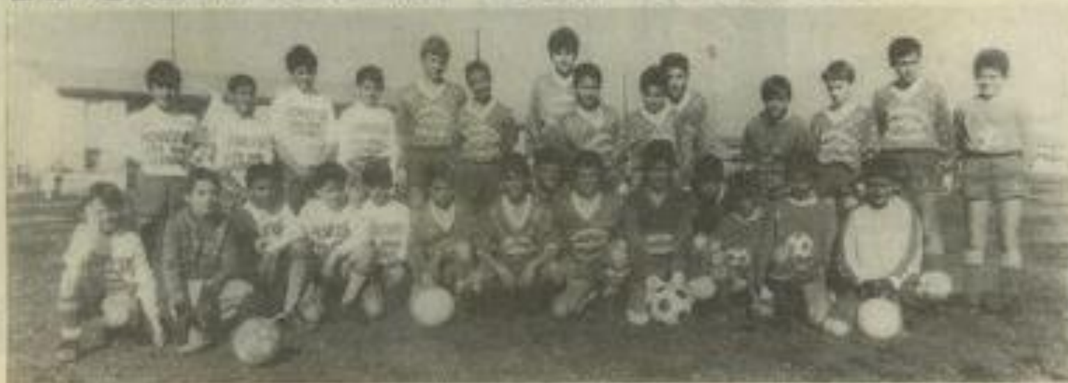
● La jeune garde du ballon rond.