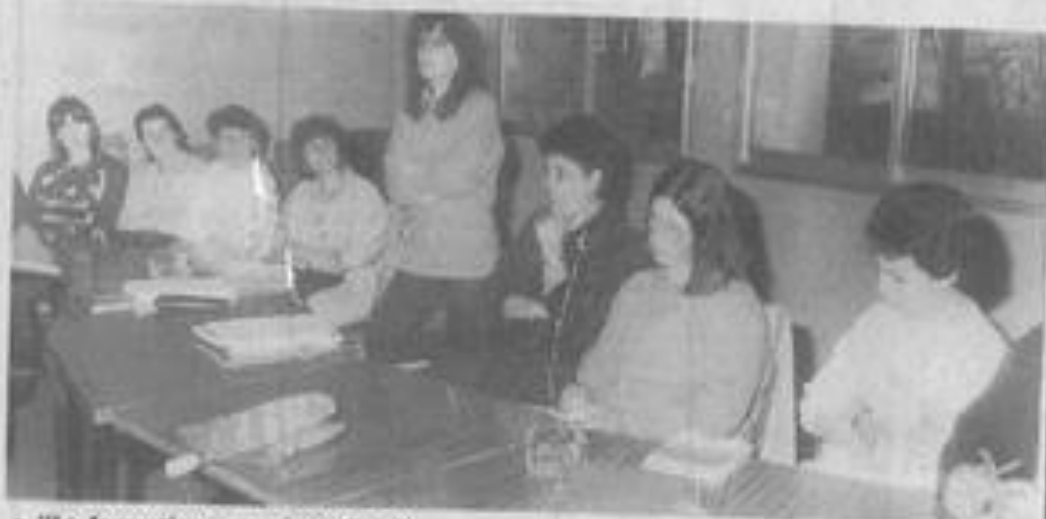
● "La formation est primordiale"