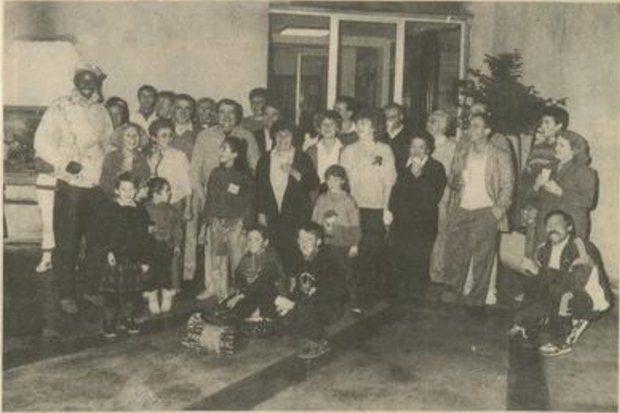
• La soirée à la M.J.C. (Photo Costesèque). Chaudes ambiances l'autre soir à la Maison des jeunes, avec un temps de circonstance. Des châtaignes arrosées de vin nouveau, c'était le menu de la soirée à laquelle assistaient les membres du conseil d'administration et de nombreux adhérents. Un agréable moment d'amitié.