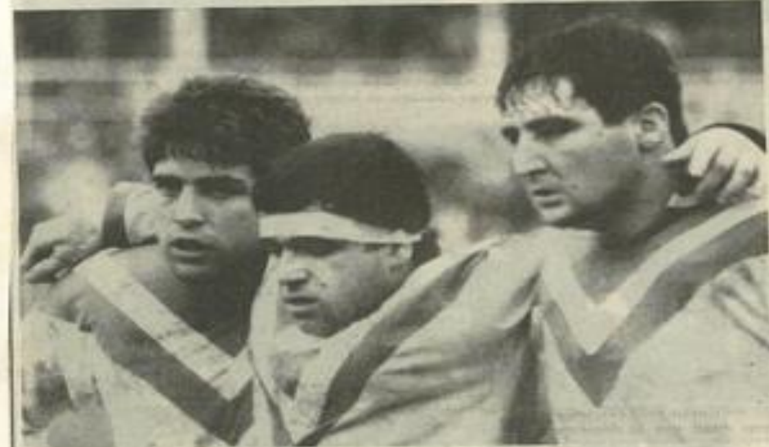
Le pack «vert et blanc» vaillant, mais jusqu'à quand? (Photos Costesèque).