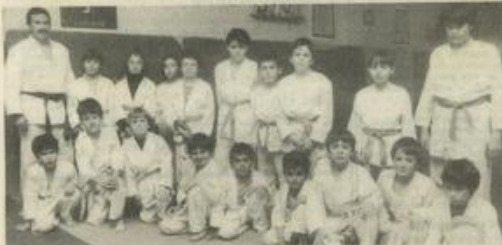
● Les jeunes judokas se préparent.