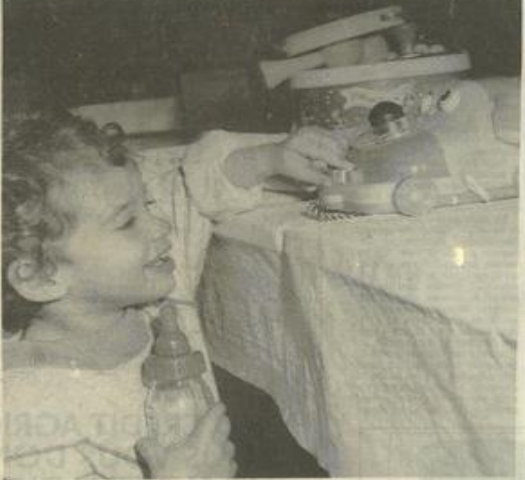
Les enfants étaient à la fête.