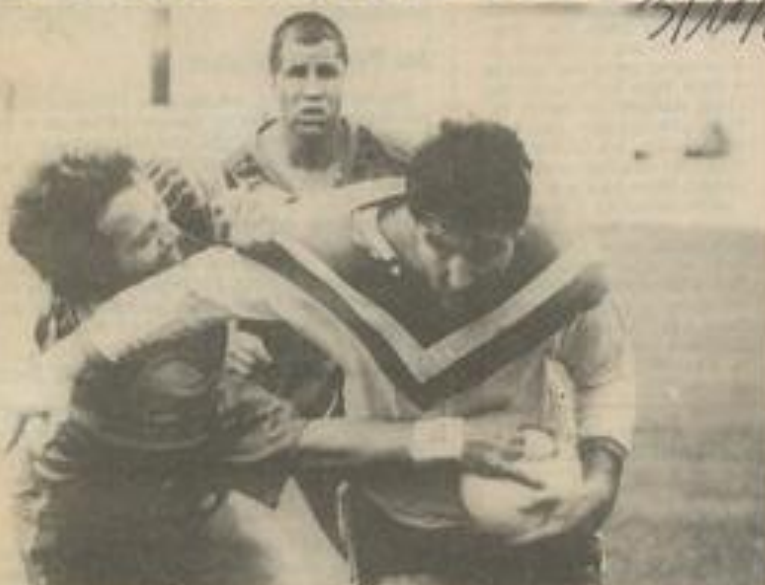
• Toute la détermination de Bosca.