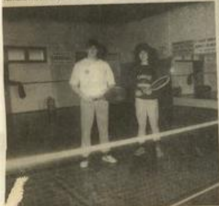
• Mini-tennis sur mini-court

Terranova, ceinture noire le lundi de 19 h 30 à 20 h 30 et le vendredi de 18 h 30 à 19 h 30.