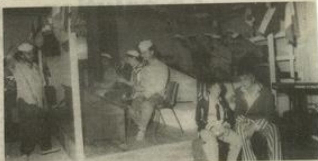
• Le swing en plus (représentation de juin)