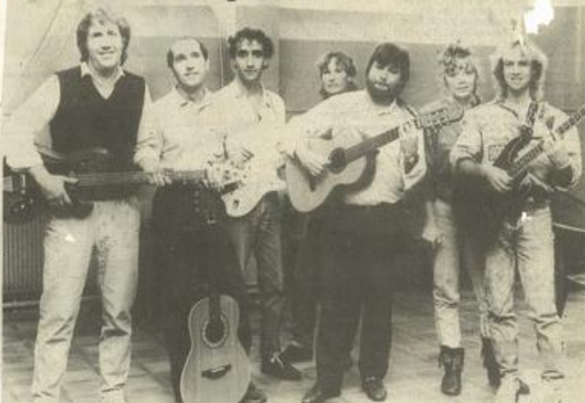
• Guitare, poésie et amitié.