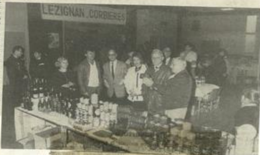
4 e Foire aux produits régionaux

Les produits régionaux sont nombreux et la qualité est en- core une fois au rendez-vous de cette manifestation désor- mais traditionnelle. Nous au- rons l'occasion de revenir dans une prochaine édition sur la foire qui, cette année, ac- cueille le musée des oiseaux de Douzens.