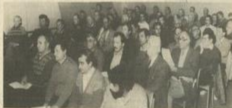
• Le public à l'écoute