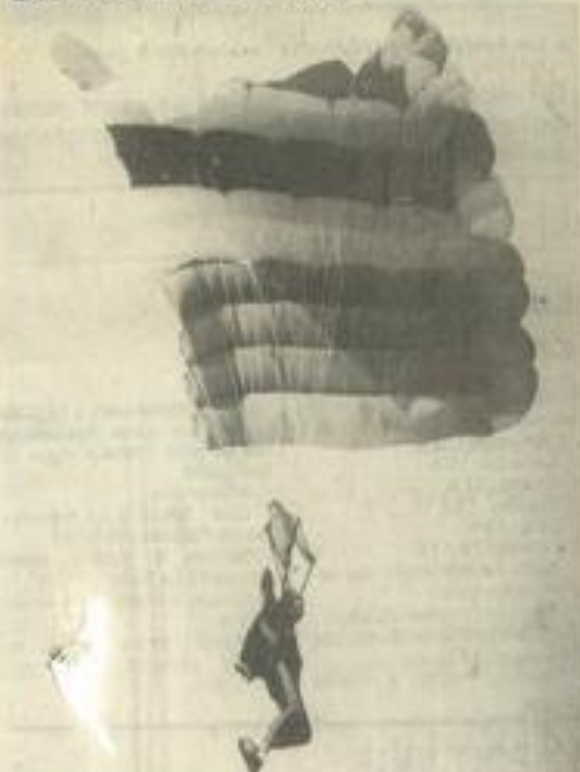
• Le grand saut en direct