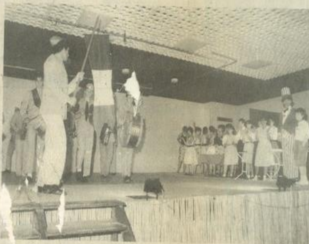
• La libération : In the mood frappe à la porte.