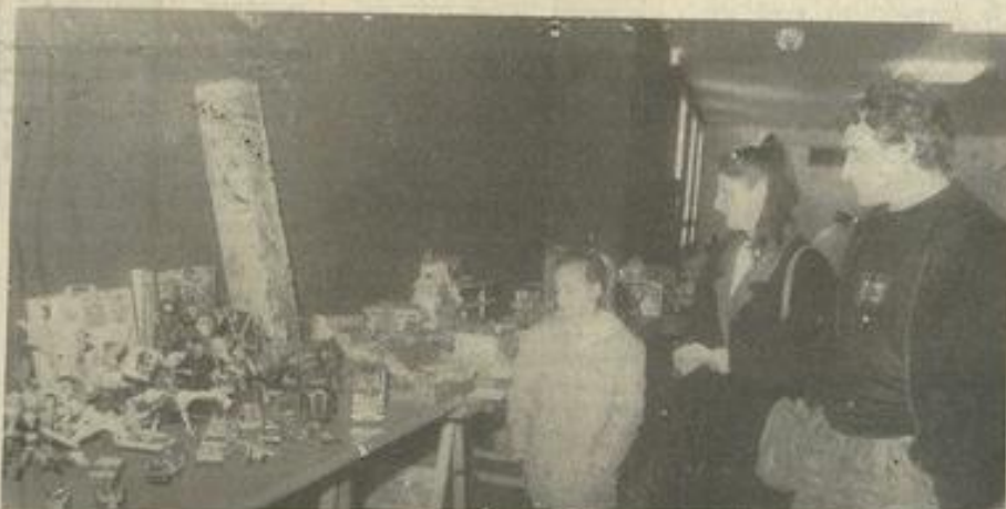
• Les jouets, promesses de Noël