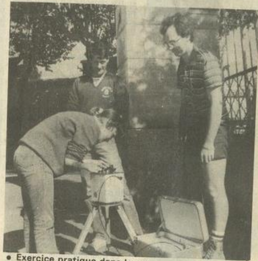
• Exercice pratique dans la rue.