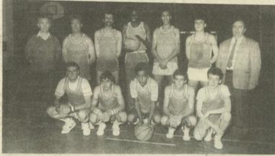
• Ils peuvent gagner

A UJOURD'HUI, la J.S.I. va défier Béziers sur son plancher avec au bout la première place de la poule de classement, pour la première phase du championnat. Pour cela, il faudra gagner ou, en cas de défaite, limiter l'écart à 4 points. La tâche s'annonce ardue pour nos représentants qui, depuis quelque temps, ont quelques difficultés à pratiquer un bon basket. Il faut dire, à leur décharge, que le gymnase municipal ne leur est attribué, en soirée, qu'une seule fois par semaine, le vendredi, ce qui n'est pas idéal à la veille des rencontres pour mener un entraînement poussé ! Il est donc