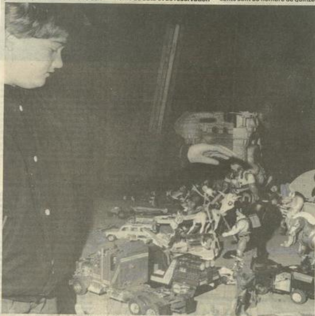
▲ Les jouets d'occasion: le royaume des enfants.

Dans la foulée, les visiteurs de la Foire aux produits régionaux qui peuvent aussi être des parents, auront la possibilité de jeter un coup d'œil sur l'armada de jouets disposée dans l'enceinte de la Foire, grâce à la participation de l'Amicale des parents d'élèves. Les Goldoraks, poupées Barbi, et autres inventions télévisuelles sont légion. Aux côtés des ordinateurs de jeu et des livres de bibliothèque roses ou vertes, trônent les multiples véhicules, trains électriques et autres jouets qui enchanteront les jeunes Lézignanais. Mais surtout les parents qui pourront les acquérir à des prix inférieurs au tiers de ceux pratiqués dans le commerce.