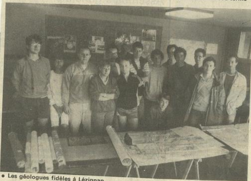
• Les géologues fidèles à Lézignan.

plus clair sur le passé géologique des Corbières. Quant aux gens de la région, si parfois ils sont un peu surpris de voir ces miroirs et ces appareils, ils font toujours très bon accueil aux étudiants, posent des questions et s'intéressent à ce drôle de travail !