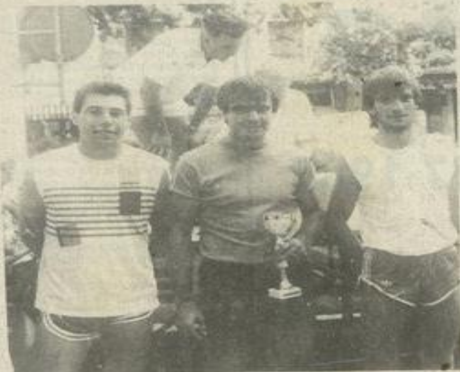
• De très nombreuses récompenses furent attribuées.