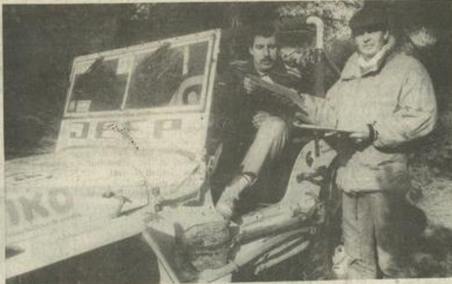
• Au contrôle.

ORGANISÉE par le "Club Lézignan-Corbières" et son président Bernard Fumet, cette deuxième édition du Trial 4x4 s'est déroulée sur la piste Thierry-Sabine longue de 5,2 km. Pour les 40 participants, venus de toute la région, le but était simple : 7 zones à parcourir en faisant le moins d'erreurs possibles.