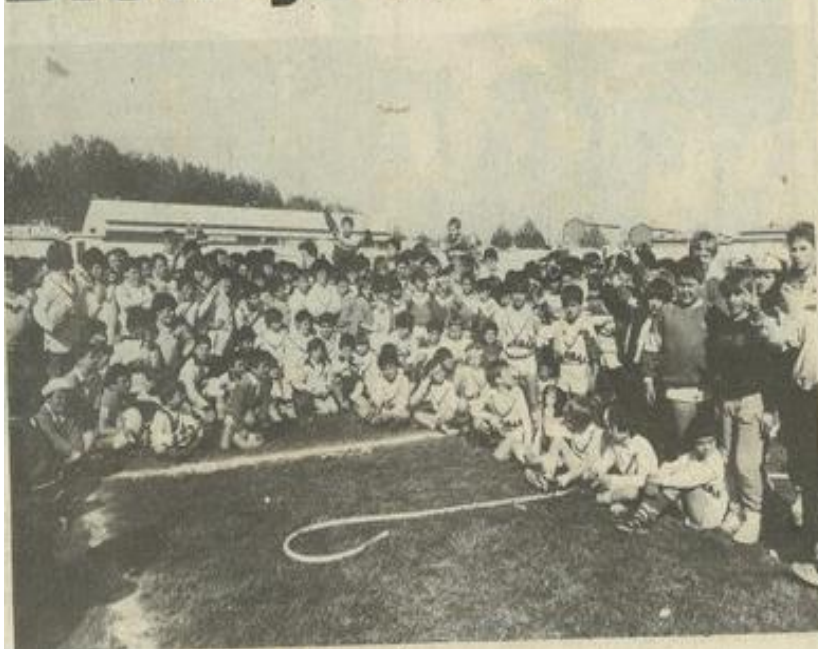
• Les nombreux participants à ce tournoi.