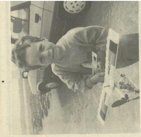
• Un jeune adepte de l'aéromodélisme.

pris leur mal en patience, espérant que le vent tomberait un peu en milieu d'après-midi. Mais sur le terrain, les conditions étaient toujours mauvaises. Soixante jours aussi, trop pour ces km/h en moyenne, et les modèles qui ne peuvent bien voler qu'avec un vent ne soufflant pas à plus de 30 ou 40 km/h. Alors ? Alors, tandis que certains des invités étaient prêts à parler de « concours », tentaient quelques vols, aux atterrissages souvent approximatifs. Une journée perdue, en somme, car, pt : pouvoir organiser un concours et des démonstrations d'aéromodélisme, il faut demander des autorisations à la préfecture un mois à l'avance et prendre des assurances spécifiques. Tout cela pour rien ! Mais ce n'est pas tout, car, le 14 juin, un nouveau concours aura lieu, à Arcassonne, les Espagnoles et les Françaises, mais on s'habille bien que ce soit. On s'habille bien que ce soit. On s'habille bien que ce soit.