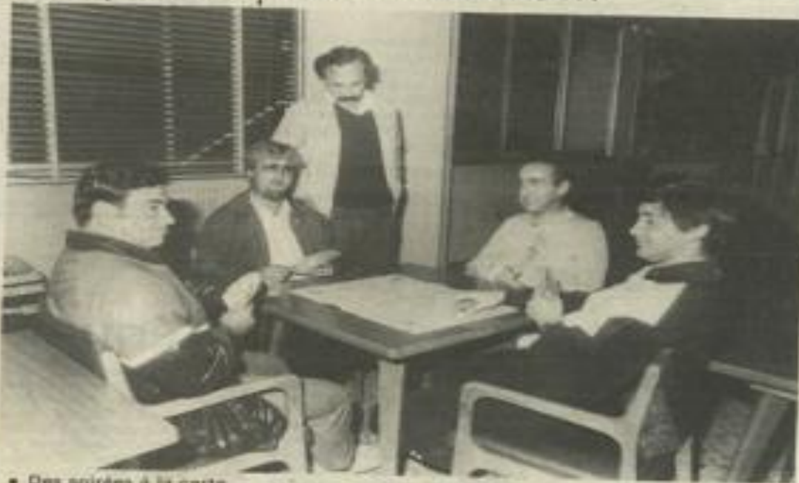
• Des soirées à la carte...

LE Tarot-club lézignans s'est réuni en assemblée générale le vendredi 9 octobre 1987, au siège de la rue Marat, sous la présidence de Roger Solves.