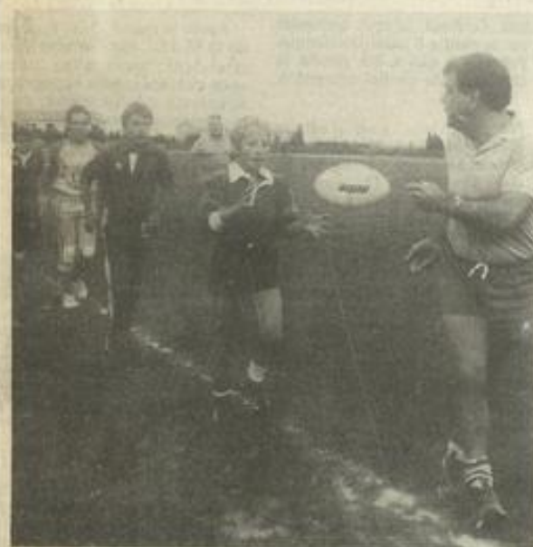
• Premier galop pour les jeunes

Et, puisque l'heure de la rentrée est le moment où l'on forme des vœux, appelons celui du présent Tournier : constituer une équipe espoir pour les jeunes, jusqu'à 23 ans. Comme cela se fait en Italie.