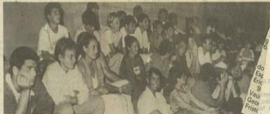
• Un public fidèle suit le tournoi.