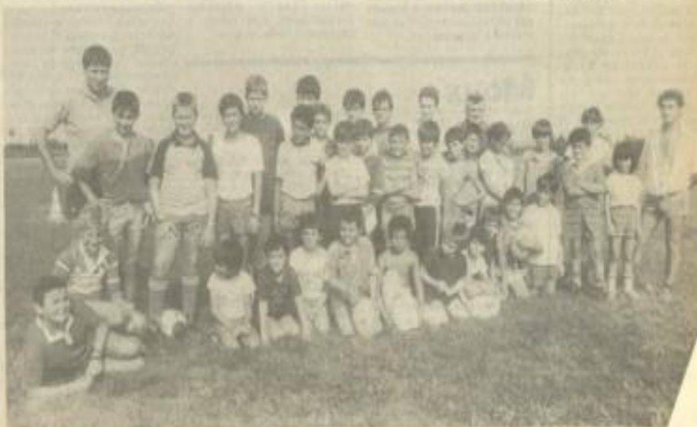
Les jeunes poussins de l'école