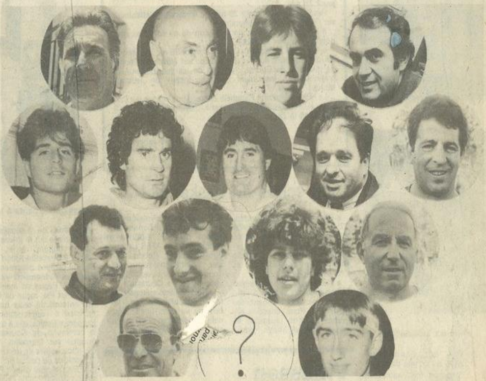
Quinze nominés pour trois césars sportifs et une surprise avec le prix spécial du jury.

On savait que Lézignan était une ville sportive. C'est d'ailleurs l'une des caractéristiques frappantes de notre localité pour qui la découvre. A travers le Treize, bien sûr, qui reste la vedette incontestée de la région. Mais au-delà du sport-phare, à travers quantités de clubs et quantité de licenciés. Ce phénomène est apparu encore plus clairement quand il a fallu recenser pour la fameuse "Nuit des Césars Sportifs" les plus méritants de nos représentants... Ce n'est qu'après mûre réflexion que les organisateurs de cette manifestation ont pu dresser la liste des "nominés", ce futur "Who's who" de la vie Lézignanaise sportive... Leurs noms brilleront ce soir de tous leurs feux, lors de cette première édition des "Césars" prévue au Patio.