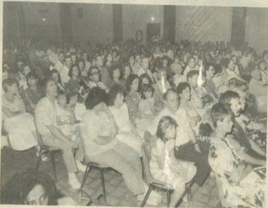
• Un public nombreux, mais pas autant qu'on aurait pu s'y attendre.