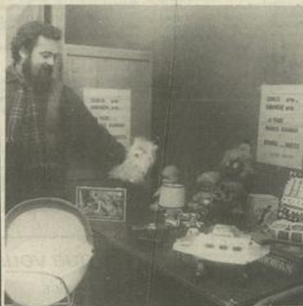
• Des jouets pour Noël.