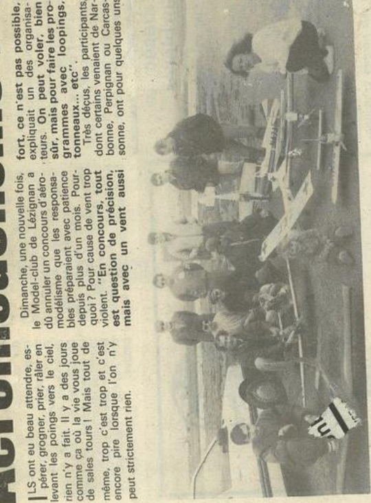
• Les avions cloués au sol.

pris leur mal en patience, espérant que le vent tomberait un peu en milieu d'après-midi. Mais sur le terrain, les conditions étaient toujours mauvaises. Soixante jours aussi, trop pour ces km/h en moyenne, et les modèles qui ne peuvent bien voler qu'avec un vent ne soufflant pas à plus de 30 ou 40 km/h. Alors ? Alors, tandis que certains des invités étaient prêts à parler de « concours », tentaient quelques vols, aux atterrissages souvent approximatifs. Une journée perdue, en somme, car, pt : pouvoir organiser un concours et des démonstrations d'aéromodélisme, il faut demander des autorisations à la préfecture un mois à l'avance et prendre des assurances spécifiques. Tout cela pour rien ! Mais ce n'est pas tout, car, le 14 juin, un nouveau concours aura lieu, à Arcassonne, les Espagnoles et les Françaises, mais on s'habille bien que ce soit. On s'habille bien que ce soit. On s'habille bien que ce soit.