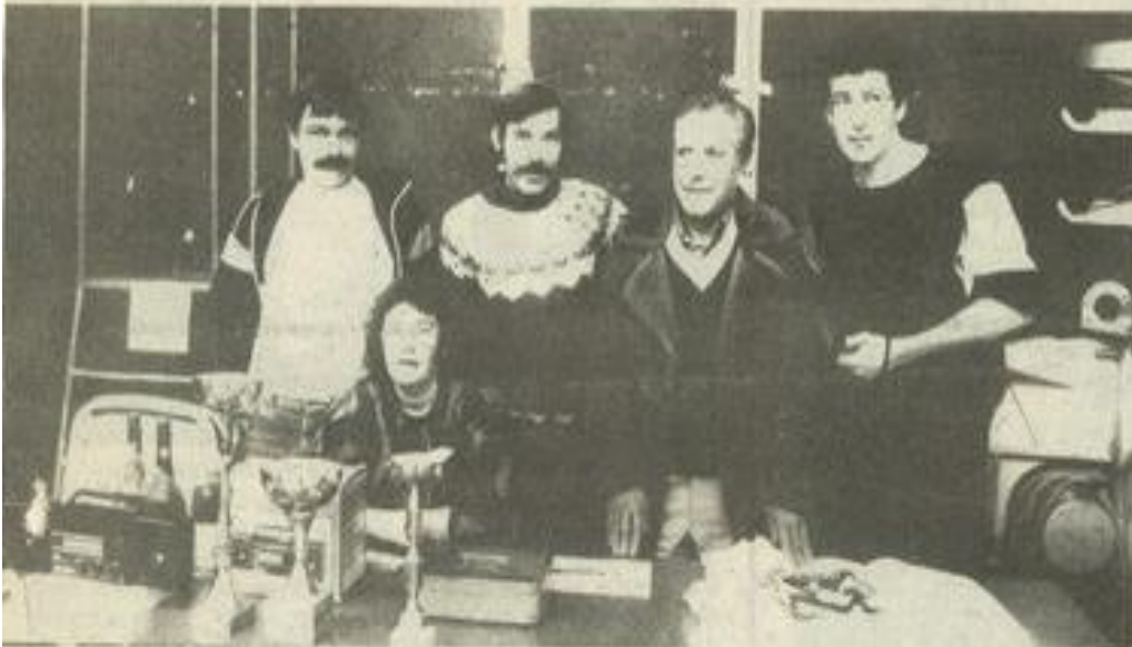
• Les organisateurs.