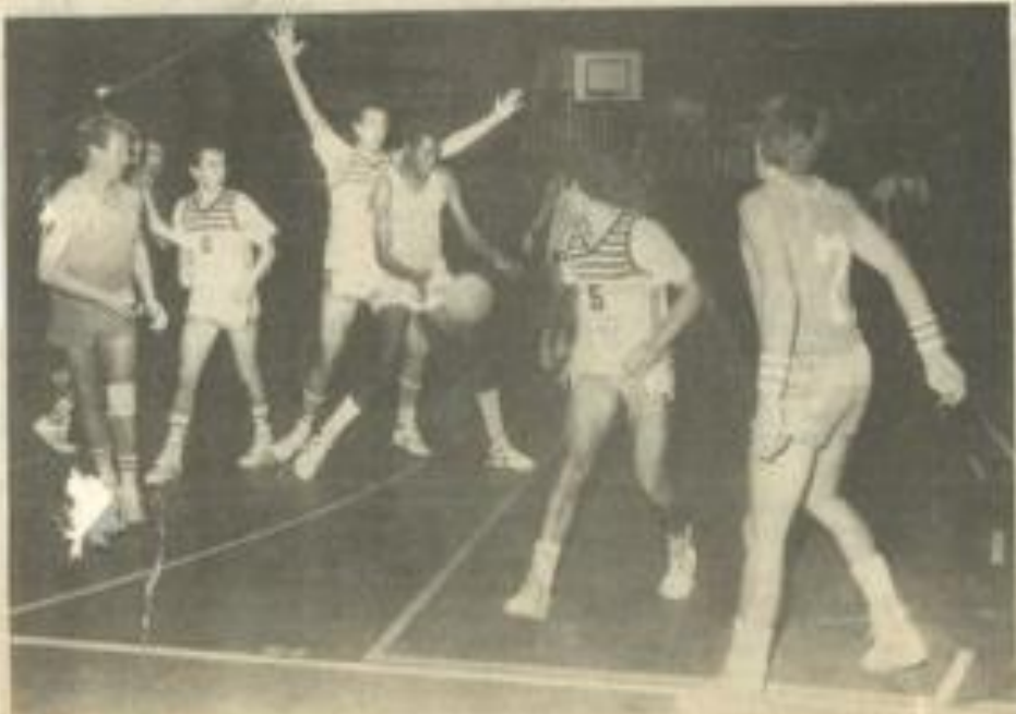
• Les basketteurs lézignais étaient déterminés.

été 16 fautes à Lézignan et 1 à Béziers. Les points ont été marqués par Nive 6 + 2 (8) Niang 11 + 6 (37) Cervello 4 + 2 (6). Sc. hors-j. + 2 (8) Chapeau 7 + 2 (8) Juret 5 + 2 (7) Camarasa-Migne et Habib complétaient l'équipe.