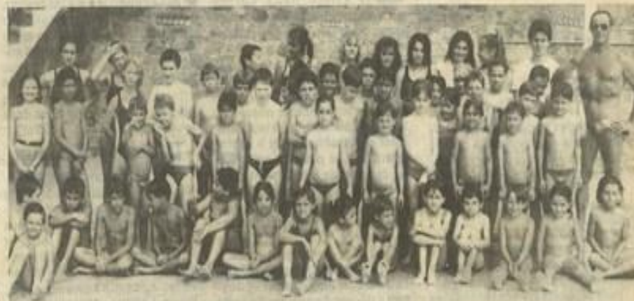
► L'école de natation.

L'ÉCOLE de natation organisée tous les matins à la piscine municipale connaît un grand succès auprès des jeunes Léznagnais. Une soixantaine de petits nageurs se sont d'ores et déjà inscrits auprès du dévoué Marceau Gay afin de perfectionner l'exercice de leur sport favori. Tous les matins, de 9 h 30 à 10 h 30, à l'exception des samedis et dimanches, les oncles et oncles font l'apprentissage du crawl, de la brasse et autres «papillons». Fin août, ces jeunes nageurs passeront le brevet de natation.