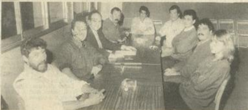
• Les adeptes du tout-terrain à la M.J.C.