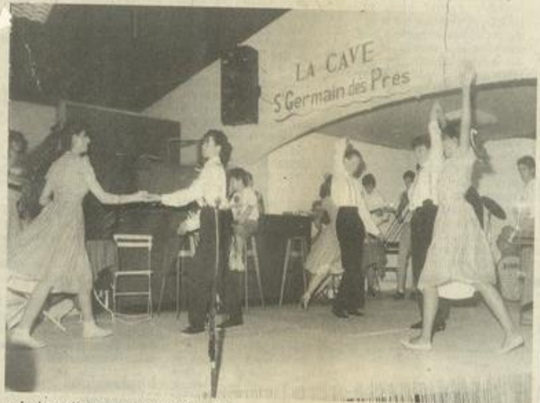
• Le bon vieux temps du rock'n roll !

Impossible de décrire tous ces moments d'euphorie. Il fallait venir, après tout ! Applaudir chacun des tableaux de cette comédie musicale jouée sur l'air de la passion. Samedi soir, les amateurs avaient de quoi rêver, de quoi planer, et Lézignan s'offrait sa plus belle nuit de la musique. Mener à terme une entreprise aussi gigantesque que celle-là, faisant intervenir écoles de musique et de danse, chorale et associations diverses, des dizaines de personnes en tout, était déjà un sacré défi. Y parvenir jusqu'à la