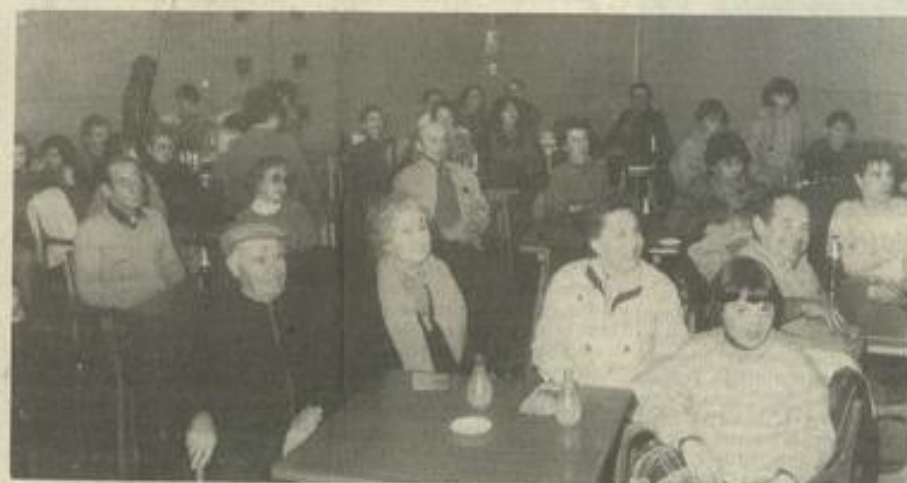
• L'assistance ravie