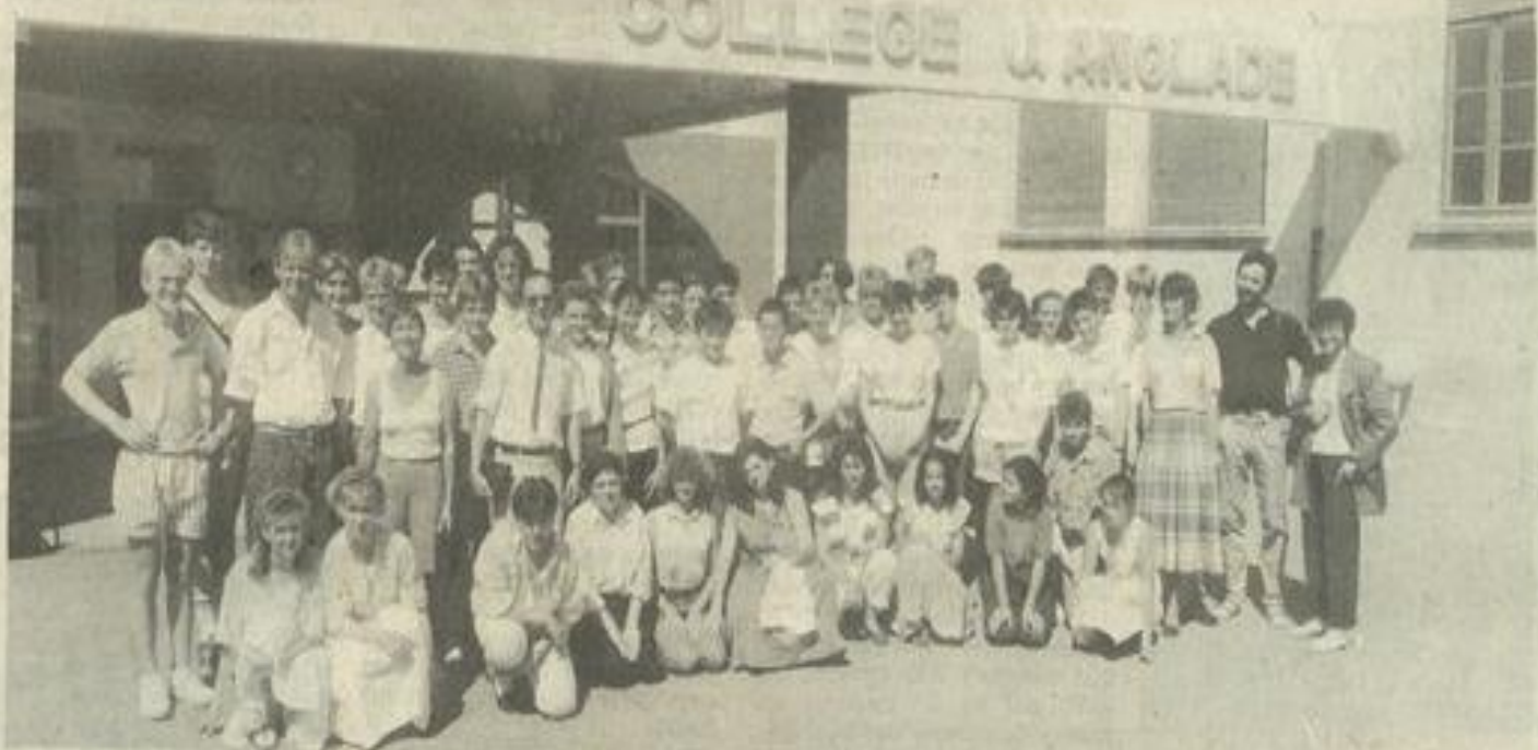
• Les jumeaux rassemblés.

Mardi soir, la municipalité offrira à son tour une réception de bienvenue à nos visiteurs bremois et, samedi prochain, Allemands et Français pourront, assister à la projection d'un film réalisé à Brême, dans le cadre des échanges, en 1986. Bon soleil, bon séjour et bienvenue tous !