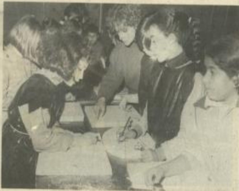
• Bas les masques!

Les principes de ces mercredis sont: Ouverture d'esprit, disponibilité et renouvellement des activités. Si avec tout ça, les chers petits font encore la fine bouche, il ne vous restera plus qu'à appuyer sur le bouton et jeter les gains.