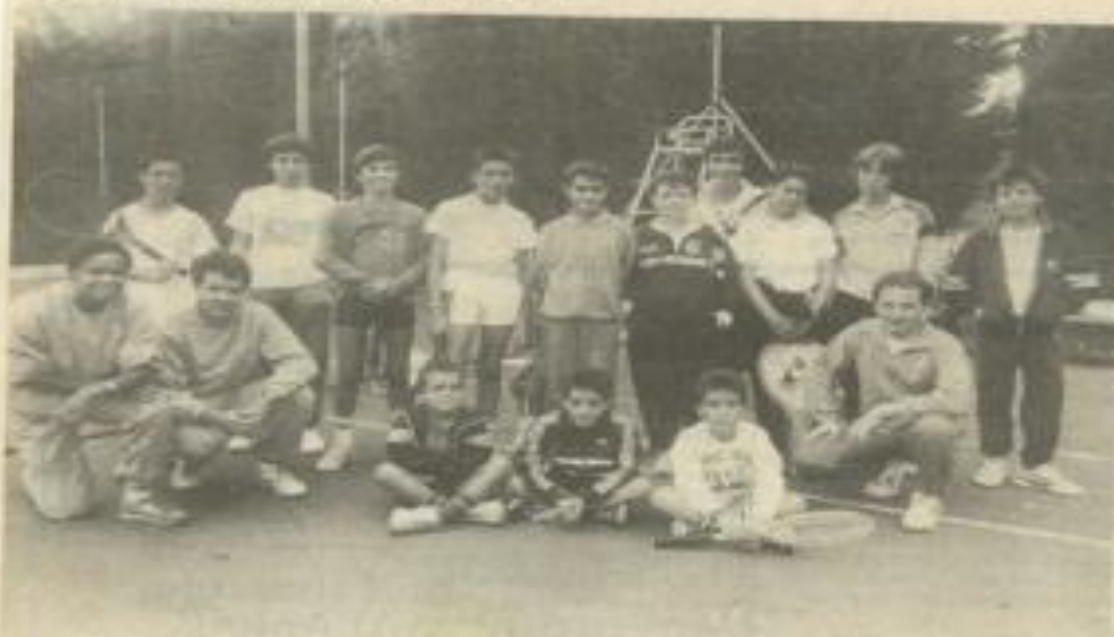
• Les jeunes tennismen.