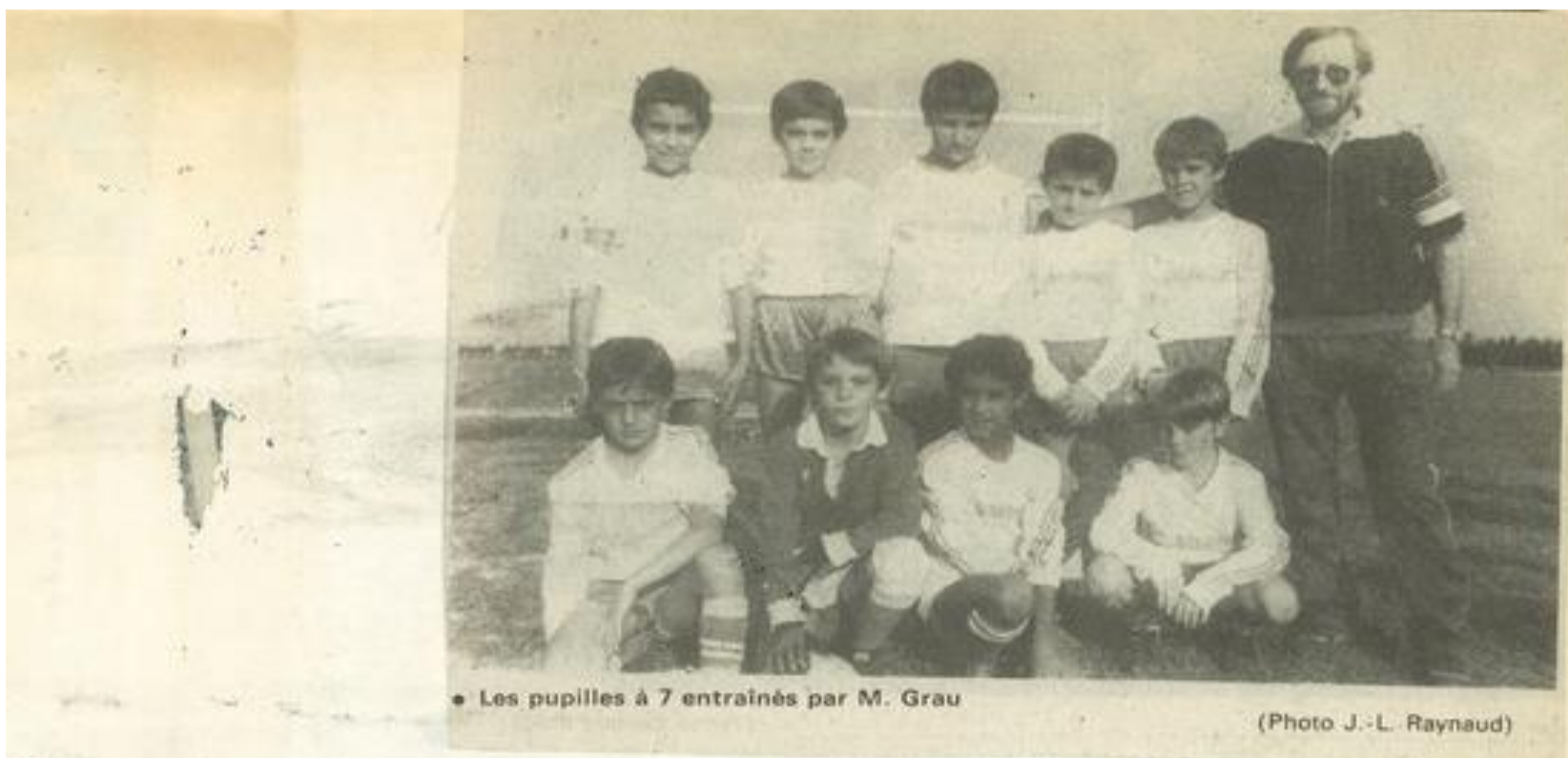
• Les pupilles à 7 entraînés par M. Grau