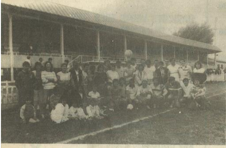
• Portrait de groupe avec dames... et ballons.