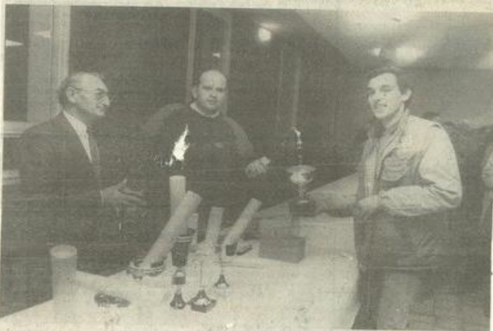
● Le Carcassonnais Cabocel, à la 2 e pl.