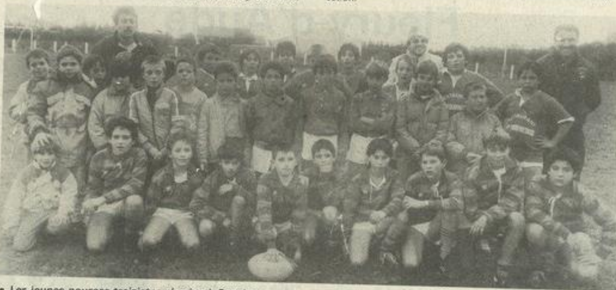
• Les jeunes pousses treizistes réunies à Ornaisons

mérité, avec tarte aux pommes et boisson, offert par les organisateurs. Sportif et gourmand, il n'y a pas de contre-indication.