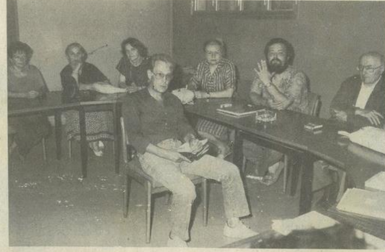
● Une assemblée générale en comité restreint, jeudi à la M.J.C.

Autre problème, et de taille, celui des finances. Les Amis des arts vivent d'une subvention allouée par la M.J.C., qui est de l'ordre de 500 F et des cotisations de leurs membres. Avec cela, ils prennent en charge l'école de dessin : en fait, ils ne peuvent se permettre que de donner un modeste défraiement mensuel à la personne chargée des cours, laquelle bien souvent paye les fournitures de sa poche. A l'heure actuelle, les Amis des arts ont en caisse 3941 F et l'école 786 F. Pour pouvoir fonctionner, cette dernière doit avoir 500 F par mois. Dans ces conditions, on peut se demander si l'association pourra encore longtemps assumer une telle charge.