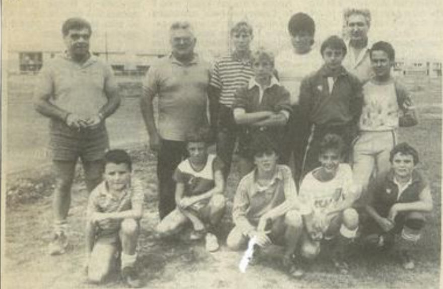
• Entraîneurs et joueurs se sont retrouvés mercredi à la Roumanginière.

Le premier entraînement de la saison, concernant les minimes et les cadets du F.C.L. XIII a eu lieu mercredi soir, à La Roumanginière. En présence de leurs entraîneurs, MM. Bernard et Marcel Thiébault pour les premiers et MM. André Tournier et Jean-Pierre Charrassier pour les seconds, les jeunes ont "re-