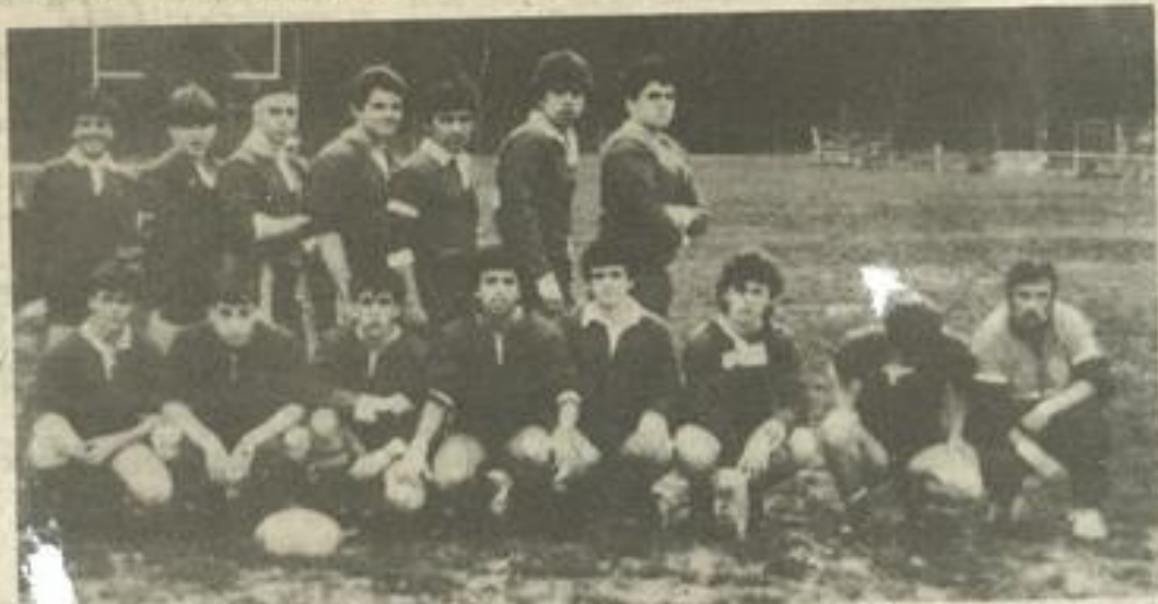
• Les minimes prêts à défendre, cet après-midi, leurs chances en demi-finale.

C'EST cet après-midi, que les minimes de la section des jeunes du F.C. Lézignan XIII rencontreront leurs homologues de la MJC Carcassonne pour le compte de la demi-finale du championnat.