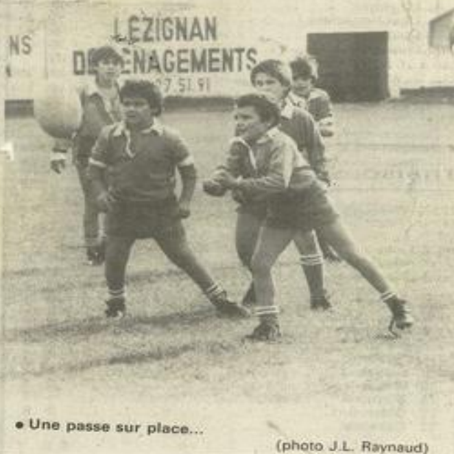
• Une passe sur place...

Le porteur du ballon étant stoppé dans sa course régulièrement, sans pouvoir passer l'arbitre dira "tenu". Ce sera notre prochain exposé.