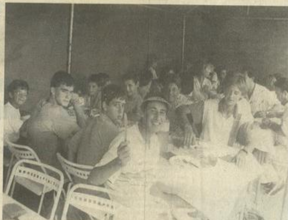
• Les convives affamés appréciaient le repas préparé pour eux au Tennis-club

La première impression qu'ils ont eue de Lézignan les a touchés au cœur. Fatigués, affamés, après des heures de trajet et un retard considérable -prévue pour 14 h, leur arrivée avait été repoussée de près de 3 h pour cause d'embouteillages à la frontière- ils n'ont eu pour leur premier jour qu'une brève vision de notre ville, suffisante cependant pour remarquer le panneau disposé à leur intention, en bienvenue, devant le Syndicat d'initiative. Le nom de Gandia y était écrit en toutes lettres... Et ils ont trouvé l'attention délicate !