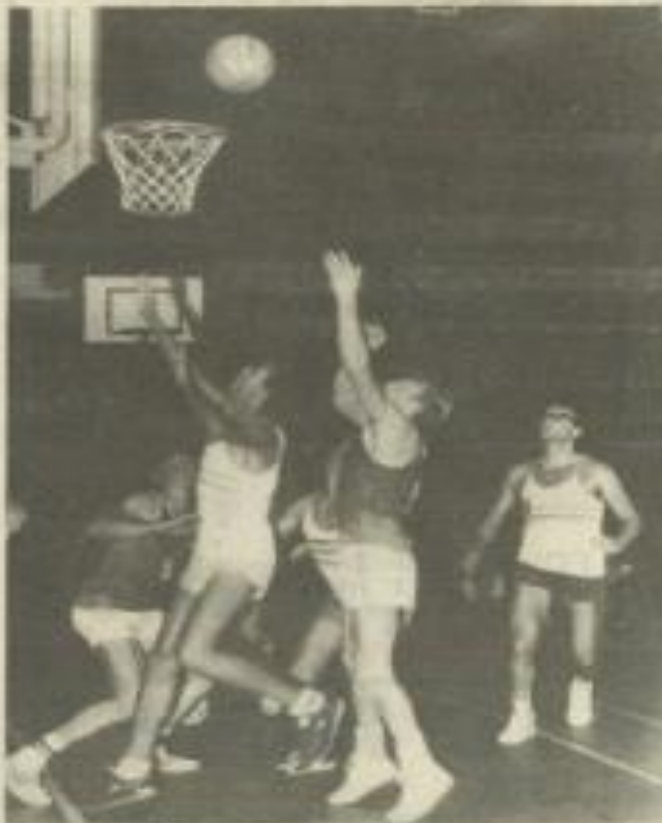
• Première rencontre et première victoire pour les basketteurs « vert et blanc ».