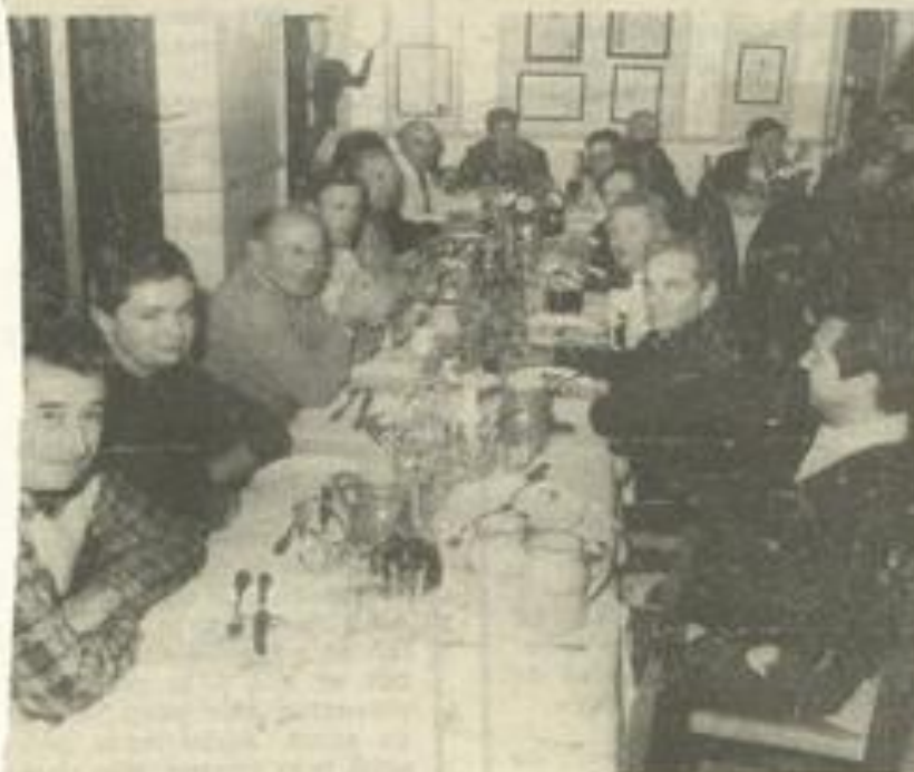
• Un repas agréable.