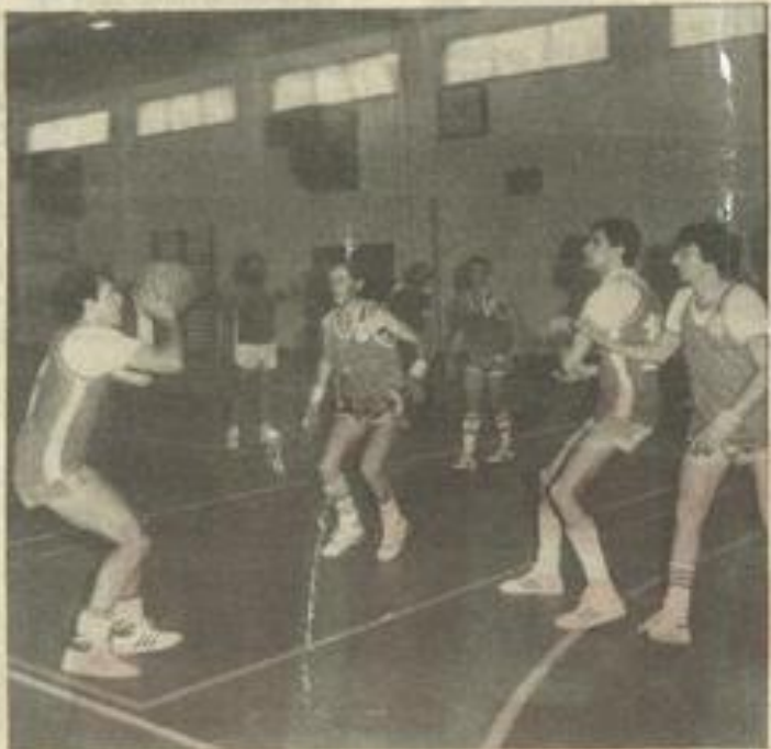
• Une des phases de cette rencontre

C E tournoi tout amical aura servi de test très concluant à la nouvelle et jeune équipe lézignanaise.