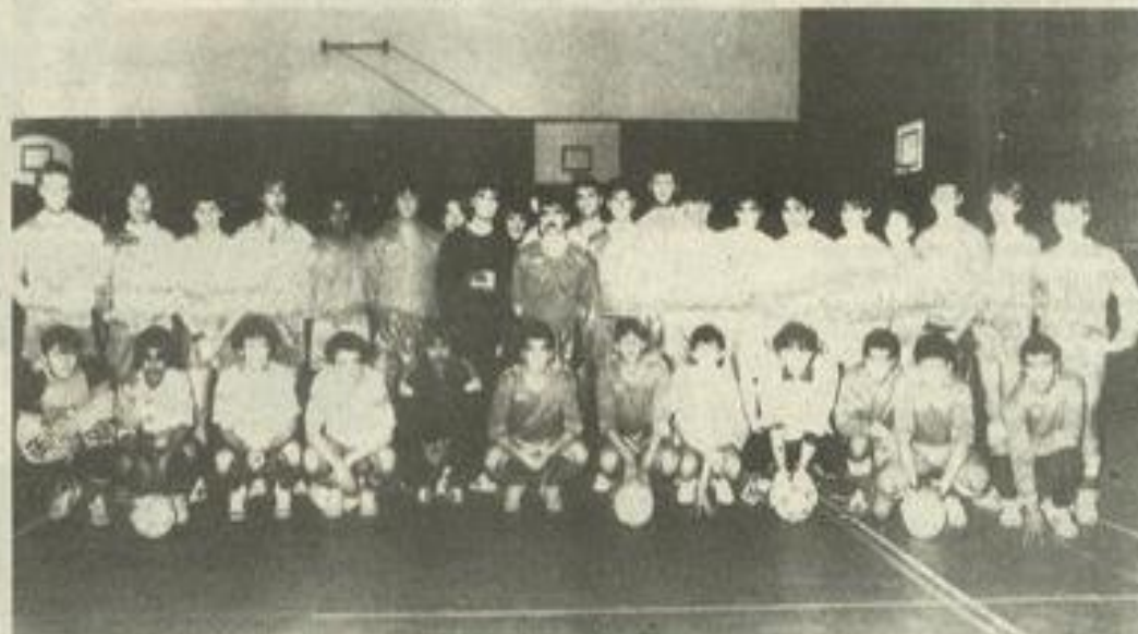
• Les équipes.