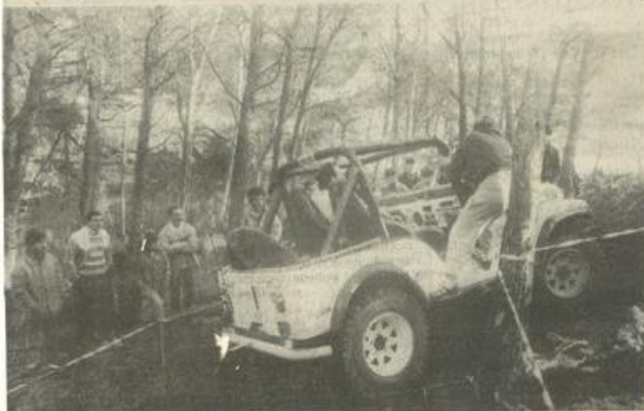
• Un "singe" en automne.