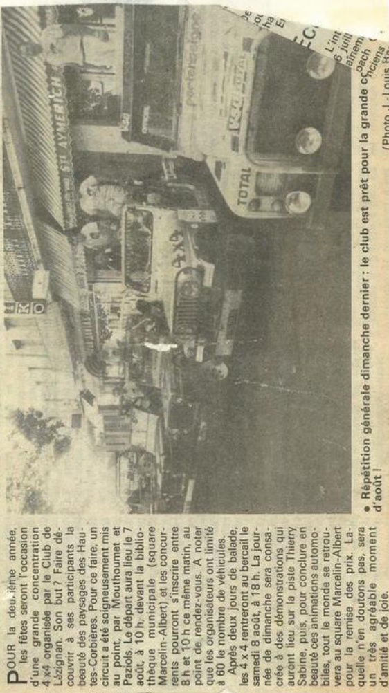
● Répétition générale dimanche dernier : le club est prêt pour la grande course d'août !

POUR la deuxième année, les fêtes seront l'occasion d'une grande compétition 4x4 organisée par le Club de Lézignan. Son but ? Faire découvrir à ses participants la beauté des paysages des Hautes-Corbières. Pour ce faire, un circuit a été soigneusement mis au point, par Mouthoumet et Paziols. Le départ aura lieu le 7 août à 10 h, devant la bibliothèque municipale (square Marcelin-Albert) et les concurrents pourront s'inscrire entre 8 h et 10 h ce même matin, au point de rendez-vous. A noter que les organisateurs ont limité à 60 le nombre de véhicules. Après deux jours de balade, les 4x4 rentreront au bercail le samedi 8 août, à 18 h. La journée de dimanche sera consacrée à des démonstrations qui auront lieu sur la piste Thierry Sabine, puis, pour conclure en beauté ces animations automobiles, tout le monde se retrouvera au square Marcelin-Albert pour la remise des prix. Laquelle n'en doutons pas, sera un très agréable moment d'amitié et de joie.