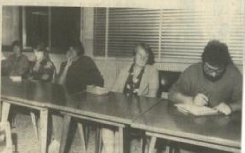
• Des membres attentifs à l'avenir des clubs.