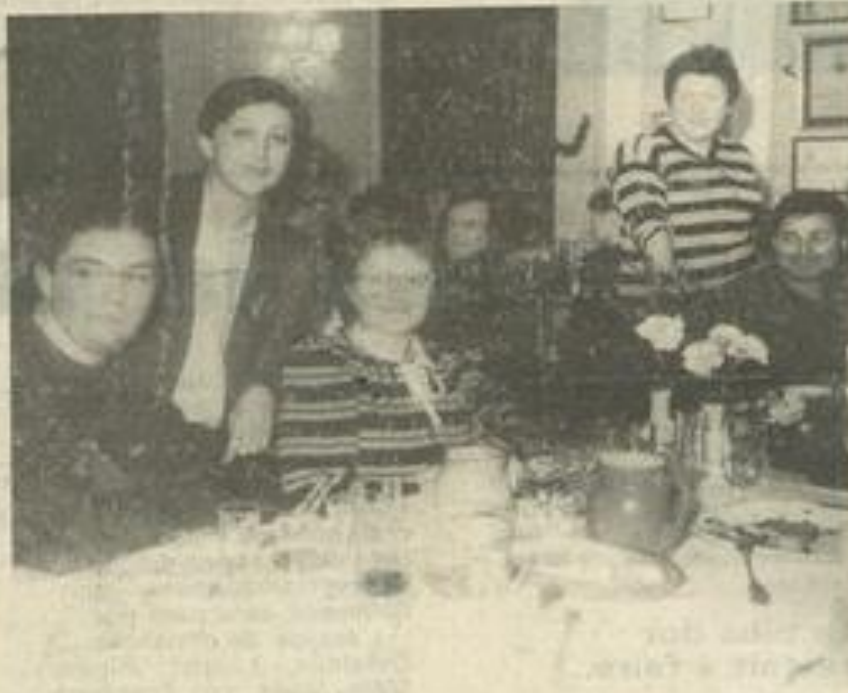
• Les deux dernières recrues des Randonneurs en compagnie de la présidente.