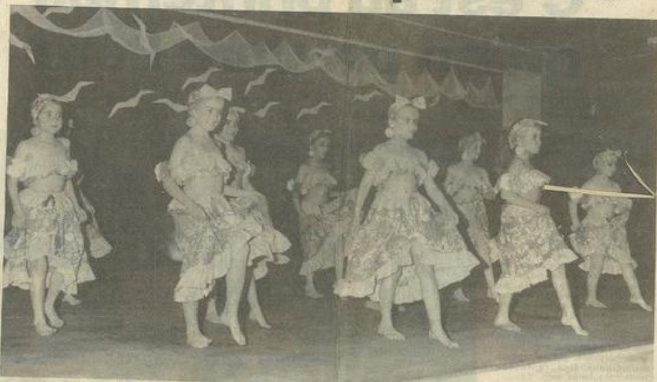
▲ Les petites vahinéennes ont dansé la biguine.