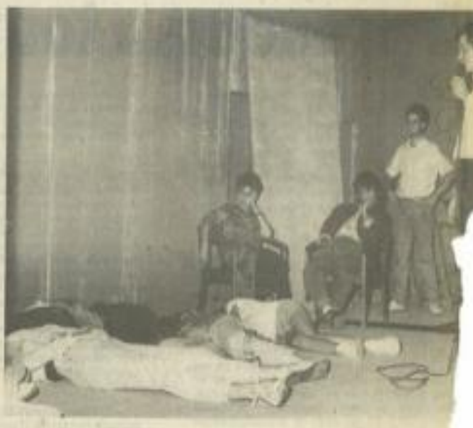
Jeudi dernier, à la M.J.C., le public dormait... pour la bonne cause!