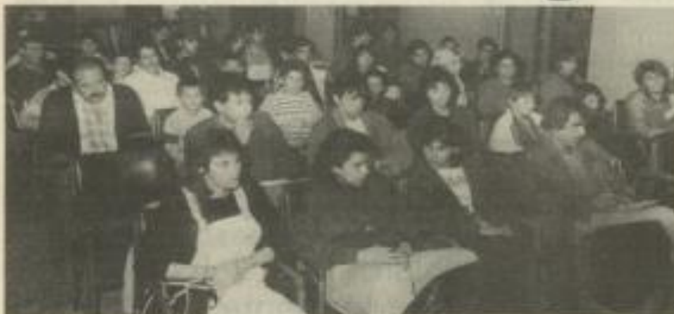
• La relève est là.

Samedi soir, s'est déroulée l'assemblée générale de la Jeunesse et Sports Lézignan-Corbières, autrement dit de notre club d'athlétisme.