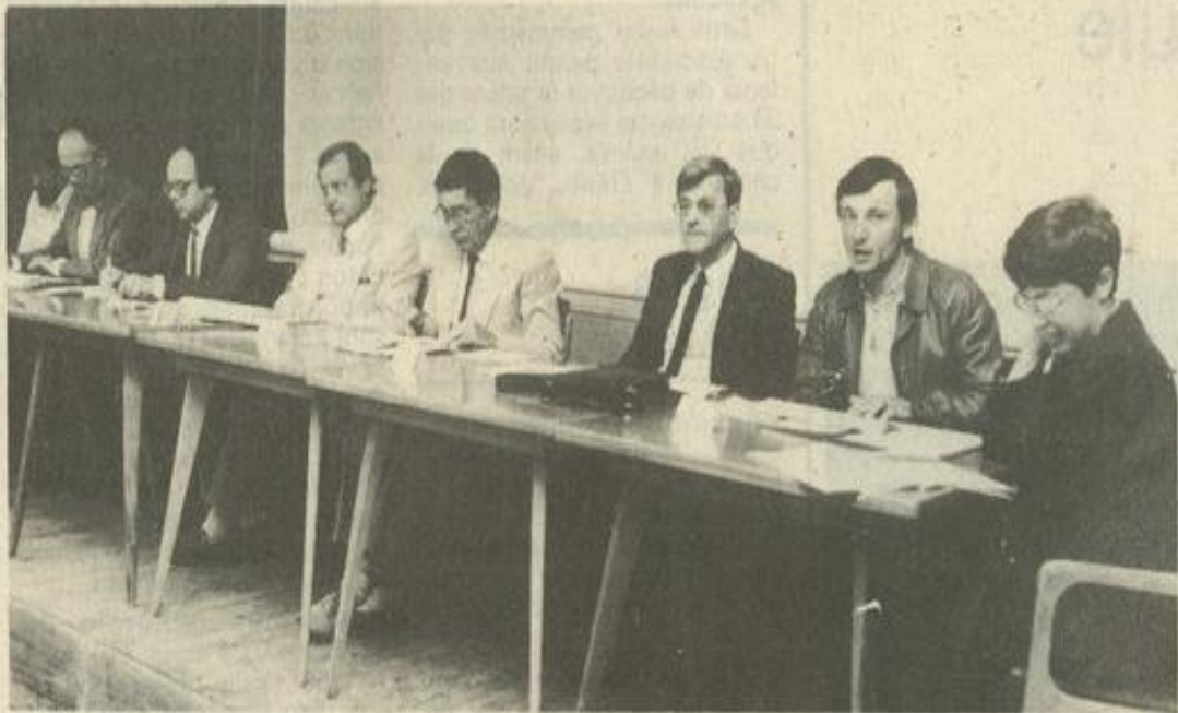
• Le bureau

"C'est le moment de nous serrer les coudes, de ne pas faiblir devant la difficulté. Si l'État, à travers des gouvernements successifs et malgré des promesses bien souvent réitérées, ne prend guère de mesures efficaces en faveur des jeunes dans les domaines de l'emploi, de l'éducation et des associations ; si, par un désengagement financier accéléré, il exploite honteusement le bénévolat et alourdit sa tâche, ce n'est pas une raison de baisser les bras. Nous irons jusqu'au bout de nos possibilités, conscients de la valeur de notre engagement humaniste. Nous ne capitulerons jamais, car nous sommes certains d'avoir raison de nous battre pour développer cette éducation populaire que les pouvoirs publics, malgré leurs multiples déclarations, n'ont jamais véritablement prise en compte".