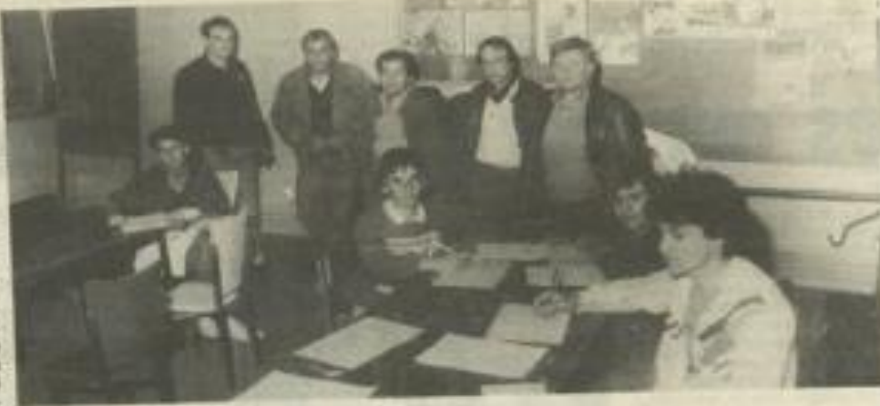
• Tout voir, tout entendre et tout noter.

La fonction de juge-arbitre est pleine de responsabilités, car se frotter à un Mac Ercoe demande nerf et assurance, des qualités décevées au moment du point. Vendredi, avait lieu l'épreuve du règlement des points du code d'arbitrage et l'établissement d'une feuille de match. Des épreuves pointues et indispensables qui seront complétées par un examen d'arbitre de chase, lors des épreuves individuelles qui se dérouleront le 1 er mai 88.