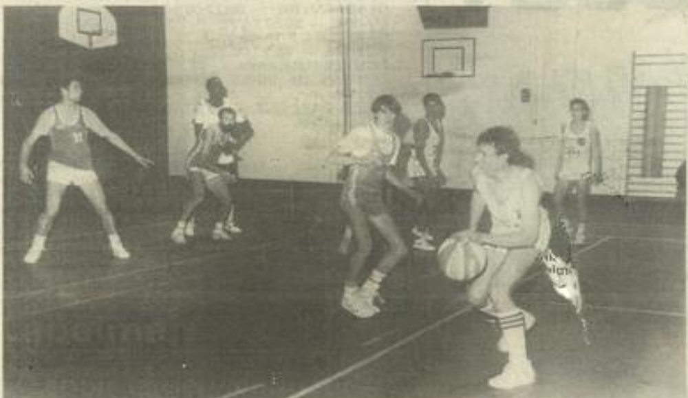
• Les "vert et blanc" face à Agde.