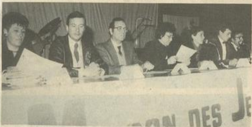
• Le bureau.