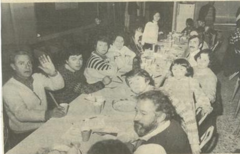
• Un bon repas.

Le Football club Lézignan-Corbières organisait samedi soir, à la M.J.C., un cassoulet géant, à l'intention de ses membres. Plus qu'une soirée gastronomique, il s'agissait d'une soirée amicale, dans le cadre des relations de camaraderie qui unissent les membres du club. Les anciens sont habitués à ces soirées fort sympathiques ; pour les nouveaux, c'était l'occasion de faire connaissance. Il est plus facile, certes, de s'entendre autour d'un bon repas que sur le terrain, mais il est vrai que le premier contribue au second.