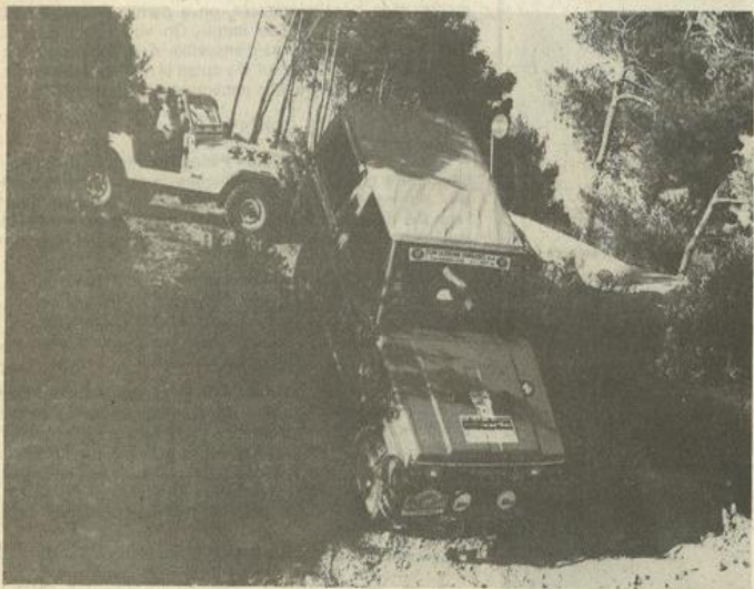
• On rode les amortisseurs