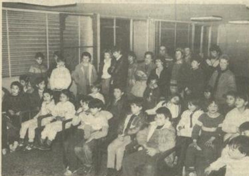
• Les nageurs.