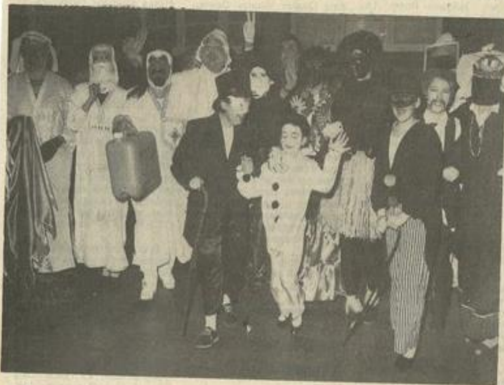
• Masques et déguisements.