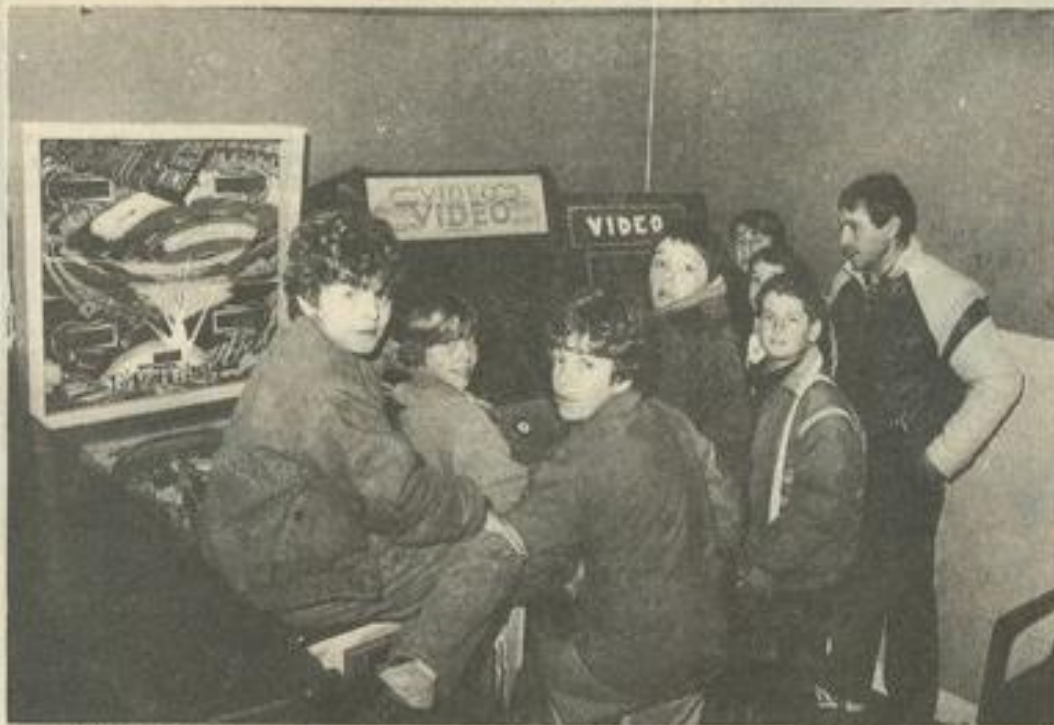
• Du flipper...

Le samedi après-midi, à la M.J.C. c'est la boum ! Un groupe de jeunes Lézignanais se donne rendez-vous dans cette vieille maison de notre ville pour vivre au rythme de son âge, l'âge de teen'agers.