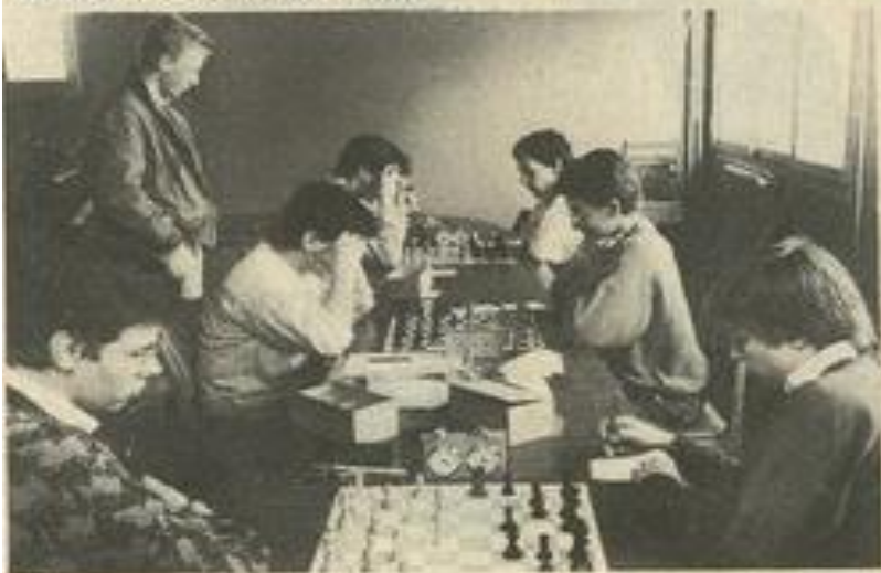
• Une salle studieuse.