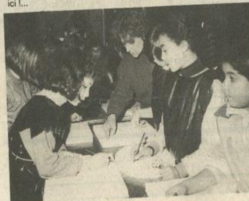
On apprend les rudiments.