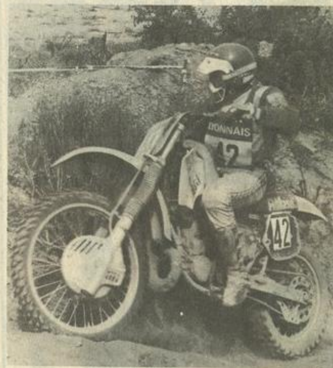
• Ça grimpe !