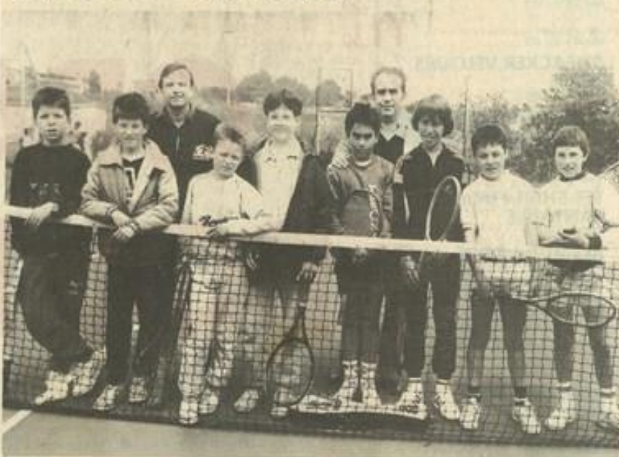
• Les champions de l'Hérault côte à côte avec les champions de l'Aude.