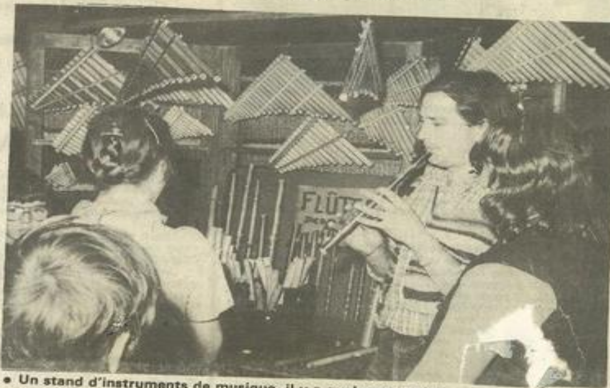
• Un stand d'instruments de musique, il y a quelques années.

Mais trêve de discours, le mieux est d'aller voir sur place.