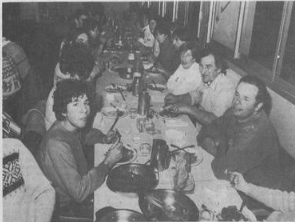
● Les membres du Moto-club à table

Rappelons l'ordre du jour de cette assemblée : accueil par le président du Moto-club de Lézignan, allocution du maire, bilan financier de la Ligue, bilan des présidents des commissions, discours du président de la ligue, intervention du représentant de la Jeunesse et des Sports, de la commission nationale d'enduro, des personnalités politiques, parole à l'assemblée, conclusion et remise de récompenses. L'après-midi, bilan de la saison par discipline, remise des prix aux champions et projets pour 86.