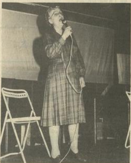
• Une adhérente du 3 e âge interprète son répertoire.