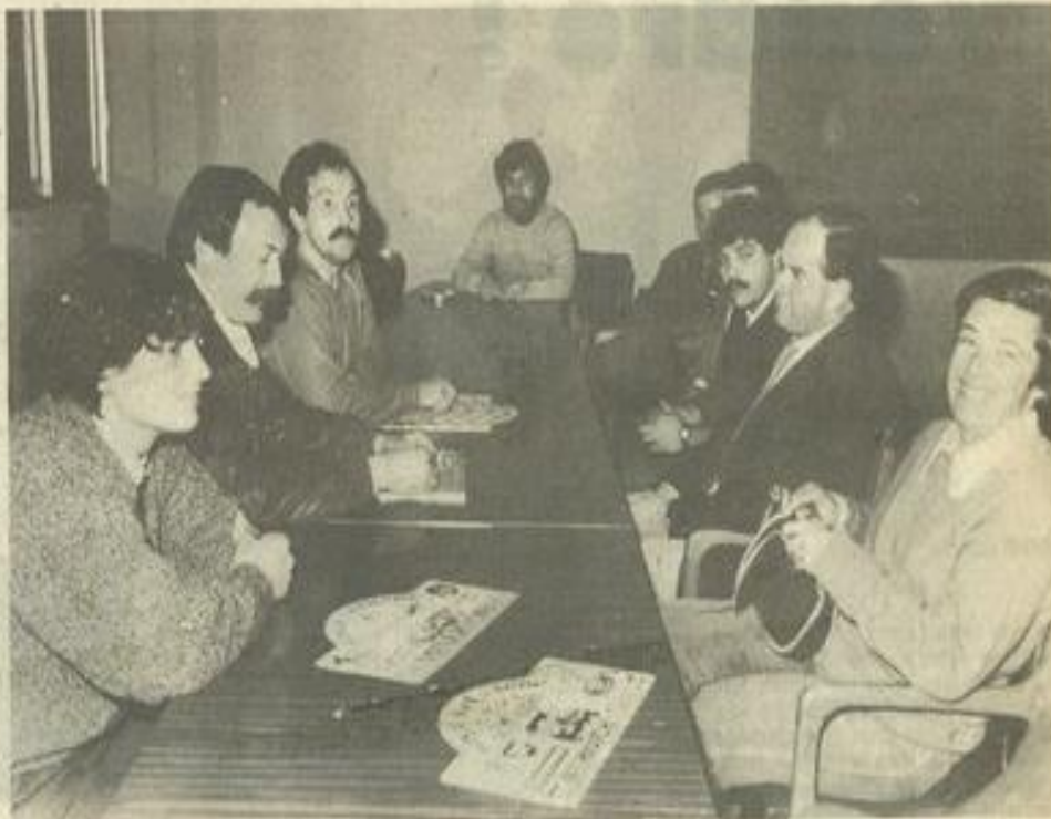
• La réunion constitutive du club