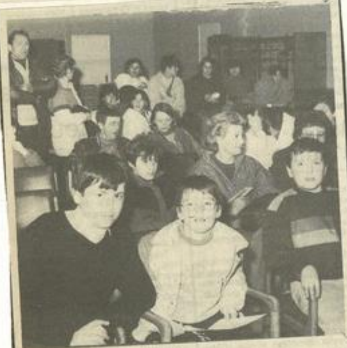
• Préparatifs pour les Baléares.

Les participants doivent fournir une carte nationale d'identité en vigueur depuis moins de dix ans et l'autorisation parentale de sortie du territoire pour les mineurs (délivrée par le commissariat de police), ainsi qu'une autorisation des parents (décharge). Prévoir un repas froid pour le jour du départ.