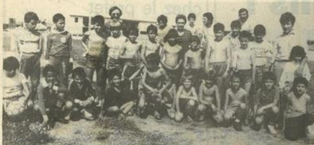
• La rentrée pour les jeunes adeptes du ballon rond