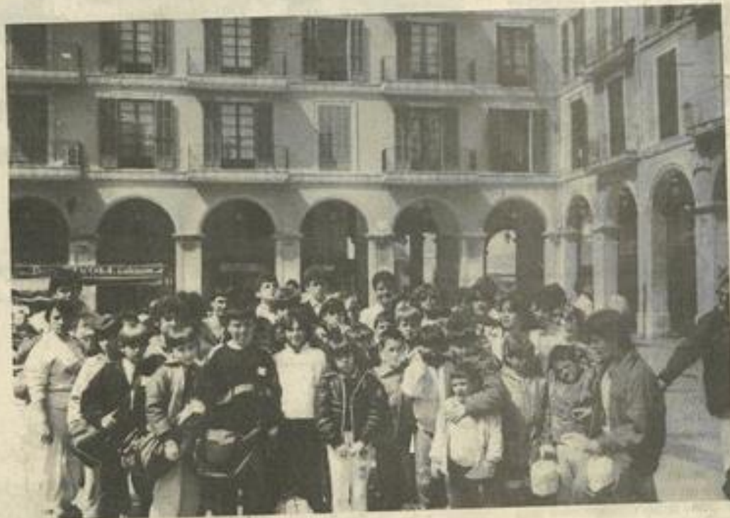
• En visite.

LES vacances sont finies pour les membres du club nautique. Hélas ! C'était si bien. Mais l'an prochain on y reviendra à coup sûr. Les nageurs sont rentrés lundi dans la nuit d'un séjour aux Baléares qui a duré une semaine. Tout s'est bien passé, le voyage en car jusqu'à Barcelone, la traversée en bateau jusqu'à Ibiza, par mer calme, le séjour et le retour. Tous les moyens de transport ont été utilisés (à part la bicyclette)