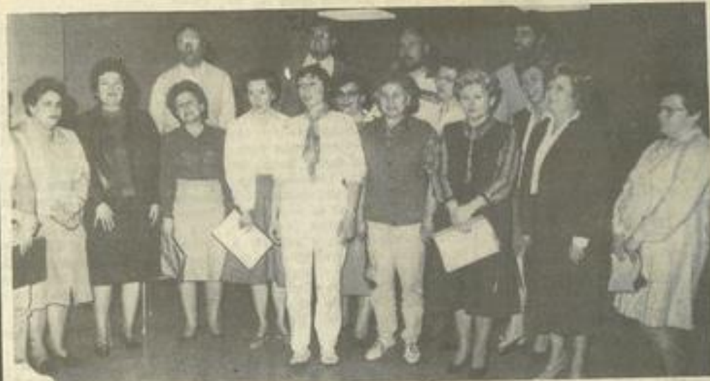
• La chorale, lors d'une répétition.