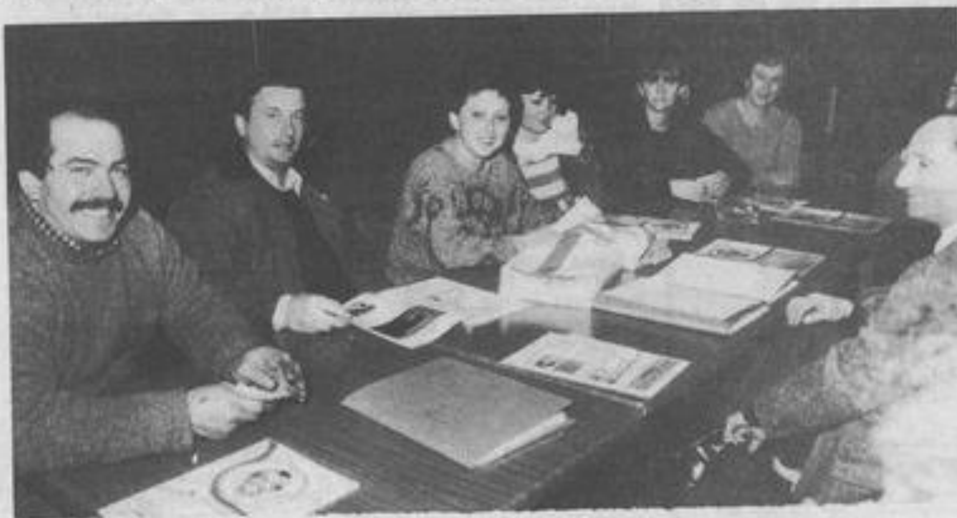
• Soirée de détente pour les randonneurs.