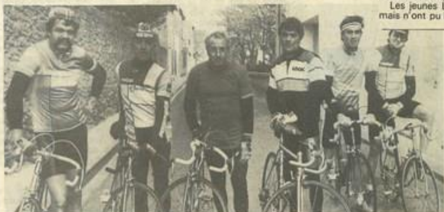
• Un groupe au départ de la M.J.C.