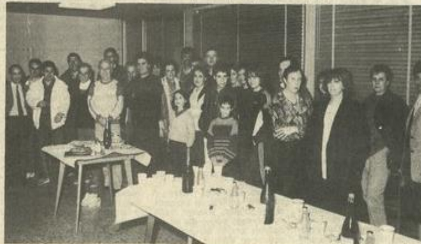
• Une quarantaine de sportifs au rendez-vous des loisirs.

pas, à 8 h 30 devant la M.J.C., c'est le grand départ pour la balade.