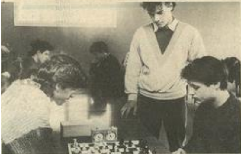
• Un face-à-face concentré.