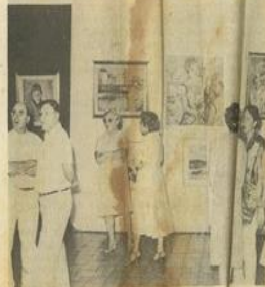
• Le salon où l'on peint est ouvert