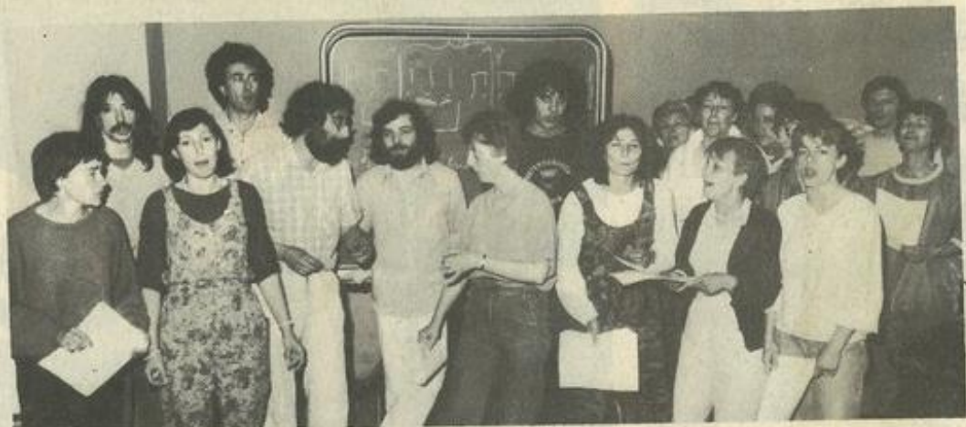
• Une démarche originale avec l'A.S.P.A.M.

L'A.S.P.A.M. espère éditer, dans les mois qui viennent, un document expliquant au grand public sa démarche. Elle a d'autres projets sur le plan local : des ateliers hebdomadaires qui pourraient être mis en place dans l'Aude avec l'aide du Centre d'études polyphoniques de Montpellier ; un projet bimensuel de travail vocal animé par