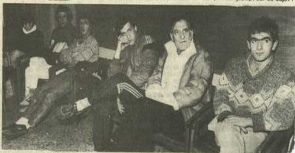
• Un auditoire peu nombreux mais attentif.

l'on parlait des autres drogues tolérées par la société comme l'alcool ; y aurait-il plus de monde dans la salle pour un débat sur ce sujet ?