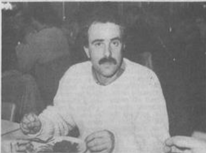
● Bon appétit, M. le Président

Le Moto-club Corbières s'est réuni vendredi soir à la M.J.C. au cours d'une réunion fleuve, qui a été agrémentée par un repas amical. Au Moto-club, on ne se réunit pas pour rien.