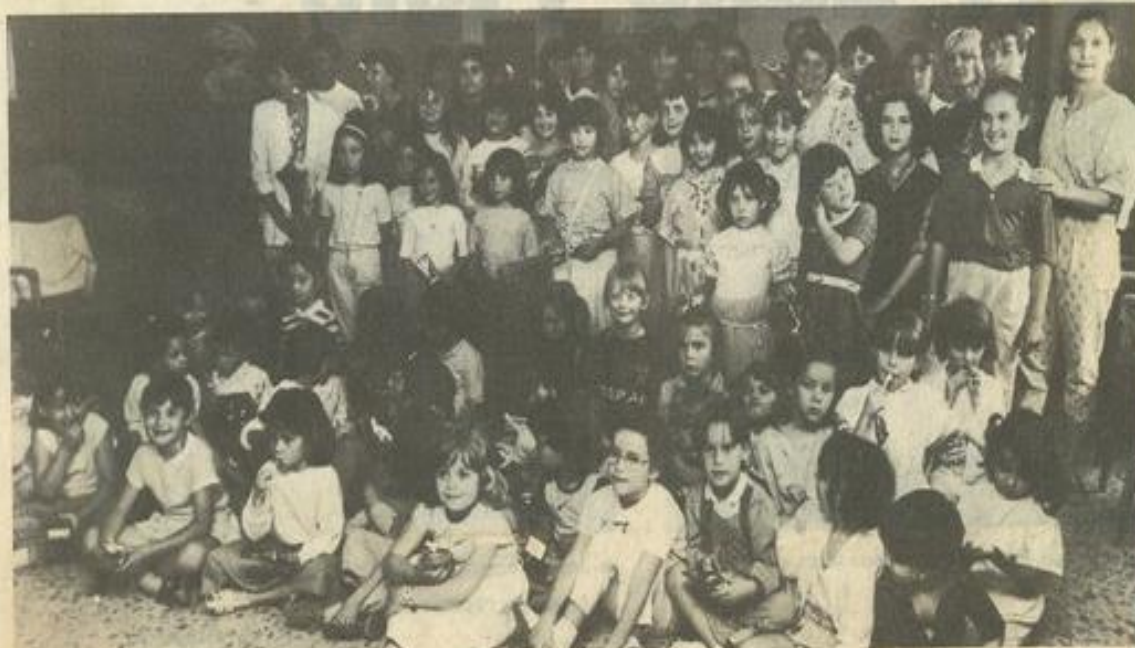
• Les jeunes danseurs n'ont plus le trac