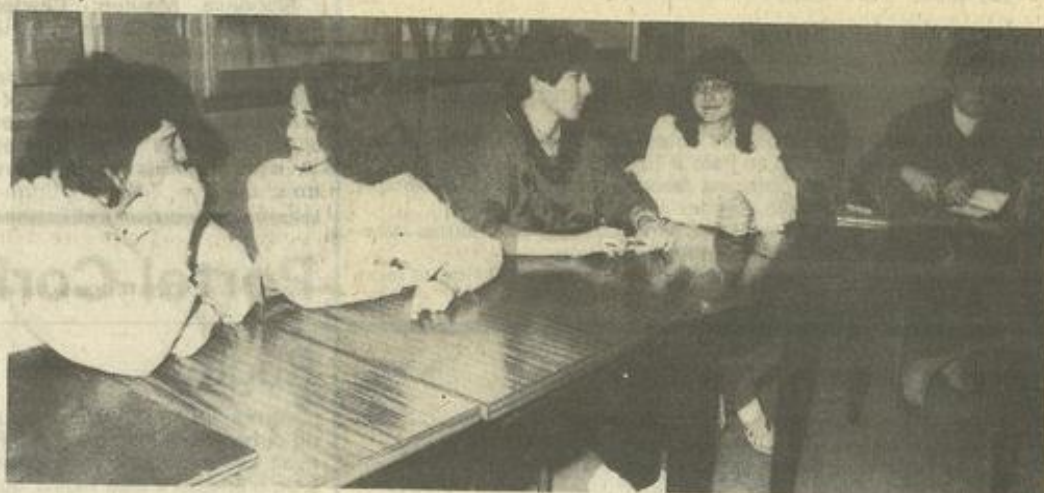
• Deux aspects de la réunion préparatoire.