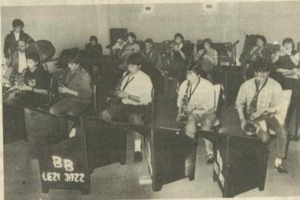
• Une répétition du "B.B. Lézi-jazz"

Leurs goûts peuvent se regrouper autour de compositions relativement anciennes telles que Benny Goodman, Stompin'at the Savoy, Duke Ellington, Ca-