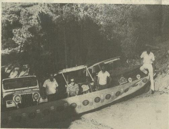
• La piste Thierry-Sabine sera l'un des points forts de cette concentration