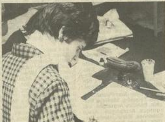
• Chacun selon son inspiration.

L'école de dessin fonctionne, à la M.J.C., tous les mercredis de 16 h 30 à 18 h 30. Pour y participer, il faut prendre la carte des