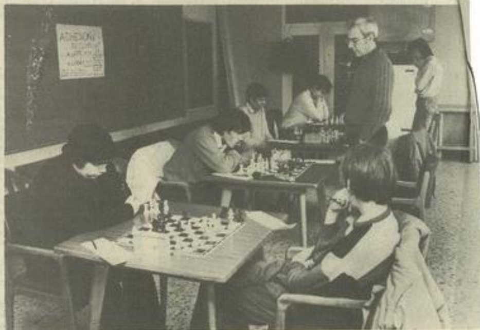
• La M.J.C. transformée en salon où l'on joue