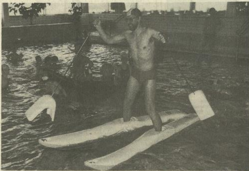
● Dans la piscine couverte de Lauterbach on peut, certains jours, utiliser tous objets flottants.

Le parlement de Lauterbach a voté le budget de la ville pour l'année 1986. Au total, Lauterbach dépense 38 millions de DM.