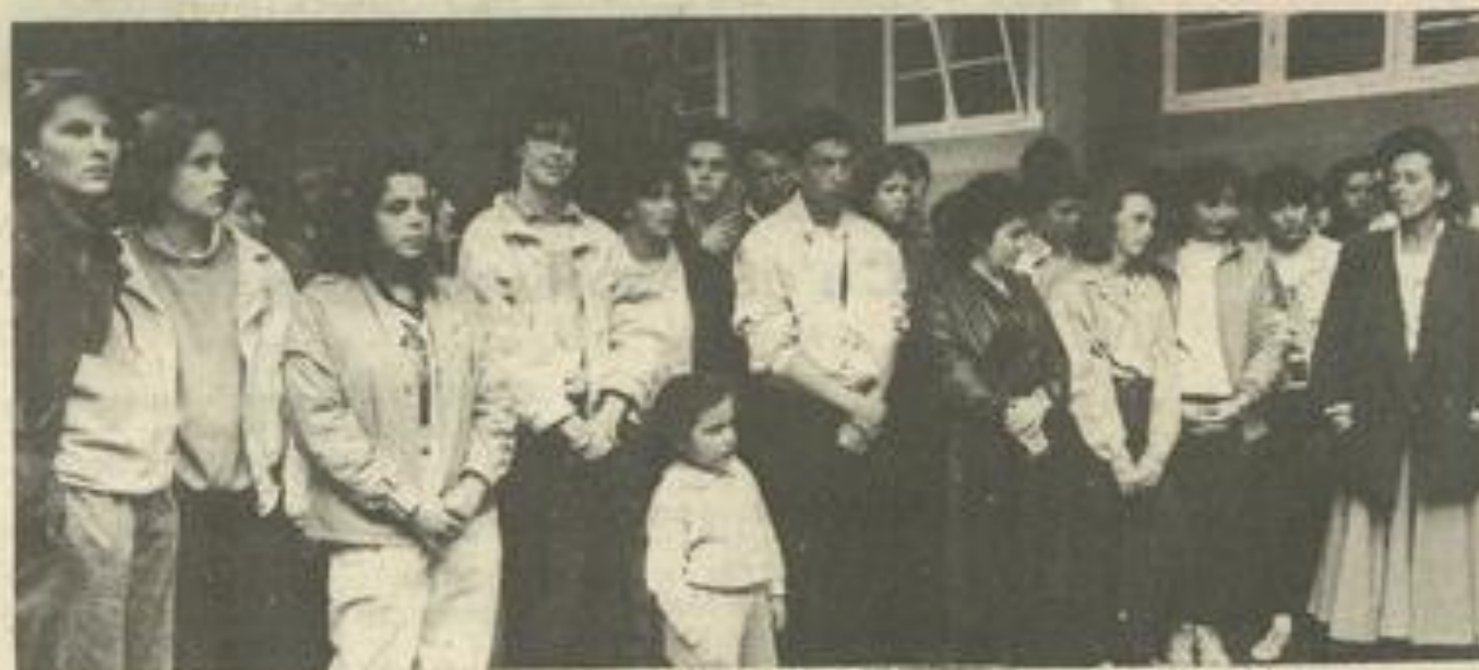
• Les jeunes Brêmois