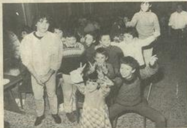
• Les enfants sont de la fête.

Le Football club Lézignan-Corbières organisait samedi soir, à la M.J.C., un cassoulet géant, à l'intention de ses membres. Plus qu'une soirée gastronomique, il s'agissait d'une soirée amicale, dans le cadre des relations de camaraderie qui unissent les membres du club. Les anciens sont habitués à ces soirées fort sympathiques ; pour les nouveaux, c'était l'occasion de faire connaissance. Il est plus facile, certes, de s'entendre autour d'un bon repas que sur le terrain, mais il est vrai que le premier contribue au second.