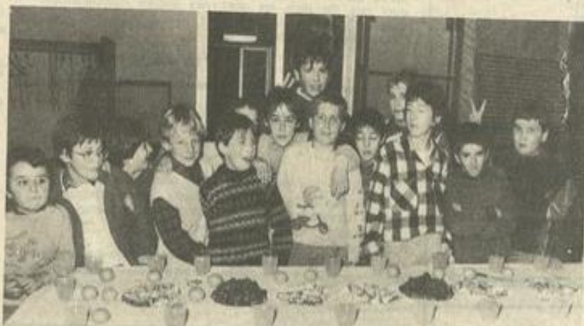
• Une partie des jeunes treizistes : ce n'est pas la mêlée, mais presque.

Le goûter, ensuite, ne fit pas long feu, tant les appétits étaient aiguisés. Les jeunes treizistes ont montré qu'ils sont aussi vaillants devant une table que sur le terrain.