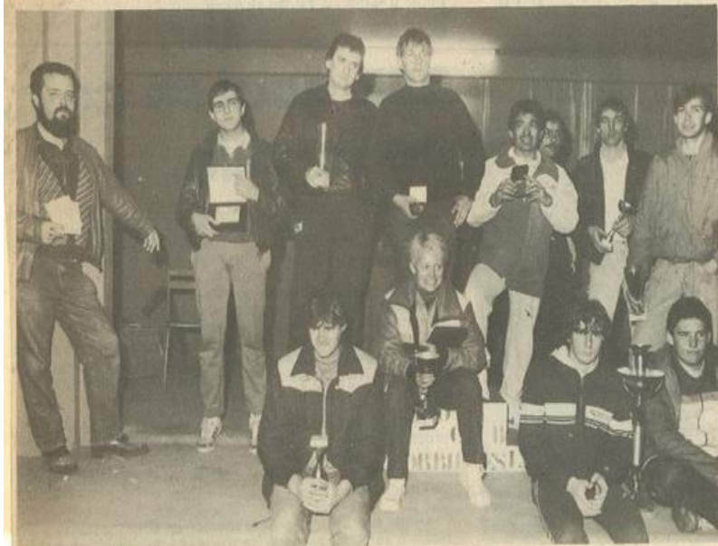
● Réconfort de la remise des prix.

Ce trial ne compte pas pour le championnat de ligue. Il y aura, cette fois, du soleil, on peut du moins le souhaiter.