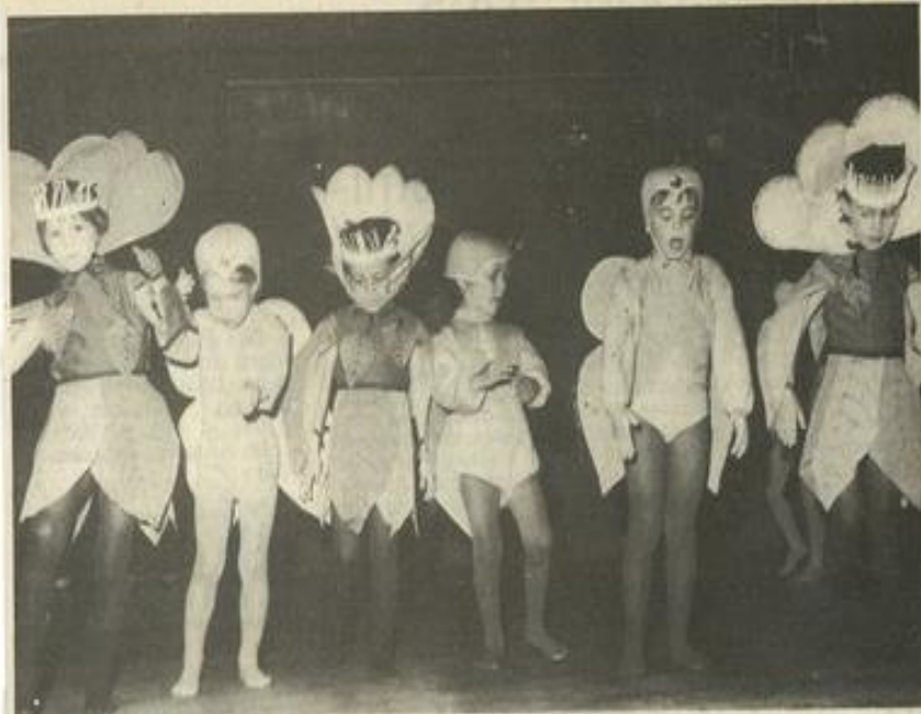
• Emilie Jolie, un conte merveilleux

Devant un Palais des fêtes archi-plein, les élèves de l'école de danse MJC de Mmes Coux et Soulayrac ont présenté samedi soir le résultat d'une année de travail. Le public, bien que complice et séduit d'avance à l'idée de voir évoluer "la petite" ou "le petit", a largement apprécié cette prestation, montrant par ses applaudissements fournis à quel point la qualité du spectacle a été reconnue.