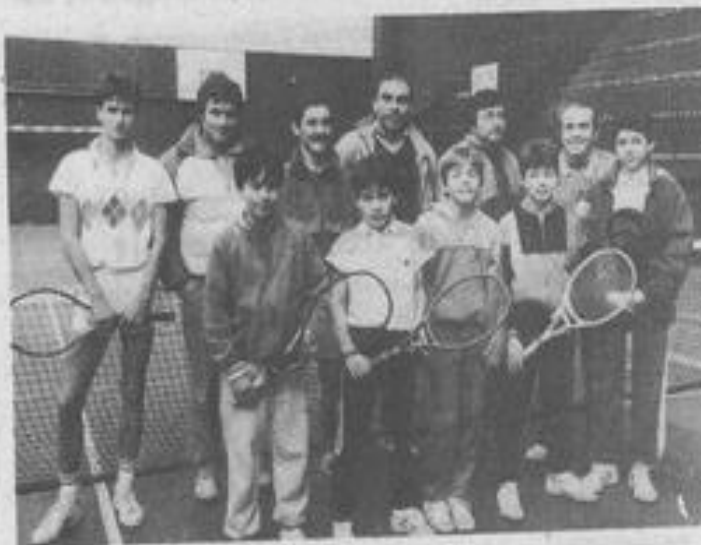
● Bonnes performances pour les tennismen.

En 3 e série messieurs, Lézignan I bat Port-la-Nouvelle I 6-1 ; Lézignan II bat l'ASCN I 4-3 ; Lézignan III bat Fleury I 6-1 ; Lézignan IV bat Cuxac I 5-2.