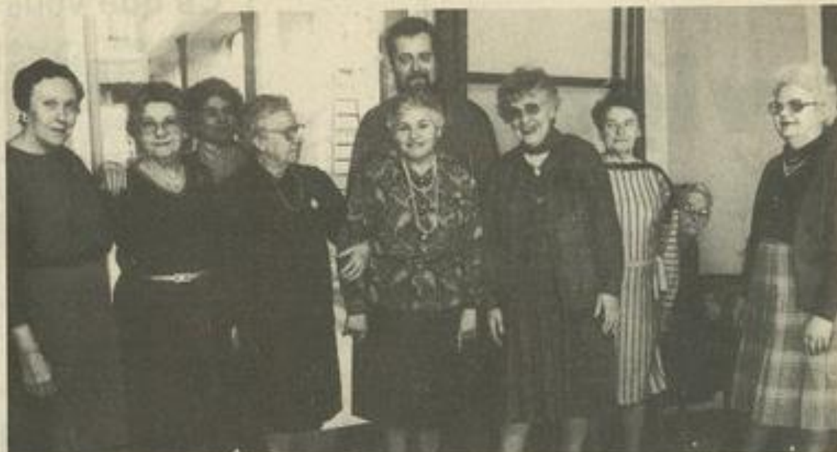
• L'année commence bien.

D'autre part nous vous rappelons qu'une section de gymnastique douce 3 e âge est ouverte à la M.J.C. tous les vendredis de 16 h à 17 h. Les inscriptions se font au foyer.