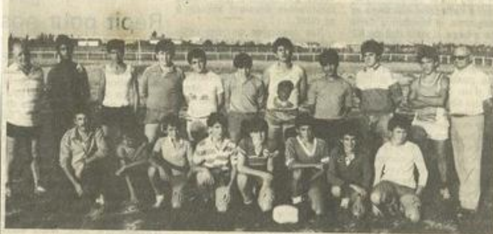
• Premier entraînement pour les minimes.