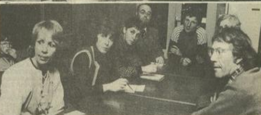
• Les membres du 3 e âge ont joué au loto.