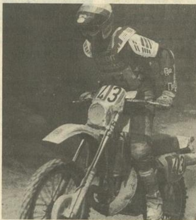
• En danseuse !