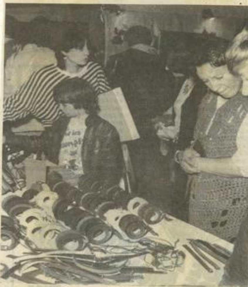
▲ Les artisans de toute la France répondent chaque année présent, photo Costesèque.