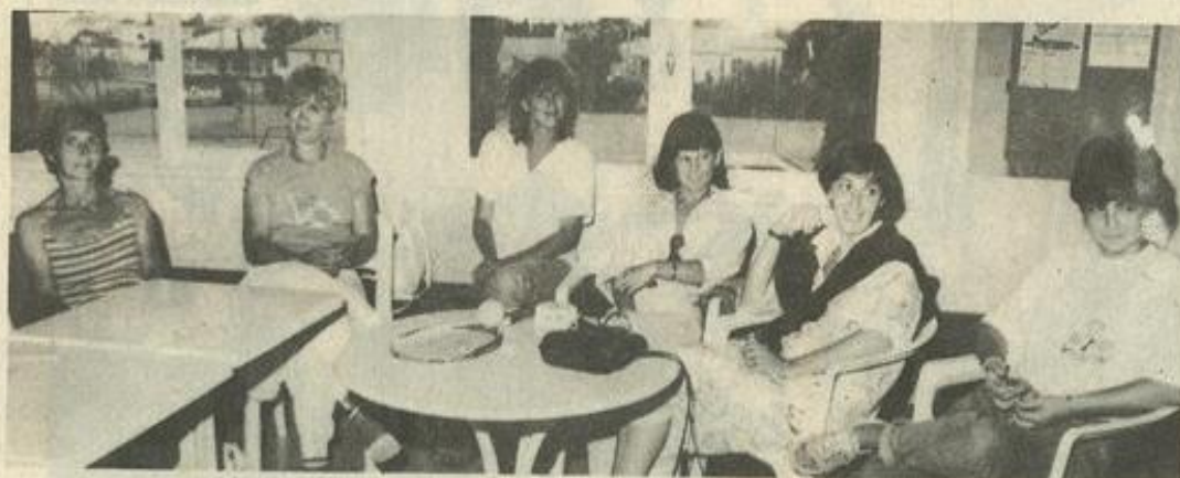
• Ces dames sur le chemin de la compétition.