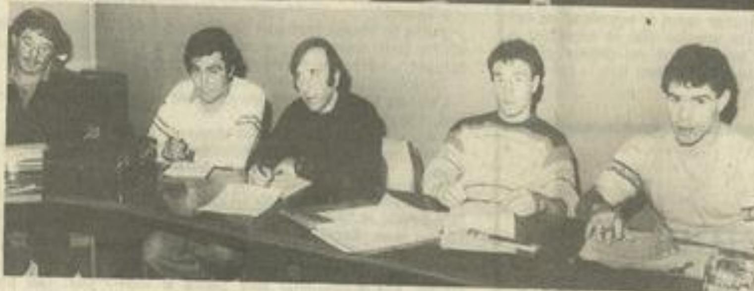
● Les formateurs en formation.