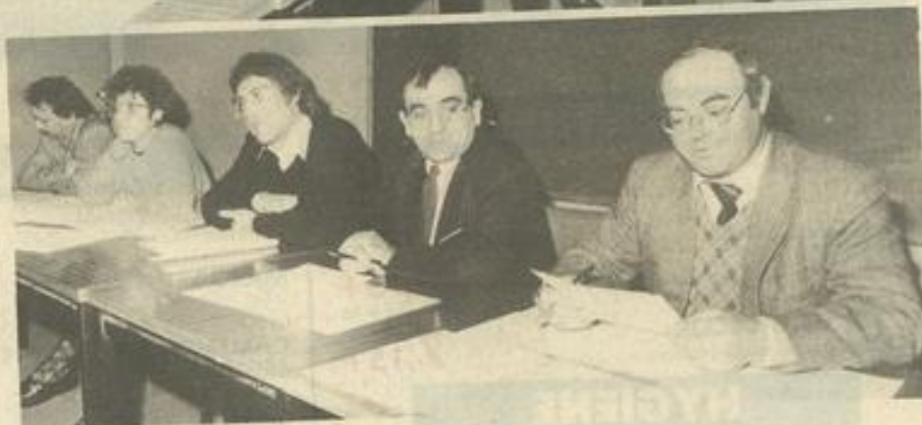
• Les derniers travaux avant l'assemblée générale.