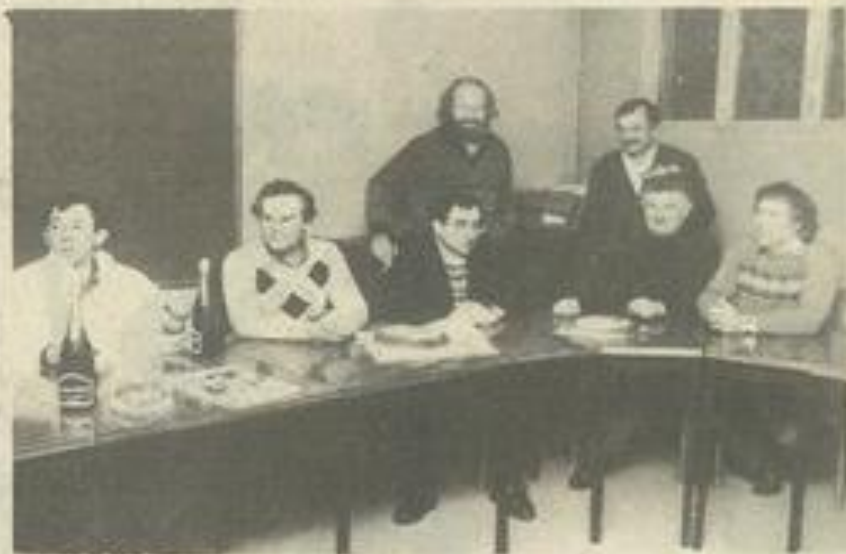
• Le rendez-vous de la galette des rois