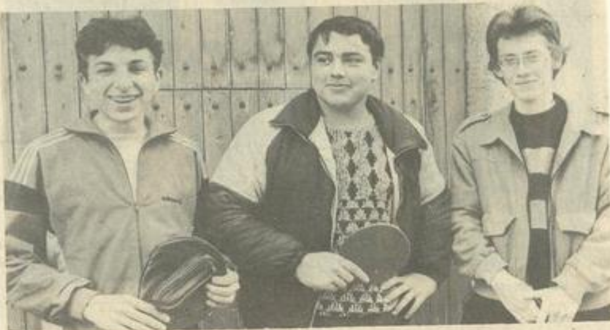
• Une équipe jeune qui peut gagner cette finale.