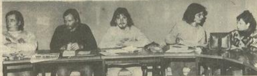
• Les jeunes paysans travailleurs