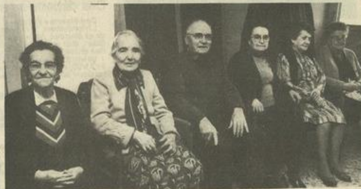
• Un bien bon goûter.

la plus forte diffusion sur l'Aude et les Pyrénées-Orientales