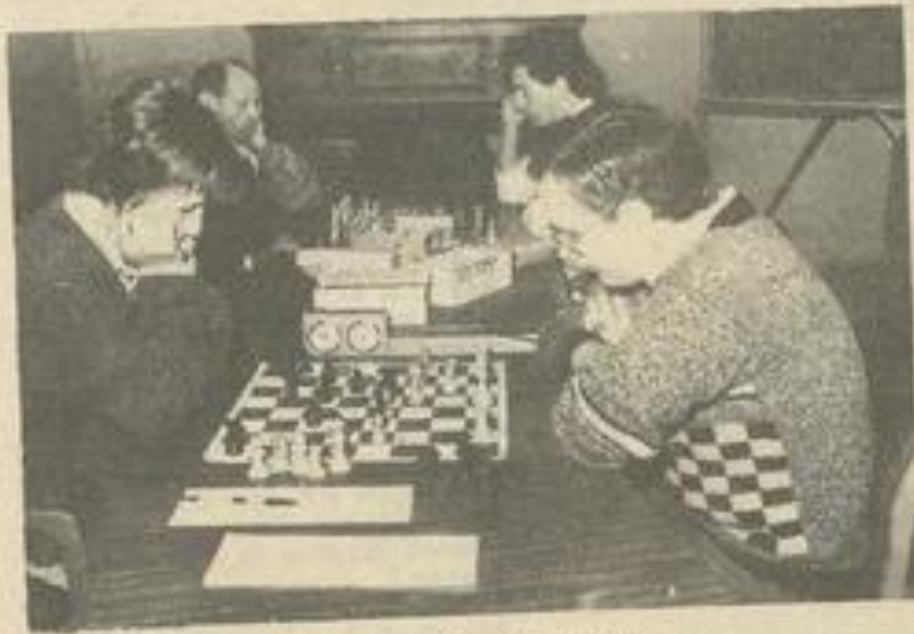
• Pendant l'affrontement de la matinée.