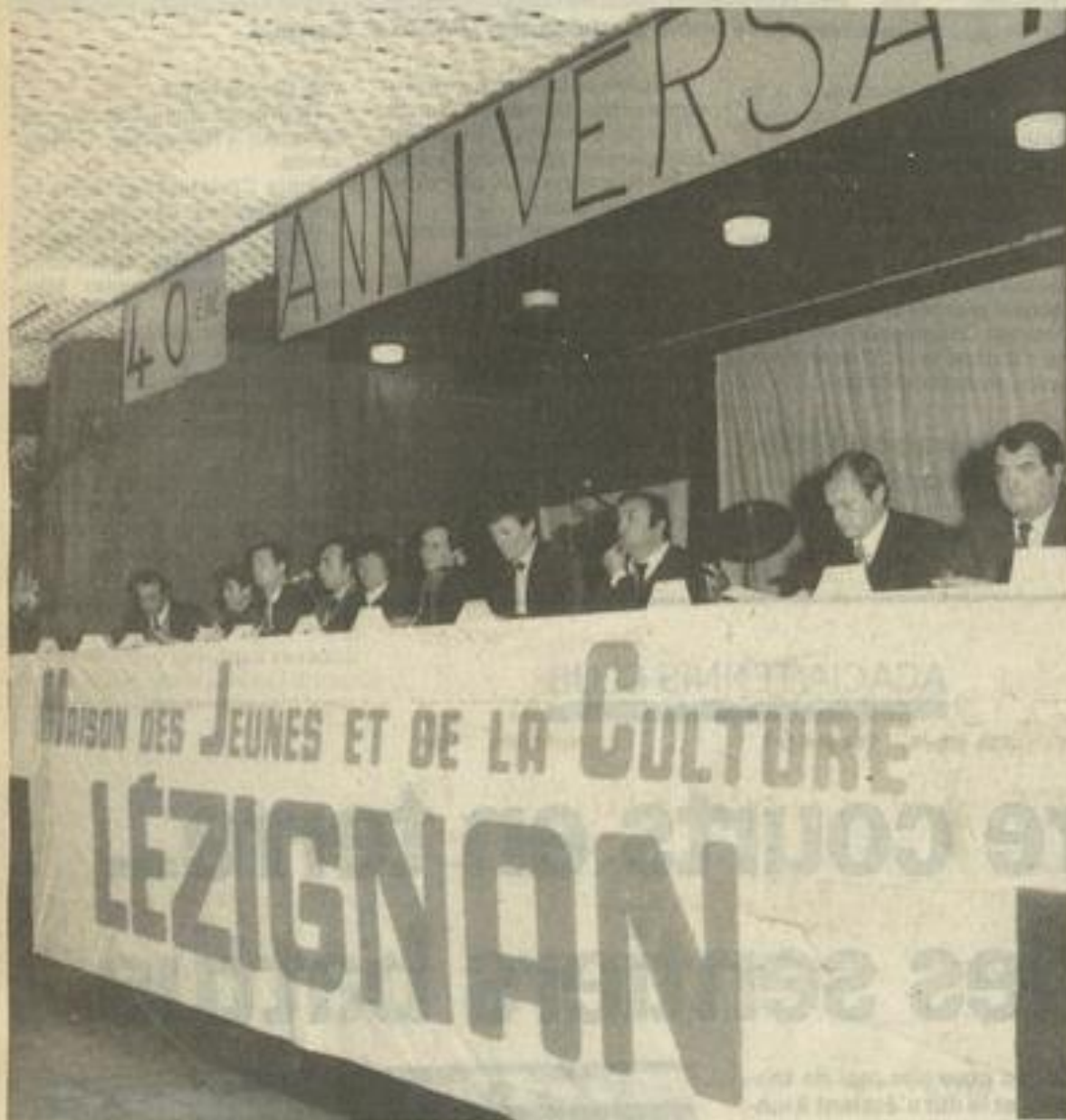
▲ Une assemblée générale placée sous le signe du quarantième anniversaire de la M.J.C.

La soirée se prolongea fort tard par une nuitée dansante où régna une ambiance... terrible.