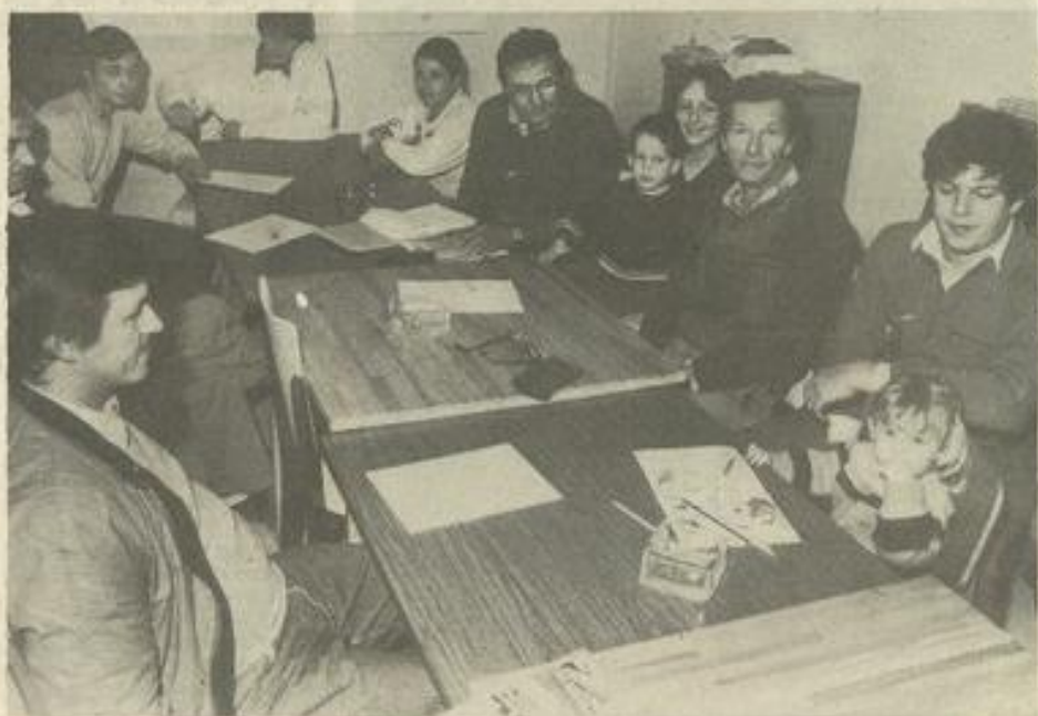
• La réunion préparatoire.