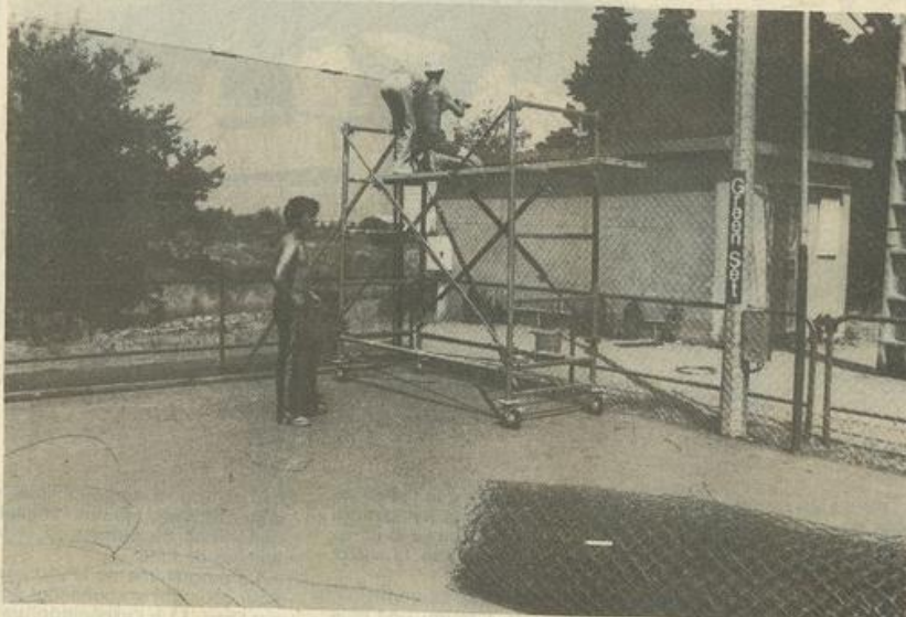
• On place le grillage.

Ce XII e tournoi mettra en jeu 500 joueurs et joueuses, 1500