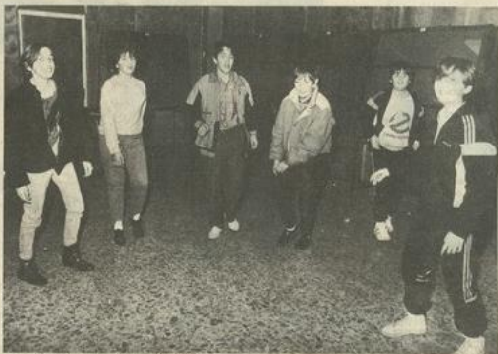
• ... à la danse, les jeunes à la M.J.C.

Age tendre, l'âge auquel tout est permis, tous les espoirs, et en tout cas le droit de s'amuser. Mettre un