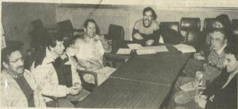
• La réunion préparatoire