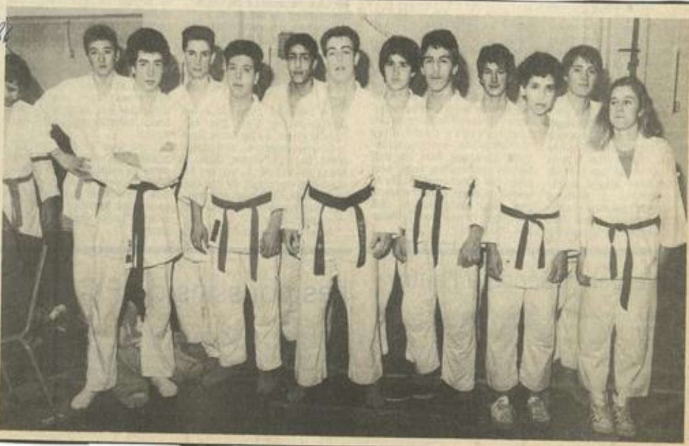
• Les judokas sur le tatami lézignanais

Les qualifiés de chaque catégorie disputeront prochainement le championnat de ligue, dans lequel les Audois ont, de manière générale, des places à prendre et de fortes chances d'y parvenir. Les vainqueurs poursuivront ensuite dans les championnats interrégionaux puis le championnat de France. Souhaitons que les clubs de notre département aillent le plus loin possible dans cette compétition.