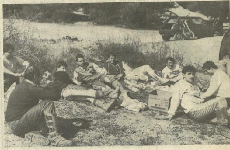
• Déjeuner sur l'herbe pour les motards.