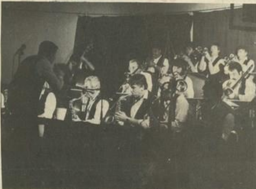
• Samedi soir, un régal pour les mélomanes.