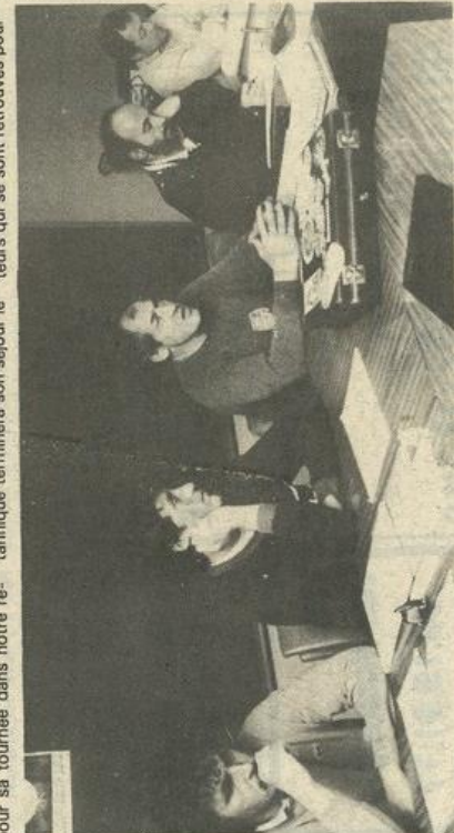
• Les éducateurs au travail

ENCORE une période placée à Lézignan sous le signe du coq. D'une part, l'équipe cadette de Grande-Bretagne s'installe au Centre international de séjour, choisi comme base pour sa tournée dans notre région. Une tournée qui l'amènera à Villeneuve-sur-Lot, au Barcarès et à Carcassonne avant la rencontre à Lézignan contre la sélection des cadets français, le 27 mars à 15 h. L'équipe britannique terminera son séjour le 31 mars. Mais auparavant elle sera également accueillie à Lézignan.