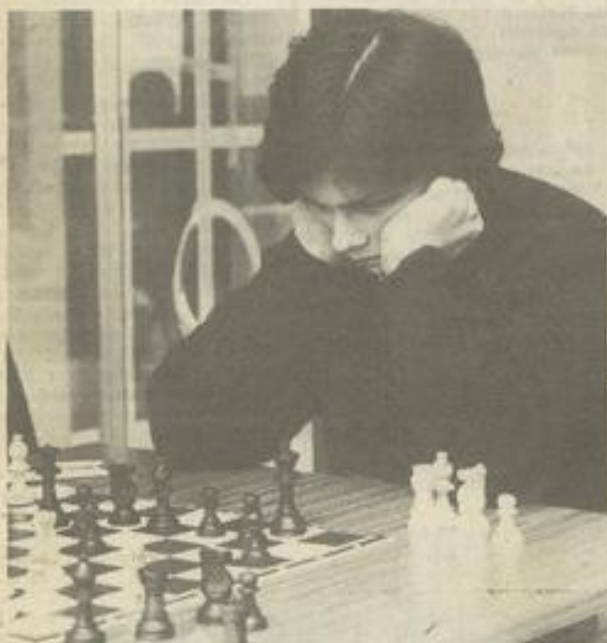
• L'heure de la concentration