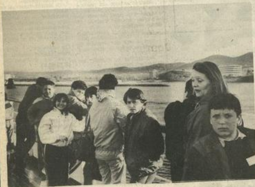
• Sur le bateau.