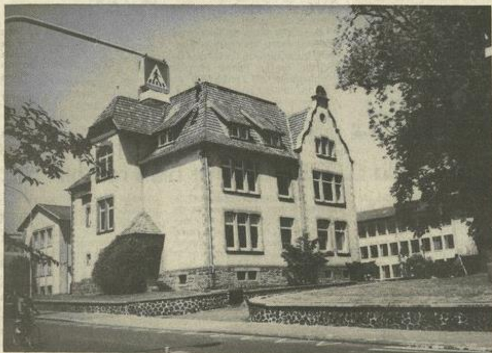
● La partie ancienne du lycée « Alexander von Humboldt ».