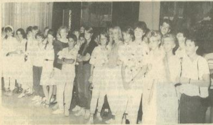
● Pendant les discours