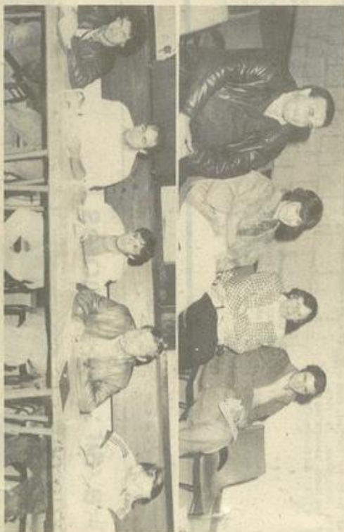
● La réunion de l'U.L. des M.J.C.