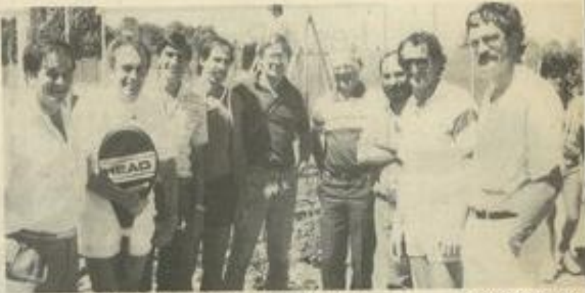
• Les responsables du club de Carnon reçus par le T.C.L.