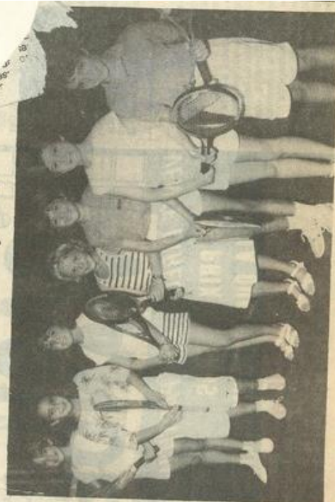
• Une belle brochette.

Dès le mini-tennis, dès l'âge de 6 ans, déjà on peut prétendre à participer aux championnats. C'est de la bonne graine de champions que l'on prépare ainsi à l'école de tennis.