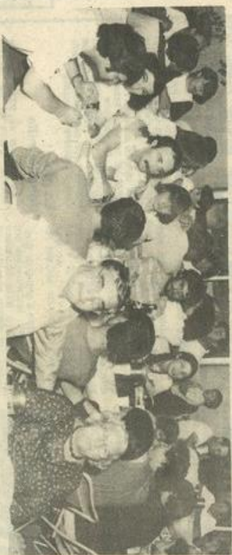
• Repas décontracté à la M.J.C.

Pot de l'amitié : La séance s'est terminée par une coupe de cidre bouché et des gâteaux dans une excellente ambiance. Fin de la séance à 23 h 15.