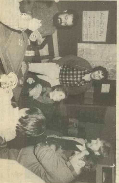
• Parties serrées mais dans la bonne humeur