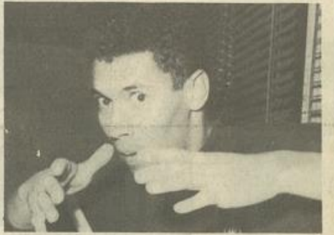
• Et des comédiens qui s'expriment