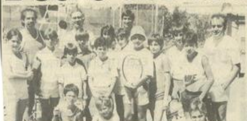
• C'est parti pour les jeunes.