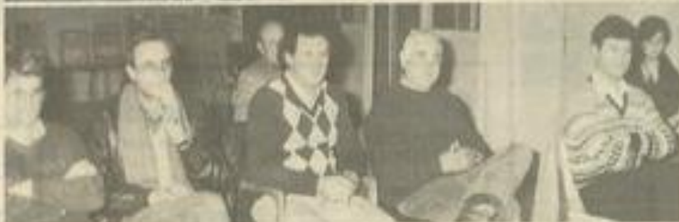
• L'assemblée générale de La Patriote.

faire venir en contrepartie des tireurs à Lézignan.