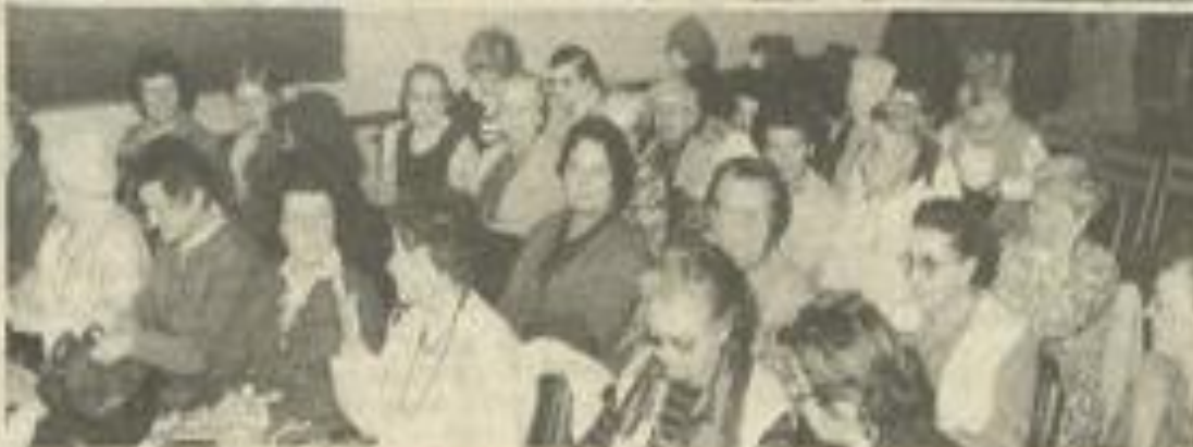
• Deux vues de cette journée