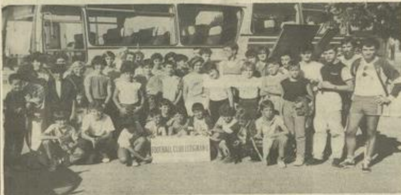
• Le départ.