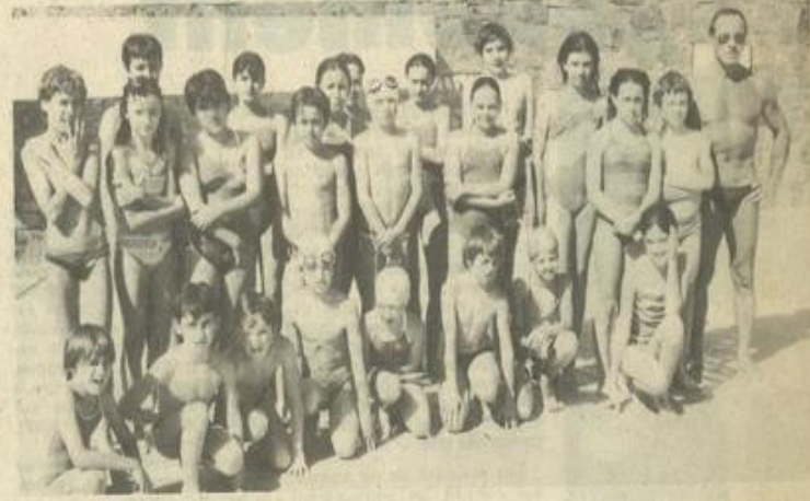
• Le club de natation

LA chaleur qui maintenant est bien arrivée sur la région est une raison suffisante pour aller se tremper dans l'eau à la piscine municipale. Mais elle n'est pas la seule. La douceur de l'air et le ciel bleu rendent tout à fait agréable la pratique des sports nautiques et si, en hiver, ceux-ci peuvent faire hésiter les frileux ce n'est plus le cas à l'heure actuelle. L'école de natation a ouvert ses portes, et le club de natation, pour sa part, a pris ses quartiers d'été, laissant pour deux mois le bassin de la piscine de Capendu.