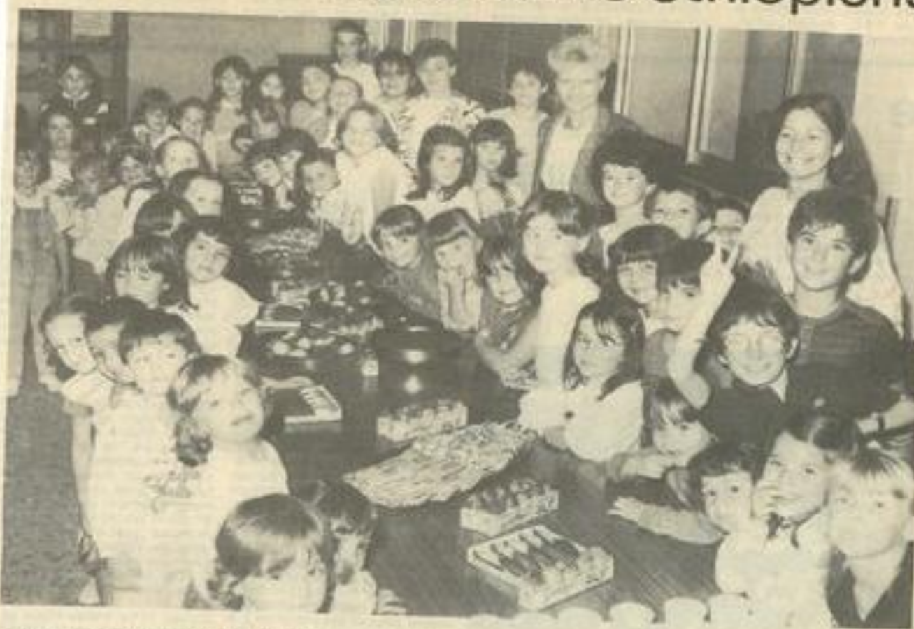
• Les élèves de Mme Coux et Soulayrac au moment du goûter.