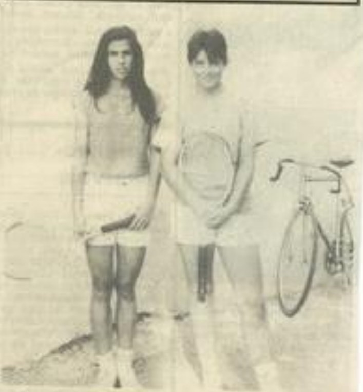
• Deux jeunes filles au tournoi.