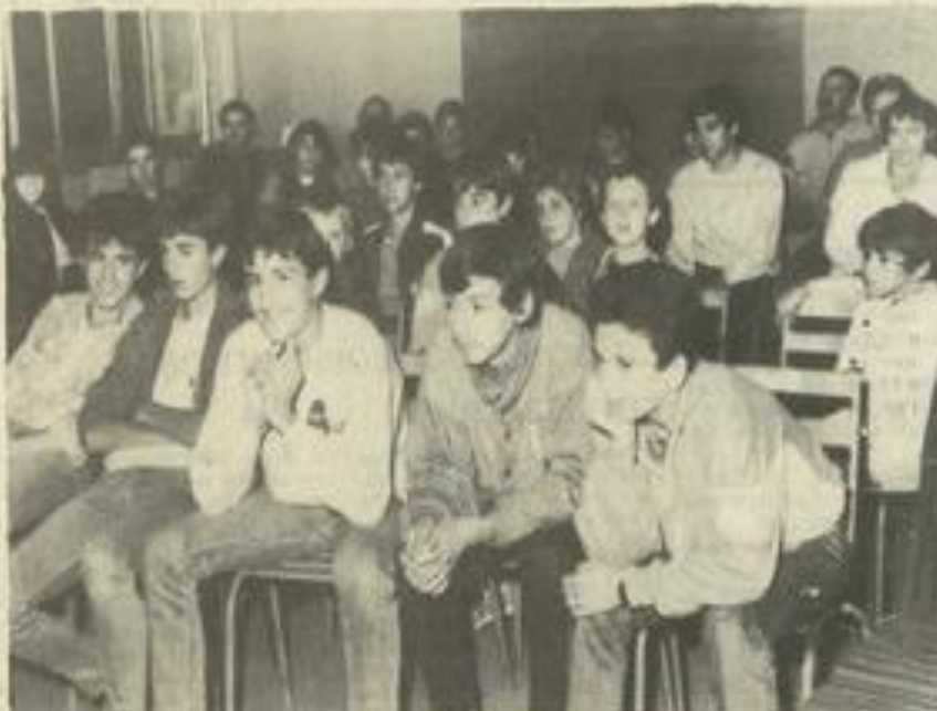
L'assemblée générale de la J.S.L.