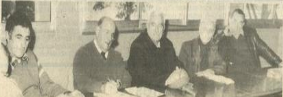
● La réunion des libres penseurs.