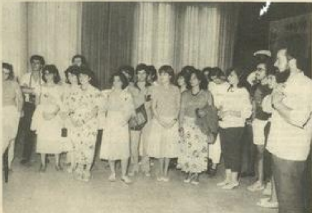
• Les stagiaires.