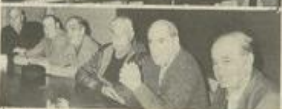
• La réunion cantonale des A.C.P.G.-C.A.T.M.