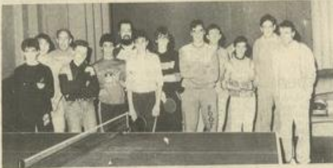
• Tournoi à la M.J.C.