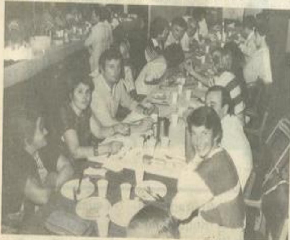
• Un repas en toute amitié.