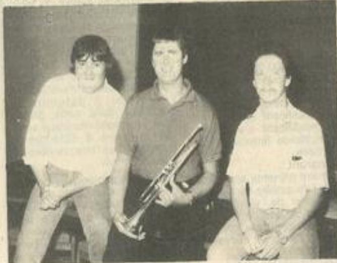
• Des musiciens "haut de gamme" (Photo Costesèque)

Alors plus de complexes. On peut, à Lézignan, faire aussi bien qu'ailleurs. Bien sûr, ce n'est pas tout cuit. Mais avec un esprit ouvert aux évolutions actuelles, on peut aller loin.