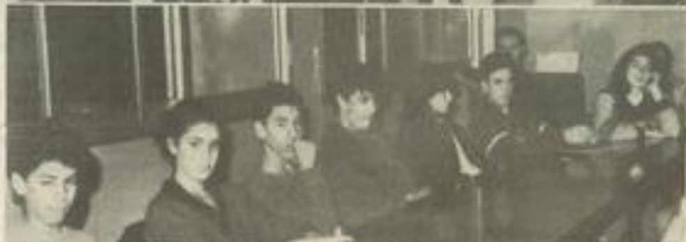
• L'assemblée générale de la J.S.L.