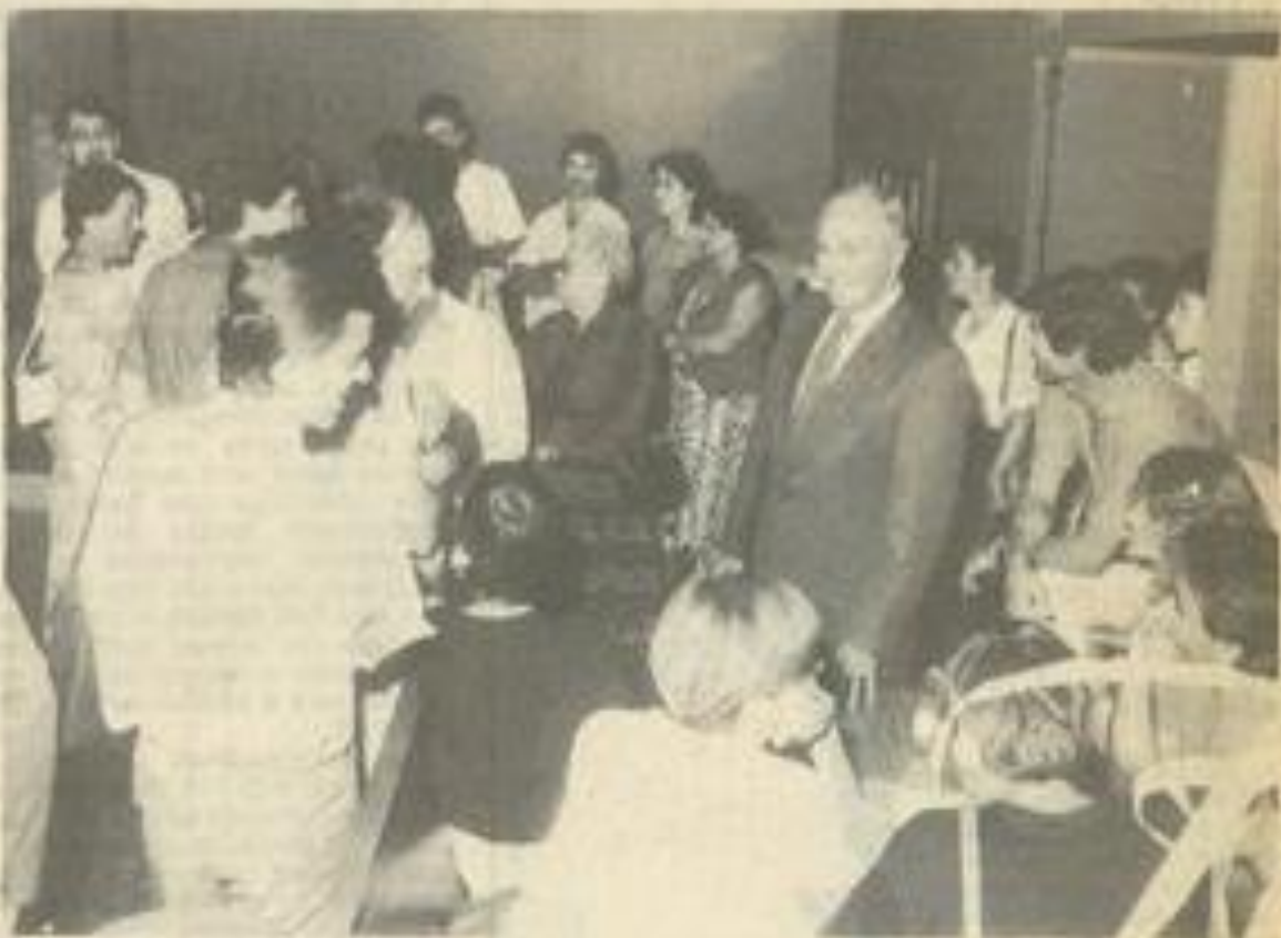
• Entouré de ses amis.