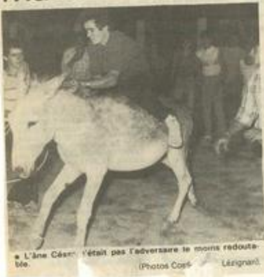
• L'âne César, c'était pas l'adversaire le moins redoutable.

Lézignan, stade de la Rouminguière, la Manade Jean et le Football-club Lézignan-Corbières font match nul, 1-1. Bon public, temps légèrement venté mais agréable, arbitrage correct.