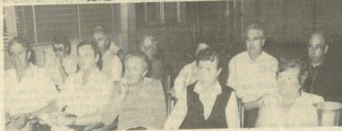
• La réunion des randonneurs