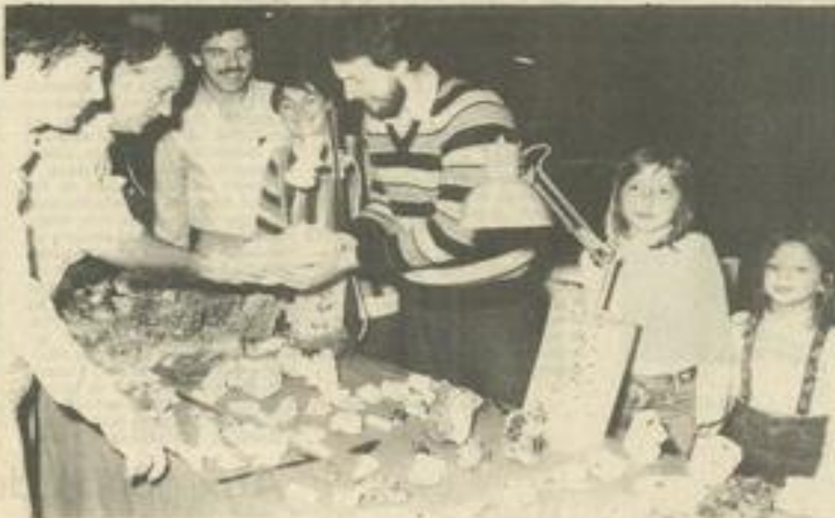
• Des minéraux, mais aussi des plantes, ce week-end, au Palais des fêtes

E XPOSITION florale et bourse aux minéraux vont égayer, ce samedi et ce dimanche, le Palais des fêtes, à l'occasion de la 8 e bourse aux minéraux, doublée depuis trois ans d'une exposition de plantes vertes, plantes fleuries et fleurs séchées.