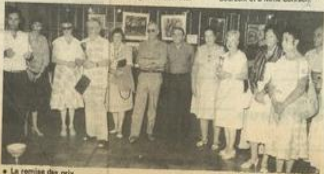
• La remise des prix