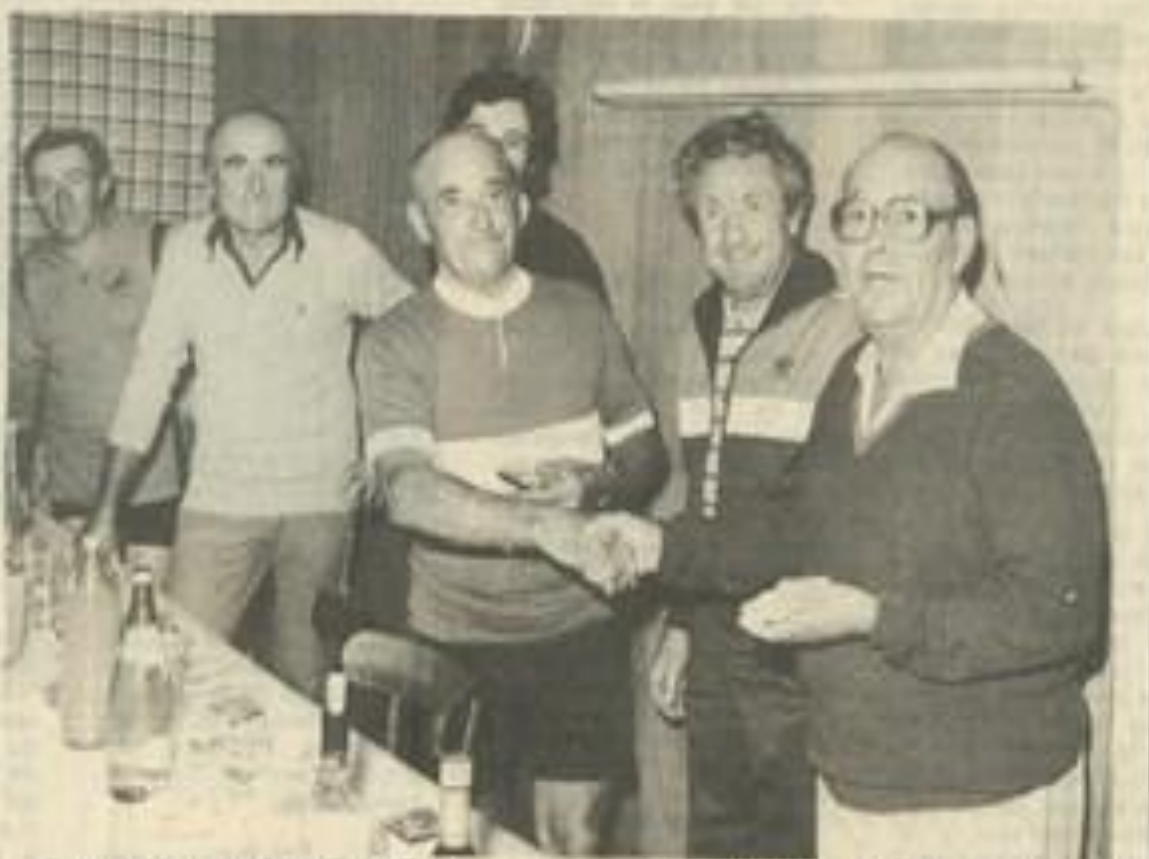
• Des randonneurs, lors d'un rallye.

Ce club sportif lézignais ne perd rien de son dynamisme et de sa fraîcheur, toujours prêt à monter en selle pour profiter du calme matinal et de la douceur estivale. Certes, le vélo demande toujours un certain effort, qui de toutes façons est dosé selon l'entraînement de chacun. Mais un effort ô combien satisfaisant, à la fois pour l'organisme et pour le moral.