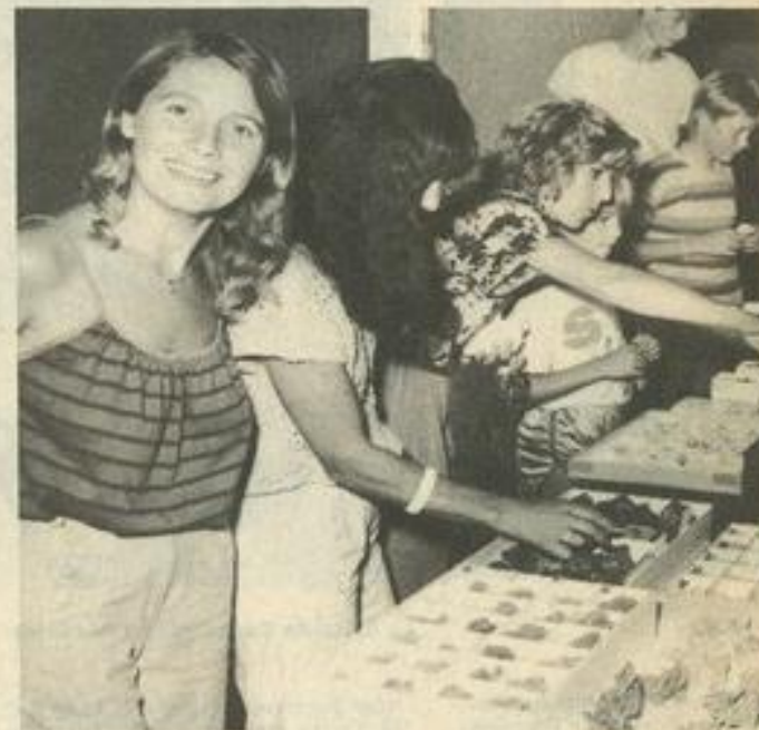
• De nombreux visiteurs.

Le goût de cette collection lui a été donnée par son cousin. Depuis il s'y intéresse et s'y connaît : "J'aime bien la calcite, les roses des sables mais aussi les fossiles, le quartz, les