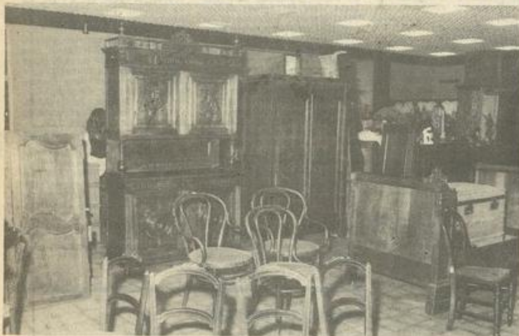
• Des meubles et de la brocante.