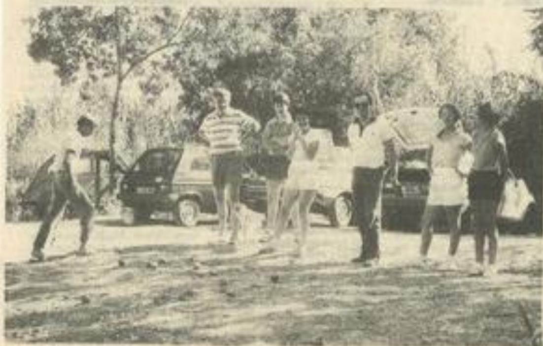
• Photo d'accord mais loisirs d'abord.