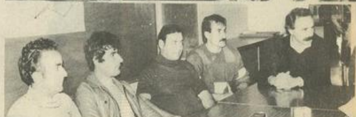
● La mise en place de la saison de tarot.