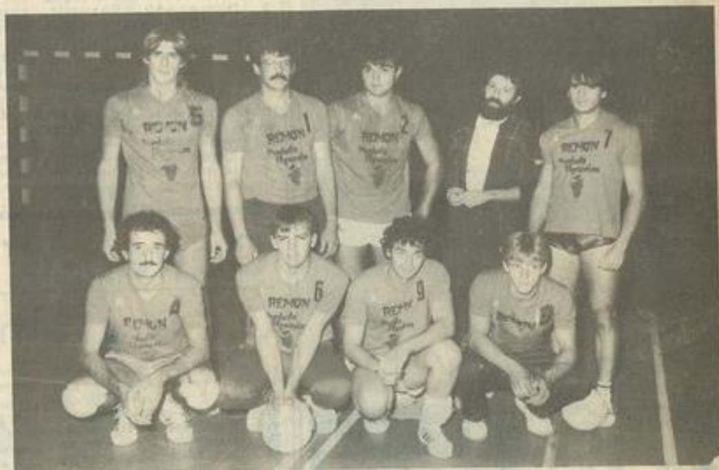
• L'équipe de l'Entente.

A Lézignan, samedi soir au gymnase Léo-Lagrange, le F.L.L. Agde a battu l'Entente Lézignan-Roubia 3 à 0 (15-8, 15-10, 15-12).