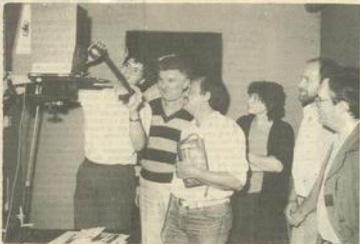
• Les membres du Photo-club essaient leur nouvel agrandisseur.

Signalons que la cotisation du Photo-club (60 et 40 F pour les étudiants et chômeurs) permet d'utiliser le laboratoire de la M.J.C. et les deux appareils photo.