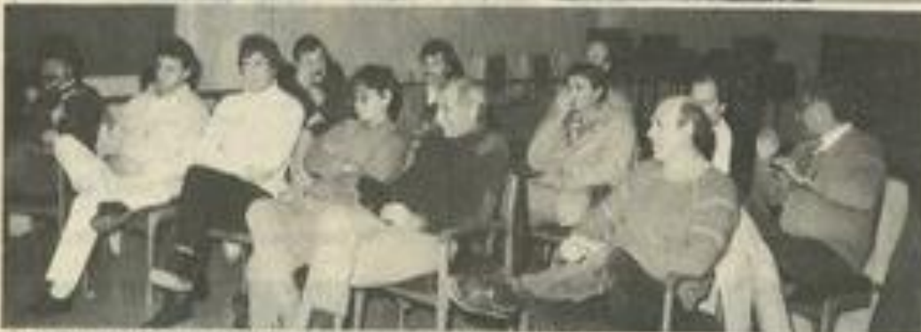
Le bureau départemental et les adhérents de la F.F.M.K.R.