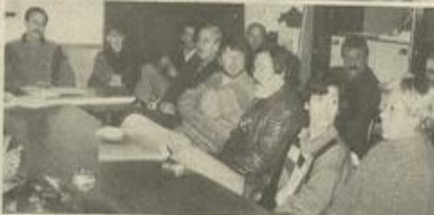
● Les antiquaires et brocanteurs audois au café de France.