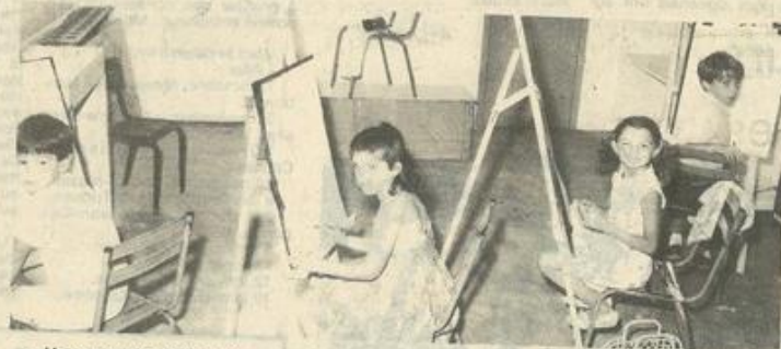
• Une nouvelle salle et des chevalets.

"Nous aurons de la place" dit M. Vigoureux "et nous serons plus à l'aise; l'an dernier les élèves dessinaient à plat, sur des tables, avec les chevalets, je pense qu'ils feront des progrès beaucoup plus importants".