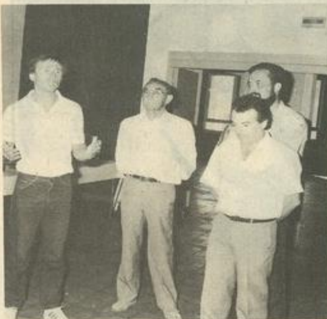
• Prologue de la manifestation, l'inauguration.

Les premiers sont plutôt destinés à l'achat-souvenir. De nombreux visiteurs se laissent tenter par la petite pièce à 10 F qui viendra se ranger entre deux bibelots. Les plus chers de-