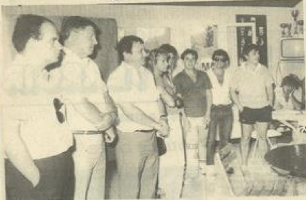
• L'ouverture du tournoi.