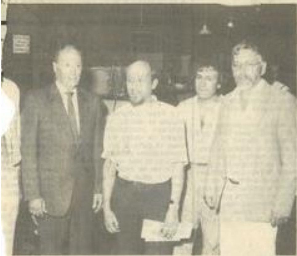
• au côté de ses collègues.