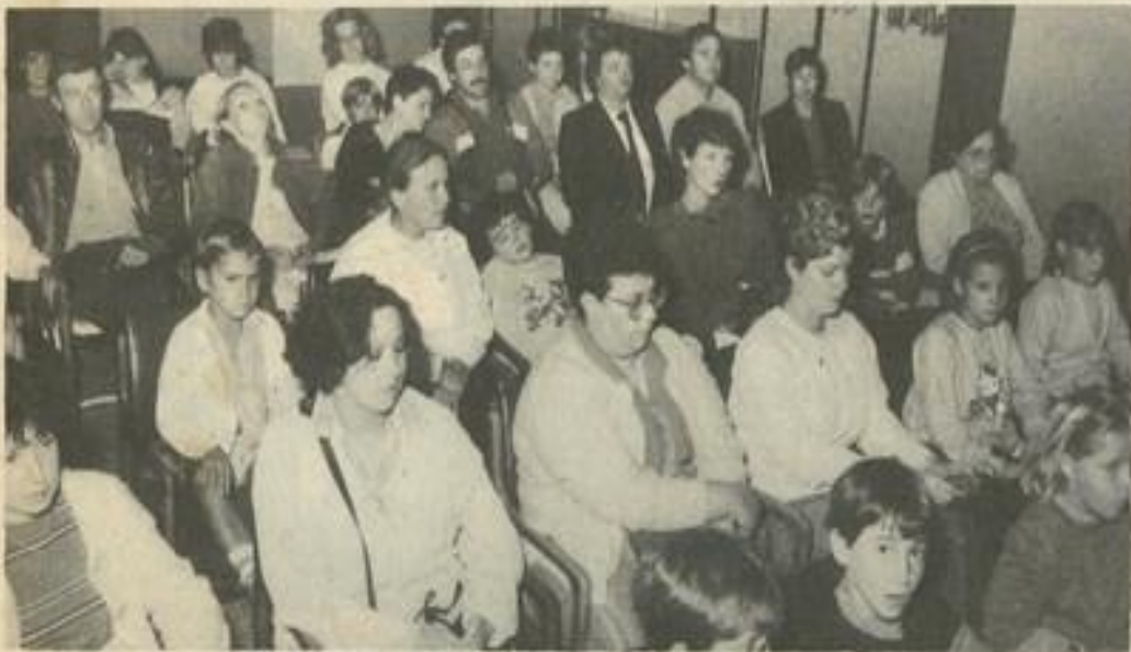
● Parents et nageurs.