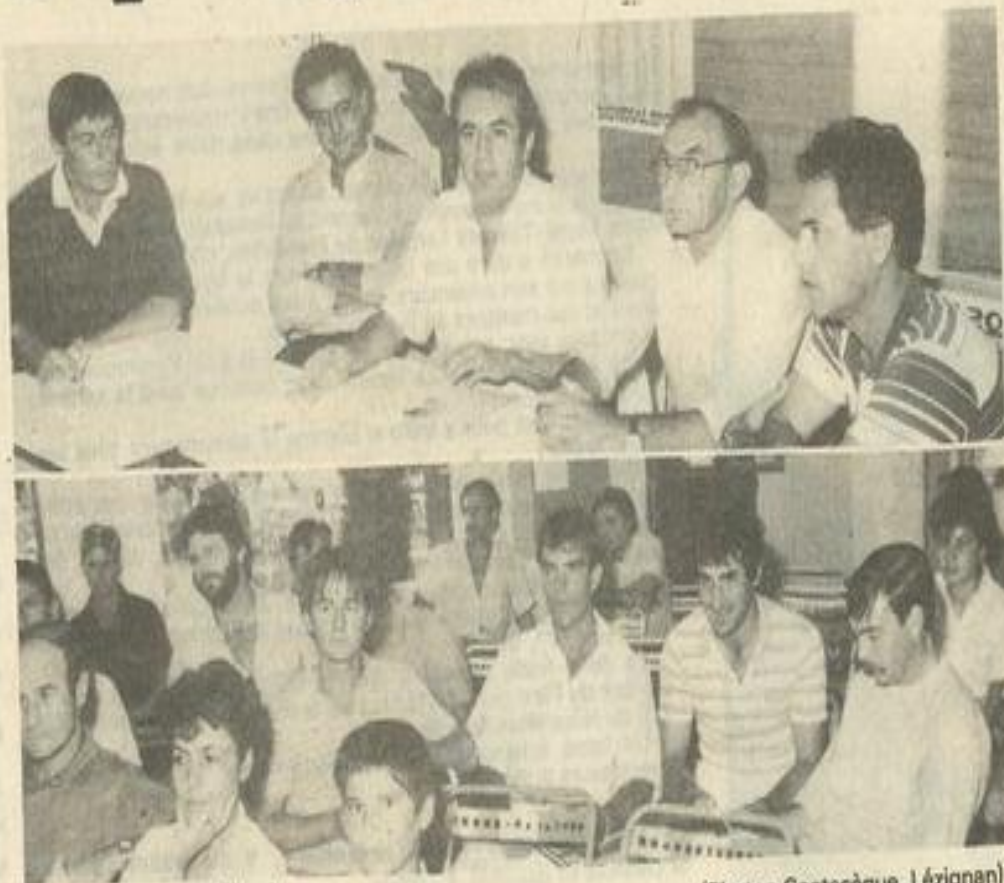
• L'assemblée générale

Le président évoquait ensuite un certain nombre de travaux qu'il souhaiterait voir se réaliser et il a sollicité pour cela l'aide de la municipalité: une clôture (mur et grillage) pour fermer l'accès du club, du groudronnage, faciliter l'écoulement des eaux, aménager en gradins, enlever la baraque blanche devenue inutile, agrandir en