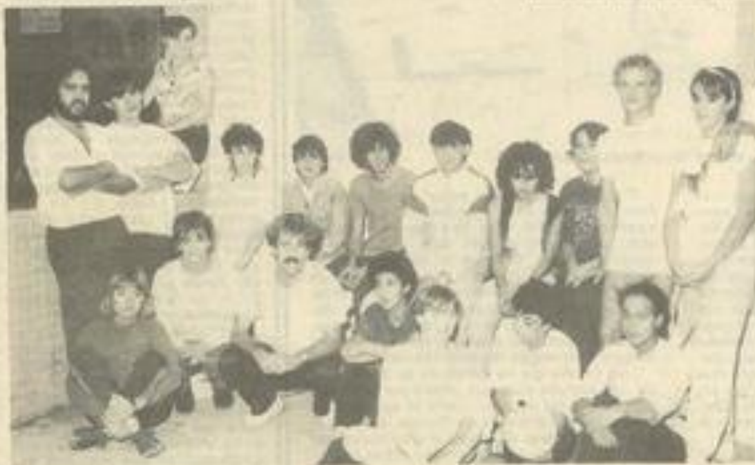
• Les participants à ce stage de perfectionnement.

leur formation, auront tous les éléments nécessaires pour être animateurs socioculturels. Il leur restera à se tourner vers le marché du travail, ou vers une formation plus spécialisée.