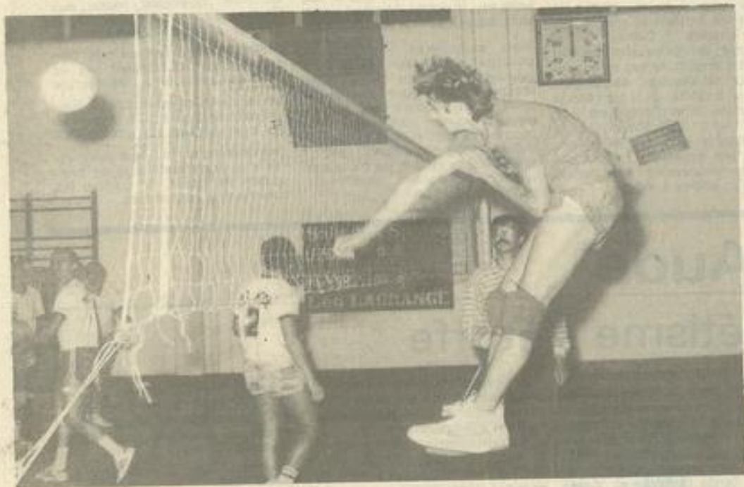
• Vue de match