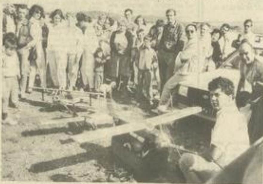
• Les modèles réduits ont eu aussi leur mot à dire.

L'Aéro-Club a montré, par ces diverses manifestations que l'air peut donner lieu à des disciplines variées où chacun peut se retrouver.