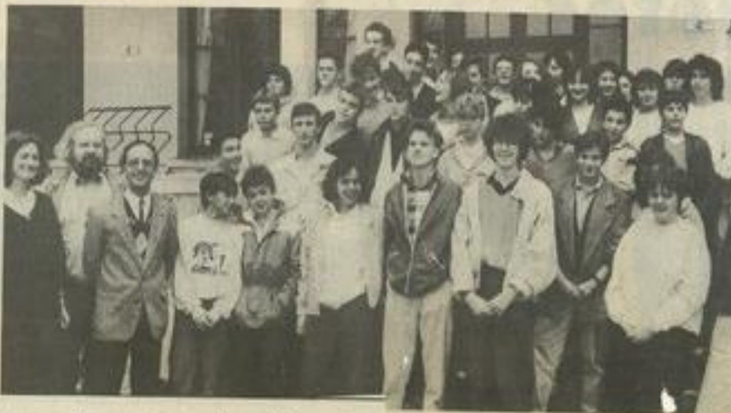
• Nos jeunes amis d'outre-Rhin

Ce séjour, au cours duquel les visites sont prévues dans la proche région, permettra aussi de relancer les relations Léznigan-Brême, en plus de son aspect échange linguistique. Une rencontre sportive est prévue vendredi à la M.J.C. une réception à la main vendredi en fin d'après-midi et une soirée d'adieux à la M.J.C. à laquelle les parents sont invités.