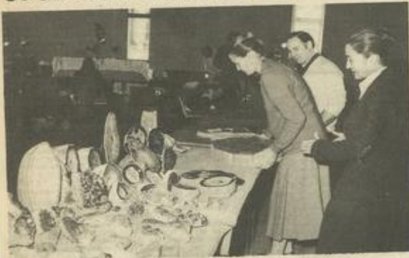
• Minéraux, fossiles, plantes et fleurs, samedi et dimanche au Palais des fêtes.