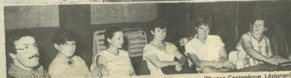
• L'assemblée générale des parents d'élèves F.C.P.E.