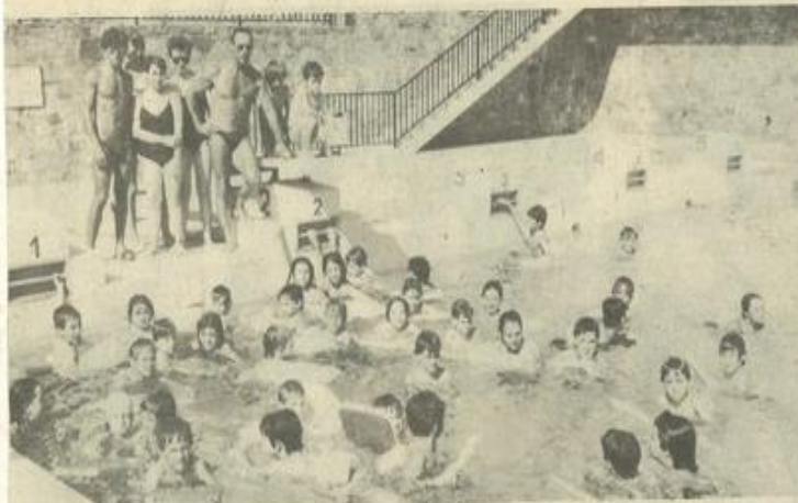
• Les débuts de l'école de natation

LA chaleur qui maintenant est bien arrivée sur la région est une raison suffisante pour aller se tremper dans l'eau à la piscine municipale. Mais elle n'est pas la seule. La douceur de l'air et le ciel bleu rendent tout à fait agréable la pratique des sports nautiques et si, en hiver, ceux-ci peuvent faire hésiter les frileux ce n'est plus le cas à l'heure actuelle. L'école de natation a ouvert ses portes, et le club de natation, pour sa part, a pris ses quartiers d'été, laissant pour deux mois le bassin de la piscine de Capendu.