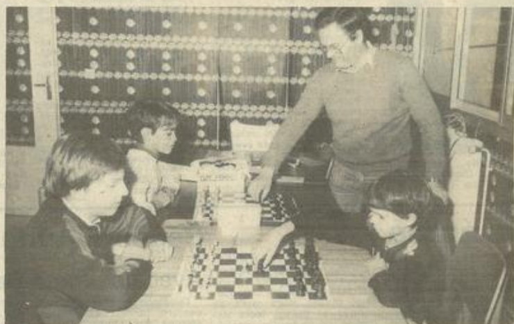
• Le goût des échecs vient jeune