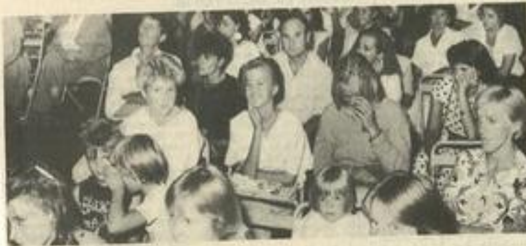
• Pendant la réception.