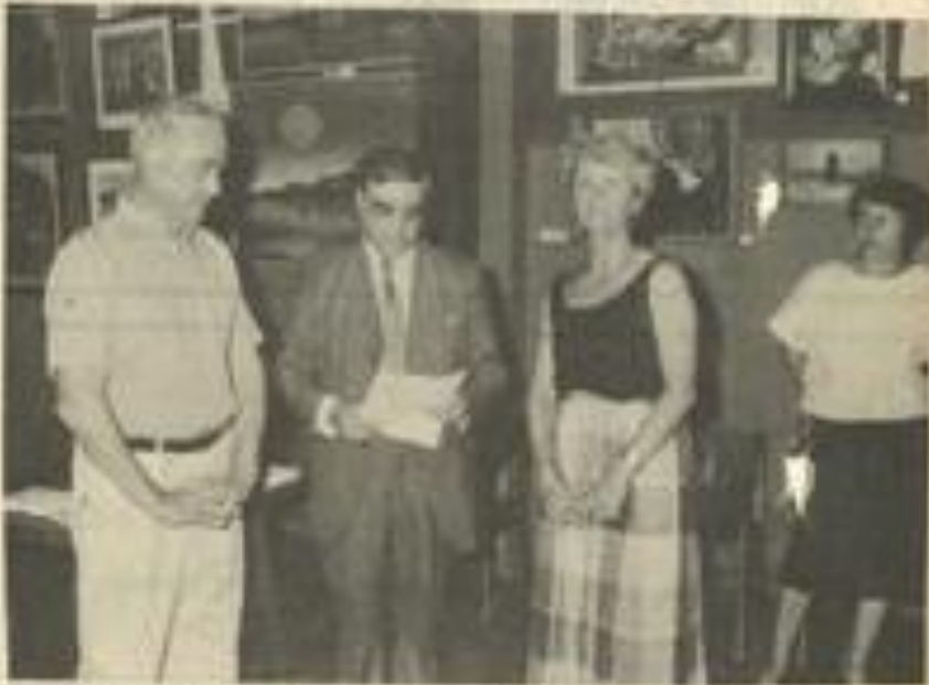
● Au cours du vernissage de vendredi soir.