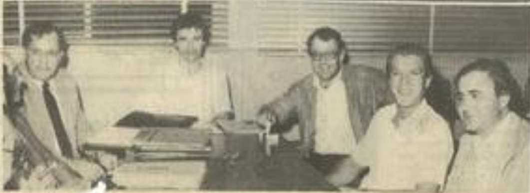
• Les assureurs lézignanais ont créé leur antenne.