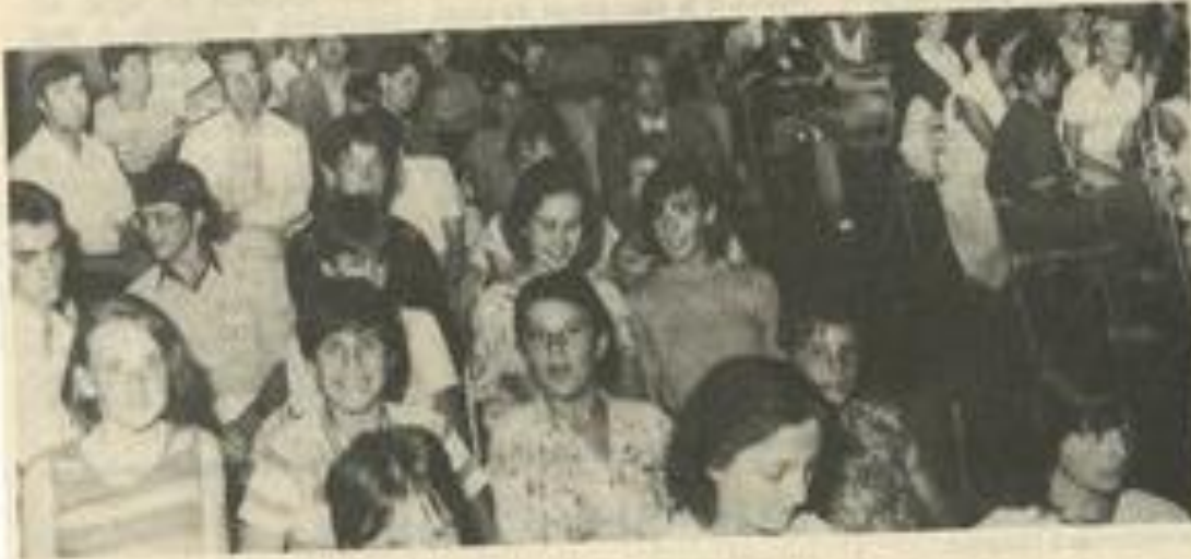
• Assistance franco-allemande.

Un film réalisé à Brême en juin a ensuite été projeté. Puis on a pris l'apéritif, et une grillage a eu lieu en présence des parents lézignanais, ceux de Brême étant un peu loin pour y venir.