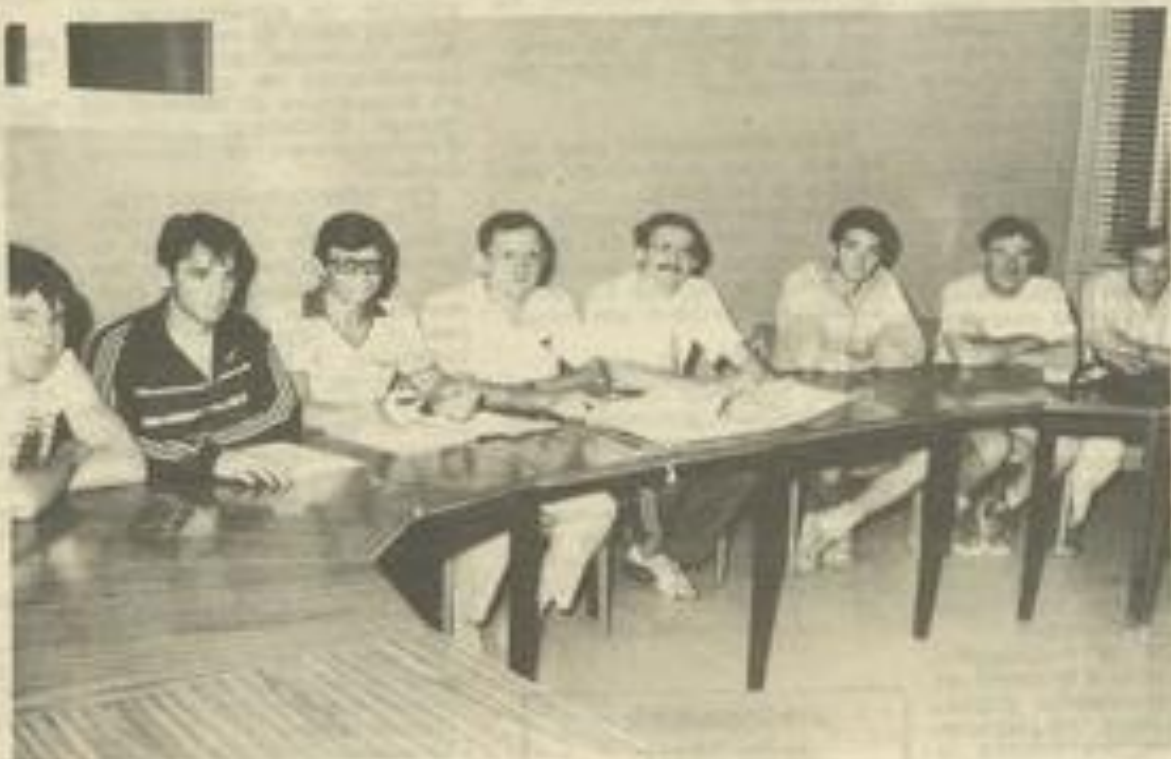
• Les participants de la réunion départementale.

La J.S.L. de son côté poursuit son petit bonhomme de chemin. Les entraînements ont déjà commencé au stade de la Poulmonguière tous les mardis et les mercredis à 18 h.