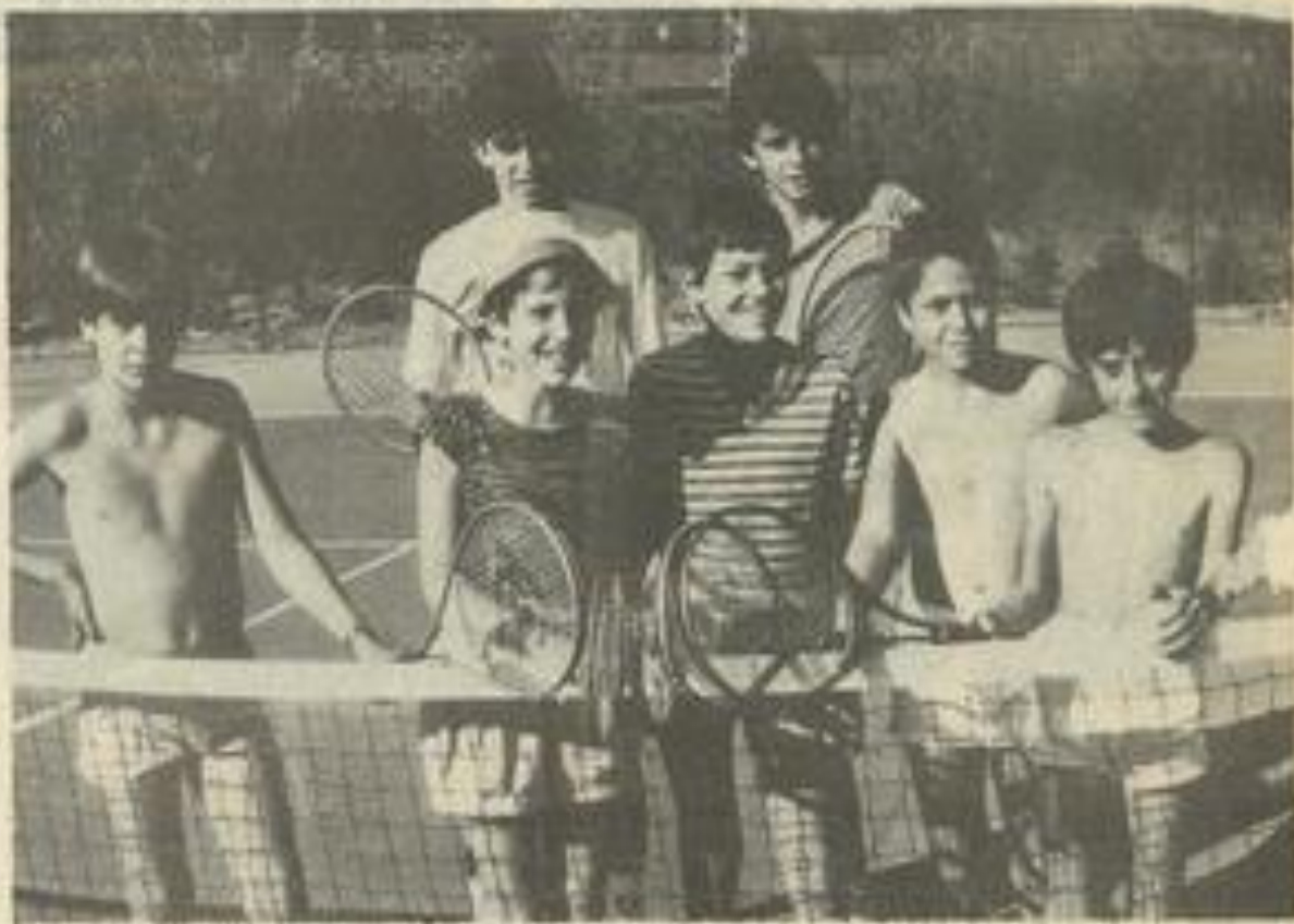
• Jeunes tennismen sur nos courts.

- Cadets II : tous les autres joueurs cadets, sont convoqués à 15 h 15 au stade de Fleury, pour la rencontre qui les opposera à l'équipe de Tuchan en championnat du Languedoc.