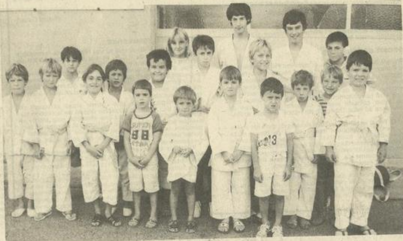
• Une partie des jeunes judokas, prêts pour la reprise.

Judokas, petits et grands à vos kimonos. La saison est partie.