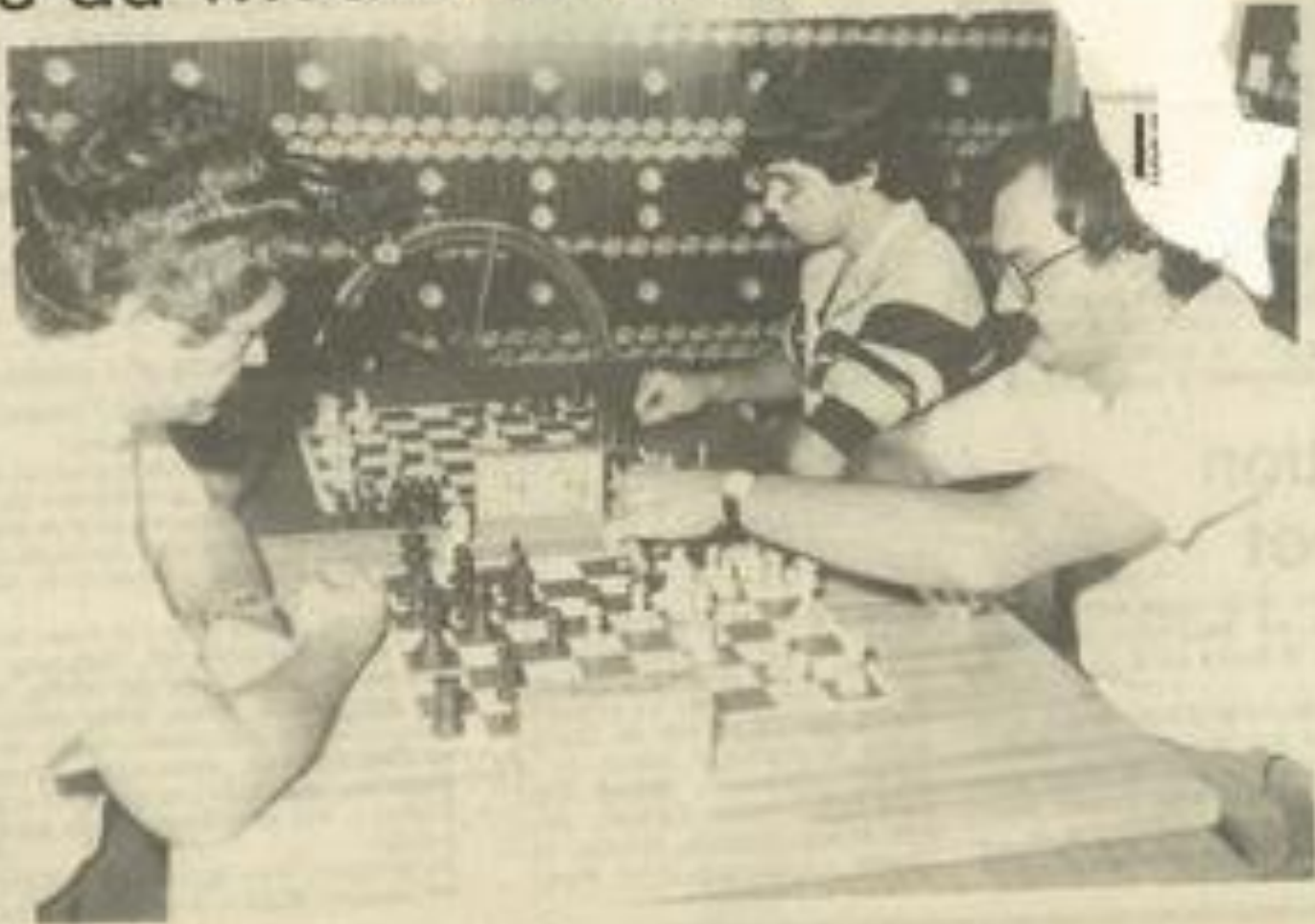
• Premières parties de la saison.

En octobre, les échéphiles vont assister, à Montpellier, au "match des candidats", autrement dit à la rencontre des prétendants au titre de champion du monde qui seront tous là jusqu'au 14 e , à l'exception des deux premiers mondiaux.