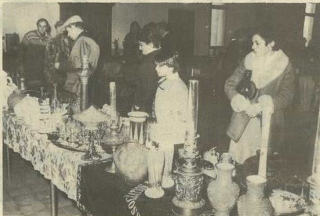
• La foire à la brocante de la J.H.C. en 1982

Nos adhérents, chacun librement, ont décidé de ne pas participer à cette foire pour exprimer leur ras-le-bol face à ce genre de manifestations".