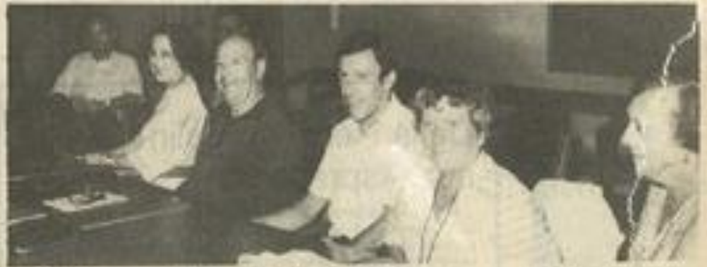
• De nombreux membres, mais hélas pas assez.