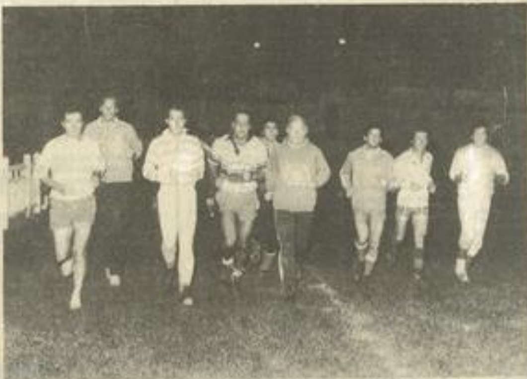
• L'équipe seconde du F.C.L. s'est entraînée au même rythme que l'équipe première. (Photo Costeséque).

La formation lézignanaise qui se présentera au stade de l'Aiguille aura fière allure, puisque quelques équipiers premiers pourraient la renforcer, ainsi que quelques juniors. Une formation en tout cas qui pourrait commencer favorablement la compétition tant elle manifeste d'enthousiasme aux entraînements. Le coup d'envoi est fixé à 16 h.