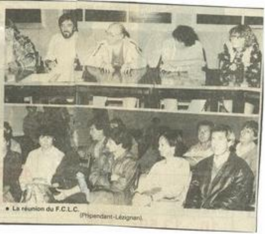
La réunion du F.C.L.C. (Pépendant-Lézignan)