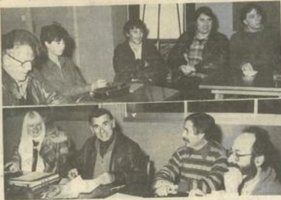
• Les diverses personnalités pendant la réunion.