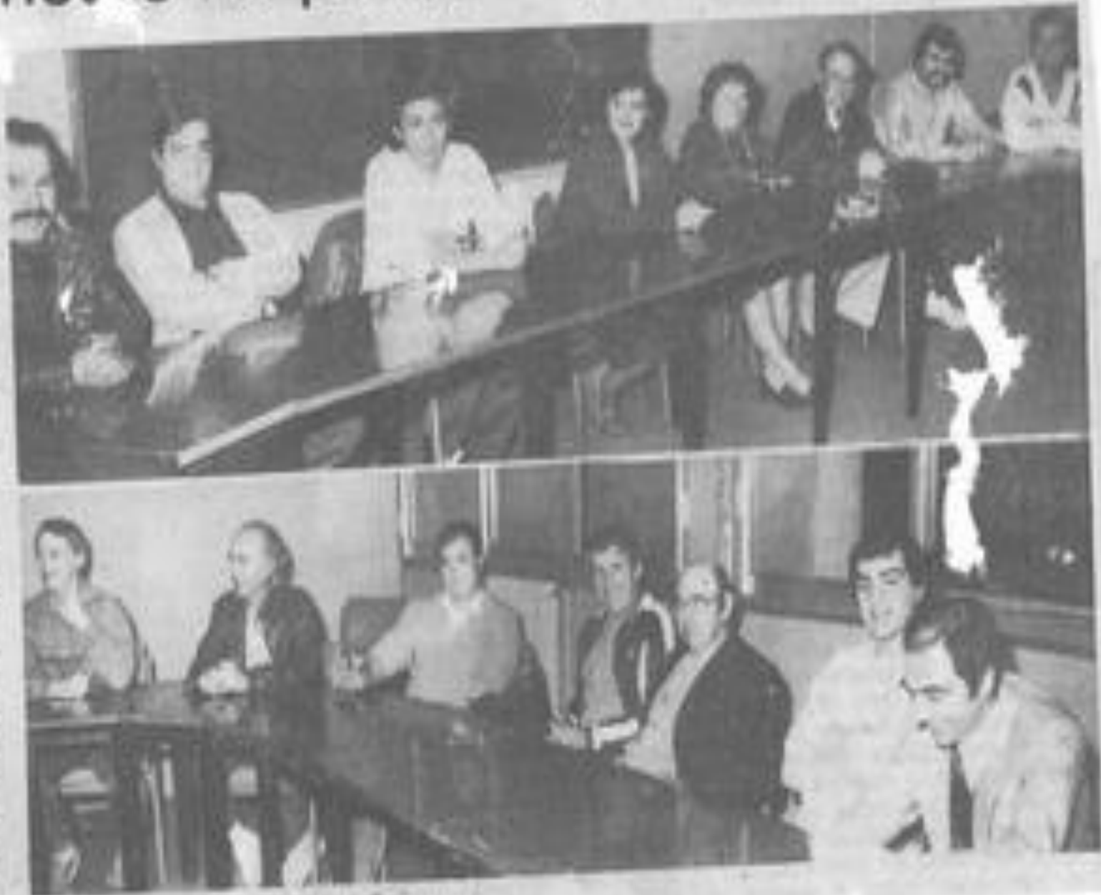
• Les randonneurs lors de leur réunion.

Le président présente à l'assemblée l'avantage qu'il y aurait à ce que la société "les randonneurs lézignais" adhère à la Maison des jeunes et de la culture de Lézignan-Corbières et y transfère le siège social. Cette proposition est adoptée à l'unanimité. L'adhésion aux randonneurs pour la saison 1985 est fixée à 100 F à savoir : 40 F pour la M.J.C. et 60 F pour la société.