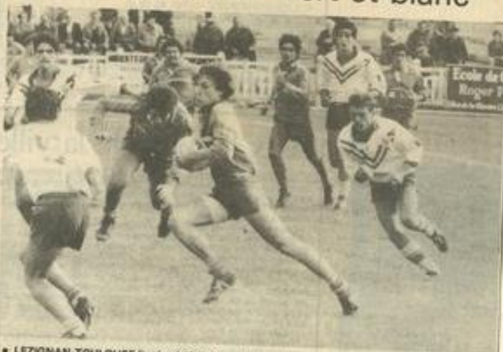
• LEZIGNAN-TOULOUSE (juniors) 42 à 12. — Ferret déterminé fonce vers l'essai.