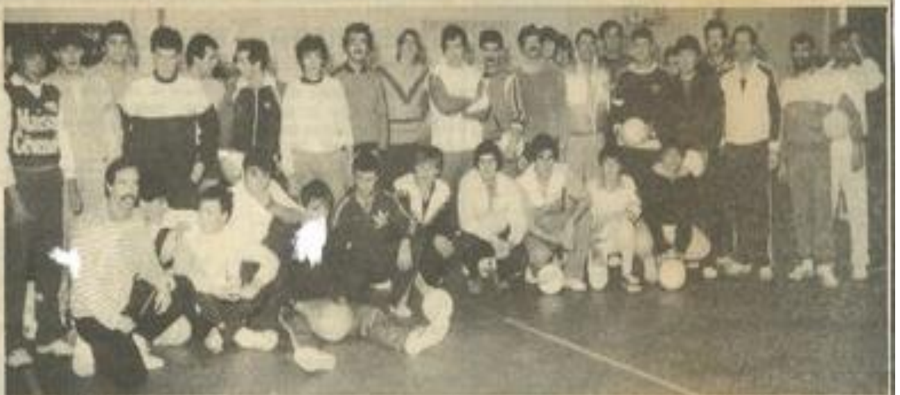
• Les participants

Voici le classement final: 1 er Roubia, 2 e l'Entrecôtier, 3 e Sud-Ouest résidence, 4 e G.A.P.A., 5 e F.L.L. Narbonne, 6 e M.J.C. Lézignan, 7 e Cruscades, 8 e Maisons cévenoles, 9 e T.C.L., 10 e Caténa.