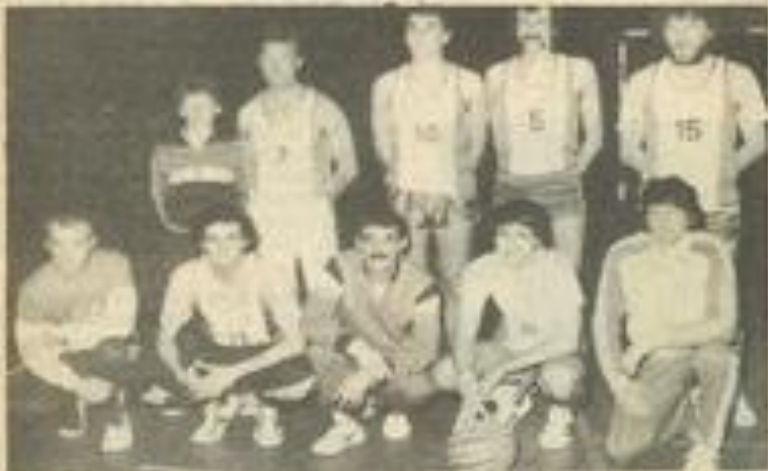
• L'équipe lézignanaise s'est bien défendue en première mi-temps.