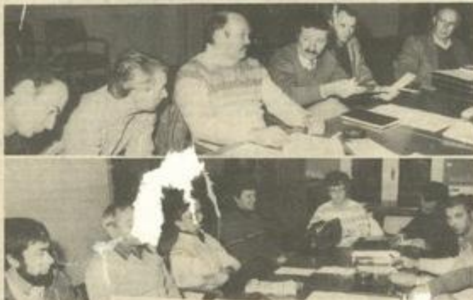
• Les participants à cette réunion.

détecter les meilleurs bacheliers qui participeront à un tournoi interdépartemental au mois de mai.