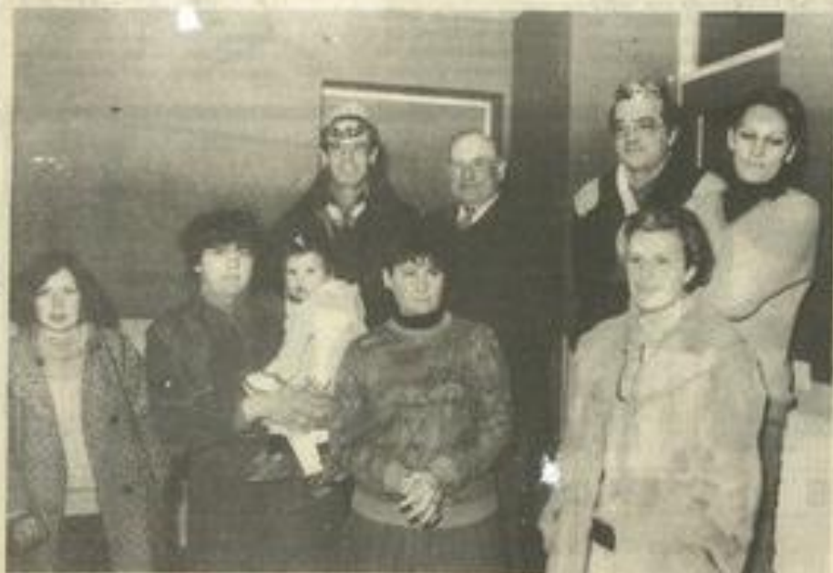
• Les responsables du club.