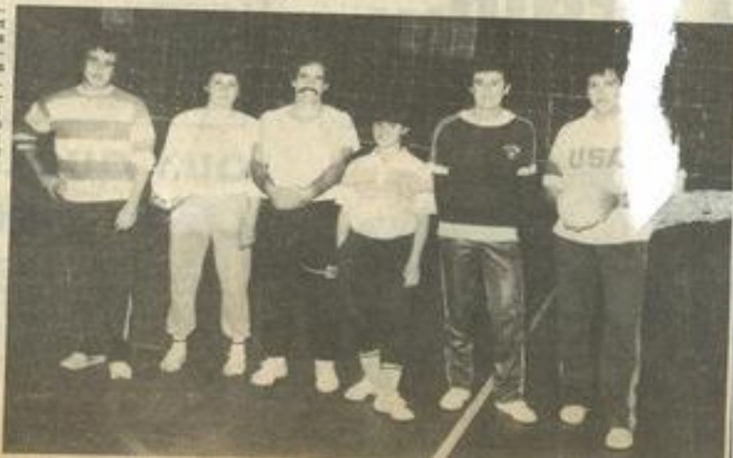
• Le premier entraînement de Sport pour Tous.

La section a choisi le volley comme activité et prépare un tournoi corporatif. Tout le monde est accepté.