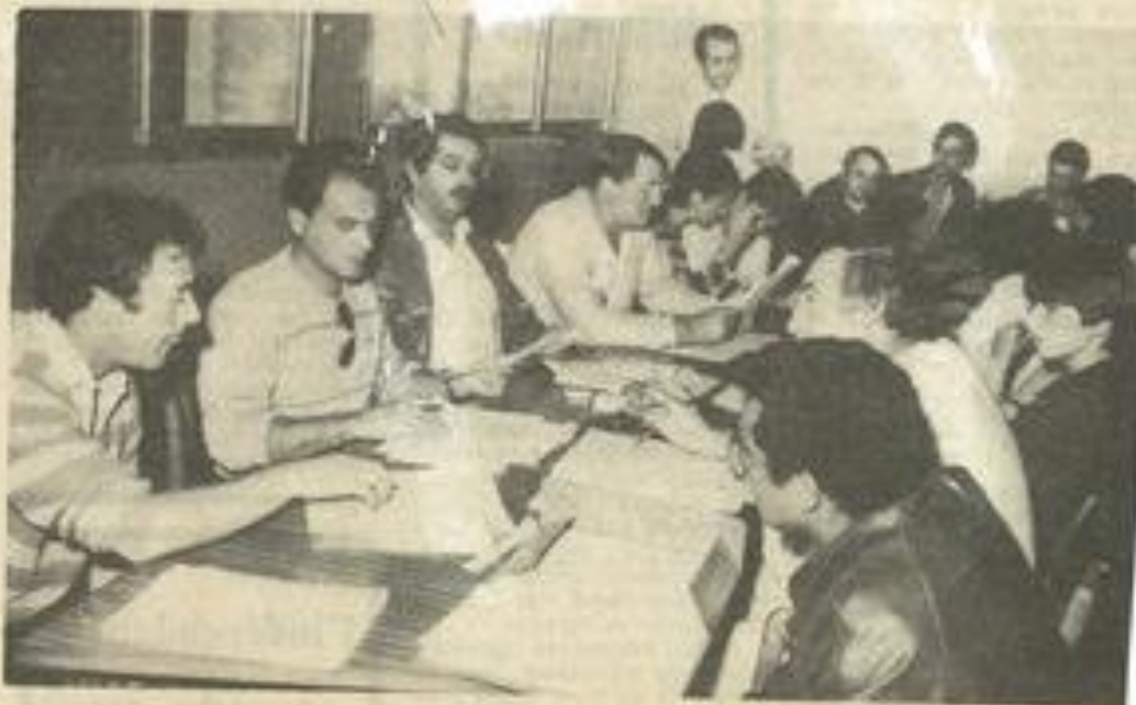
• Après-midi studieux.