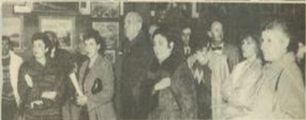
• Les exposants et le public.