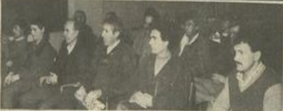
• Une assemblée convenable