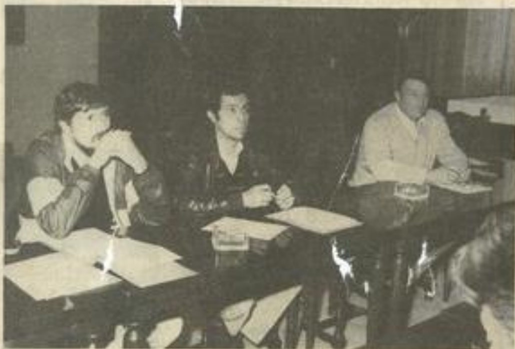
• Les représentants de FR 3.