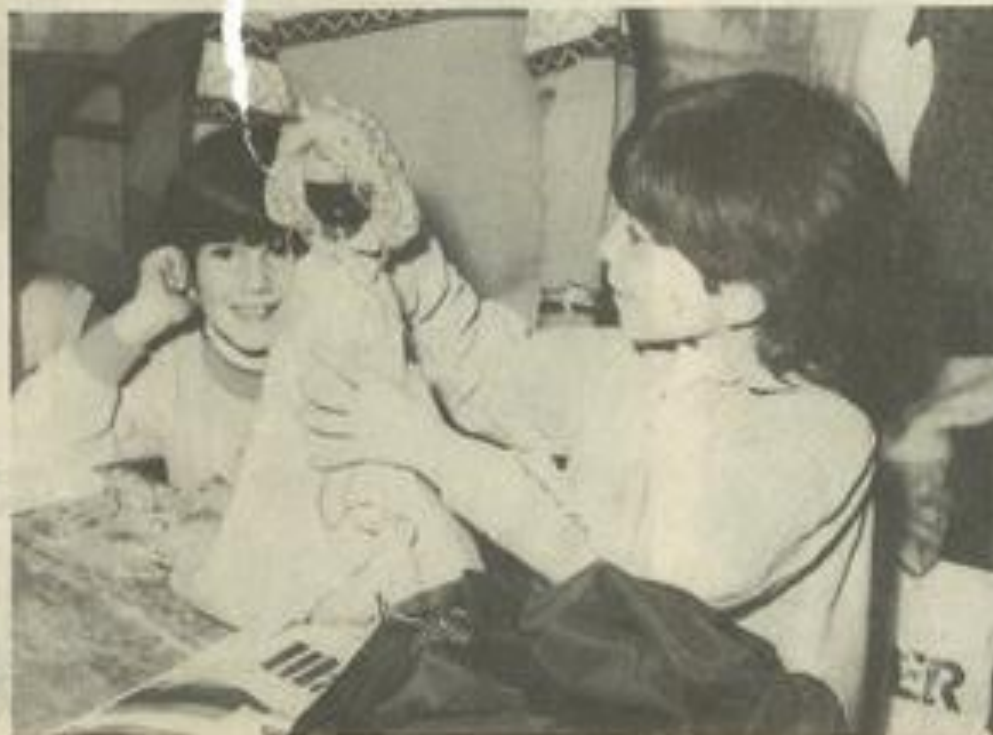
• Comment, d'une bouteille, faire sortir un personnage.