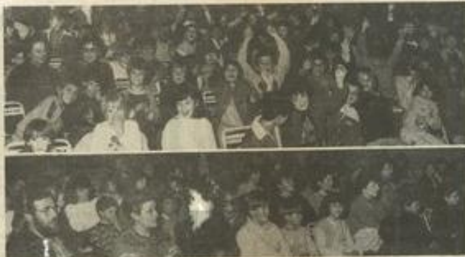
• Un spectacle d'adultes vu surtout par les enfants.