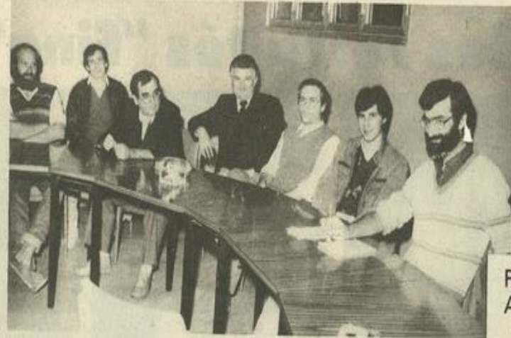
• Les membres du Photo-club M.J.C.