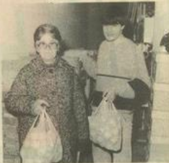
• A la mairie, des pommes distribuées par le bureau d'aide sociale.

Que deviennent les sans abris ? tous ces errants qui traînent dans le Midi parce qu'ils le pensent plus accueillant qu'ailleurs ? Mais que deviennent aussi les gens qui ont moins que jamais les moyens de s'offrir des denrées qui augmentent à mesure que la température baisse ?