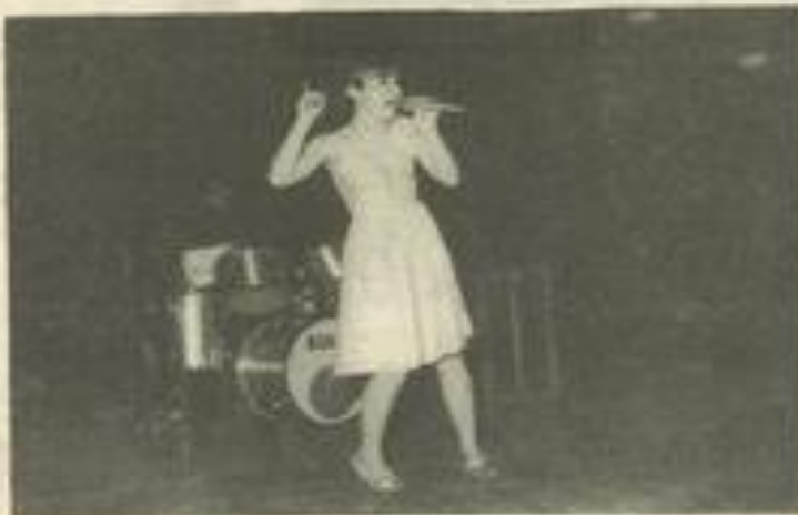
• Une jeune artiste du club Léo-Lagrange

Maurice Chevalier, Charles Trénet, Annie Cordy et d'autres chanteurs contemporains ou plus anciens ont été les vedettes de ce spectacle. Il a été suivi d'un goûter apprécié de tous.