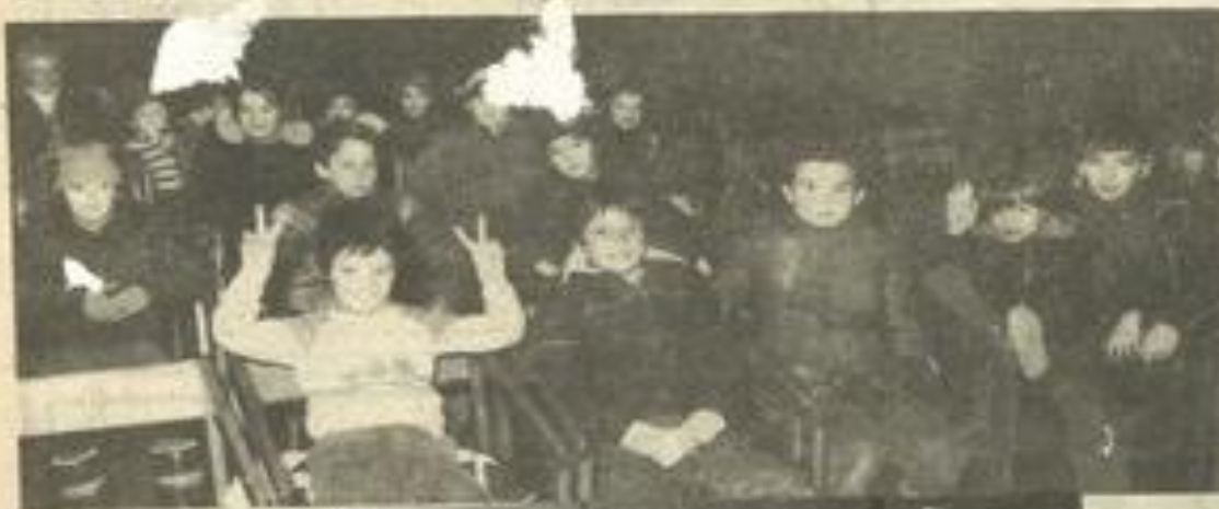
• Les enfants au cinéma

Le Ciné-club, avec son nouveau programme, propose cette année (après quelques années d'interruption à Lézignan) des films de haute qualité, la plupart du temps en couleurs, récents, et appropriés aux goûts tous publics.