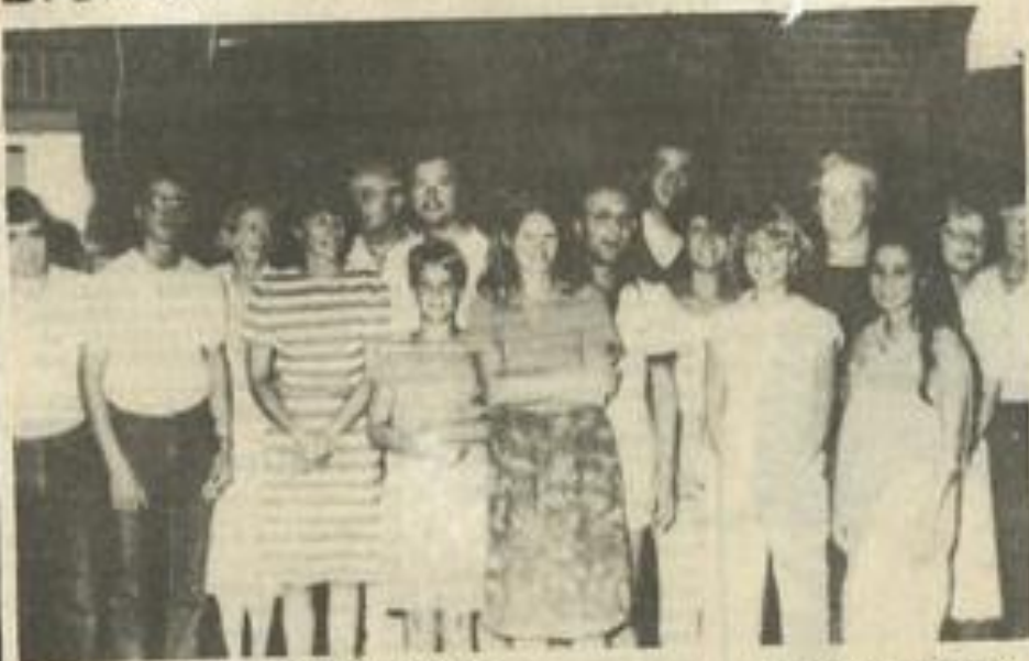
• Le groupe lors de son arrivée outre-Rhin