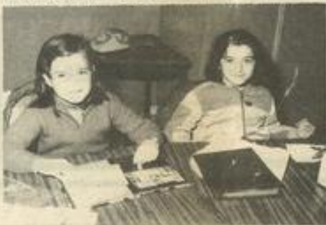
• Il n'y a pas d'âge pour la philatélie.

Les dadas des membres de la section philatélique sont des plus variés : marques postales, collections thématiques, plaques de l'aéropostale, cartes postales, enveloppes. Il y a ceux pour qui les timbres sont une valeur sûre, ceux qui cherchent les timbres rares ou originaux. En tout cas, tous se régaleront de parler de leur collection, de leur dernière trouvaille, et on pourrait discuter de philatélie avec eux pendant des heures.