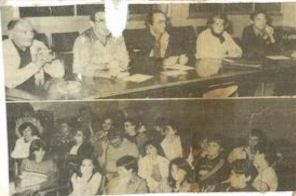
• Les responsables du club et les participants à la réunion