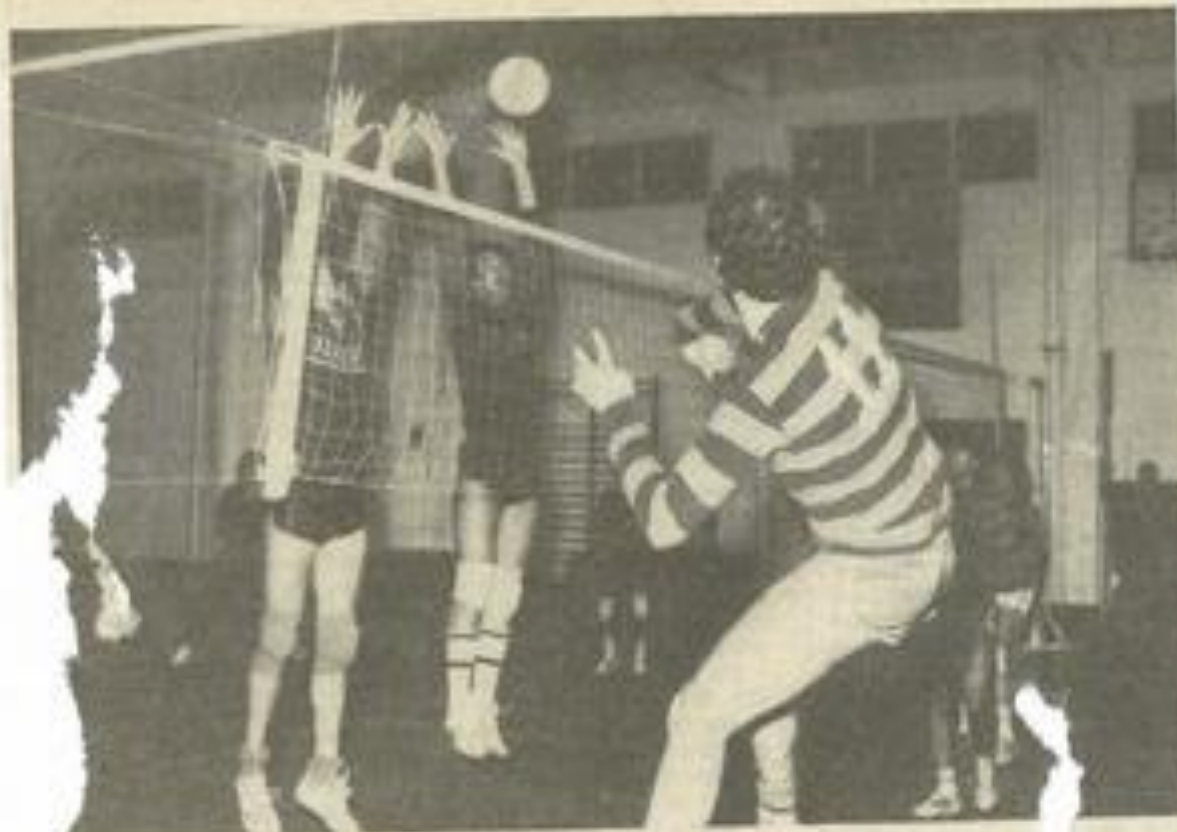
Une phase de jeu.