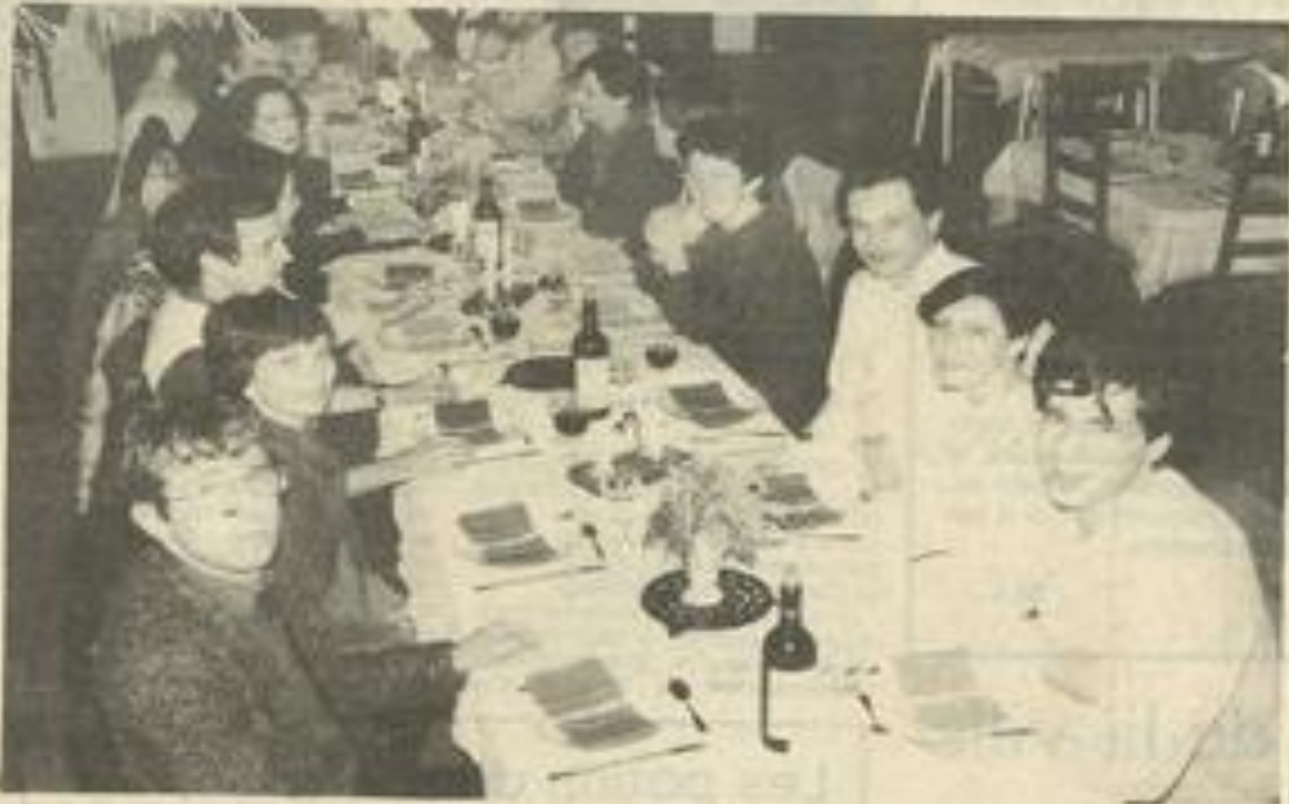
• Agréable soirée pour le Photo-club M.J.C.

Le club rappelle qu'il a acquis un appareil photo qui peut être emprunté par ses adhérents. Cet appareil peut servir en particulier à ceux qui veulent apprendre la photo et n'ont pas d'appareil personnel.