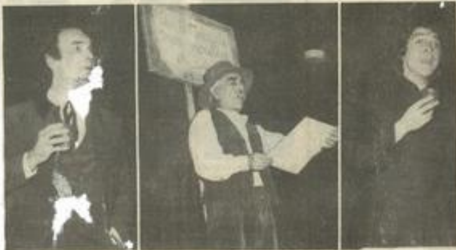
• "Les lettres de mon moulin", avec d'excellents comédiens.