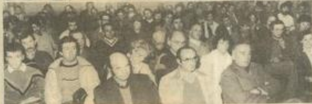
• La foule des participants.