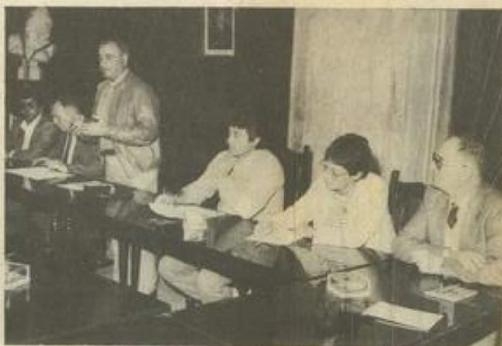
• Les partenaires lézignais pendant cette première réunion de concertation.