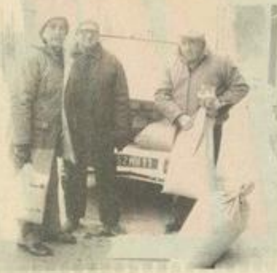
• Les responsables de la S.P.A. dans leur distribution de graines aux oiseaux.

Aussi, courageusement, dans le froid, quelques uns des membres de la S.P.A. ont après les rues des villes, sillonné la campagne. Ils sont partis chargés de graines pour les oiseaux.