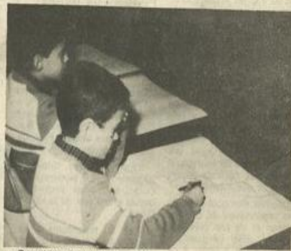
• Premiers pas dans le dessin

Dans six mois, mes élèves pourront faire un dessin ; ils ne seront plus paralysés par la grandeur de la feuille, ils auront une notion de l'espace et leur vue ira mieux ; leur