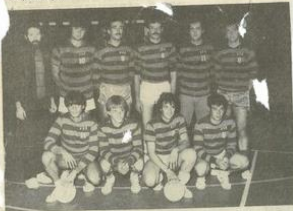
• L'équipe de Roubia.