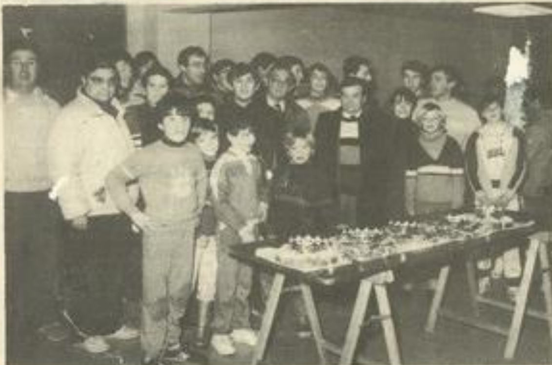
• Les athlètes tirent les rois