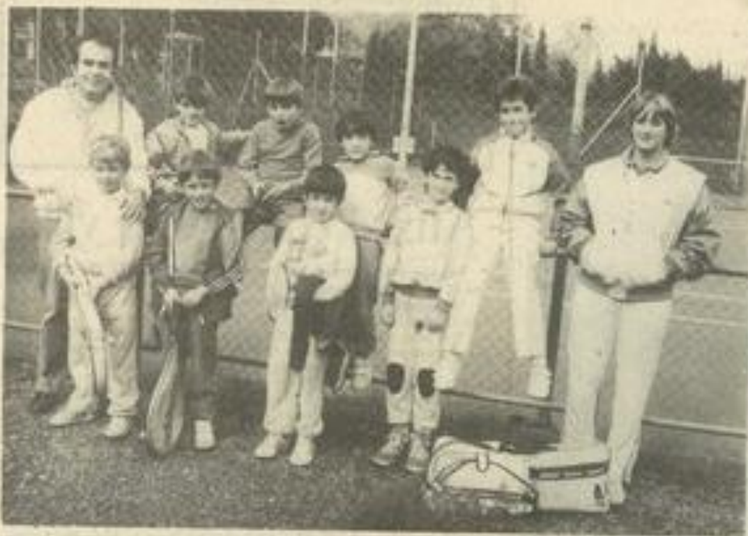
• Les jeunes tennismen présents à cette sélection.