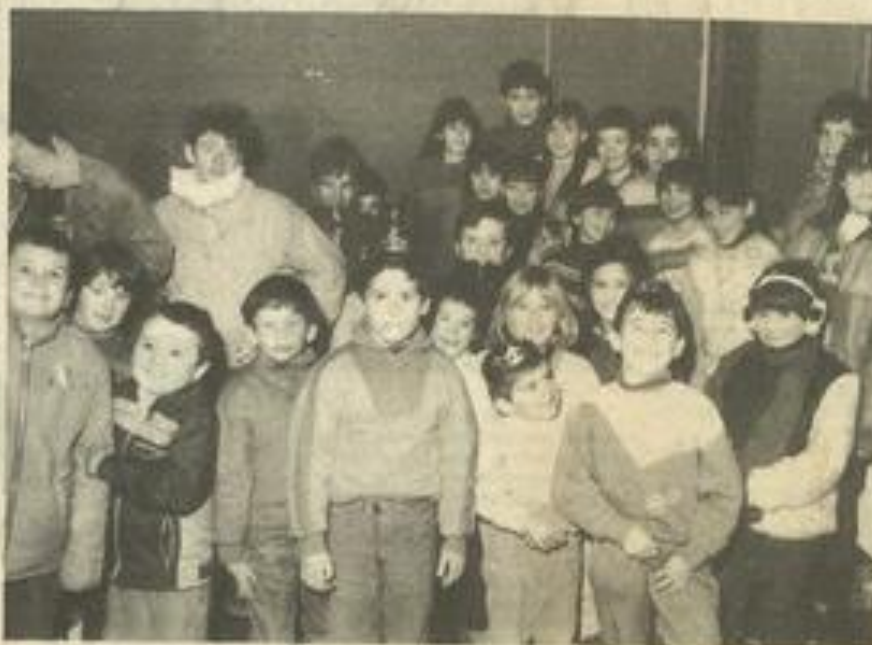
• Les petits nageurs.