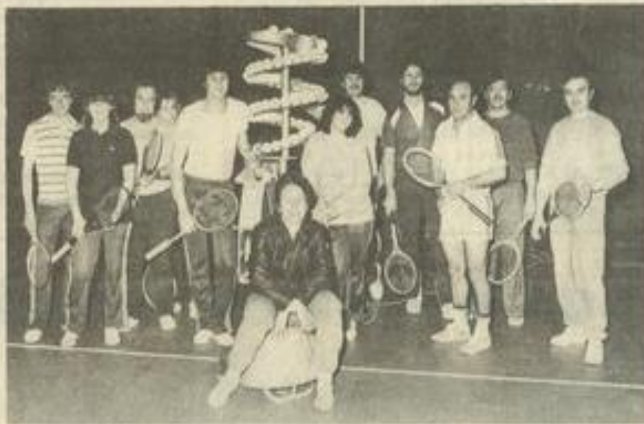
• Une pléiade d'adultes ont reçu ses cours.