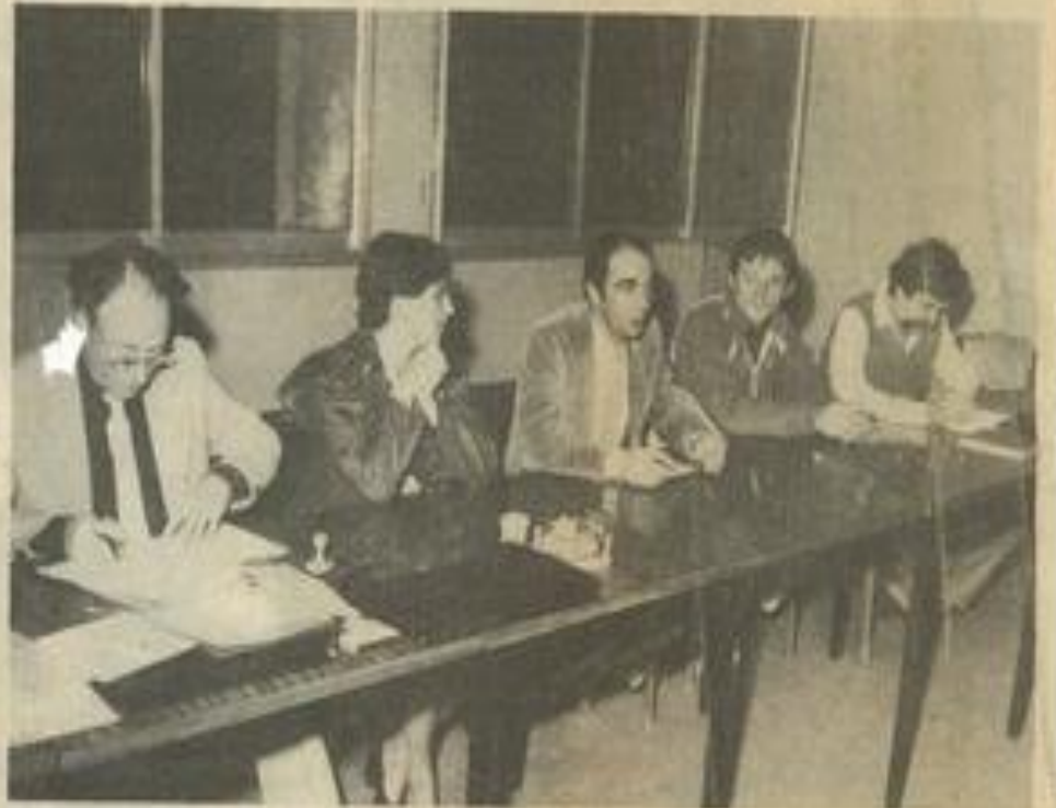
• Le bureau des randonneurs