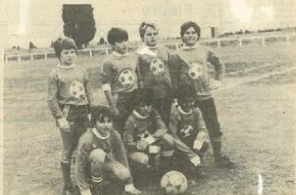
• Les minimas, fidèles au rendez-vous