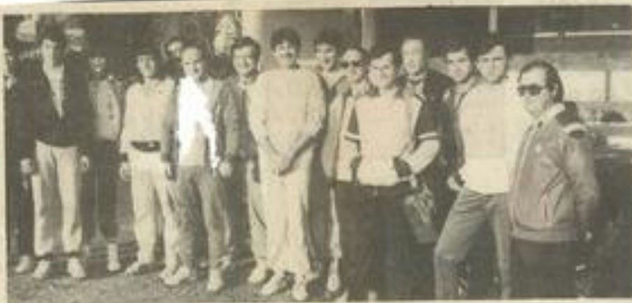
• Les membres

En seniors, T.C.L. I bat A.N.T. Narbonne II 7-0 ; T.C.L. II bat A.N.T. I 5-2 ; T.C.L. bat A.S.C.N. 6-1.