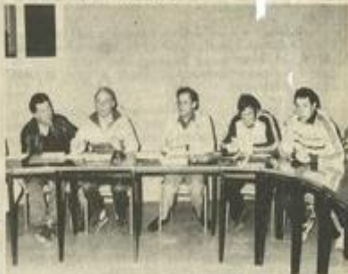
de la mise sur pied du nouveau calendrier.