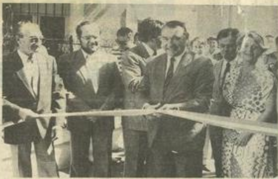
• Le député coupe le ruban.