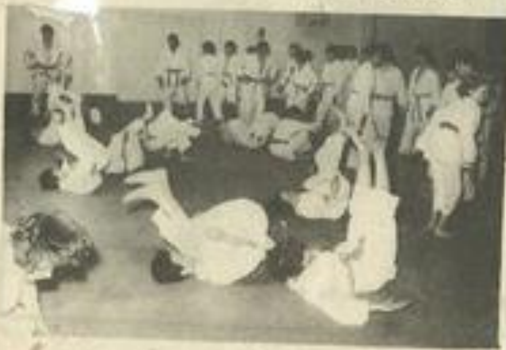
• Le travail au gymnase Léo Lagrange.

Le judo départemental a pris le taureau par les cornes. C'est une tactique qui ne peut que porter ses fruits avec de la patience et du travail. Un exemple à suivre.