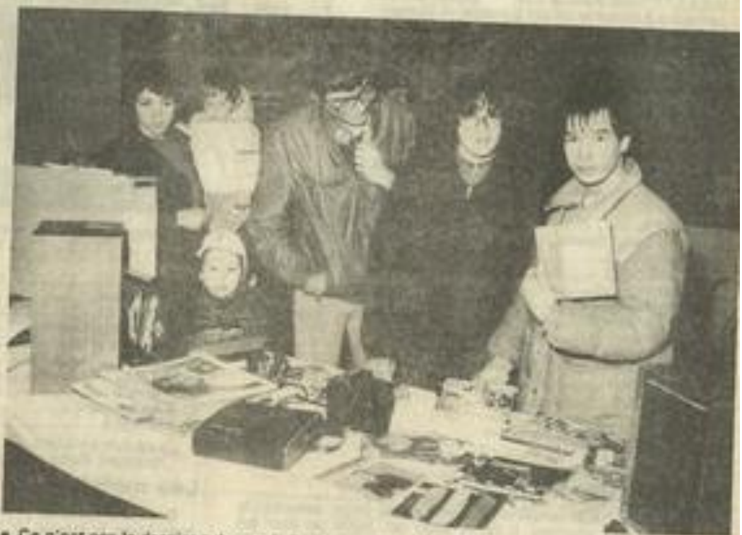
• Ce n'est pas le dernier tube, mais il y en a qui aiment.