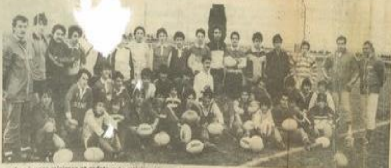
• Les jeunes minimes et cadets qui participent à ce stage