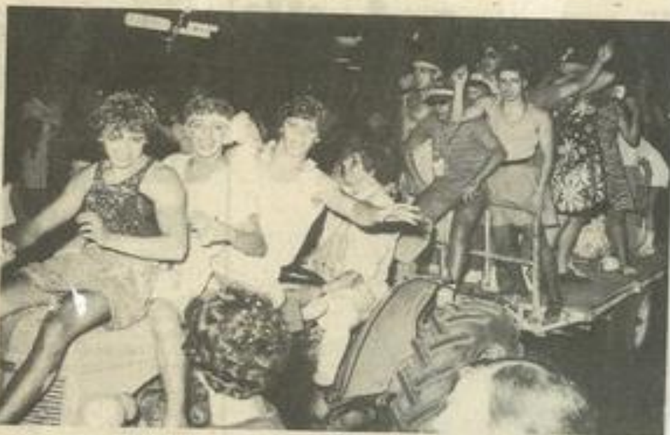
• De belles demoiselles qui ont mis de l'ambiance.