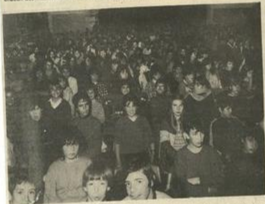
• Le public scolaire, un grand public