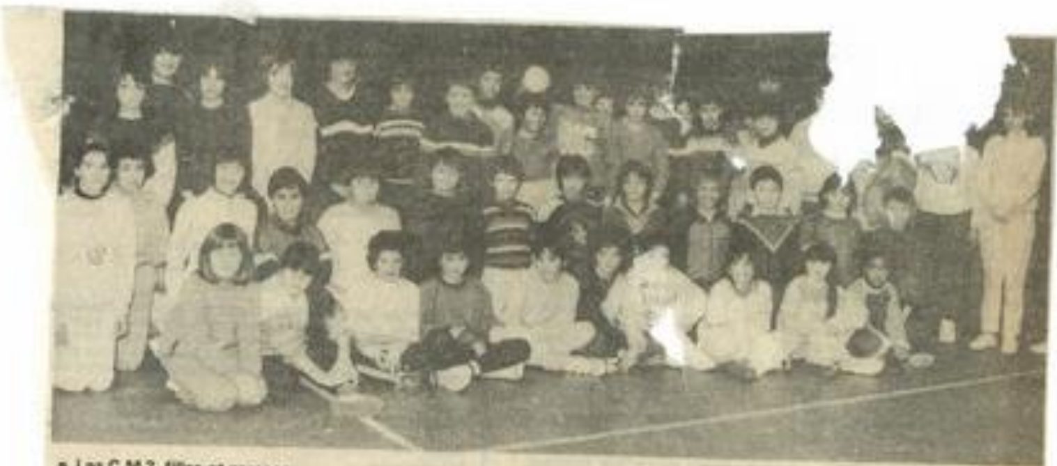
• Les C.M.2. filles et garçons.

Pour Toulouse : 3 essais, 30°, 60°, 70° trois transformations et 1 drop.