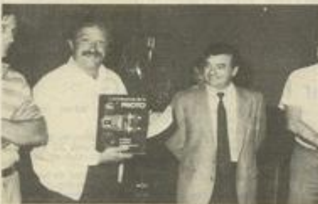
• Le président présente le prix offert pour le concours.

ses propres moyens techniques, qui sont bien entendu variables. Puisque tous les membres du club, même les débutants, exposent l'échantillon de leur savoir faire. La photographie est certes, mais au premier moyen d'expression portée de tous.