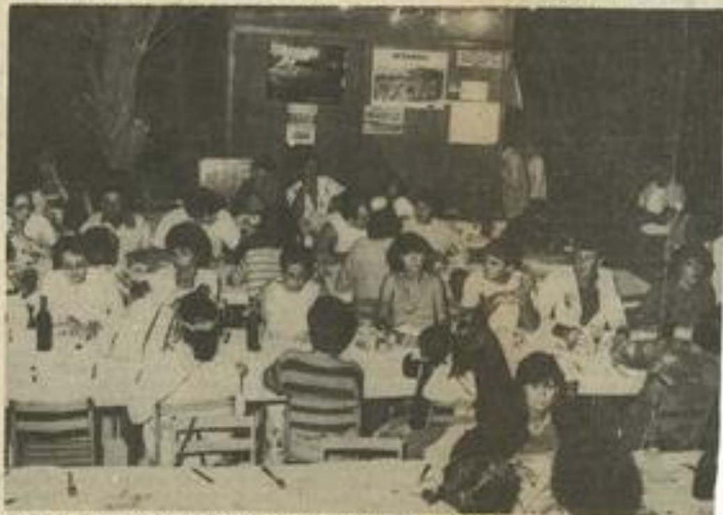
• Soirée couscous au club-house. L'ambiance était de rigueur.

Charade tennisque : Il fallait trouver hier Jean Tar-bouiech. C'était facile !