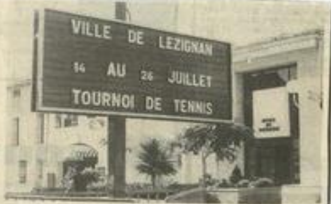
• Devant le S.I., le grand panneau municipal attire l'œil des passants.