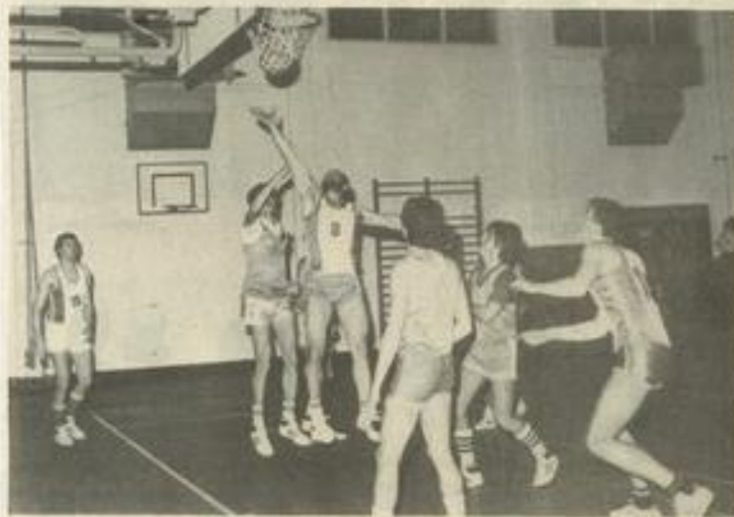
• Une vue de cette rencontre.

Si la victoire sur Coursan, samedi à Lézignan, fut facile pour le Basket-club lézignais, celle sur Castelnaudary, samedi prochain au gymnase Léo-Lagrange, sera moins assurée. Pourtant, le club lézignais en a besoin pour se classer troisième et achever la saison sur un classement qu'il mérite.