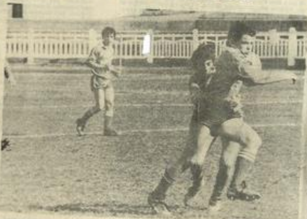
• LEZIGNAN-PIA (Benjamins). — Beaucoup de volonté et de désir de bien faire chez ces jeunes joueurs qui n'ont pas ménagé leurs généreux efforts tout au long de la rencontre.