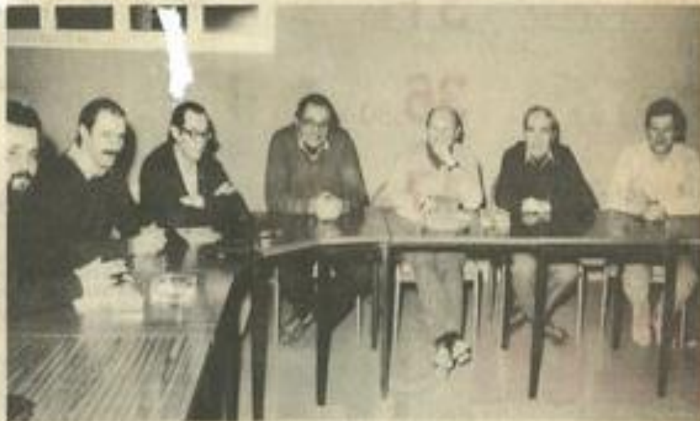
• La réunion des aéromodélistes