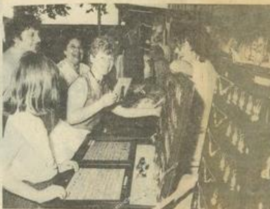
• A la foire artisanale.