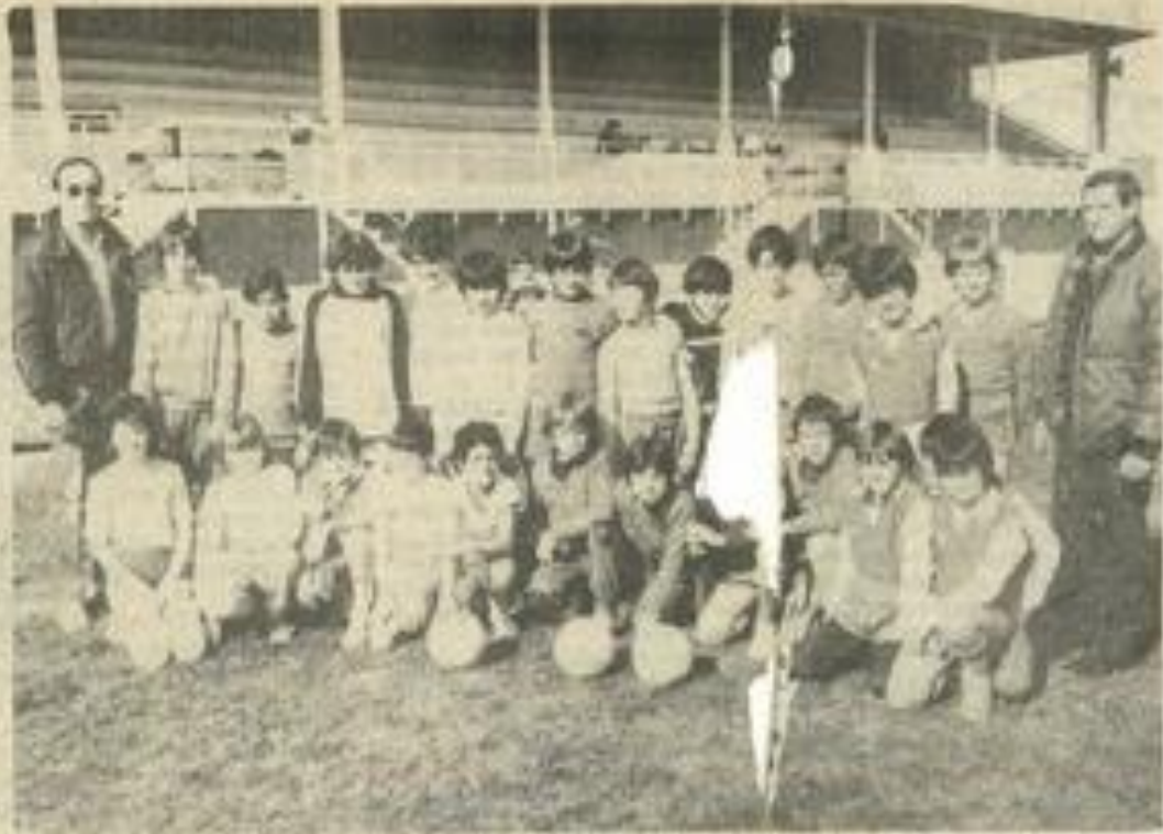
• L'équipe de Lézignan