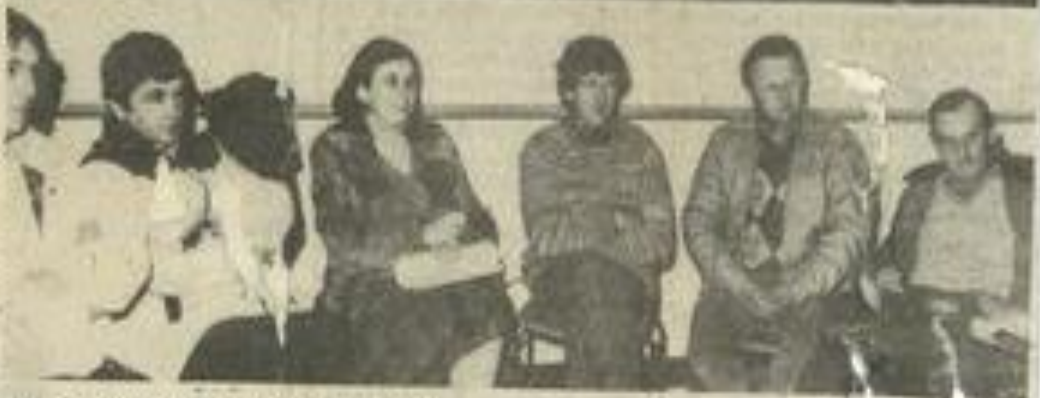
Deux vues de la réunion des M.J.C.