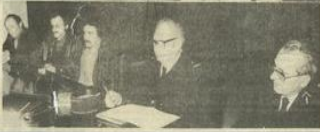
• Les élus, les responsables de la Jeunesse et des Sports, du Moto-club, du commissariat et de la gendarmerie.