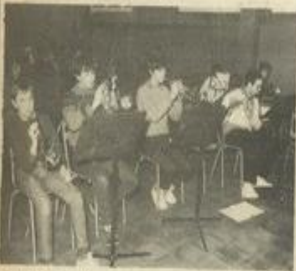
• La classe d'orchestre au travail.

La fin de l'année scolaire, qui pointe à l'horizon, permettra d'effectuer une tournée de concerts, au mois de juin. Mais auparavant, il faut passer les examens, en mai, et pour les examens semestriels des le 20 février (instrumental), le 27 et le 28 février (écrit et oral du solfège).