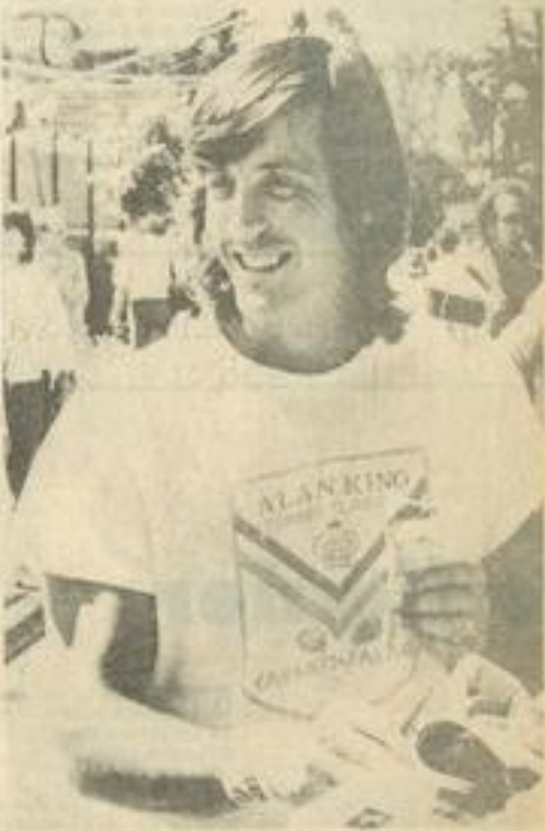
• Adriano Panatta, encore une vedette dans l'esprit du public.