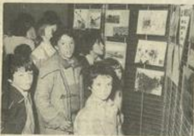
• A l'intérieur, des panneaux étaient prévus pour les expositions. (Photos Costesque, Lézignan)