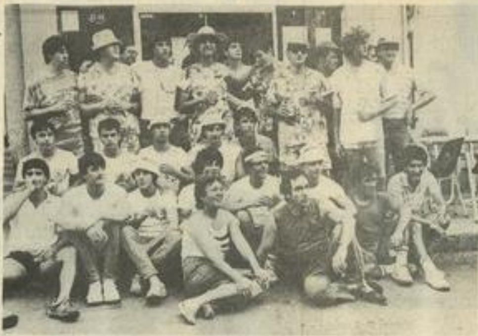
• Les "Mountchs" et "Les Monstras", une autre façon de faire la fête.