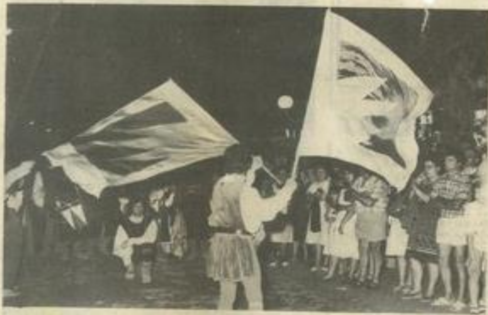
• Des "bandierante" époustoufflants.