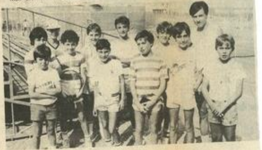
• Les jeunes ont commencé le tournoi.

n'est pas laid ; mon tout est le joueur le plus sympa du T.C.L., sauf sur le terrain. La solution demain.