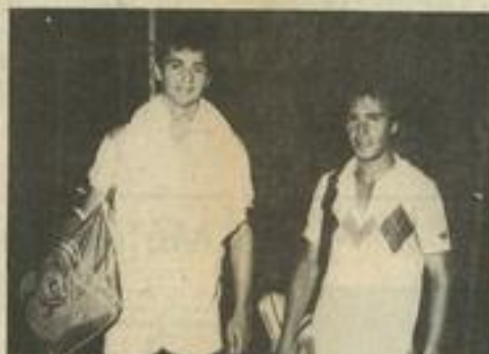
• Champion, à droite, a finalement battu Barthe qui a effectué un super parcours.

J OYEUSE ambiance au club-house mardi soir à l'occasion de la soirée couscous. On manie aussi bien la fourchette que la raquette ! Une centaine de personnes sont venues participer à cette animation sympathique.