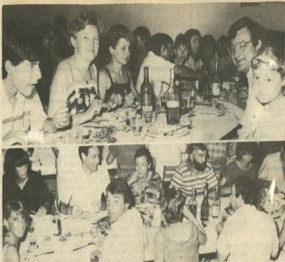
● La soirée paëlla, une animation extra-sportive, qui a connu un succès bien mérité.

Le pari du tournoi : « Si je bats Rougé, j'irai à Saint-Régis à pied », nous a confié Eric Waligunda. On le met derrière l'oreille.