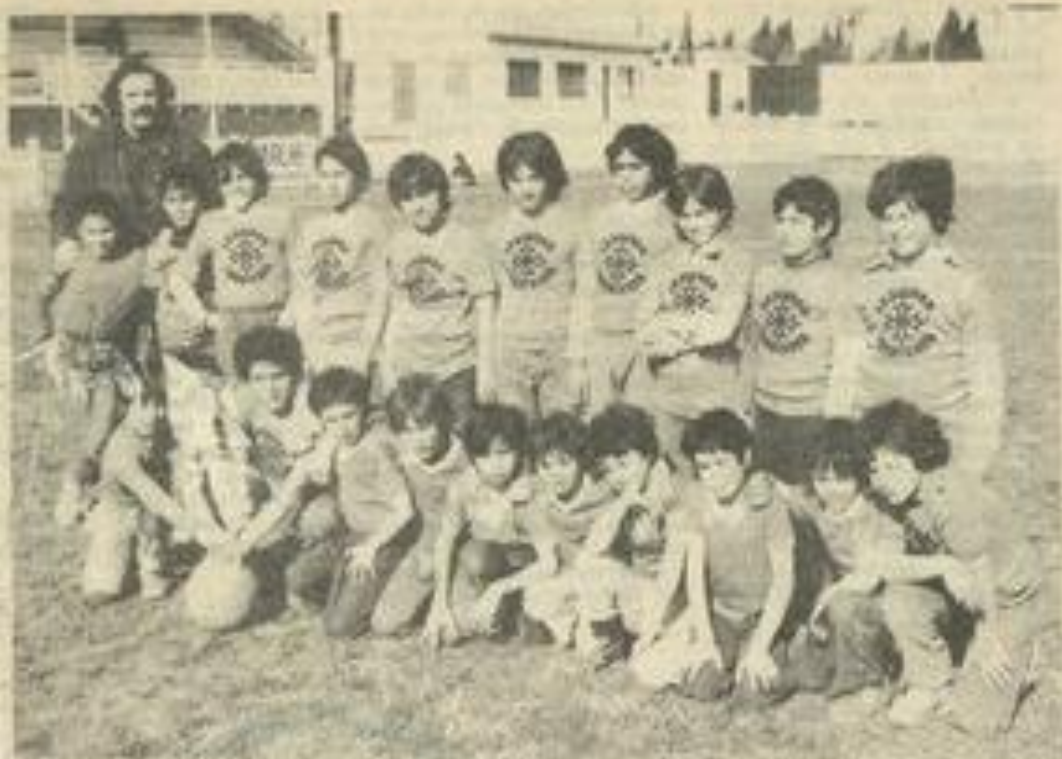
• L'équipe d'Escouto quand plaou