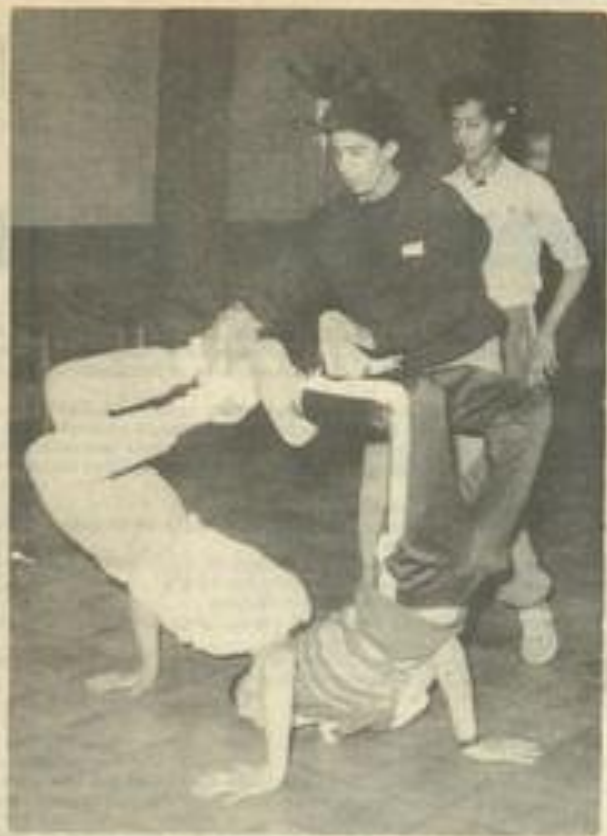
Sur la piste des champions de smurf.

"Vous êtes très souples, en pleine forme et vous possédez de l'énergie à revendre? Alors vous pouvez peut-être tenter