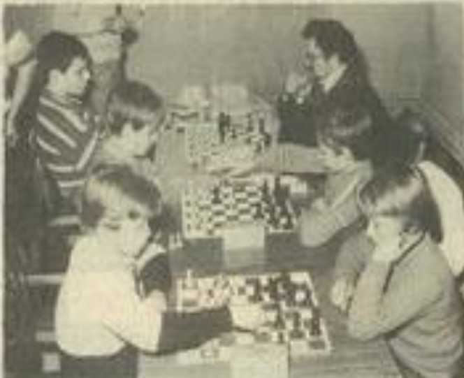
• La valeur n'attend pas le nombre des années

tour des équipes audoises de concourir pour le championnat de l'Aude dans le milieu du printemps.