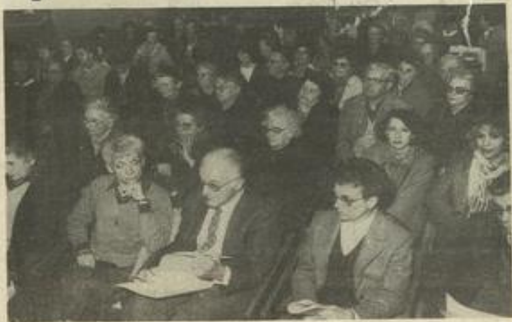
• Une nombreuse assistance