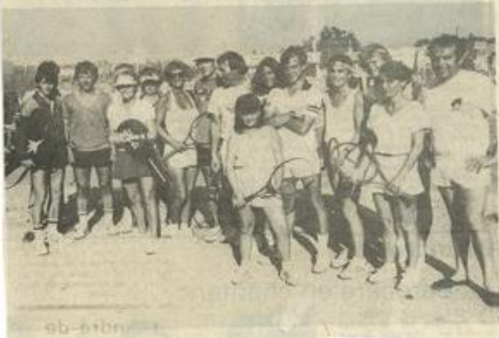
• Les Américains au T.C.L.

Le groupe américain "Tennis Expérience", qui est une société privée de tourisme, était venu l'an dernier à Lézignan. Il y est repassé cette année, sans doute satisfait de son premier passage. Avec "Tennis Expérience", douze personnes voyagent en péniche sur le canal du Midi et disputent de temps à autre des rencontres de tennis avec les clubs locaux,