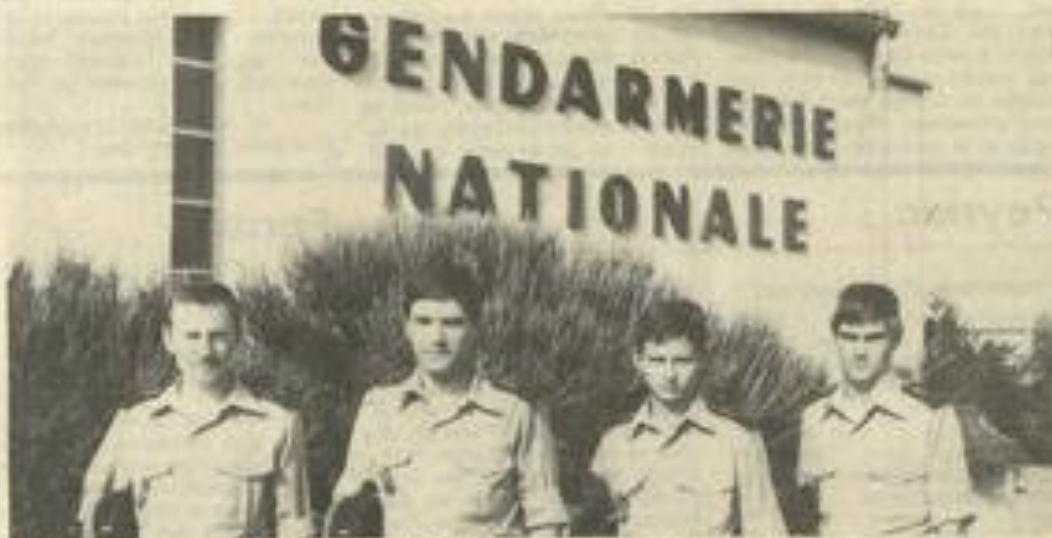
• Les 4 jeunes appelés qui ont choisi d'être gendarme pour un temps

Ces 4 jeunes sont originaires de la région Alsace-Lorraine et en profitent pour découvrir les Corbières.