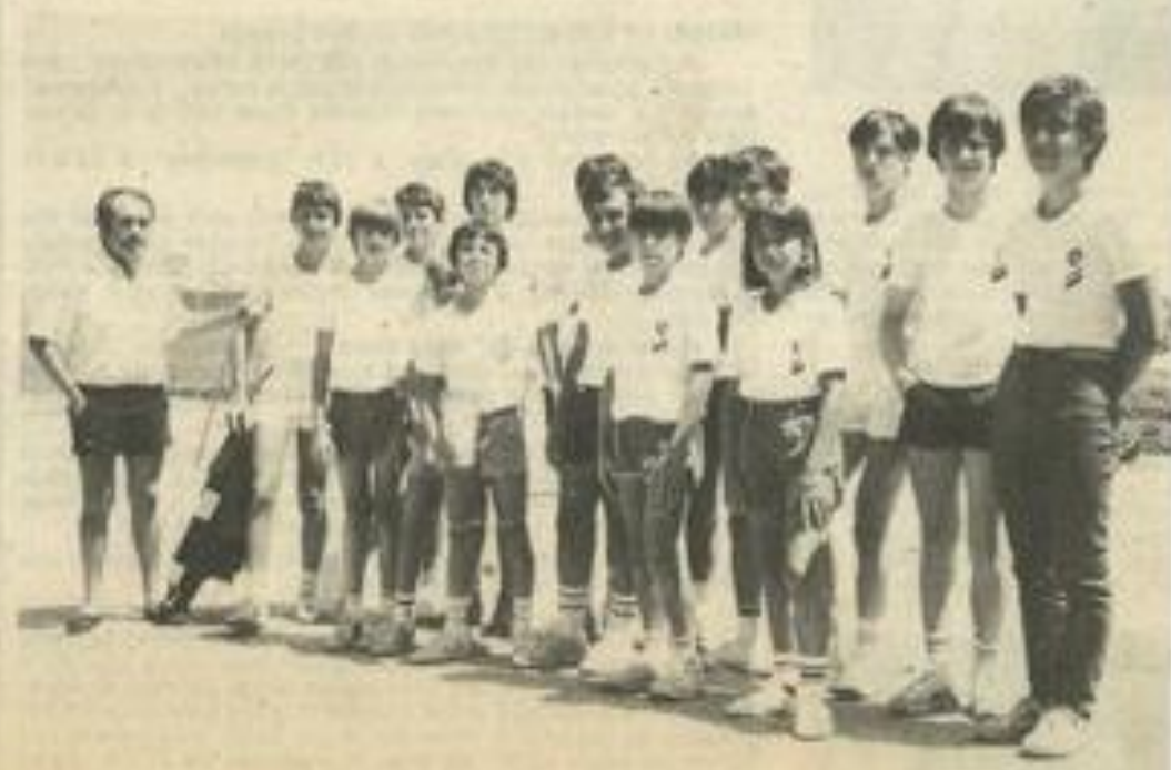
• Les 25 jeunes arbitres du tournoi.