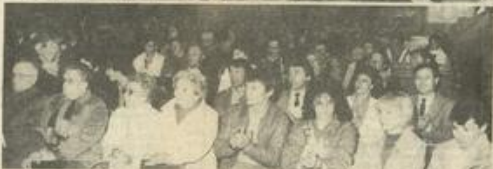
• Le public est venu nombreux assister à cette intéressante soirée.