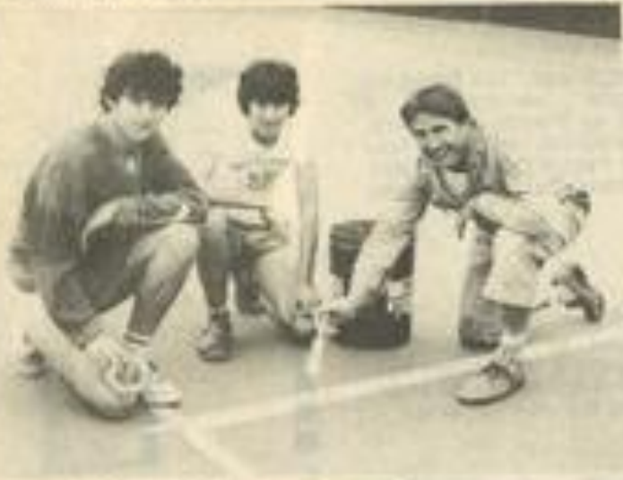
• Dernière main à la pâte, sur les courts