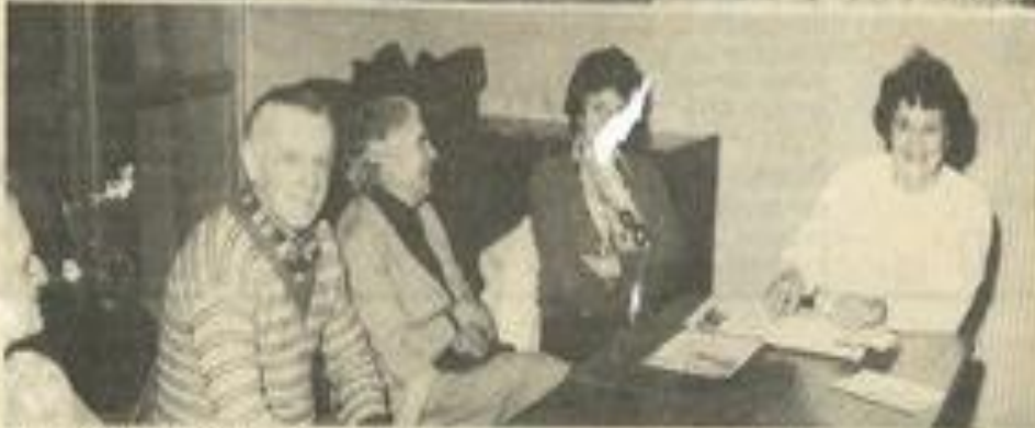
• Les représentants des clubs du 3 e âge.