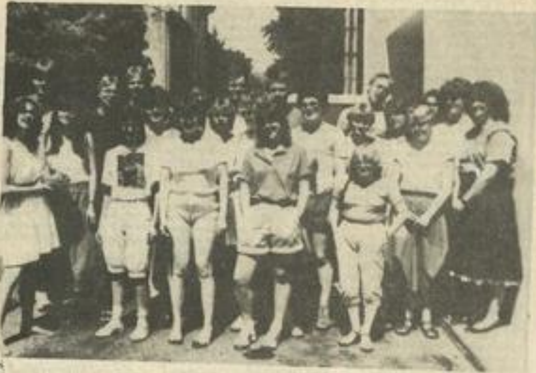
Le groupe de Lauterbâch à son arrivée