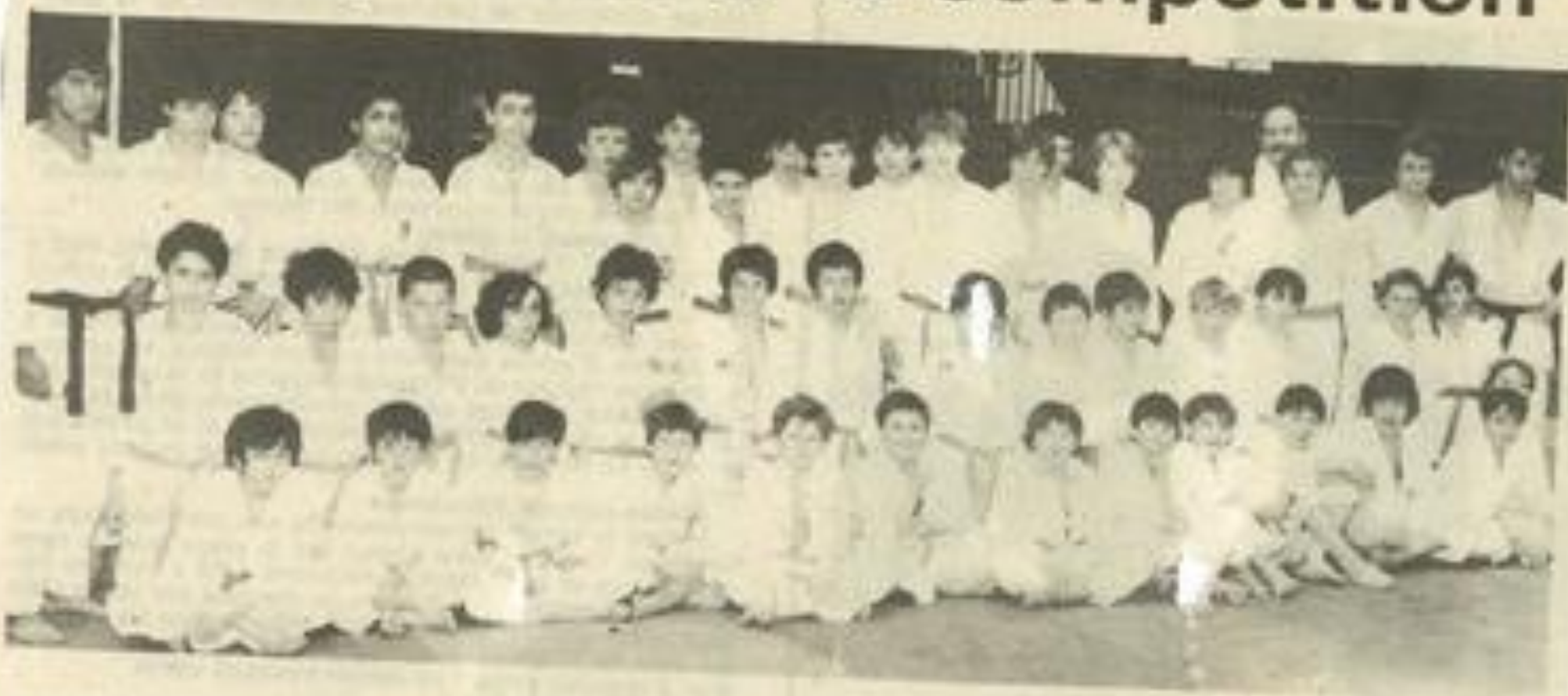
• Les participants au stage.