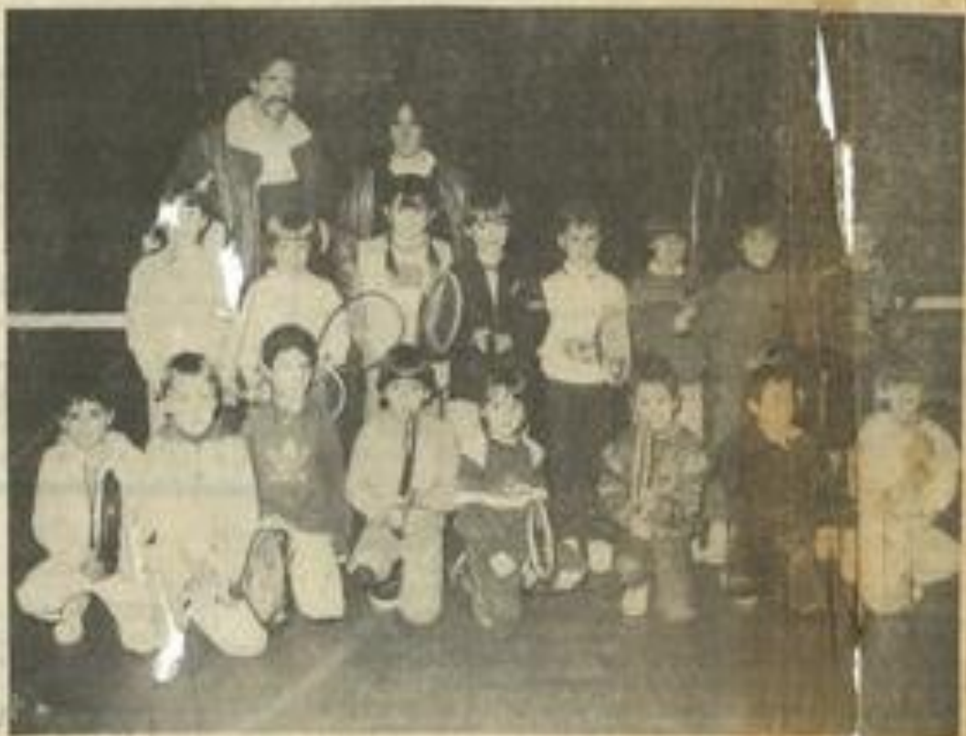
• Les jeunes raquettes du département.