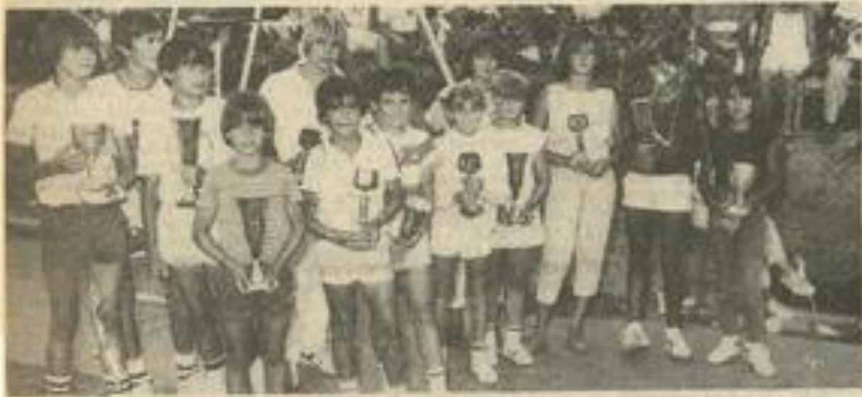
• Les vainqueurs des finales jeunes.