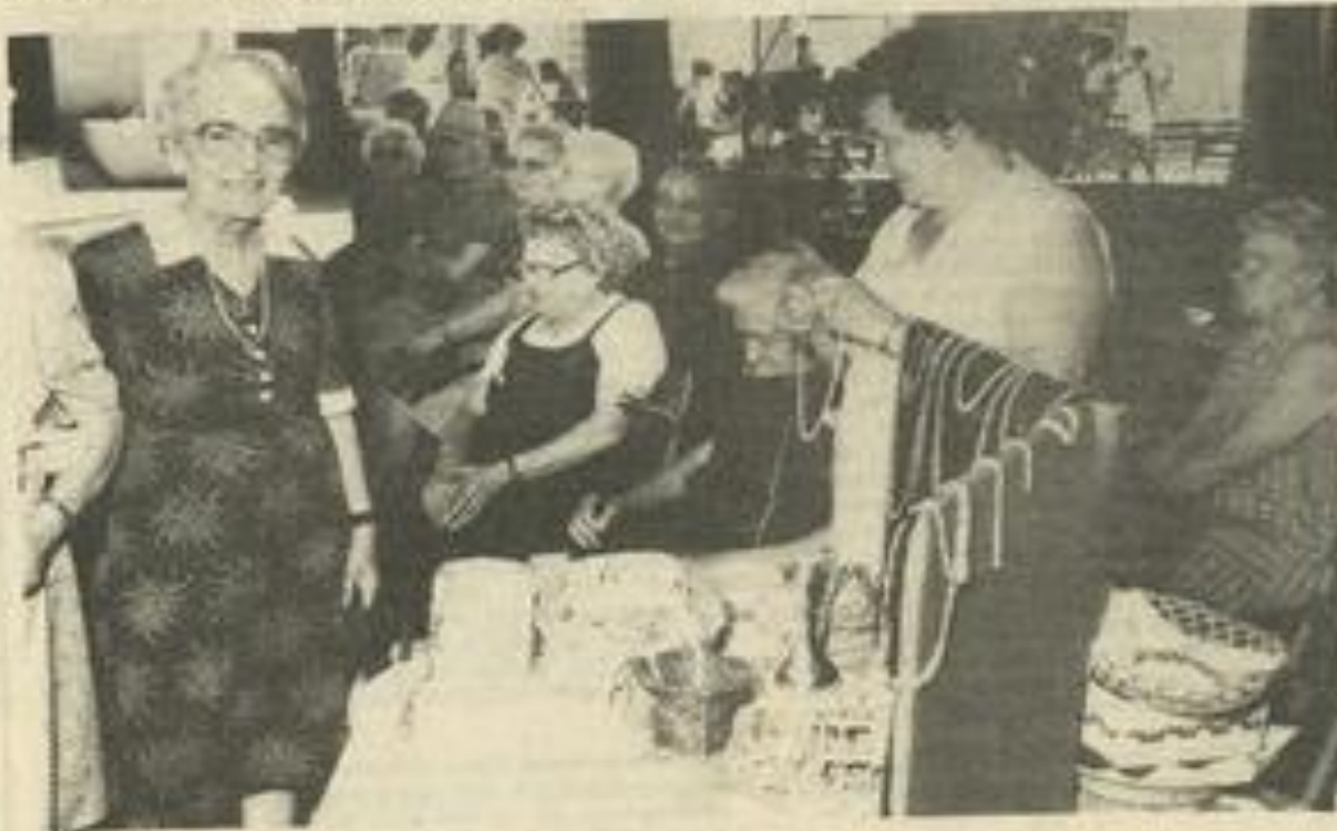
• Le stand du 3 e âge à la fête.

Ramener les lots à la M.J.C., côté jardin.