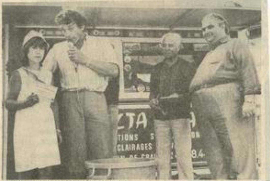
• Le tirage au sort, point fort de la dizaine.

L' é tirage de la dizaine commerciale a permis hier soir de désigner les gagnants de trois lots supplémentaires :