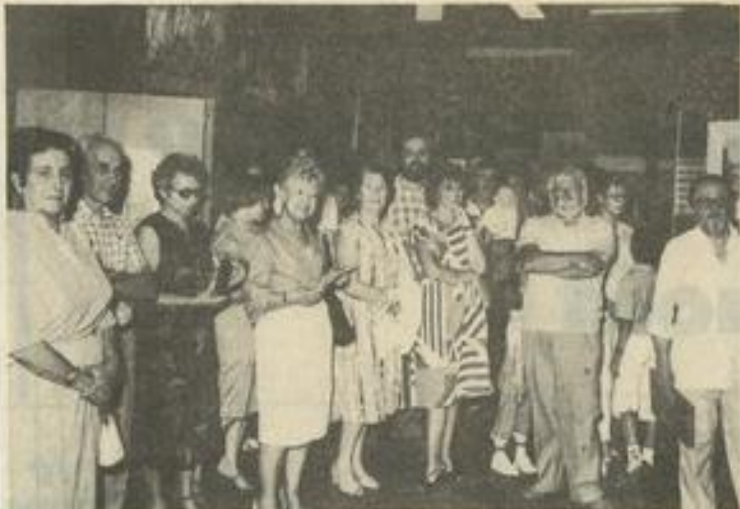
• Lors de l'inauguration du salon.