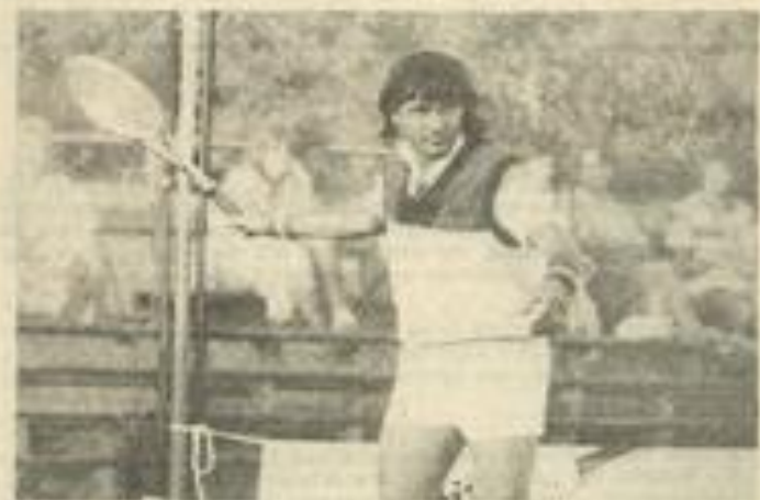
• Ilie Nastase, des airs de comique, mais une raquette impitoyable.

La finale fut arbitrée par François Bosca. C'est là que Nastase et Panatta amusèrent le plus le public et c'est également là qu'eurent lieu les meilleurs échanges. Le premier set fut remporté par Nastase 6-3, de même que le 2 e , par 6-2.