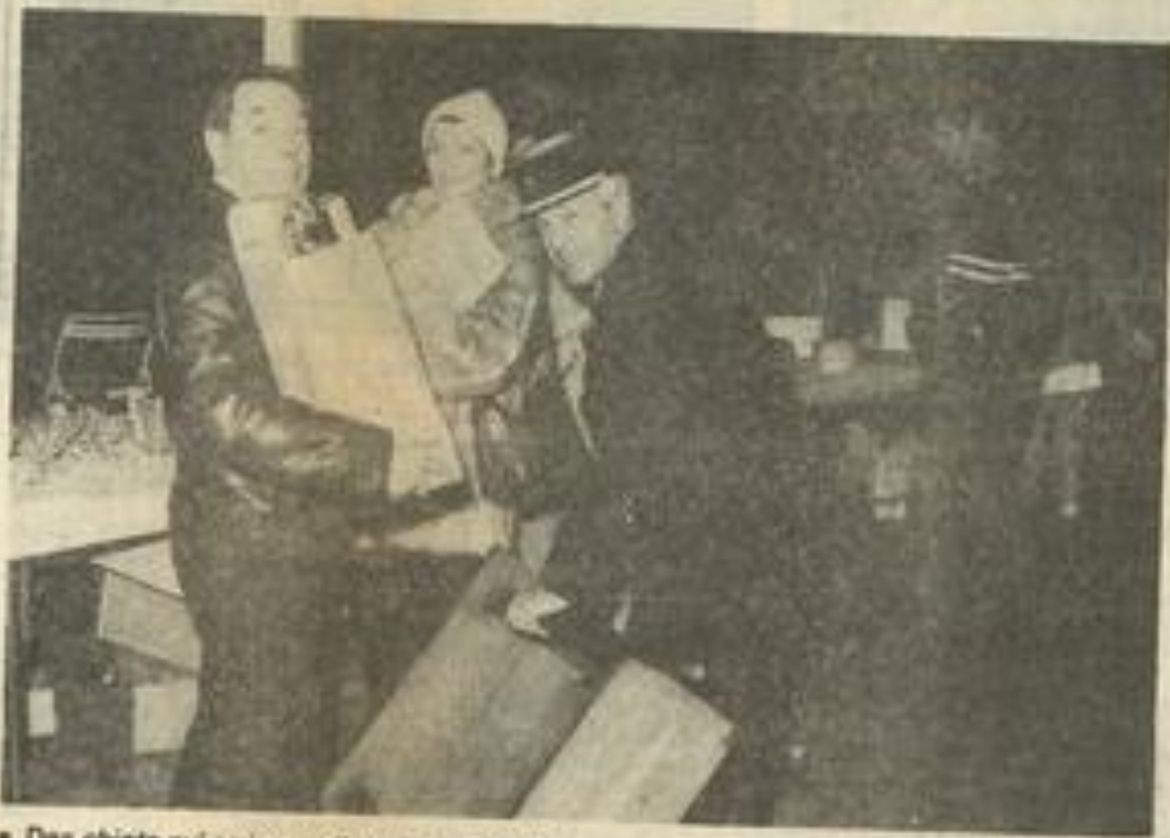
• Des objets qui arrivent, d'autres qui partent.