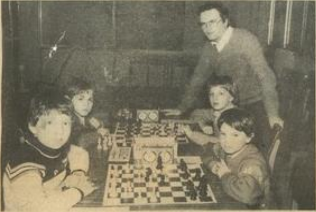
• L'école d'échecs, avant tout un jeu