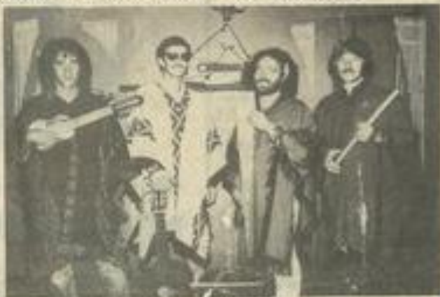
Les musiciens du groupe "Tequilé", un fameux ensemble qui vous ravira le 12 mai (Reproduction Costesèque, Léznigan).

core possible de réserver une table entière si vous décidez de venir avec vos amis.