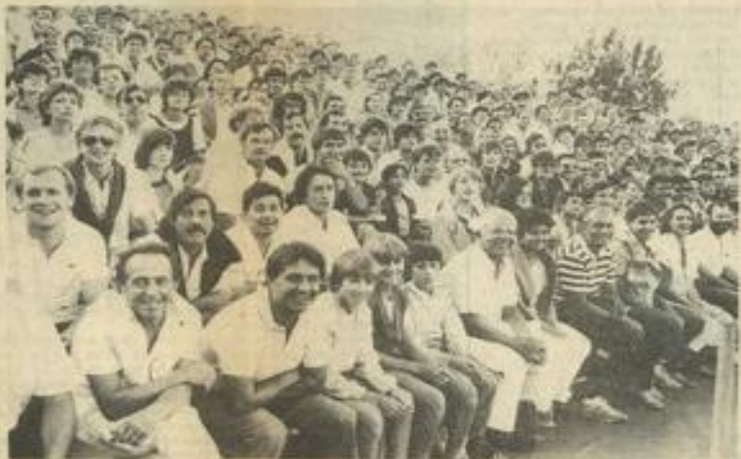
• Un public conquis.