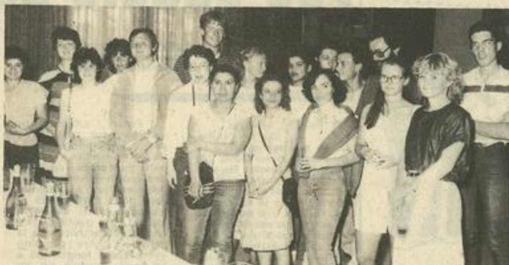
● Les étudiants jordaniens, norvégiens, français et libanais qui découvrent notre département