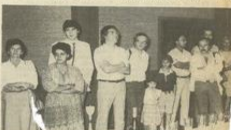
• Beaucoup de monde pour ce vernissage (Photos...)