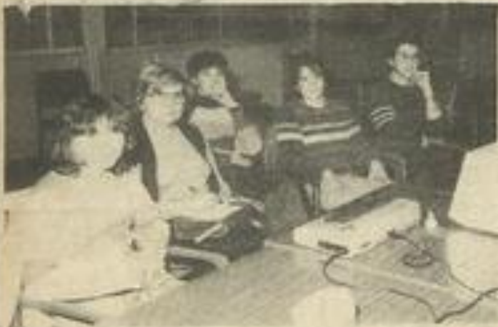
• Initiation pour tous