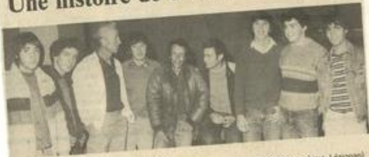
• Les spéléologues entre deux saisons