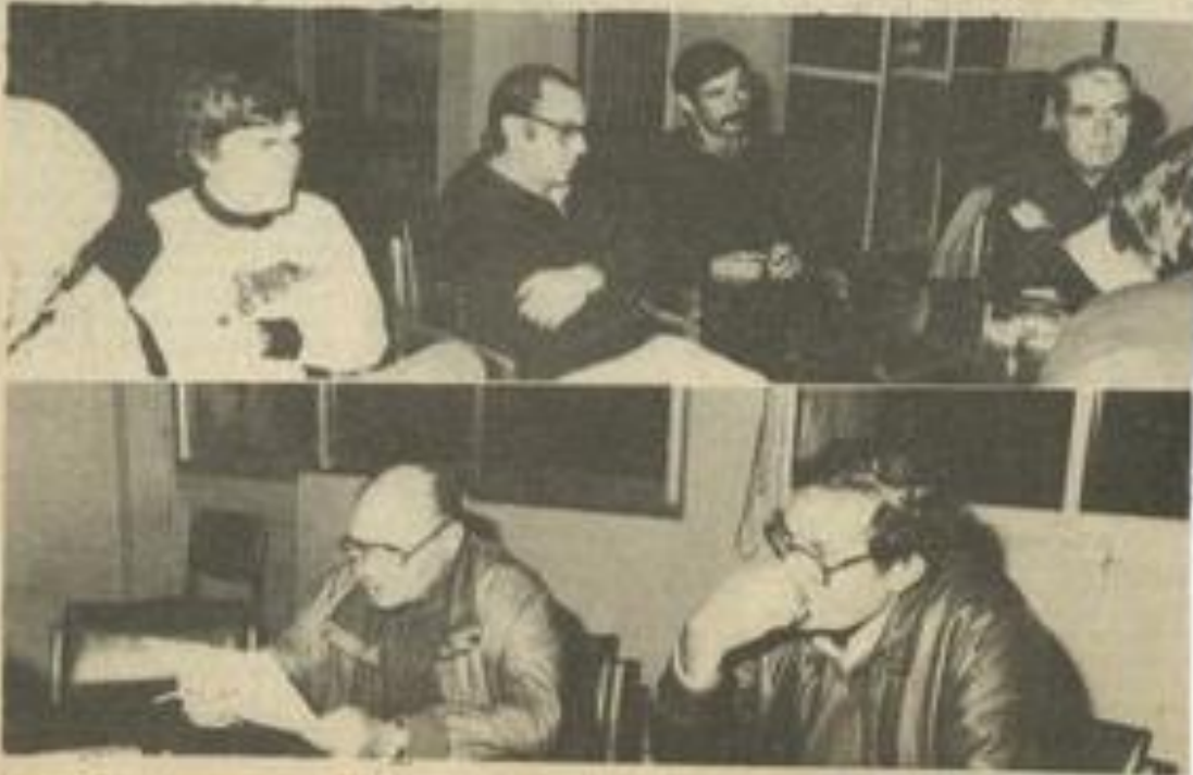
• La réunion des aéromodélistes.