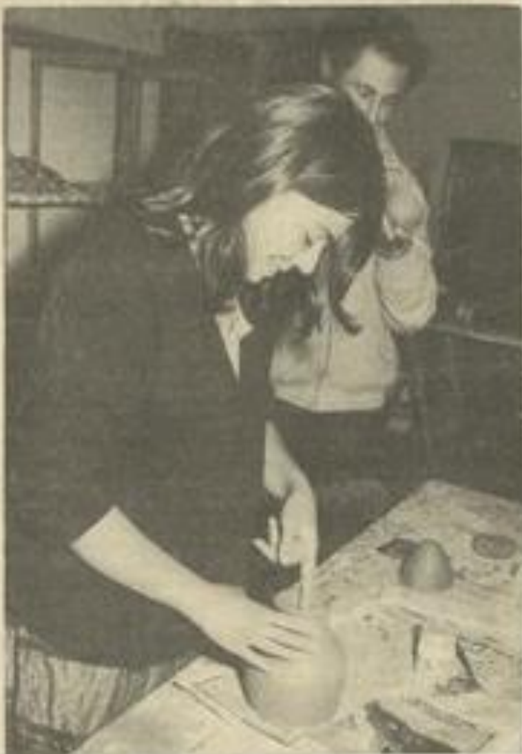
• Les adultes s'initient à la poterie

Les inscriptions ne sont pas encore closes.