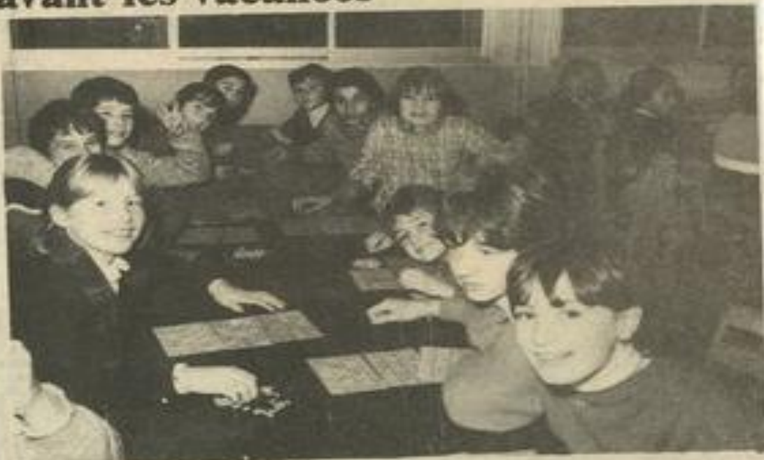
• Un loto décontracté pour les petits.