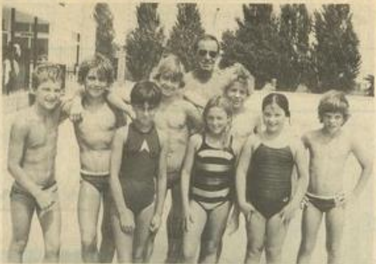
• Les jeunes Lézignanais étaient à Canet-Plage