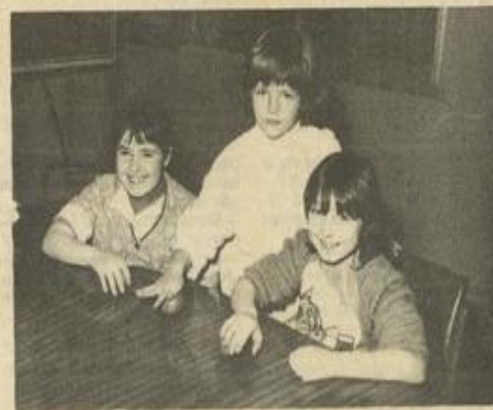
● Les petites apprenties potiers