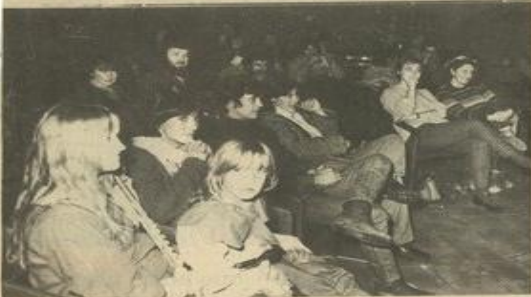
• Un public tout acquis