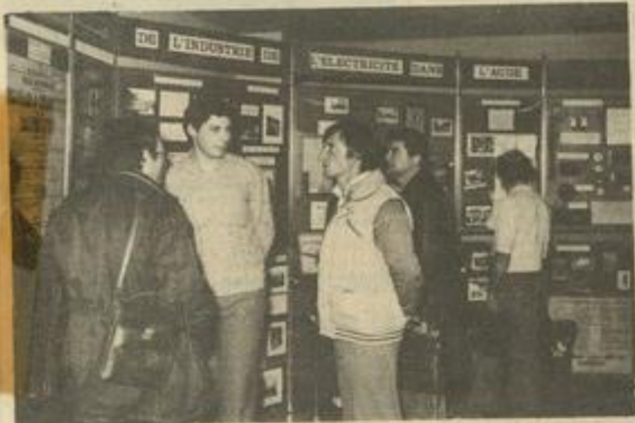
• De nombreux documents sont rassemblés : photos, instruments et pièces de musée.