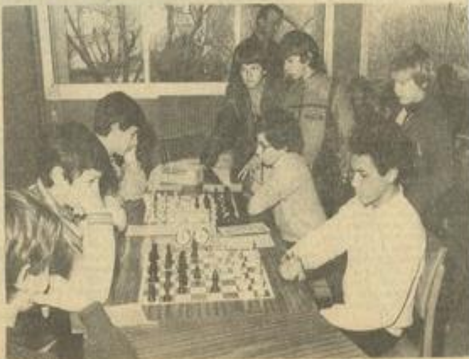
• Le temps de la réflexion

Les deux premiers qualifiés participeront aux championnats du Languedoc qui se dérouleront à Narbonne au mois de février prochain.