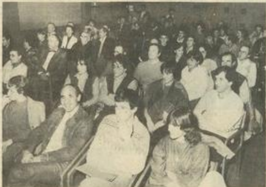
• Une assistance tout à fait honorable.