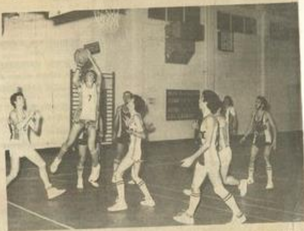
• Un tir lézignanais.

A partir de là, les "verts" main tenant leur pression, jouant toujours plus vite, Toulouges commençait à faiblir et Lézignan faisait une remontée qui inquiétait sérieusement le manager adverse. A la 11 e mi-