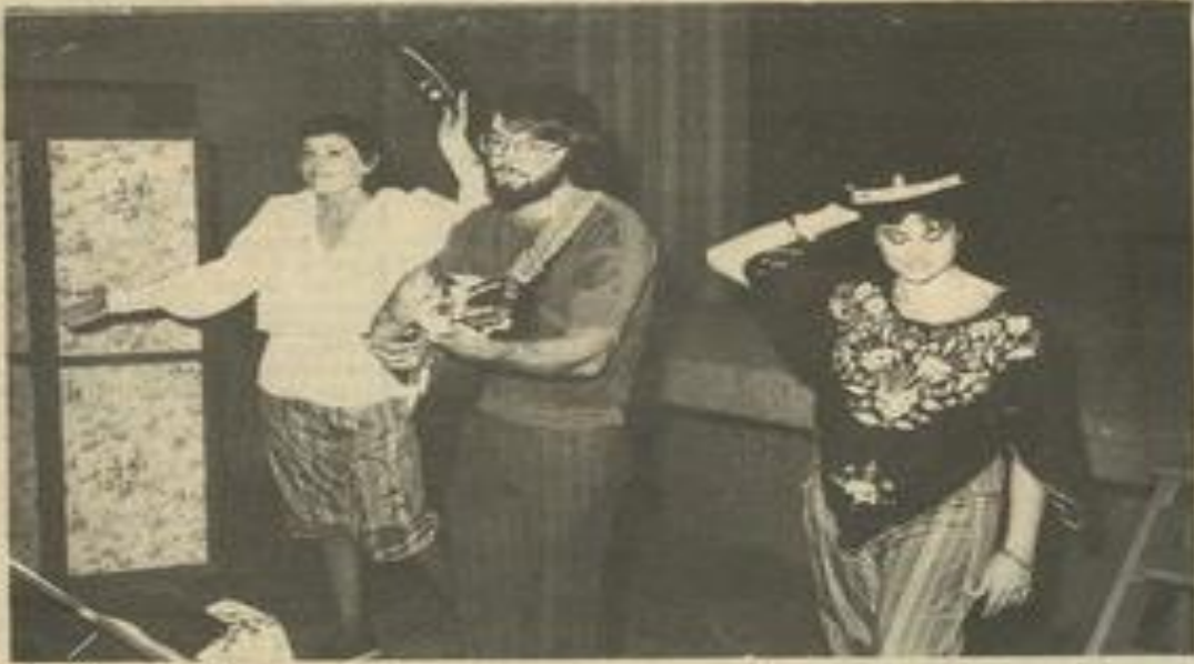
• Les trois du groupe Sans gain