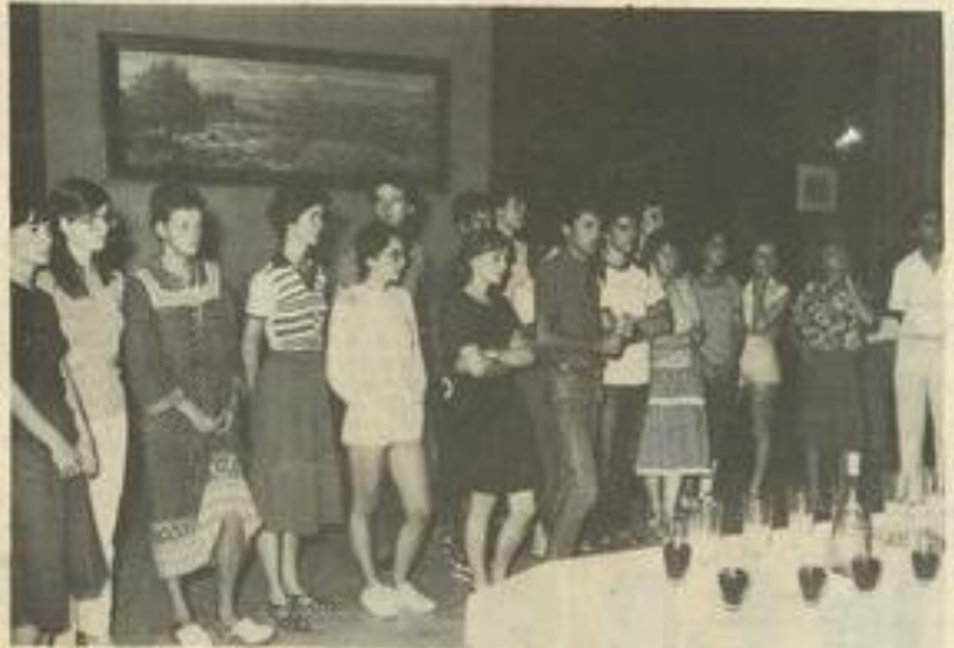
Les stagiaires reçus par la municipalité