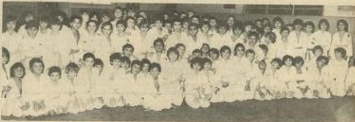
• Les participants, venus de six clubs