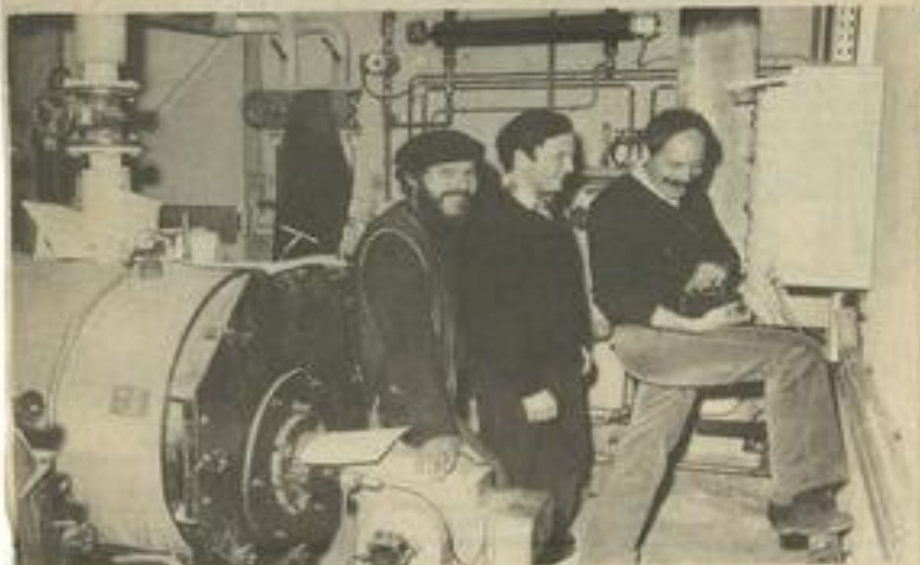
• Les installateurs vérifient les derniers détails.