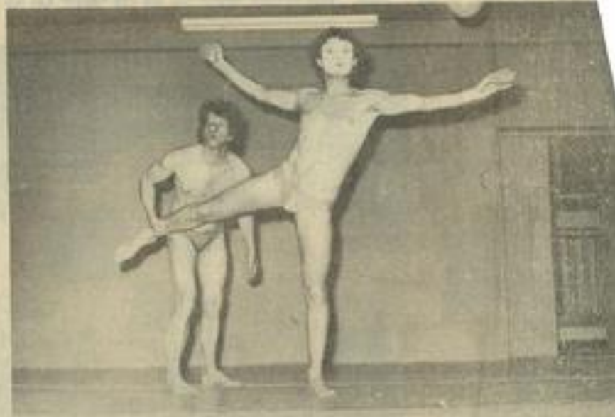
• Un moment du spectacle

d'écouter l'autre aussi sur ce mode d'expression. Ce soir là, le corps était presque interdit de paroles. Il est reparti parler à d'autres publics sous d'autres latitudes. Gageons qu'il y sera accueilli.