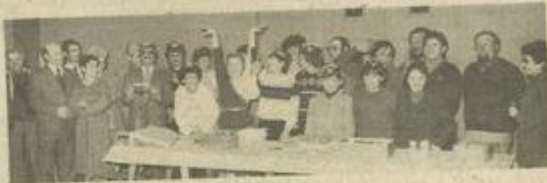
• Les amis de la danse sportive