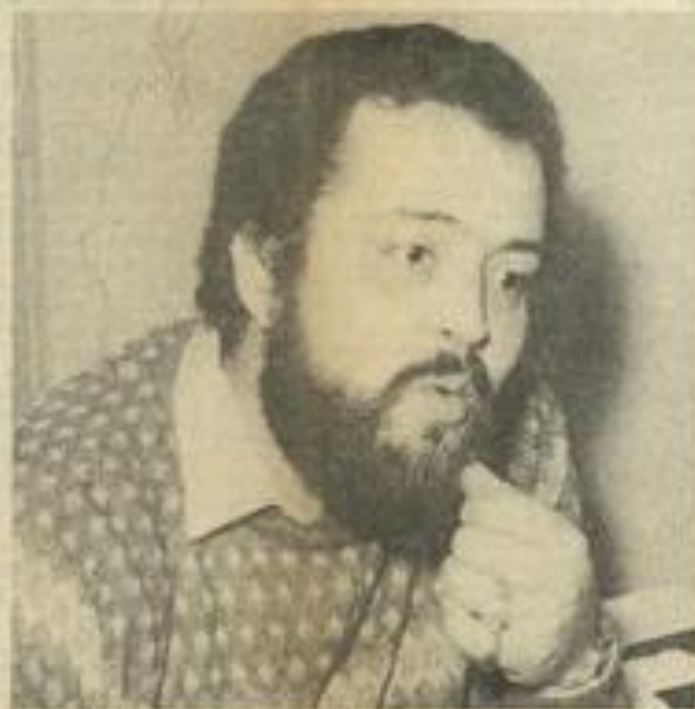
"Assurer un renouveau par les jeunes". (Photos Costesèque-Lézignan).

Pour ce qui est de l'animation, il faut voir quels sont les gens susceptibles d'être intéressés par la M.J.C. et comment les y amener. Quant aux jeunes, leur désaffection n'est pas un problème spécifique à Lézignan. Les adolescents et les jeunes adultes viennent difficilement dans les M.J.C. A Mauguio, quand j'y suis arrivé, il y avait un groupe de jeunes de 13 à 15 ans ; ils ont maintenant de 18 à 20 ans ; ils étaient 60 ou 80 à venir ; on en a récupéré 4 dans le