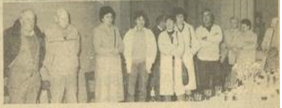
• Une partie des nombreuses personnalités présentes