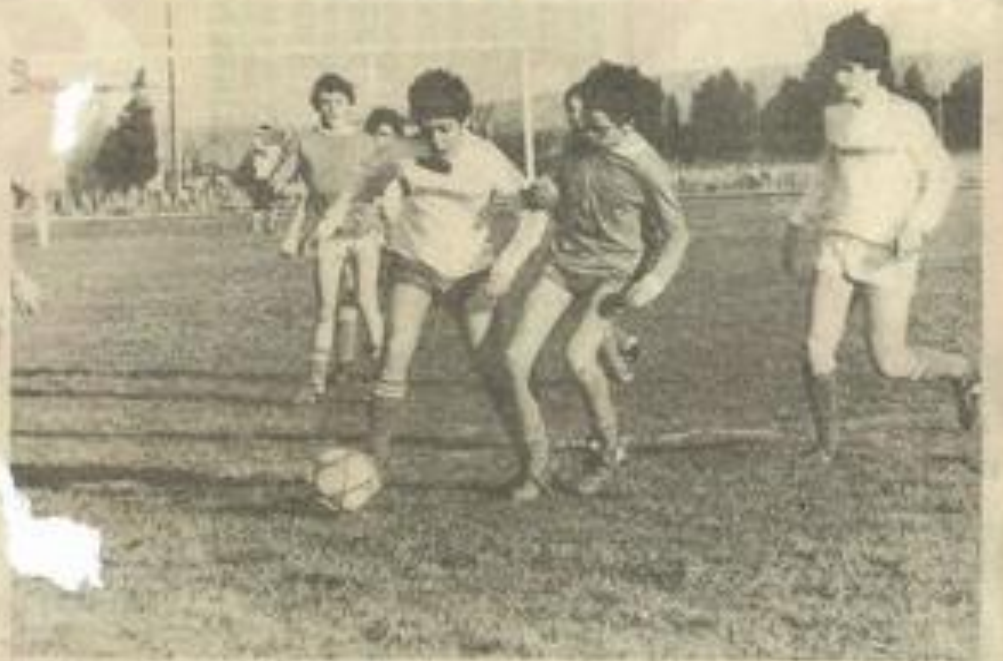
• Une vue de la rencontre minimes.

Poussins : F.C. Corbières 1 La Nouvelle 0. Cette victoire acquise à l'extérieur. Bon match des tout petits du club qui entament bien leur championnat, devant une formation difficilement maniable chez elle.