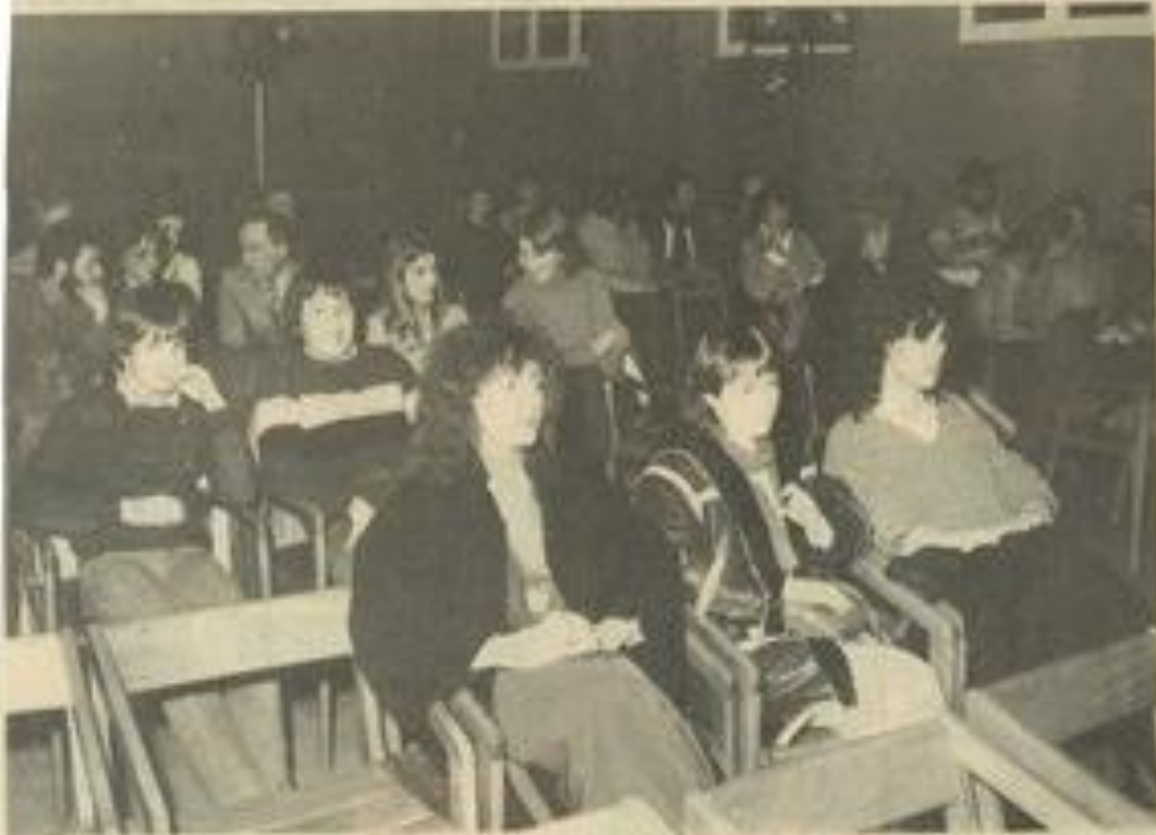
• Une partie du public qui avait pris place dans la nouvelle salle de spectacle de la M.J.C. (Photos Costesèque-Lézignan).