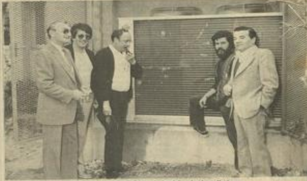
• Les représentants de la municipalité lors de la visite des installations.

C HAUFFAGE solaire pour la piscine, lampadaires solaires pour la zone industrielle, notre ville est décidément engagée à fond dans un programme privilégiant les économies d'énergie. Continuant sur sa lancée, la municipalité a décidé d'installer une pompe à chaleur à la Maison des jeunes.