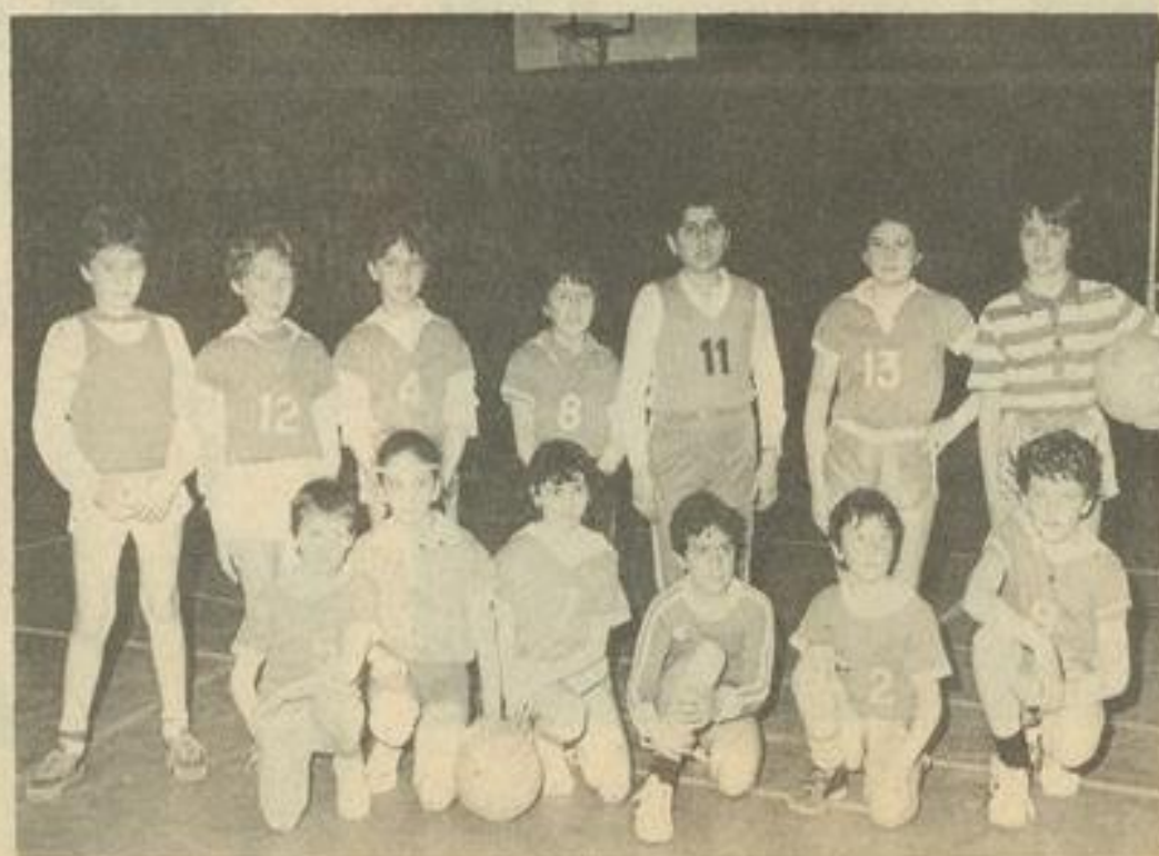
• Les poussins lézignanais

Leuc II-Castelnaudary, match nul 6-6 ; Leuc I bat Villeneuve 8-0 ; Villeneuve bat Leuc II 16-6 ; Lézignan II bat Leuc II 10-4 ; Lézignan I bat Leuc 10-8 ; Villeneuve bat Lézignan I 14-5 ; Cas-