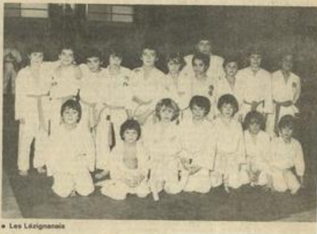
• Les Lézignanais

Cette journée, qui n'était pas vraiment un championnat mais plutôt un rassemblement de jeunes judokas, aura été profitable à ceux-ci.