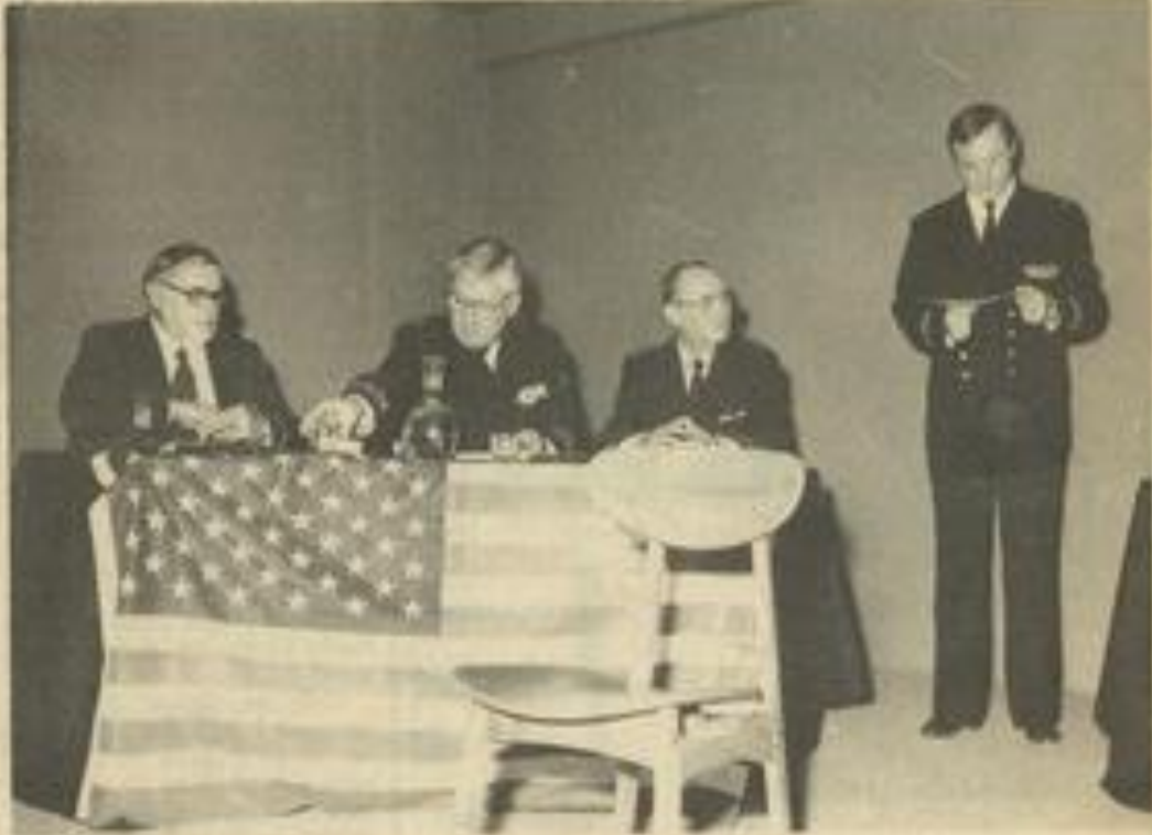
• Les acteurs pendant le déroulement du procès.

T OUT au long de plus de deux heures de spectacle, le public a pu, vendredi soir, à la M.J.C., se laisser mener dans une progression très prenante, pleine de tension, d'incertitude, puis d'émotion, comprenant bribe par bribe quel était l'enjeu du procès et le message de la pièce d'Hermann Wouk.