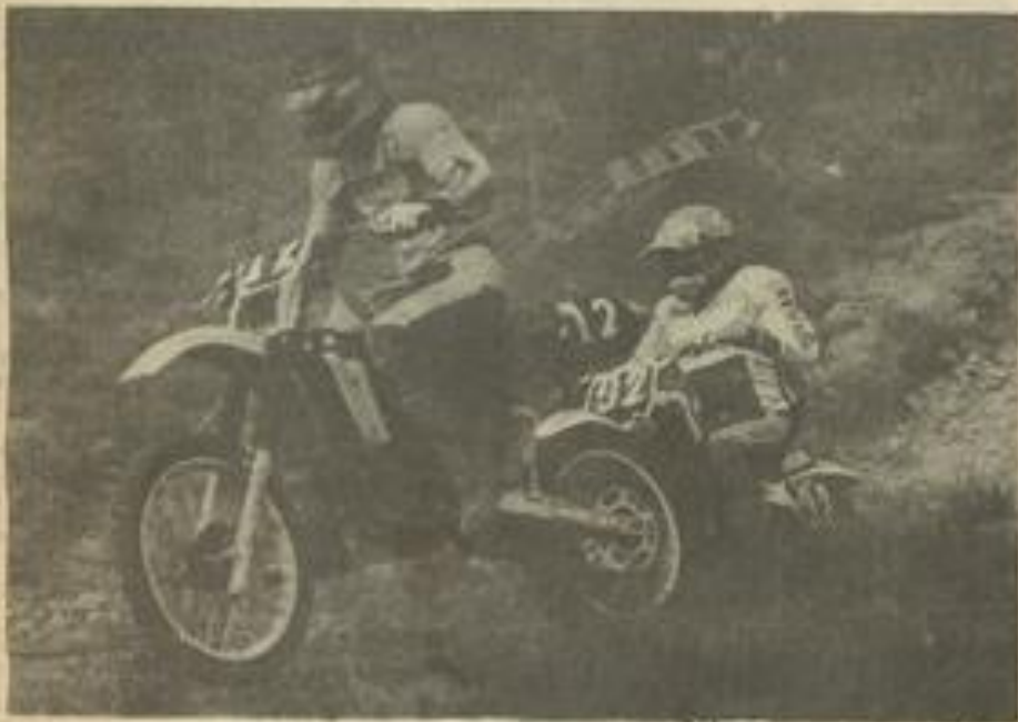
• Roue dans roue.