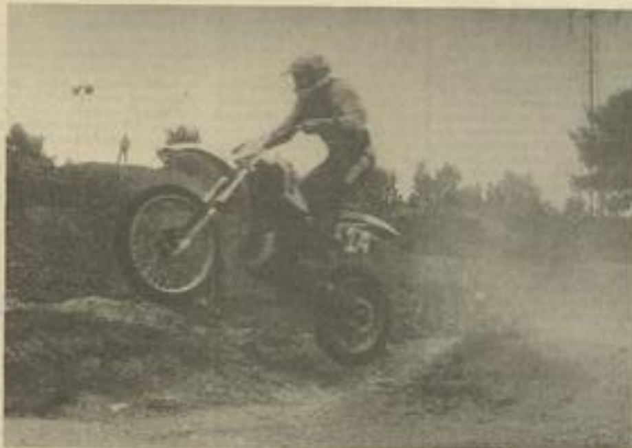
• A la sortie du tremplin.

Le troisième moto-cross lézignanaise a réveillé dimanche le circuit de La Roque de Barrau, dans la pinède. Après l'expérience des deux premiers, on peut dire que le Moto-club Corbières est maintenant bien rodé et qu'il est l'auteur d'une compétition dont l'attrait atteint toute la région.