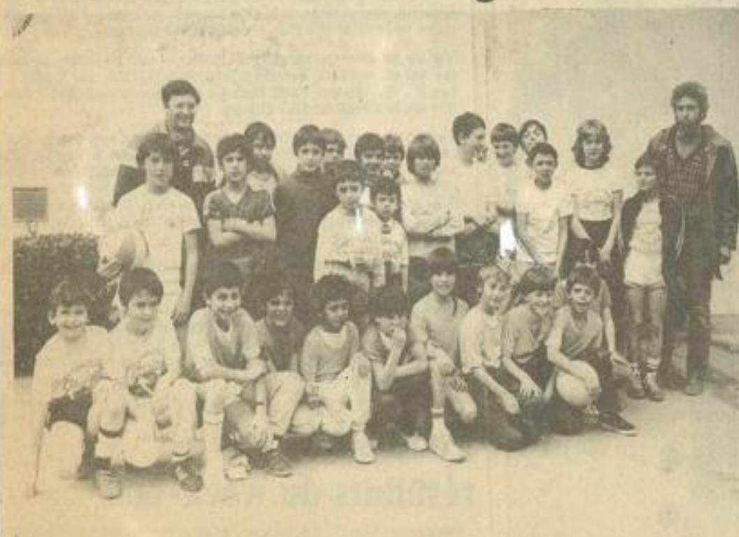
• Les poussins de Castelnaudary et Villeneuve-la-Comptal.

Le premier d'une série de tournois de basket dans les catégories poussins et benjamins avait lieu samedi à Lézignan, au gymnase Léo-La grange. Les clubs participants doivent recevoir, à tour de rôle, un tournoi du même genre.