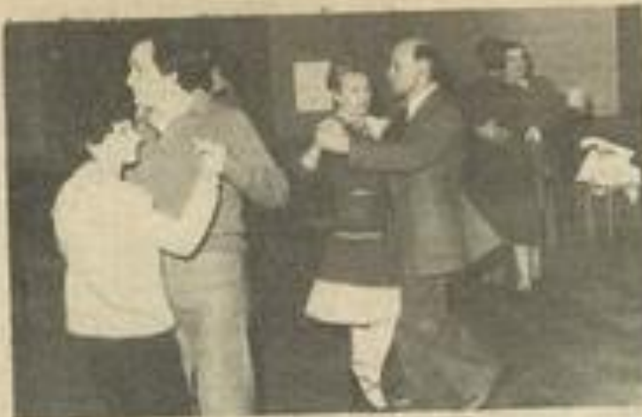
• N'accorderez-vous une valse ?

Du paso doble à la samba et du slow au cha-cha-cha et au rock ou au jerk, l'école de danse sportive permet à ceux que le rythme attire d'apprendre les danses de leur choix. La musique et la danse, on les a dans la peau mais les pas et les figures s'apprennent avec un peu de patience. Et même les plus gauches et les plus timides peuvent acquérir la maîtrise d'une danse et, sans se prendre forcément pour Trévolts, se considérer comme des danseurs dignes de ce nom.