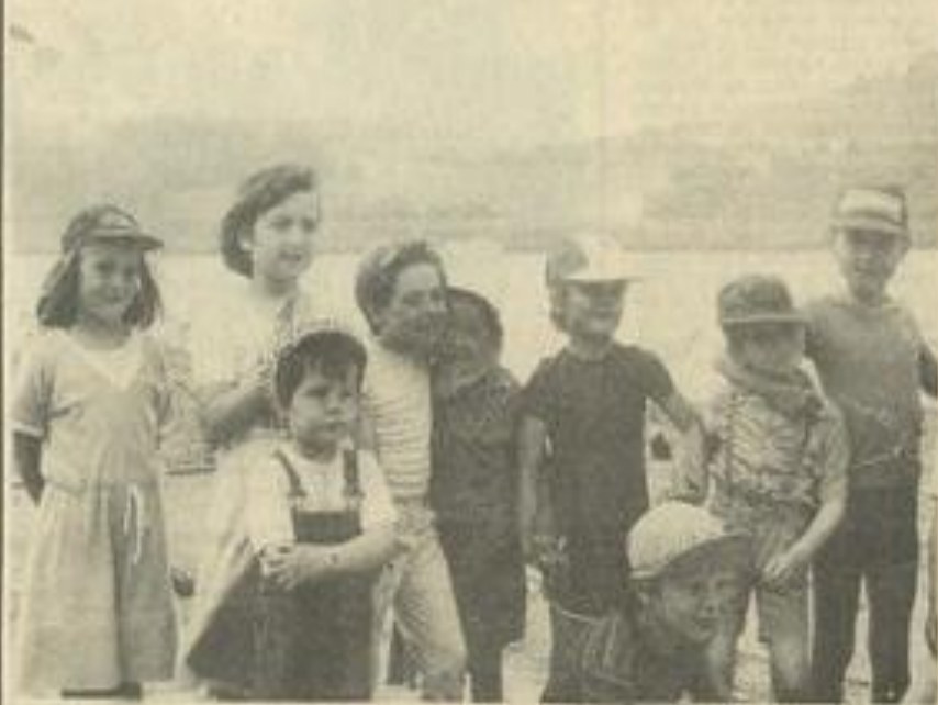
• Au bord de l'étang.