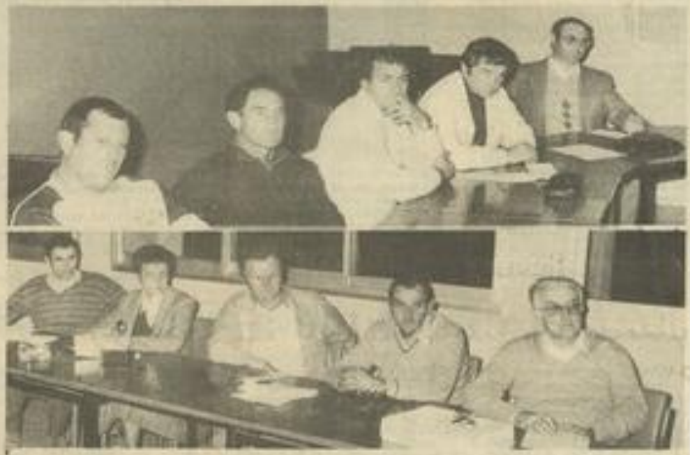
• Les représentants des M.J.C. du secteur.