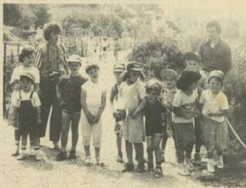
• Agréable promenade.