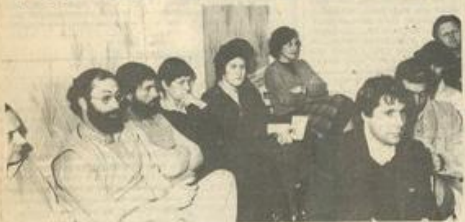
Des travaux fructueux qui devraient aboutir le 24 mars...