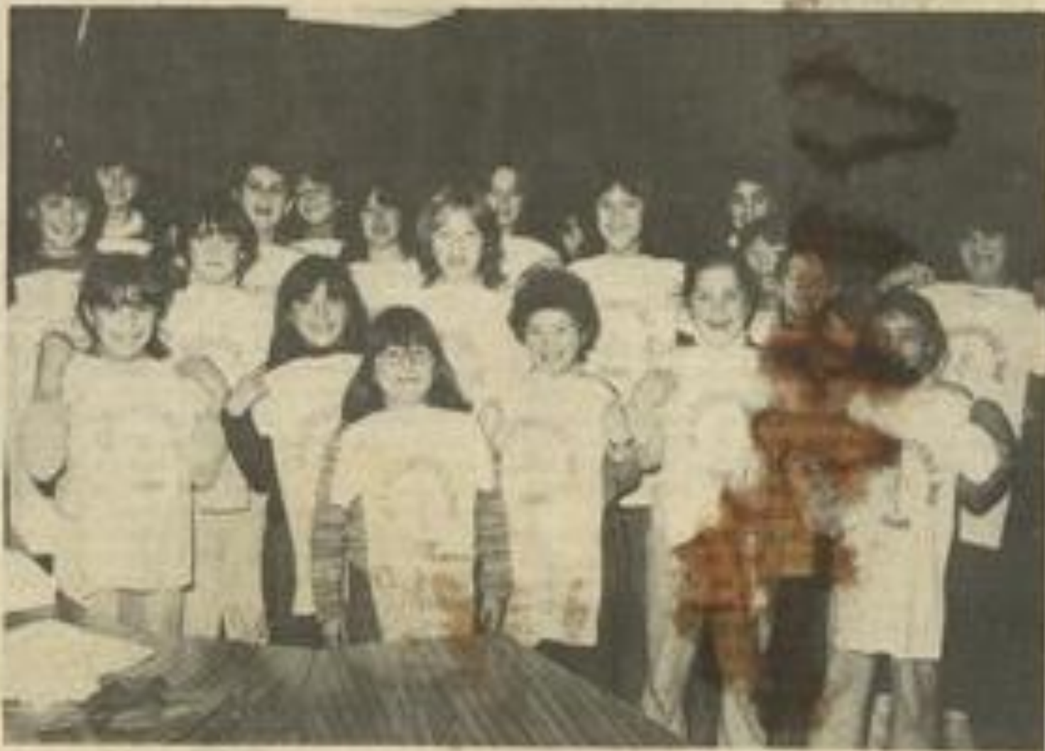
• Les majorettes avec leurs nouveaux tee-shirts.