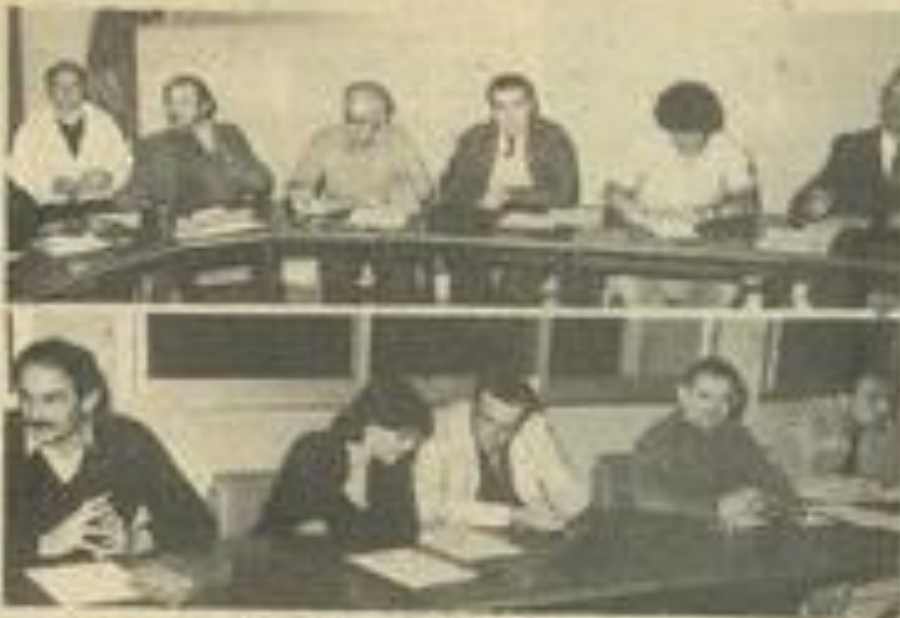
• Deux vues de cette réunion de la F.D.M.J.C.

Nous publierons prochainement un compte-rendu plus complet de cette réunion.