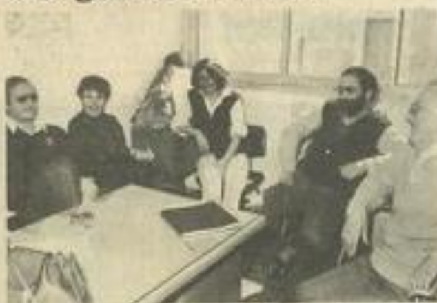
• Les directeurs se concertent.

Il s'agissait d'une réunion d'étude sur la promotion des centres de séjours du département. A cette occasion, plusieurs possibilités ont pu être étudiées (participation à un certain nombre de rassemblements, par exemple).