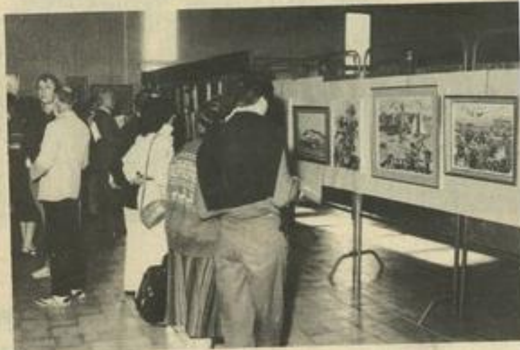
• Des œuvres très différentes.