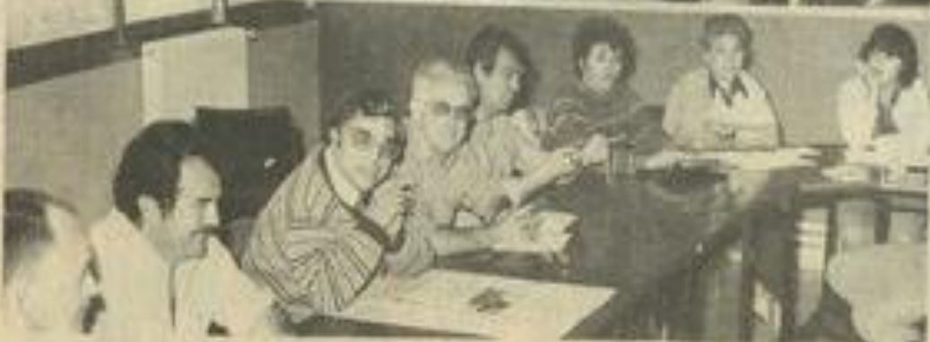
• Les membres du bureau.