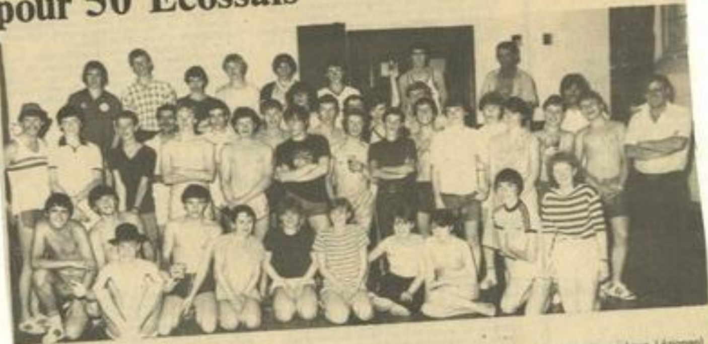
• Les élèves de Harris Academy