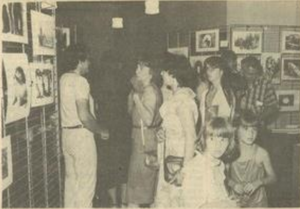
• Beaucoup de monde pour cette première.