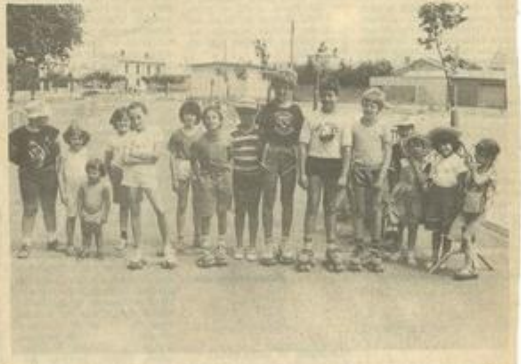
• Les petits patineurs au départ.