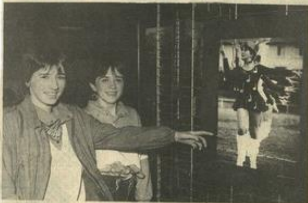
• Nos majorettes ont bien plu à nos voisins...