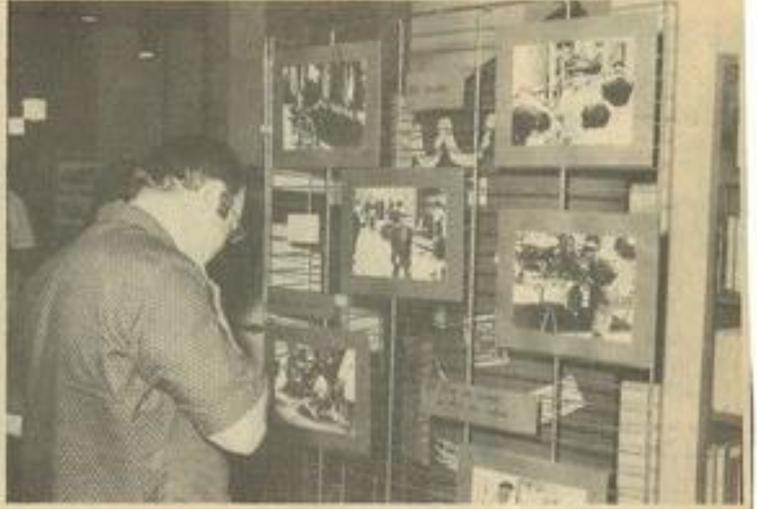
• Quelques scènes de la vie quotidienne brillamment mises en valeur. (Photos Costesque, Lézignan)

A PRES le diaporama présenté cet hiver, nos photographes amateurs proposent jusqu'à mercredi prochain leur exposition à la bibliothèque municipale. Recherche et technicité sont les qualités majeures des images exposées. Visages, attitudes, paysages naturels, instantanés de la vie quotidienne, des thèmes très divers caractérisent cette exposition. D'ores et déjà, les personnalités invitées