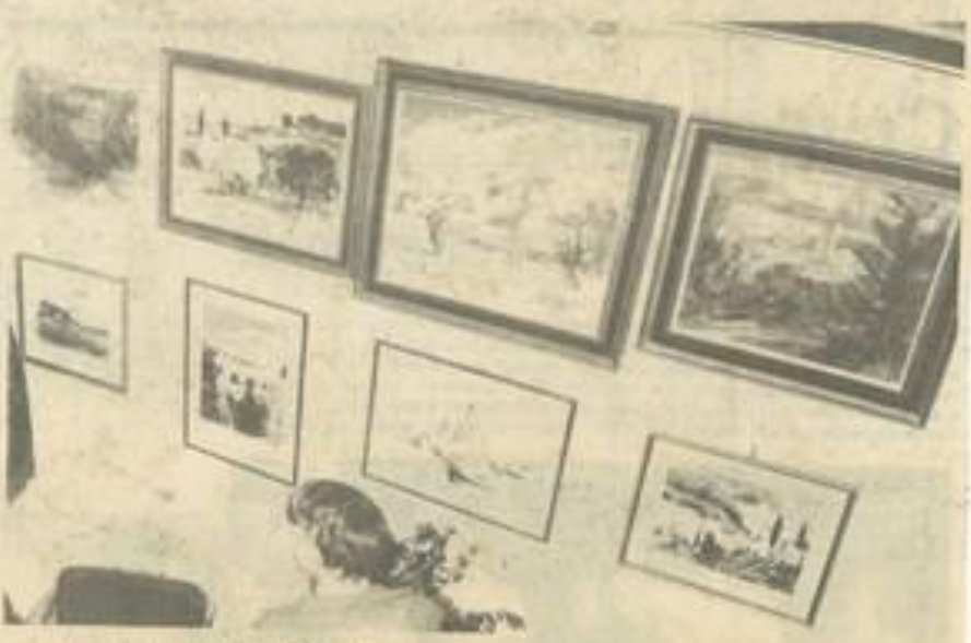
• Du 9 au 19 avril, au Palais des fêtes.