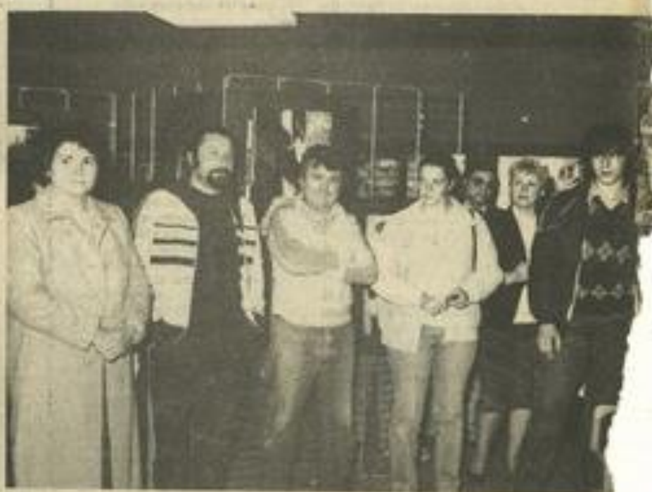
• Les Lézignanais pendant la présentation.