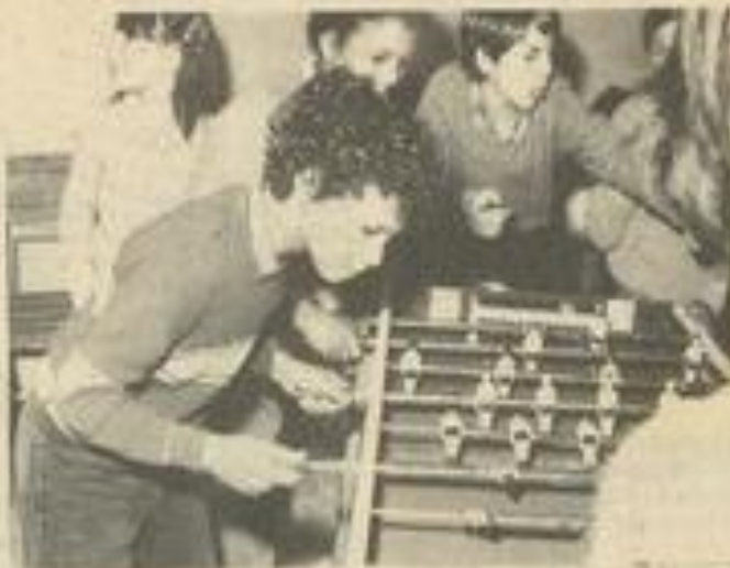
• Pendant la compétition

de se retrouver avec leurs homologues des autres villes, le 15 décembre.