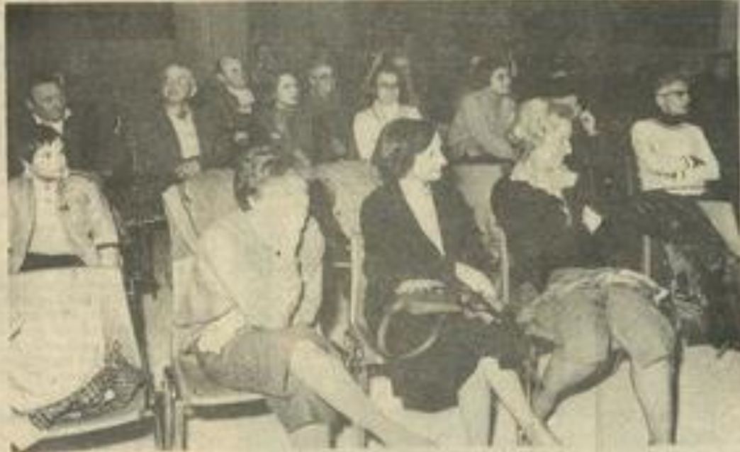
• Un public passionné.