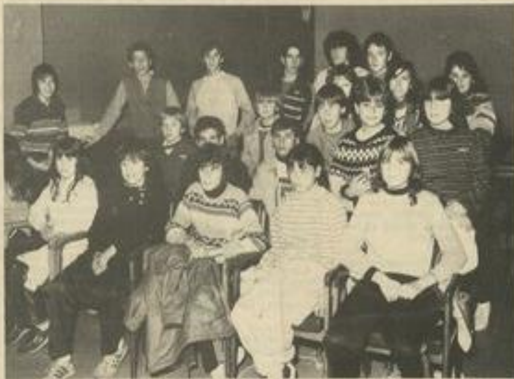
• Quelques membres de la J.S.L.

Départ gare SNCF rendez-vous 7 h 30, retour gare SNCF 20 h 30. Prévoir un repas froid (penser au maillot et short, pas de pointes).