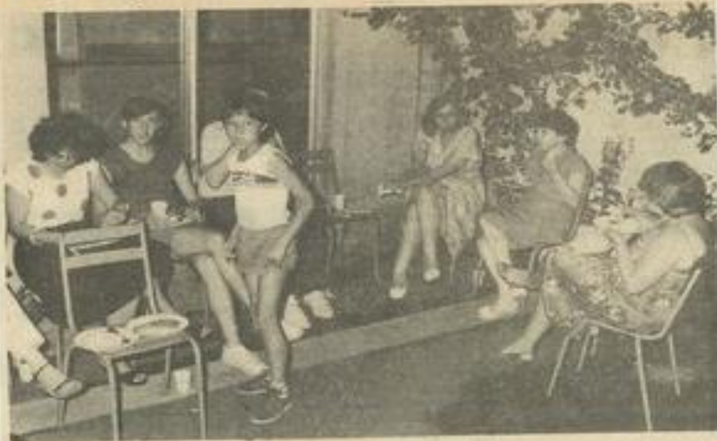
• Un moment agréable.