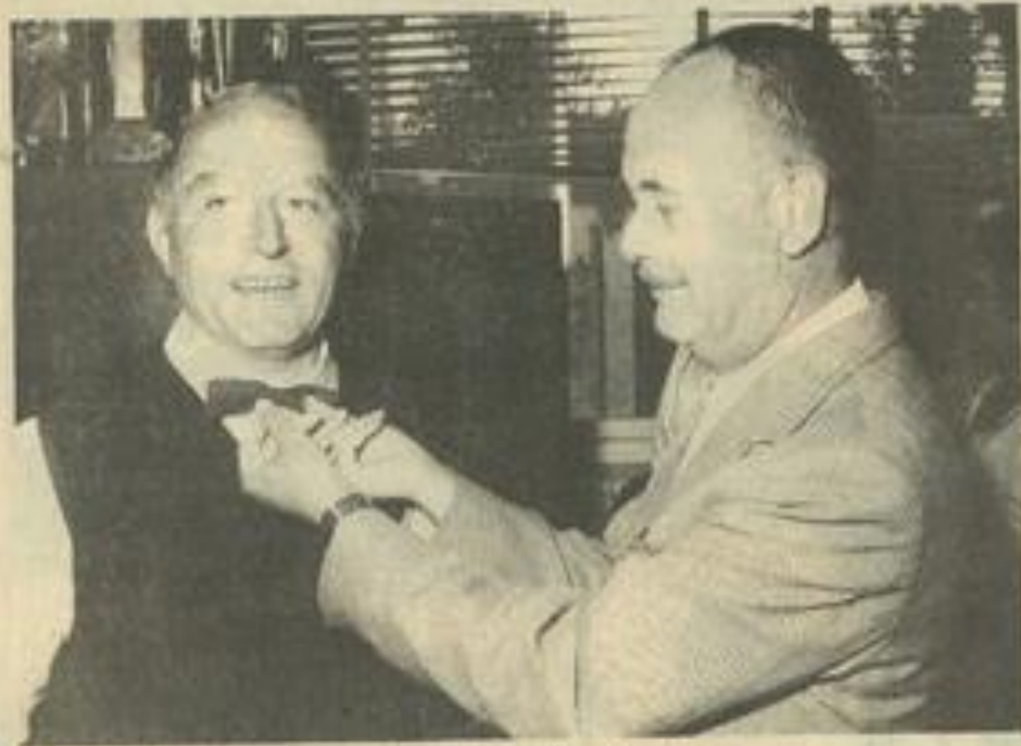
• Un président se doit d'arborer « le petit nœud de circonstance... »