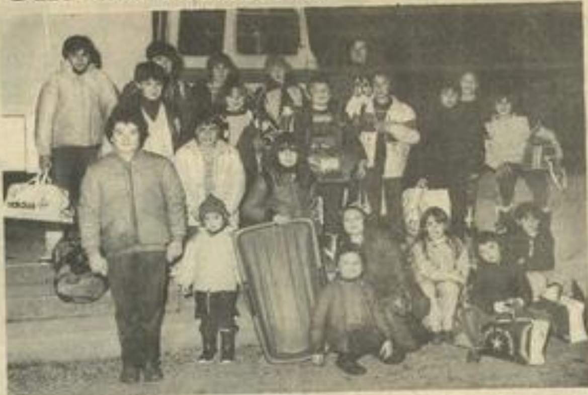
• Fourbus mais satisfaits.