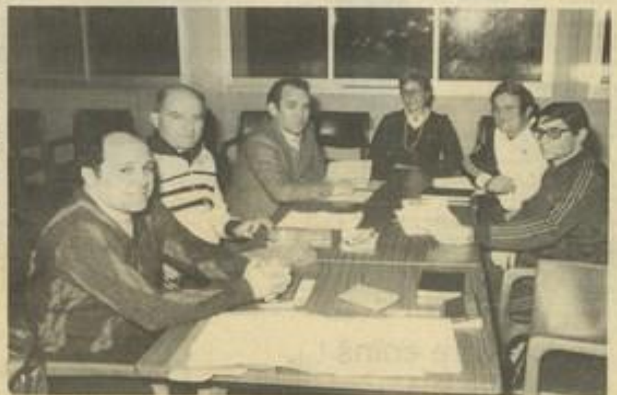
Les responsables des clubs d'athlétisme.

saison. Elle restera en relation avec la Jeunesse et les Sports.