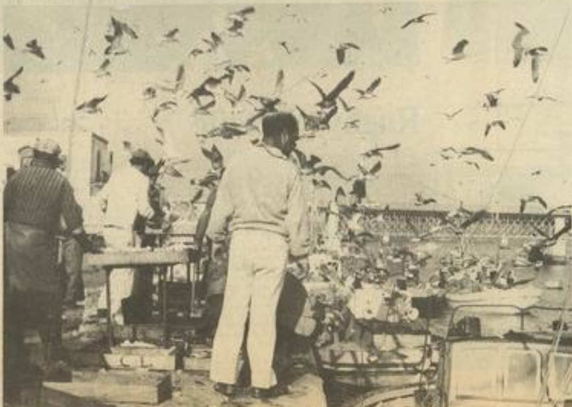
• La pêche, l'une des principales activités.