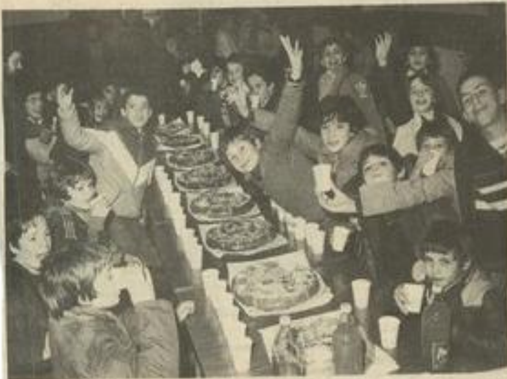
● A la section des jeunes treizistes.

LES jeunes rugby, ten ont posé le ballon au instant, samedi, pour faire la fête. Le goûter de Rois que la section des jeunes organisait à la M.J.C. a attiré un bon nombre de participants qui ont répondu présents comme ils le font quand il s'agit d'aller sur le stade.