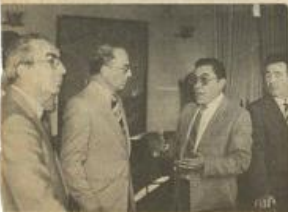
• Les Lézignanais reçus par l'un des responsables portugais.

À Faro, où les quelques petites industries surtout des conserves ont disparu depuis que le thon s'est éloigné des côtes portugaises vers le Maroc, la pêche reste très importante bien qu'artisanale ainsi que l'agriculture avec ses méthodes d'exploitation très arriérées. Mais l'Algarve est aussi une importante région touristique.