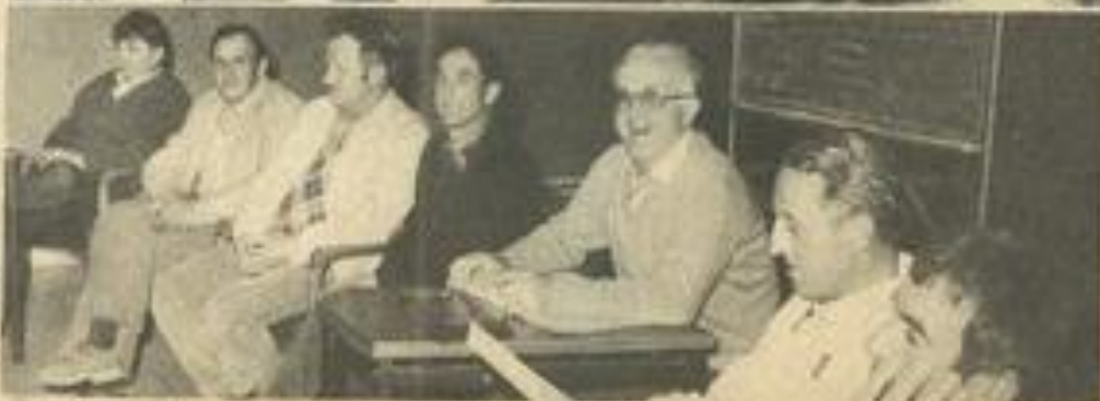
• Les représentants des M.J.C. du secteur.