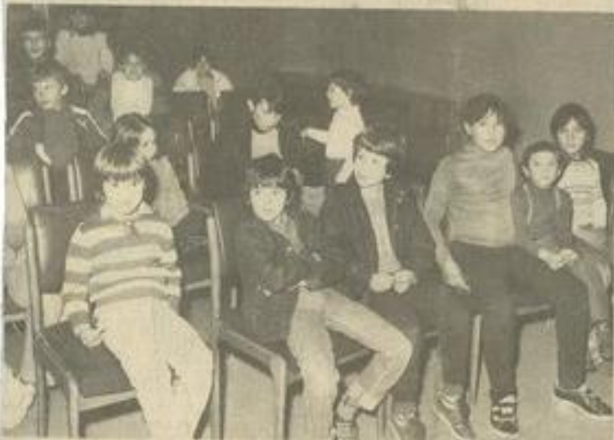
• Le public du ciné-club enfants