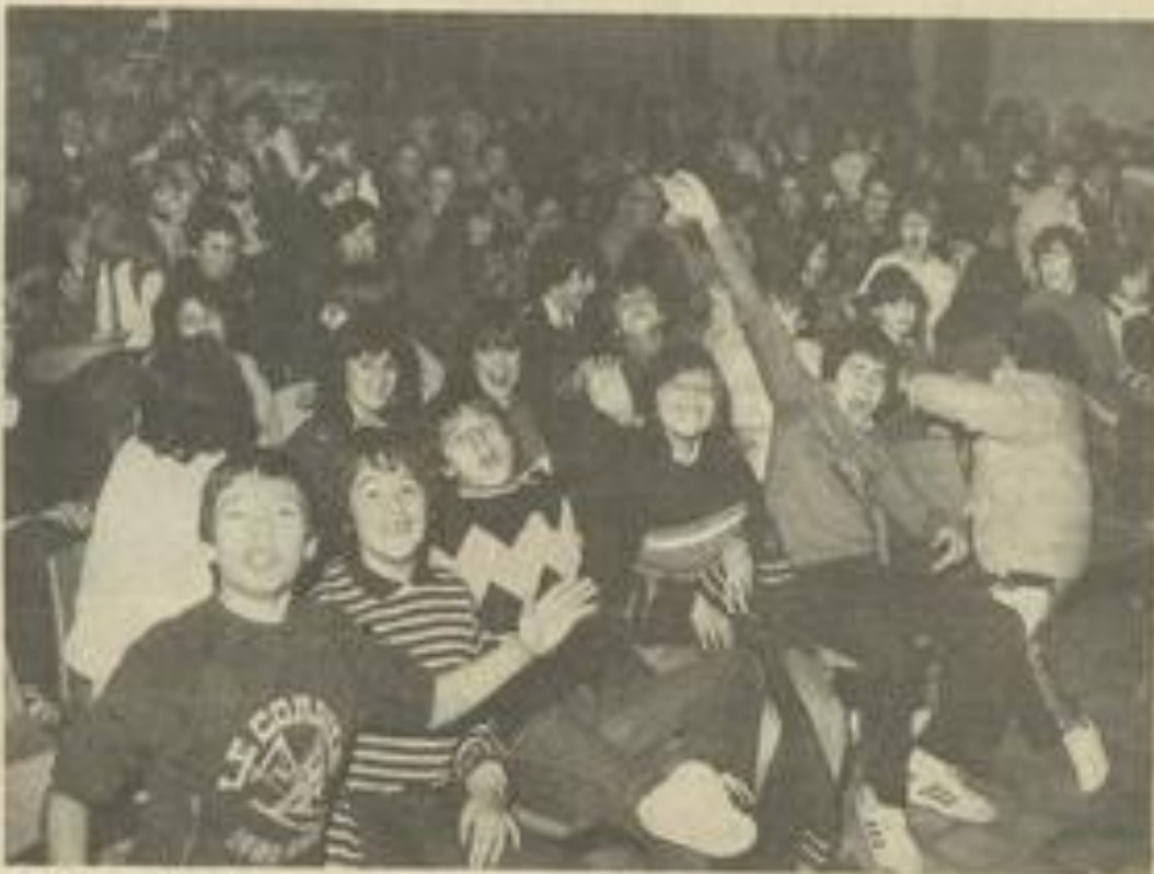
• Une vue du public