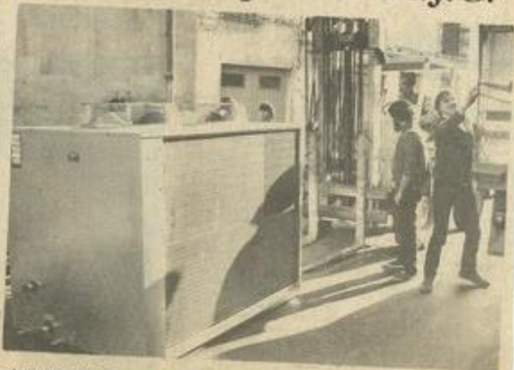
• La livraison du nouveau système de chauffe.

Une pompe à chaleur comparable à celle-ci pourrait servir à chauffer l'école Marie Curie.