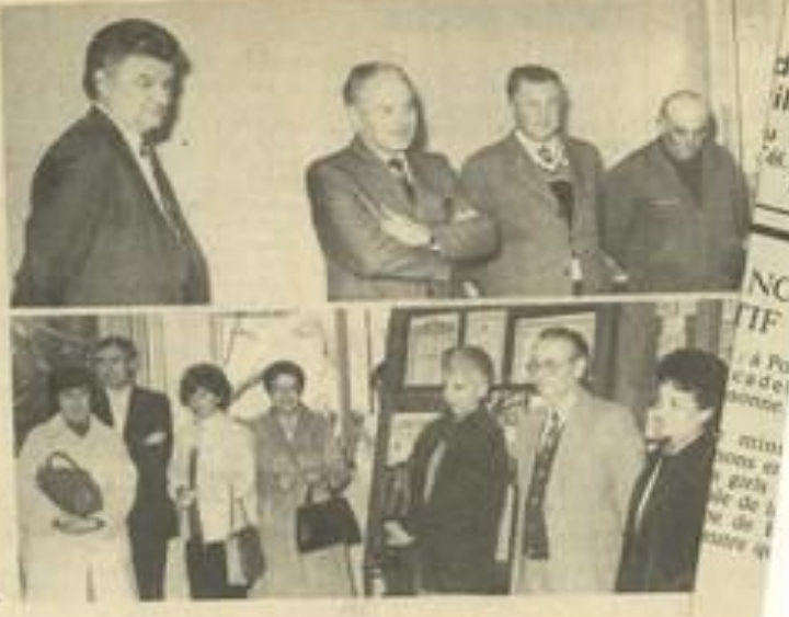
• Les exposants et organisateurs lors de l'inauguration.

trains à voie étroite qui ont sillonné le département de 1901 à 1936 (il s'agit des cachets des convoyeurs). Plus loin, les cachets des trains à voie large, autrement dit des lignes principales, celles qui existent encore. Les lettres censurées, elles n'ont plus, n'ont pas d'époque bien arrêtée car la censure a existé de tout temps : pendant les guerres de 14 et de 40, ou actuellement comme l'atteste une lettre venue de Pologne. Les collections thématiques, sur l'aviation ou la France touristique par exemple, ajoutent une note plus personnelle. Enfin, les assignats, billets de banque, actions et emprunts russes donnent une visualisation intéressante d'autres événements historiques. Le visiteur peut trouver dans une telle exposition autant de plaisir que celui qu'on éprouve ses auteurs en la mettant en place.