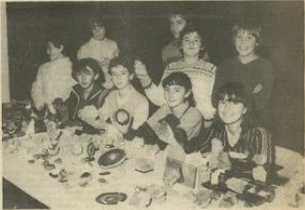
• Le club des amateurs de fossiles et minéraux de la M.J.C.

LA cinquième bourse aux Minéraux, samedi et dimanche, a attiré de nombreux amateurs de "vieilles" pierres et de fossiles autour des stands de neuf exposants, commerçants ou collectionneurs, et aussi des jeunes du club de la M.J.C.