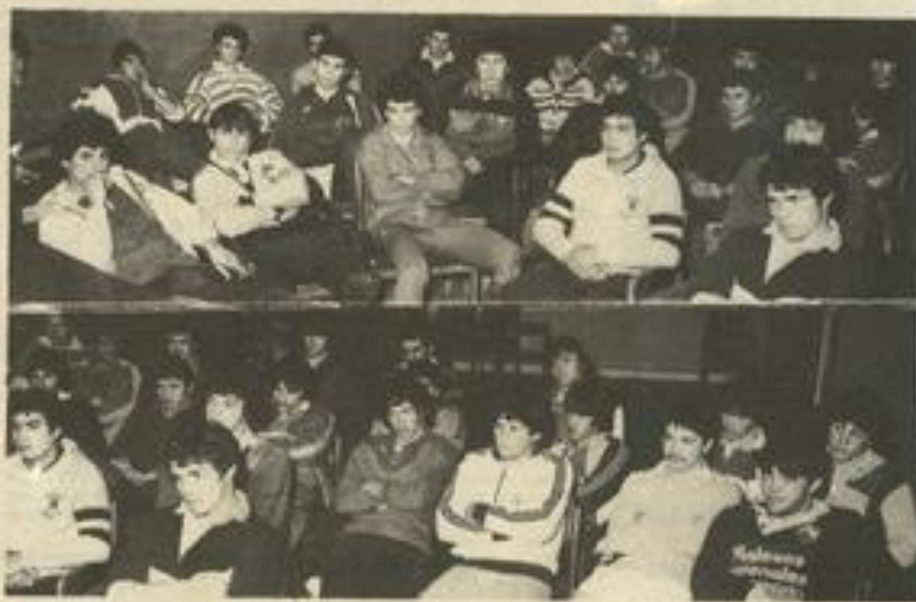
• Les jeunes sélectionnés attentifs.