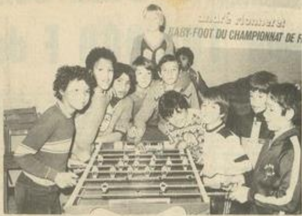
• Une partie des joueurs