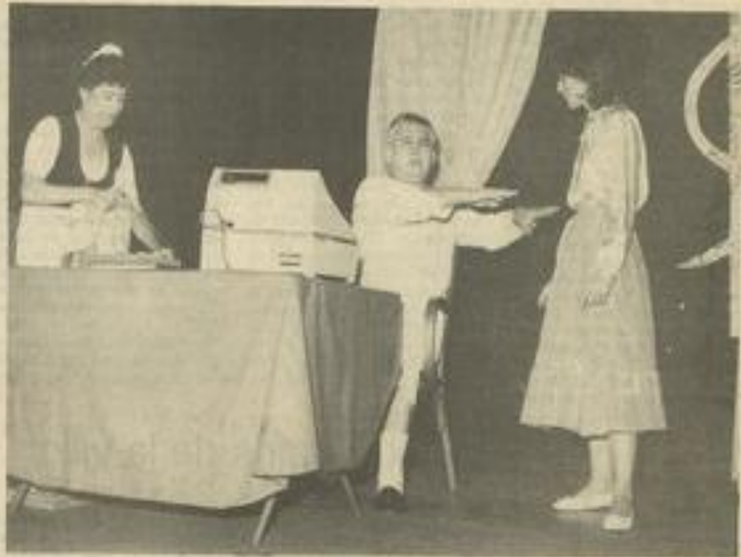
• Une machine ultra-moderne, pour faire le compte des médicaments du "malade"