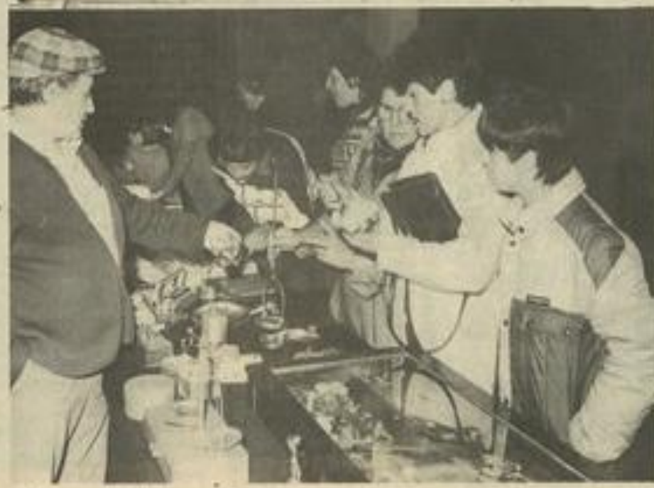
• Les merveilles du temps passé.