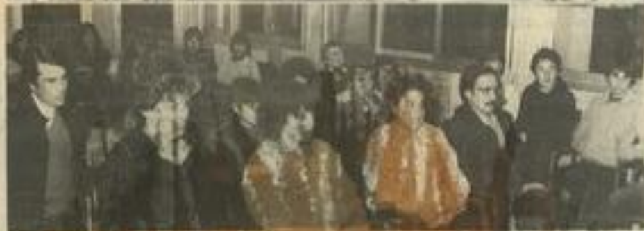
• La réunion de la J.S.L.