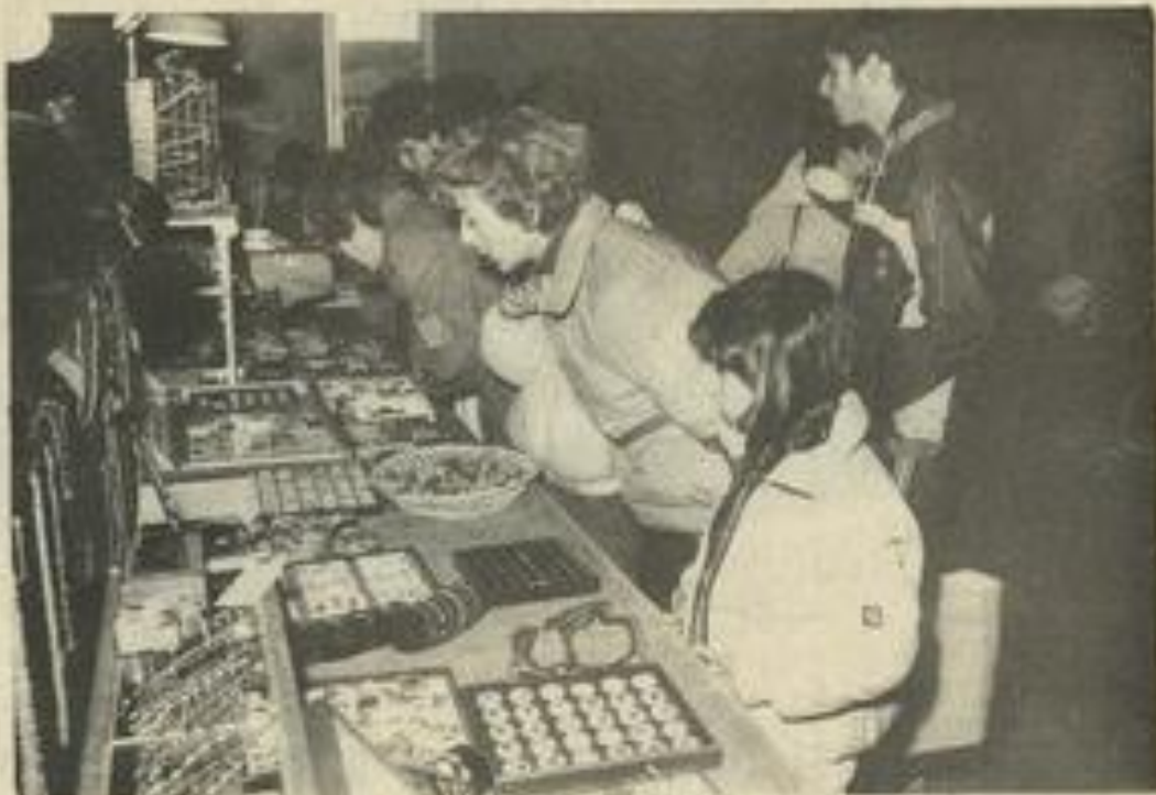
• Beaucoup de visiteurs pour cette originale exposition.