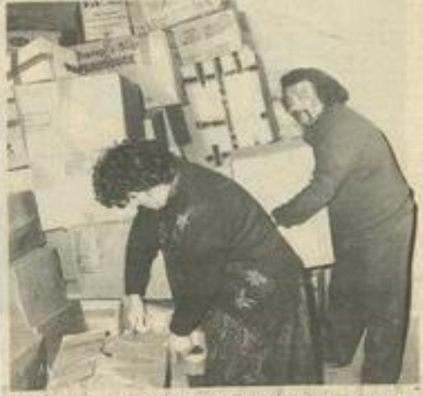
● Les représentants du comité lézignais de Solidarité internationale commencent le chargement.