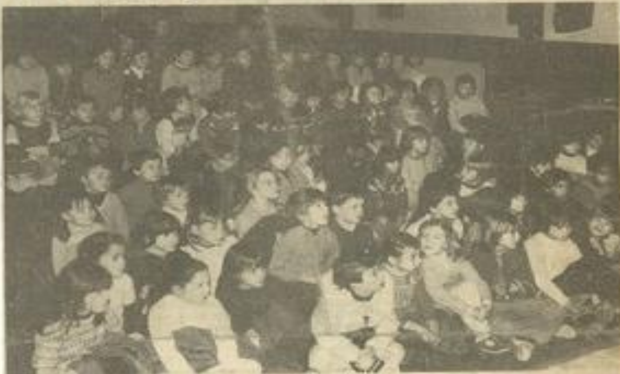
• Au pays du rêve.

LUNDI matin, à la M.J.C., la troupe "avant-quart" présentait aux enfants de l'école "Marie Curie" un très agréable spectacle, "Florette et le vent". Ce spectacle, mi marionnettes, mi théâtre, est écrit par Jean-Paul Cathala, dessiné par Marc Peyret. La musique est signée par Suzan Ferré. Le spectacle, très poétique, plein de couleurs et de mouvements, a enthousiasmé les enfants. Le groupe "Avant quart" édite également des livres pour enfants et des recueils de poésie.