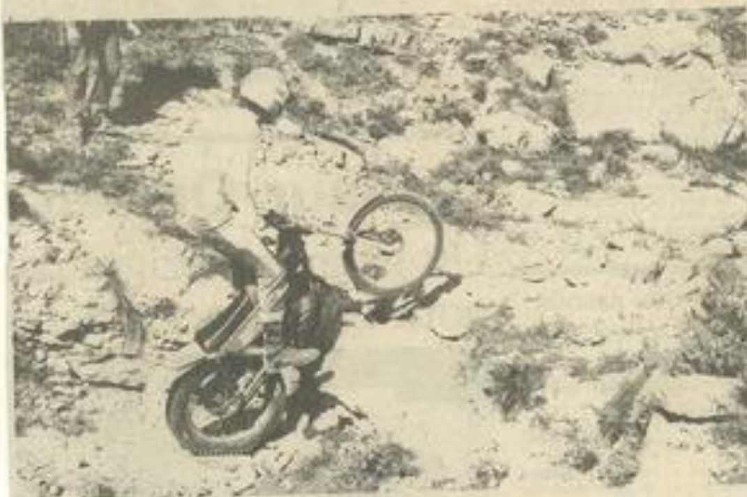
• Les motards seront à l'honneur dimanche.