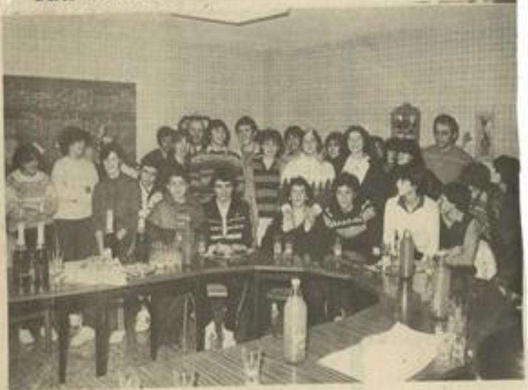
● Au basket-club.