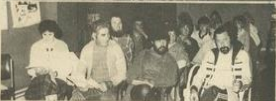
• Deux vues de l'assemblée générale.