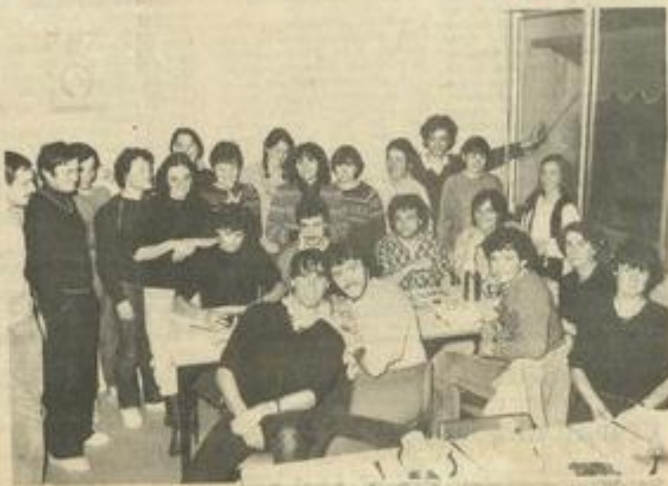
Les sympathiques stagiaires.

Les jeunes Toulousains vont tous les jours sur le terrain, par groupes de trois, dans les secteurs de Serre d'Opus, d'Argens-Roubia, de Fontcouverte, de Serre de Boussigne qui s'étend entre Lagrasse et Villavieille-la-Croisade, de Moreilaur et de Prudelles-en-Viel. Ils font les relevés qui leur permettent de dresser la carte géologique du secteur choisi et c'est cette carte qui servira pour leur œuvre de maîtrise.