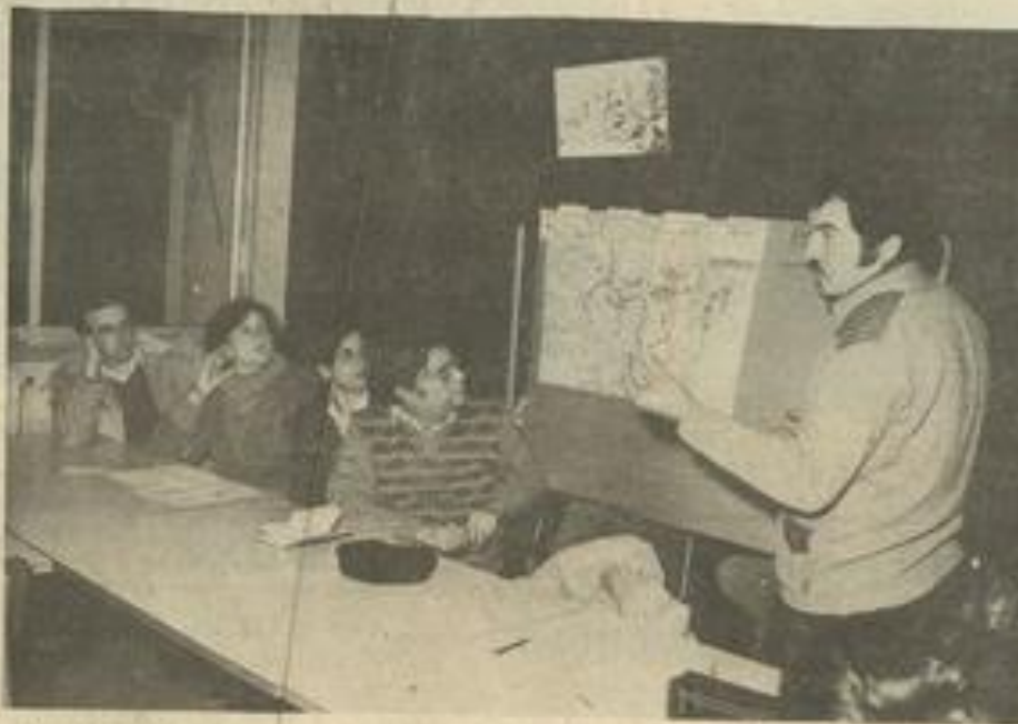
• Vers des actions communes