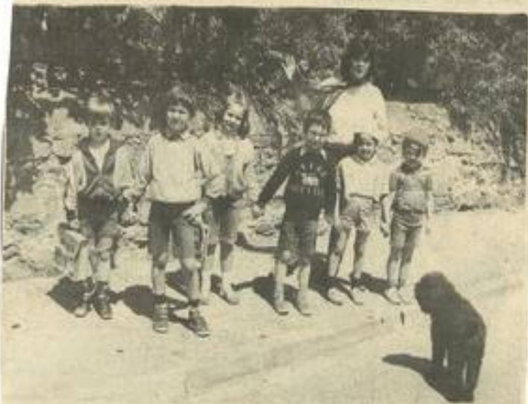
• En route vers la pinède.