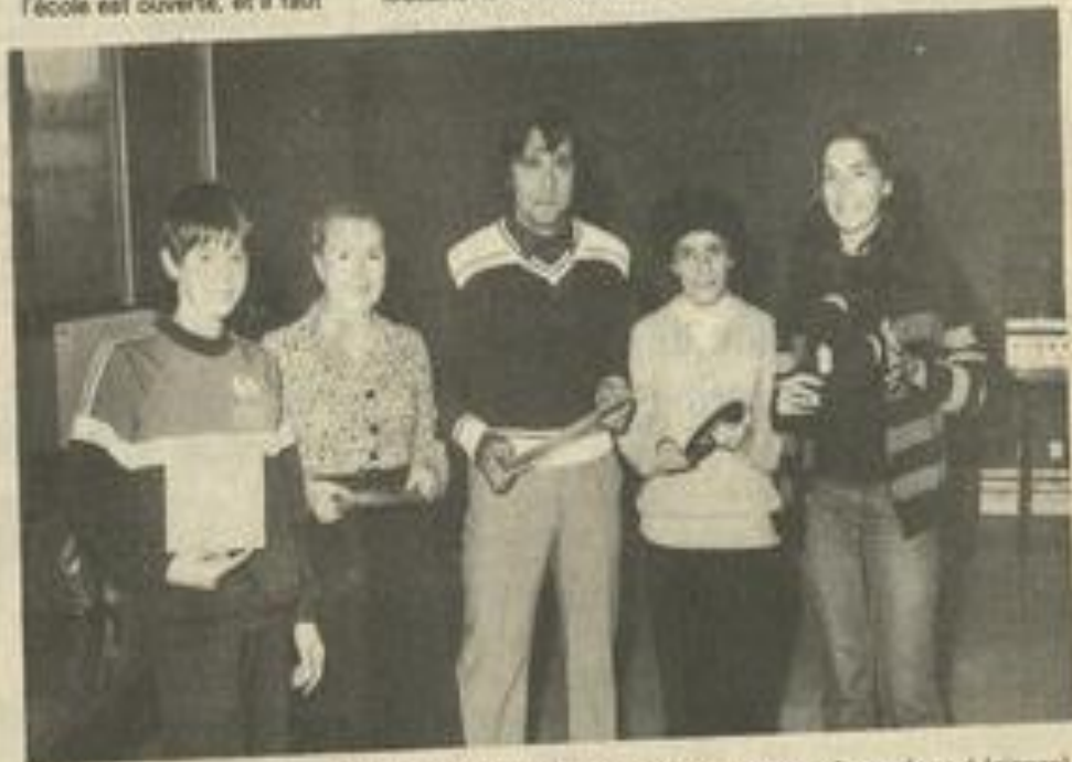
• Les premiers amateurs réunis autour de leur professeur.