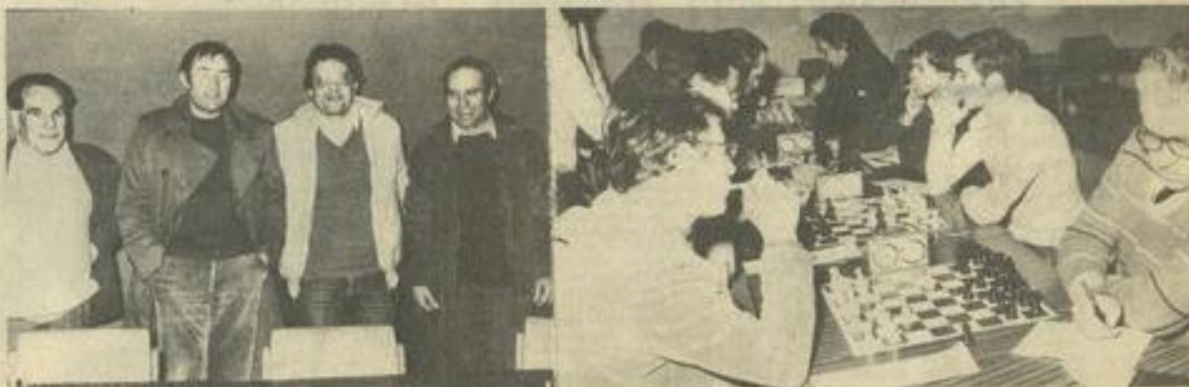
• Les vainqueurs carcassonnais, le temps de la réflexion.