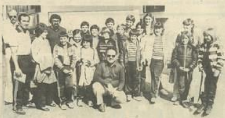
• Un départ dans la bonne humeur.

matin pour le départ du voyage à destination de Brême en Allemagne. Ils étaient pas moins d'une