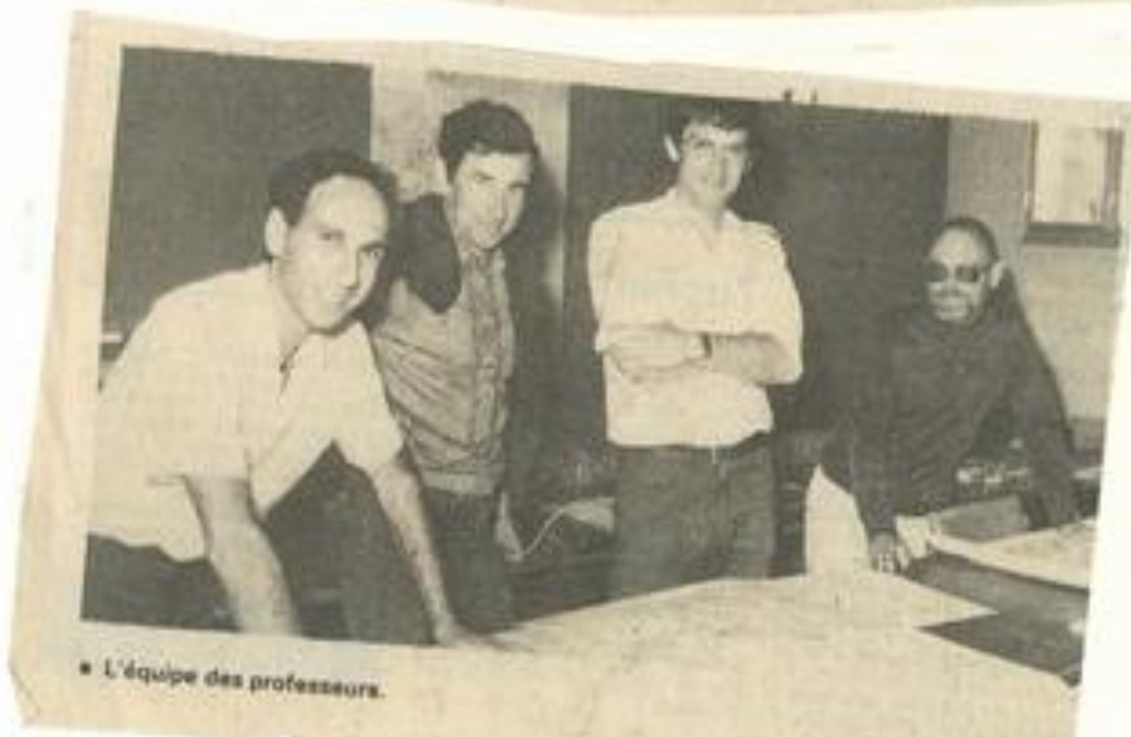
• L'équipe des professeurs.

Après les cours théoriques qui ont eu lieu à Rueil-Malmaison, les professeurs ont effectué une présentation régionale en salle à la M.J.C.