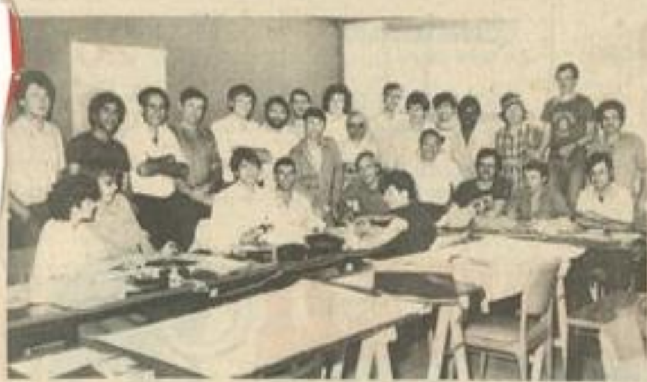
• Stagiaires et professeurs dans une salle à la M.J.C.

UN groupe de géophysiciens est actuellement à la M.J.C. de notre ville. Il y effectue un stage de formation, sous la houlette de l'École nationale supérieure du pétrole et des moteurs, de Rueil-Malmaison.