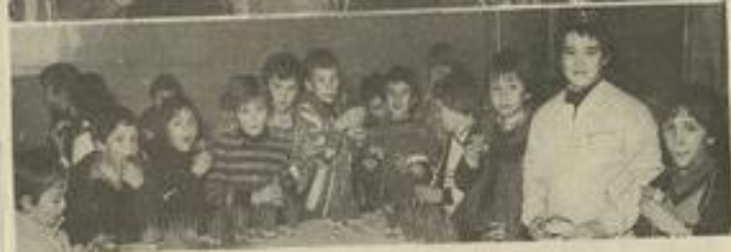
● Les jeunes tennismen.

LES dirigeants du Tennis-club ont offert, samedi, un goûter de Rois à leurs jeunes adhérents, membres du club ou de l'école de tennis. Ceux-ci avaient posé la raquette pour déguster les gâteaux et l'orangeade.