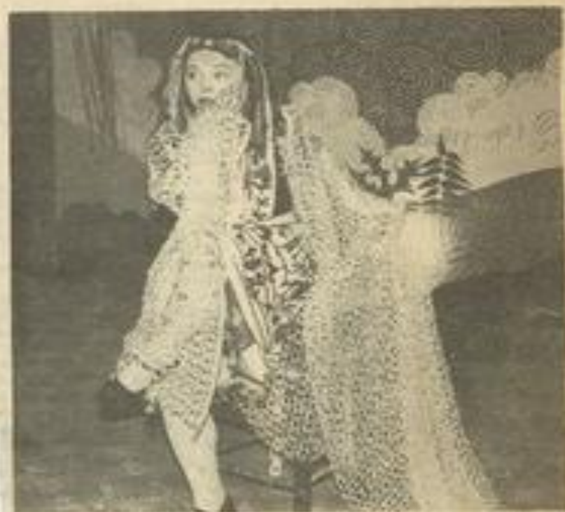
• Théâtre et marionnettes mêlés.