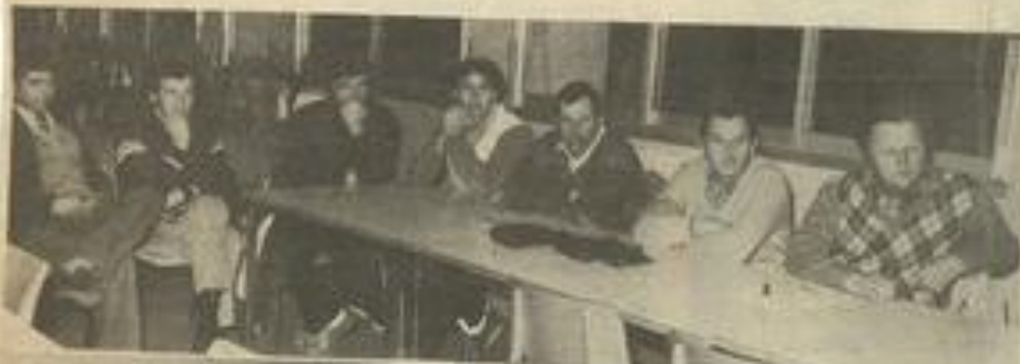
• Les délégués des M.J.C. du secteur