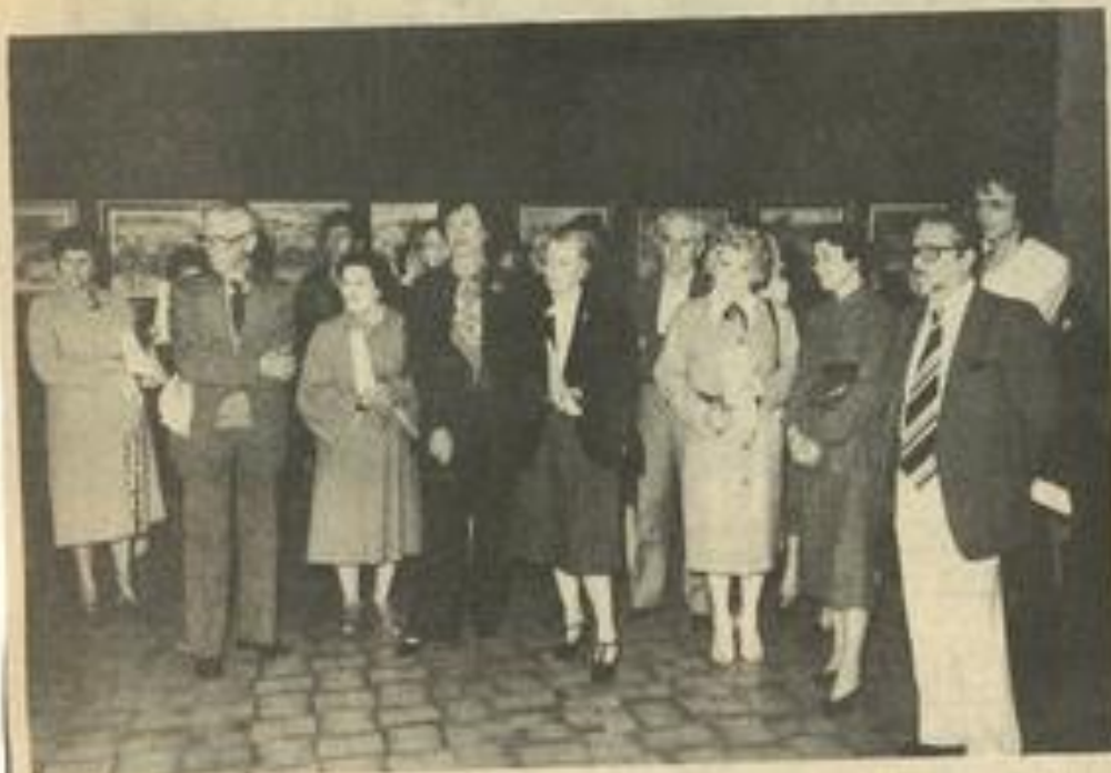
• Des artistes et des visiteurs.