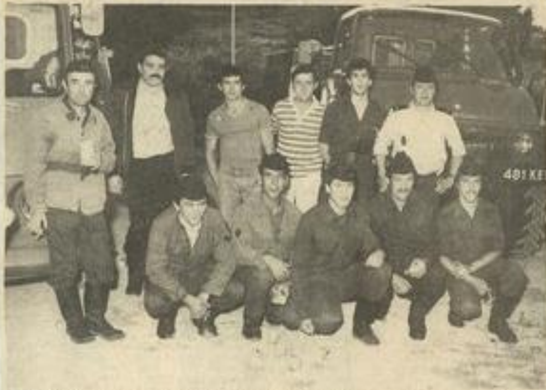
Le feu de la St-Jean attira également les pompiers : raison récréative... ou professionnelle ?