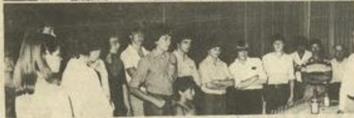
• En haut, les responsables du groupe allemand et les représentants de la municipalité. En bas, le groupe des jeunes Brêmois.

M ERCREDI, en fin d'après-midi, la municipalité accueillait pour la 16 e fois nos amis allemands de Brême.