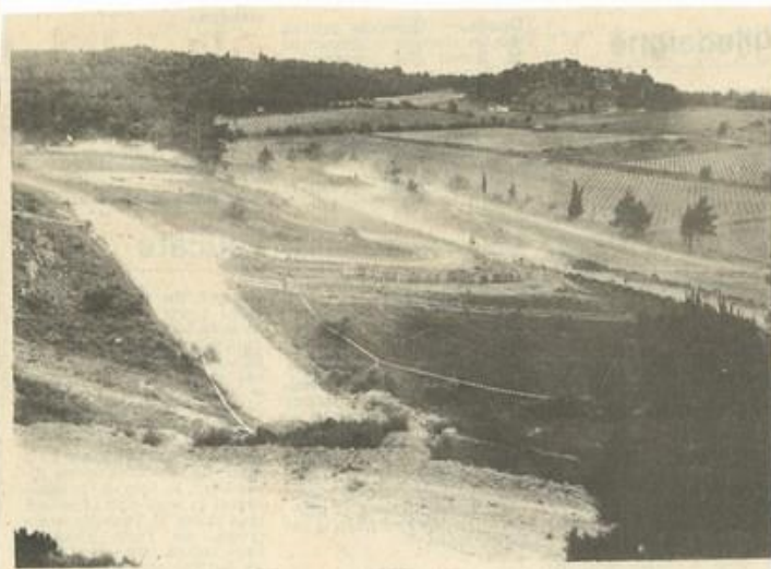
• Le circuit de moto-cross ; on imagine le spectacle.