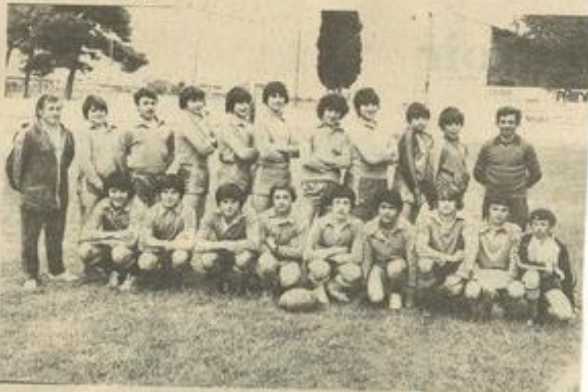
• Les minimes vainqueurs des Catalans.

Au cours de cette épreuve Catalans et Lézignonnais laissèrent à