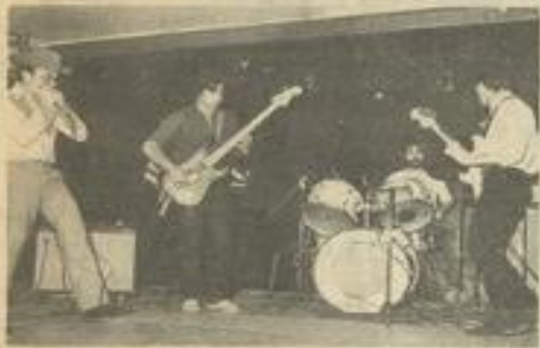
• Urban Blues à l'œuvre.