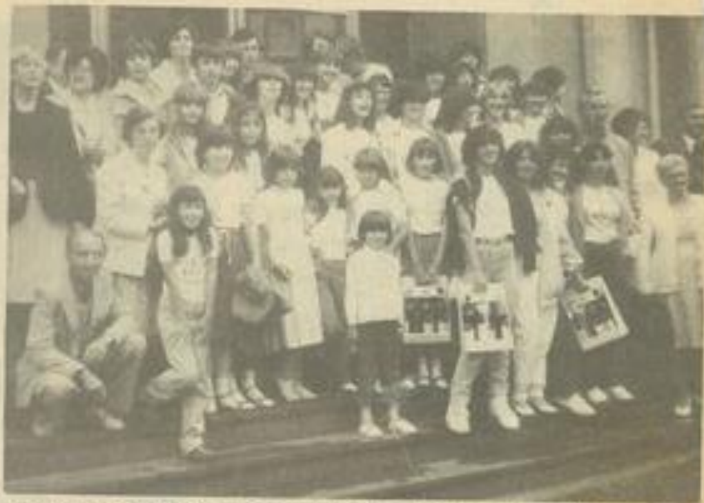
Le groupe des majorettes avec les responsables et accompagnateurs du voyage, devant la mairie de Lauterbach.