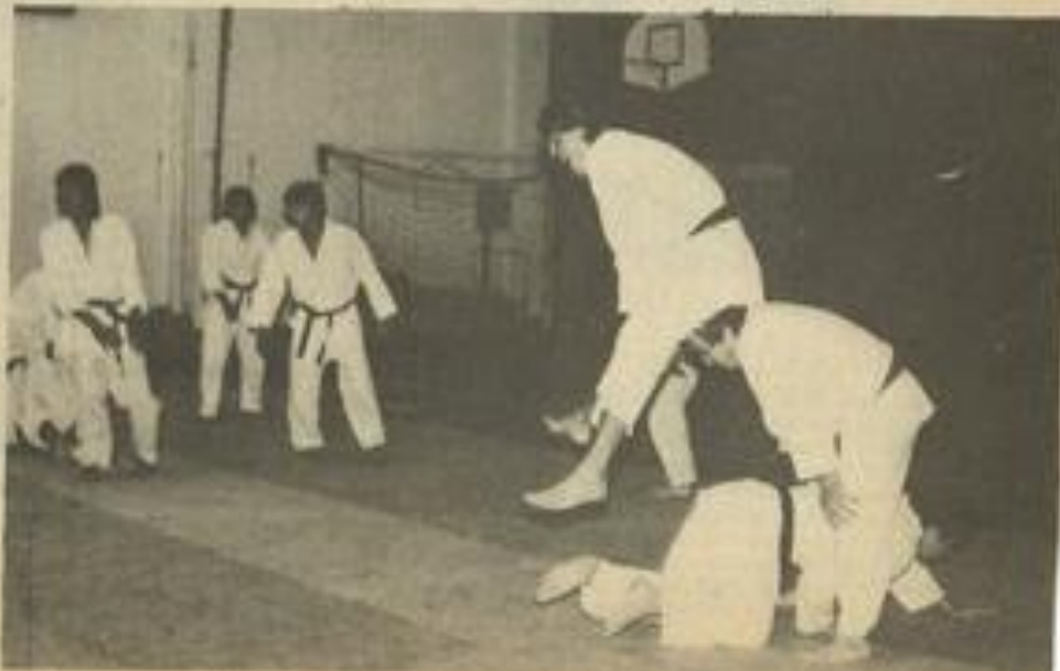
• Un entraînement intensif...