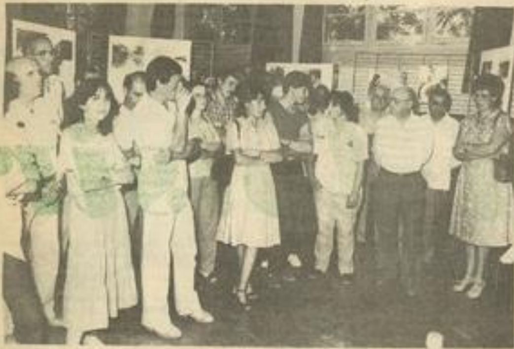
● Un nombreux public assistait à l'inauguration