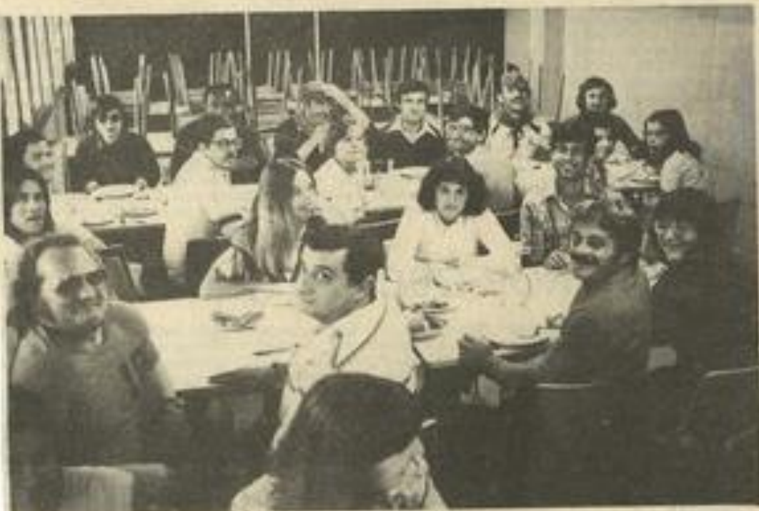
• Le groupe à l'heure du repas.