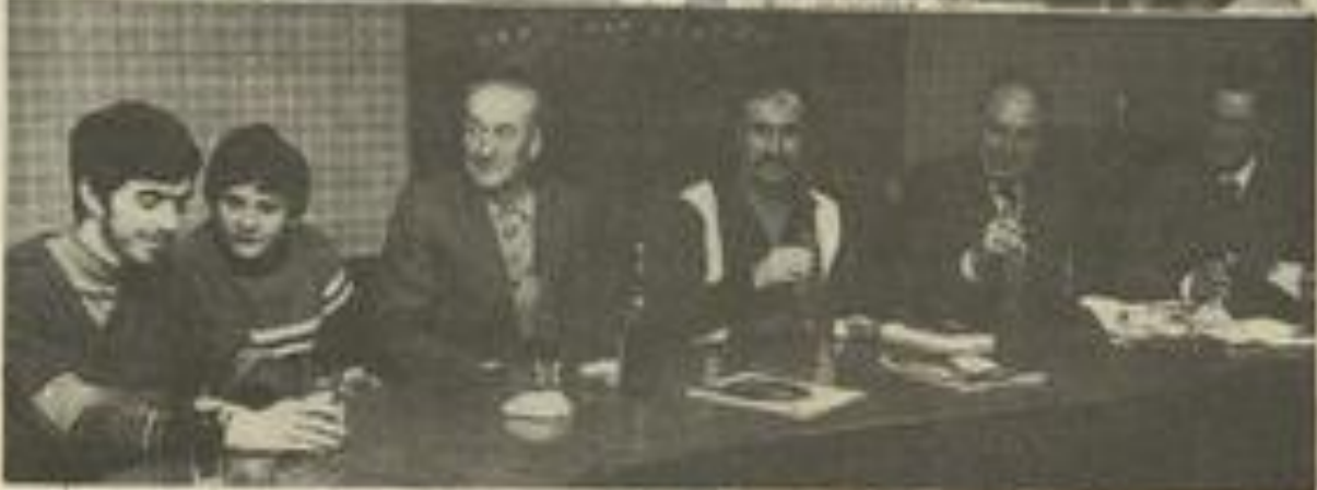
● A la section philatélique, on ne connaît pas l'ennui