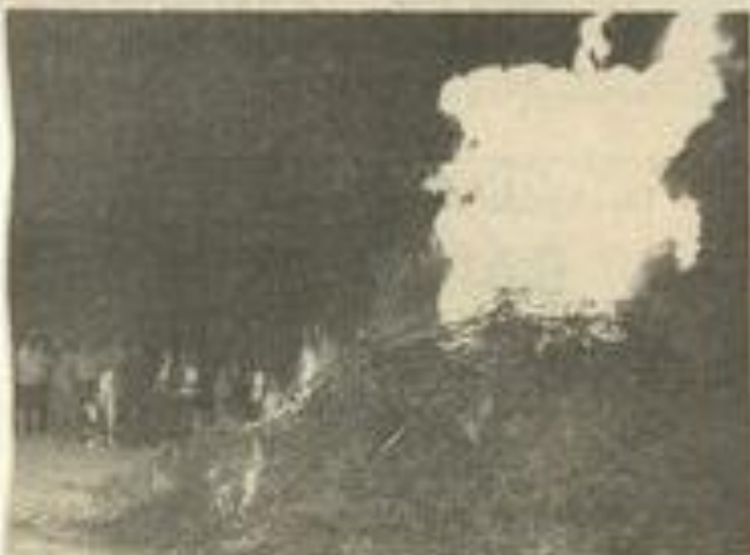
L'immense feu de la St-Jean était très admiré.

Il y avait eu beaucoup de monde, dès 20 h, pour manger les grillades préparées par tous ceux de la M.J.C. Et dès la fin du repas, l'ambiance musicale était donnée par le groupe "la patate chaude" composé de jeunes de Lézignan et des environs, groupe qu'on avait déjà pu entendre durant les rencontres musicales.