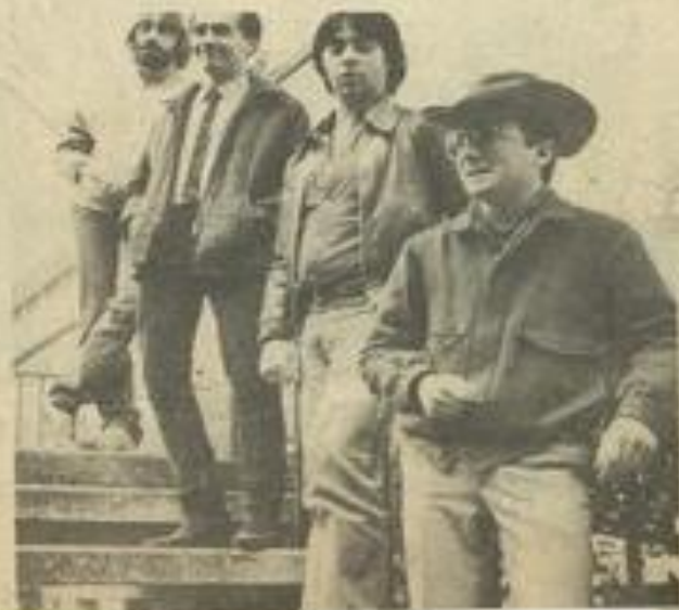
• Les musiciens "d'Urban blues"

Une fin d'après-midi à réserver donc, pour tous ceux qui aiment la musique rock.