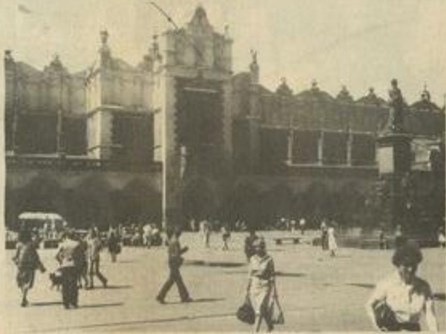
• Un instantané de vie quotidienne devant les halles de Cracovie.