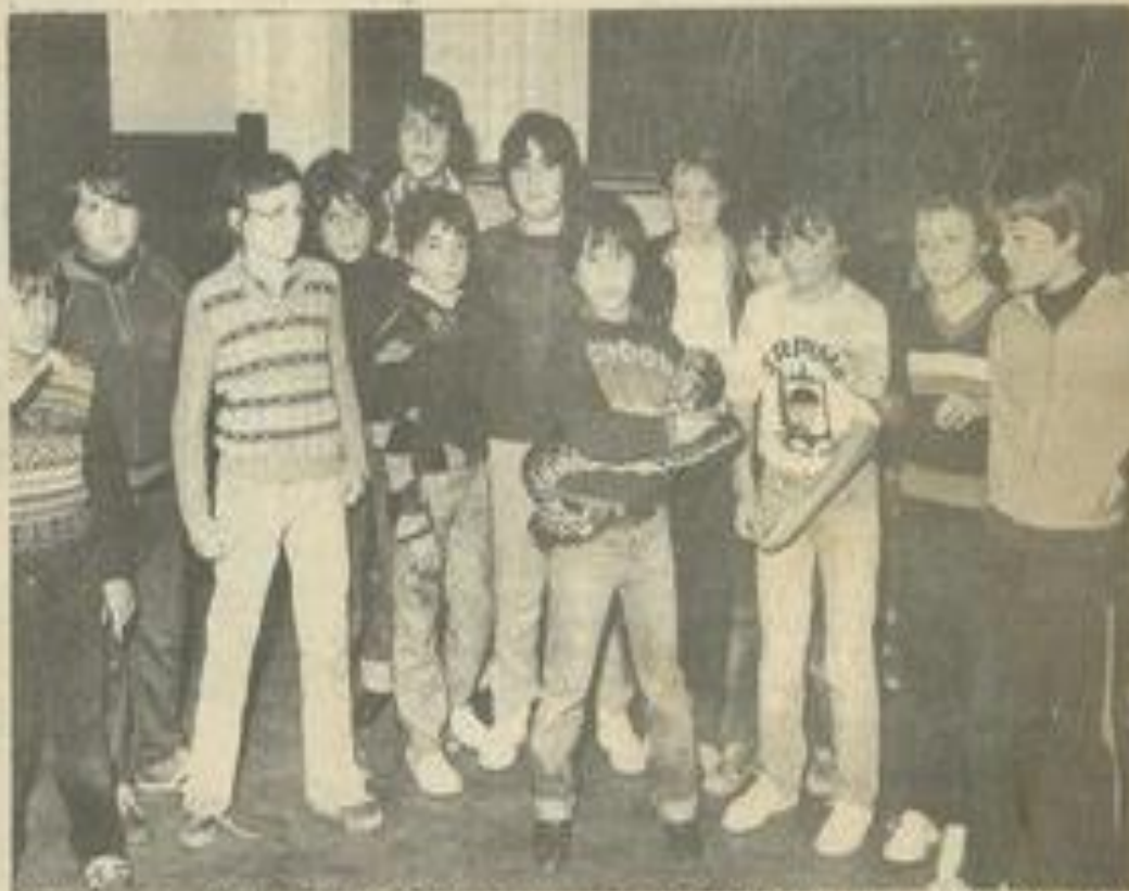
• Ce jeune garçon épate les visiteurs avec son ami le Python, aussi doux qu'un chien quand il se sent en confiance.

La tradition populaire a toujours extrêmement exagéré le danger que représentent les animaux (la peur du loup, par exemple). L'important est de bien les connaître et de chercher à les comprendre, car l'intelligence a toujours été plus forte que les réactions farouches et irraisonnées, celles des animaux comme celles des hommes.