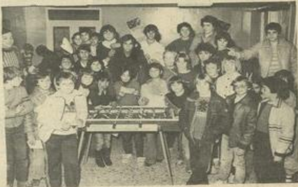
• Et une manche, pour le championnat de France de baby-foot

CE mercredi avaient lieu dans notre ville, à la M.J.C., les éliminatoires comptant pour le 2 e championnat de France de baby-foot.