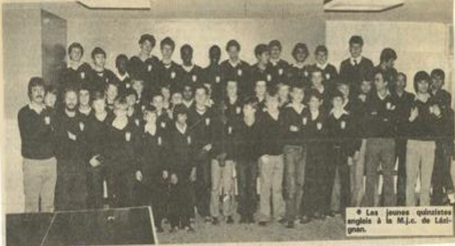
• Les jeunes quinzistes anglais à la M.j.c. de Lézignan.

Le Centre international de séjour a reçu, ces jours-ci, un groupe de jeunes Anglais, venus de Luton (dans le Bedfordshire), qui pratiquent dans leur « school » le rugby à XV. Ils sont donc pour quelques temps dans la capitale du jeu à XIII et, apparemment, ne s'en portent pas plus mal... Il est vrai qu'outre-Manche, les