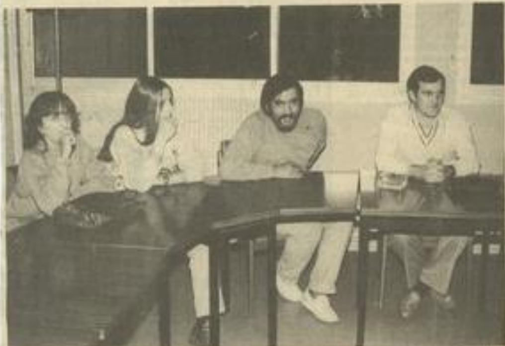
• De nombreux projets au Photo-club.