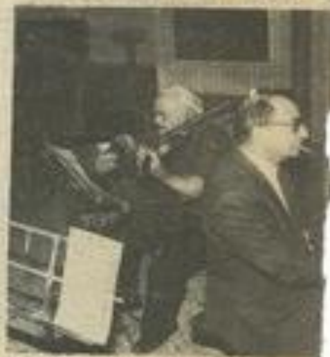
• Pour l'amour de la musique (Photo...)

qui discrètement et dans une ambiance tout à fait à