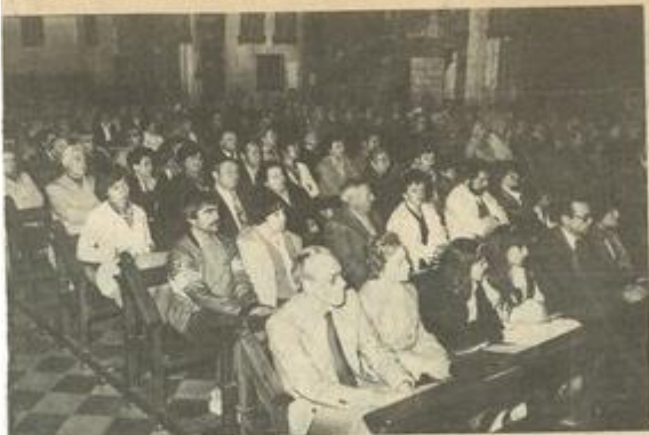
• Un public mélomane assez nombreux