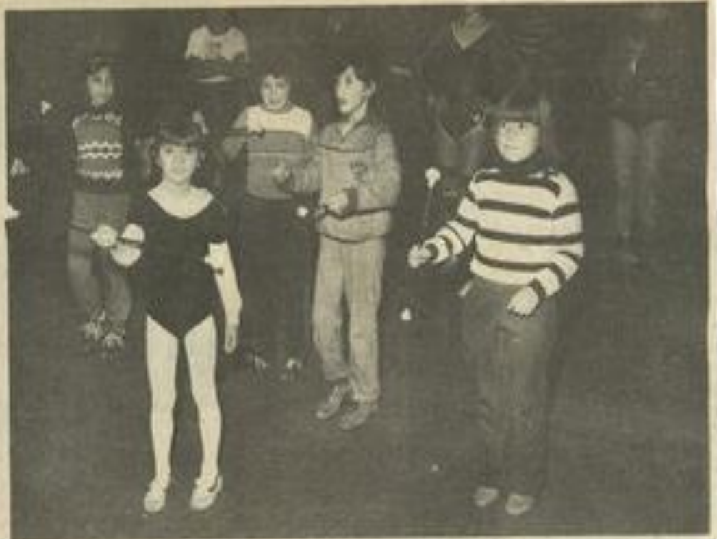
• Les plus petites.