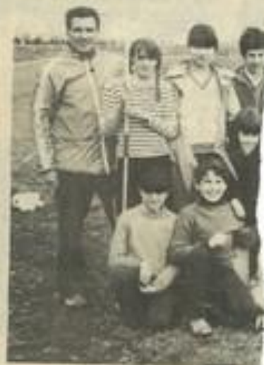
• La J.S.L. à l'entraînement.

Ils sont revenus cette semaine avec des souvenirs pleins la tête et il faut attendre quelques jours avant de réaliser pleinement ce voyage. Une fête de la bière est prévue peu avant la rentrée où nous reparlerons du voyage de la J.S.L. à Lauterbach.