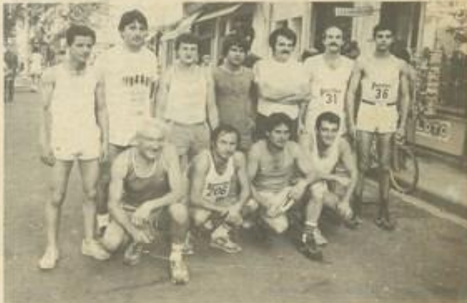
• Parmi les marathoniens lézignanais, accroupis, nos deux qualifiés au national.