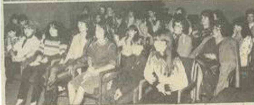
• En haut, les responsables : en bas, l'assistance.