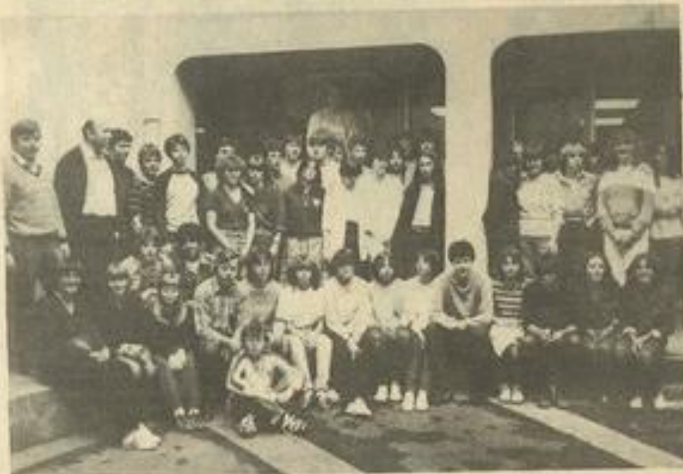
• Les jeunes allemands autour de leur directeur.