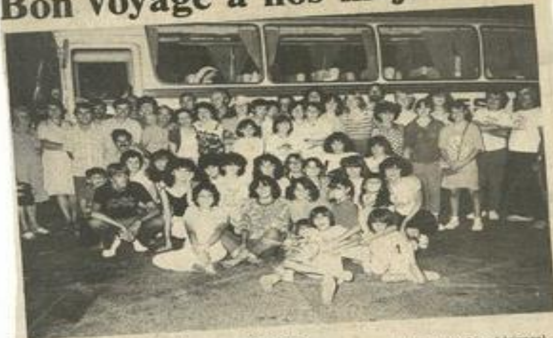
• Nos sympathiques majorettes avant le départ.