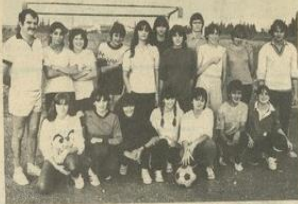
• Les footballeuses s'entraînent.

Le club ne fera pas de compétition cette année. Il se contentera de s'entraîner sérieusement et d'avoir des rencontres amicales avec les équipes de la proche région, comme Port-La Nouvelle, Maureillas ou Canet (P.O.), entre autres. L'effectif se compose d'une vingtaine de filles, de Lézignan, Argens, Montredon ou ailleurs. Autant dire que le football féminin démarre bien.