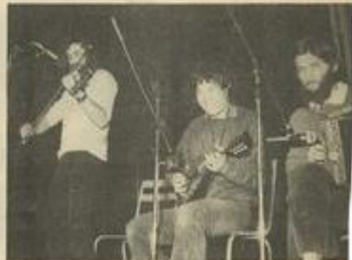
Le groupe Rosamunda mettait l'ambiance

Une excellente soirée pour tous et un grand bravo à la commission loisir de la M.J.C.