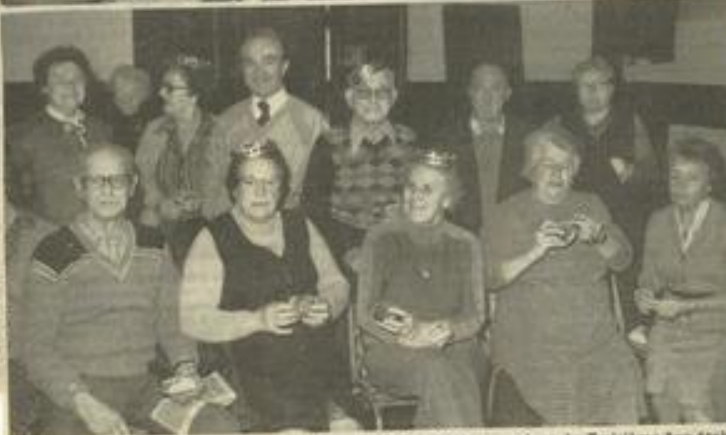
Si la tradition des Rois est bien respectée, c'est bien chez nos anciens. Le Troisième âge était en fête avant-hier après-midi à la Maison des Jeunes dans une ambiance qui n'engendrait pas la mélancolie.