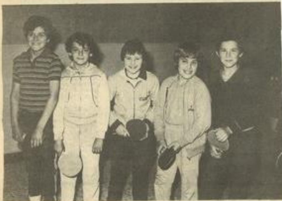
• L'équipe de ping-pong d'Ornaisons.