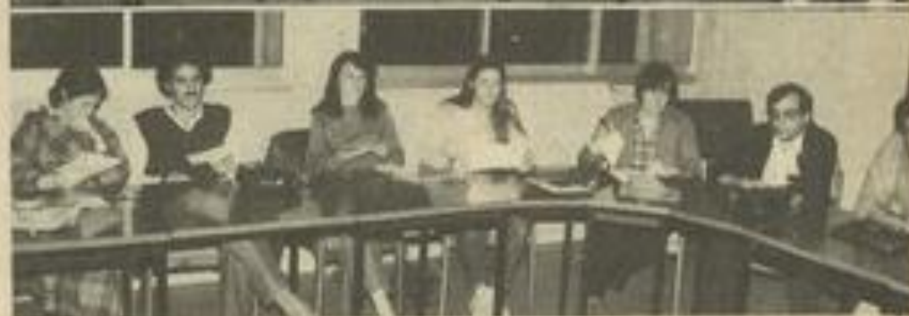
• Anciens et nouveaux à la réunion de reprise.

LES anciens mais aussi un bon nombre de nouveaux ont assisté, mercredi soir, à la reprise du Photo-club M.J.C. Après les présentations, on a abordé les activités de l'année à venir.