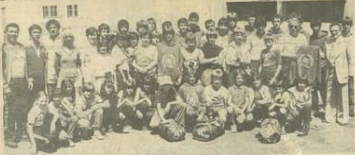
• Les membres de la J.S.L. au moment du départ.