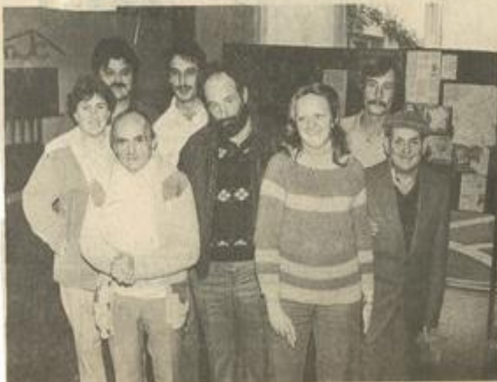
• Le groupe de vacanciers