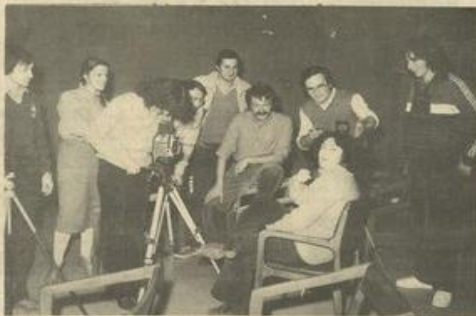
• Quand les apprentis photographes se tirent le portrait...