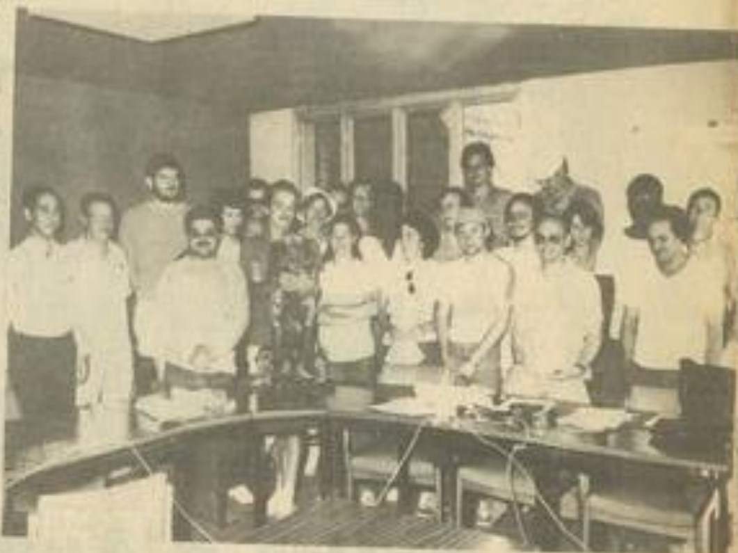
• Les stagiaires de l'école du pétrole.

Le groupe est hébergé jusqu'à fin juin dans les locaux du centre de séjour et on peut lui souhaiter d'utiliser à plein cette présence en Lézignais.