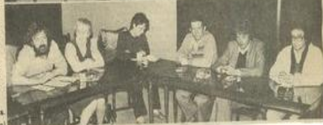
• Une vue des participants.