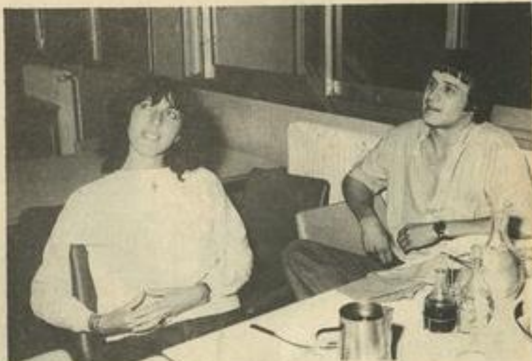
• Deux des responsables.