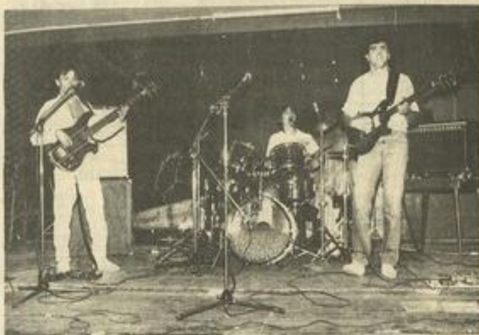
• Le groupe "Ad Libitum".

Premier concert, mais une grande expérience musicale