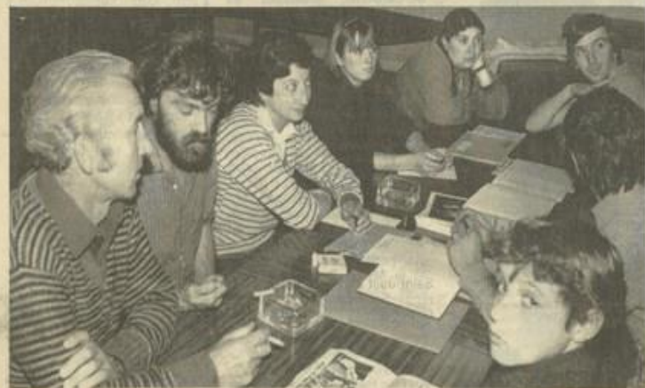
Beaucoup de projets donc, souhaitons que les résultats soient à l'image de l'activité déployée.

La discussion des projets pour l'année à venir a prolongé fort tard la réunion. Les zones traditionnelles dans les Corbières et l'Alaric continueront à être prospectées ; de nombreuses cavités déjà connues demandant à être revues. Les débutants ne seront pas oubliés, puisque des sorties découverte du milieu souterrain et entraînement technique en faïse ont déjà été programmées.