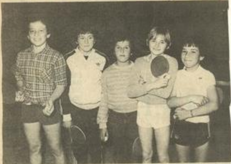
• Nos jeunes pongistes lézignais.