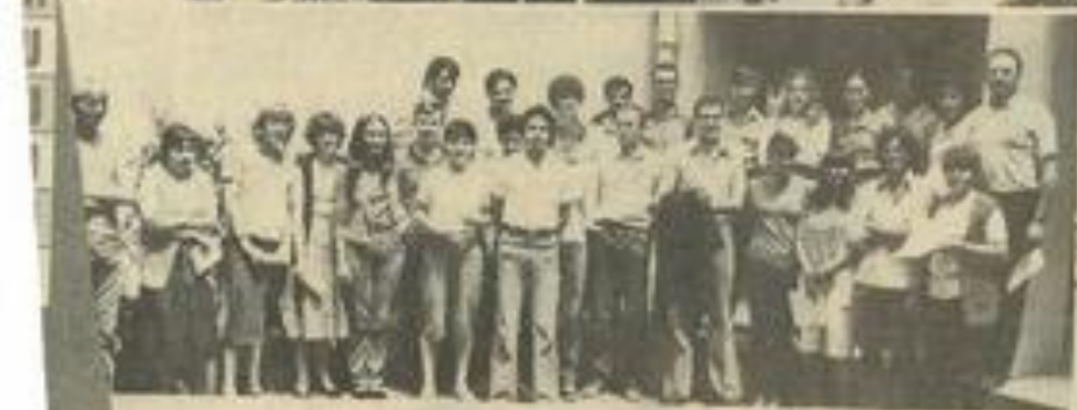
...ement de ce stage et, en bas, les stagiaires