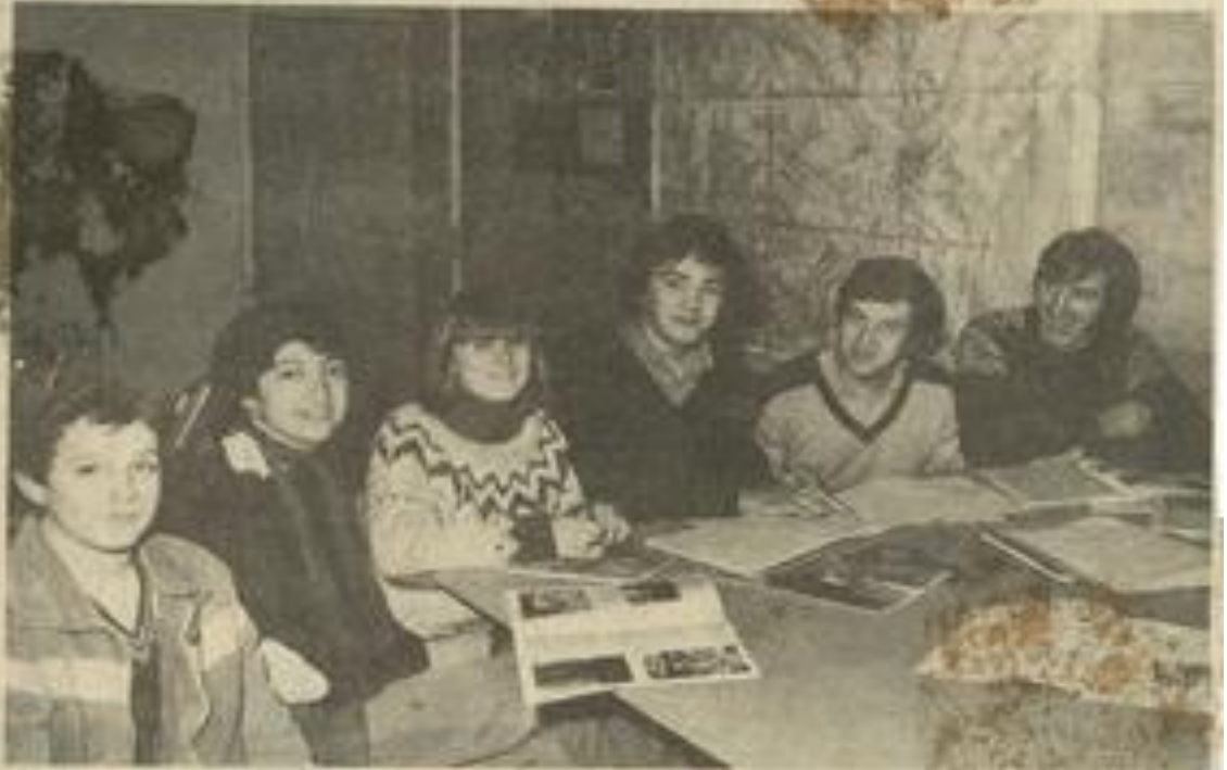
• Les spéléos ont préparé le programme de l'année.

Tout cela, bien entendu, avec un merveilleux esprit d'équipe.