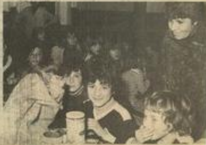
• De jeunes gagnants

Bonne humeur et gaieté étaient au rendez-vous du loto organisé ce mercredi par la MJC pour les enfants lézignanais. Ils ne furent pas moins de 80 à prendre part aux parties qui eurent au nombre de 18. De nombreux lots vinrent récompenser les gagnants, lots gracieusement offerts par les fournisseurs de la MJC. La faible participation escomptée pour cet après-midi servira à organiser un mercredi ou un dimanche à la neige pour tous. Voilà qui n'est pas pour déplaire aux enfants, grands amateurs de ski et glissades !