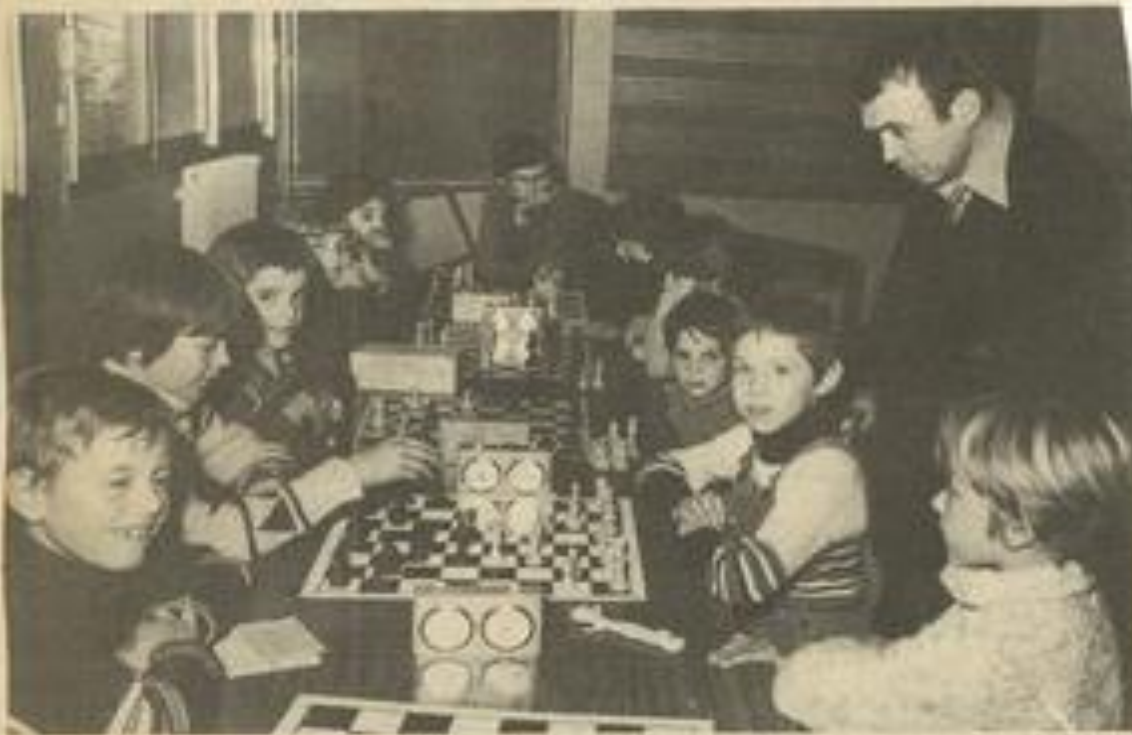
• Les petits échéphiles étaient venus nombreux.