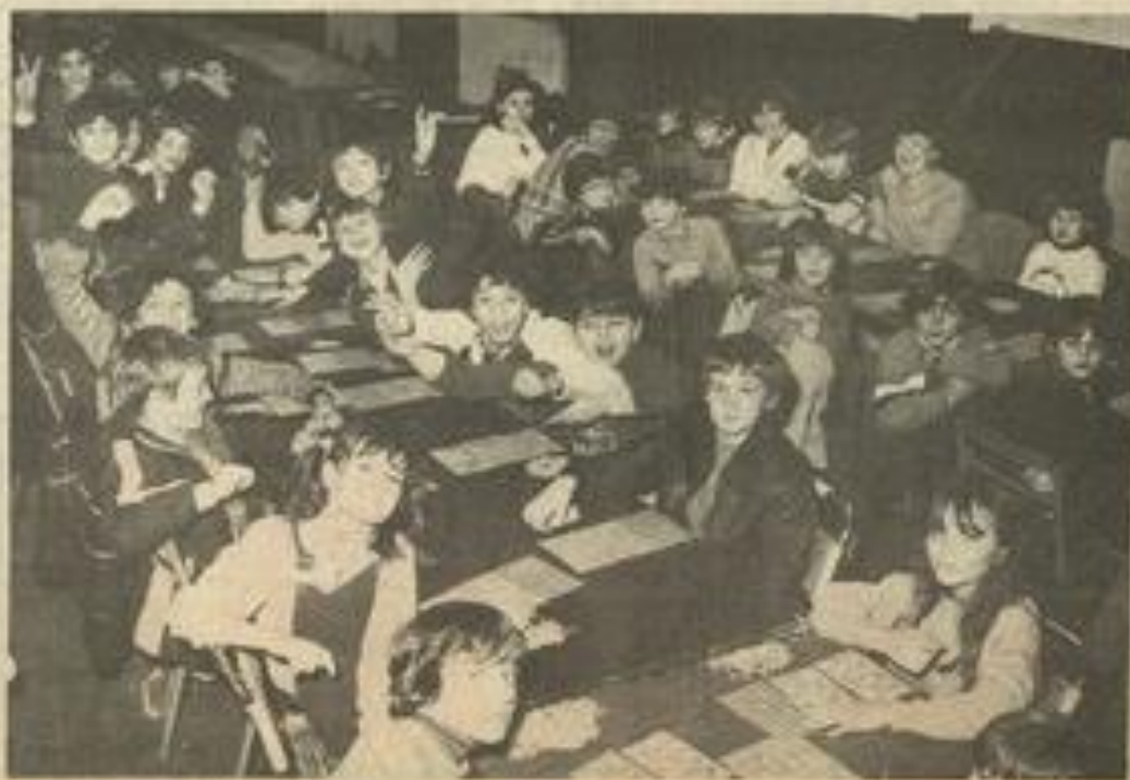
• Qu'il est agréable de faire comme les grands

Bonne humeur et gaieté étaient au rendez-vous du loto organisé ce mercredi par la MJC pour les enfants lézignanais. Ils ne furent pas moins de 80 à prendre part aux parties qui eurent au nombre de 18. De nombreux lots vinrent récompenser les gagnants, lots gracieusement offerts par les fournisseurs de la MJC. La faible participation escomptée pour cet après-midi servira à organiser un mercredi ou un dimanche à la neige pour tous. Voilà qui n'est pas pour déplaire aux enfants, grands amateurs de ski et glissades !