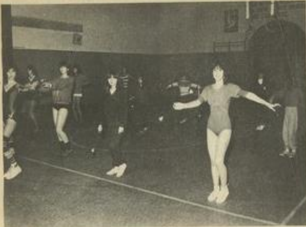
• L'entraînement repart.