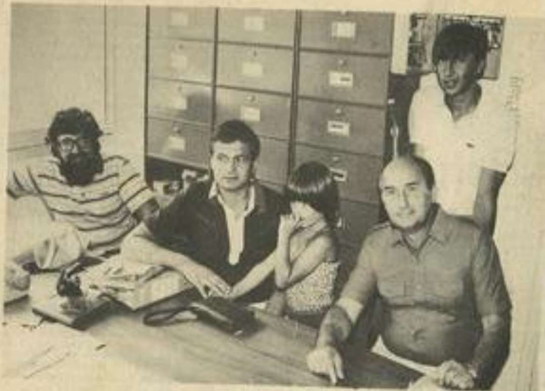
• Le groupe de nageurs de Lauterbach devant la M.J.C. où ils résideront durant leur séjour.