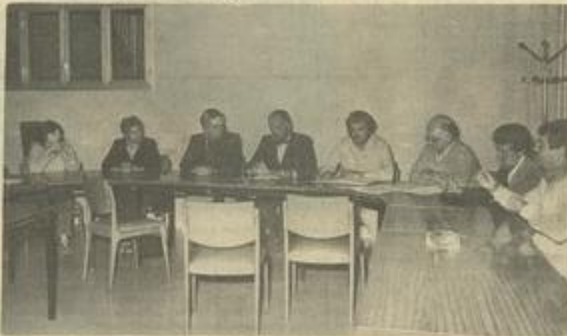
• Les membres de la commission jumelage M.J.C.

Dans le cadre des jumelages et des échanges, une délégation de représentants des différentes régions d'Italie sera reçue à Léznani le jeudi 29 octobre. Il s'agit de responsables de maisons des jeunes italiennes.