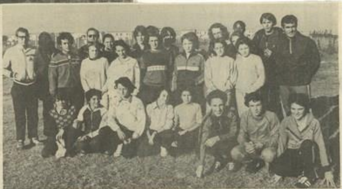
• Les stagiaires au grand complet.