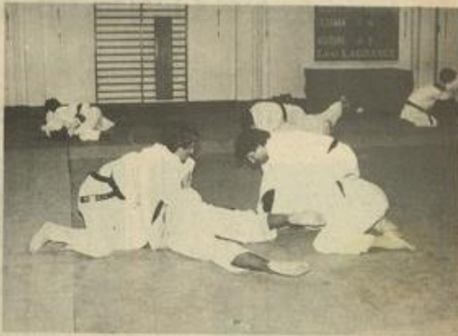
• Le randori ou travail au sol est l'une des bases essentielles du judo.

Il ne reste plus aux stagiaires qu'à devenir de véritables champions.