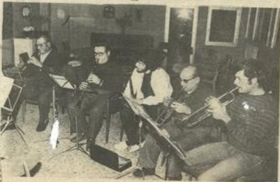
• Les musiciens n'étaient pas tous là.

L' ORCHESTRE de la Maison des jeunes s'est réuni jeudi pour sa première séance de reprise. Tous les membres du groupe n'étaient pas présents la reprise étant encore au stade de redémarrage. Mais ils ne tarderont pas à être là.