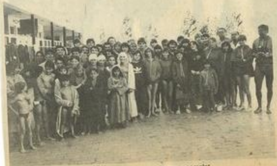
Les équipes de natation de Lauterbach et de Lézignan au complet.