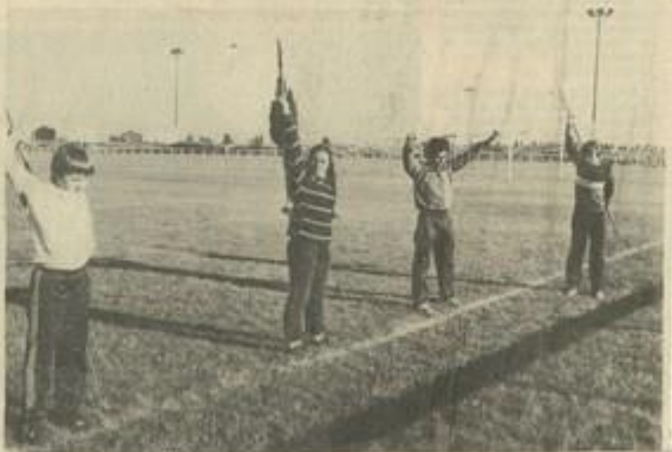
• On perfectionne la pratique du javelot

D'autres parts, des sorties sont projetées le 15 à Carcassonne, le 22 à la Grande Motte et le 29 à Thuir.