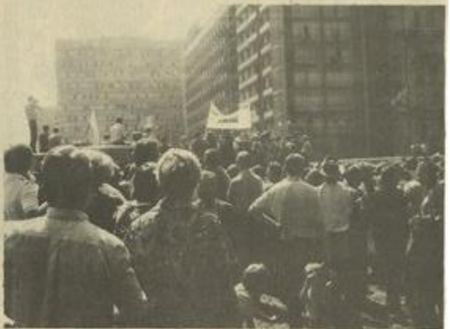
• Une manifestation pacifique à Varsovie.