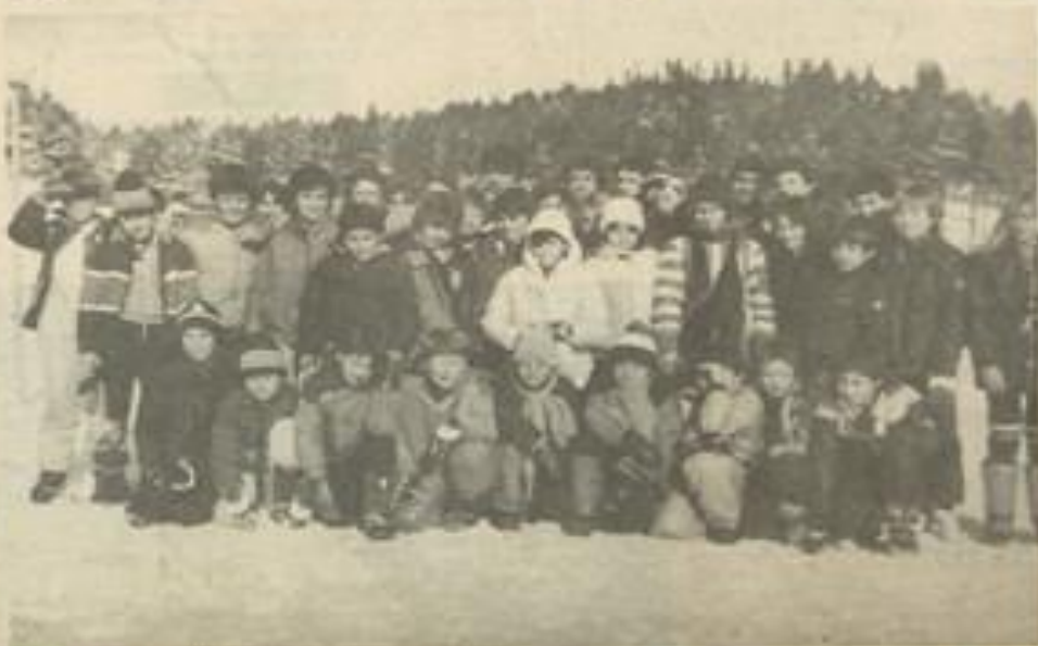
• Les nageurs à Font-Romeu

Du 19 au 24 décembre, ils ont suivi un entraînement sérieux de natation, à raison de plusieurs heures par jour, et en ont profité également pour pratiquer des sports de neige, comme le ski de fond, et aussi du patinage.