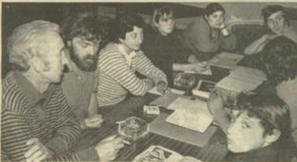
Beaucoup de projets donc, souhaitons que les résultats soient à l'image de l'activité

La discussion des projets pour l'année à venir a prolongé fort tard la réunion. Les zones traditionnelles dans les Corbières et l'Alaric continueront à être prospectées ; de nombreuses cavités déjà connues demandent à être revues. Les débutants ne seront pas oubliés, puisque des sorties découverte du milieu souterrain et entraînement technique en falaise ont déjà été programmées.