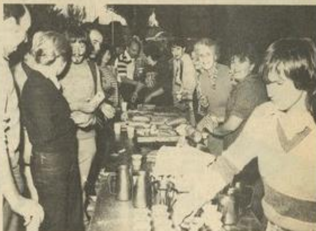
Beaucoup de monde autour du buffet