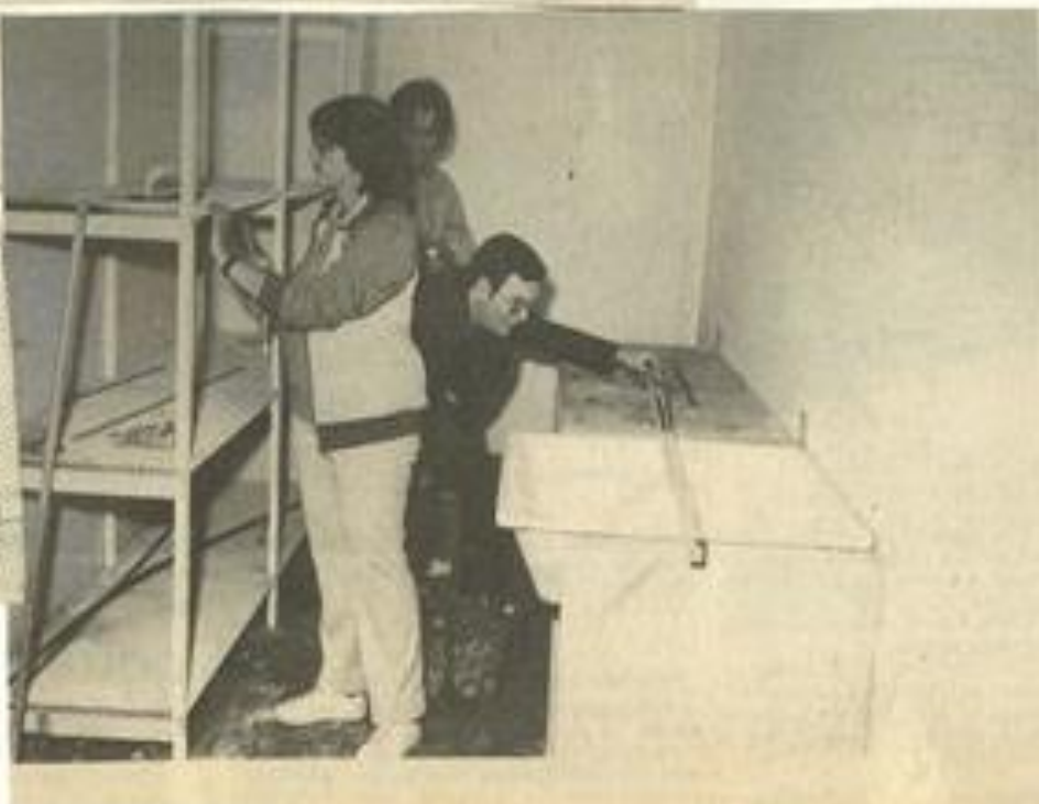
• Le nouveau laboratoire du Photo-Club M.J.C. en cours d'aménagement.

Signalons pour terminer la sortie qu'effectuera le club le dimanche 17 mai à Fontfroide : prise de vue à loisir dans l'abbaye le matin et repas familial dans la garrigue, dans un site agréable, une réunion à lieu es-mercredi à 21 h à la M.J.C., notamment pour préparer cette sortie.