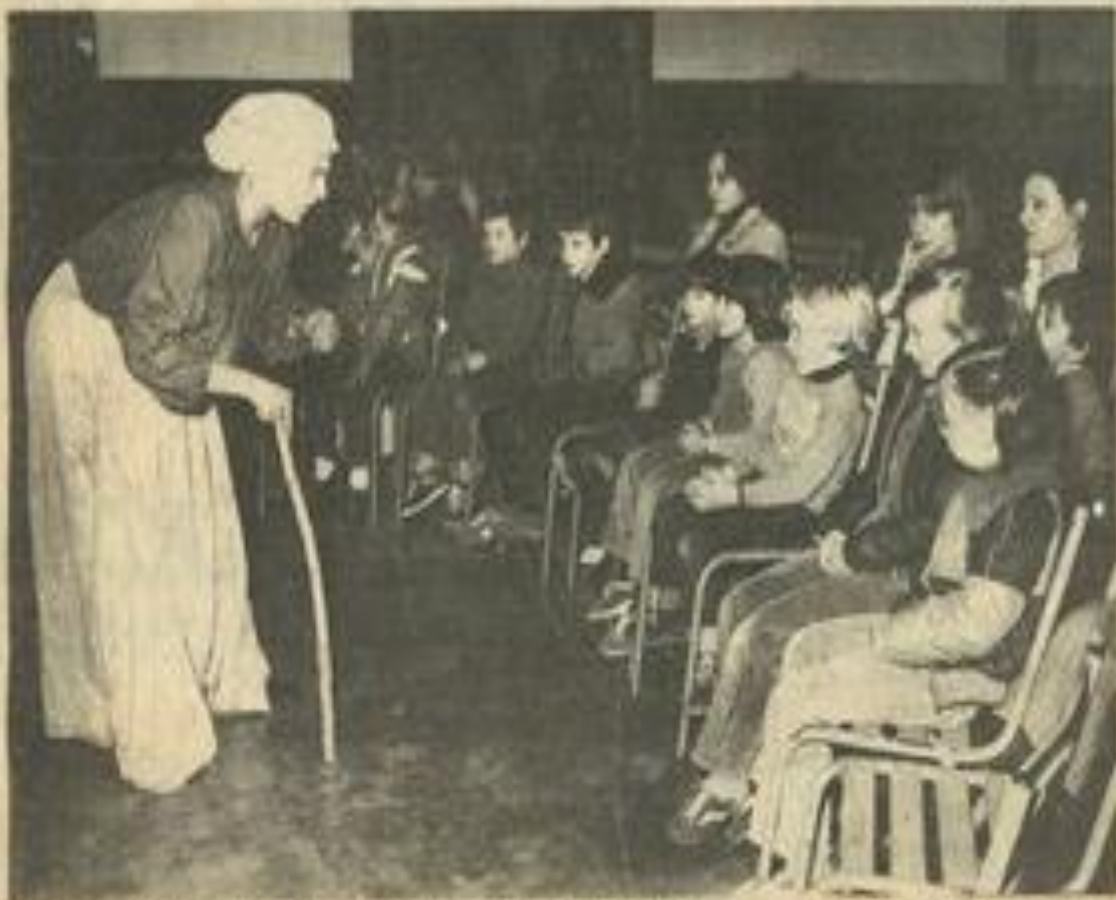
• Les petits Lézignanais sous le charme de la Balandine