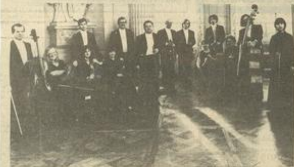
• Jean-François Paillard et les 13 musiciens de son ensemble seront accompagnés par le violoniste Gérard Jarry.

Les amateurs de rock vont être comblés avec la venue de ce groupe inconnu mais que nous vous avons déjà présenté. Leur musique simple et efficace plaira certainement aux léznignans. Rendez-vous donc à samedi 21 h à la M.J.C.