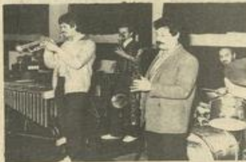
• Les musiciens...