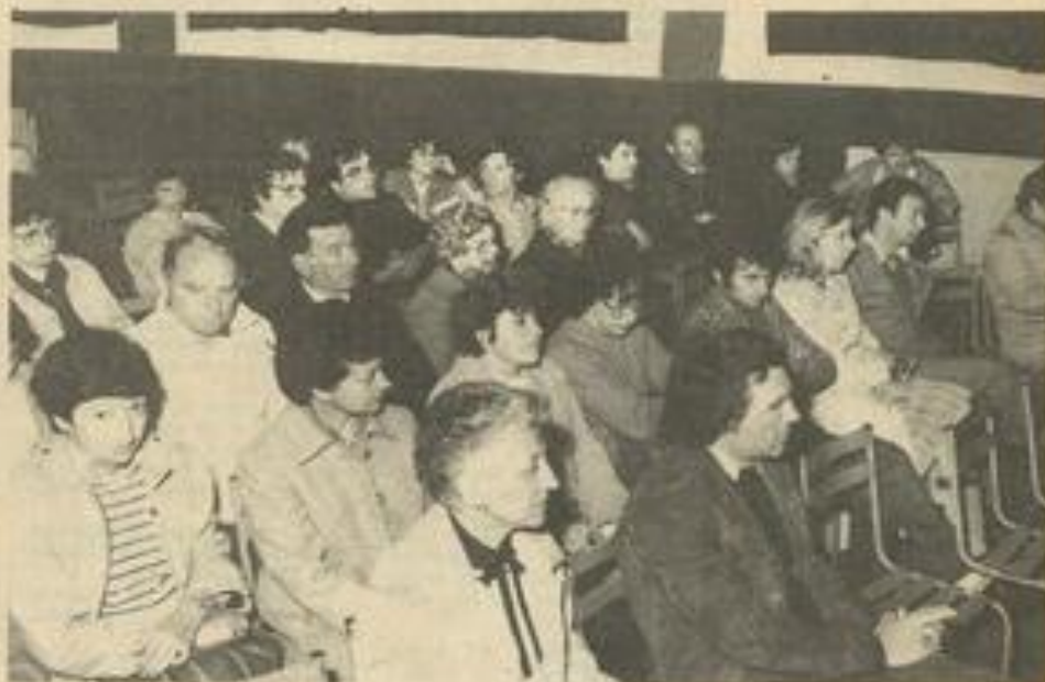
• Les adhérents de la M.J.C.