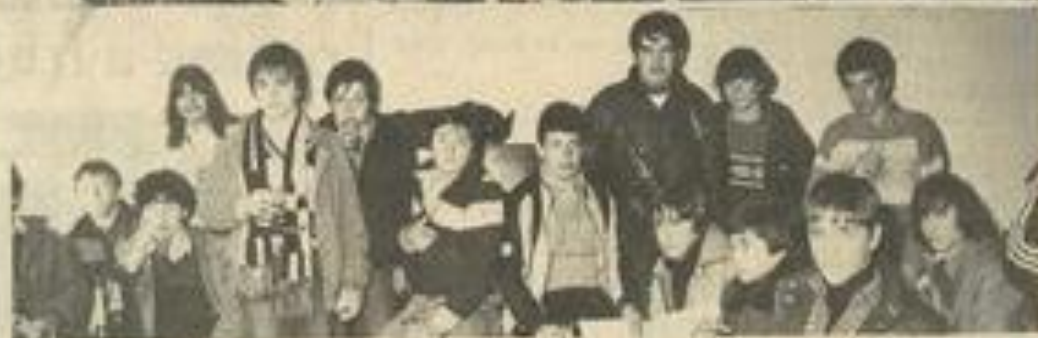
Les minimes et cadets de l'Aude et de l'Hérault ont fini le stage dans la joie.