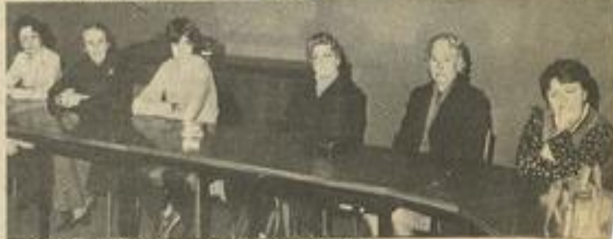
• Deux vues de cette réunion de la commission loisirs.