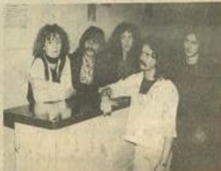
"Otway", qui passait en deuxième partie