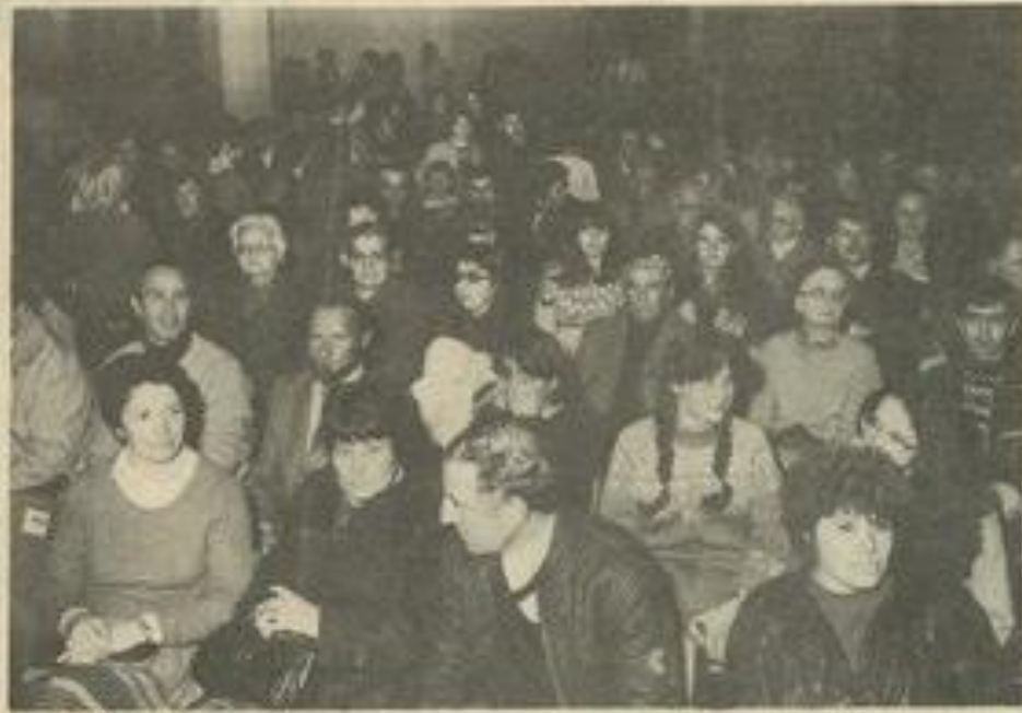
• Une salle comble.