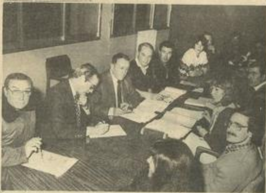
• Le comité de l'Aude d'athlétisme réuni à Lézignan.