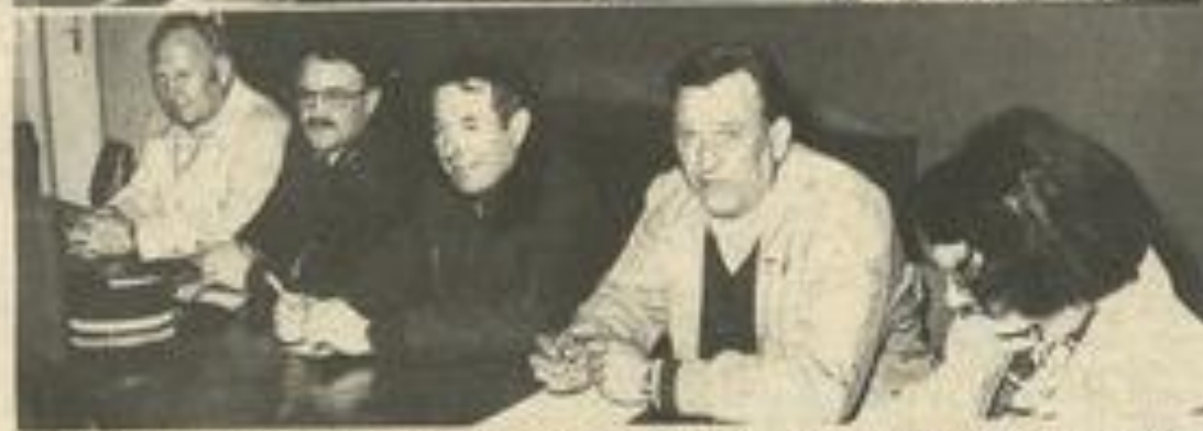
• En haut, les responsables de la manifestation, en bas, les représentants de la gendarmerie, la police, des pompiers, des services techniques de la mairie.