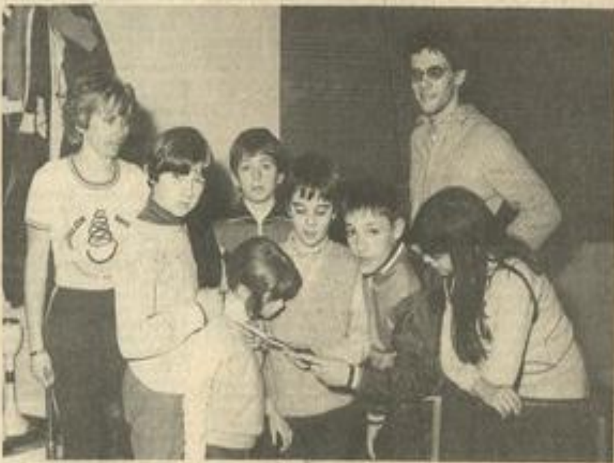
• A l'atelier théâtre : les jeunes s'initient à la diction...