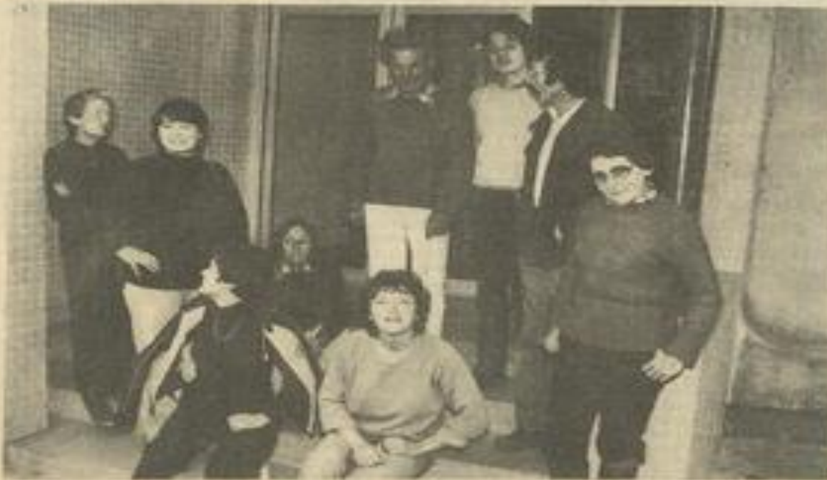
• Les randonneurs pédestres avant de partir.

Les randonnées programmées sont nombreuses : du 25 au 30 mai "Marcher avec Lanza del Vasto" (sur les traces du célèbre philosophe) de Lodève à Lodève ; du 1 er au 6 juin, sur la légende des trois ermites de Florac à Peyriac. Et ainsi tout l'été. On peut, en prenant contact avec "Drailles" se procurer la liste des randonnées.