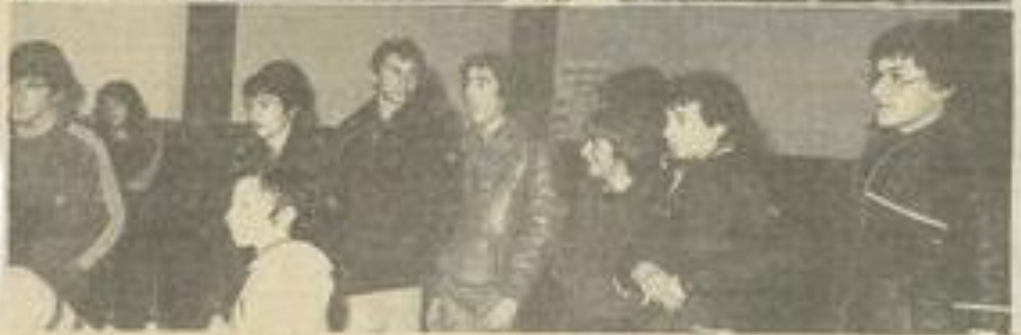
• Les responsables et les athlètes les plus âgés.