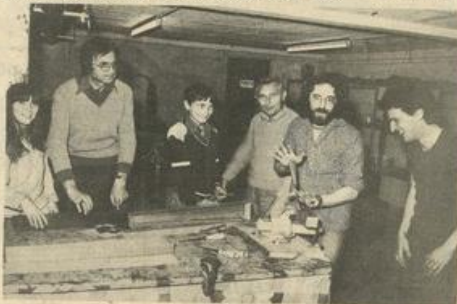
L'atelier lutherie au stade de la réalisation

autre instrument, peut-être le violon-tambo de la Montagne Noire.