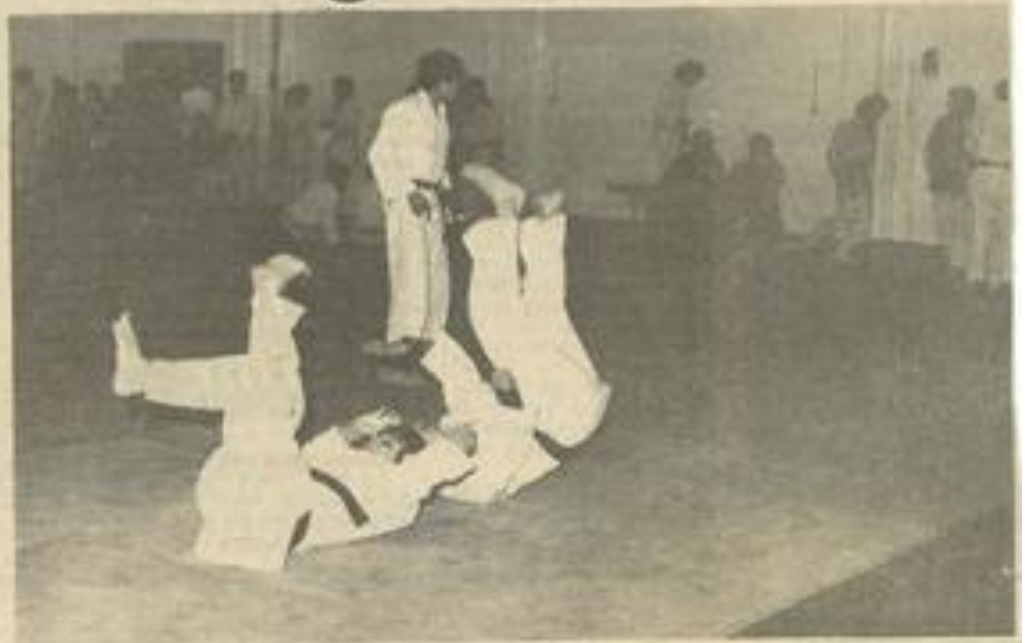
• Les juges-arbitres venus de tous les coins de la région.