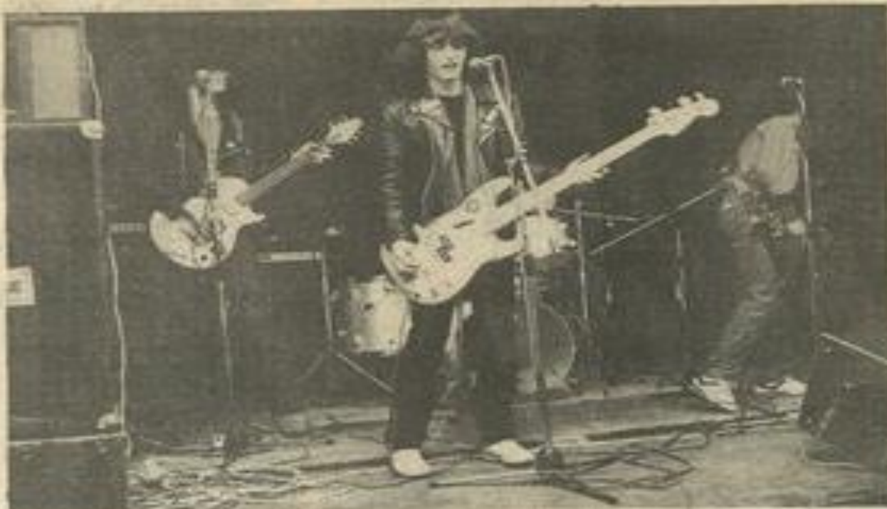
• Le groupe Quartz en pleine action