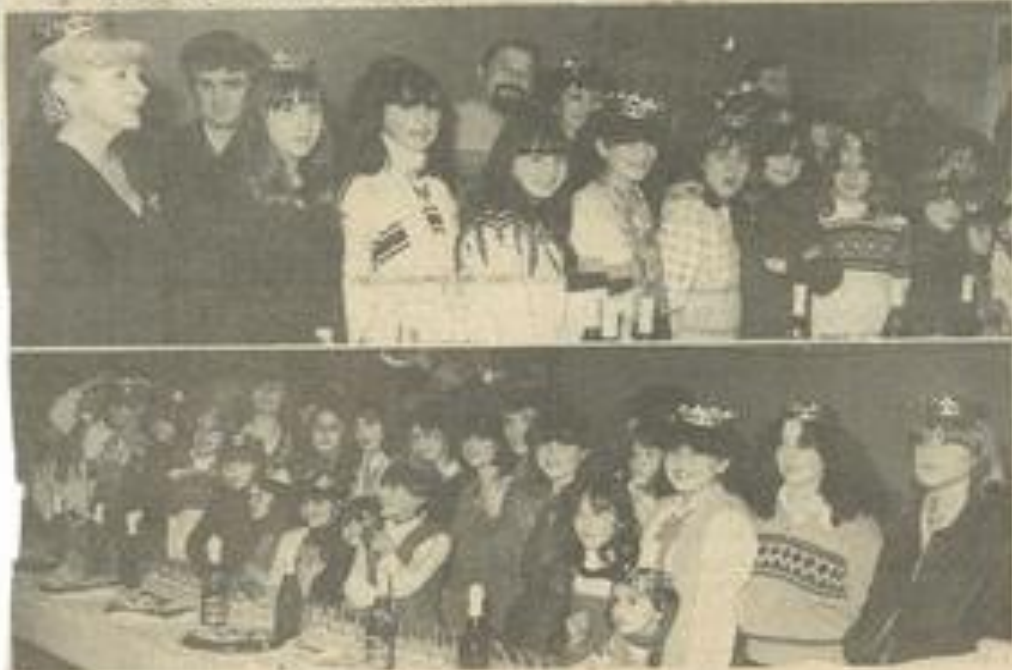
• Les Rois aux majorettes M.J.C.