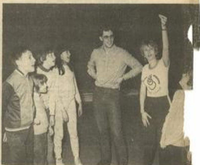
• ... puis à l'expression, suivant les conseils de Mme Castal et de Pierre Zabala.