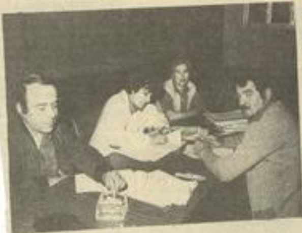
• La préparation du camp de vendanges commence tôt.