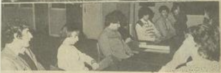
• Les responsables départementaux des M.J.C. et les participants à la réunion.