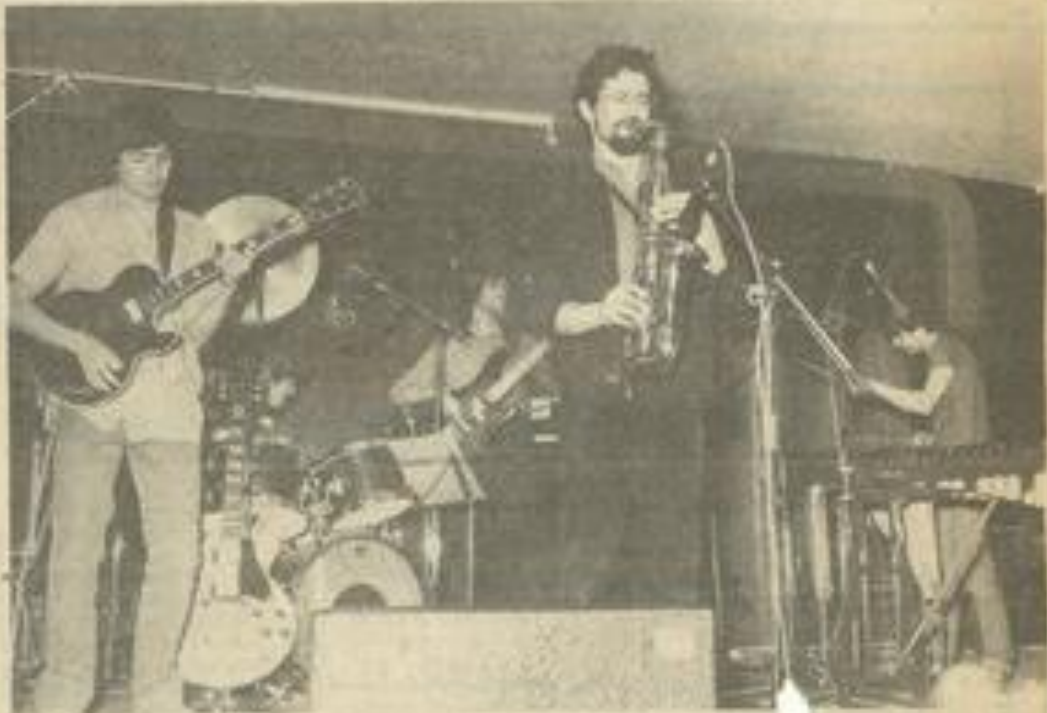
• "Abus dangereux", une musique convaincante.

V ENDREDI soir à la M.J.C. le concert "d'Abus dangereux" a rassemblé un peu plus de monde que celui de "Nitro". Il est vrai que les amateurs de rock n'ont pas d'horaires et qu'ils arrivent souvent vers les 22 h ou plus tard.