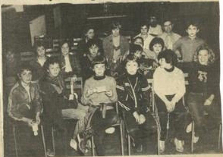
Les nageurs et leurs parents ont vu la Tunisie... en images.