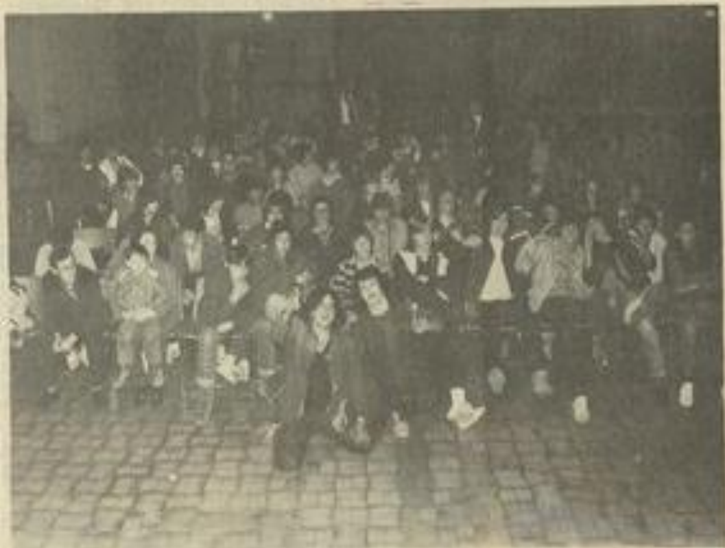
• La salle allait se remplir encore