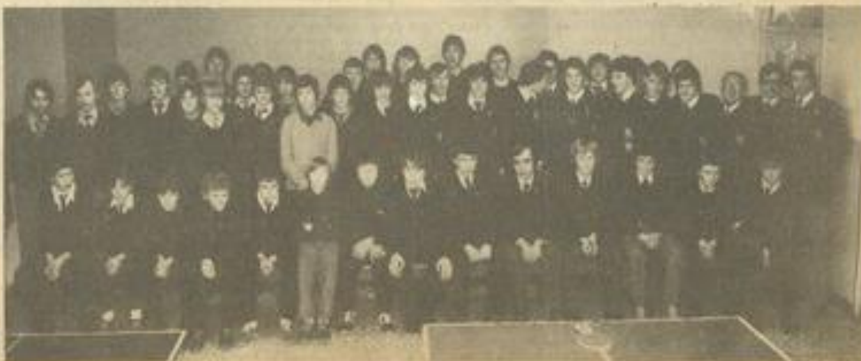
● Les collégiens britanniques.