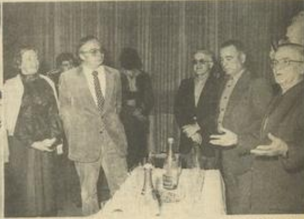
• Le maire accueille les Brémois.