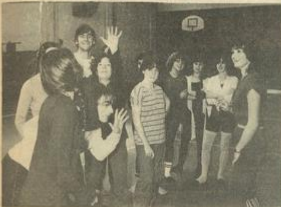
● Une approche détendue de la danse jazz.