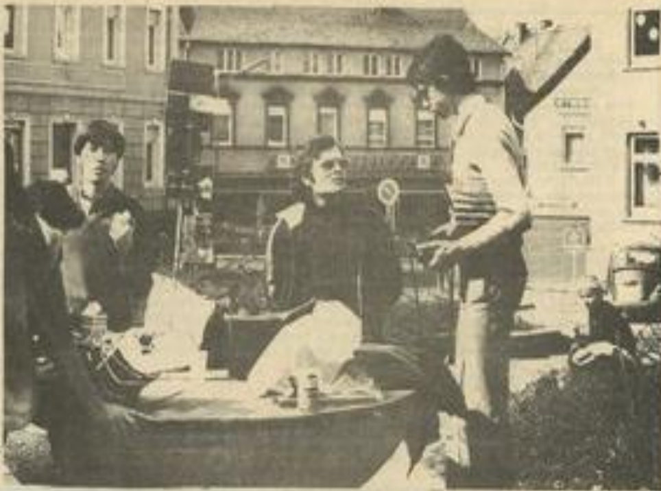
• Trois Lézignanais sur une place de Lauterbach

Le Photo club de Lauterbach doit venir à son tour à Lézignan à Pâques 1982.