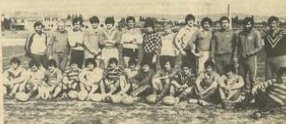
• Les juniors en stage à la Rouminguère.