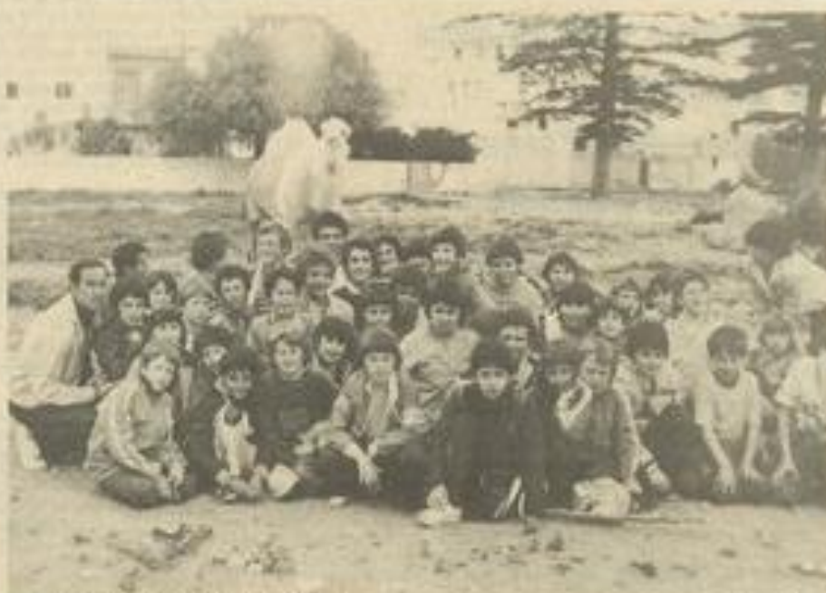
• Même le chameau est en admiration...