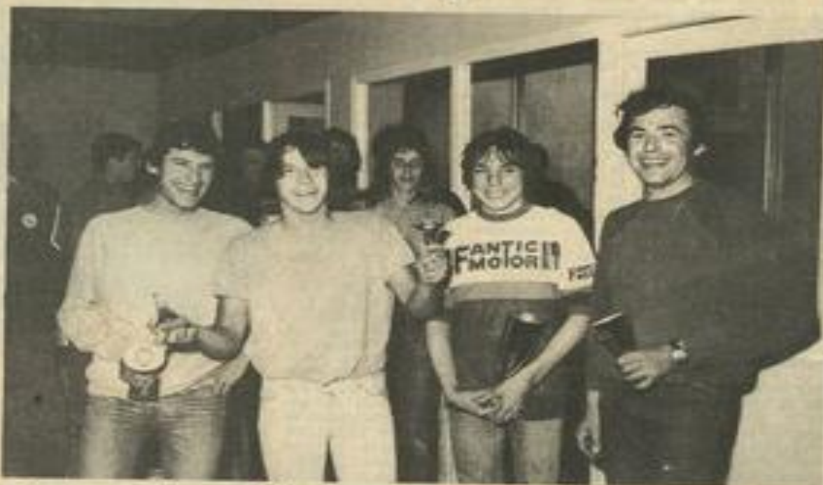
• Quelques unes des coupes remises à l'issue de la compétition.