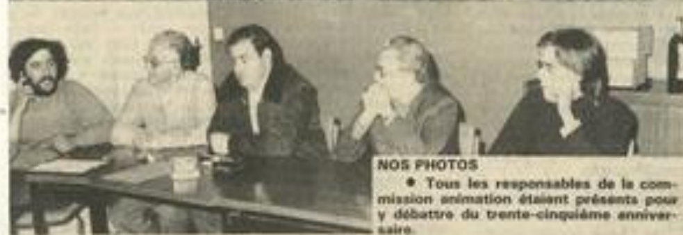
NOS PHOTOS • Tous les responsables de la commission animation étaient présents pour y débattre du trente-cinquième anniversaire.