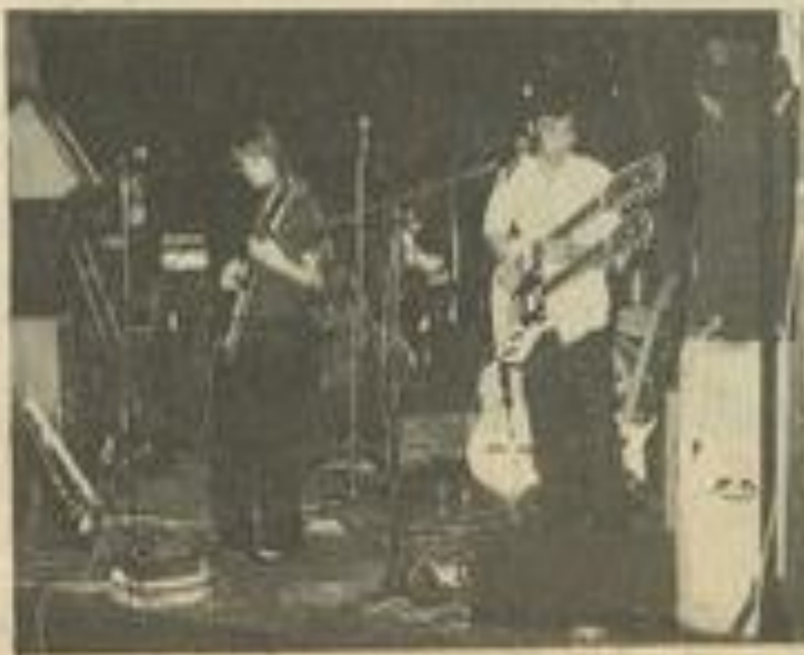
• Le groupe "Nuance" a commencé le concert

Leur musique n'a rien à voir avec le rock traditionnel et est largement influencée par la musique classique. "Nuance" comme "Otway" jouera le 18 avril au festival rock de Fitou.