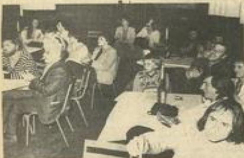
• Un public chaleureux.

Une manière bien agréable de renouer avec une musique ancienne, de qualité et qui, nous l'avons vu vendredi soir, attire toujours beaucoup d'amateurs.