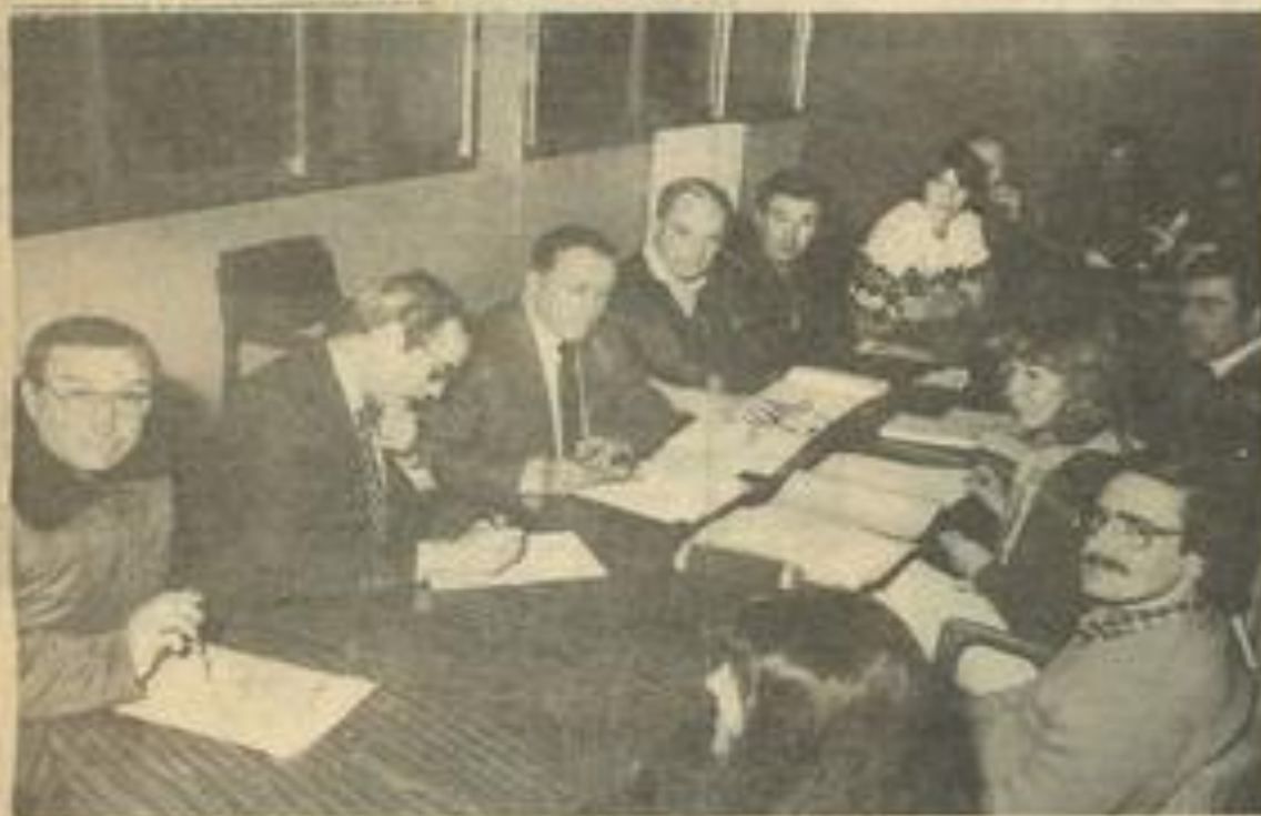
• Le comité de l'Aude d'athlétisme réuni à Léznigran.