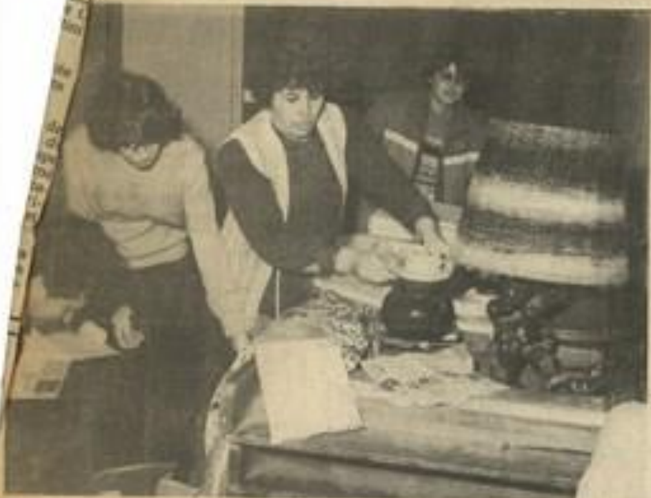
Les animateurs de la M.J.C. achèvent les derniers préparatifs de cette kermesse