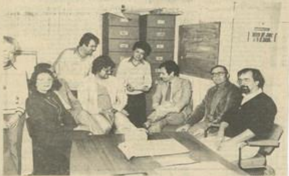
• Les responsables des diverses associations.