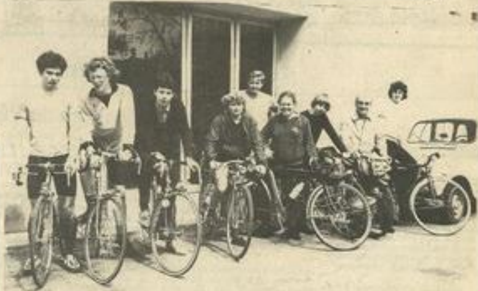
• Les cyclos belges devant la M.J.C.

tons-leur un agréable séjour et un temps ensoleillé afin qu'ils gardent un excellent souvenir de notre région.