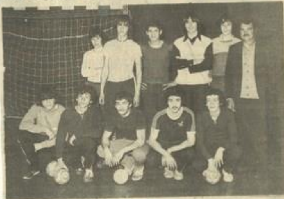
• La nouvelle équipe de handball