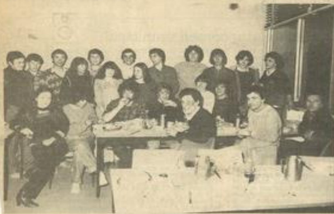
• Les étudiants en géologie