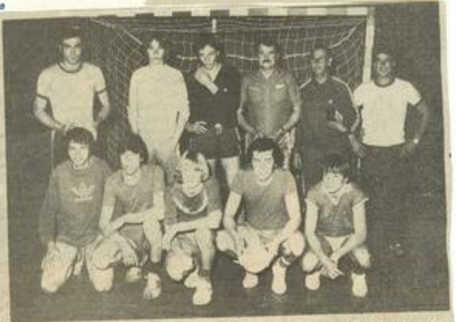
• L'équipe d'Armissan.