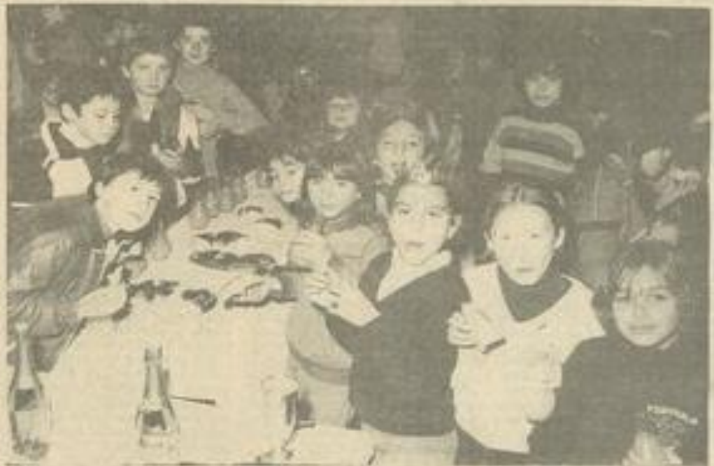
• Du monde autour de la table.