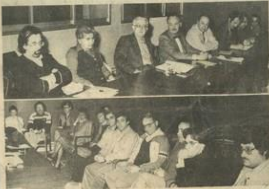
• Le conseil d'administration en plein travail.