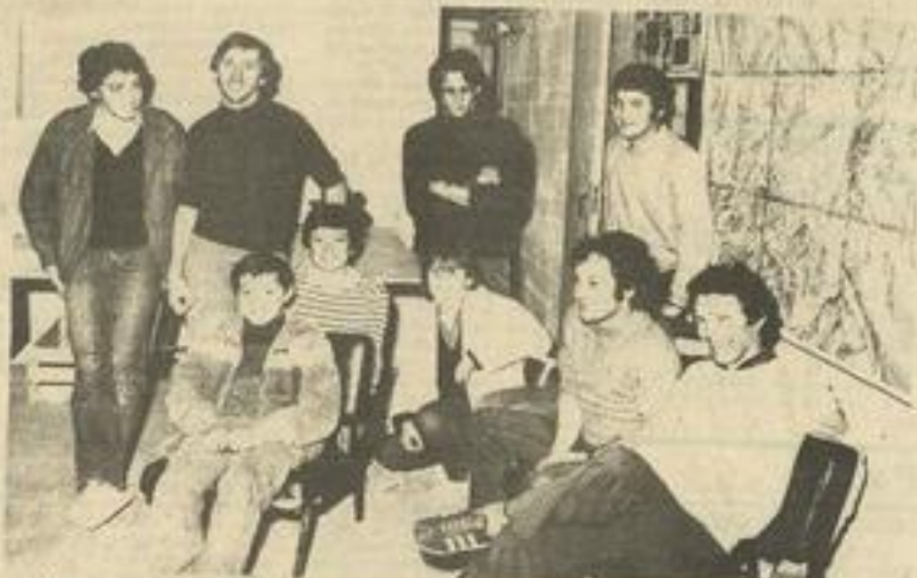
• Les membres du spéléo-club lézignanais lors de leur assemblée générale.