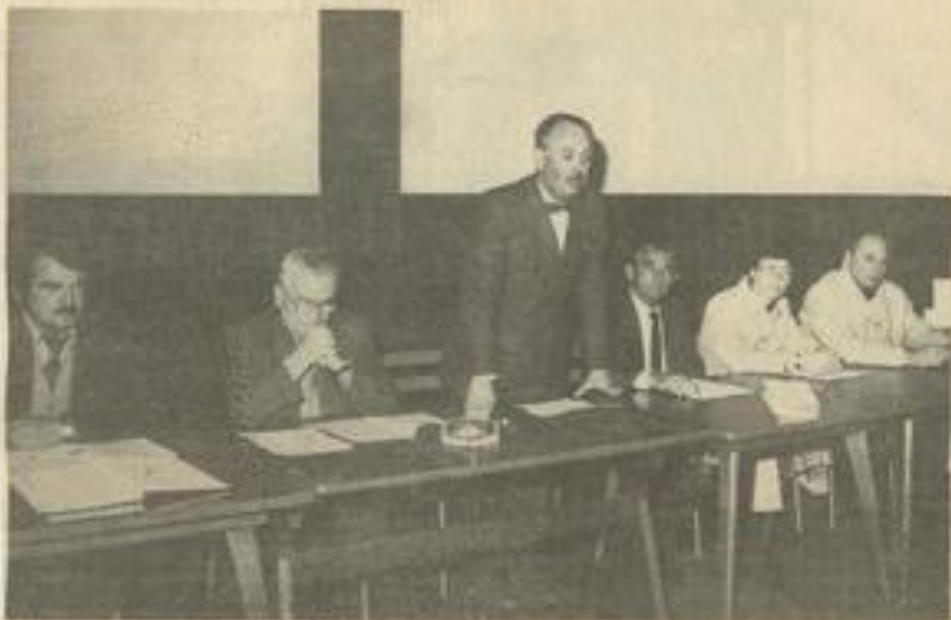
• Le bureau, et les personnalités présentes.