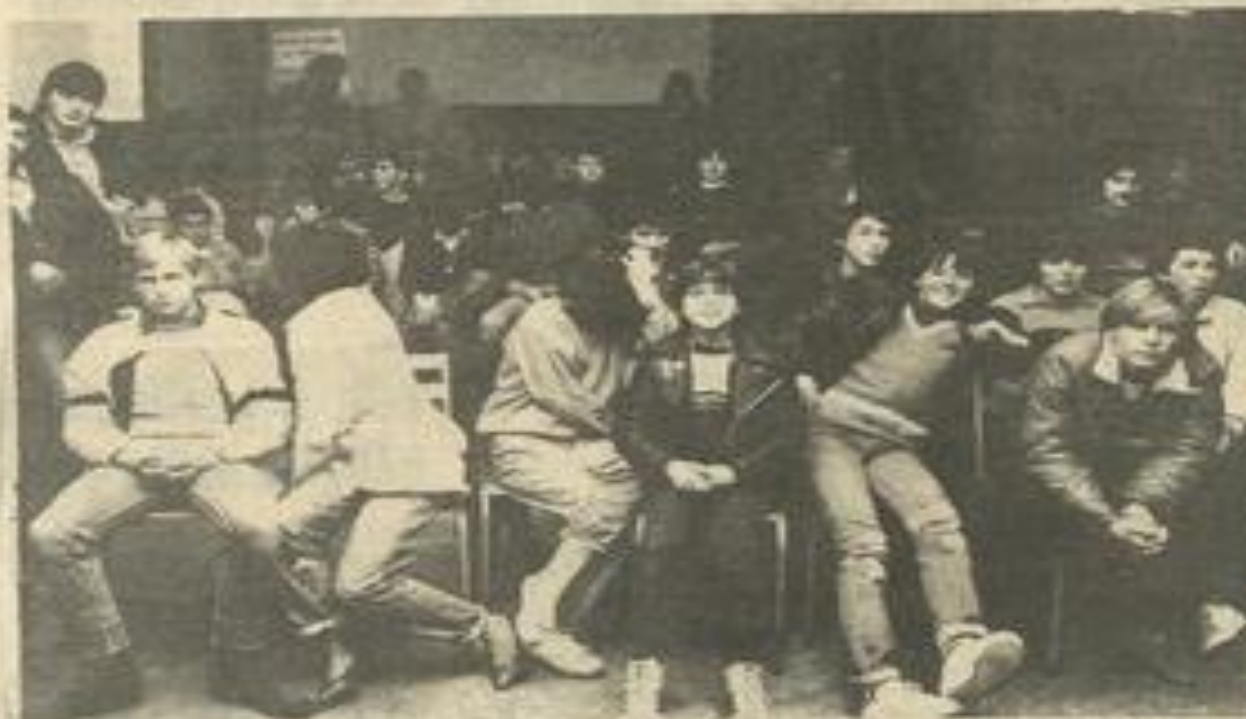
• Dans la salle, de jeunes fans