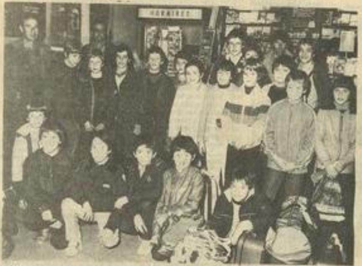
« Nos nageurs attendent le train