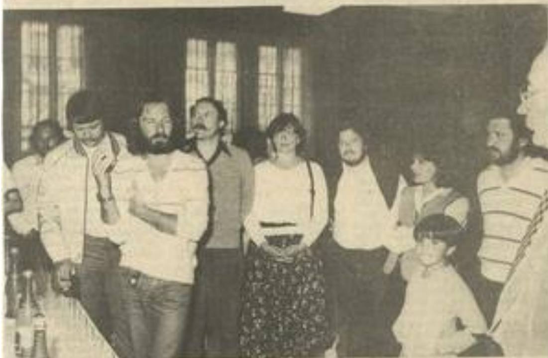
• L'interprète parle au nom du groupe allemand.