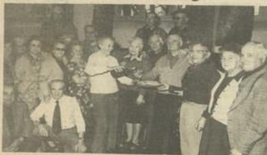
• C'est la fête au 3 e âge...