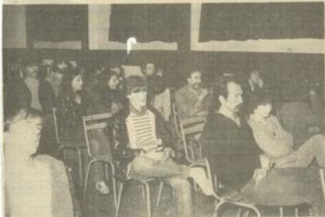
• Le public au début du concert, d'autres spectateurs sont arrivés plus tard