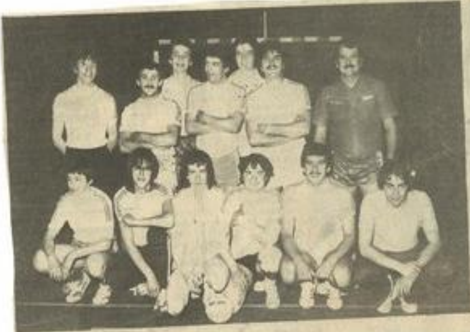
• L'équipe lézignanaise.