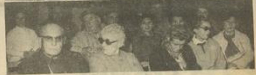
• Le public de cette soirée