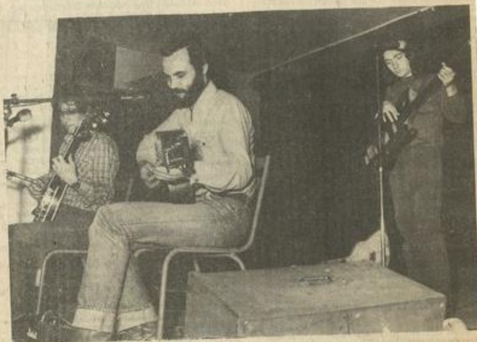
• Le groupe Duodenum pendant son concert.