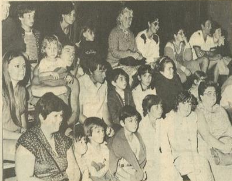
• Des enfants sérieux.