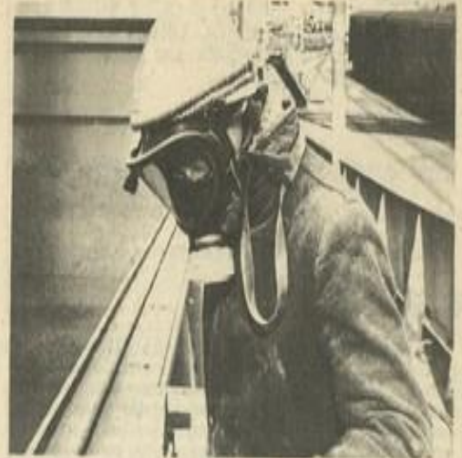
● Pour se protéger de la poussière.