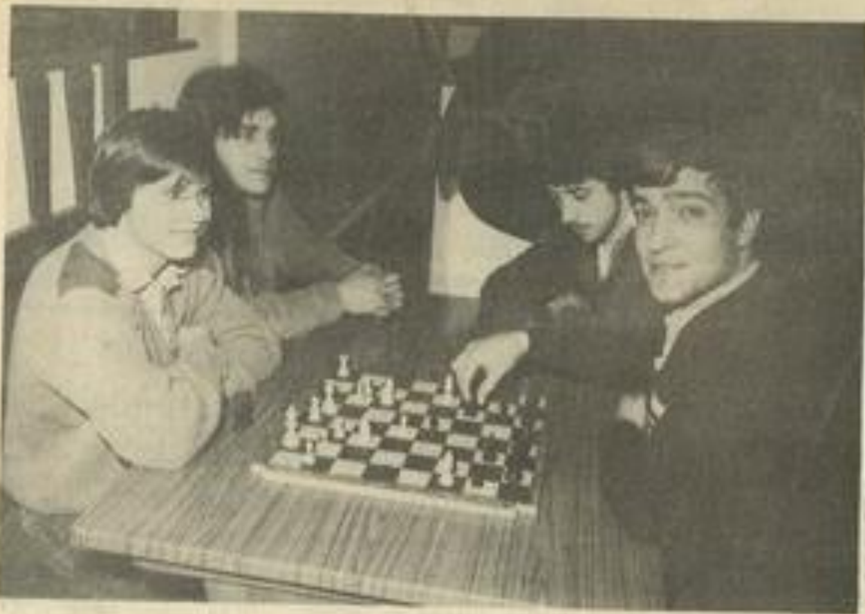
• Une partie d'échecs à la M.J.C.