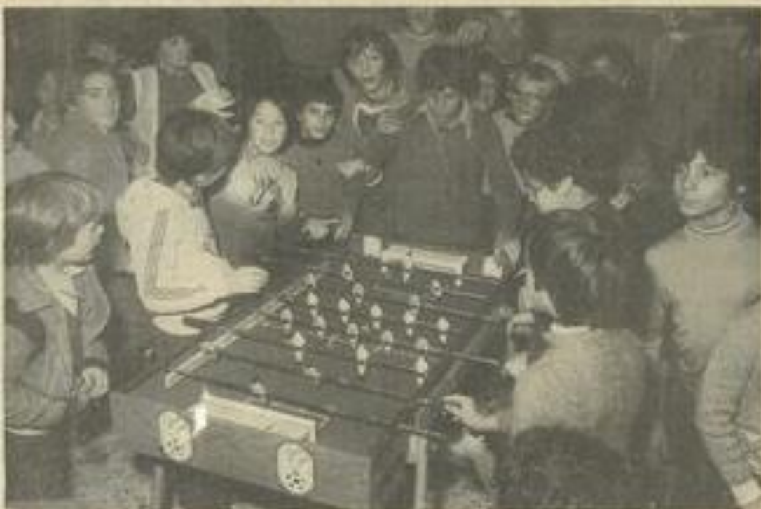
• Les baby-foot étaient assaillis, ce qui n'est pas habituel.