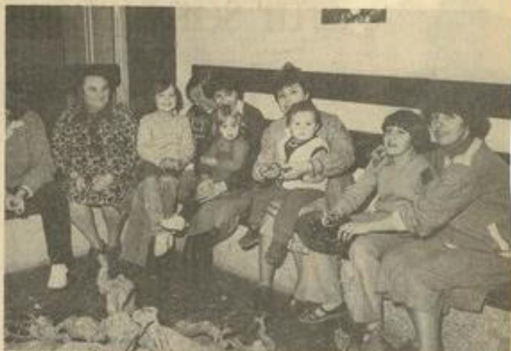
• On mange les châtaignes dans la joie et la chaleur familiale