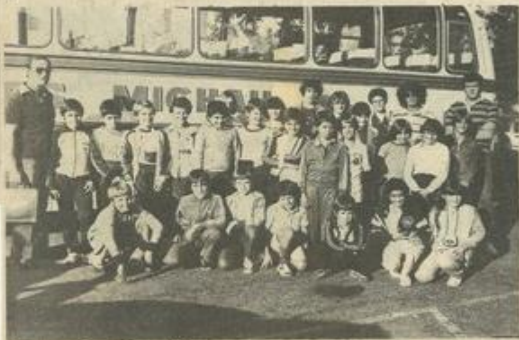
• Le groupe des nageurs lézignais et leurs accompagnateurs.