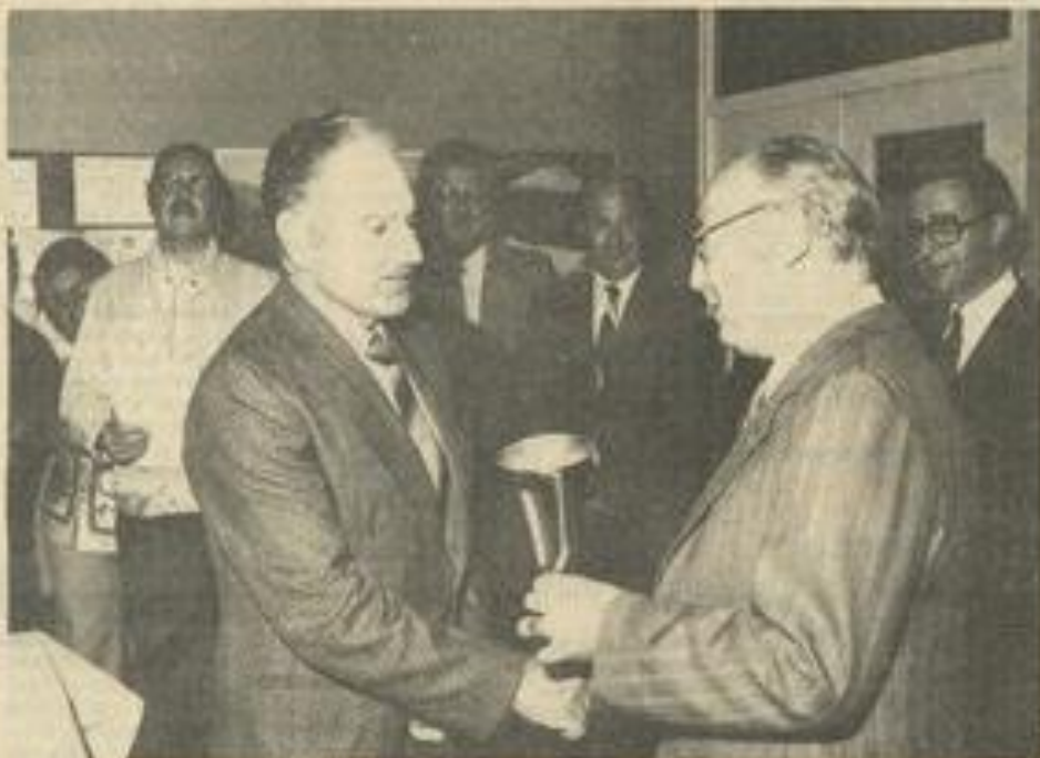
* Au vernissage de l'exposition philatélique de la M.J.C. de Lézignan, la remise des coupes. Ici, le président du club philatélique reçoit sa récompense.