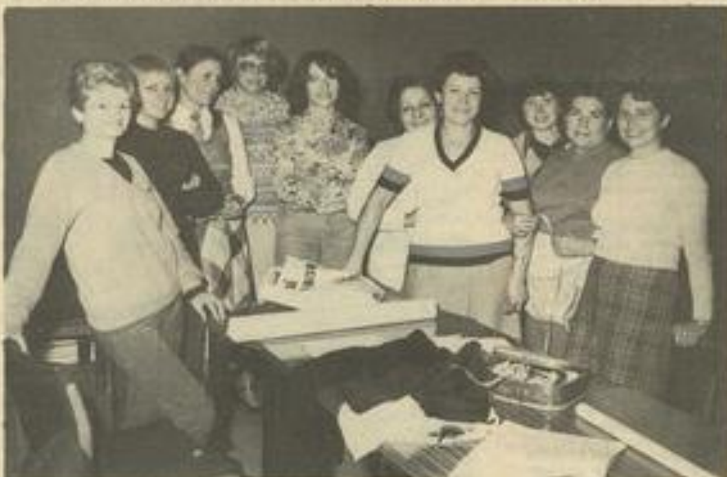
• Vendredi, les dames ont repris les cours.

plus que ceux que l'on trouve dans le commerce. Comme quoi tout s'apprend.