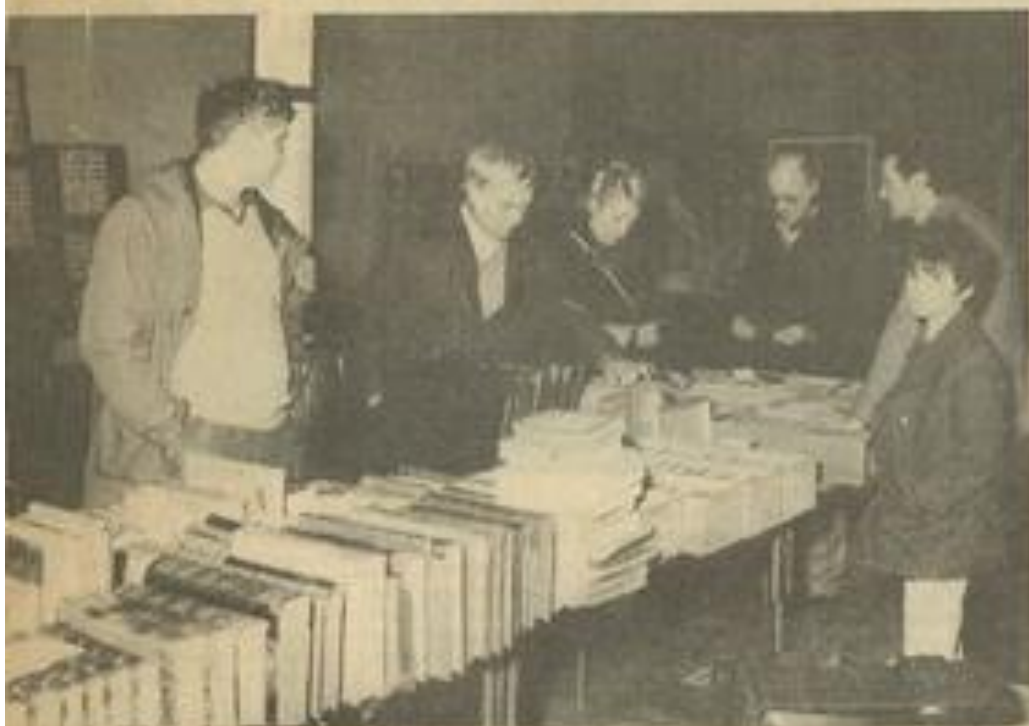
• De vieux livres et des cartes postales