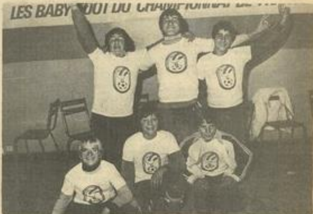
• Les deux équipes finalistes.