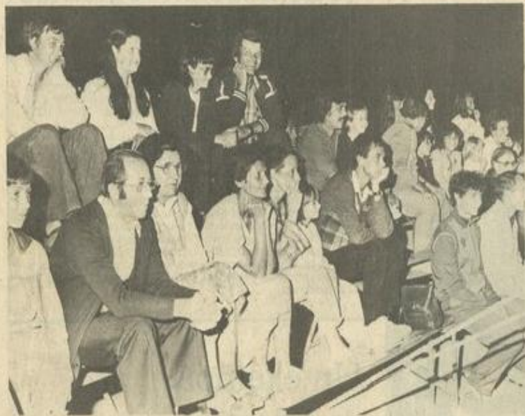
• Des adultes attentifs.