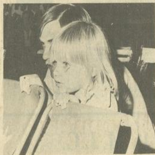
• Des enfants qui rêvent...

APRES la manade Jean qui avait planté ses arènes à la plage, c'est au tour d'un petit cirque de participer à l'étalement des vacances et qui a obtenu un succès des plus probants pour les estivants du mois de septembre.