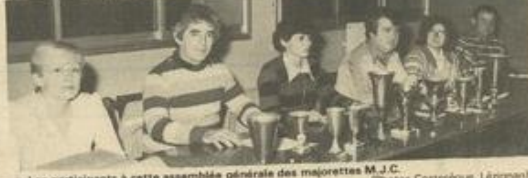
• Les participants à cette assemblée générale des majorettes M.J.C.