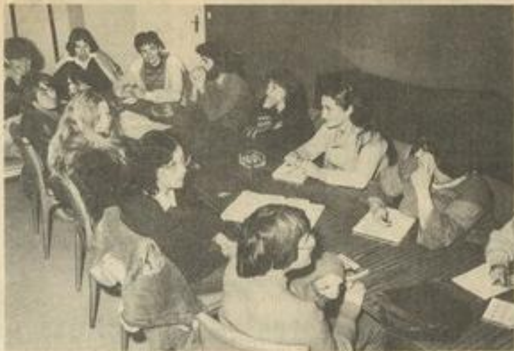
• Les hommes sont encore peu nombreux aux réunions du Planning Familial, ne seraient-ils pas, eux aussi, concernés ?