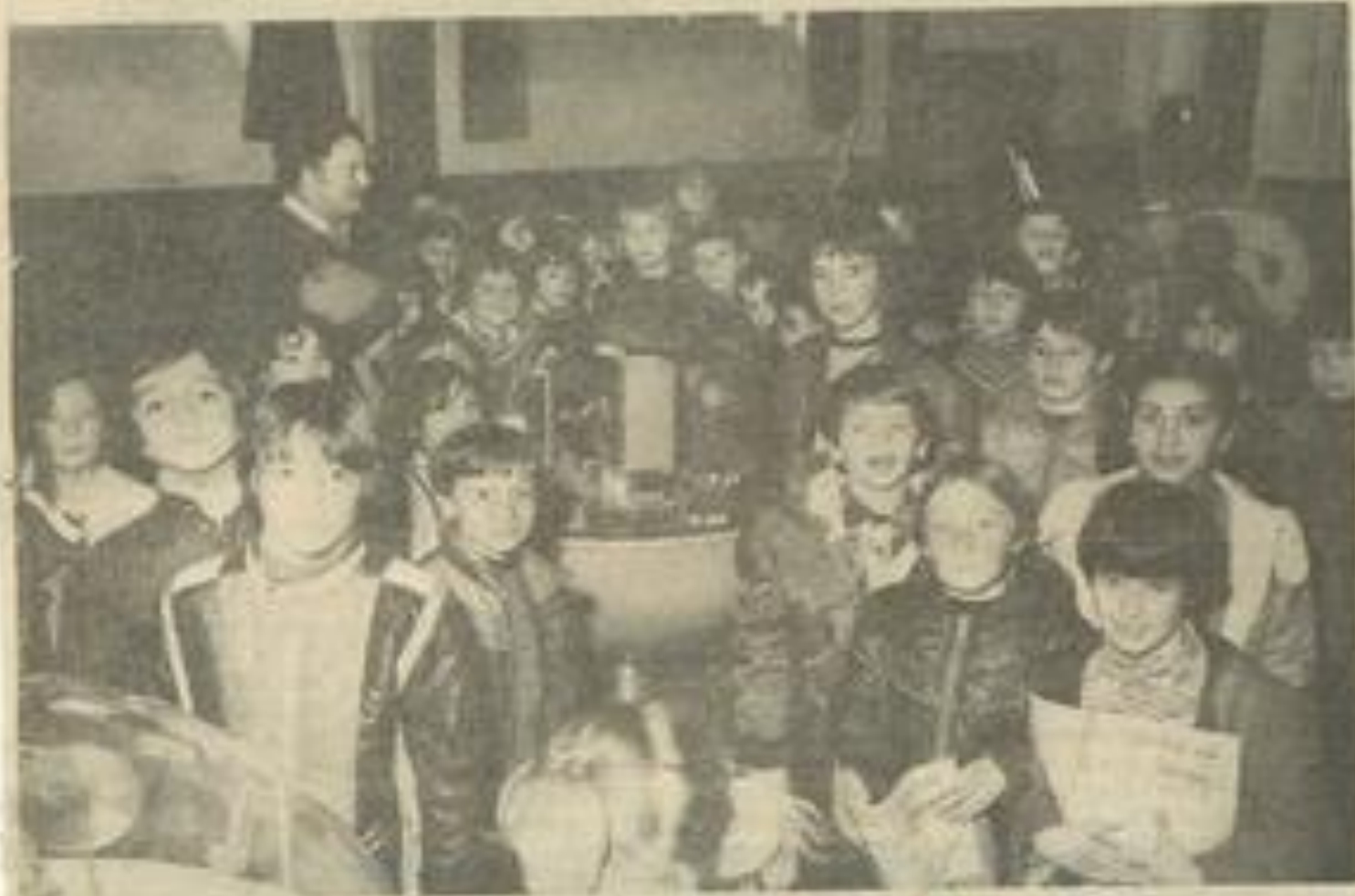
• Un groupe de lycéens en visite.

Une riche exposition, comme on le voit, et qui s'adresse à tous ceux qui ne savent rien, un peu ou même beaucoup sur l'électricité.