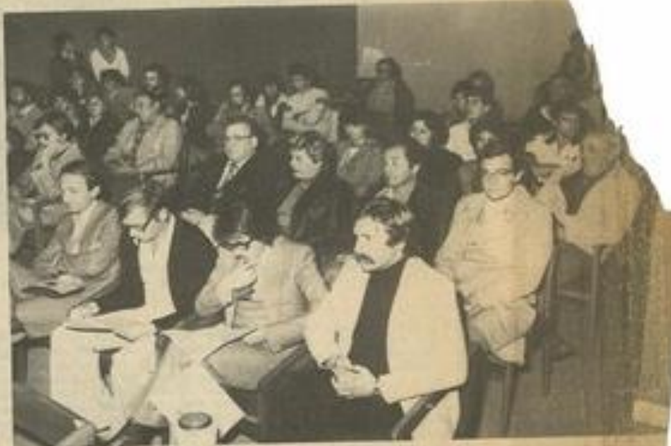
• Beaucoup de monde pour l'assemblée générale du Tennis-Club.

B EAUCOUP de monde mardi soir à la M.J.C. pour l'assemblée générale. La séance fut ouverte par le président Fau puisque le quorum était atteint.