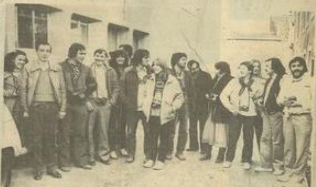
• Les stagiaires prêts à tout mettre sur leur pellicule. A droite, les deux animateurs du stage.

Le dimanche matin donna lieu à l'apprentissage du tirage sur papier et en début d'après-midi les travaux furent mis en commun.