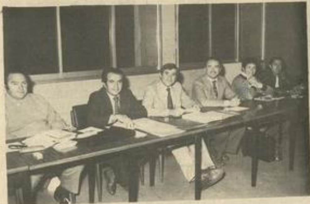
• Le bureau du Tennis-Club en assemblée générale.