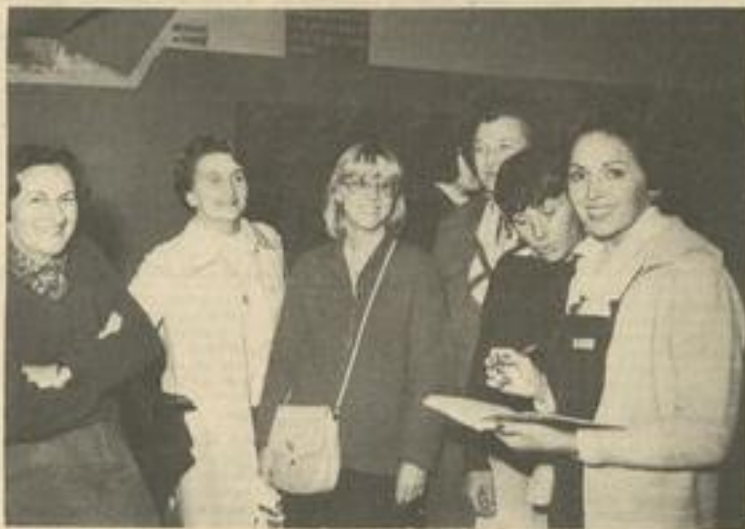
• Les inscriptions à la gymnastique féminine de la M.J.C.