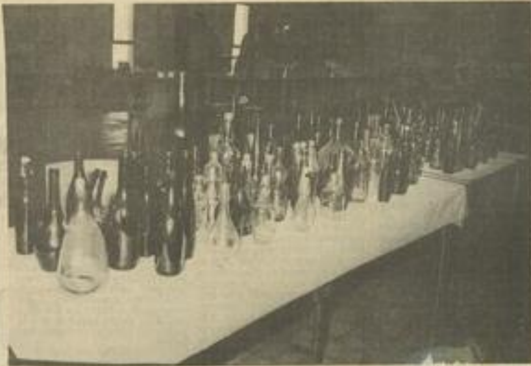
• Le royaume du verre, au pays du vin