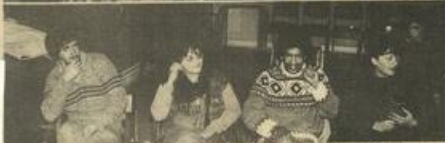
• Le Ciné-Club a repris, dans une salle du premier étage de la M.J.C., qui offre une bonne acoustique. (Photos Costesèque, Lézignan).