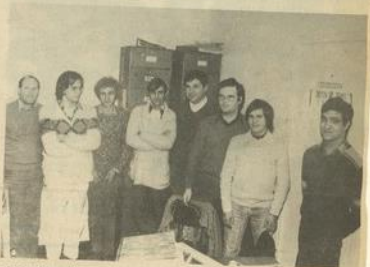
• Les participants à cette première prise de contact des amateurs d'échecs

La section faisant partie de la M.J.C. il faut la carte de cette dernière pour participer à ses activités. Une section d'échecs avait fonctionné à la M.J.C. de Lézignan il y a deux ans, puis n'avait pas continué. Souhaitons à celle qui vient de naître d'atteindre son but et de conserver longtemps la vitalité du départ. A Narbonne et Carcassonne existent des sections d'échecs qui marchent bien.