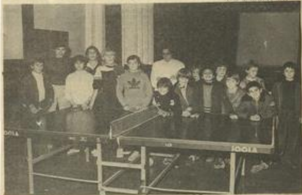
• Un tournoi original