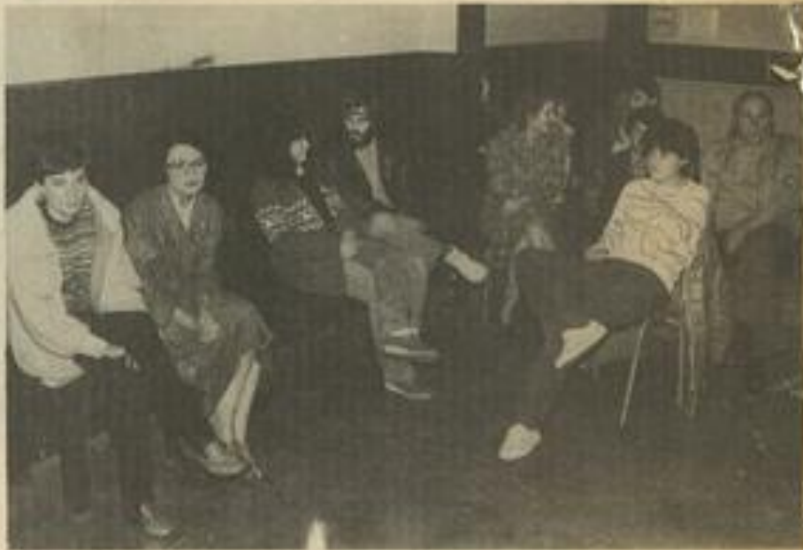
• Les participants étaient venus de Lézignan et d'ailleurs.

L E Cercle occitan, pour fêter les châtaignes et le vin nouveau, avait fait venir, vendredi soir, le groupe "Rosamonda", composé de quatre musiciens audois. "Rosamonda" animait cette veillée culturelle de musique traditionnelle du Languedoc dans le cadre d'une animation départementale financée par le conseil général et la direction départementale de la Jeunesse et des Sports.