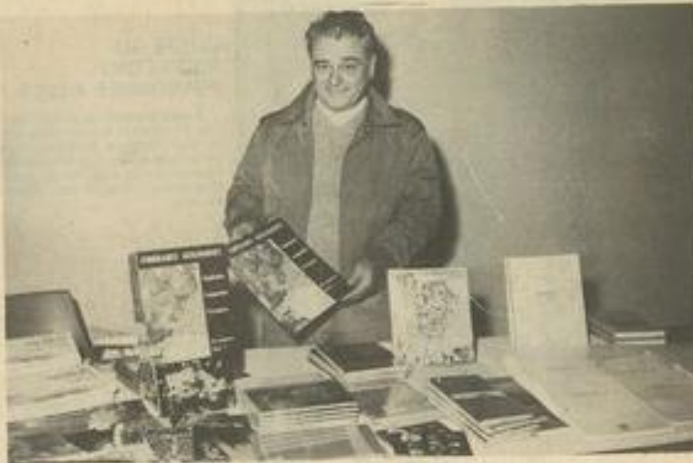
• Des documents très intéressants au stand de la « Maison de la Presse ».

LA troisième bourse aux minéraux organisée par la M.J.C. a débuté hier à la salle des fêtes, mais elle continue encore aujourd'hui de 9 h à 19 h 30. Cette année, les pièces exposées sont largement à la hauteur des deux bourses précédentes, sinon encore plus intéressantes.