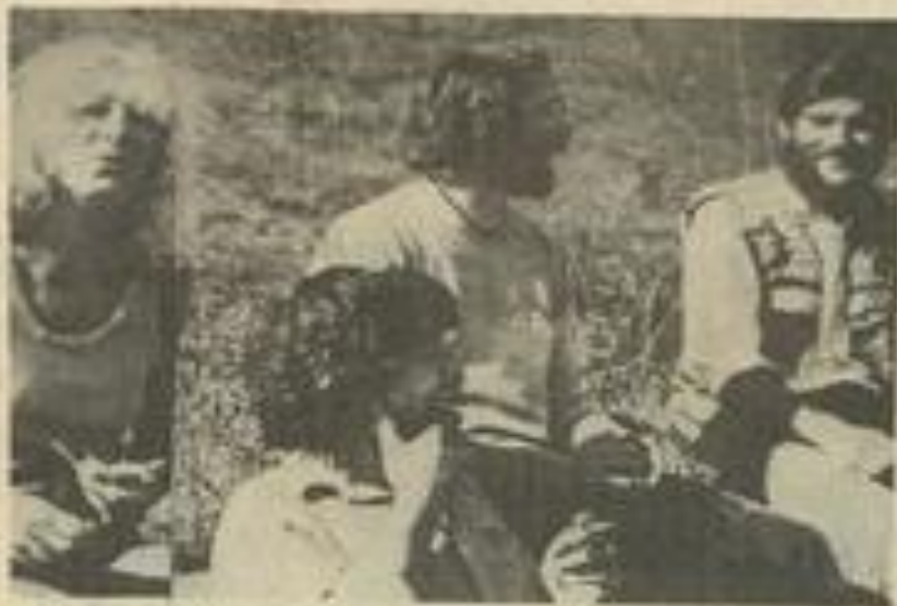
● Le groupe Rosamonda jouera et chantera le vendredi 21 novembre à la M.J.C.

Le tout sera accompagné des fameuses châtaignes et du vin nouveau.