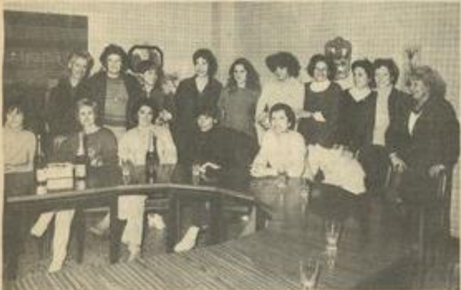
Le groupe de gymnastique féminine de la M.J.C. a tiré les rois.