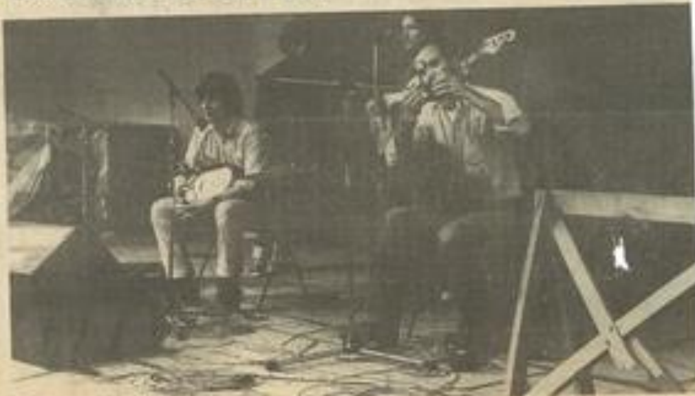
Le groupe « Duodénum » qui sera à Lézignan le mardi 9 décembre

Venez écouter Duodénum le mardi 9 décembre à 21 h à la M.J.C.