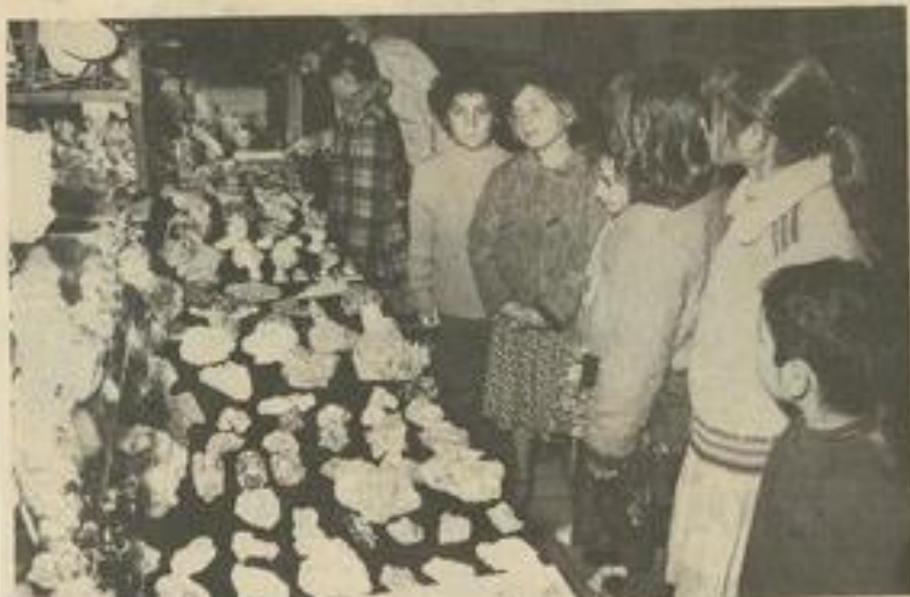
• Les élèves de l'école d'Escouto Quand Ploù ont visité l'exposition.