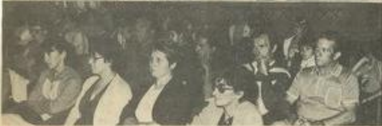
• Nageurs et parents étaient venus nombreux.