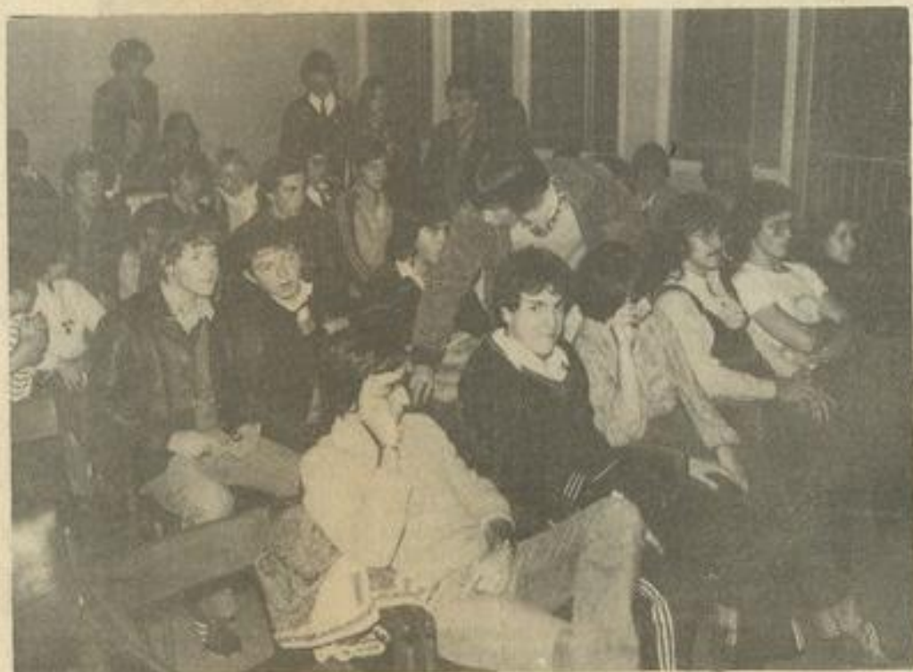
• Une assistance nombreuse, en partie venue de l'extérieur. (Photos Costesèque, Lézignan)