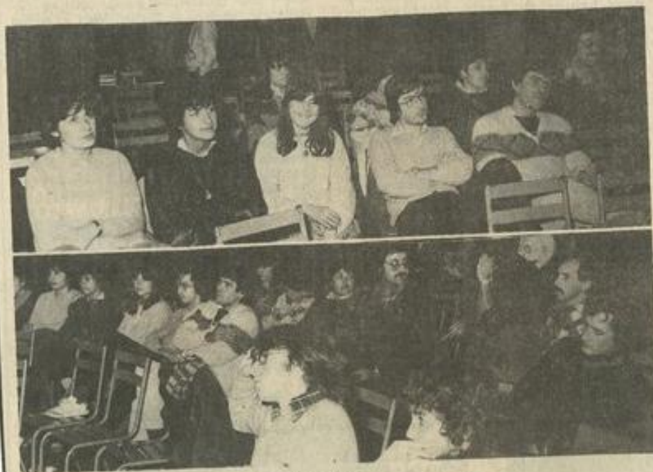
• L'assistance intéressée par la musique folk.