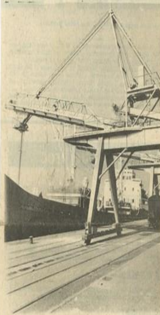
● L'opération spectaculaire de chargement.