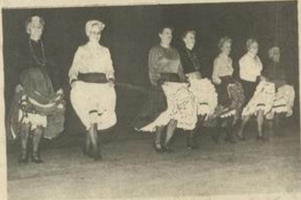
• Le dernier gala des « aînés lézignanais » ces dames entrent en danse.