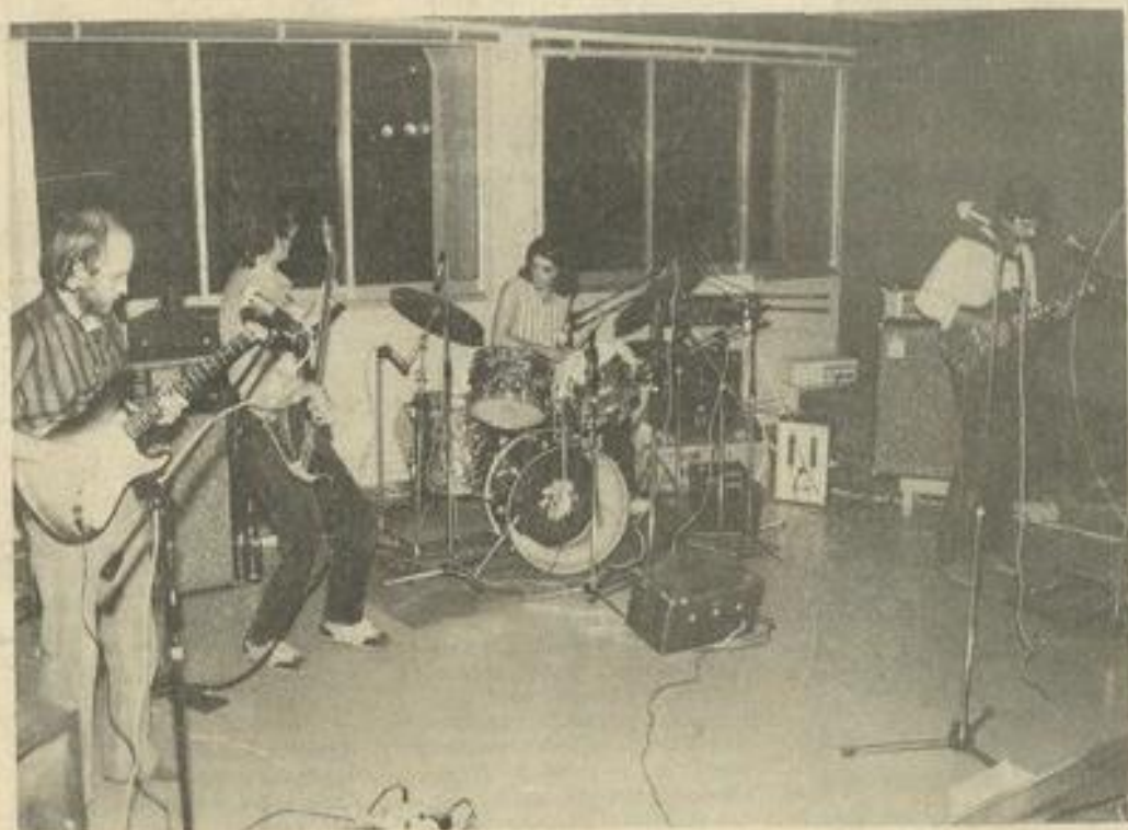
• Les musiciens de Celephais.