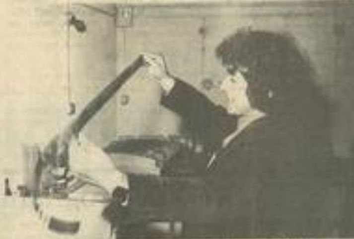
• La satisfaction de développer soi-même ses photos.

Le thème du début d'année était "les Ports" et "les Ruisseaux".