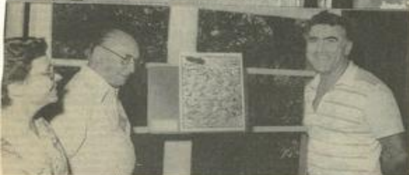
Le Foyer de la Maison des Jeunes a reçu les photogra-