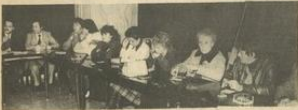
• Une partie des personnes présentes