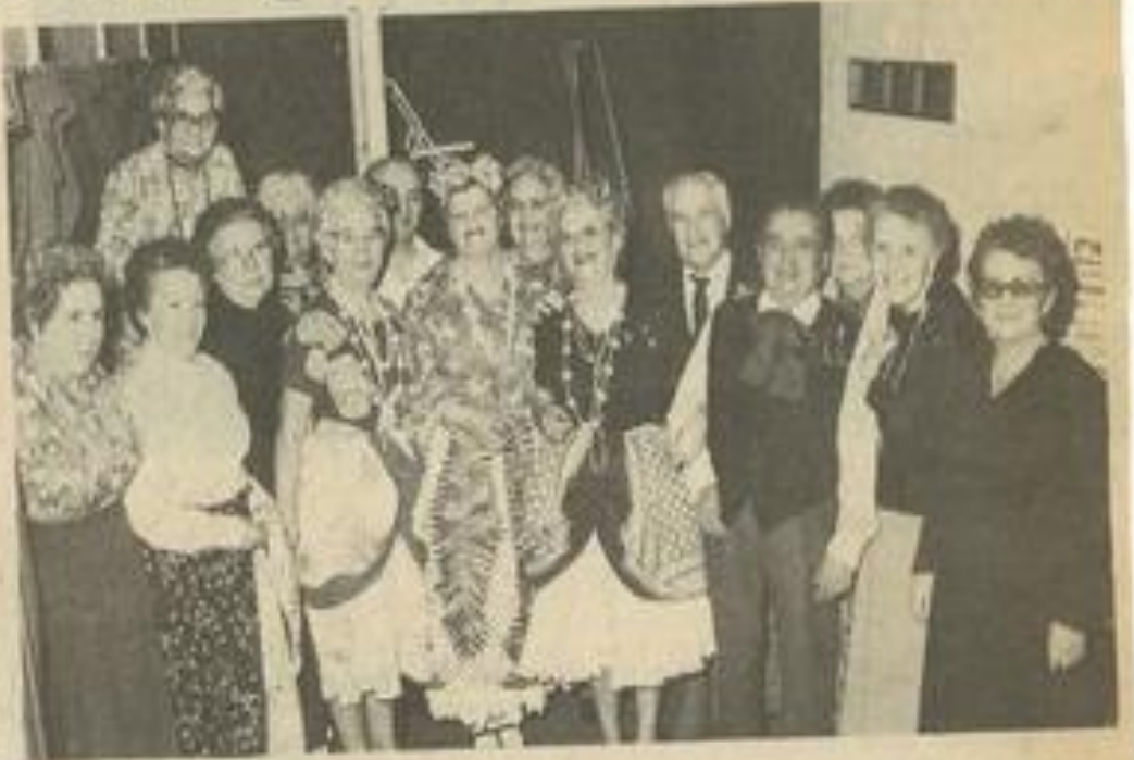
• Le groupe artistique du 3 e âge.

LES personnes du 3 e âge faisant partie du groupe animation se sont réunies pour former leur bureau et se donner un nom. Ce groupe s'appellera désormais "les aînés lézignanais" après avoir voté à bulletin secret