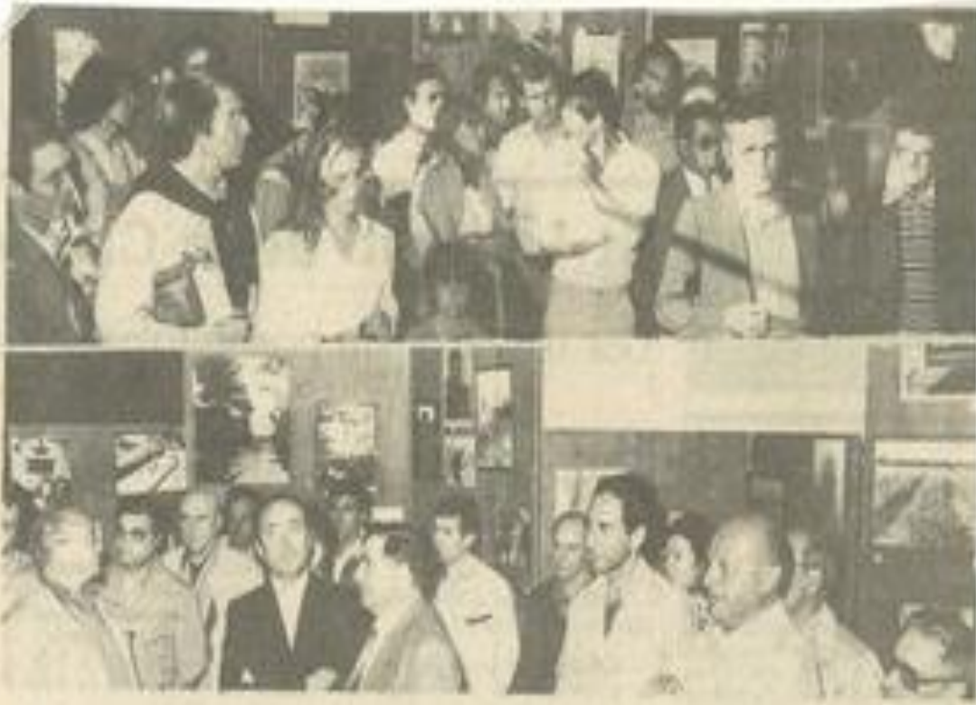
• Beaucoup de monde à ce vernissage.