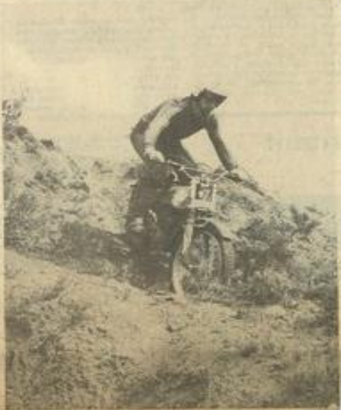
• Un passage délicat pour un concurrent.