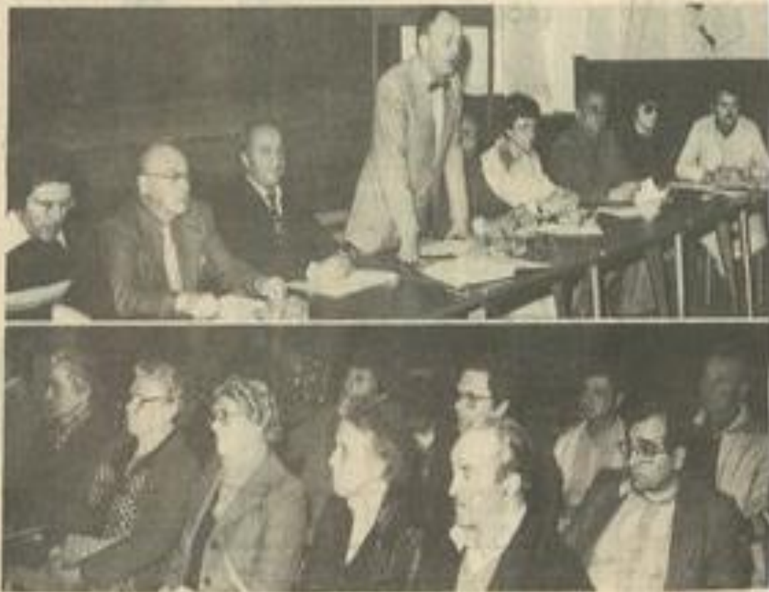
• En bas, une partie de l'assistance ; en haut, le bureau tandis que le président a la parole.

La Blanquette permit, après la réunion, de continuer les discussions amicalement.