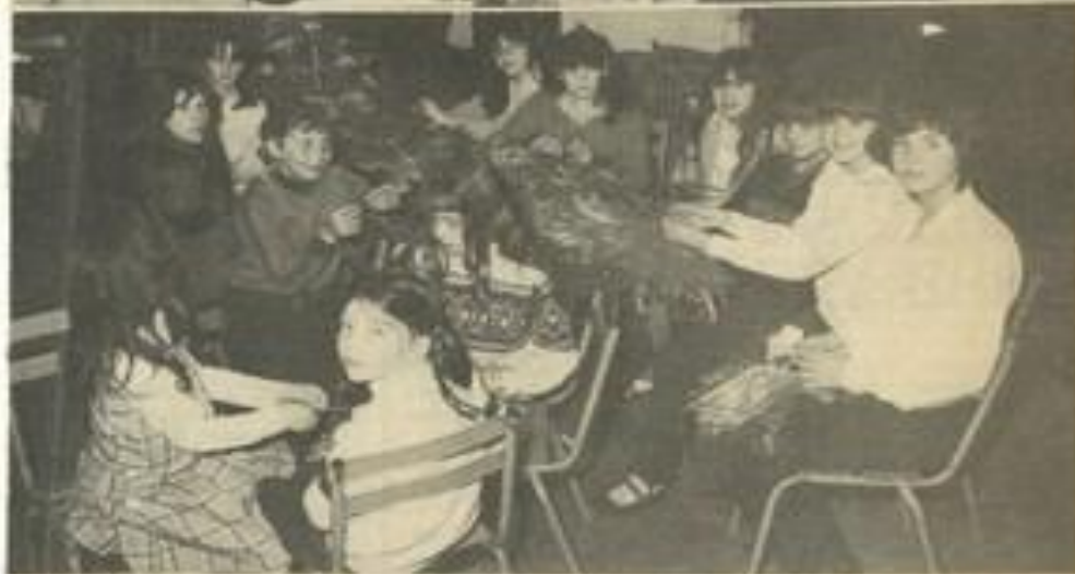
• Les majorettes M.J.C. au travail.