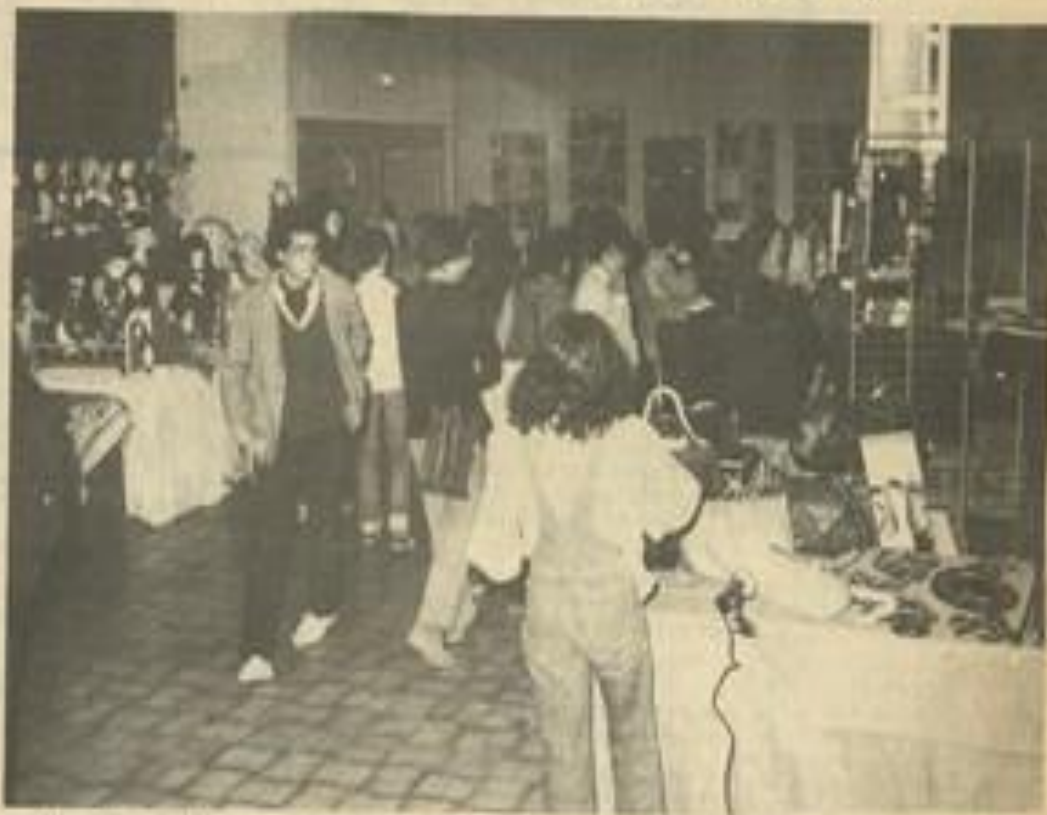
• La salle des fêtes sert également à abriter des expositions diverses