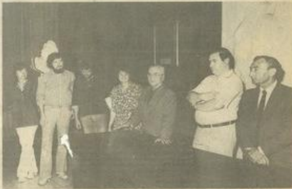
• Dans le cadre des échanges de l'Office franco-allemand, 45 jeunes de Lauterbach.