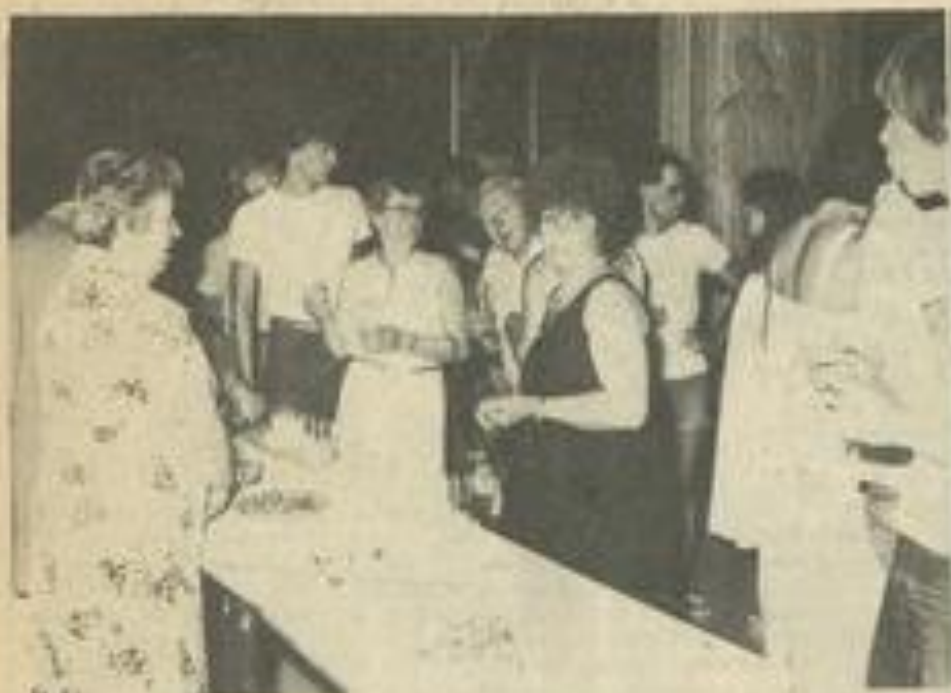
• L'heure de la blanquette.