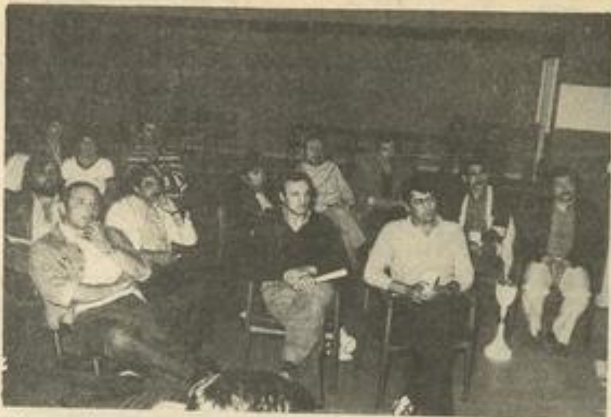
• Les entraîneurs.