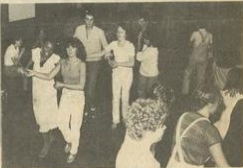
• Et en avant pour le rondeau