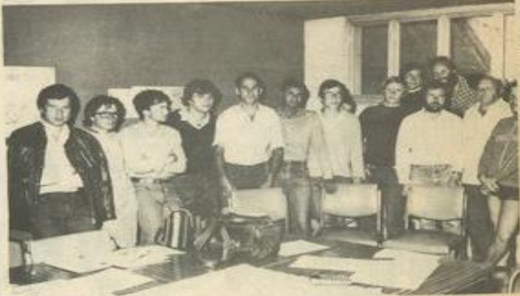
• Les stagiaires de l'I.F.P.