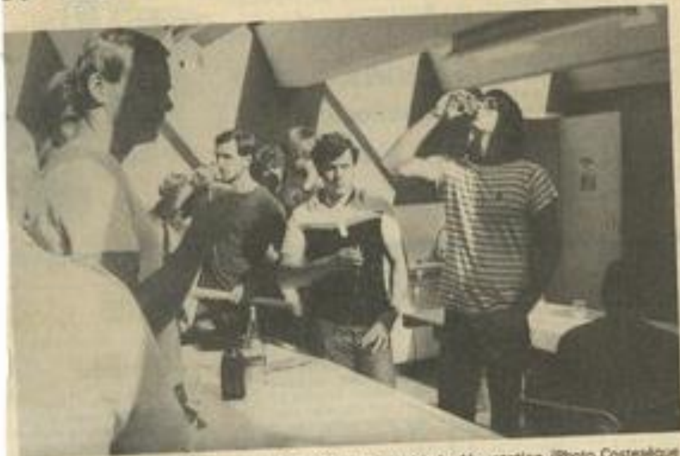
• Les Allemands aux Coteaux occitans. C'est l'heure de la dégustation.

L E groupe de 47 nageurs allemands de Gelnhausen près de Francfort est dans nos murs depuis mardi dernier. Ils sont ici en vacances et vont profiter au maximum de la mer, du soleil et de nos jolis coins de pitade.