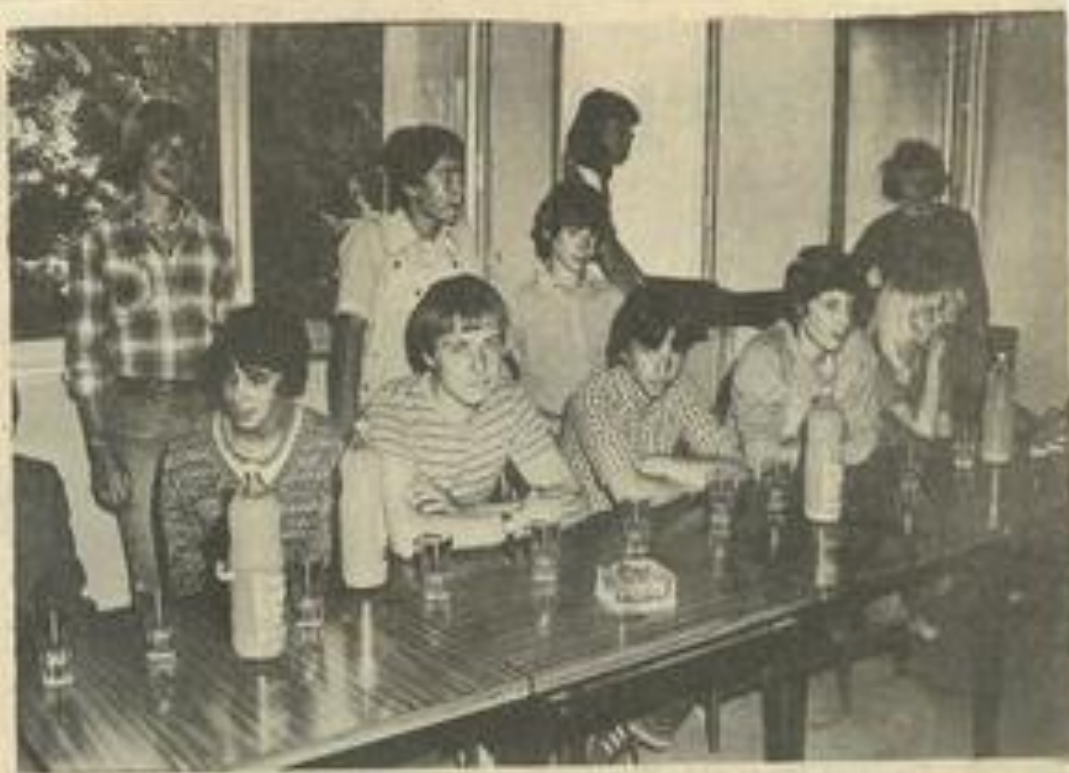
• Les jeunes Allemands avant la cérémonie.

Et bien sûr, tout le monde leva le verre de l'amitié. Une soirée d'adieu clôtura la soirée et le séjour. On se quitta au petit matin le cœur un peu lourd.