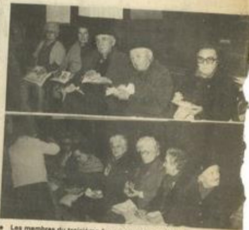
• Les membres du troisième âge pendant le goûter.