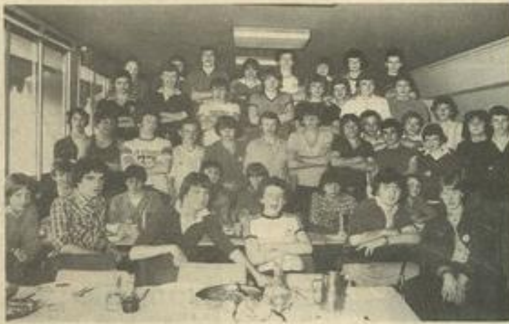
Les dirigeants des lycéens anglais.