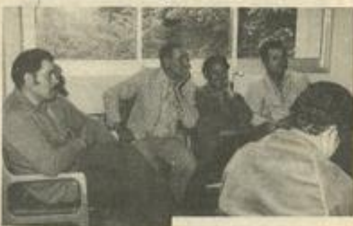
• Au cours de leur réunion, les travailleurs immigrés, algériens et marocains, ont mis au point le principe de leur amicale.

Les travailleurs immigrés sont nombreux dans notre région comme partout en France. Pas toujours appréciés à leur juste valeur, malheureusement. Cette plaie de l'homme, le racisme, montre trop souvent le bout de son nez (quand ce n'est pas sa matraque). Passons.