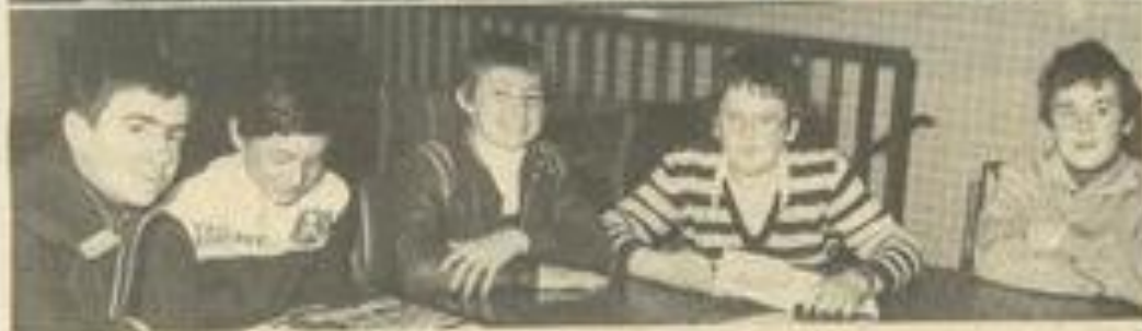
• Les participants à la bourse aux timbres, jeunes et moins jeunes.

LA section philatélique de la maison des jeunes, qui se réunit tous les 15 jours, le dimanche de 10 h à 12 h, a tenu une séance, ce dimanche, avec un nombre de participants relativement nombreux.