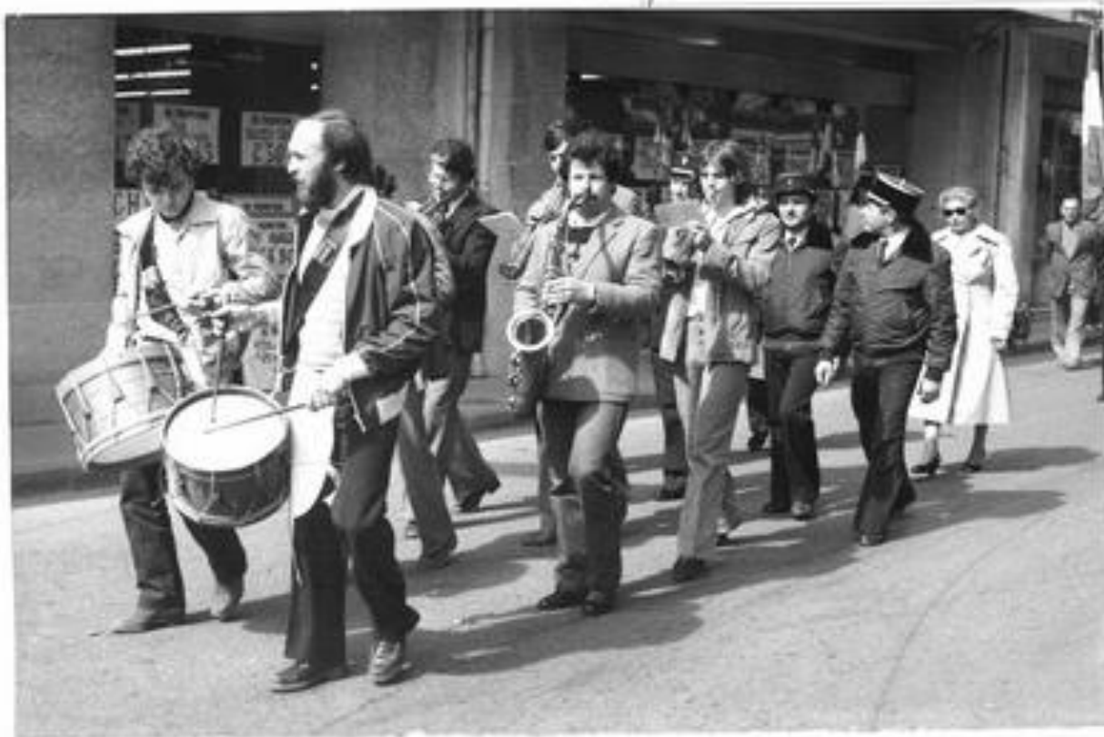
pour le 81 er , Lézignan on retrouve la musique.