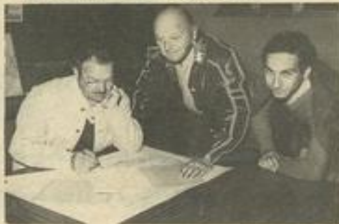
• Les professeurs en plein travail.

L'Institut français du pétrole, et plus précisément le Centre supérieur d'études géologiques et géophysiques, organise un stage basé à Lézignan, à la M.J.C., pratiquement tous les ans. Les stagiaires sont arrivés dimanche et resteront jusqu'au 30 mai. Cette première partie concerne les géologues. Du 1 er au 30 juin, aura lieu une deuxième partie, pour les géophysiciens.