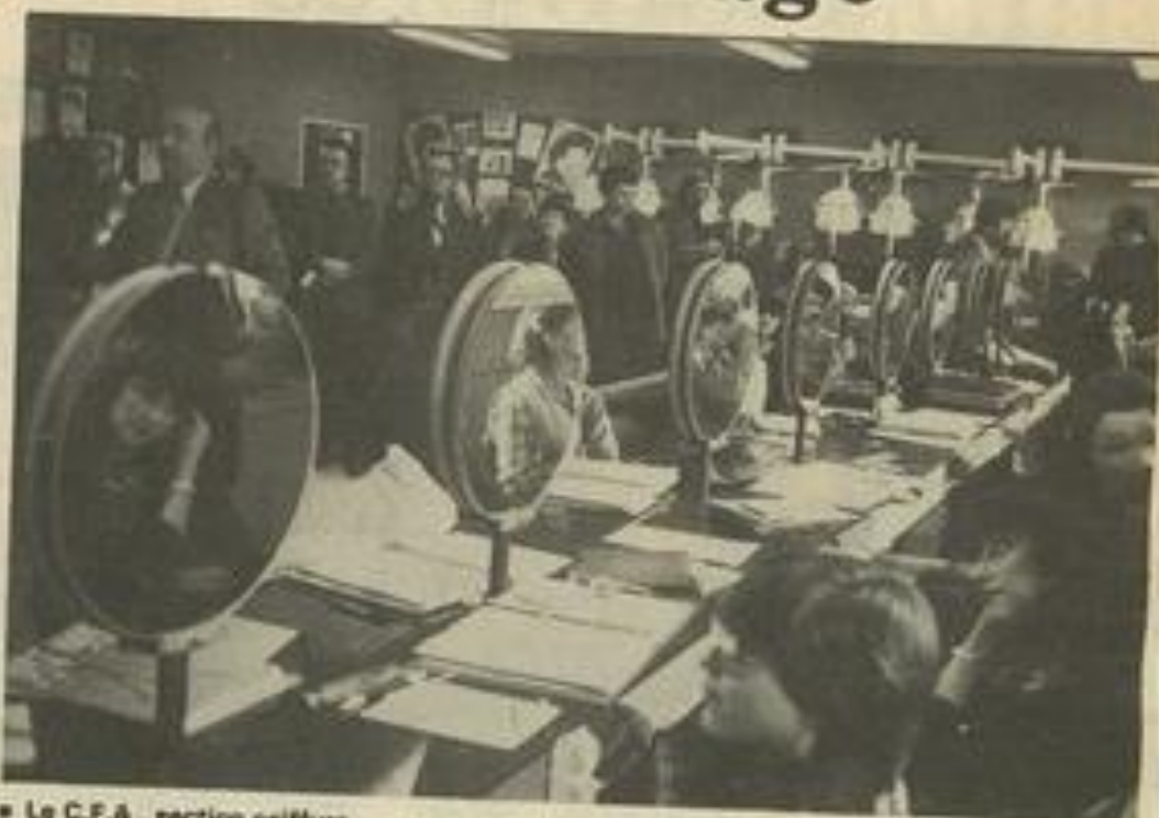
• Le C.F.A. section coiffure.