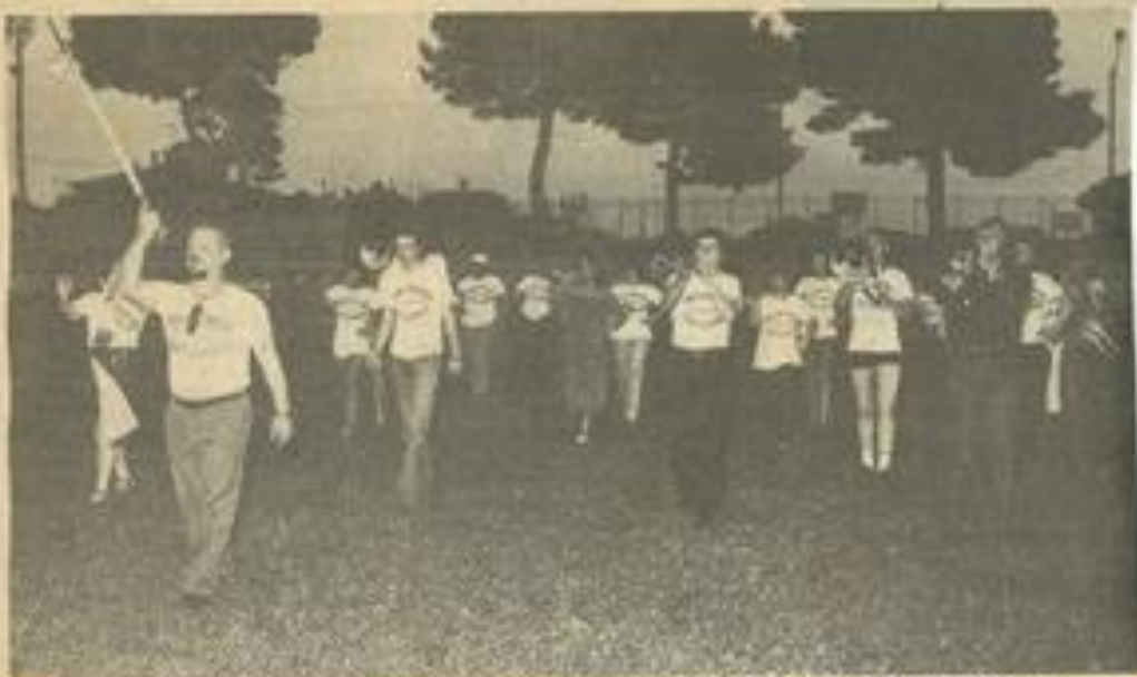
• Deux vues de la fanfare, qui s'est entraînée en compagnie des majorettes M.J.C.

A VANT de participer au défilé de ce jeudi, et à la suite des festivités, la fanfare de pompiers de Lauterbach, reçue dans notre ville par les majorettes M.J.C., s'est entraînée mardi après-midi au stade du Moulin avec ces majorettes. Tout nos invités allemands que les filles de Mme Roudière ont mis beaucoup de sérieux à préparer ces défilés. L'entrée en matière devait avoir lieu, pour la fanfare uniquement, hier à 17 h, avant que le comité des fêtes offre l'apéritif au groupe à la mairie. Ce soir, à partir de 21 h, la fanfare de Lauterbach et les majorettes M.J.C. feront partie, comme les majorettes "Lézignan-Festivités", de la grande parade d'ouverture des Fêtes.