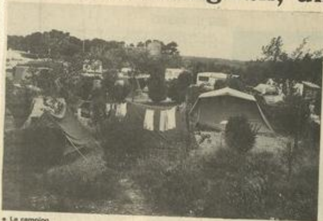
• Le camping