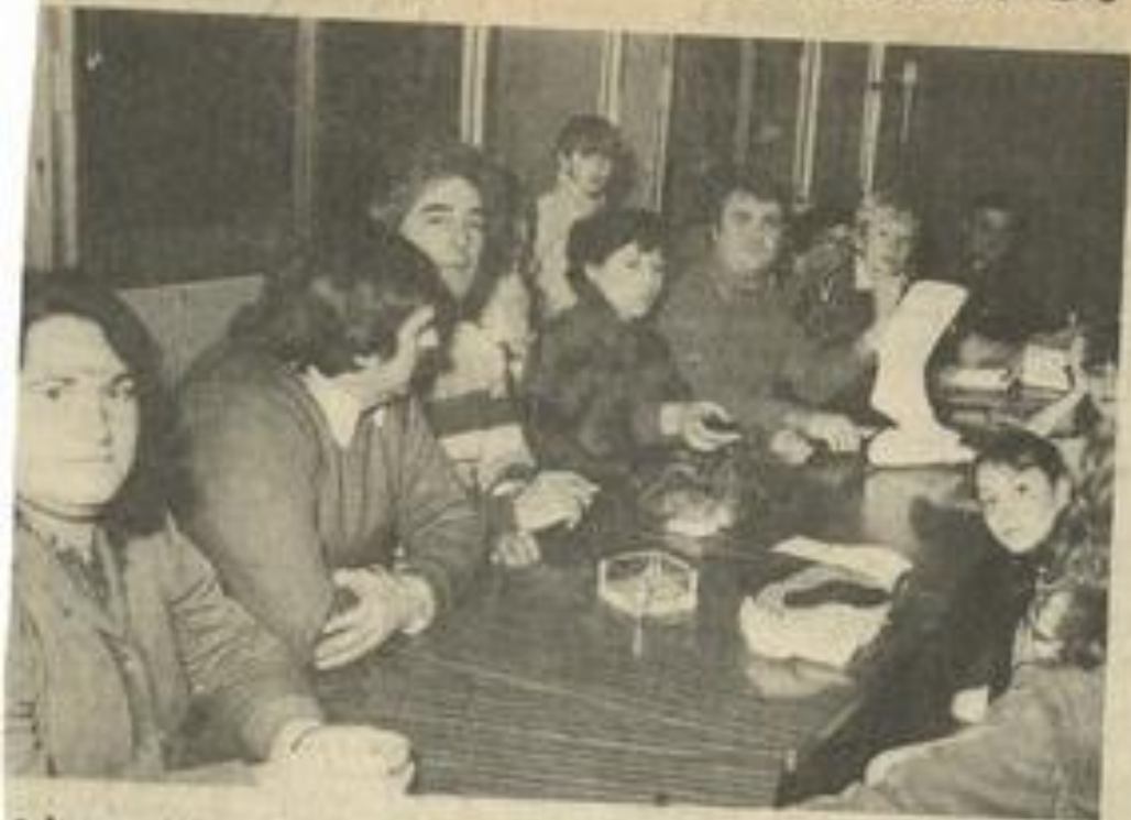
• Au cours de la réunion, le bureau a pris des décisions