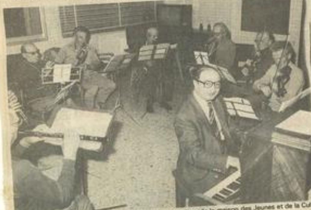
• L'orchestre symphonique de la maison des Jeunes et de la Culture de Lézignan..

partie vocale, fut le "O Jesus Christe" de Van Berchem, un des chefs-d'œuvre de la musique sacrée de la Renaissance, d'une expression musicale toute en grâce, un modèle du genre. Suivit un salut glorieux à Marie "Salve Regina", chant de Mayence en Allemagne. Ce fut encore un magnifique chant de la Renaissance, toujours élé, "C'est l'agneau de Dieu" de Pretorius, d'une sensibilité exquise. Le concert se termina par le majestueux "Te Deum" extrait de l'Oratorio de Saint Sulpice, avec chœur et orchestre, qui fut acclamé par une assistance debout, rendant ainsi un vibrant hommage aux artistes amateurs qui avaient, par cette prestation, apporté leur modeste contribution aux travaux de rénovation de l'église, patrimoine culturel de notre Occitanie. M. le curé de Cesseras remercia en des termes enthousiastes et chaleureux, musiciens, chanteurs et auditeurs, se félicitant que le temps de Noël commence sous le signe de l'union et de la beauté qui illustrent parfaitement cette phrase de l'Evangile sur la fête de Noël "Gloire à Dieu au plus haut des cieux et paix sur terre aux hommes de bonne volonté".