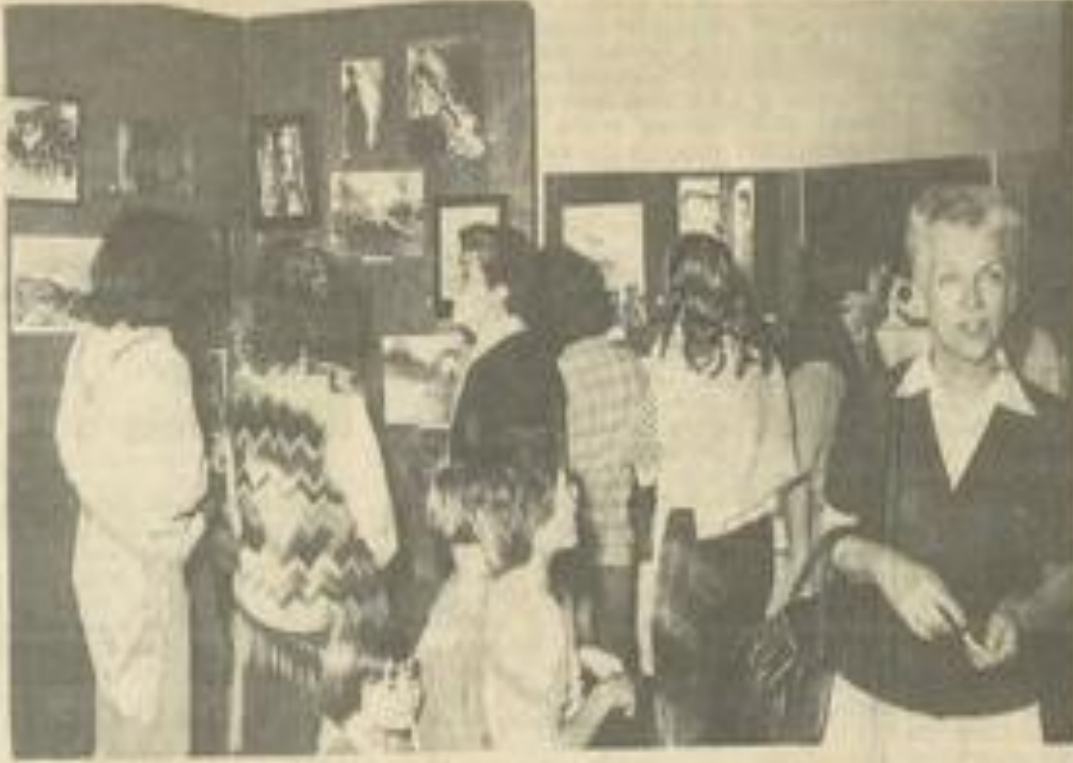
• Des photos d'un grand intérêt.