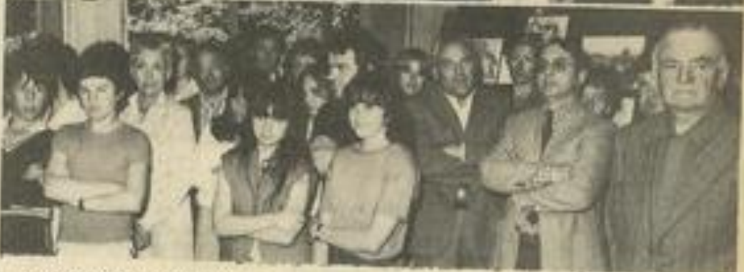
• Le public était nombreux.