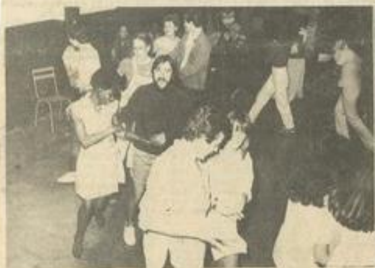
• L'animateur Jimmy mène la danse