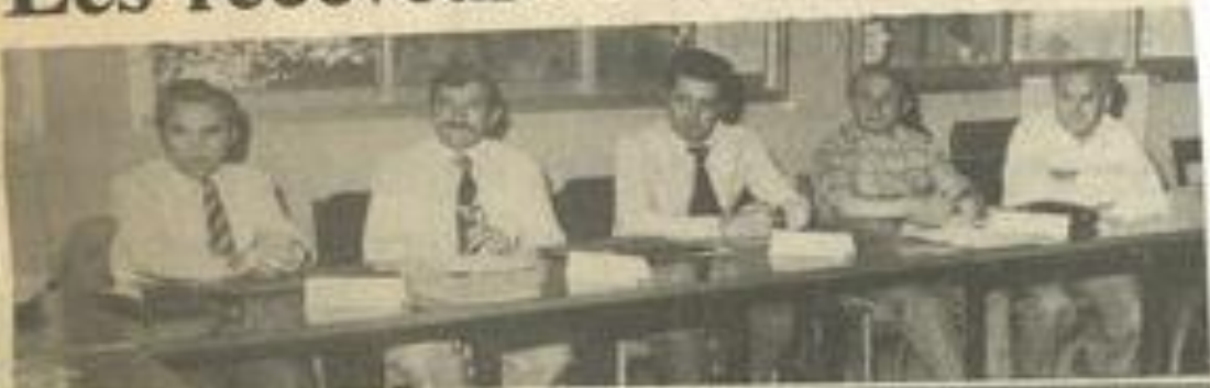
• Les receveurs, dans une salle de la M.J.C.