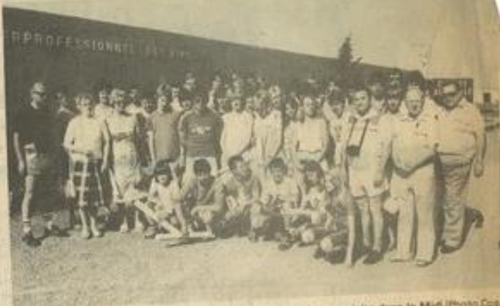
• Les jeunes allemands de Gelnhausen, près de Francfort en visite dans le Midi

Une visite commentée aux établissements Castelnau à Sallèles d'Aude pour la mise en bouteille. Une possibilité de baptême de l'air et de promenade en bateau à voile et bien sûr, une indispensable compétition de natation à la piscine.