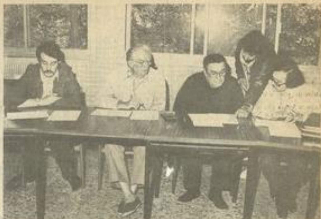
• Le jury de l'examen de solfège