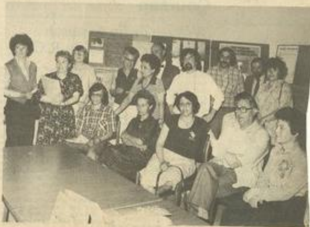
• Les participants à cette réunion.

été envisagé une antenne lézignanaise dépendant du groupe de Narbonne. Les personnes intéressées peuvent prendre toutes informations à la Maison des Jeunes et de la Culture.