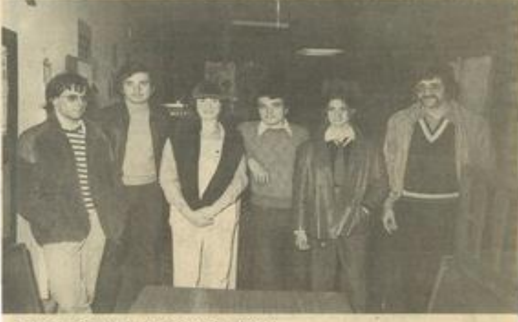
• Les six Lézignanais de retour sur leur terre.