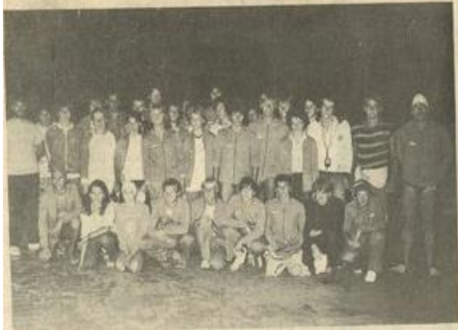
• L'équipe de natation de Geinhausen