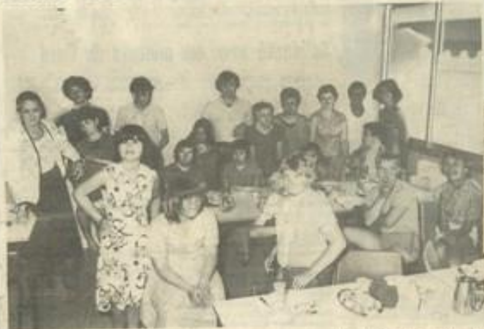
• Le groupe de Bourgoïn se plaît beaucoup à Lézignan.