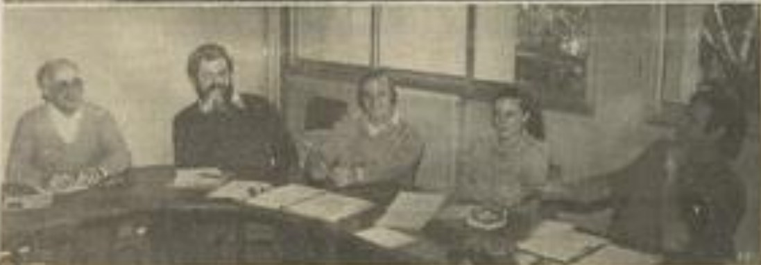
• Les directeurs de M.J.C. réunis rue Marat.