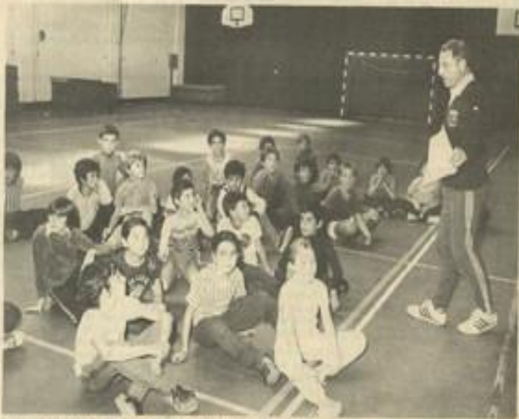
• Le gymnase : très utilisé par les jeunes notamment