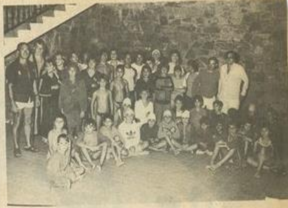
• L'équipe de natation de Lézignan