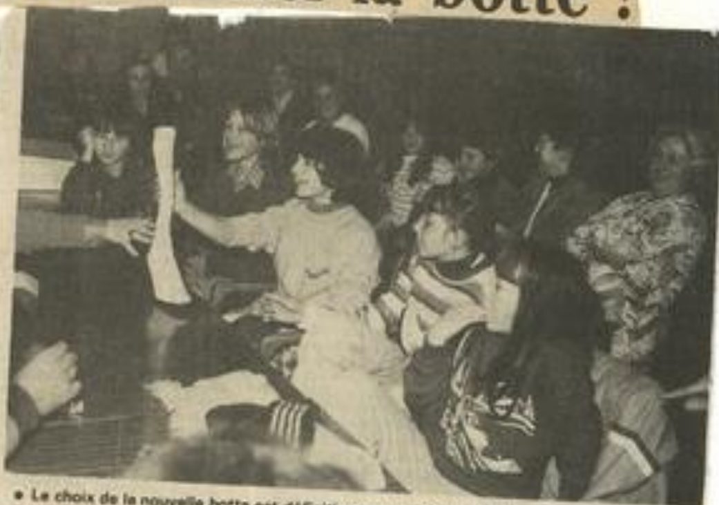
• Le choix de la nouvelle botte est définitivement arrêté. La voici.