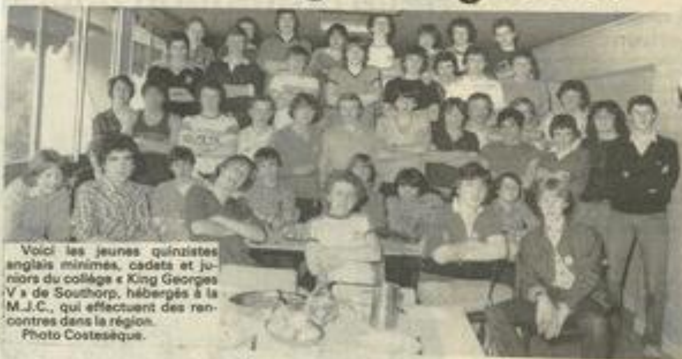
Voici les jeunes quinzistes anglais minimes, cadets et juniors du collège « King Georges V » de Southorp, hébergés à la M.J.C., qui effectuent des rencontres dans la région.