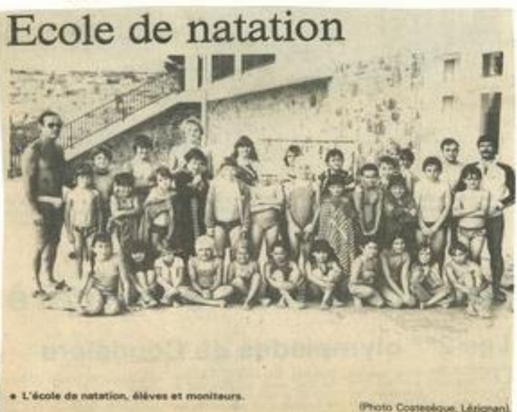
• L'école de natation, élèves et moniteurs.