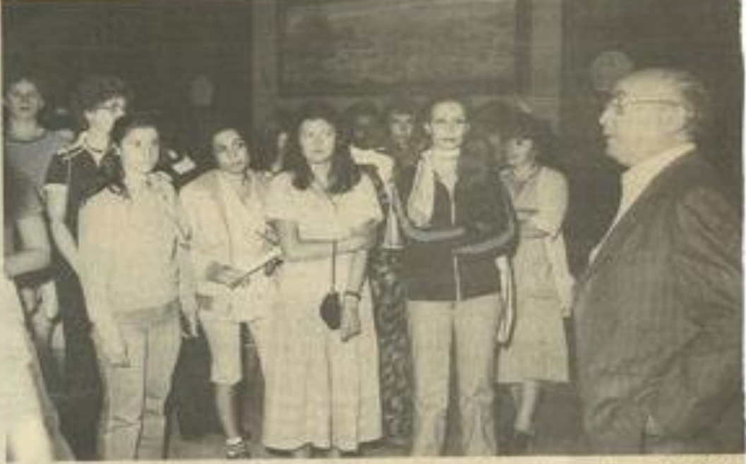
• Les stagiaires et les conseillers de séjour.