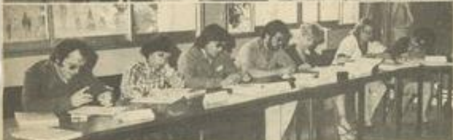
• Les participants de l'Aude et des P.-O.