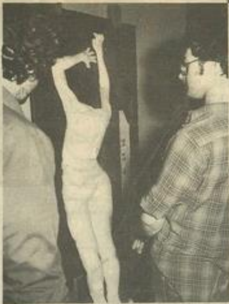
• Une sculpture.