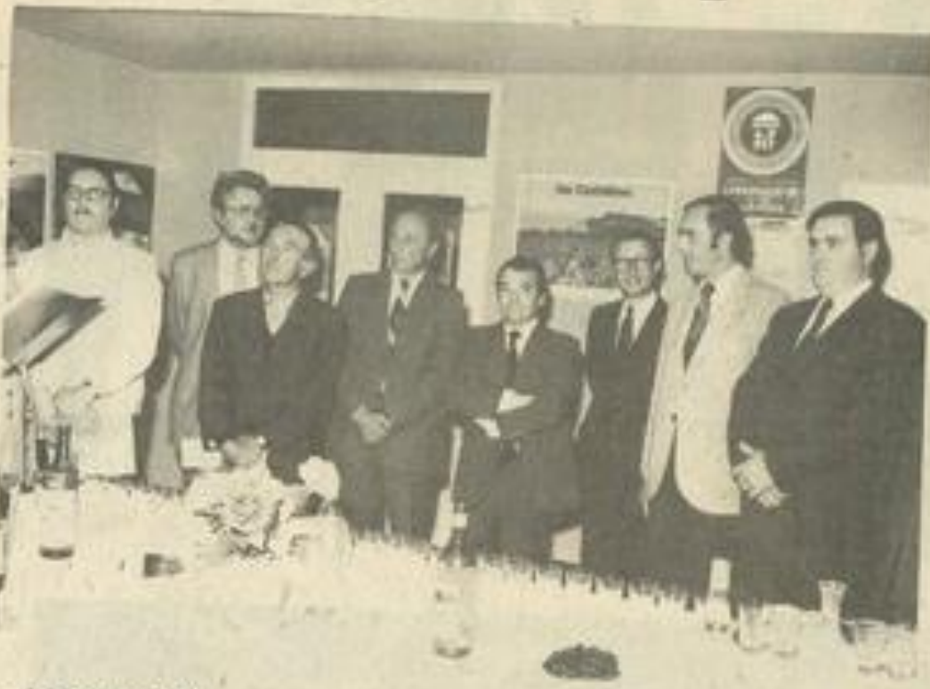
• Les personnalités.