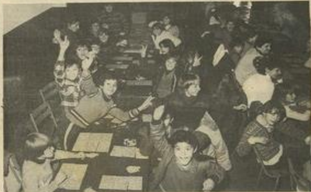
• Une très nombreuse participation à cet après-midi amical des jeunes de la M.J.C.