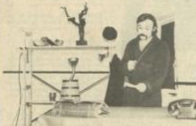
● Un moment de la pièce.