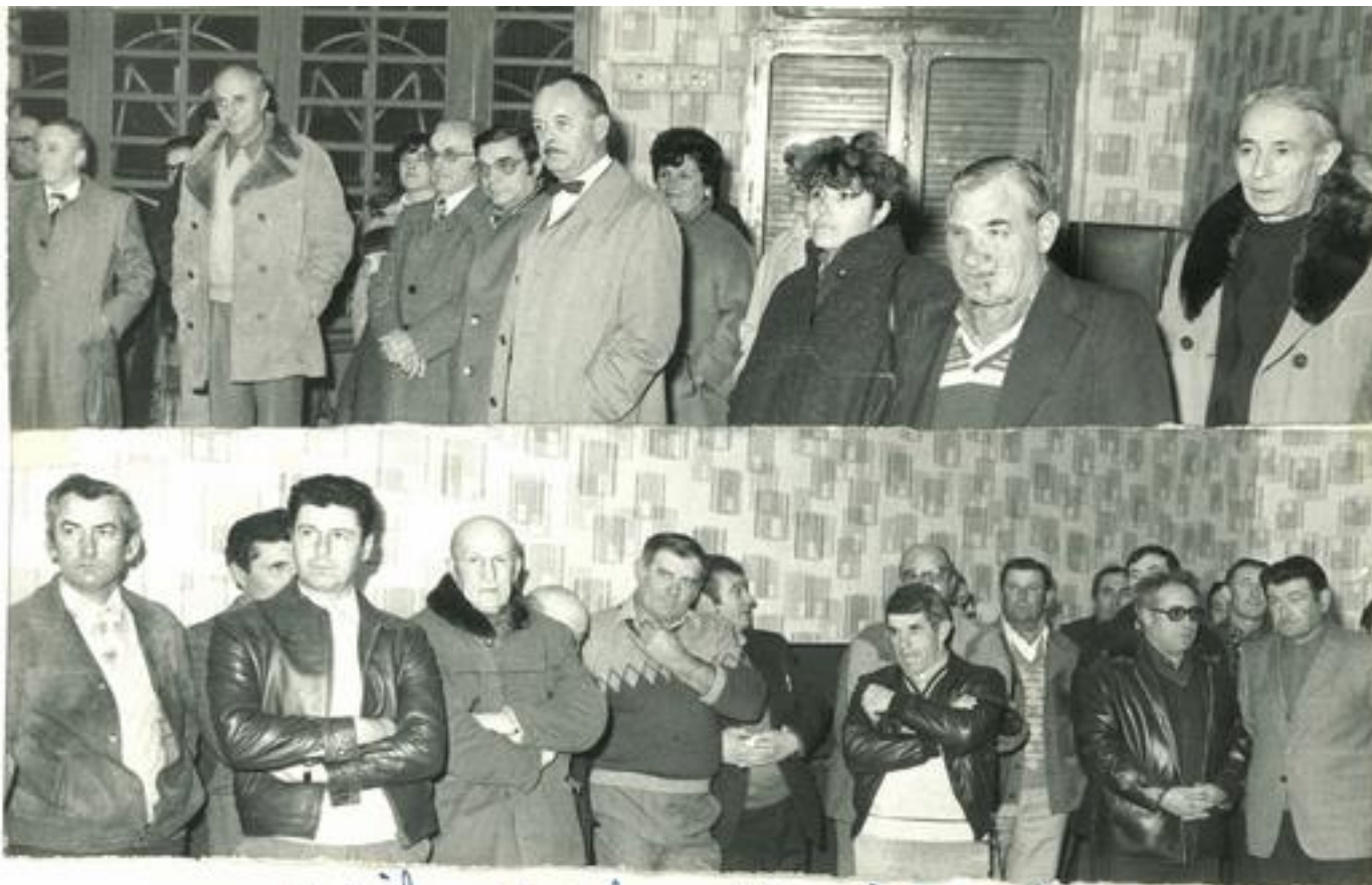
Médaille agricole MJC catholique pers. 26.11.79

SIX ANIMATEURS ITALIENS LE 3 DECEMBRE A LEZIGNAN Une délégation de six animateurs d'Argenta arrivera à Léznan le lundi 3 décembre à 2 h du matin. Ils resteront chez nous une dizaine de jours et aborderont tous les problèmes concernant les sports, la culture et la jeunesse.