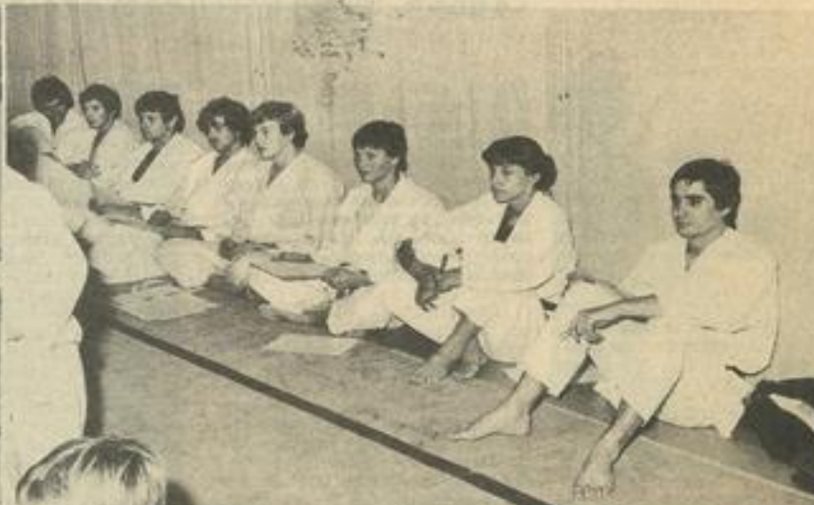
• Les plus jeunes à l'œuvre.