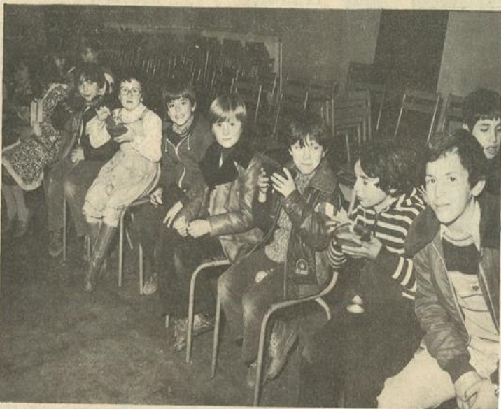
• ... Les autres boivent.