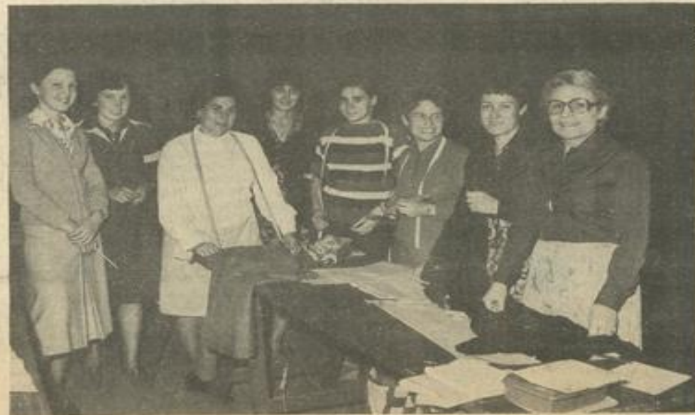
• Au travail...