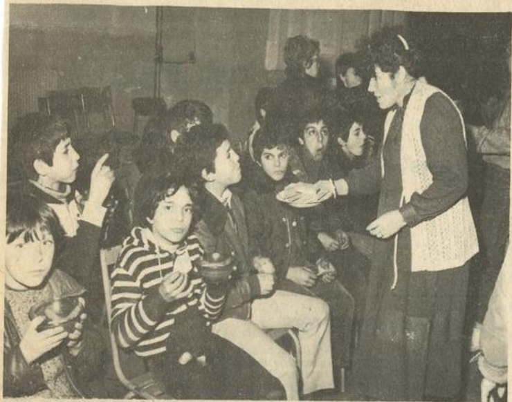
• Les uns mangent...