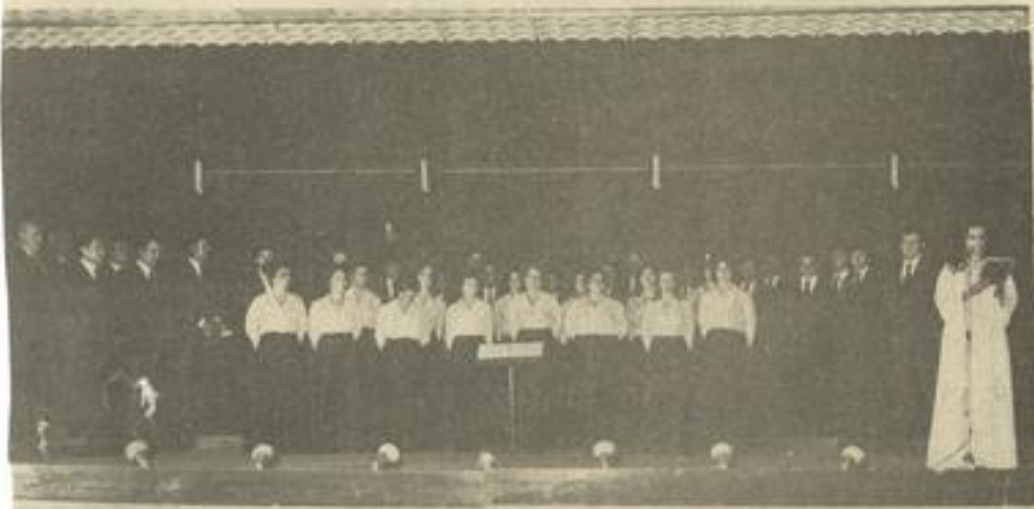
• Une vue d'ensemble de la chorale d'Argenta.