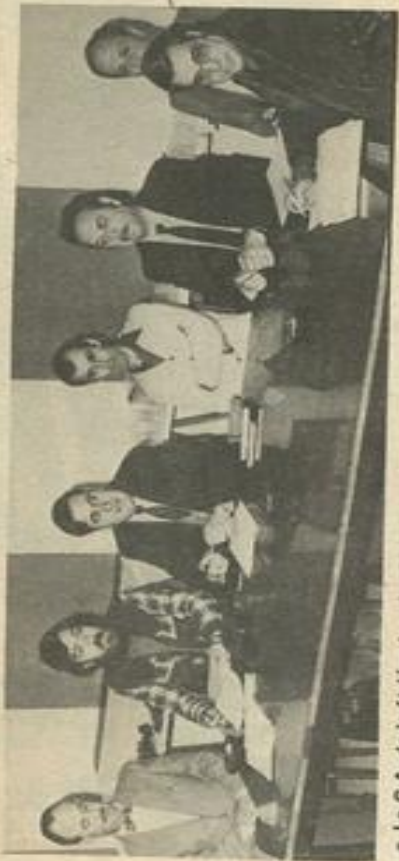
• Le C.A. de la fédération des M.J.C. était rassemblé à Durban.