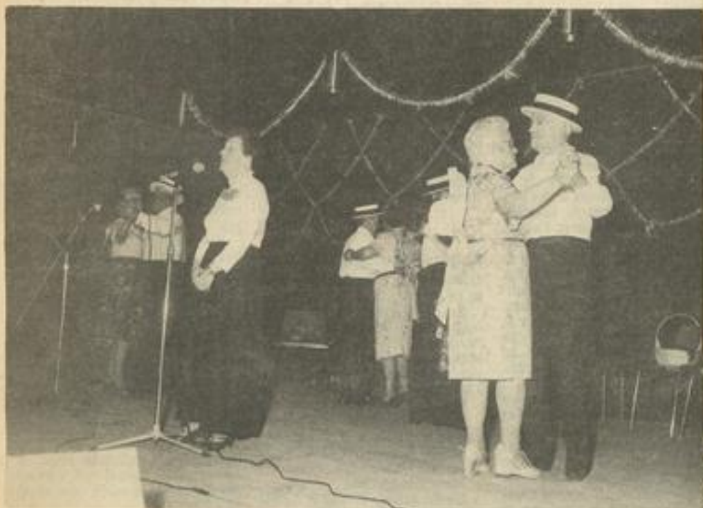
• Valse d'autrefois.