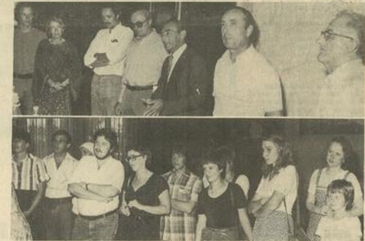
• En haut, la réception à la mairie ; en bas, vue d'ensemble.