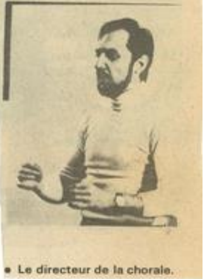
• Le directeur de la chorale.