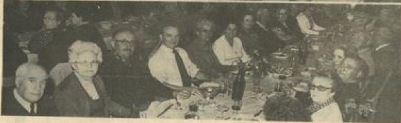
• Deux vues des convives au cours du repas.