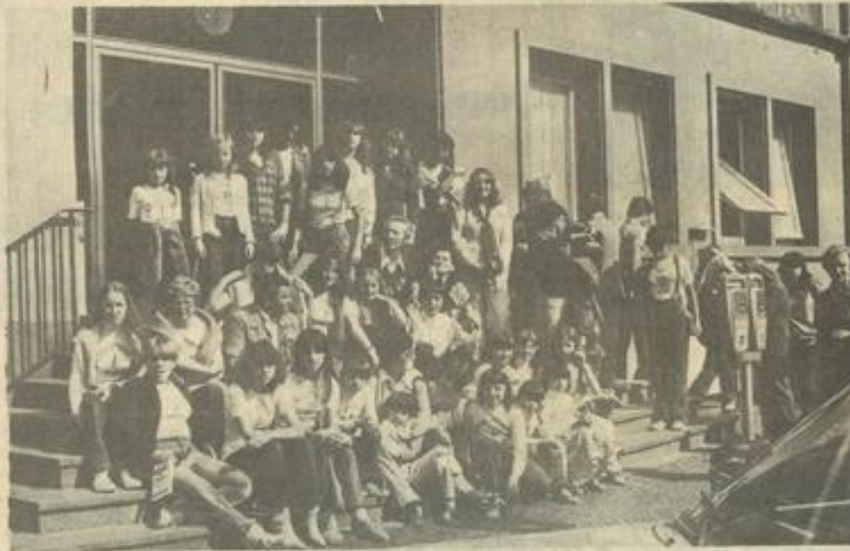
• Le groupe devant la mairie de Lauterbach.