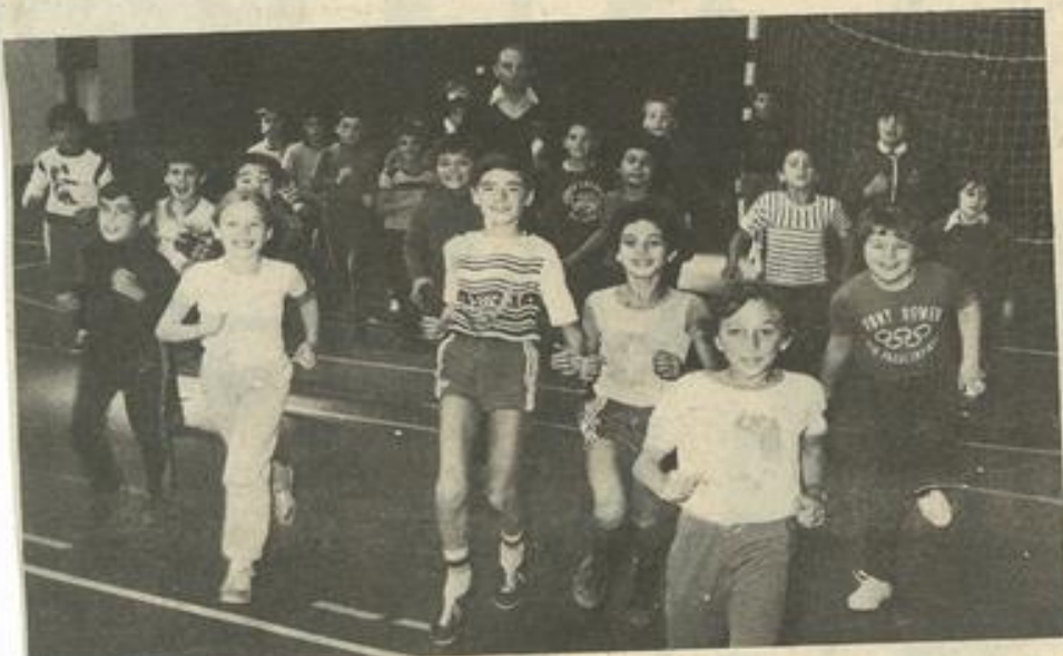
• On sautille