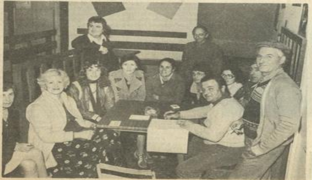
• Pendant la réunion des majorettes M.J.C.