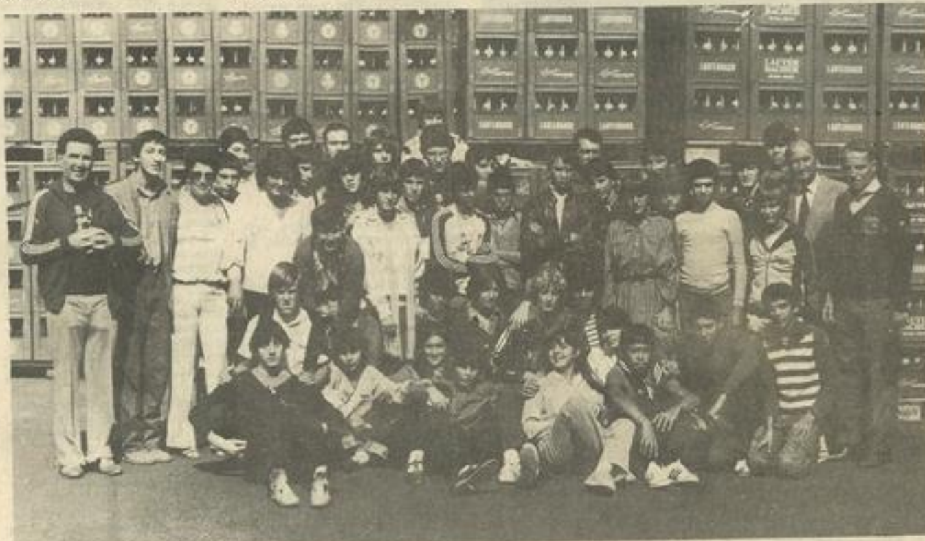
• Le groupe des Lézignanais à Lauterbach.