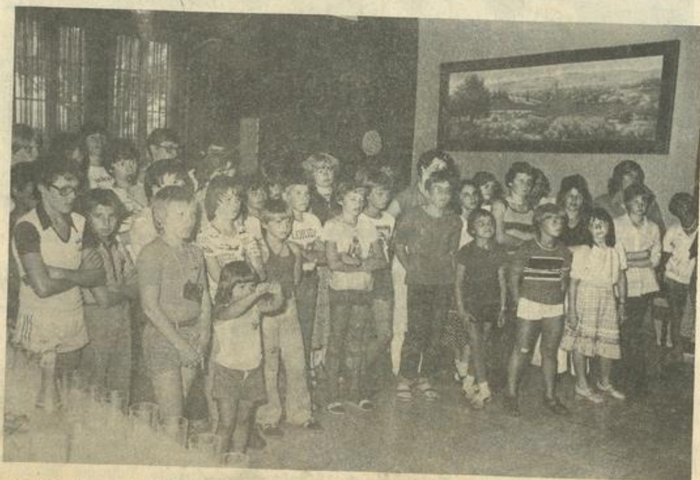
• Vue d'ensemble des jeunes nageurs lézignanais et allemands