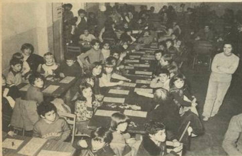
• Les nombreux rifleurs de la Maison des Jeunes.