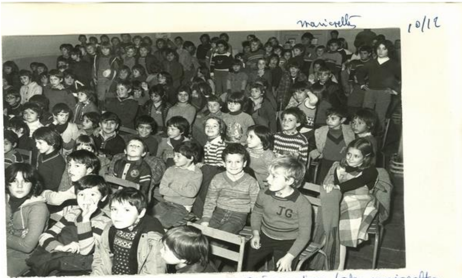
préparation loto maiorettes