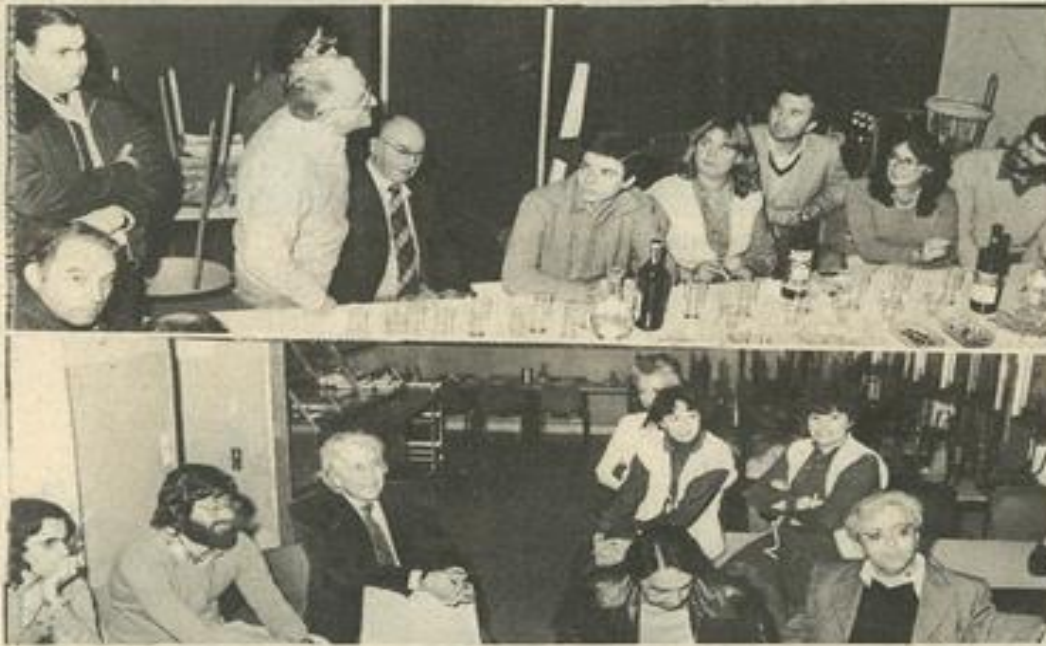
• Un accueil sympathique