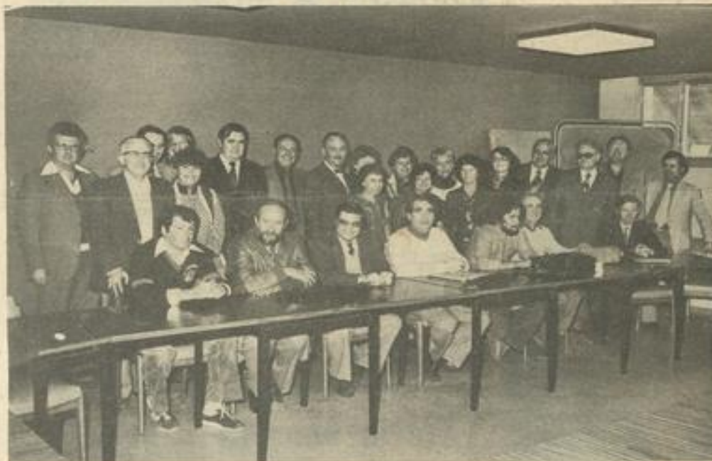
• Vue d'ensemble des participants.