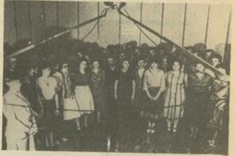
• Les choristes d'Argenta au cours de l'enregistrement de leur tout dernier morceau.

Nous comptons sur vous pour la rencontre avec les amis Italiens ce soir 15 septembre à 21 h au Palais des Fêtes.