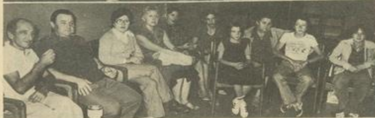
• Deux vues d'ensemble des participants.