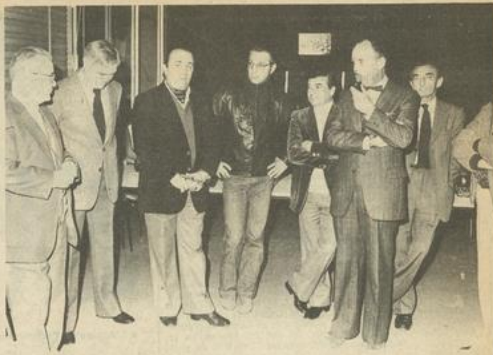
• Une partie des personnes présentes.