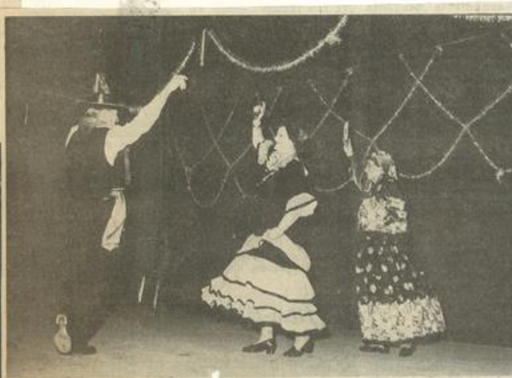
• Danses espagnoles.