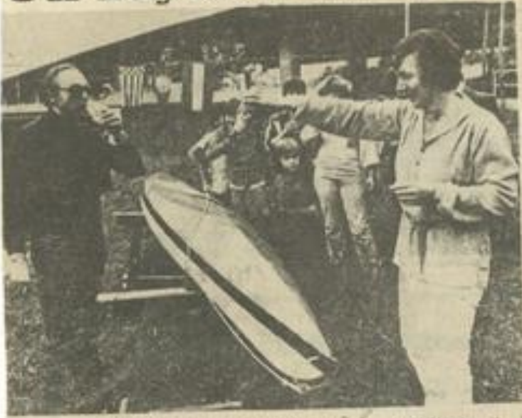
Der erste Kajak trägt den Namen „Lézignan“