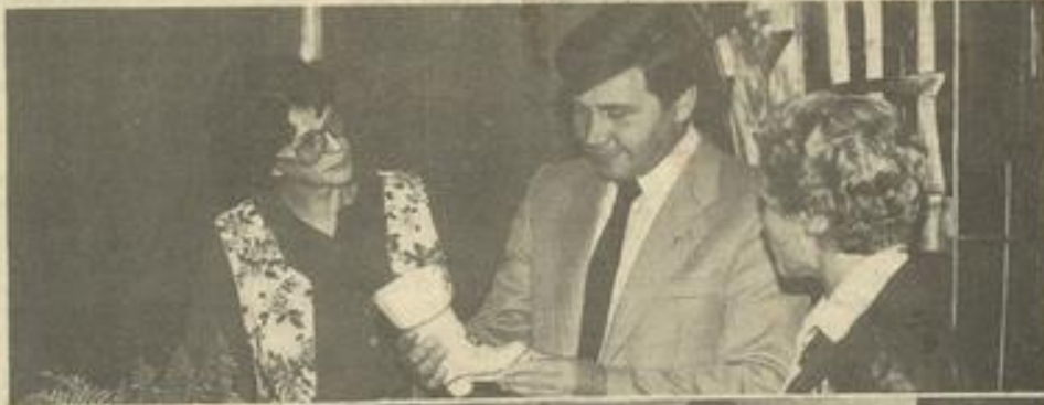
• Au cours de la réception.