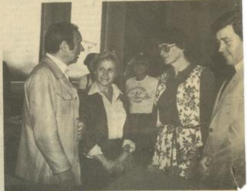
• Le premier magistrat de Lauterbach adresse des compliments à Mm du bataillon de majorettes.