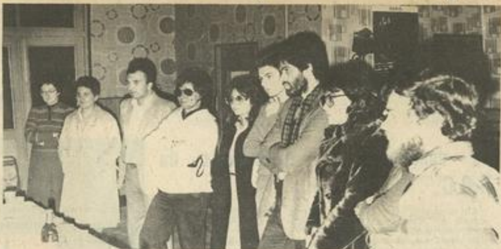
• Les membres de la délégation italienne et les animateurs M.J.C.