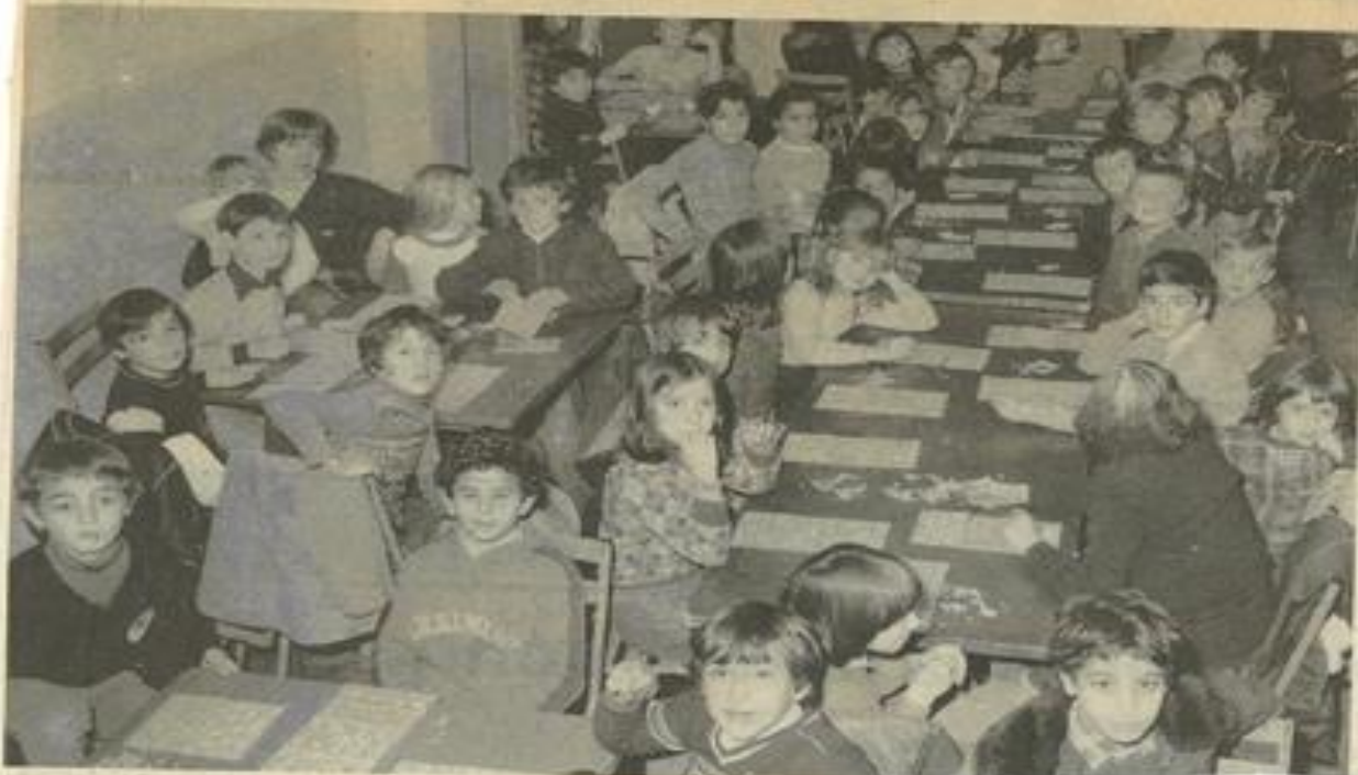
Grâce à la M.J.C. les jeunes lézignans ont eu si leur loto. Ce dernier organisé mercredi par la Maison des Jeunes a obtenu un très gros succès, groupant 200 enfants. Ces derniers se retrouveront mercredi aux mêmes lieux pour un goûter.