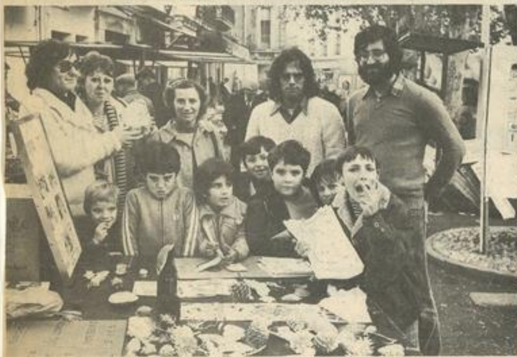
Le stand des animateurs sur le champ de foire.