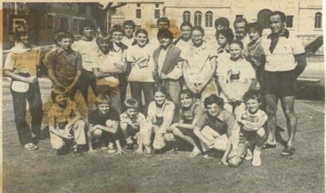
• A l'heure du départ.