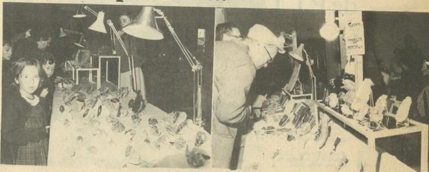
● Les jeunes étaient eux aussi intéressés par toutes ces belles pierres.