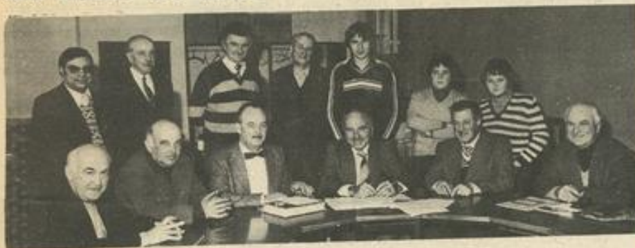
● La section philatélie M.J.C.