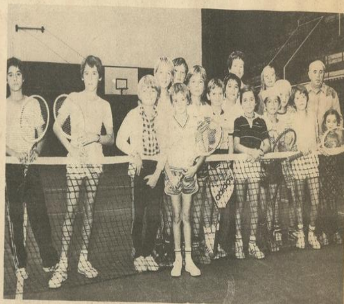
• Quelques-uns des participants au tournoi qui a débuté samedi