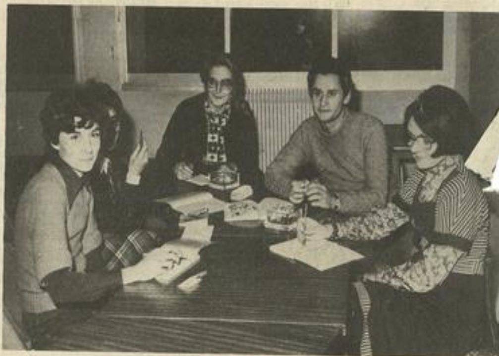
• La première répétition du groupe Théâtre.