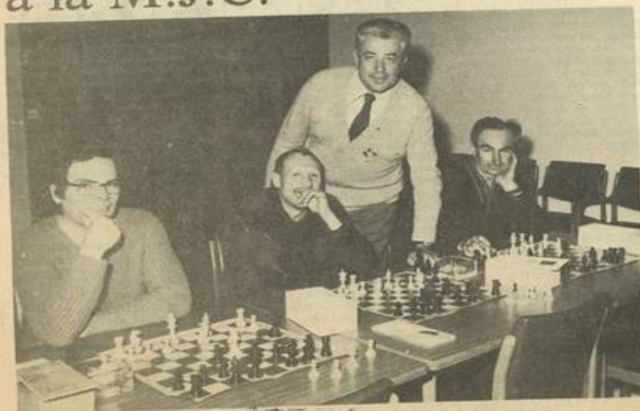
• Quelques-uns des participants