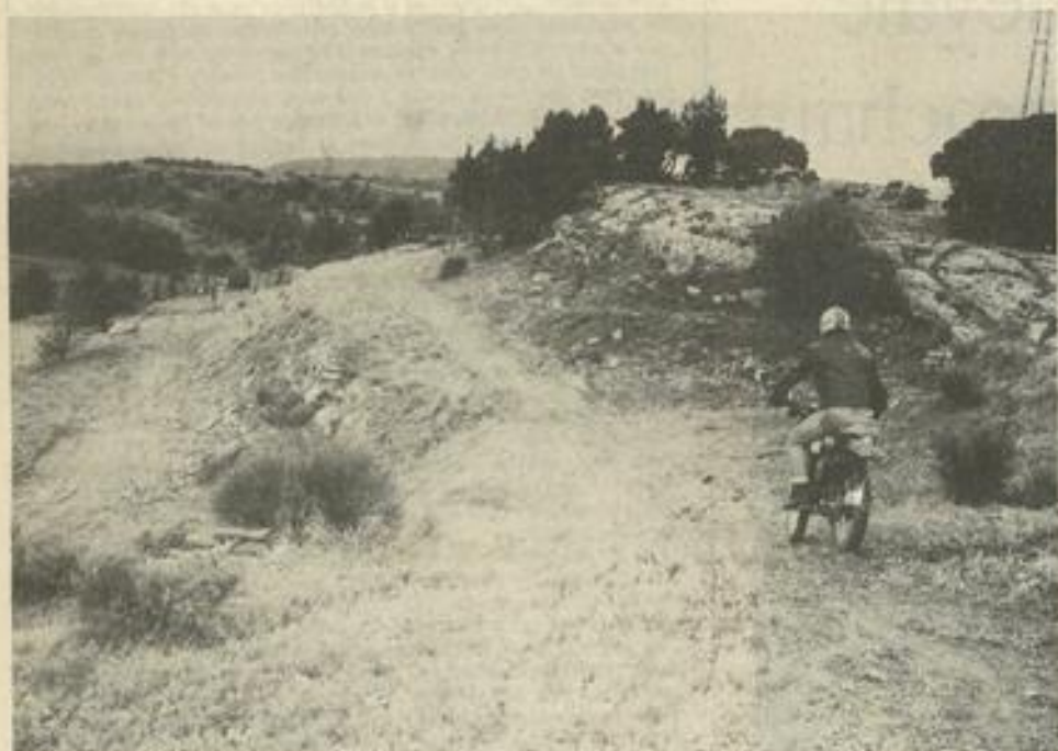
• Au lieu dit "La Roque de Barrau" un circuit idéal pour nos trialistes de la section cross à proximité du Ball-trap.

Il y a déjà deux ans, le Trial club de la M.J.C. se porte bien, avec près de quarante membres dont vingt Lézignanais à part entière (les autres venant des villages des Corbières et du Minervois).