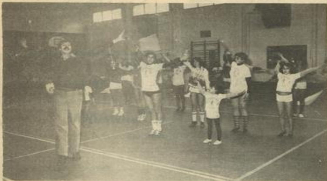
• La leçon.