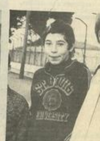
• Frédéric Barreda..

venir encourager les athlètes. L'entrée est gratuite.