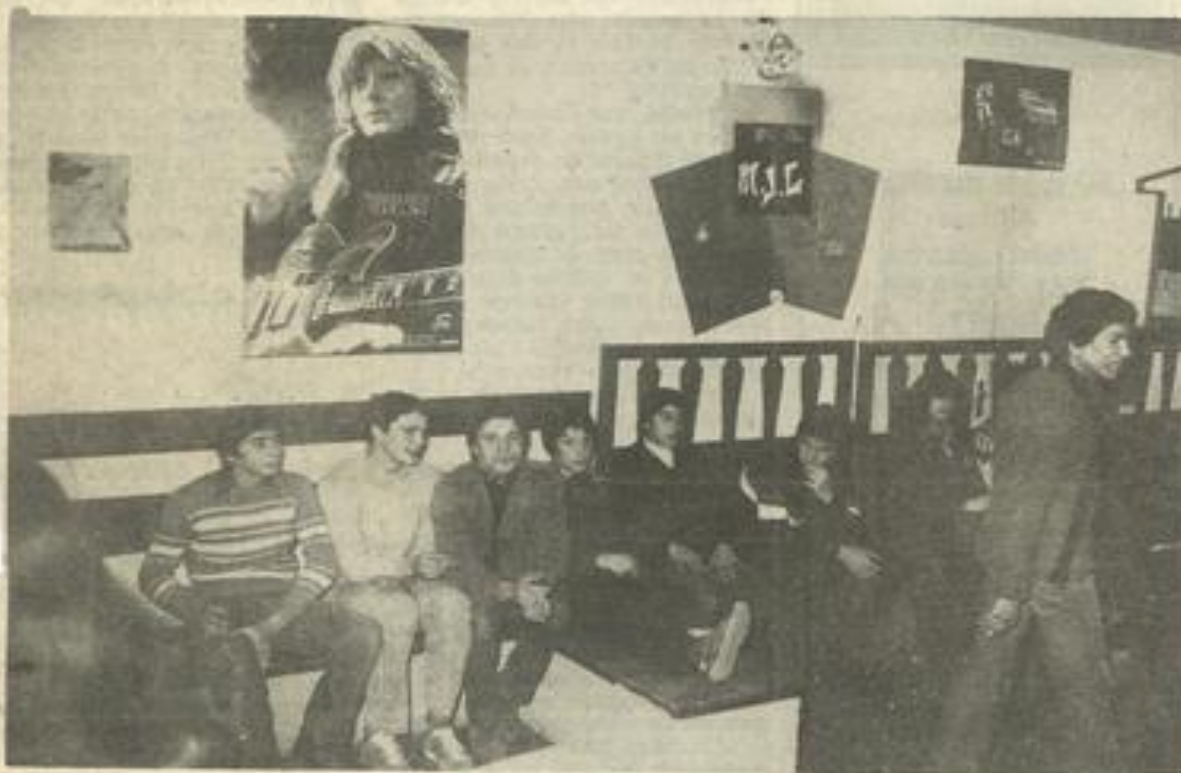
• On attend patiemment le moment de déguster les savoureuses pâtisseries.