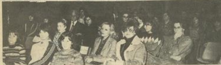
• Deux vues d'ensemble du public.