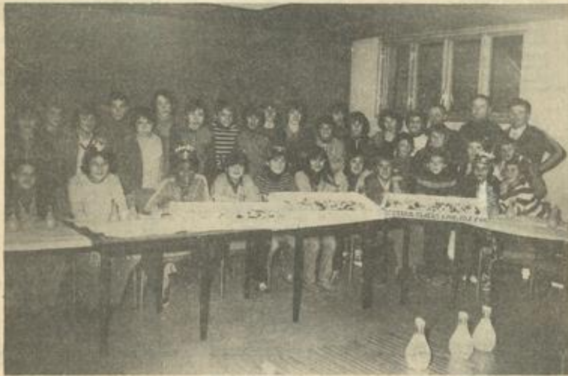
● A la J.S.L.