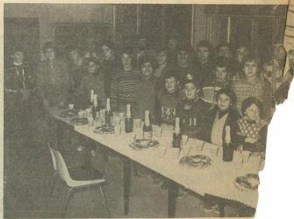
● Au F.C. Corbières