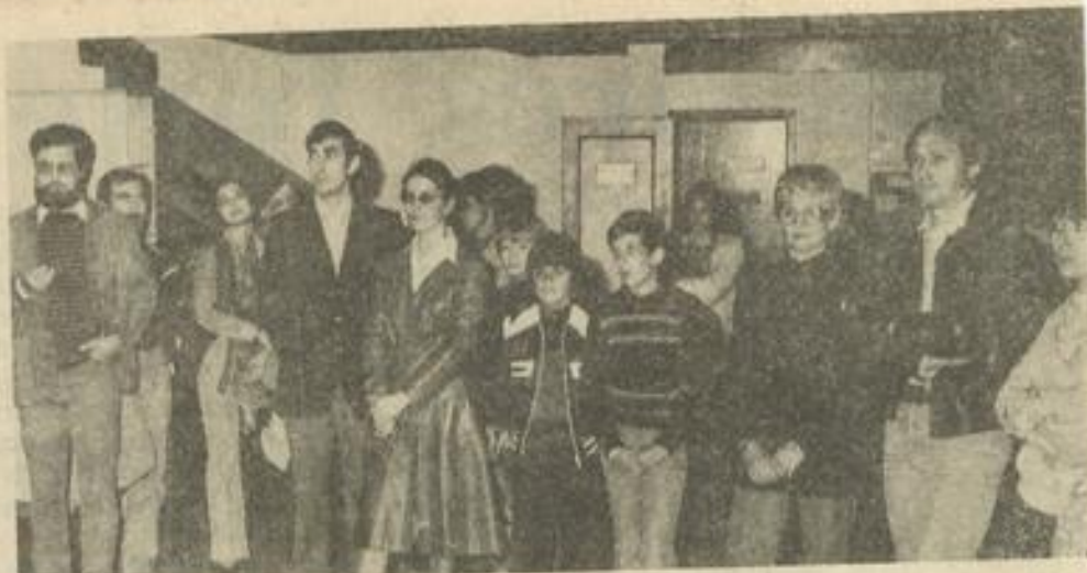
● Coup d'œil sur la manifestation