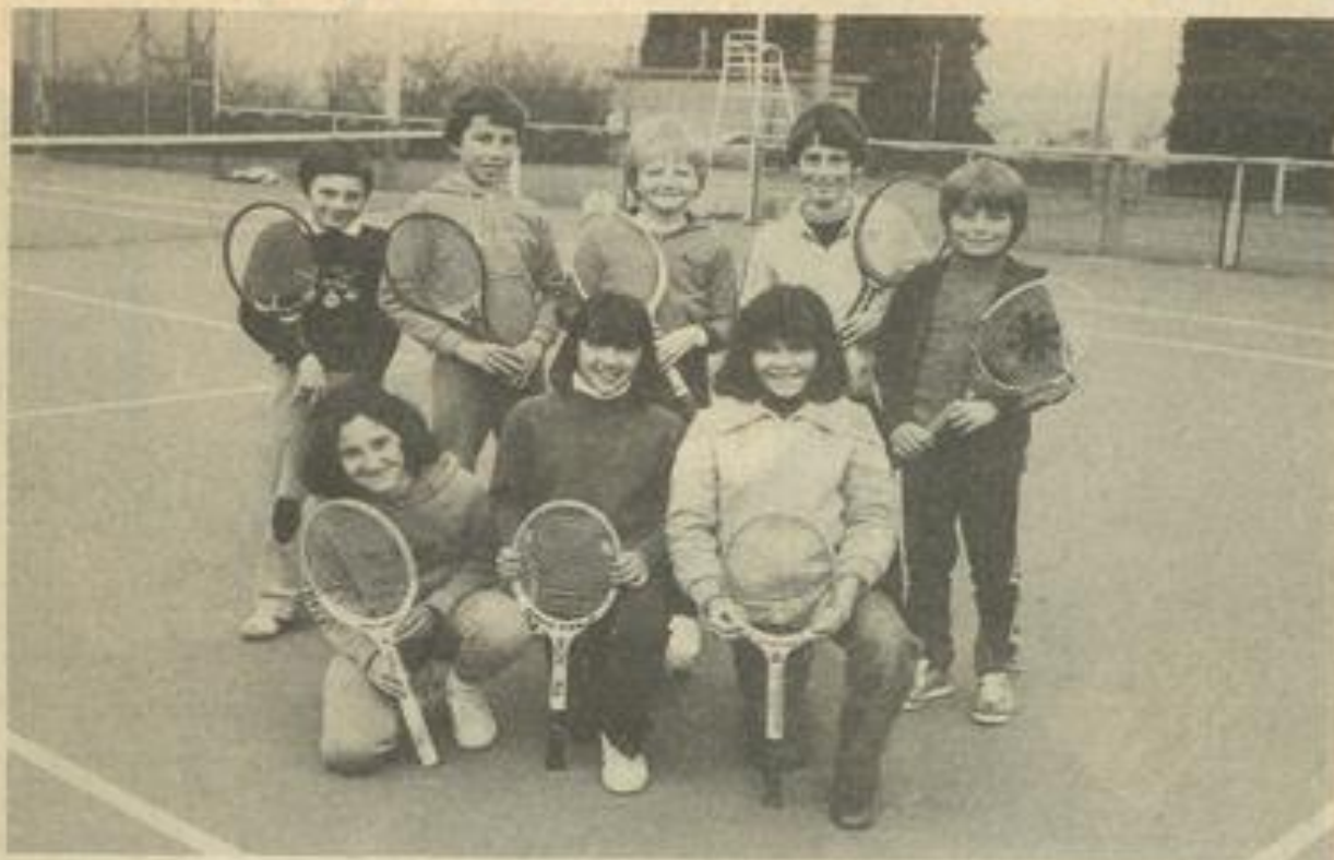
• Les équipes minimales filles et garçons.