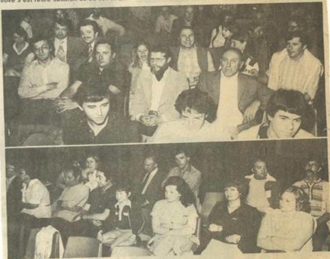
• Vue d'ensemble du public.