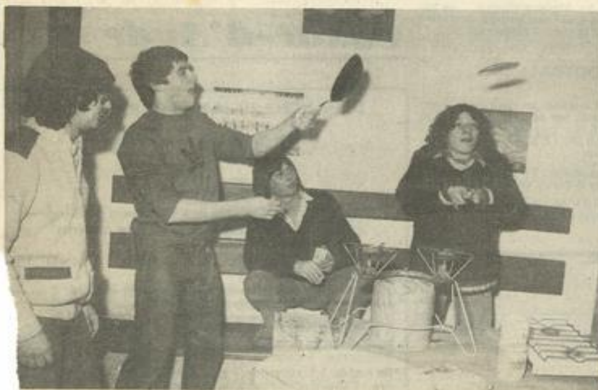
Les jeunes s'exercent à faire sauter les crêpes.