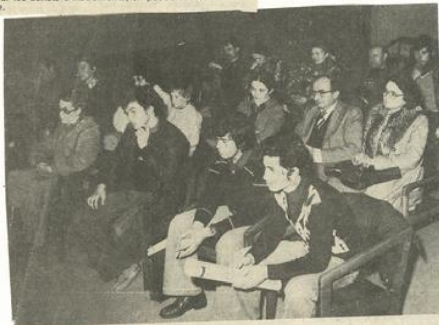
Une vue d'ensemble des participants.

Séance particulièrement fructueuse sur laquelle se penche avec bienveillance la municipalité pour presque une centaine d'élèves dont le programme 79-80 sera mis au point dès la rentrée.