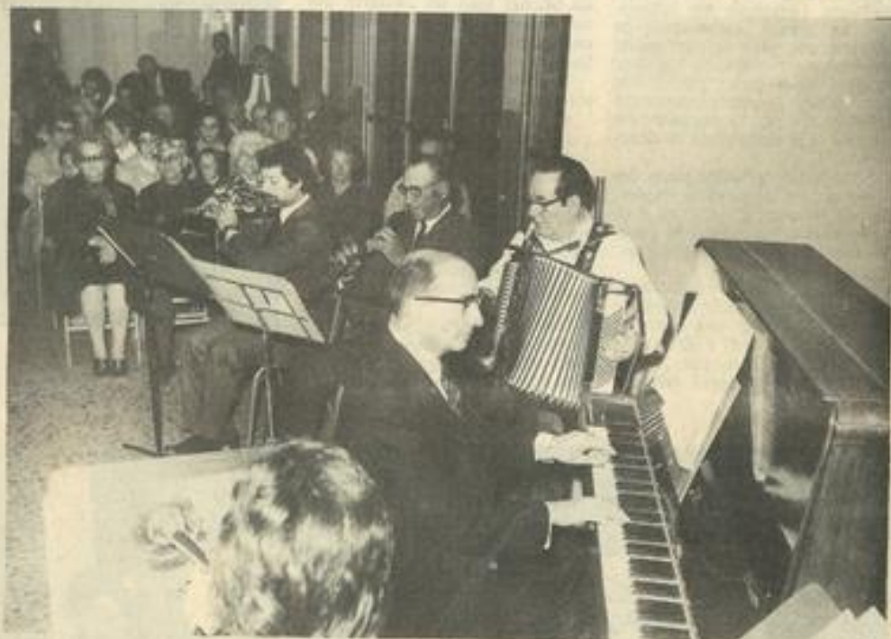
• Vue d'ensemble avec l'orchestre au premier plan.