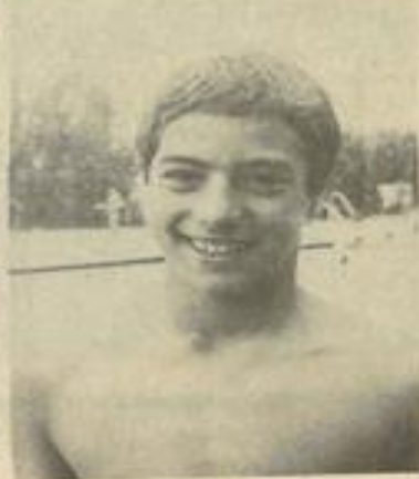
• Franck Deleigne (Photos Costesèque)