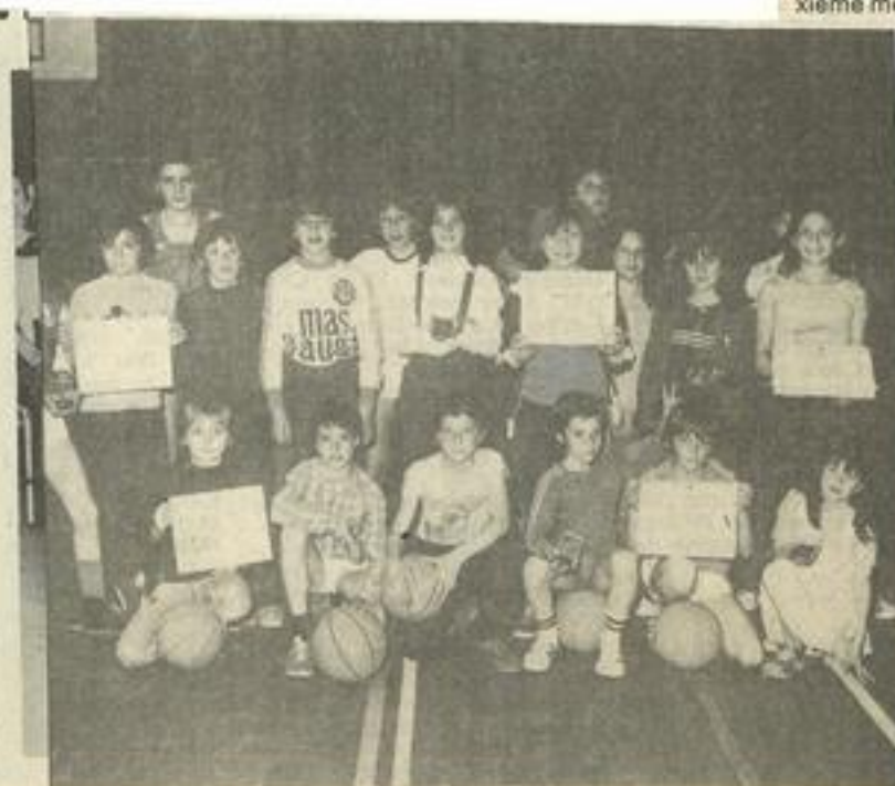
présentant leurs récompenses.