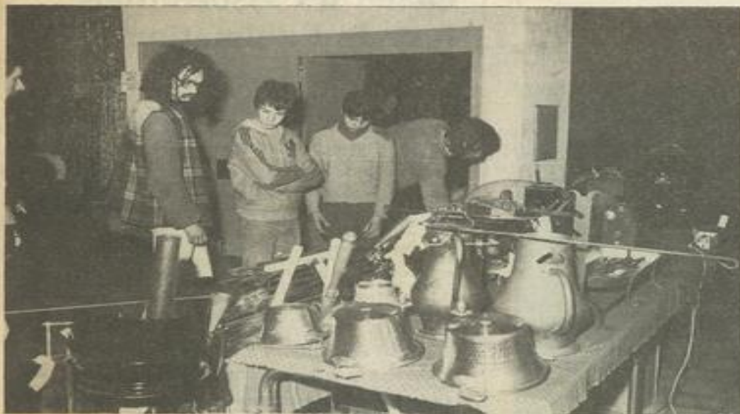
• Un stand parmi tant d'autres.