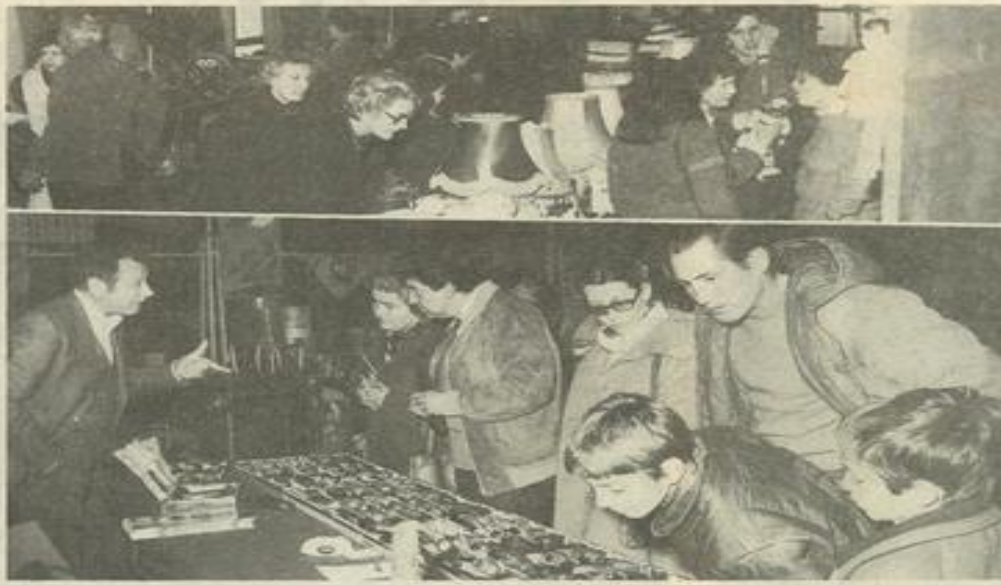
• En parcourant les stands.