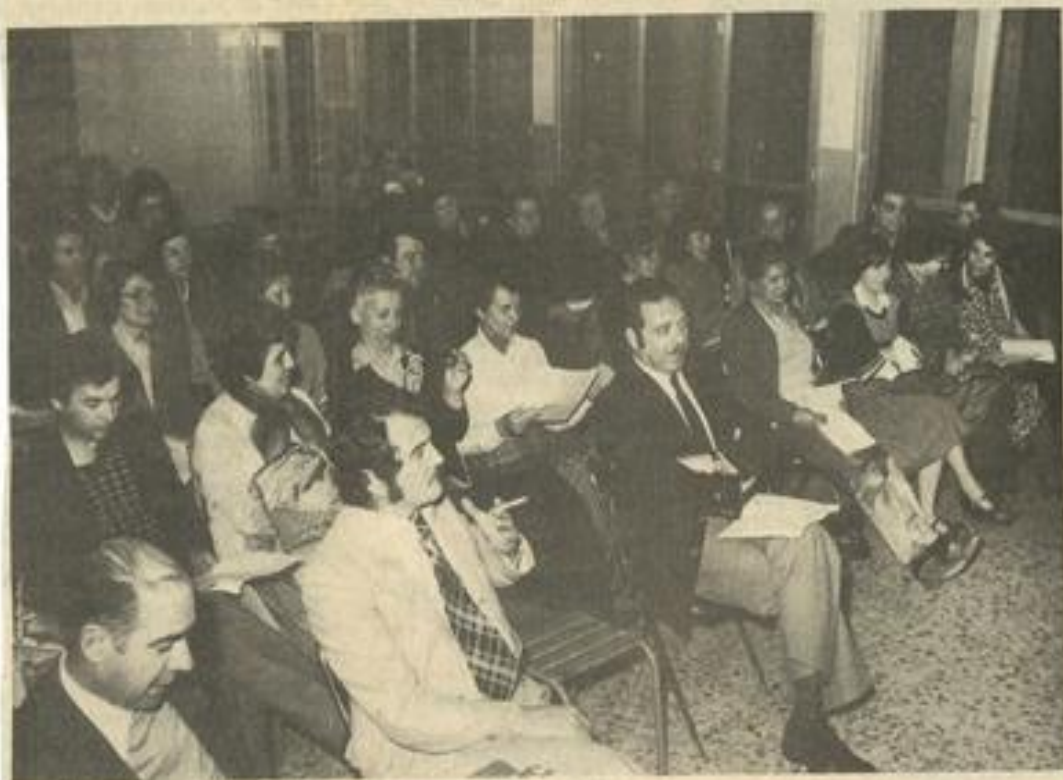
• Une vue d'ensemble des participants.