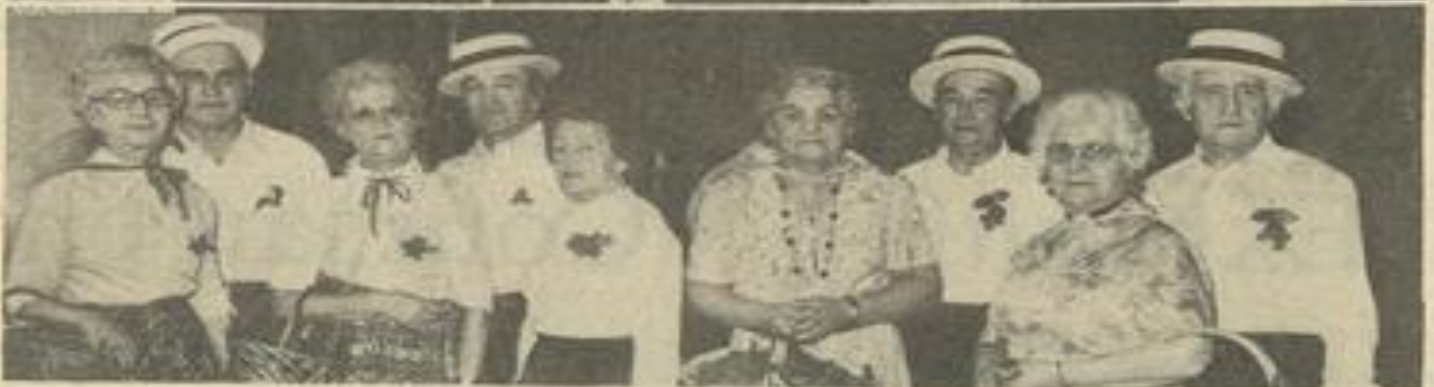
• Les vedettes : en bas comme à vingt ans...!