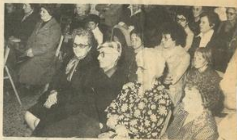
• Vue d'ensemble des spectateurs.

Une excellente soirée entre amis pour les amoureux de la musique et du chant.