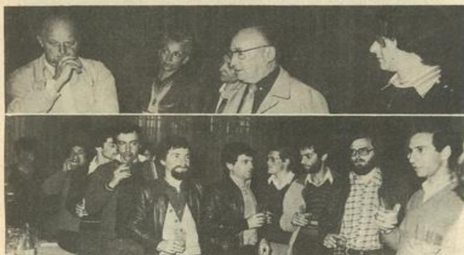
• Au cours de la réception