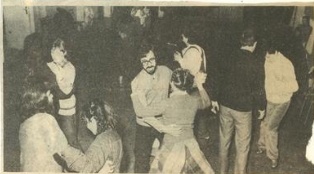
• Danses d'autrefois

Il faut dire que les athlètes boudent moins les entraînements, car participeront aux compétitions et aux stages les plus assidus. D'autre part on pense déjà au déplacement du mois d'août à Lauterbach chez