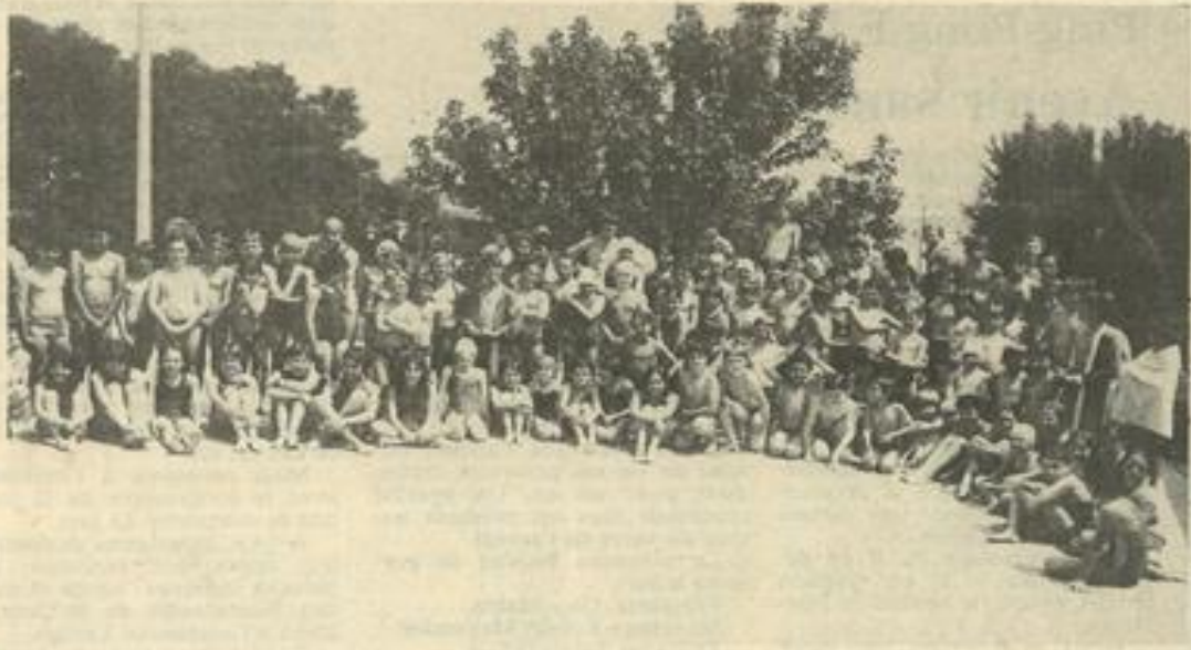
• Les participants.