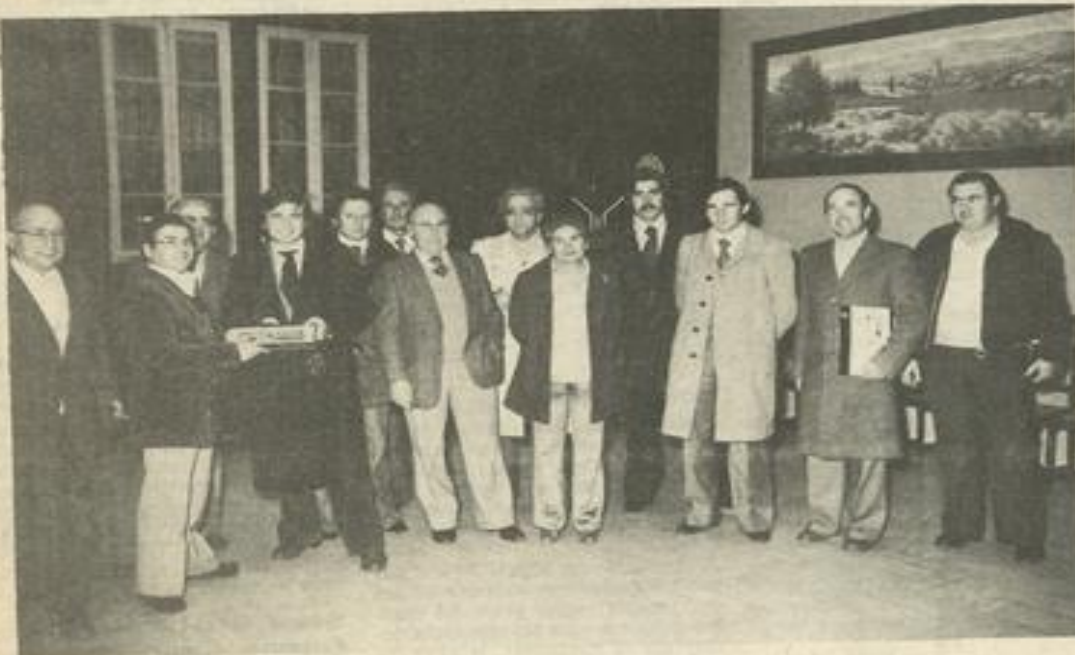
• Au cours de la réception officielle à la mairie

Première délégation à venir après l'échange culturel, nos amis italiens d'Argenta ont marqué toute leur satisfaction de voir le processus d'échanges définitivement engagés.