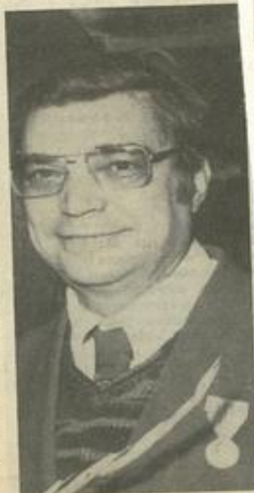
Lézignan, capitale des Corbières se soit de retrouver une section des Amis des Arts des plus dynamiques. Pour cela nous faisons confiance à tous ceux qui veulent nous rejoindre. Rendez-vous donc pour un premier temps au vernissage de l'exposition qui aura lieu jeudi 18 janvier à 18 h 30 au Palais des Fêtes.

Ce premier salon sera suivi d'autres, soit au Palais des Fêtes, soit à la M.J.C. Désirant vulgariser les arts plastiques nous accorderont une chance à de jeunes peintres ou sculpteurs. Nous délivrerons des diplômes d'encouragement. Nous reprendrons aussi nos concours de dessins avec le concours de la direction départementale de la jeunesse et des sports et des loisirs et des fédérations des M.J.C. Nous avons été dans ce domaine des précurseurs car il y a plus de deux décennies que nous avons organisés des concours départementaux et régionaux. Des jeunes ont obtenus de belles bourses de la jeunesse et des sports. Un atelier pour ceux qui sont libres dans la journée, et une école de dessin, sont également envisageable... d'autant plus que la municipalité a en projet pour l'an prochain une école de dessin et de peinture. Pour toutes ces réalisations il faut trouver des personnes disponibles. L'an prochain, si Dieu me prête vie, j'aurais tout le temps nécessaire pour m'occuper de ces projets.