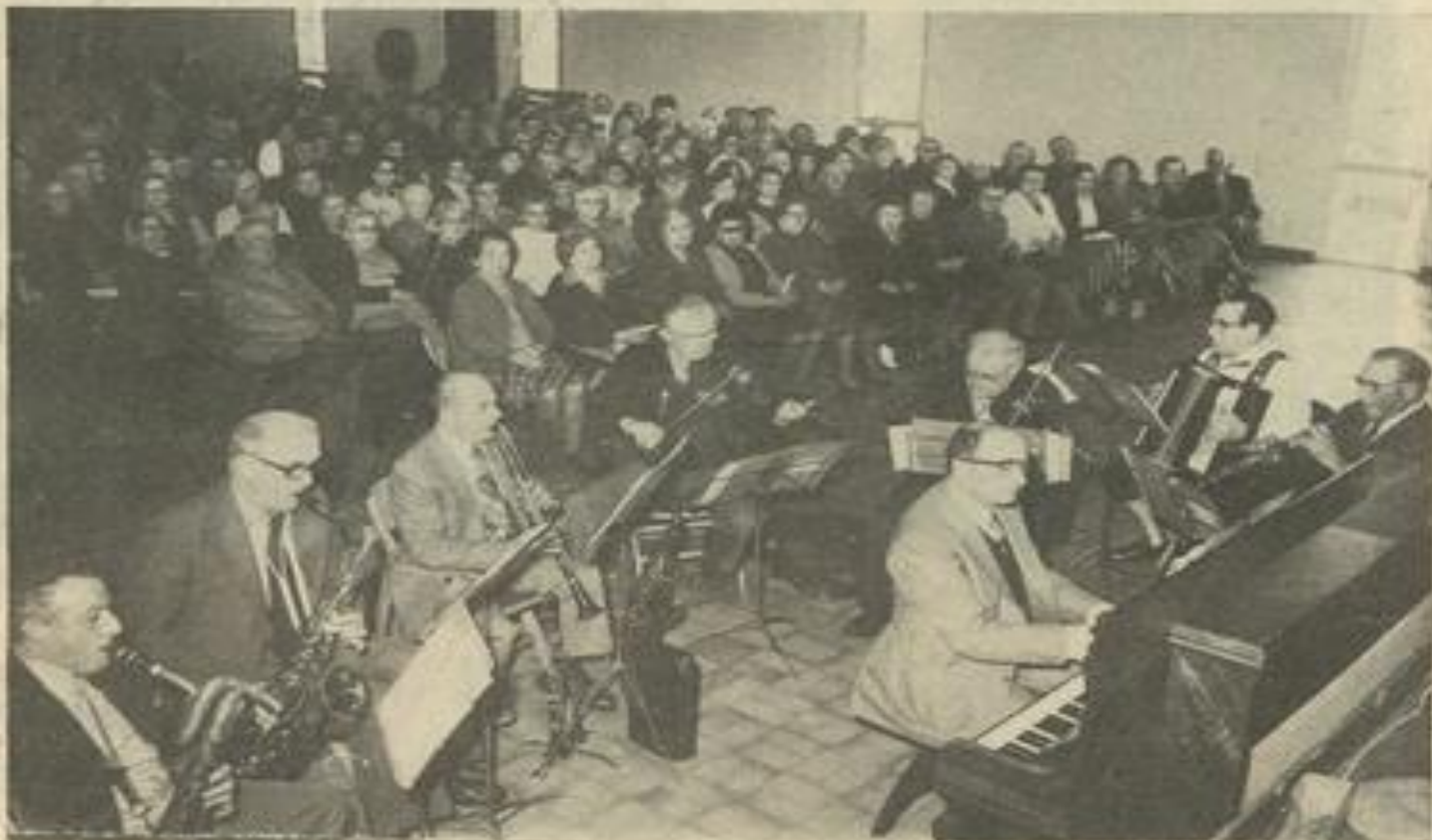
• Au premier plan, l'orchestre de la M.J.C.

Le célèbre quadrille des Lanciers recueillit ensuite le suffrage unanime de la foule en délire et la chorale du Foyer 3 e âge, puis l'orchestre de la M.J.C., mirent un magistral point final à cet artistique après-midi d'évasion où les personnes âgées retrouvèrent la "flamme" enthousiasmante du printemps de leur vie !