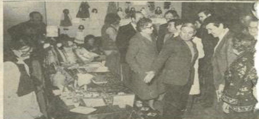
• Les personnalités : en bas, une vue d'ensemble au cours de l'inauguration.