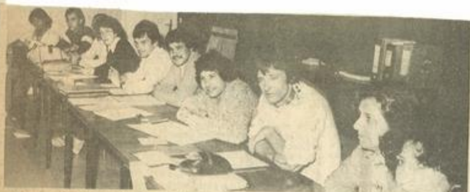
Deux vues d'ensemble des participants.