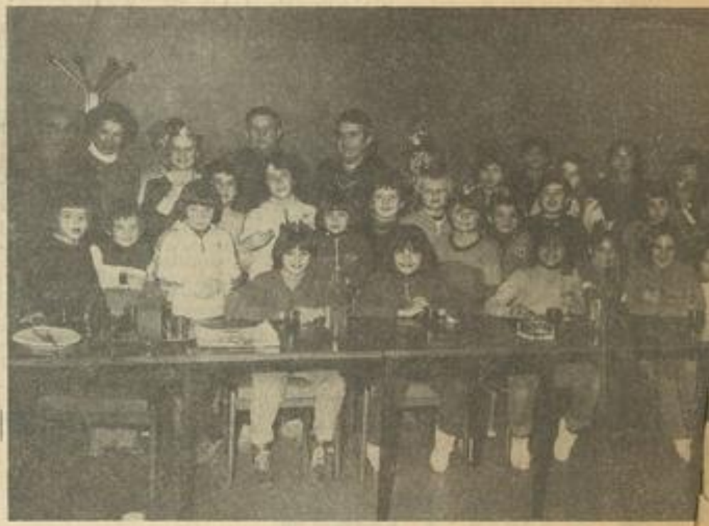
● Au Tennis-Club.