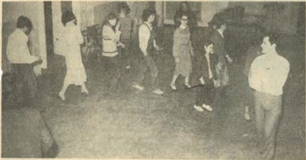
• Les participants au cours de la répétition.