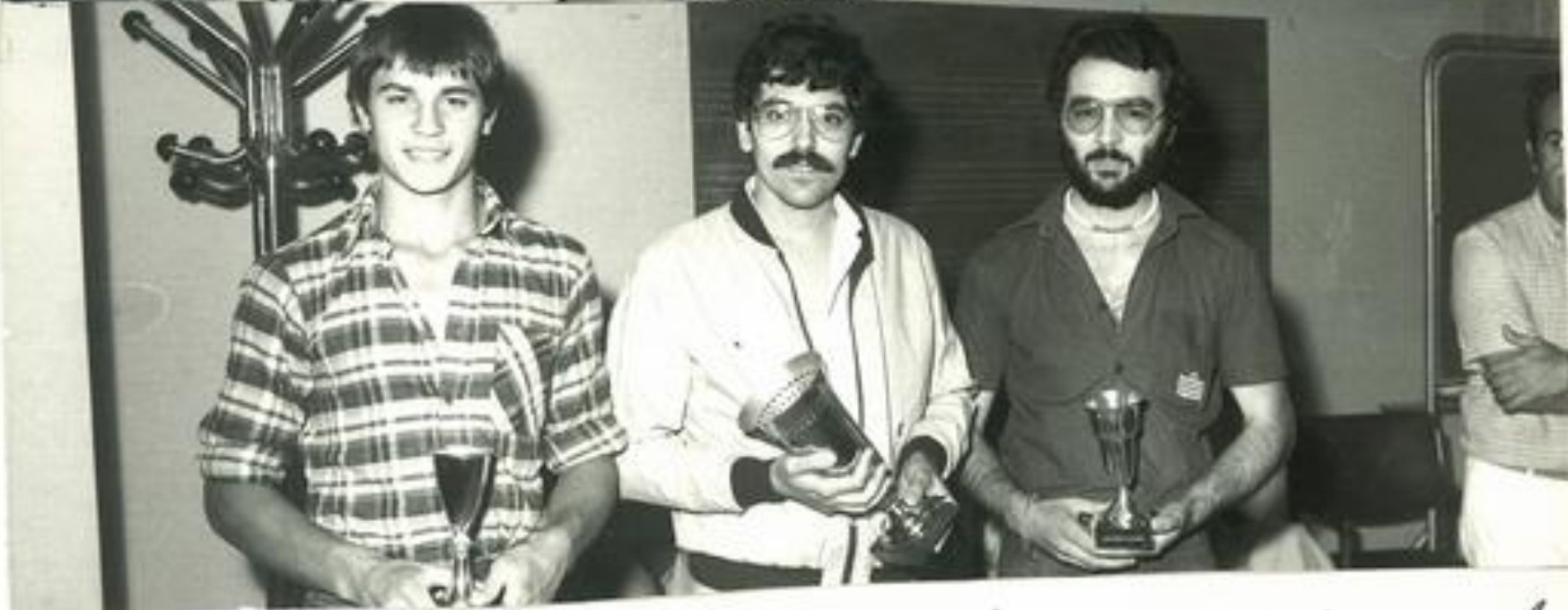
13/7/79 reception Lauterbach