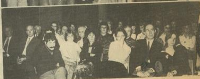
• En haut la chorale du Minervois ; en bas vue d'ensemble du public.