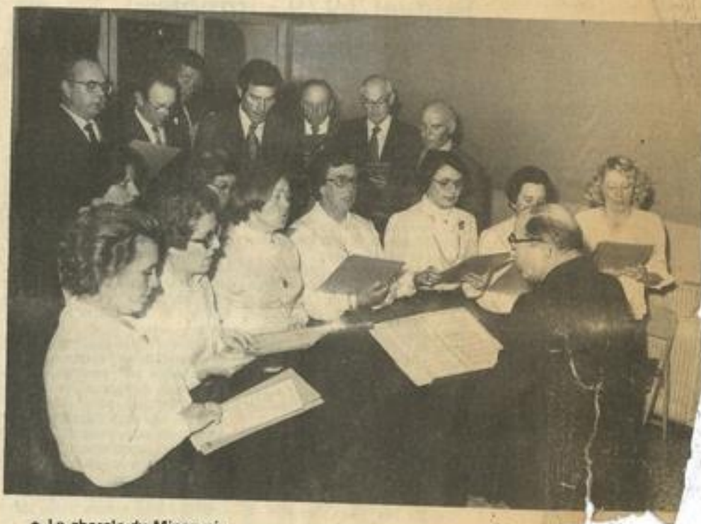
• La chorale du Minervois.