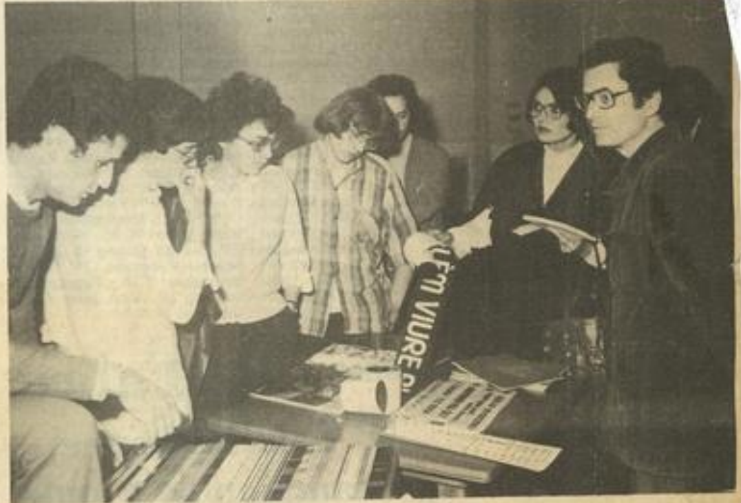
● L'exposition des œuvres de "La Sauze"