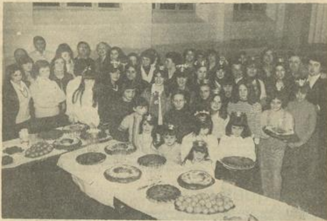
● Chez nos majorettes.