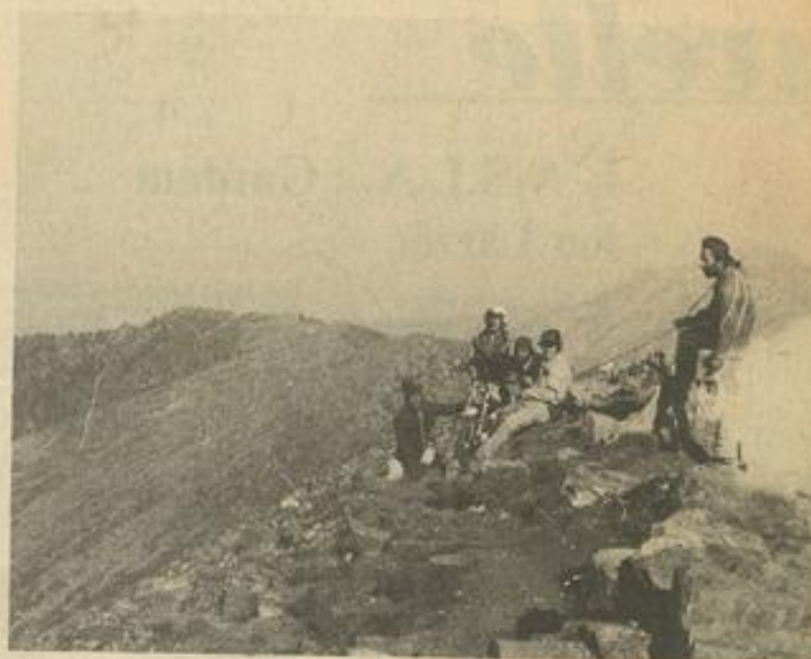
• Fatigués mais heureux, les courageux trialistes se reposent au sommet du Canigou (Photo)

SIX jeunes trialistes audois et catalans réussissent l'ascension du Canigou (2784 m) et ce avec des motos de trial.