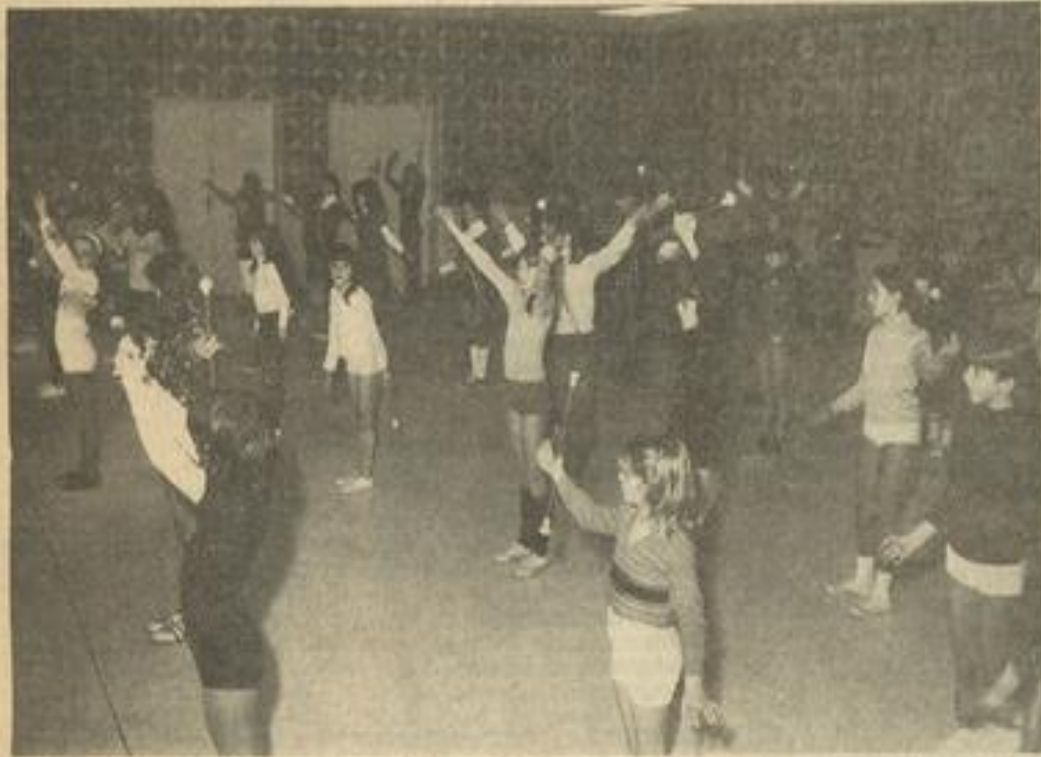
• Vue d'ensemble au cours du stage