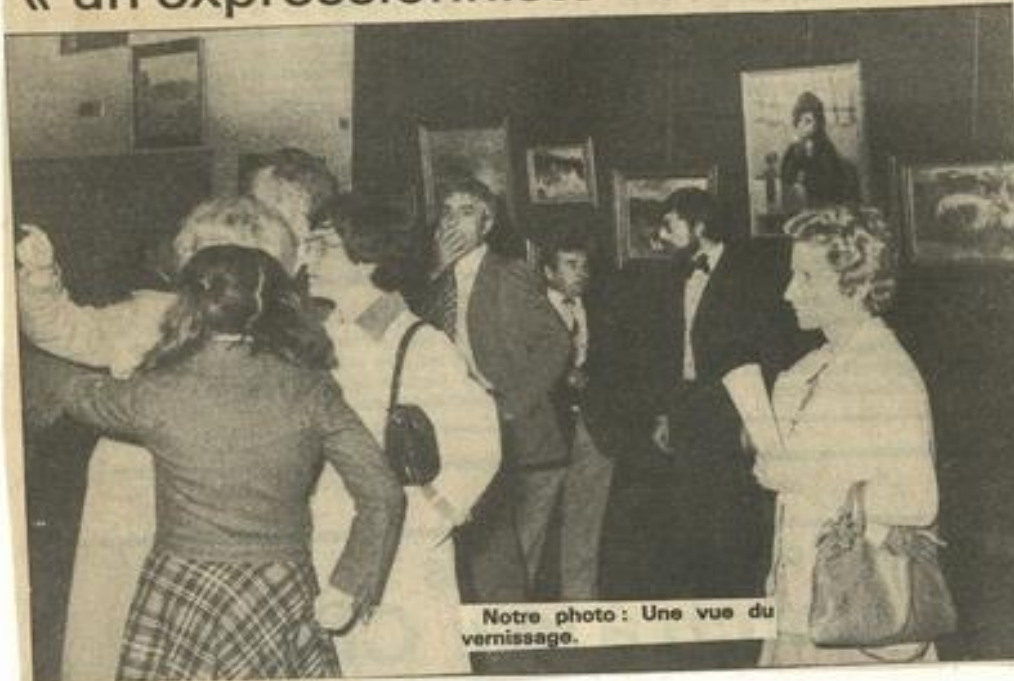
Notre photo: Une vue du vernissage.

Jusqu'au 16 novembre Lézignanais et Audois peuvent visiter tous les jours au Palais des Fêtes de la capitale des Corbières, ce 2e salon d'automne du Languedoc où sont accrochées quelques 120 œuvres portant les signatures de 60 artistes professionnels parmi les plus réputés.