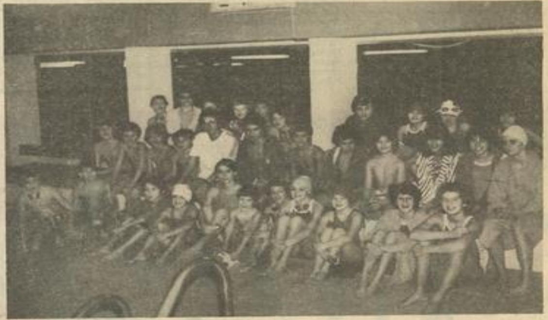
● A la piscine.

Nos nageurs et nageuses sont rentrés samedi après-midi entièrement enchantés de leur séjour.