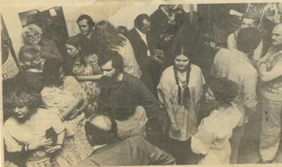
• Un premier rendez-vous avait lieu mercredi en fin d'après-midi.

U N commerce pas tout à fait comme les autres, un lieu d'expositions, de rencontres, d'échanges et d'amitié : la boutique Arcadia qui a ouvert ses portes mercredi soir au n° 3 de la rue de la mairie, au cours d'un délicieux cocktail, est un peu tout cela... Un peu tout cela, et surtout une sorte d'exceptionnel forum de tout ce qui se produit dans notre région au niveau d'un artisanat d'art. A Arcadia, ce sera la fête des mains qui travaillent, avec des poteries faites à Ajac, des vitraux d'art venant de Luc-sur-Aude, des bijoux, des objets de bois, des idées de décoration, du macramé, etc... Bref, une boutique où acheter sera un geste libre, relevant d'un choix personnalisé et non point du conditionnement habituel et contraignant. A Arcadia, ensuite se dérouleront avec régularité des expositions artistiques auxquelles les fulgurantes toiles de Jean-Jacques Ostier, installé à Torreilles, donnent d'ores et déjà un attrayant coup d'envoi.