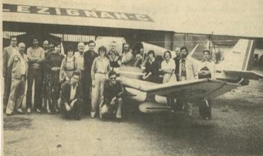
Les Italiens à l'aéro-club pour une découverte de Lézignan par les sirs.