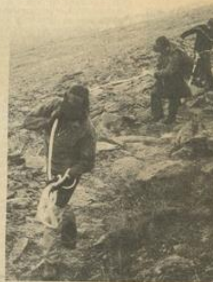
• Sur les pentes

Nous remercions encore une fois les établissements Espuna, le spéleo-club ainsi que les établissements F. Lucas (importateur Butaco) qui nous avait offert gracieusement l'équipement vestimentaire.