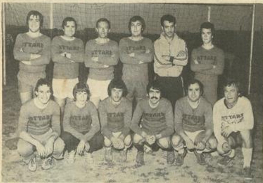
• L'équipe championne.