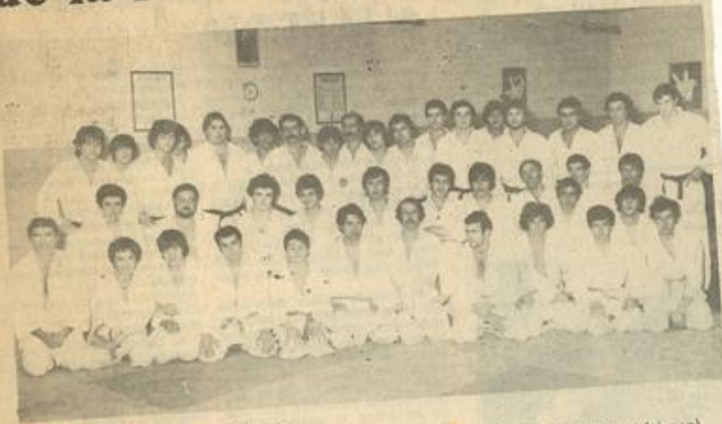
• Vue d'ensemble des participants