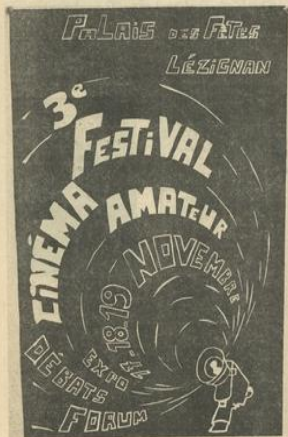
Voici l'affiche du festival.