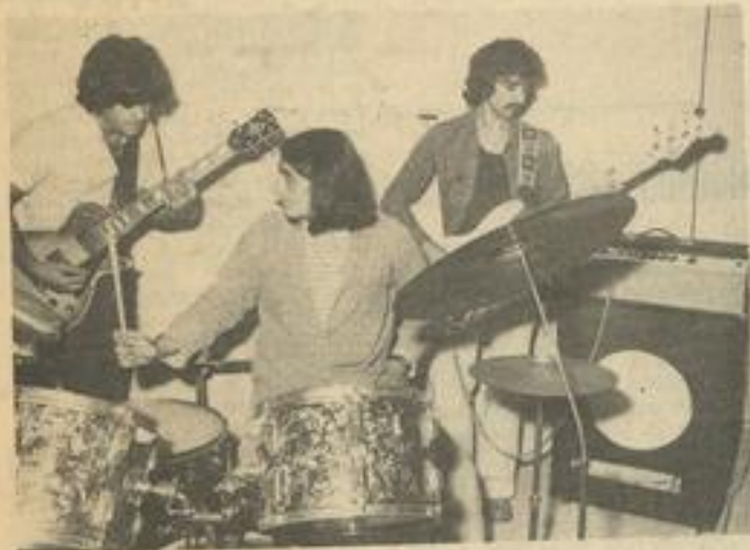
• Quelques uns des participants