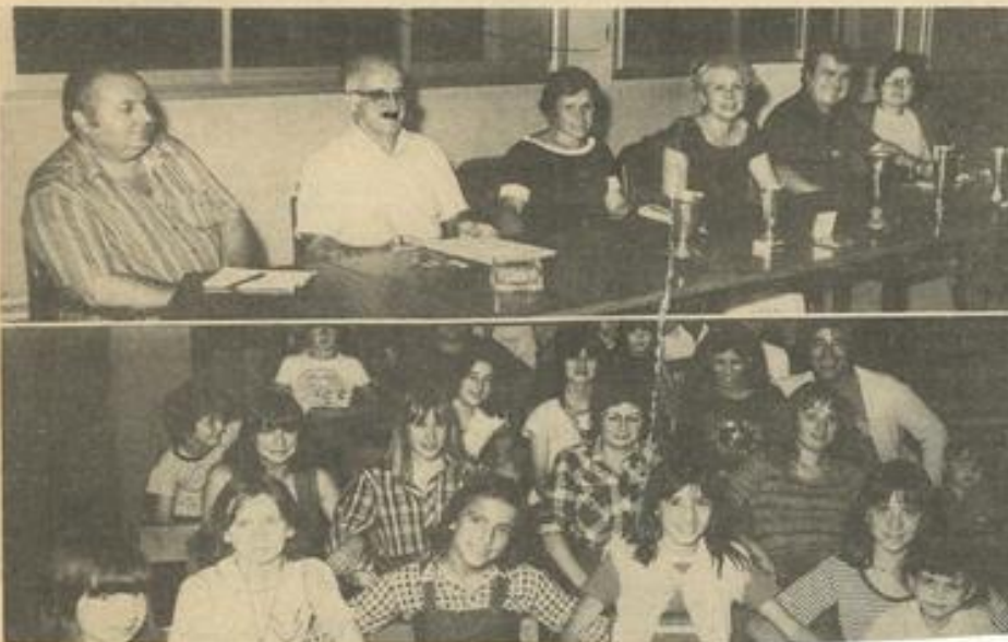
• Le "Sataillon" et, en haut, le bureau.