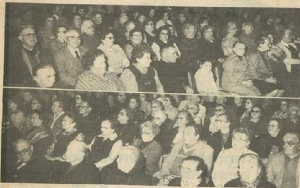
• Deux vues d'ensemble du nombreux public

On peut affirmer que la séance récréative organisée samedi après-midi dans le cadre de la "Journée nationale des personnes âgées" a été un grand succès sur toute la ligne.