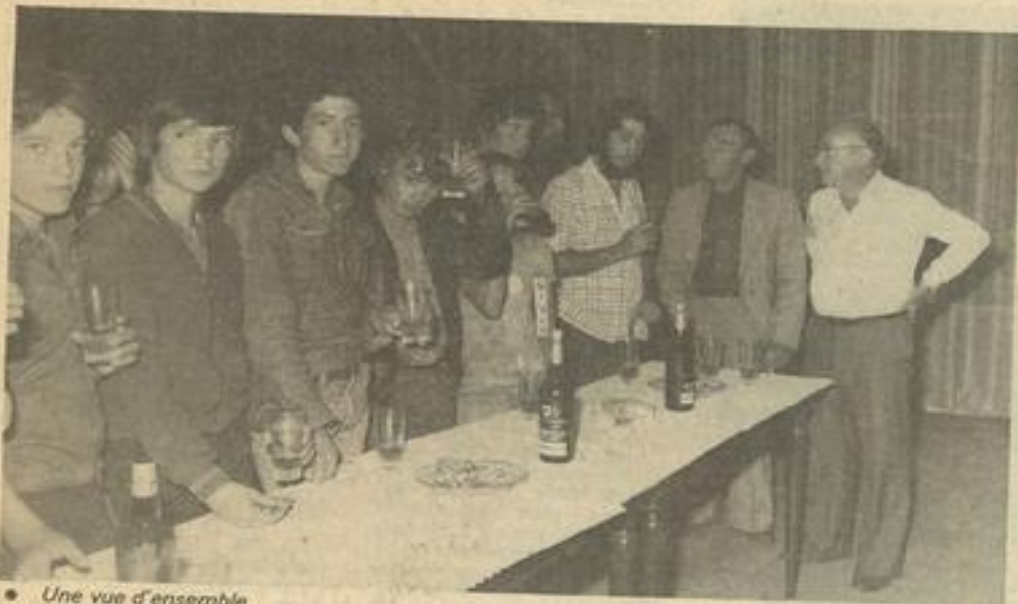
• Une vue d'ensemble