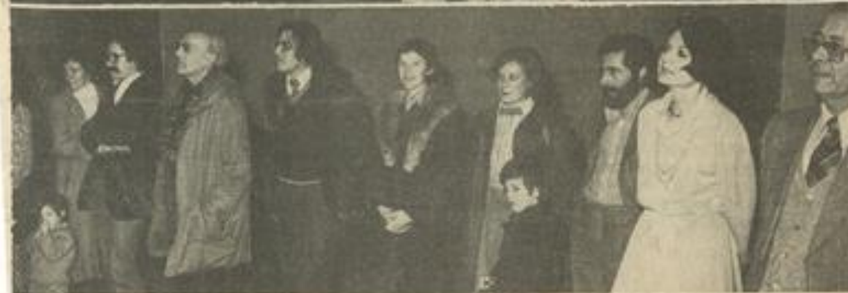
• Deux vues d'ensemble des participants