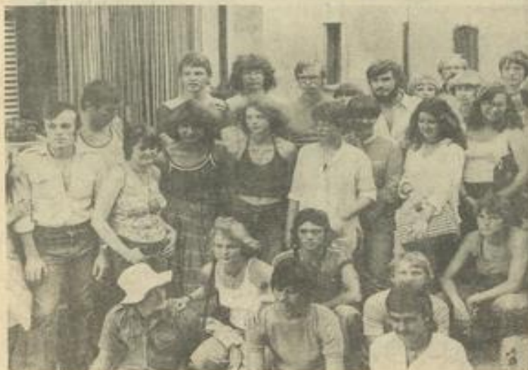
• Le groupe de jeunes Allemands en visite dans le Lauragais.