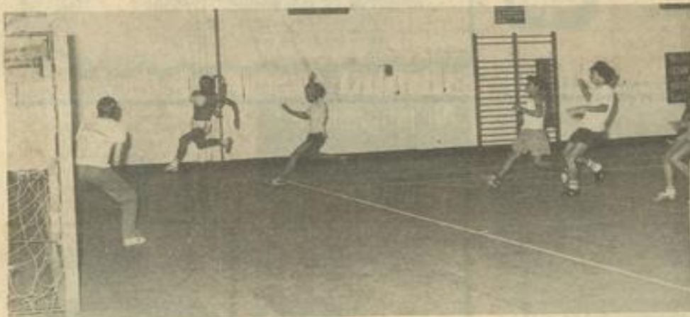
• Une phase de la rencontre