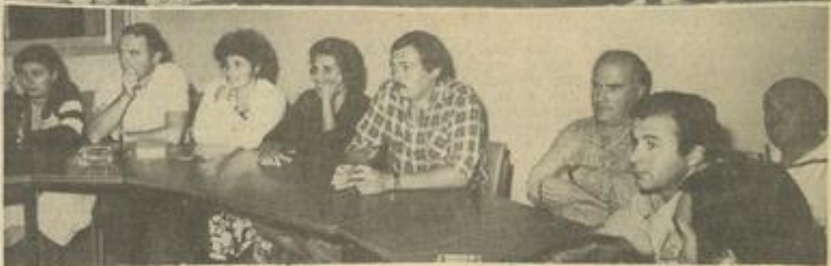
• Les principaux responsables de la M.J.C. et les représentants des diverses sections.