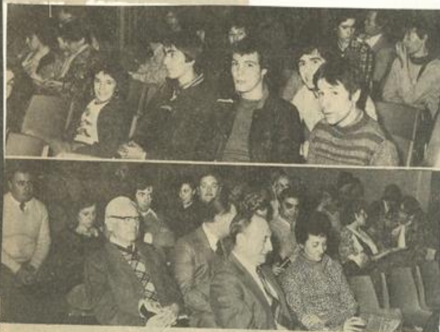
• Un public connaisseur qui ne manqua pas d'accueillir chaleureusement tous les films mis en compétition.