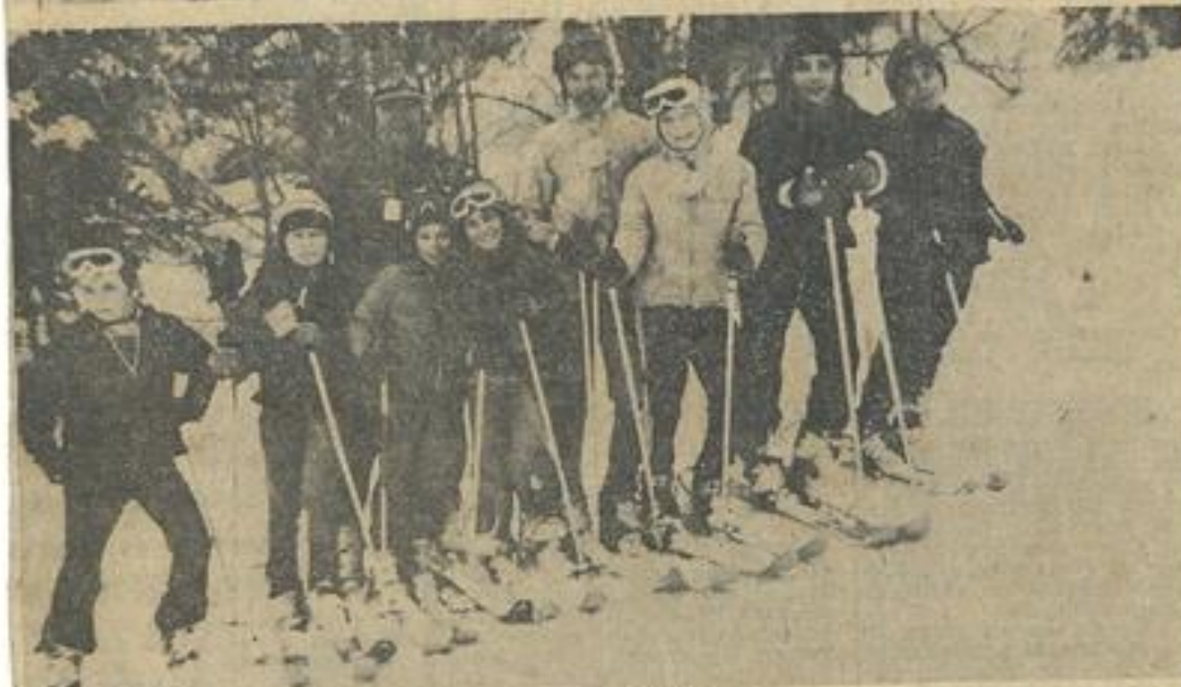
• Deux vues d'ensemble des jeunes skieurs lézignanais.