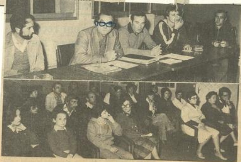
• En haut le bureau ; en bas les participants.

Pour l'entraînement à Narbonne, en voiture ou en autobus ; départ et arrivée devant la Maison des Jeunes.