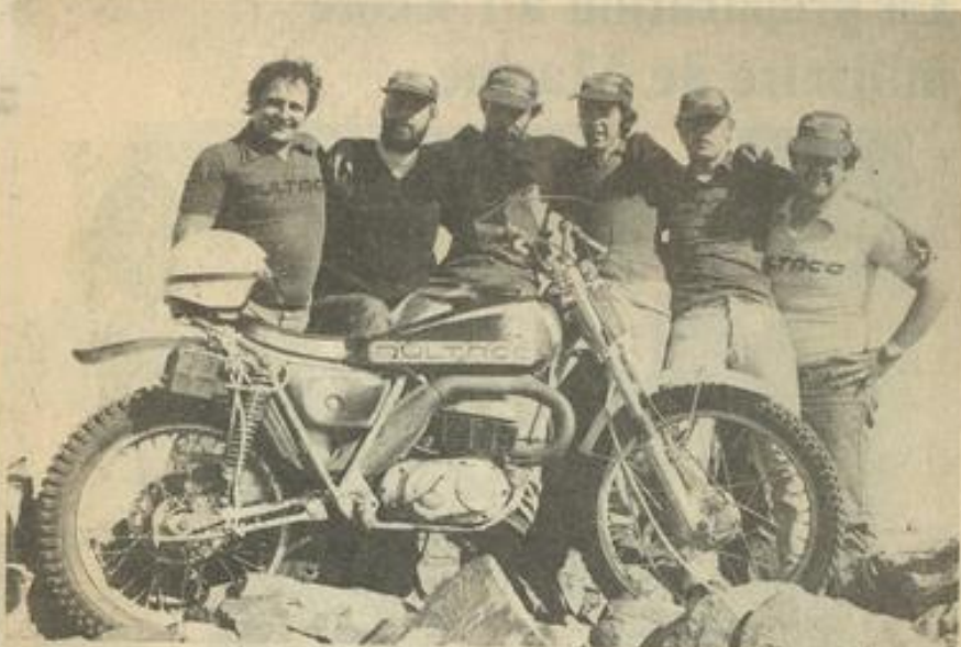
• La courageuse équipe