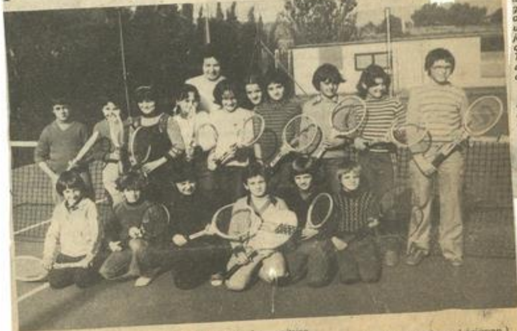
• Le groupe des jeunes raquettes et leur dévouée monitrice.