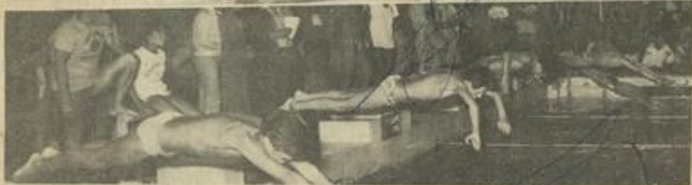
• En haut le public. En bas : le départ d'une course