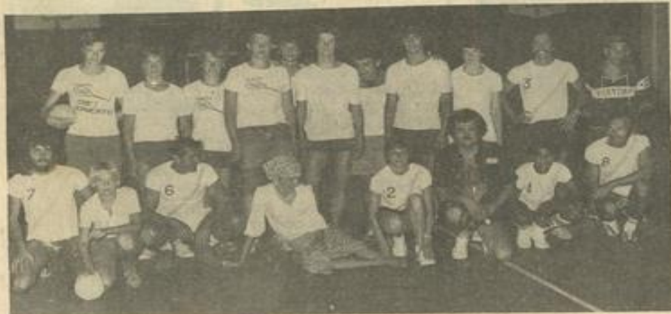
• Les deux équipes

Bref, une soirée des plus attrayantes pour nos jeunes hôtes allemands qui en emporteront un très bon souvenir.