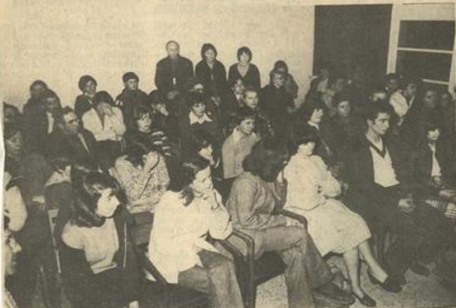
• Vue d'ensemble des parents.