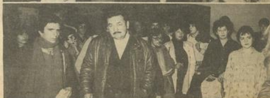
• Vues de l'assistance

Un bon festival, certainement. Et cela ne peut qu'encourager les organisateurs, à aller de l'avant.