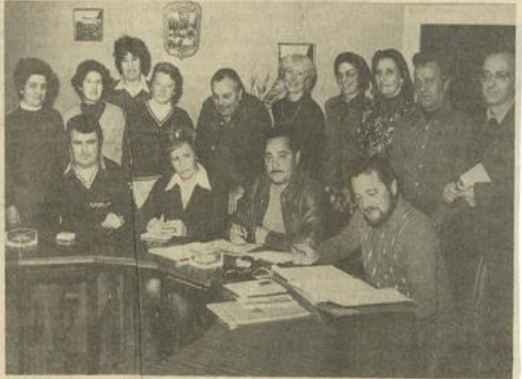
• Les participants à l'assemblée départementale