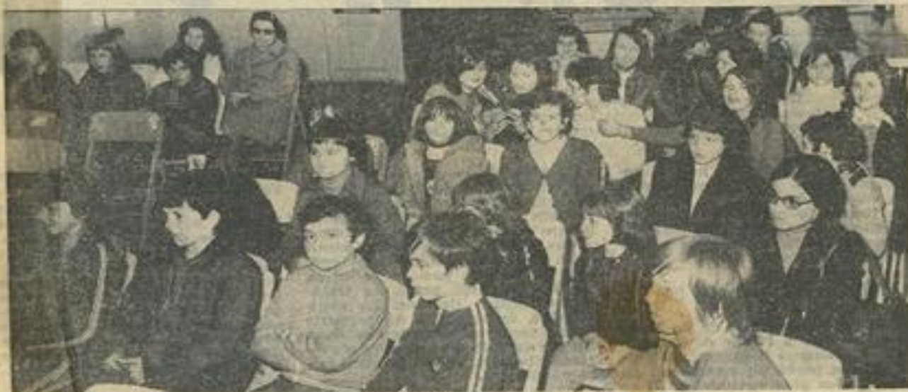
Quelques-uns des jeunes skieurs présents