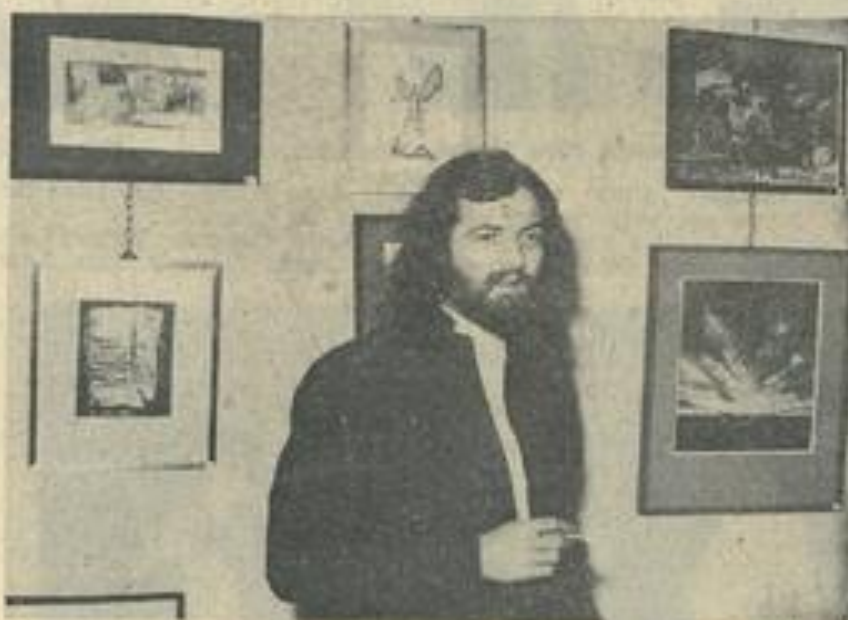
■ Le jeune peintre devant ses œuvres.