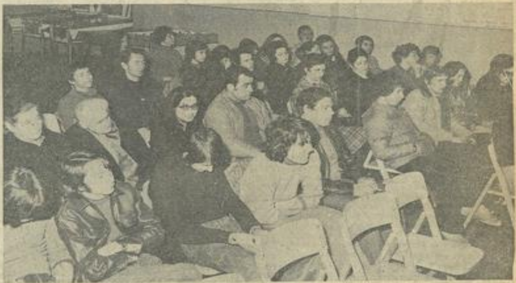
● Les participants.

Il annonce, à la satisfaction générale, le début prochain des travaux d'agrandissement de la maison dont la date est prévue pour le mercredi 2 mai.