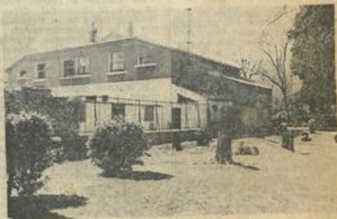
● Cet agrandissement englobera l'espace séparant l'actuel bâtiment du gymnase Léo-Lagrange. Afin de dégager le coin, les sapins entourant la M.J.C. côté jardin public ont dû être abattus.