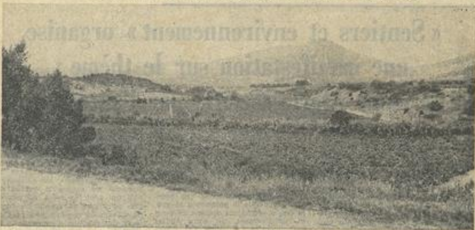
Depuis le site de Beaumont, que domineront bientôt les « Hauts de Narbonne », une vue imprenable sur la plaine, la ville et, si le regard va vers la droite, l'étang et au-delà la mer.