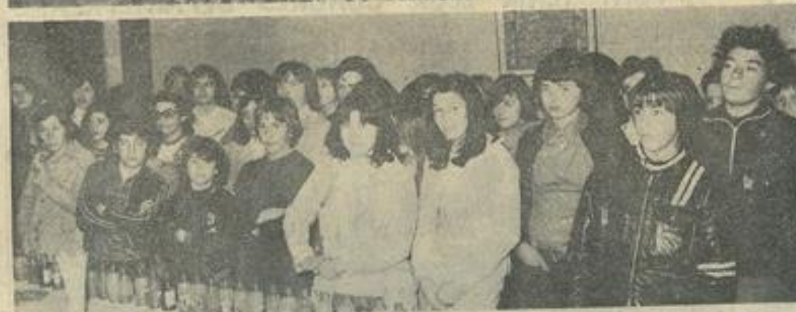
■ Deux vues d'ensemble au cours de la réception officielle.