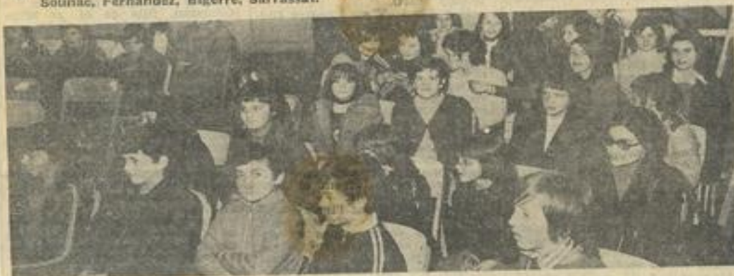
■ Les jeunes skieurs.