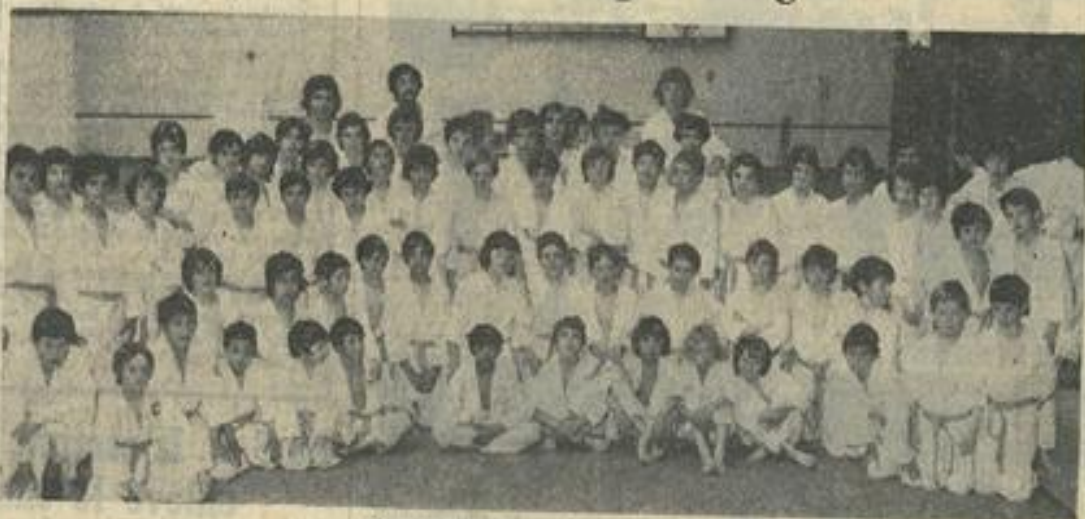
L'imposant groupe des participants

Cette manifestation qui groupait plusieurs Maisons des jeunes de la région s'est déroulée au gymnase Léo-Lagrange, dans une excellente ambiance. Malgré les obligations créées à nos jeunes judokas par la fête des mères, 102 d'entre eux se sont retrouvés sur les « tatamis » où répartis sur 5 catégories d'âge, ils se livrèrent tous avec cœur, pour tenter d'arracher une victoire individuelle et aussi ramener dans leur maison une des trois coupes mises en compétition par la fédération régionale.