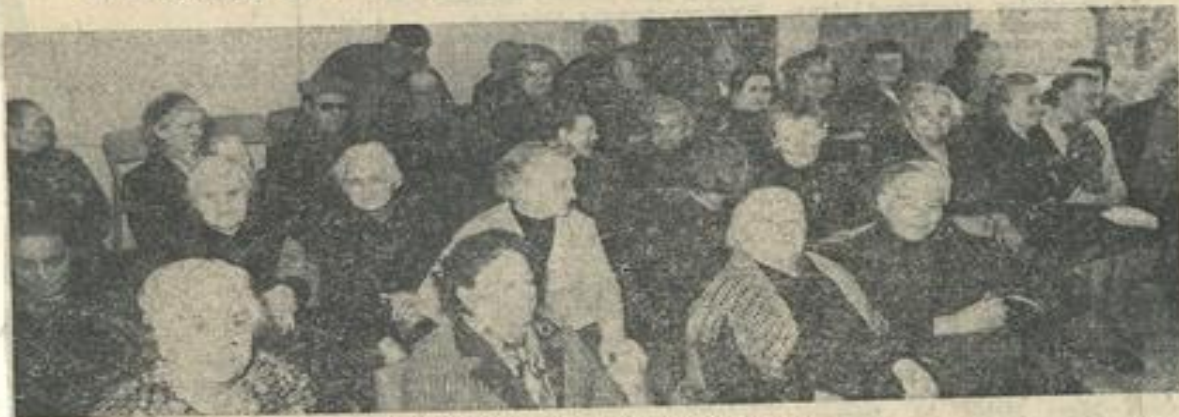
Un auditoire en or pour un tel sujet