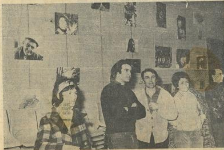
● Une vue de l'exposition et des animateurs.