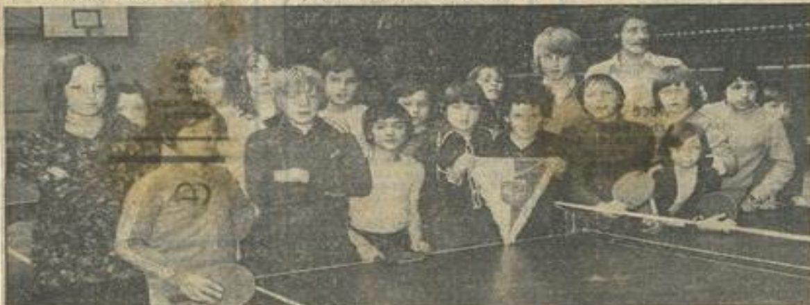
Une partie des participants au tournoi de ping-pong Lézignan-Leeds.