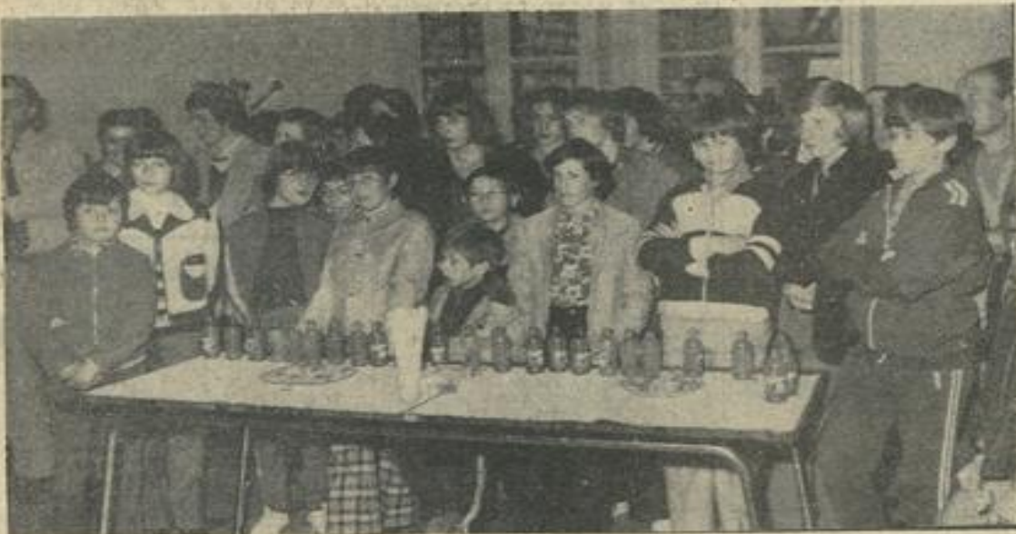
Anglais et Français au coude à coude.

La réception des jeunes Anglais de Leeds et de leurs correspondants audois a revêtu, samedi, à 18 h 30, en l'hôtel de ville, un caractère particulièrement populaire.