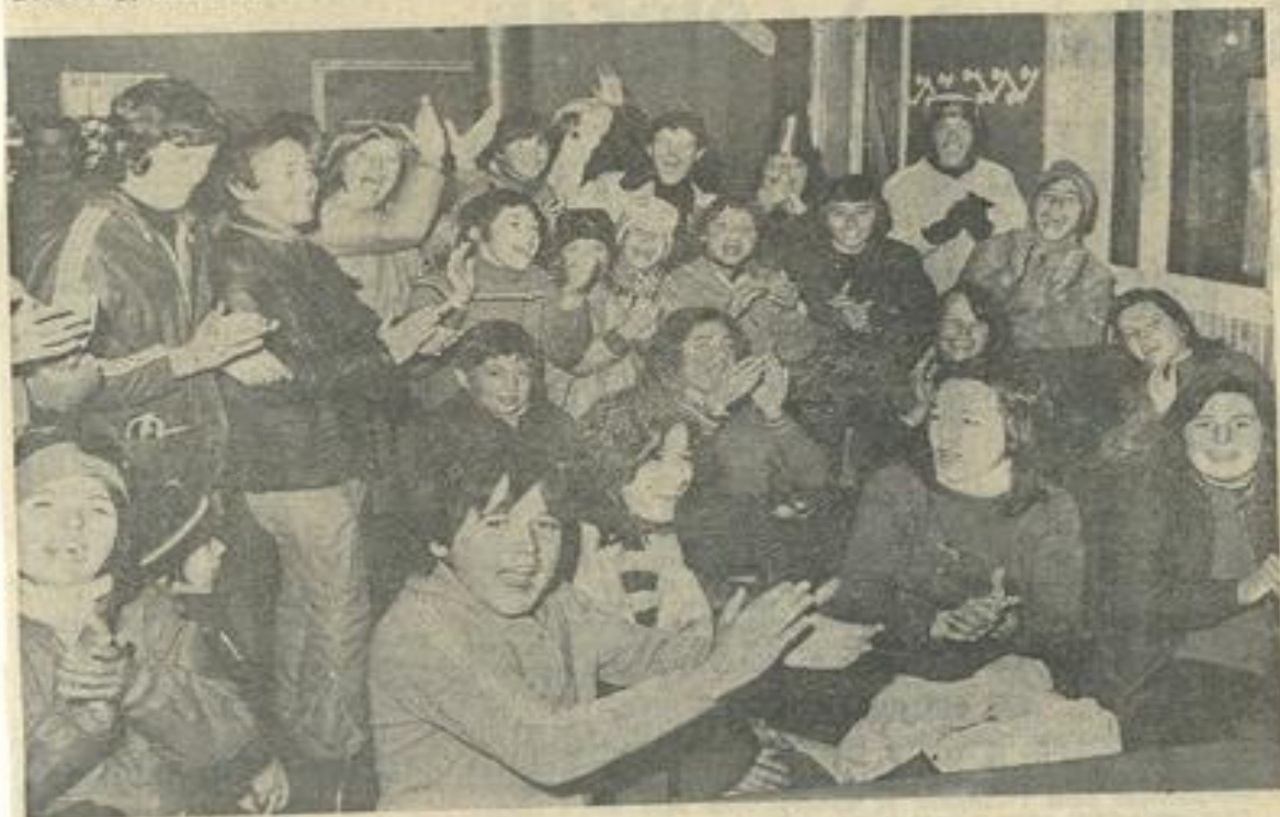
● Un groupe de participants lors de la remise des prix.

M ERCREDI à Camurac sur la piste de La Labière, les moniteurs de l'école de ski de Camurac organisèrent sous le patronage de la Jeunesse et des Sports, une course interscolaire à l'attention des scolaires ayant participé aux sorties plein air.