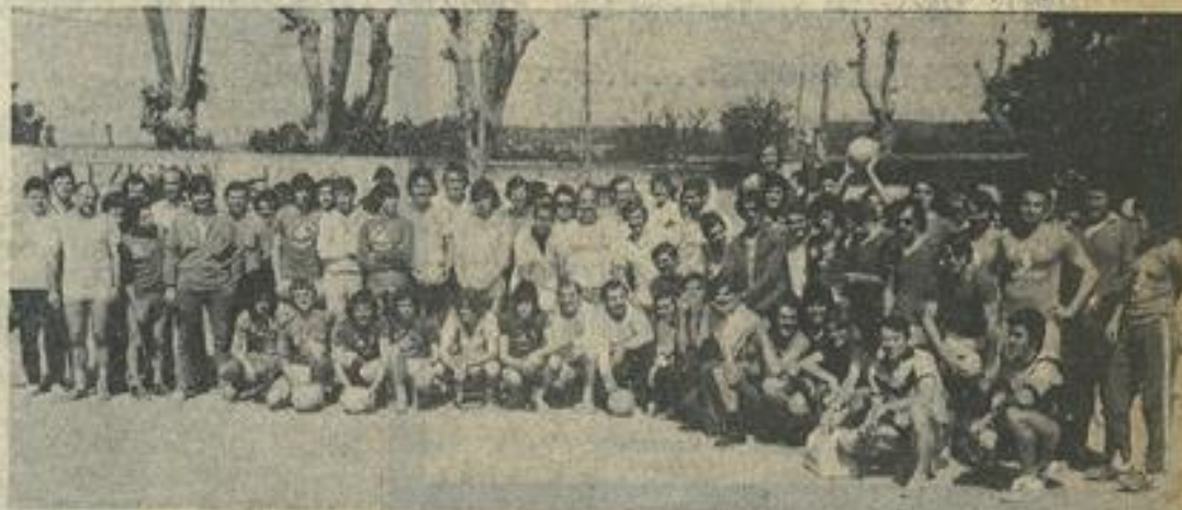
Les 180 volleyeurs rassemblés

Ce jeudi de l'Ascension, la section volley-ball de la M. J. C. de Lézignan a organisé le deuxième tournoi de la ville de Lézignan qui a été une très grande réussite dans tous les domaines surtout par la bonne volonté de « Monsieur météo ».