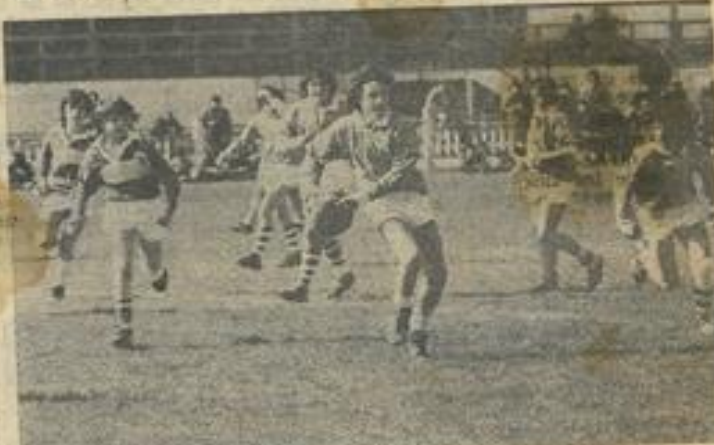
Une phase de la rencontre.

Pour le compte des 1/8e de finale du championnat, ils af-