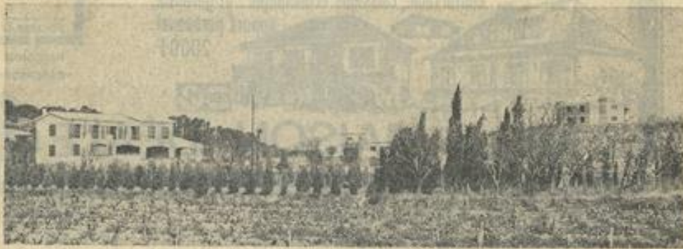
Sur le versant de « La Coupe », trois résidences particulières parmi plusieurs autres : deux sont habitées, la troisième, à droite, fait déjà admirer son architecture cosue