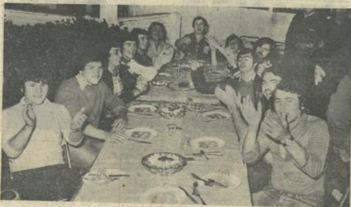
● La table des juniors.