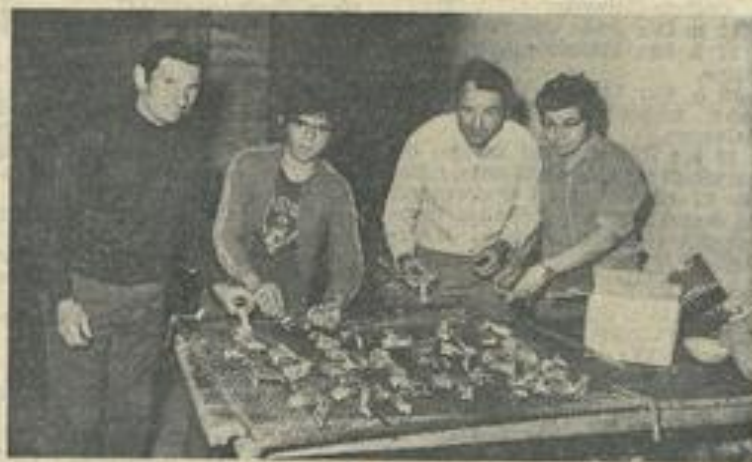
● Les « Maîtres rôtisseurs » au travail.