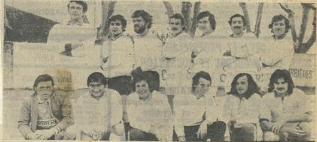
Les « Gratte Gazon » victorieux.