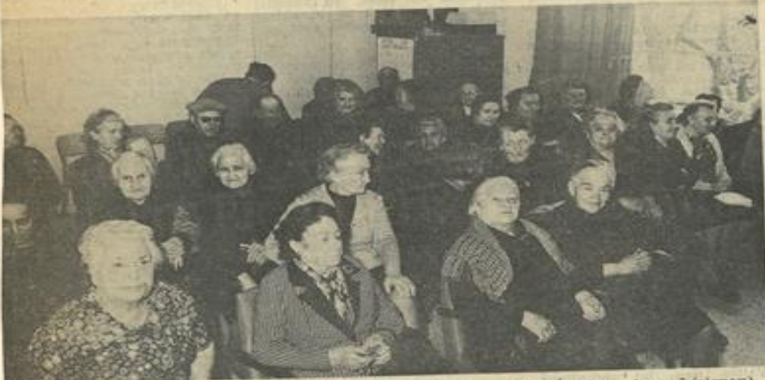
● Une vue d'ensemble des spectateurs.