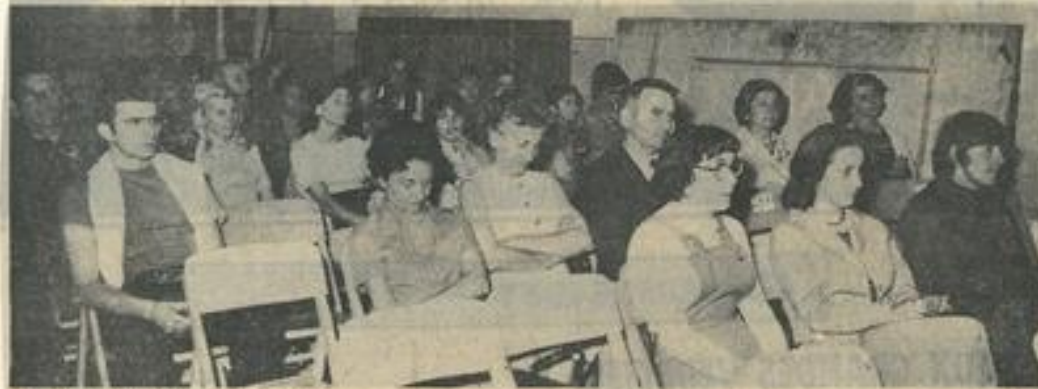
● Une vue de l'assistance.