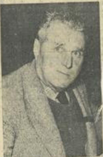
© M. Joseph Euzet, l'éminent historien, membre de la Société d'Etudes Scientifiques de l'Aude.

En conclusion, M. Euzet eut une pensée pour tous ceux qui se sont penchés sur l'histoire de la capitale des Corbières, car ce sont les Léznignans de toutes les époques qui ont fait la ville actuelle et qui préparent le Léznigan du 21e siècle.