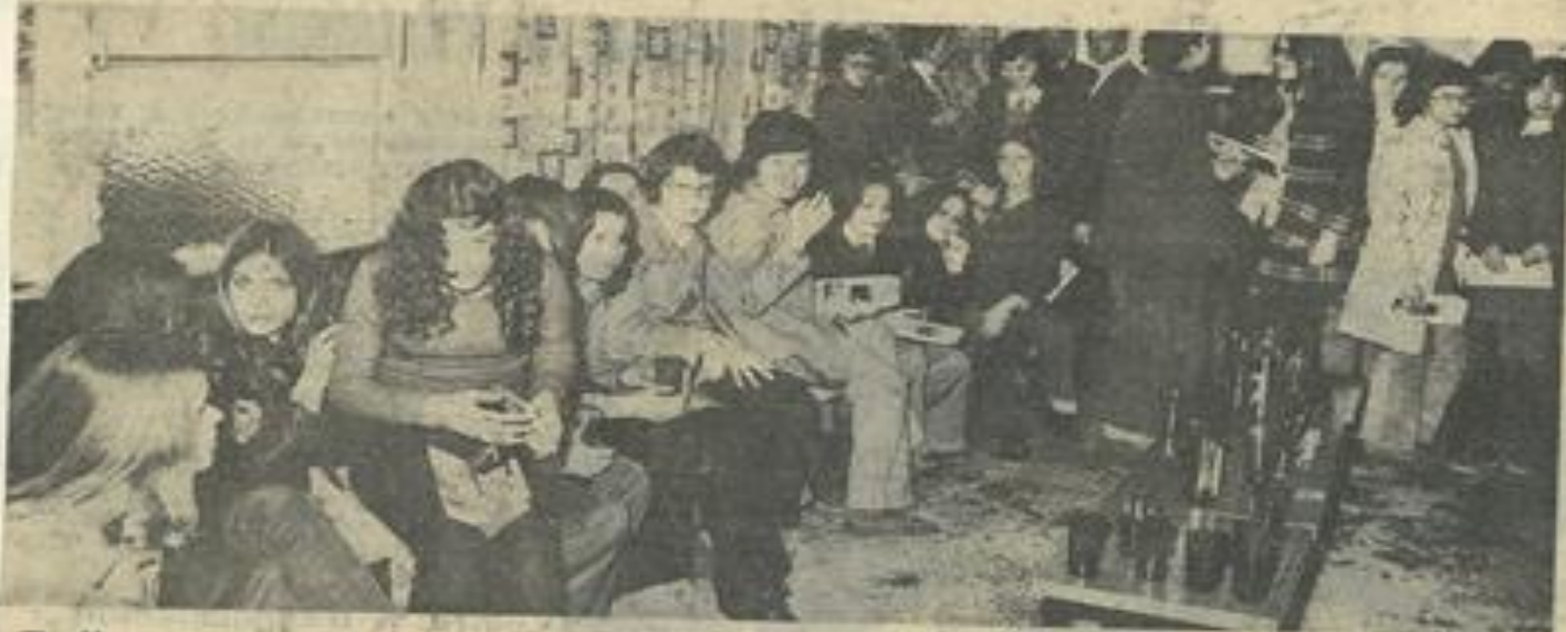
■ Une vue d'ensemble.