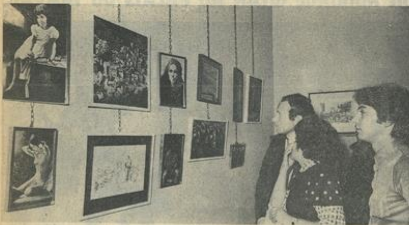
■ Une partie de l'exposition.