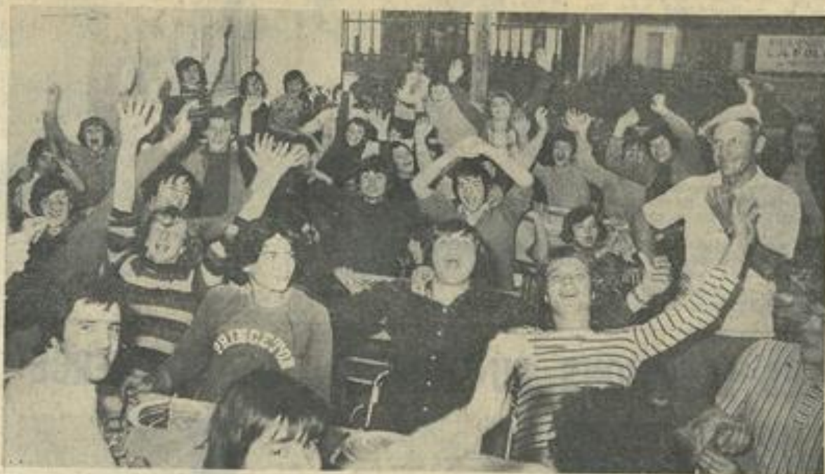
● Une vue d'ensemble des jeunes convives.