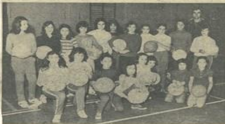
Comme pour les garçons des cours d'initiation au basket sont donnés chaque semaine