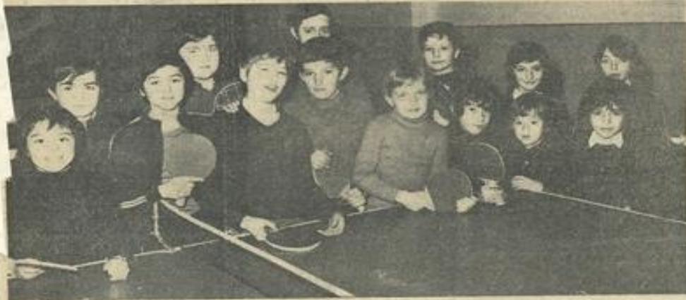
● Les participants.