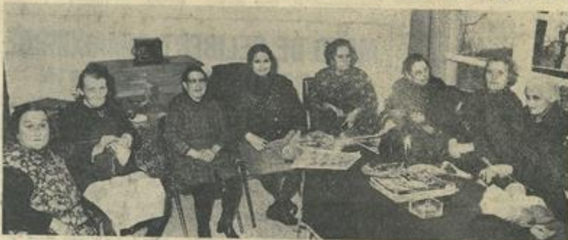
● Deux vues d'ensemble de nos Jeunes grands-mères.