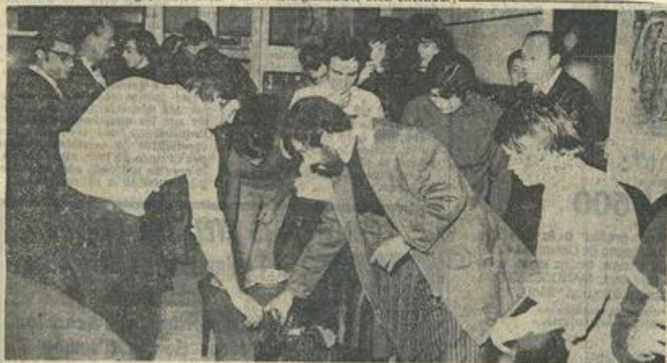
Animateurs et responsables des sections de la M.J.C. n'ont pas manqué de lever leur verre à la réussite des projets évoqués par les jeunes membres du conseil de maison.

Dans la salle d'honneur de la M. J. Lézignanaise, bien entendu.