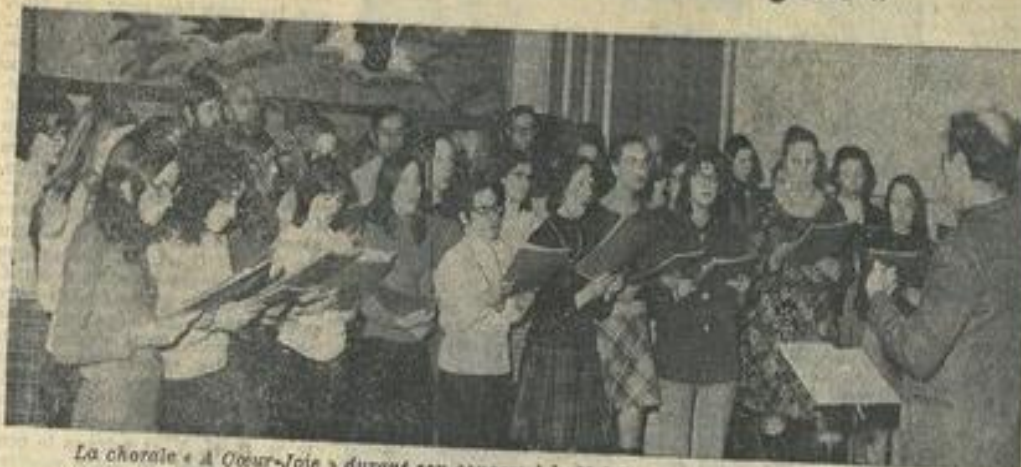
La chorale « A Cœur-Joie » durant son concert à la M.J.C.