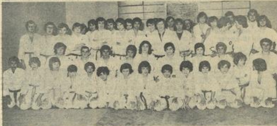
● Une vue d'ensemble des concurrents.