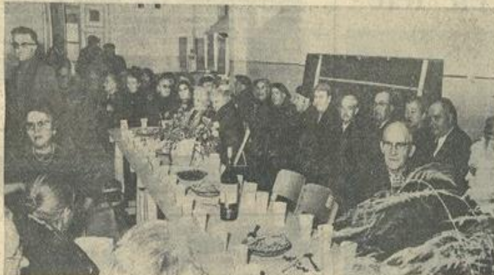
■ Une vue d'ensemble sur le coin des messieurs.