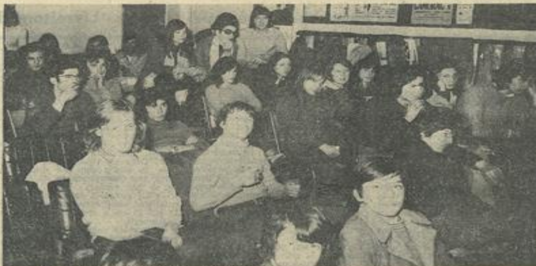
● Une vue d'ensemble de l'assistance.

Vendredi soir, les jeunes Lézignonnais étaient gracieusement invités à un récital de guitare, chants et poésies, présenté par le groupe de la M.J.C. Narbonnaise.