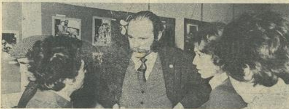
■ Un des dirigeants de la M.J.C. Bramoise s'entretient avec des auditeurs intéressés.

SAMEDI, en fin d'après-midi, au 20 de la rue Marat, une équipe de la Maison des Jeunes de Bram présentait un fort intéressant montage audio-visuel dont le thème peut se résumer ainsi : « Artisanat et progrès ». Pour le réaliser, un groupe de jeunes munis d'un magnétophone et accompagnés des membres du Club Photo, sont allés interviewer les artisans de Bram et particulièrement ceux