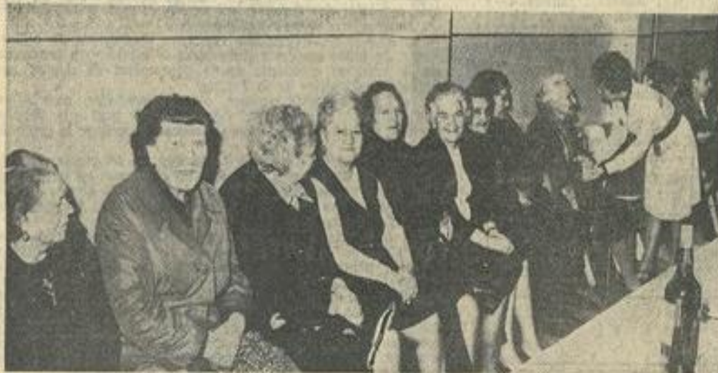
■ Le coin des dames.