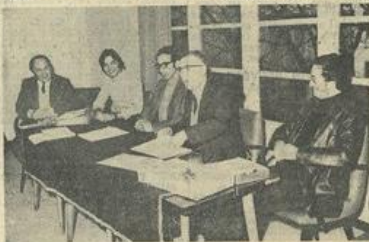
● Le bureau.

Un repas familial était ensuite pris en commun au foyer de la M.J.C., repas qui devait se poursuivre par une visite du Grand Concoust.