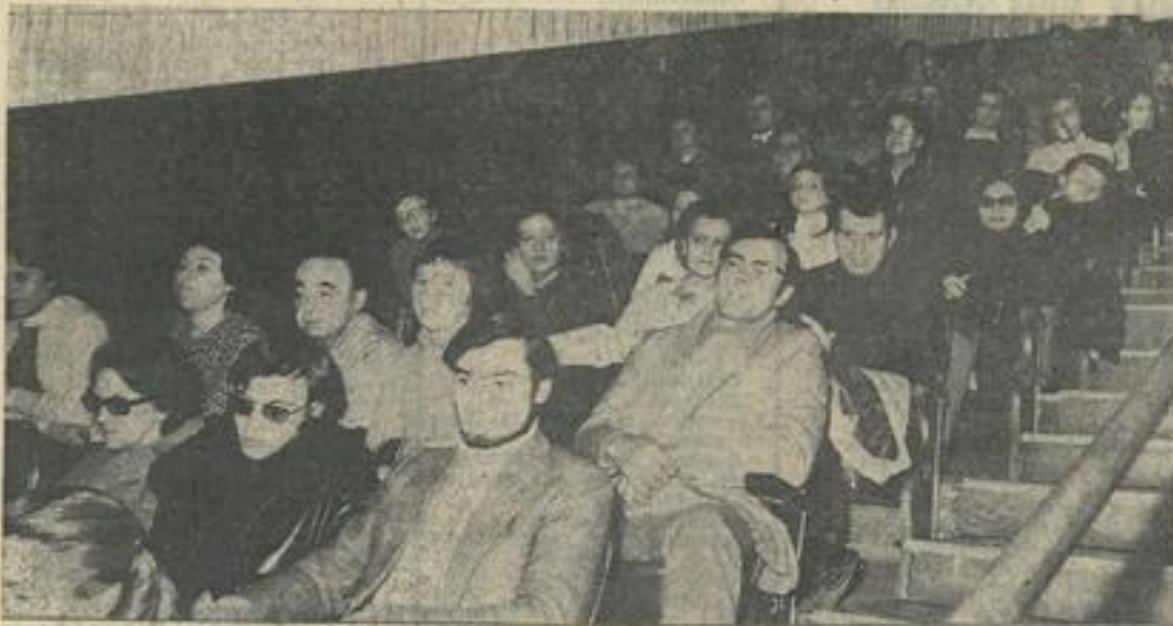
Une vue partielle des auditeurs emplissant les balcons du Palace.