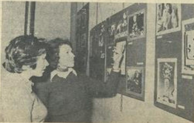
■ Une jeune fille de l'équipe de Bram commente les photos.

Une exposition de photos complétait cette séance des plus instructives, qui a été suivie par de nombreux jeunes et moins jeunes.