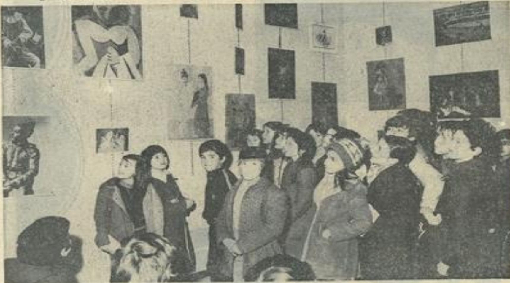
● Les élèves de Marie-Curie admirent l'exposition.