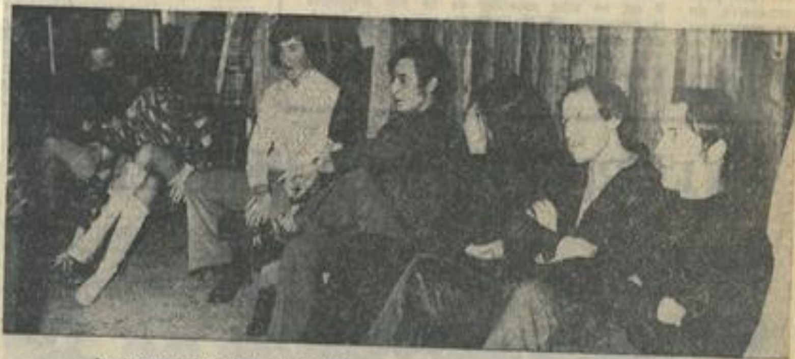
La jeunesse était bien représentée.