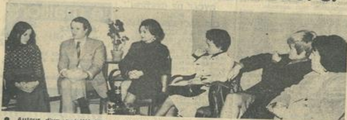
● Autour d'un apéritif-débat à la Maison des Jeunes et de la Culture.

A 18 h 30, au Payer de la M.J.C., jeunes et adultes recevaient Georges de Caunes autour d'un apéritif d'honneur.