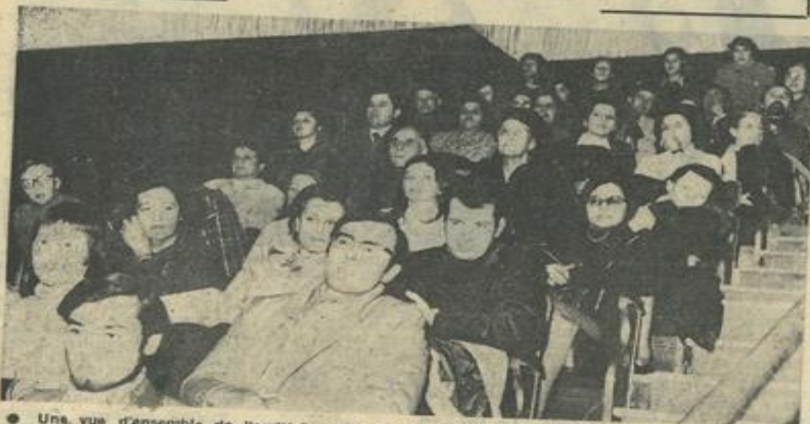
● Une vue d'ensemble de l'auditoire aux balcons de l'établissement de M. Grillard.

L a soirée de jeudi soir au Palace, organisée par la commission culturelle de la Maison des Jeunes et de la Culture, nous a rappelé l'époque, pas si lointaine, où la M.J.C. recevait couramment des conférenciers. Ce soir-là, un peu plus de 200 personnes avaient répondu à l'appel des organisateurs.