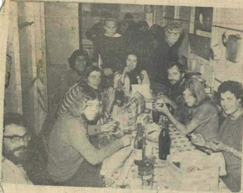
L'ambiance des « resto-U »

« Trop de risques » : Une explication que l'on peut traduire ainsi : Une femme serait