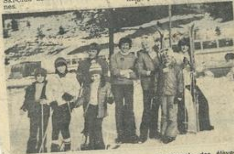
* Quelques-uns des participants parmi lesquels des élèves de C.E.S. J.-Anglade.