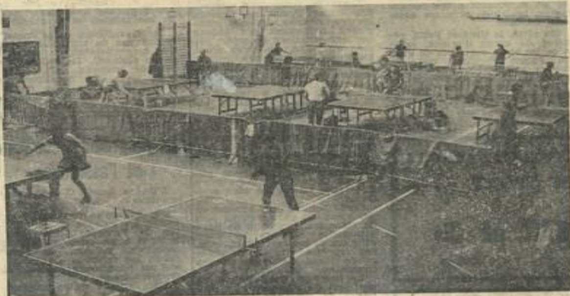
■ Une vue d'ensemble du gymnase Léo-Lagrange où avait lieu cette importante compétition pongiste.