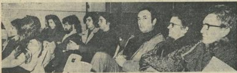
● Une vue d'ensemble de l'assistance.

Malgré le froid, la salle de la Maison des Jeunes était coquettement remplie, ce vendredi soir, pour recevoir la Troupe des Comédiens des « Bouffons du Midi » dans une pièce d'Eduardo Manet : « Holocaustum » ou « Le Borgne ».