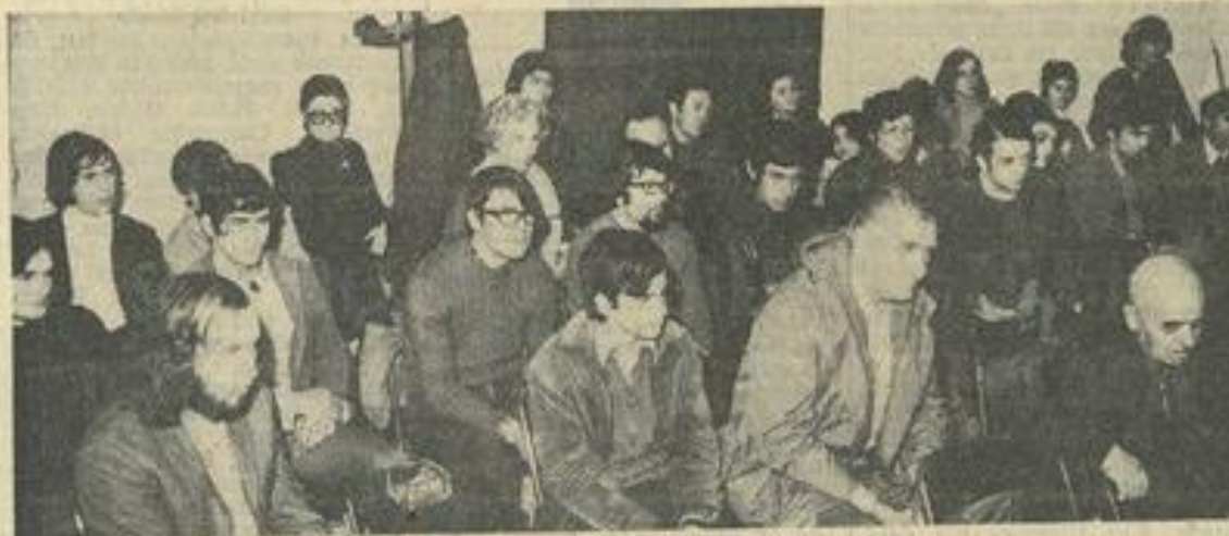
● Une vue d'ensemble de l'assistance.