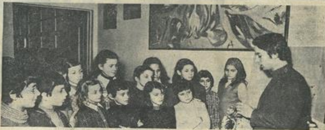
● Les élèves de la classe de Mme Fauché paraissent fort intéressés.

Les élèves de l'établissement de la rue Lakanal, dirigé par Mme Brunet-Fontanet, ont bénéficié cette semaine de cours fort intéressants sur la spéléologie.