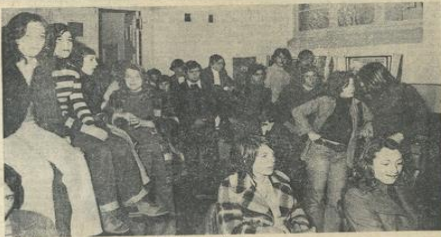
■ Deux vues d'ensemble des nombreux auditeurs.