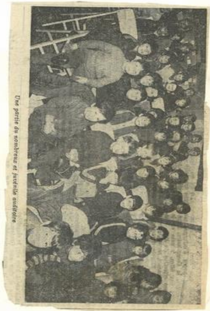
Une partie du nombreux et juvénile auditoire

Nous rappelons que c'est ce soir, à 21 heures, qu'aura lieu, dans le cadre de l'animation culturelle, au foyer de la M. J. C., la soirée guitares, chansons et poésie animée par le groupe de jeunes de Narbonne.