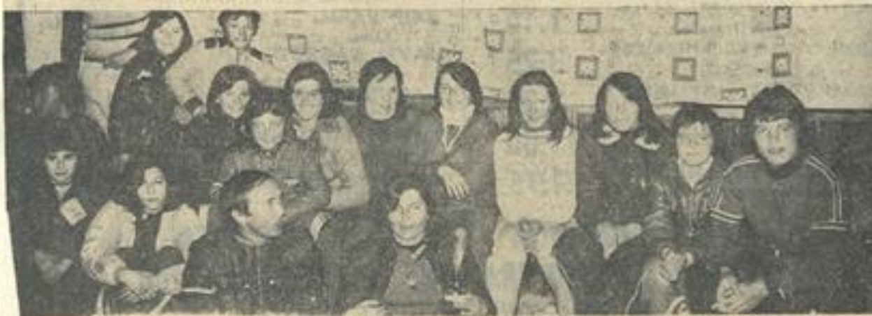
« Les skieurs léznignanaïes engagés dans la compétition. »