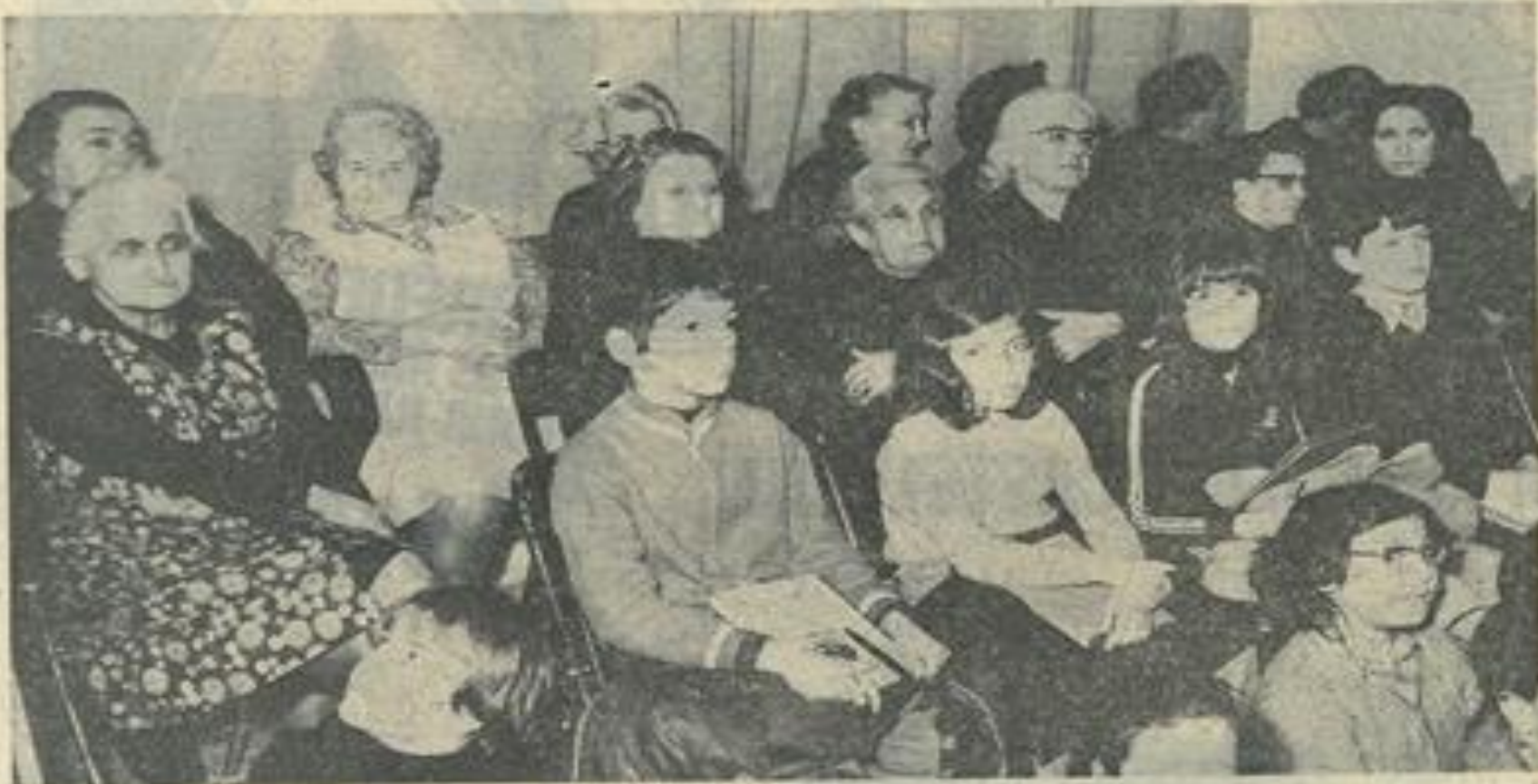
● Ces dames du troisième âge.