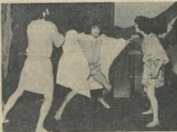
● Une scène de la pièce d'Eduardo Manet.

Et merci aussi à la Commission Culturelle de la Maison des Jeunes et de la Culture de notre ville de nous avoir offert un tel spectacle.