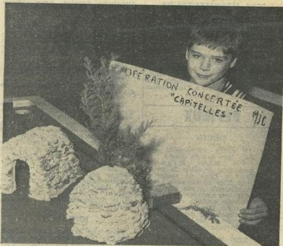
Les deux projets qui seront proposés

Les nouvelles structures du conseil d'administration ont prévu un secteur environnement qui réunit aujourd'hui sa première commission. le thème essentiel débattu sera le rapport qui sera présenté au préfet de l'Aude au mois d'avril : opération concertée « Capitelles ». Une opération concertée est par définition une action menée secteur par secteur par des responsables volontaires et conscients. En effet, le but visé est de remplacer après sensibilisation des propriétaires les vieilles carcasses de voitures qui gênent considérablement à l'esthétique du paysage. Il ne s'agira pas d'une mesure autoritaire, mais