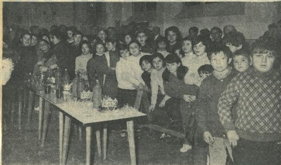
● Bien qu'en minorité, les filles n'ont pas été les dernières à savourer les succulentes galettes.