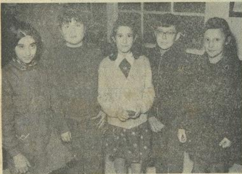
D'autres petits artistes en herbe du foyer de Fabrezan.

Samedi, à 17 heures, avait lieu à la M.J.C. de Lézignan, le vernissage de l'exposition de dessins d'enfants, dans le cadre du concours départemental de dessins et de peintures organisé par la « Maison-Père » de Lézignan.