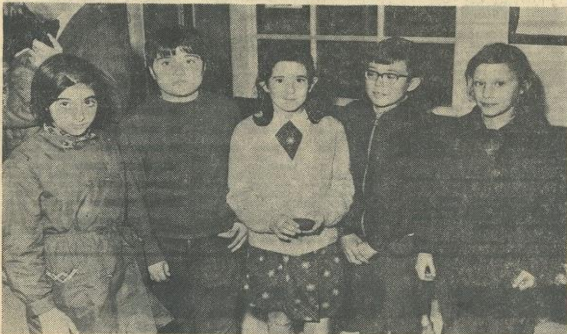
● Ce gracieux quintette mixte défendait le blason de Fabrezan - « Charles Gros ».