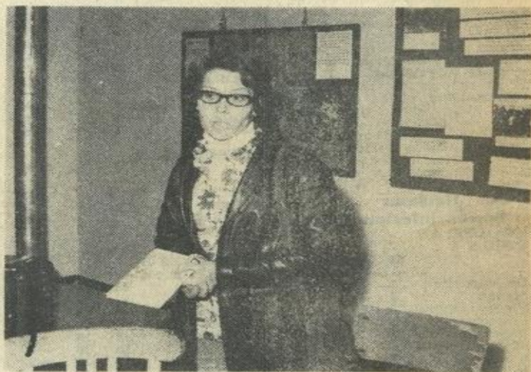
■ La présentatrice, au début de son exposé.

La présentatrice sut fort pertinemment, en quelques phrases, situer exactement l'homme bien connu par ses exploits authentiques et ses aventures ; mais aussi, l'écrivain profond qui se cache derrière cette façade. Souhaitons que les Lézignanais jeunes et adultes visitent cette exposition. L'entrée est libre et gratuite.