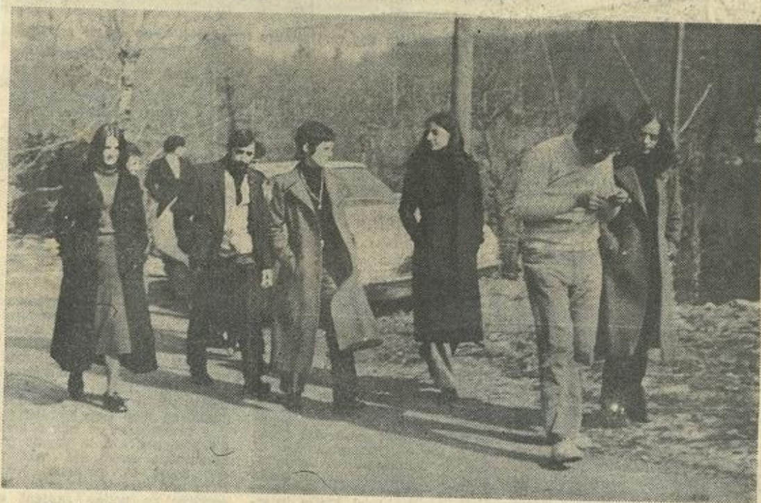
★ Un groupe de jeunes du Conseil de Maison.