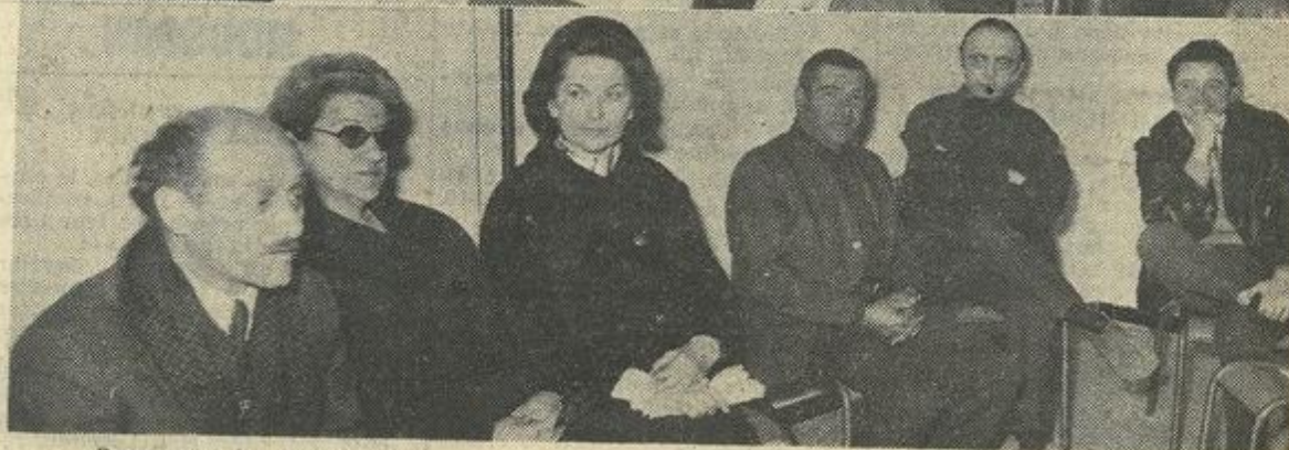
Deux vues des participants.