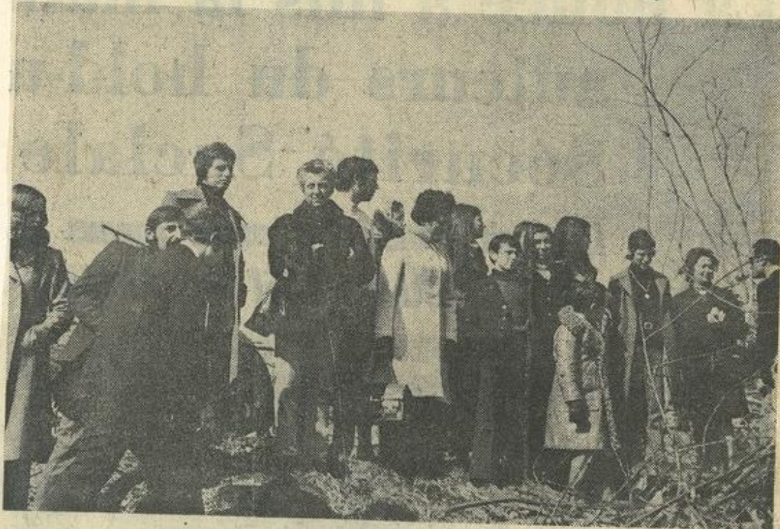
★ Le groupe des Lézignanais et Blomacois dans le Sidobre.