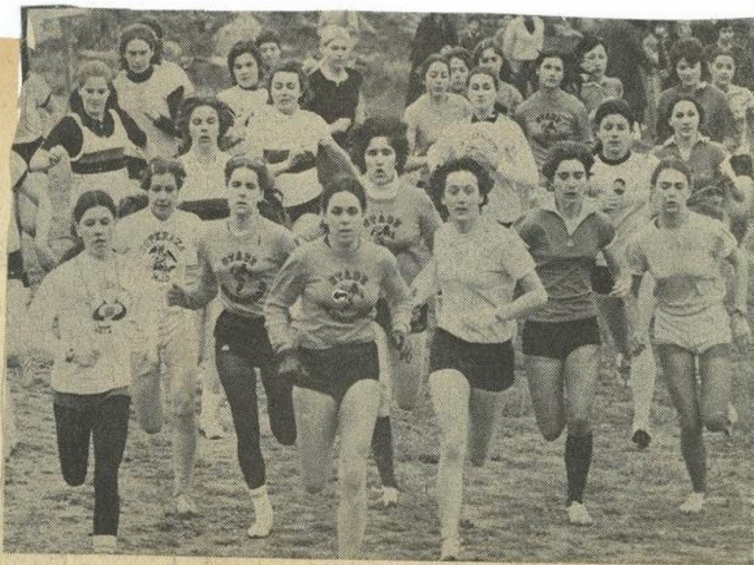
Le départ des juniors-seniors féminines.

Filles : Juniors-seniors : 1. Sarda (Villegly); 2. Gros (Caunes); 3. Bastié (Villegly); 4. Elen (Caunes); 5. Antonello (Caunes); 6. Chacon (Villegly).