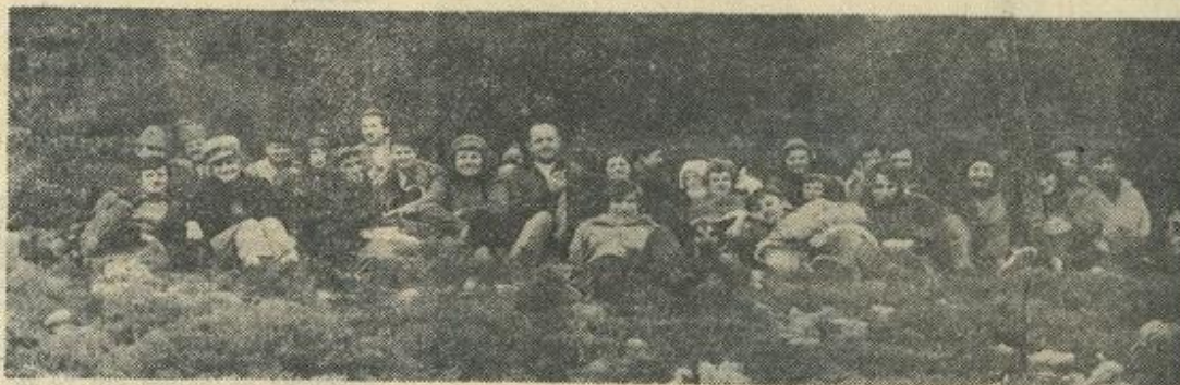
● Ouf ! Le sommet. Un bon repas sera le bienvenu et remettra de bien des fatigues.

Le « signal » a été atteint vers midi après 6 km de marche. Après le repas, dans un paysage de neige, deux groupes allaient terminer le « travail » : vers Camplong, vers Fabrezen et un troisième allait récupérer tout le monde au point de jonction où étaient stationnés les véhicules.