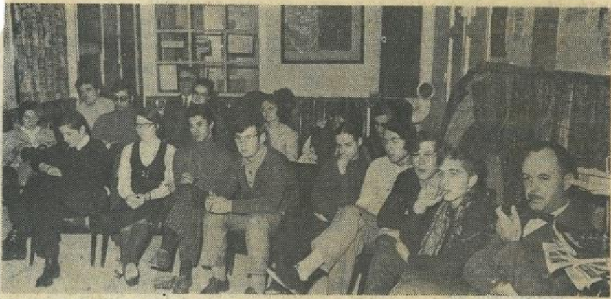
● Une vue d'ensemble de l'auditoire.

Devant une quarantaine de jeunes et d'adultes, M. Barlatier que nous avions eu déjà le plaisir de recevoir à Lézignan pour une conférence sur Cocteau, présente vendredi soir à la Maison des Jeunes et de la Culture une conférence sur la contestation dans la chanson.