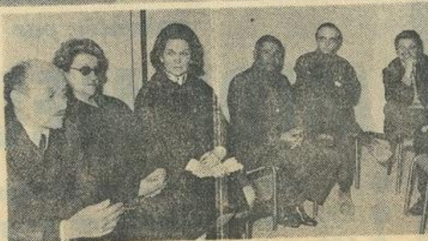
● Une vue d'ensemble des participants.