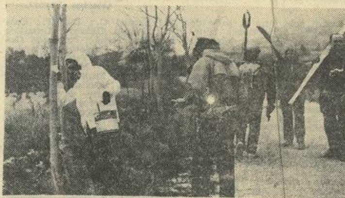
● Le travail du « traceur » : la peinture sur les arbres. (Photos Costesèque, Léznigan).

C'est là que fut pris un repas succulent sorti des « maxi-saquettes ».