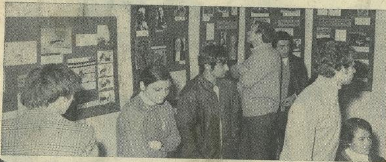
L'assistance était très intéressée.