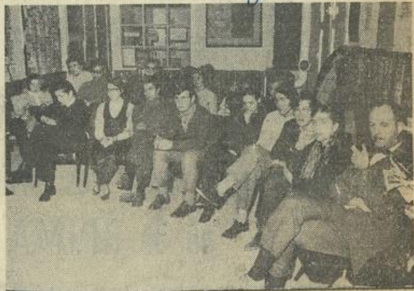
Une partie de l'assistance.