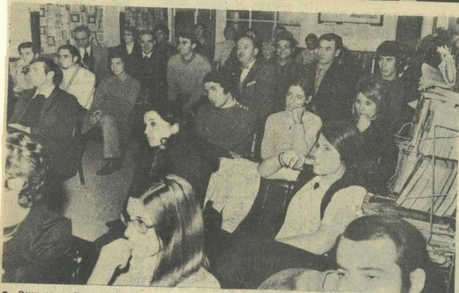
● Deux vues d'ensemble des participants.