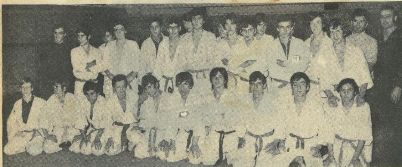
■ Notre flash rassemble les concurrents avant l'ouverture de la compétition.

Mercredi à 21 h se sont déroulées au gymnase Pierre de Coubertin à Lézignan les épreuves des championnats départementaux cadets de l'Aude de judo, championnats organisés par le Comité départemental de l'Aude.