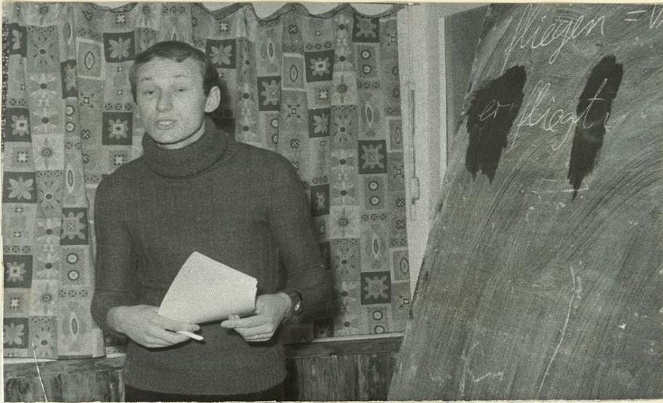
un étudiant enthousiaste