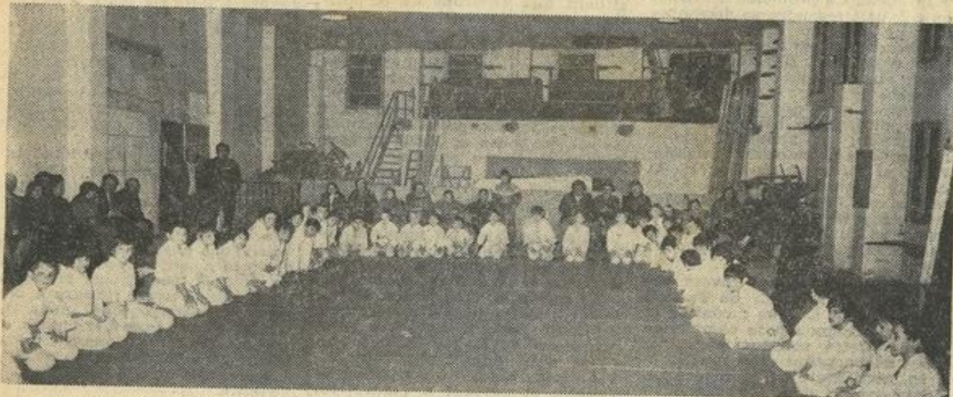
La démonstration dans la nouvelle et spacieuse salle.