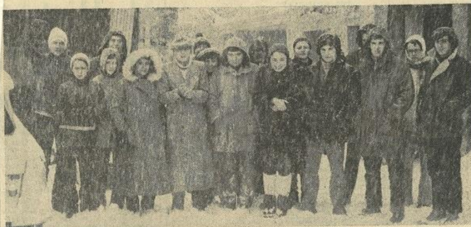
Le groupe léznignais sous la neige... à Camurac. Manque sur le document Jojo Riu, qui photographiait.

Le groupe du conseil de maison de la M. J. C. a fait cette semaine un déplacement à Camurac qui n'a pas été sans surprises et imprévus.