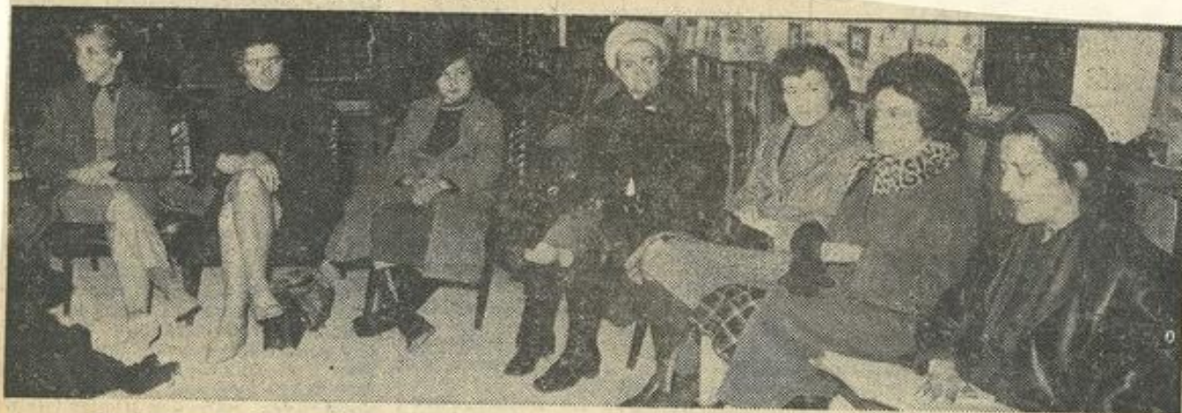
Quelques-uns des participants.