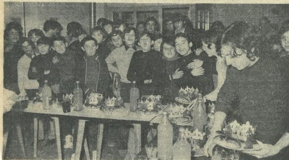
● Les garçons étaient en majorité.