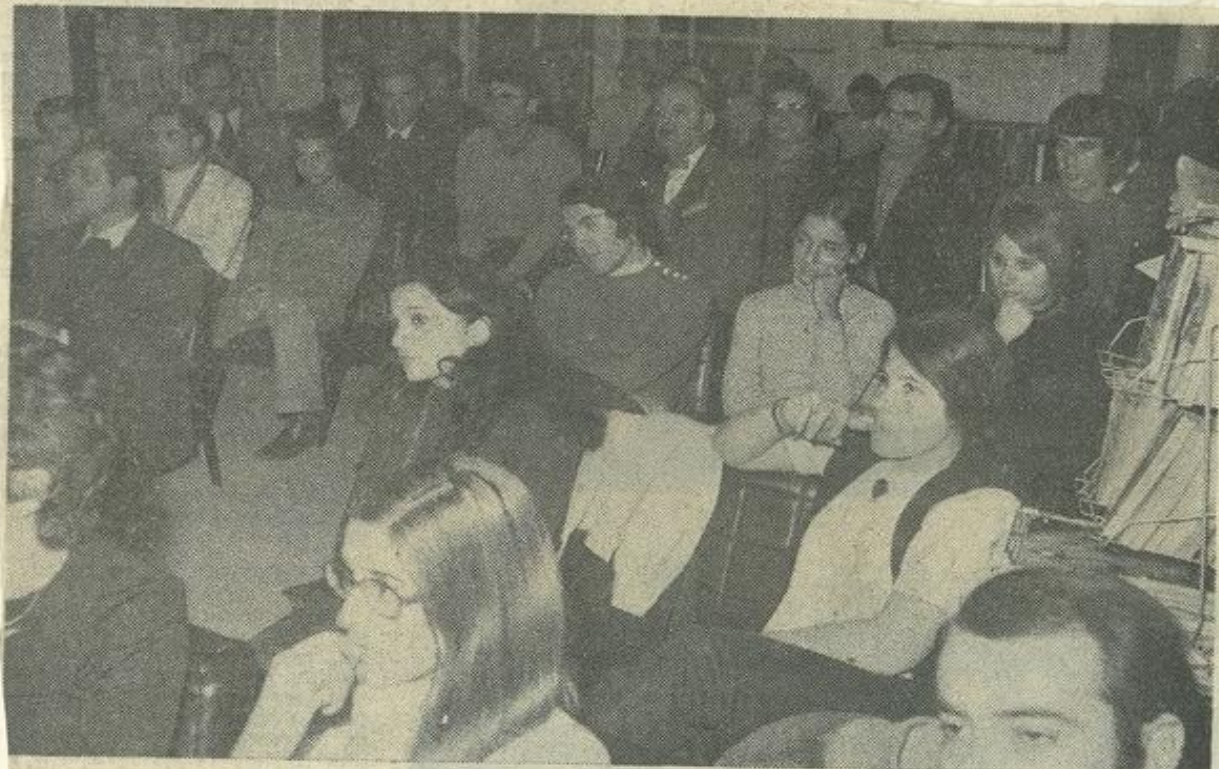
Une vue de l'assistance