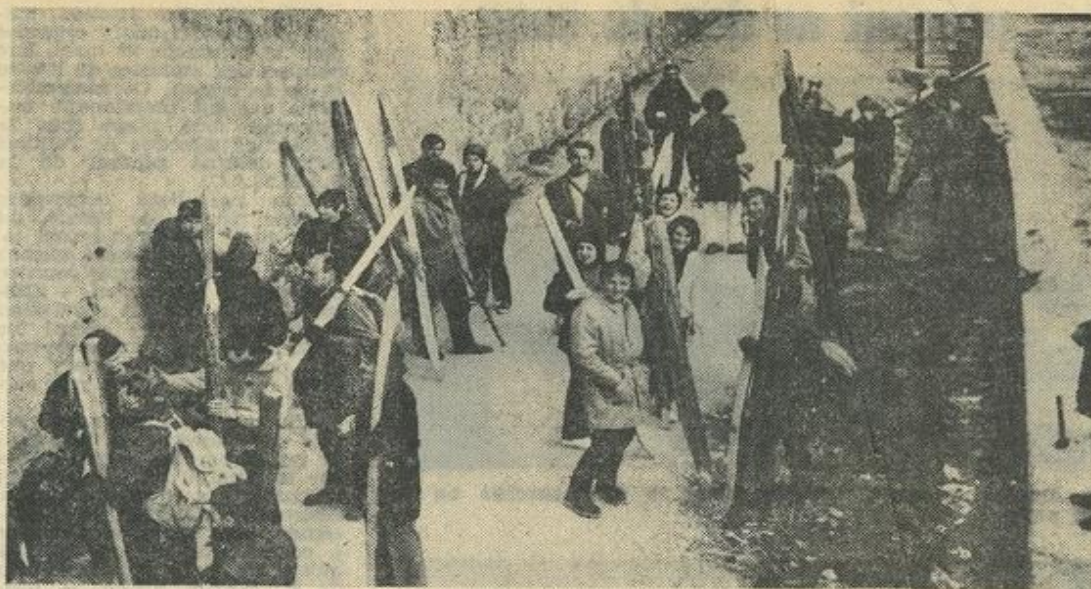
● Armés de pied en cap, poteaux sur l'épaule, prêts à baliser...