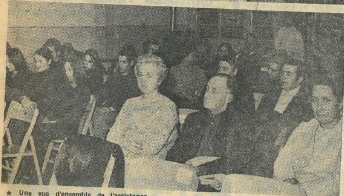
★ Une vue d'ensemble de l'assistance.