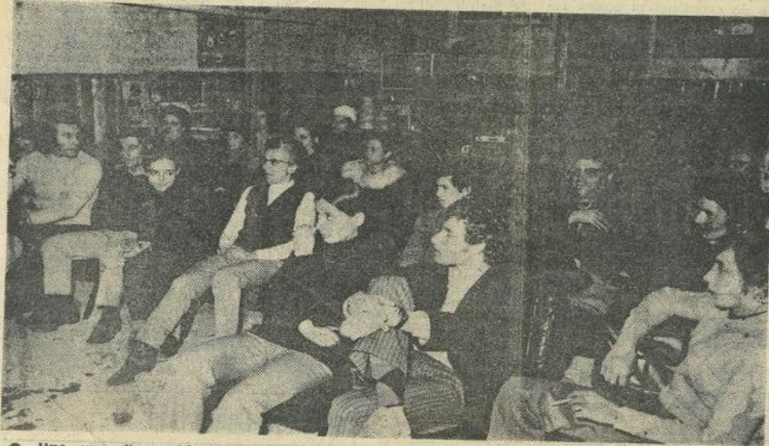
● Une vue d'ensemble de l'assistance.