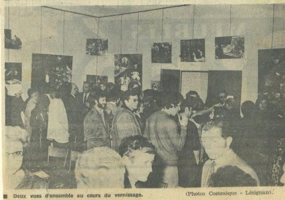
■ Deux vues d'ensemble au cours du vernissage.