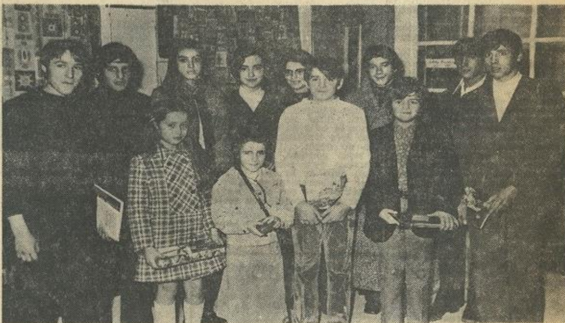
● Flash d'honneur, distinguant les douze lauréats.

Pour la remise des récompenses MM. Ouradou, Le Dantec et