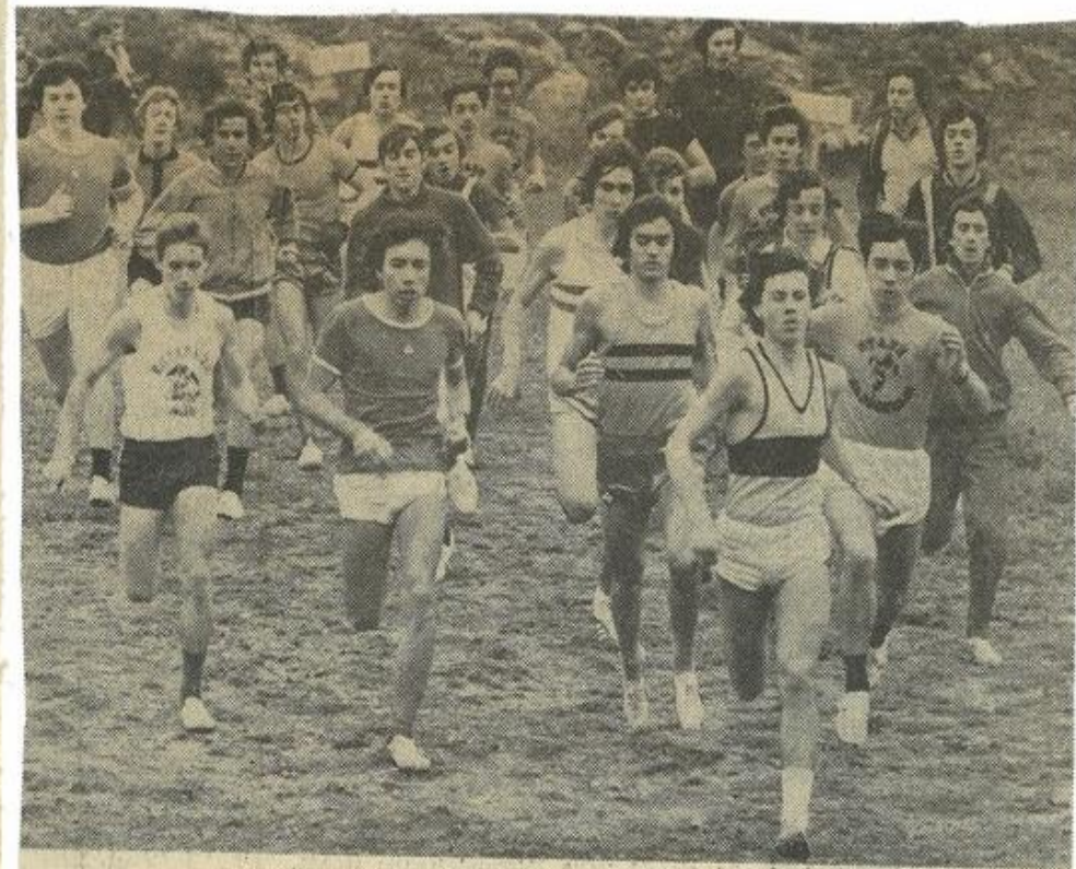
Un passage du peloton des cadets emmené par Cabo (Carcassonne).