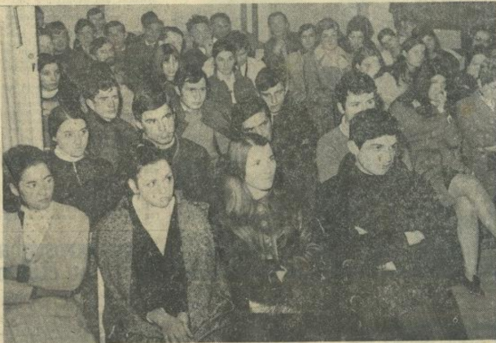
Une vue de l'affluence

directeur était celui d'animateur des animateurs, M. Sala dit qu'il fallait compter sur les personnes de bonne volonté pour la bonne marche des activités.