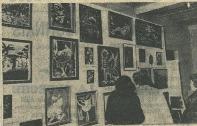
Voici les magnifiques tapisseries, œuvres des jeunes et moins jeunes Léznignaises exposés à la mairie de notre ville.