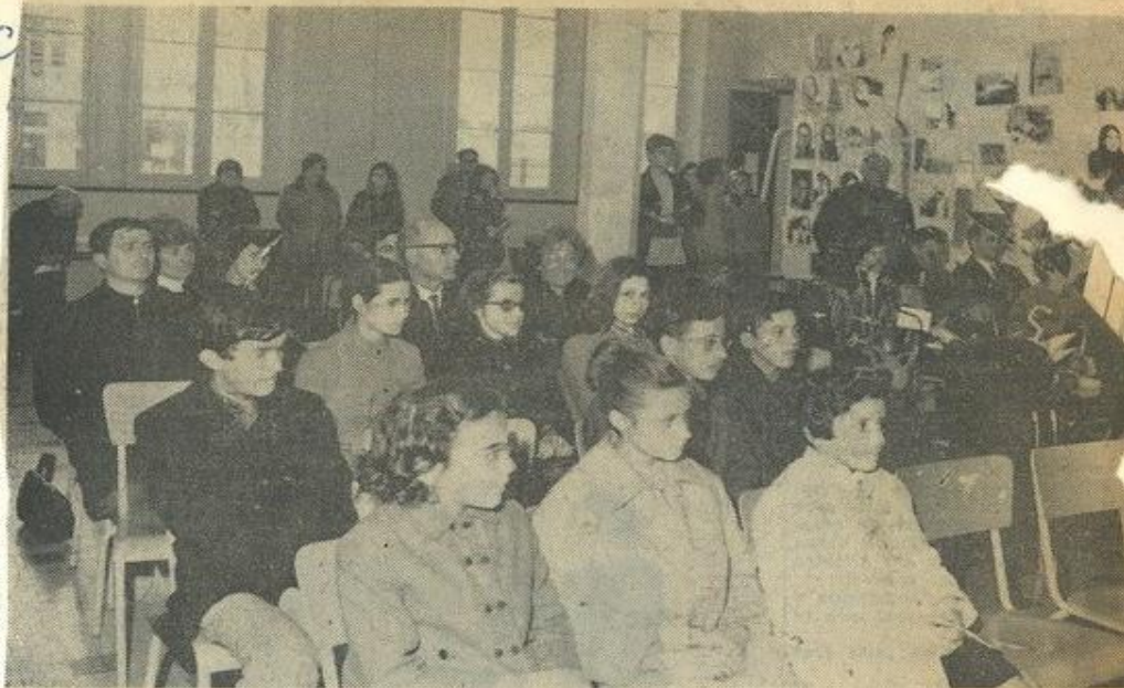
Lauréats, parents et amis des jeunes artistes.

Brillant succès du concours départemental de dessins organisé dans le cadre de la Quinzaine culturelle de la M.J.C.