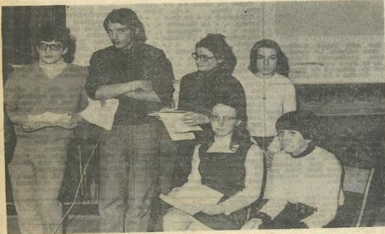
Récitantes et récitants du club d'histoire.