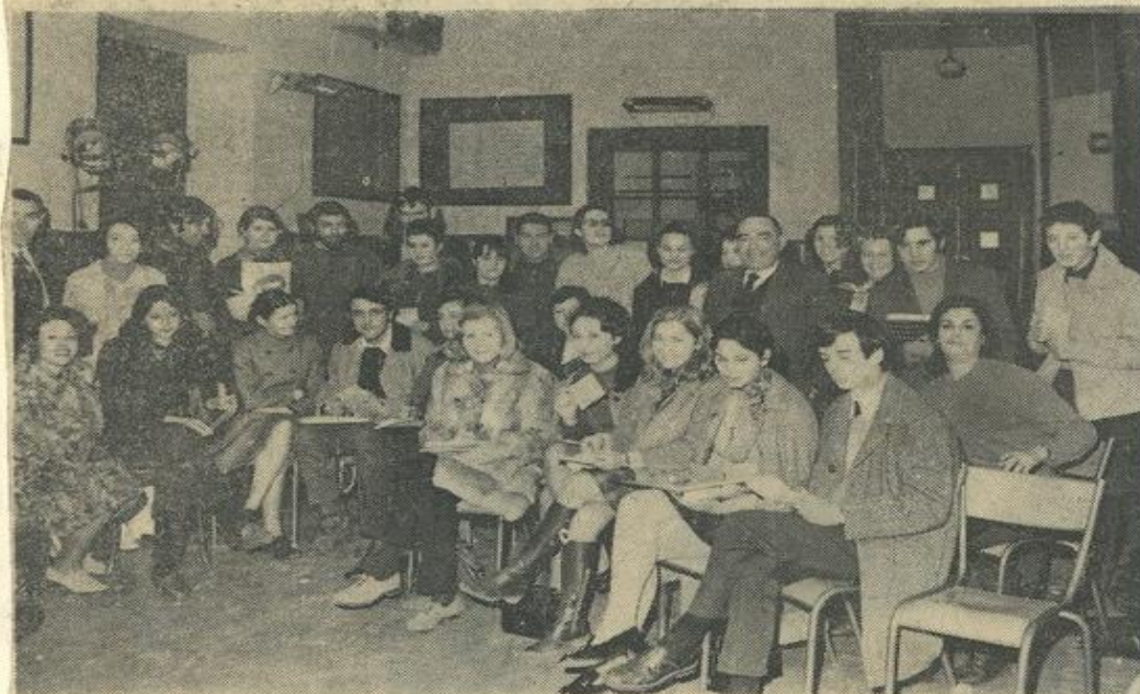
Week-end « Art dramatique » : sourire et confiance sont ici de rigueur.

L'encre d'un certain stylo de responsable de la M.J.C. locale s'étant assurément gelée, nous lui prêtres bien volontiers le nôtre pour annoncer que la Maison des jeunes, la Fédération audoise des œuvres laïques et le club des loisirs Léo-Lazrange tenaient con-