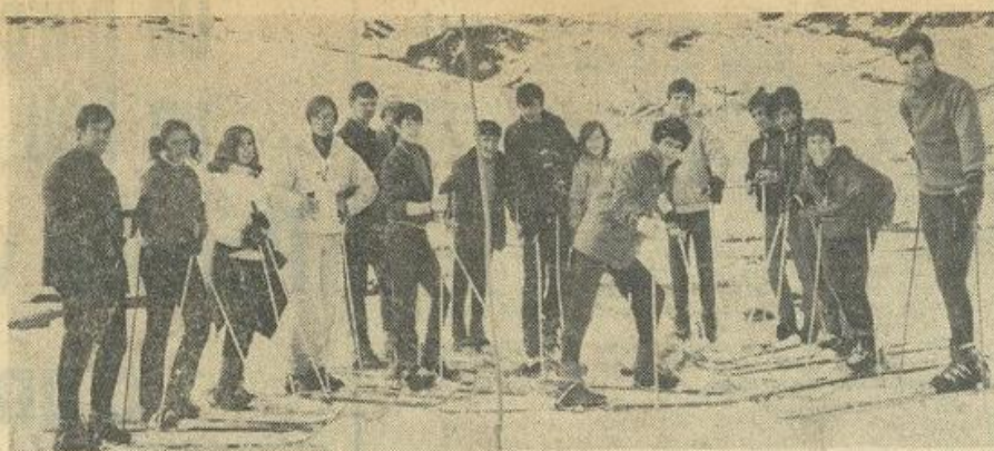
Sur la ligne de départ...

Après la course préparatoire, qui s'est déroulée le 27 février à la Chioula, et à laquelle 55 participants avaient pris part, le prix de Léznigan, pour les scolaires a eu lieu jeudi dernier aux Monts-d'Olmes.