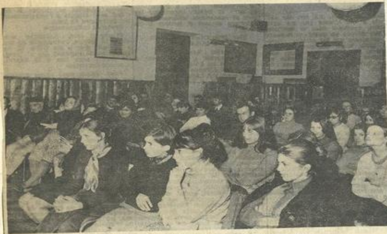
La nombreuse assistance, où l'élément jeune dominait.