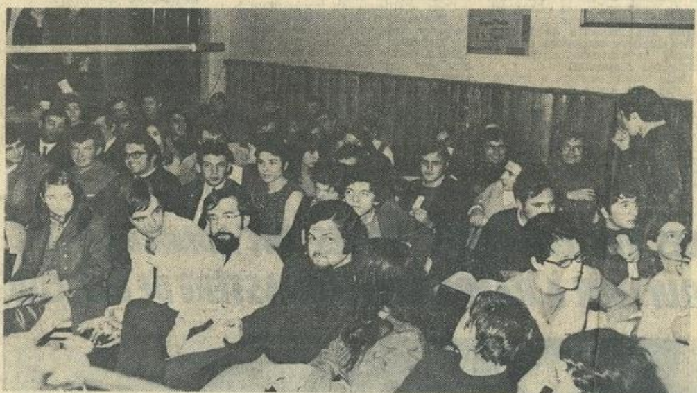
● Ambiance nouvelle vague et fort enthousiaste mardi soir dans la grande salle du 25 de la rue des Vosges..