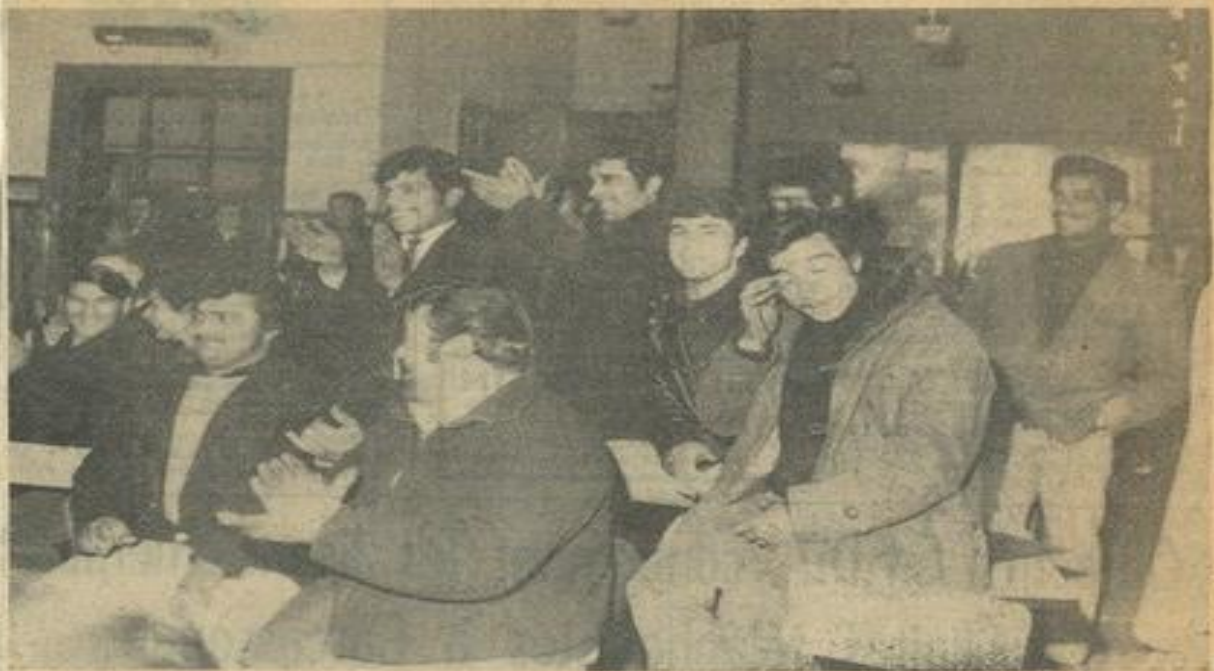
Une partie de l'assistance. Les rires fusent. Les applaudissements crépitent.