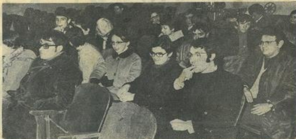
● Avant la projection de « L'impossible M. Bébé » l'un des classiques de la Comédie américaine.