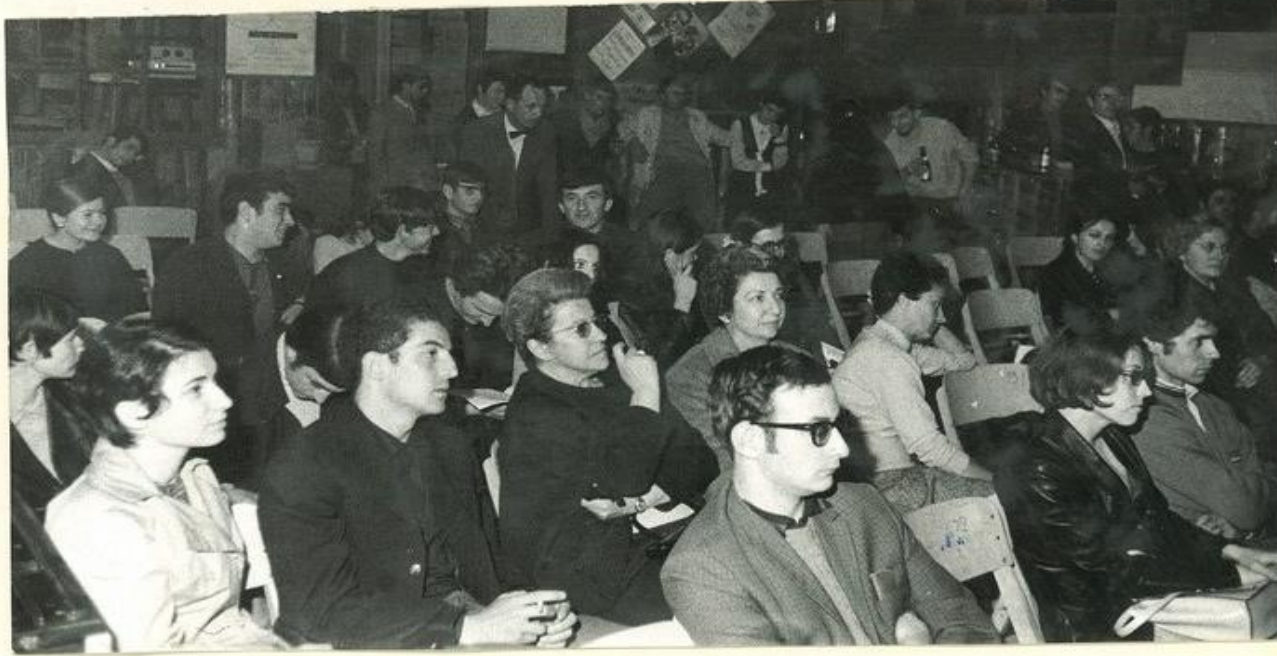
Ski Club: Distribution de prix.