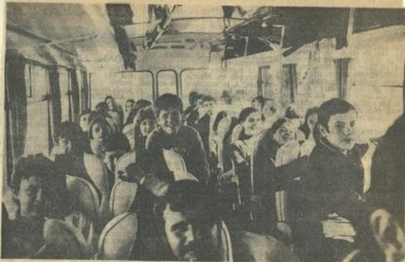
● Au départ pour les Monts d'Olmes un car de joie sur les « chapeaux de roue ».