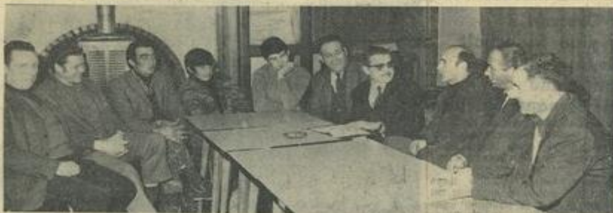
Le bureau pendant les travaux.