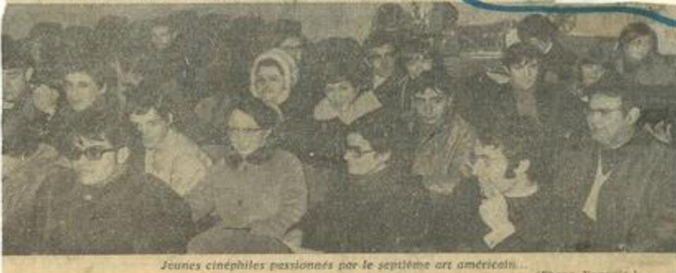
Jeunes cinéphiles passionnés par le septième art américain...