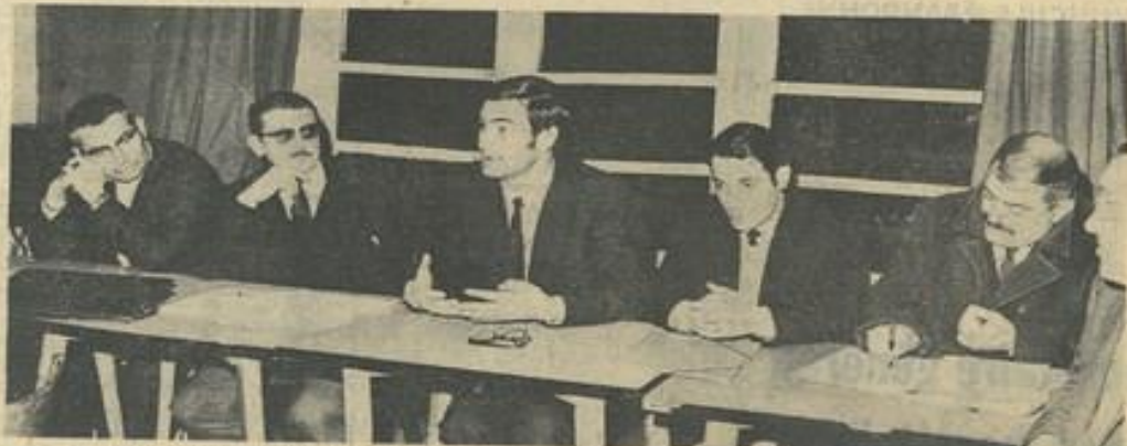
● Ci-dessus les membres du bureau.