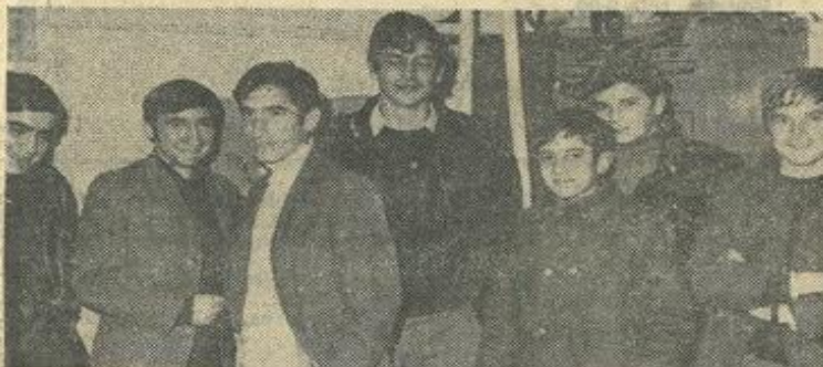
L'aéromodélisme lézignanais était bien représenté.

L'assemblée constituante de l'Aéro-Club Narbonne-Lézignan, qui s'était tenue à la sous-préfecture remonte tout juste à trois mois. Un trimestre qui aura été fort bien employé par les dévoués promoteurs et qui aurait été bien suffisant pour pouvoir affirmer après cet envol, réalisé sans encombre dans un ciel serein, que tout va parfaitement bien à bord, que les espérances les plus optimistes sont dépassées et que la vitesse de croisière est atteinte. Ce sont ces prometteuses constatations inscrites sur la première page du carnet de bord qu'a reflétée vendredi soir, la première assemblée générale d'une très nombreuse assistance, parmi laquelle, raison supplémentaire d'espérer, une consistante représentation de jeunes.