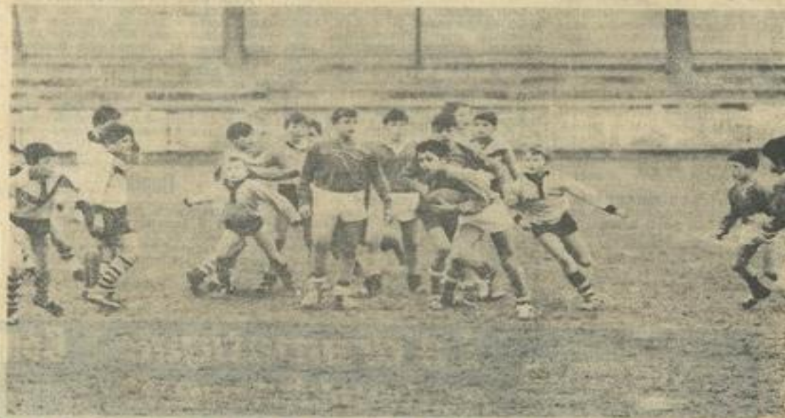
● Au cours du match des minimes, une sortie de mêlée pour les locaux. Protégé par ses avants, le demi tente l'échappée.