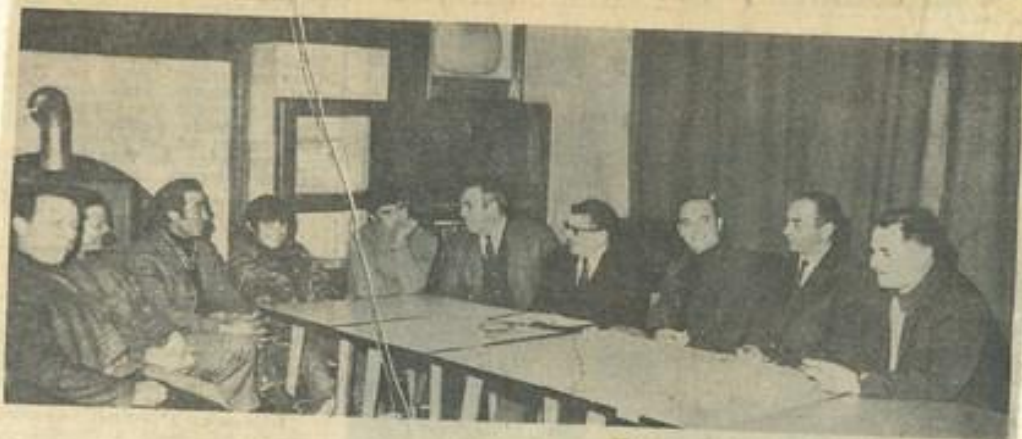
● Les dirigeants, à pied d'œuvre, dressent le plan d'organisation de la saison future, axée essentiellement en faveur des jeunes pousses, de plus en plus nombreux.