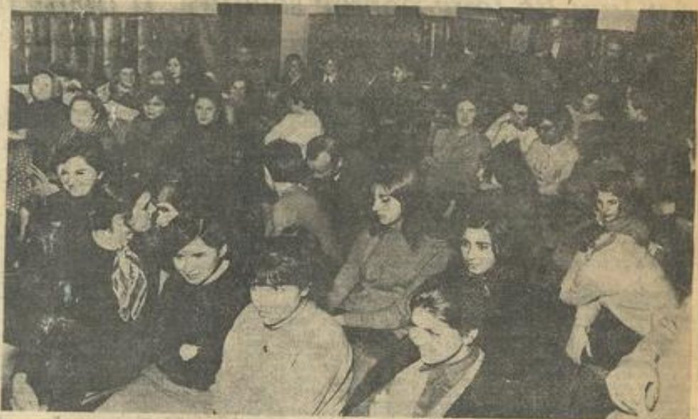
● Encadré d'enseignants et de parents, l'assistance était tout à fait nouvelle vague.

M ARDI soir au foyer de la Maison des Jeunes et de la Culture avait lieu une soirée évoquant la Résistance dans les hauts cantons de l'Hérault, présentée par une équipe du Club d'Histoire du lycée Joseph Anglade.