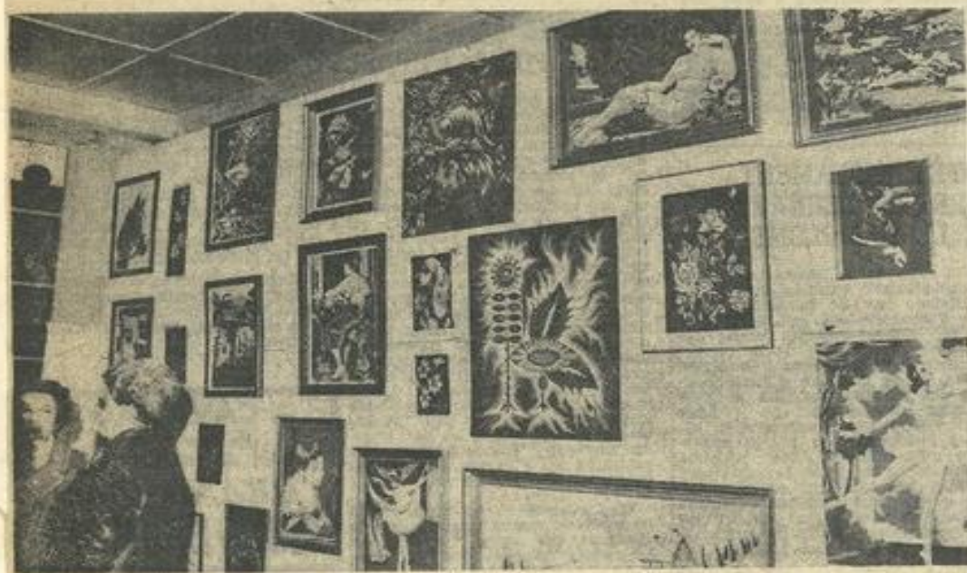
● Une vue d'ensemble de l'exposition.

Essentiellement réservée aux dames (31 exposantes de Lézignan et des environs) ont participé cette manifestation de l'art cultu- rel dont la visite vaut la peine, restera ouverte au public jusqu'au 23 mars.