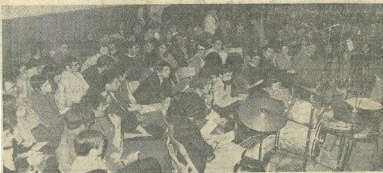
Une vue de la nombreuse assistance, le soir, venue voir et écouter Hal Singer