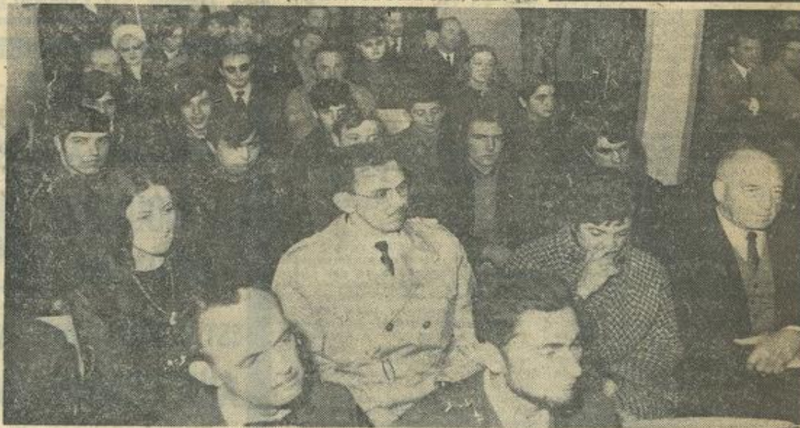
Une vue partielle de l'assistance

mentaire. Par contre 32 pilotes s'entraînent actuellement d'une