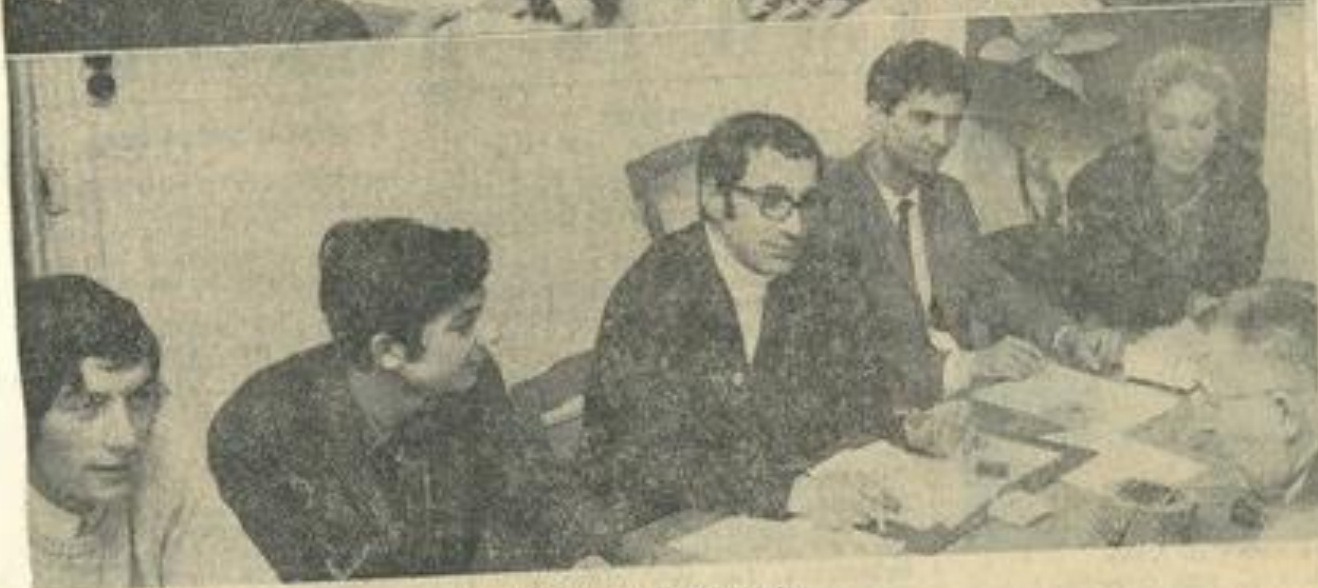
Les membres du Spéléo-Club