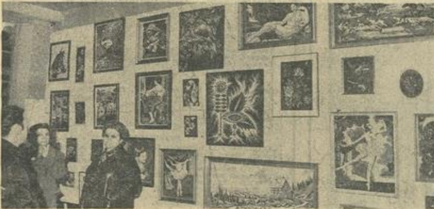
Quelques-unes des magnifiques tapisseries exposées, tandis que les premiers visiteurs commencent à affluer lors du vernissage.

Y aurait-il tant d'Ulysse lézignanais partis pour de longs voyages ? La capitale des Corbières ne manque pas, en tout cas, de modernes Pénélope, penchées sur leur ouvrage, pour réaliser avec une patience d'ange et une dextérité d'artiste de délicates et complexes broderies.