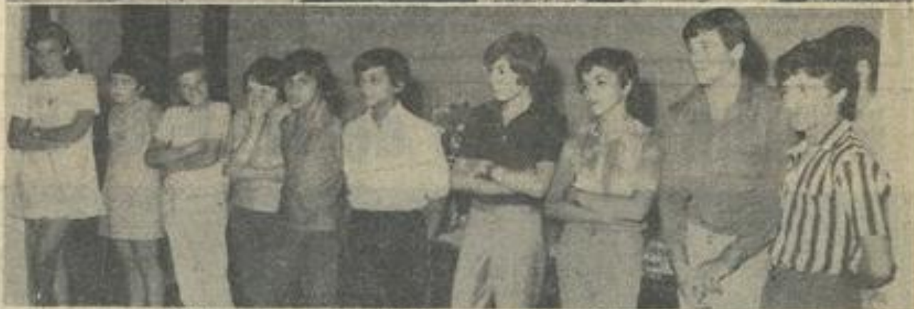
Athlètes et nageurs attendent leur tour pour recevoir les récompenses.

La distribution des prix, cette manifestation scolaire qui annonçait sur un air de fête les grandes vacances, n'a plus, paraît-il, sa raison d'être. Mais chez nos sportifs, on a encore conservé l'esprit d'émulation et la notion de classement. Cela a permis à beaucoup de nos jeunes garçons et filles de se distinguer dans les diverses compétitions départementales et régionales et de glaner sur le terrain une belle moisson de médailles et diplômes. C'est pour recevoir ces récompenses que les athlètes de la J. S. L. et les nageurs du Club