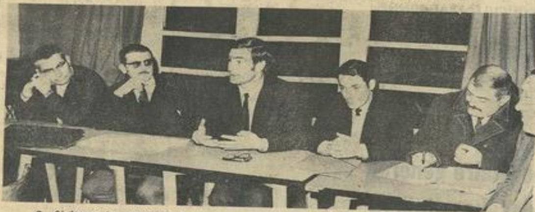
● Ci-dessus les membres du bureau.