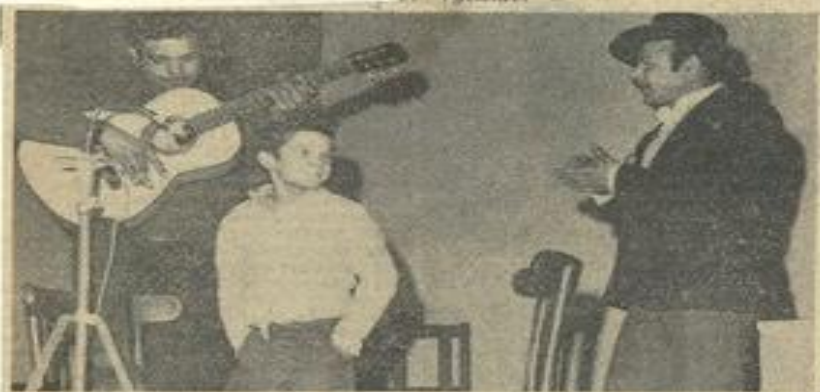
Au cours de la soirée, un jeune gitan se produit dans son tour de chant, avec un solide accompagnement.