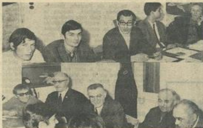
Tous les clubs du département étaient représentés à cette réunion qui s'est tenue vendredi soir à son siège social à la Maison des Jeunes et de la culture de Carcassonne.