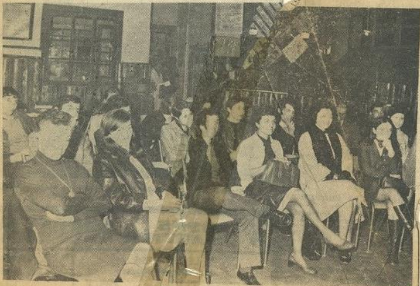
aud... s'intéresse et médite.