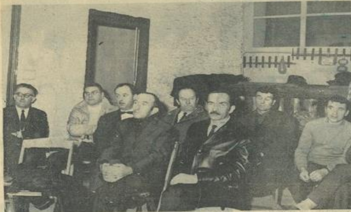
Les nombreux représentants des M. J. de l'Aude.

Vendredi soir s'est tenu à la M.J.C. de Carcassonne le conseil d'administration de la Fédération départementale des M.J.C. de l'Aude. A ce jour, vingt et une maisons des jeunes et de la culture sont en exercice dans notre département. D'autres viendront augmenter ce chiffre sous peu. C'est vraiment réconfortant car c'est toujours à la demande des jeunes, aidés par des adultes, que ces maisons sont créées.