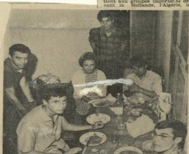
• Ici, un Algérien, deux Portugais, un Belge, une Française, un Français, partagent la même table. (Photos Costesèque).

OBJET : A l'occasion des travaux saisonniers des vendanges (cueillette des raisins pour le vin), la Maison des Jeunes organise un chantier international, véritable rencontre internationale qui permet à des jeunes, français et étrangers, de connaître le pays.