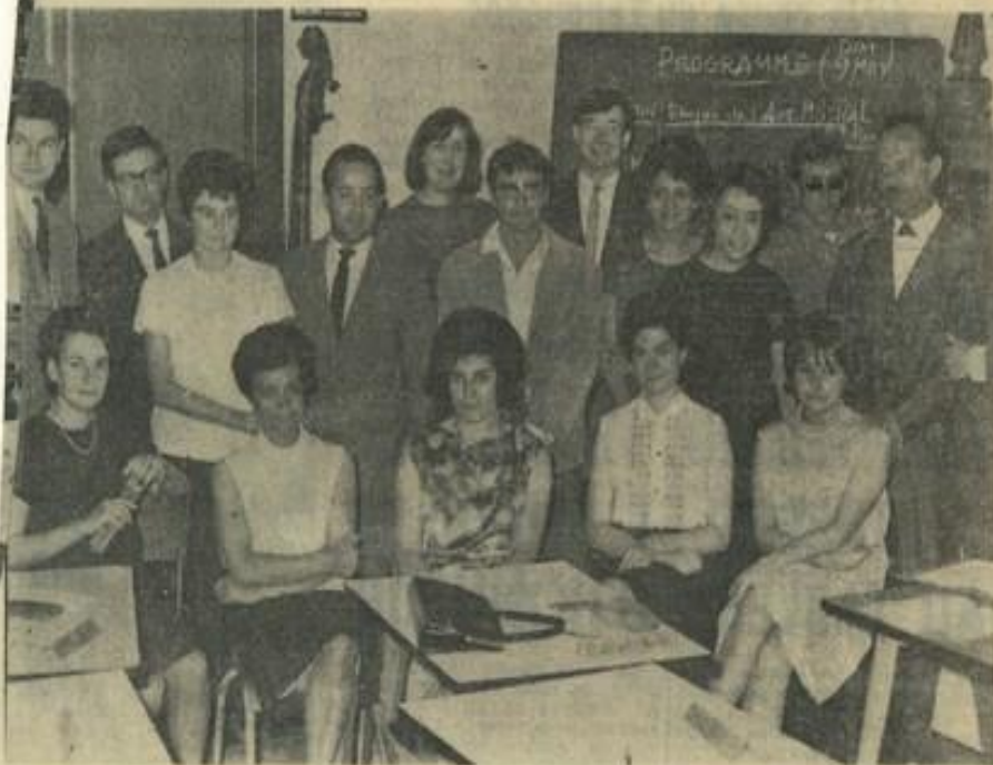
Une vue des participants.