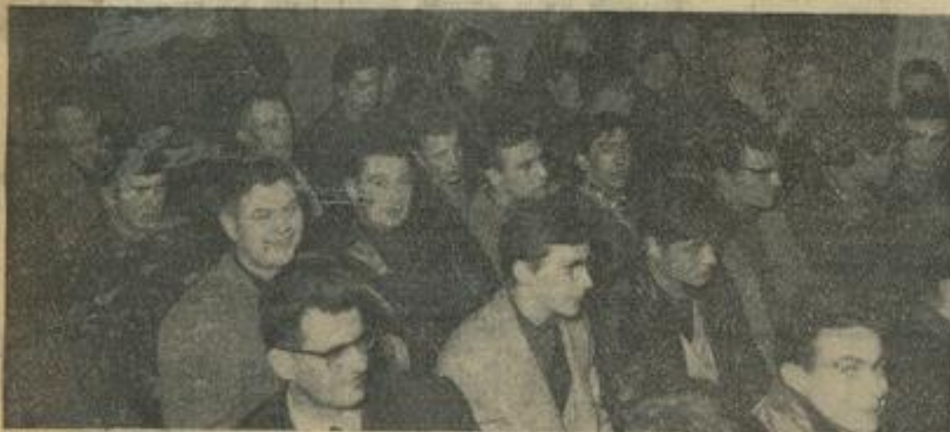
Un groupe de jeunes enthousiastes et curieux qui montrent les vrais raisons de vivre de la M. J. C... sa jeunesse.