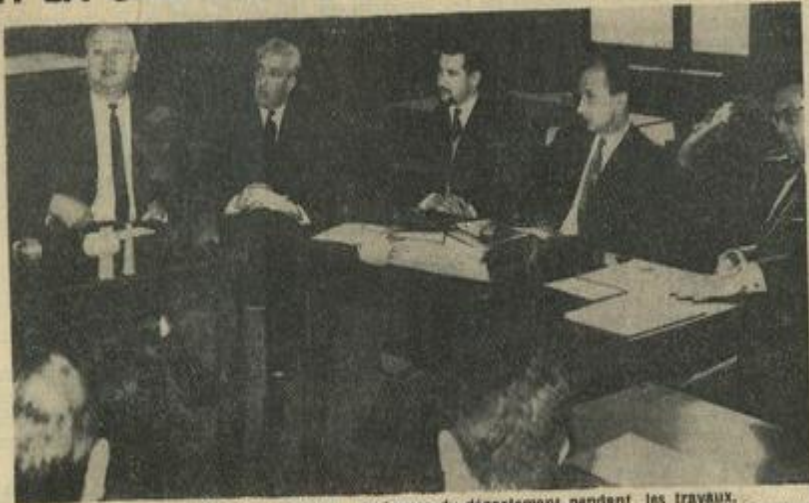
Les responsables des maisons de jeunes du département pendant les travaux.

Hier matin, se sont déroulées à Carcassonne, les réunions du conseil d'administration de la fédération départementale des M.J. de l'Aude, en la salle des mariages de la mairie, et des responsables des conseils des M.J.C. de