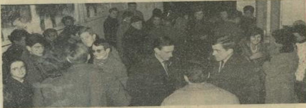
Après la séance, la discussion ébauchée au Ciné-Club continue dans le hall, et parfois même sur le trottoir. Les jeunes ne sont pas toujours les moins enthousiastes et passionnés.

La Maison des Jeunes et de la Culture marche allègrement vers sa vingtième année d'existence sans avoir rien changé à sa ligne d'action qui est la diffusion de la culture et l'éducation populaire, mais aussi la formation civique des jeunes et la prise de responsabilités. Divers moyens sont à sa disposition pour ce faire, et le ciné-club en est un. Tandis que nous sommes habitués à voir la science descendre des instituts aux instituteurs et aux élèves, l'éducation populaire présente un mouvement inverse : la libre ascension de la personne vers les formes de culture qui lui conviennent.