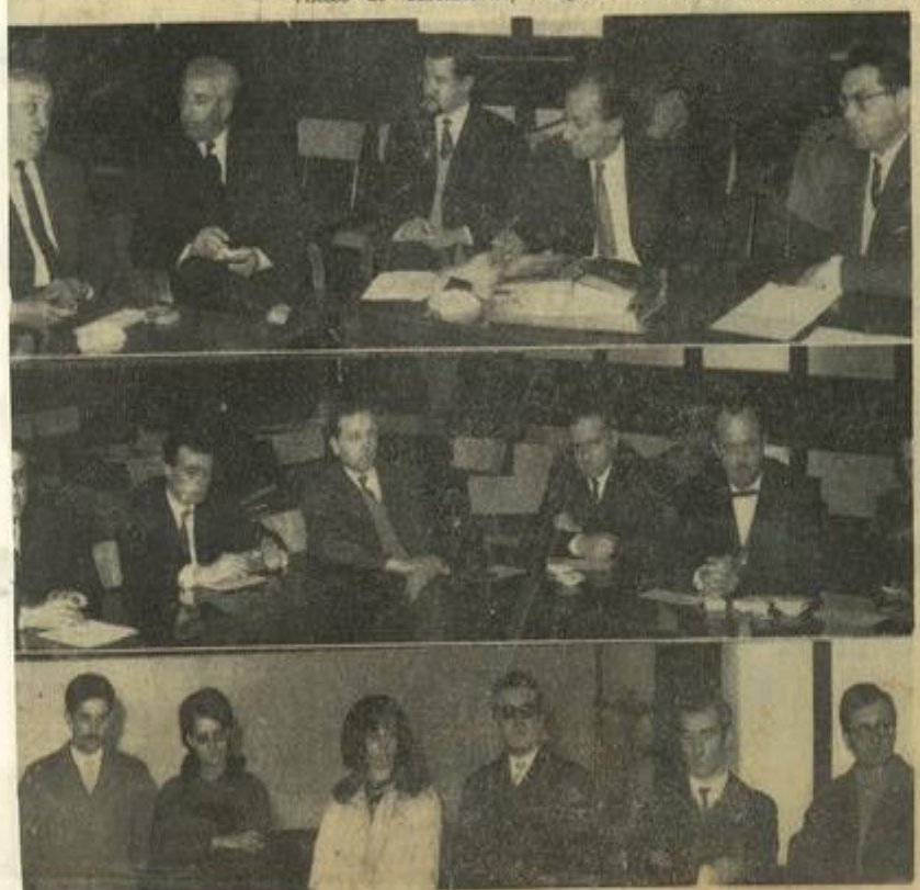
Responsables et animateurs des Maisons de Jeunes réunis à la mairie