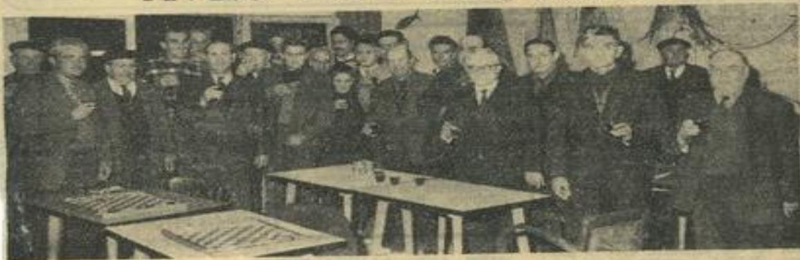
Après l'effort, les damistes participent à la deuxième phase du championnat de l'Aude et leurs supporters se réconfortent dans l'auditorium de la M. J..