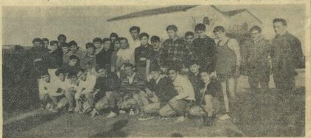
● Avant le signal du starter, les concurrents de l'épreuve catégorie cadets posent pour «L'Indépendant».