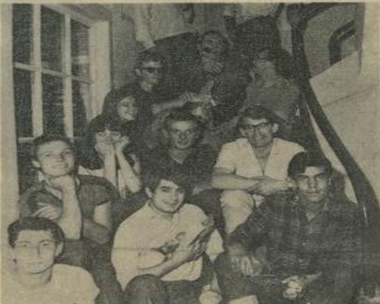
• Dans cette cage d'escalier nous découvrons, prêts pour la cueillette, un Français, un Irlandais, deux Portugais, cinq Britanniques dont deux souriantes miss, un Polonais.

A leur disposition pouvaient se proposer 28 sujets de la blonde Albion (Anglais), 22 Allemands, 15 Français, de Lille, Brest, Marche, 1 Lézignanais et 1 Carcassonnais qui en était à son deuxième camp, ainsi que 4 Miss ayant franchi le Channel. Avec 12 participants la Pologne appartient aux groupes importants devant la Hollande, l'Algérie, la