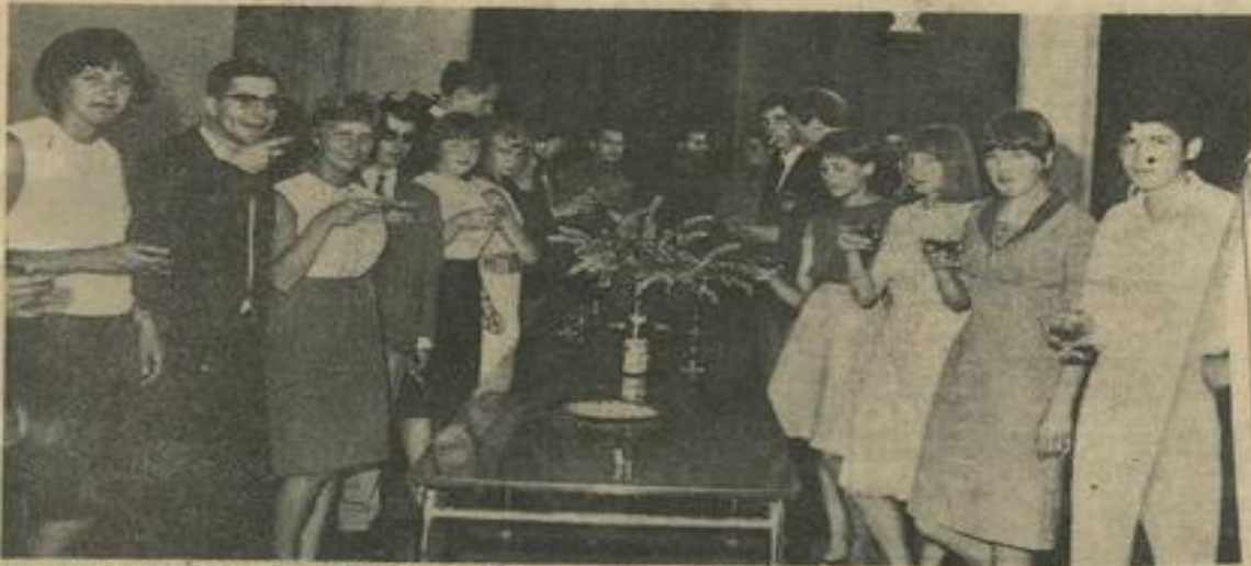
● Au cours du vin d'honneur, lycéens lézignansais et allemands se sont réunis pour le cliché souvenir.