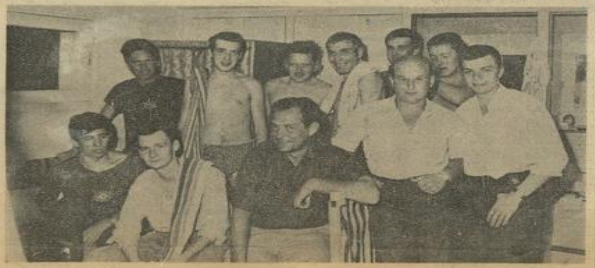
• Au nombre de 22 Allemands inscrits, ce groupe, où se reconnaissent de jeunes visiteurs venus de Haute-Normandie.