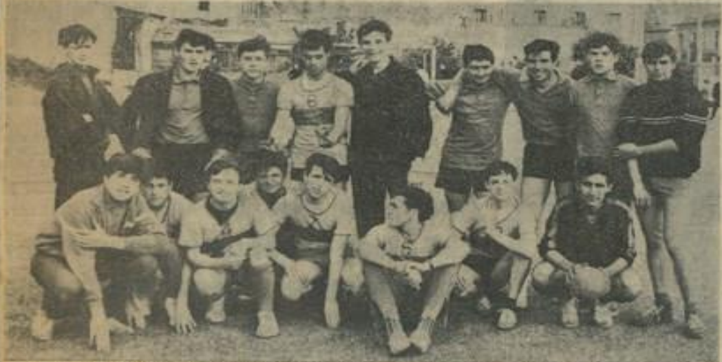
PLACE AU SPORT DANS LA MATINÉE.— Ces jeunes ont participé au tournoi de hand sans se soucier du tableau de marque, ils se sont appliqués à pratiquer dans le meilleur esprit du hand.