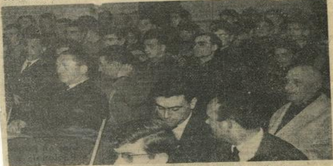
Jeunes et parents emplissent la salle de réunion de la mairie.

Nous publierons demain, l'intervention de M. Augé, premier adjoint au maire, à propos du futur gymnase.