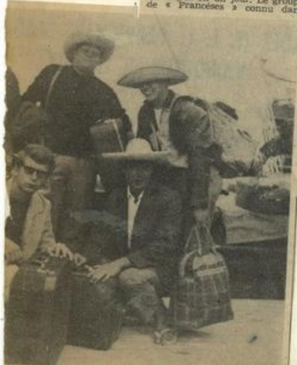
de la joie en débarquant à Las Palmas ; ce groupe de sourient. A nous 16 jours de vraies vacances.