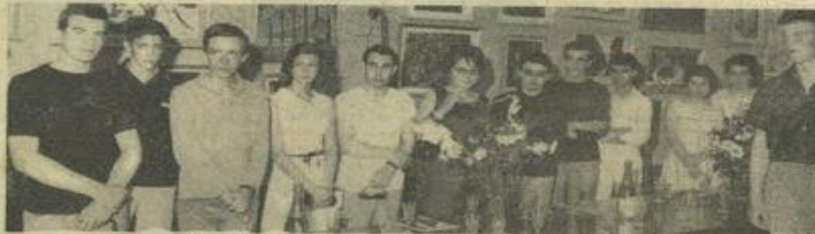
Un groupe de stagiaires de « Connaissance de l'Aude » et leurs conseillers de séjour, durant la réception à la mairie.