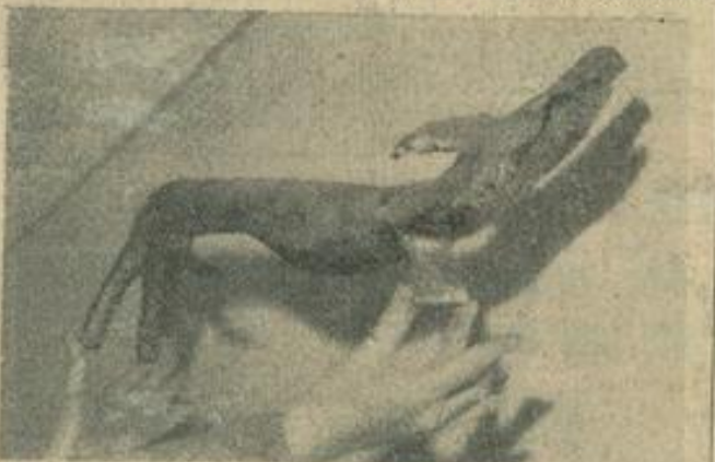
Façonné dans le bronze, voici « Daschung », chien basset dont la ligne harmonieuse et pure nous emporte vers les hauts lieux de la sculpture moderne.

Tout comme celles de Jean Martinolle, les œuvres de J.-C. Bouyssou prendront évidemment place sur les cimaises de la prochaine exposition de nos Amis des Arts, au printemps prochain. Elles y seront attendues avec curiosité pensons-nous, et accueillies, nous en sommes certains, avec le succès qu'elles méritent.