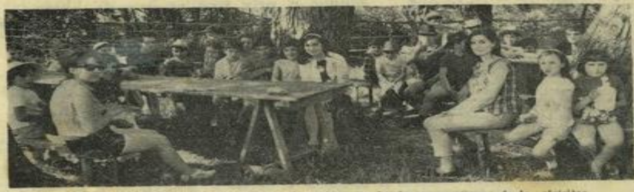
Retour de promenade, voici l'heure du goûter sur les bancs rustiques de la clairière ombragée.