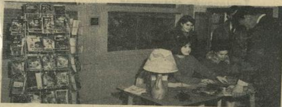
C'est avec le sourire que les jeunes responsables du Conseil de Maison reçoivent les lecteurs dans la coquette salle réservée à la bibliothèque M. J. On aperçoit, à droite, le touriquet - présentoir réservé aux « policiers ».

A cette question, le Conseil de Maison de la Maison des Jeunes a répondu : « Pas assez ».