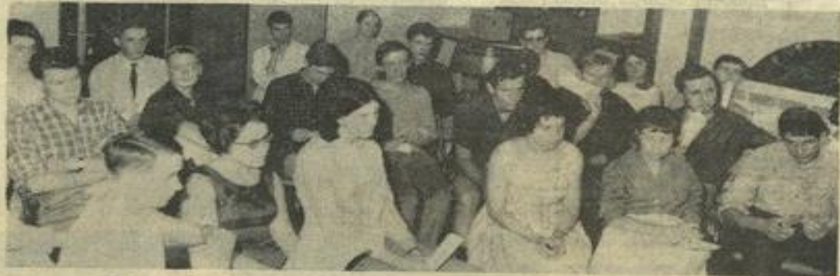
Une vue des stagiaires durant la réunion plénière de début de session à la M. J.

alisé par l'équipe de cinéma de la M. J. : « La Vigne et le Vin ». Samedi 10 juillet : 9 h. : Les réalisations sociales et les industries de la ville de Lézignan. 14 h. : Réalisation des stagiaires. 21 h. : Au théâtre de la Cité « Bérénice ». Dimanche 11 juillet : 9 h. : Réalisation des stagiaires. 11 h. : Une journée dans une famille lézignanaise. 21 h. : Théâtre de la Cité. Lundi 12 juillet : 9 h. : Réalisation des stagiaires. 14 h. : Visite du musée archéologique de Mailhac. 21 h. : Veillée de détente organisée par les stagiaires. Mardi 13 juillet : Table ronde. Conclusion du stage.