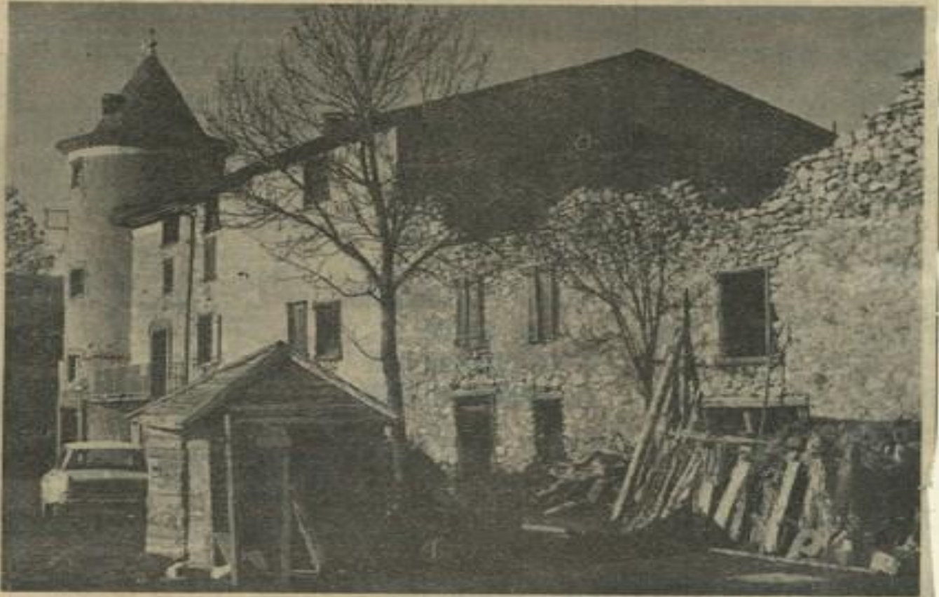
« Le château » de Camurac, tel qu'il se présente actuellement, avec ses dépendances vaincues par le temps.

Depuis plusieurs années, la Maison des Jeunes de Narbonne — qu'il nous soit permis de la prendre comme exemple — ouvrait pour une démocratisation du ski. Pour cela, elle formait, tous les dimanches, des cars spéciaux qui transportaient sur les pistes de Pont-Romeu d'abord, sur celles de Camurac ensuite de forts contingents de jeunes skieurs. Cette solution était bonne, très bonne même, mais posait certains problèmes aux dévoués dirigeants. L'un des plus ardues était sans aucun doute, celui de l'hébergement dans la station. Si le mauvais temps faisait subitement son apparition, il était très difficile de mettre les jeunes sociétaires à l'abri. L'autobus se trouvait là