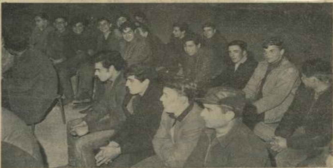
● La jeunesse saint-andréenne a manifesté, par une nombreuse présence, son intérêt vis-à-vis des activités M.J.C., témoin ce coin de salle.