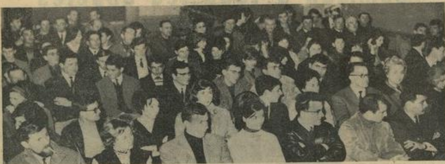
• Une vue de la jeune et nombreuse assistance de l'assemblée générale de la Fédération départementale M.J.C.