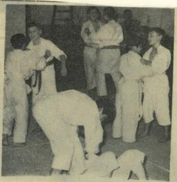
Cadets et juniors préparent soigneusement la compétition de dimanche.

Tous nos vœux accompagnent nos représentants judokas dans ce difficile déplacement.