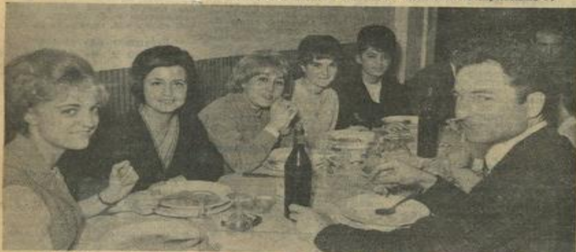
● Notre gracieuse jeunesse a également adopté la formule « D. D. ». En voici la preuve : les jeunes gens voisinant avec les moins jeunes à la table de ce dîner-débat servi au « Grand Soleil ».