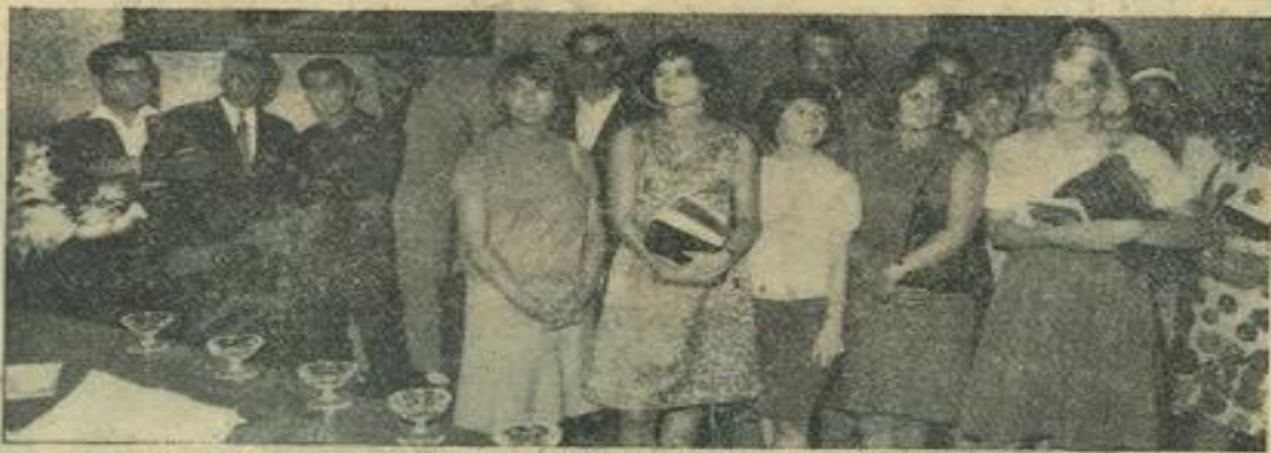
Une vue partielle du groupe berlinois et tunisien, lors de la réception à l'hôtel de ville. (Photo Costesèque).

On sait que durant les vacances de Pâques, une délégation de la municipalité et de la Maison des Jeunes était l'hôte de la Maison des Jeunes de Radès, en Tunisie, et qu'au cours de ce séjour, dont nos représentants merveilleusement bien accueillis, avaient conservé un inoubliable souvenir, un accord de jumelage fut conclu.