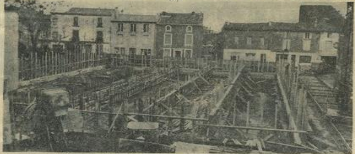
Une vue du chantier, du balcon du premier étage de la Maison des Jeunes. (Photo Costesbègue).

De tous les projets municipaux, la construction d'un gymnase municipal, est bien vraisemblablement celui qui se sera fait le plus attendre avant d'entrer dans la voie des réalisations. Depuis combien de temps l'espérait-on ? Une bonne douzaine d'années pour le moins. Aussi, est-ce maintenant avec une délectation toute particulière que tous ceux qui l'ont voulu comme tous ceux qui en seront les utilisateurs assistent maintenant chaque jour à sa lente mais sûre réalisation. Ce qui paraissait pour beaucoup une chimère est devenu une solide réalité. Aussi solide que les fondations que l'on voit s'élever sur le vaste chantier ouvert depuis la fin de l'été par l'entreprise Lapetina.