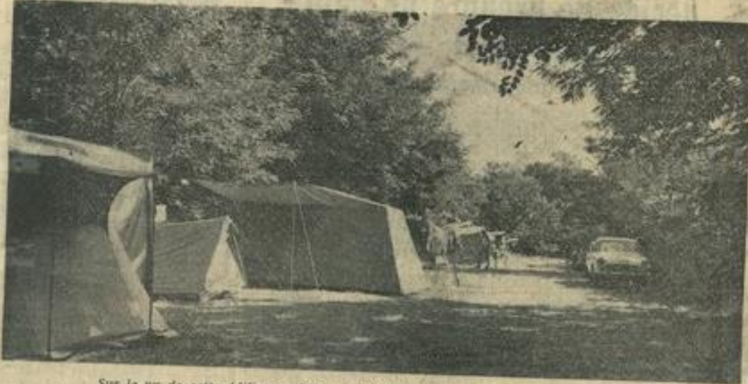
Sur le vu de cette édifiante photo, les connaisseurs — et les profanes — apprécieront ! Les conditions de vie en plein air offertes par le camping de la « Pompe » sont tout simplement idéales.

Lorsque, voici quelques années, la Maison des Jeunes et de la Culture de Léznigan signa un bail avec la propriétaire du domaine de La Pompe, en vue de l'aménagement d'un terrain de camping sur un coin charmant de terre « minervoise », la vie sous la tente était à la fois un luxe et une aventure, une spécialité touristique réservée aux jeunes gens hardis et entreprenants ; eh bien ! des Lézniganais demeurèrent sceptiques quant à la réussite et l'implantation d'un village de toiles dans un coin relativement peu fréquenté des campeurs.