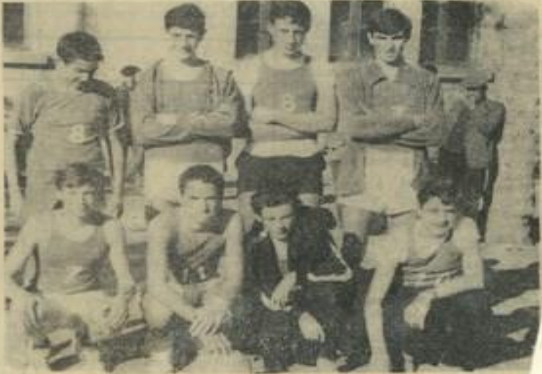
Notre équipe de cadets qui a fait une belle prestation devant les Carcassonnais.