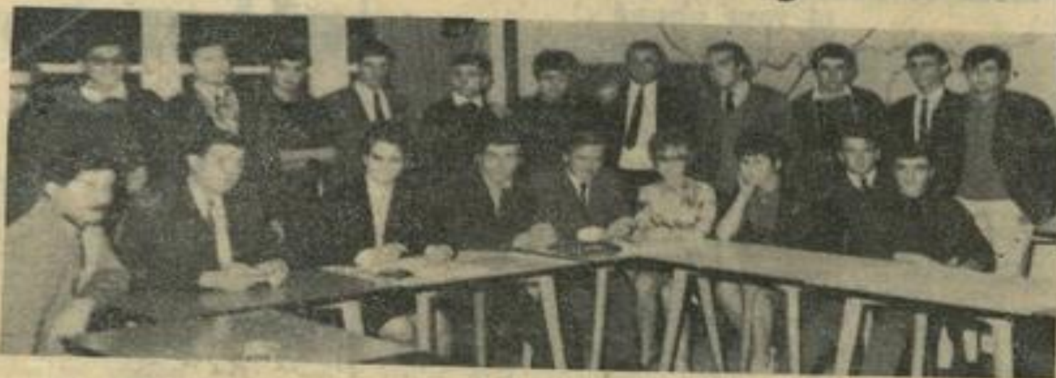
Les membres de la commission d'animation départementale, qui s'était réunie rue des Vosges