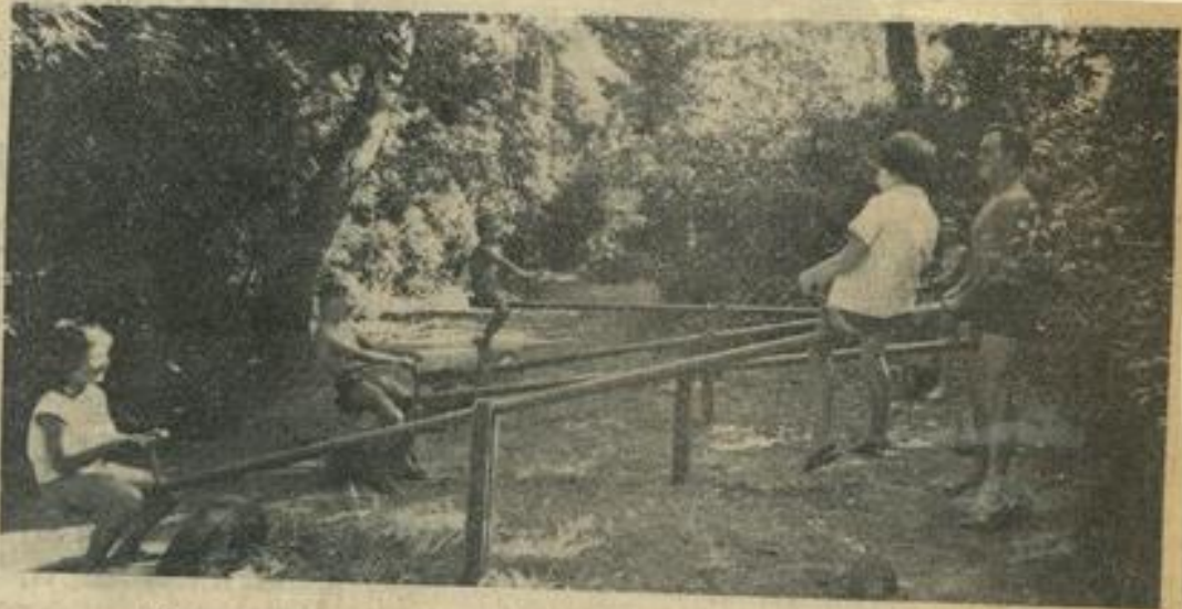
Affluence aux balançoires ! Les enfants des campeurs bénéficient actuellement des installations et jeux de l'ancien « Centre aéré » repris et améliorés pendant l'année scolaire.

Toutes ces commodités et la toute nouvelle tendance du touriste préférant le confort agréable, pittoresque et tranquille à la surpopulation des cités de toiles, expliquent la récente consécration du terrain de camping de la M.J.C. de Léznigan, et lui assurent un brillant avenir.