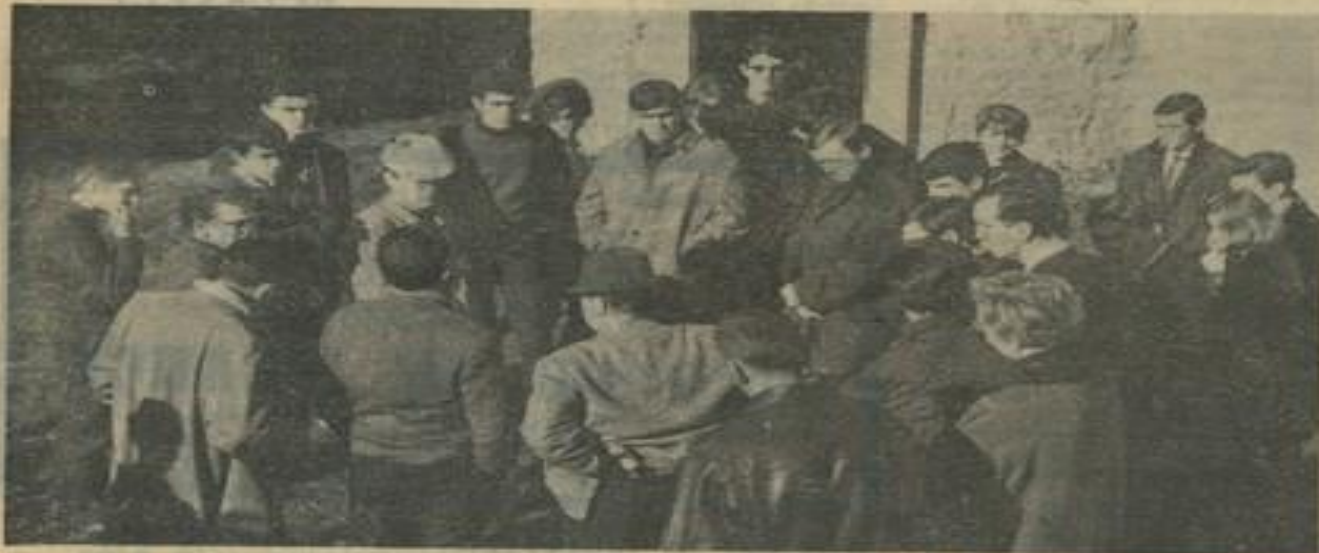
Les dirigeants et les membres des diverses Maisons des Jeunes de l'Aude, lors de leur visite, dimanche, à la station de Camurac.

Pour satisfaire chacun d'entre eux, des programmes de sorties seront établis en fonction des emplois et des jours de repos de chaque membre. Par exemple, le dimanche pour les scolaires et le lundi pour les apprentis et les ouvriers. Ainsi, chacun pourra pleinement profiter de sa journée et connaître des plaisirs nouveaux dans un merveilleux cadre de montagne. Le rêve deviendra réalité, une réalité que l'on n'aurait pu envisager sans l'effort collectif de nombreux dirigeants ouvrant pour un même but : apprendre à la jeunesse ce qu'est la joie de vivre.