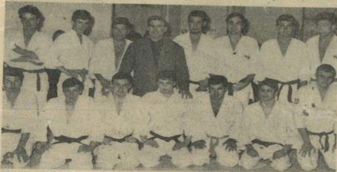
Le groupe des juniors qui participaient aux éliminatoires de mercredi. (Texte en rubrique sports.)