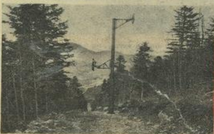
● Le grand téléski a été installé dans la « saignée » faite à travers la forêt.