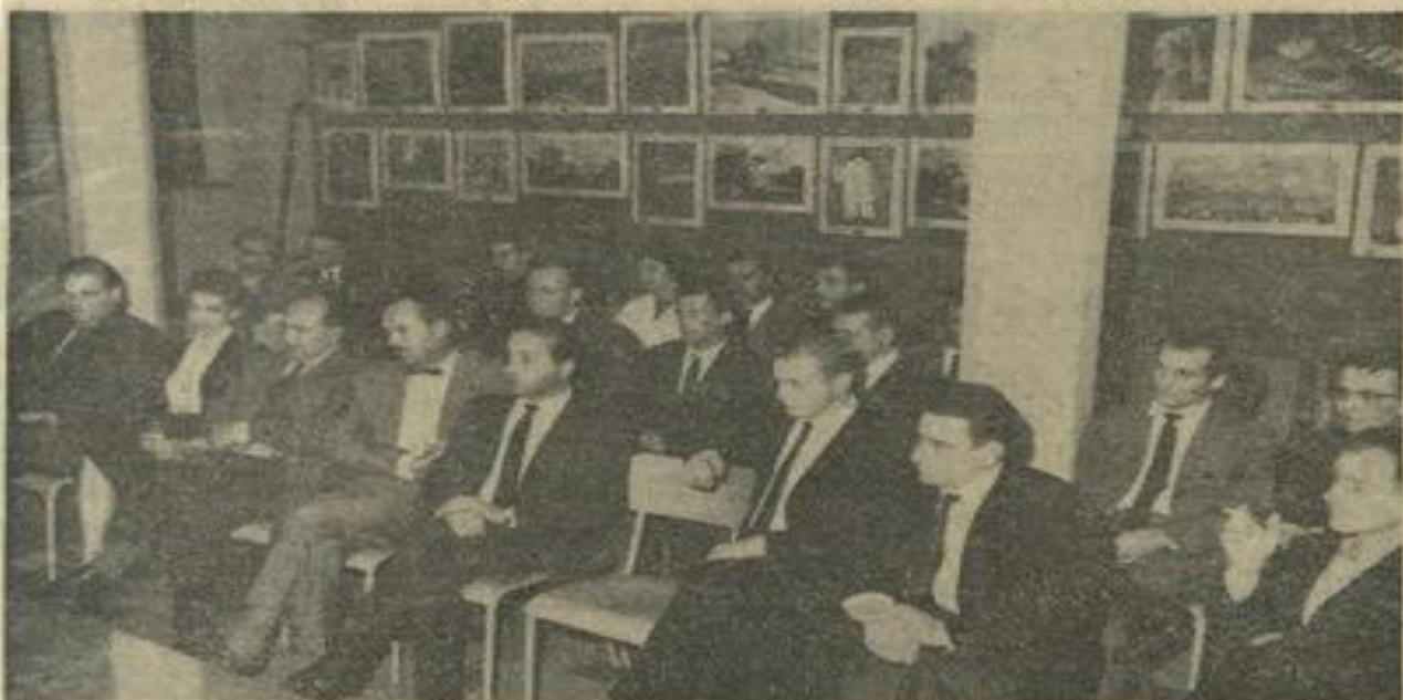
● Une vue partielle de l'assistance qui composait les présidents et membres des divers conseils d'administration de Narbonne, Saint-André, Bize, etc.

P RES de 80 délégués représentant les Maisons des Jeunes de Bize, Saint-André, Peyriac-de-Mer, Carcassonne, Narbonne, Lézignan, Espéras se sont réunis samedi soir dans notre ville.