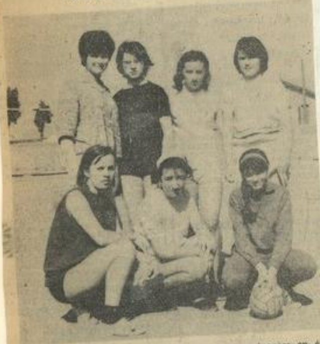
● Récemment constitué, le « sept » de l'École ménagère en était à ses premiers essais : ses gracieuses handballeuses feront certainement mieux la prochaine fois !

Dans le cadre du critérium de hand-ball féminin, a eu lieu samedi une rencontre opposant l'École ménagère à la Maison des Jeunes.