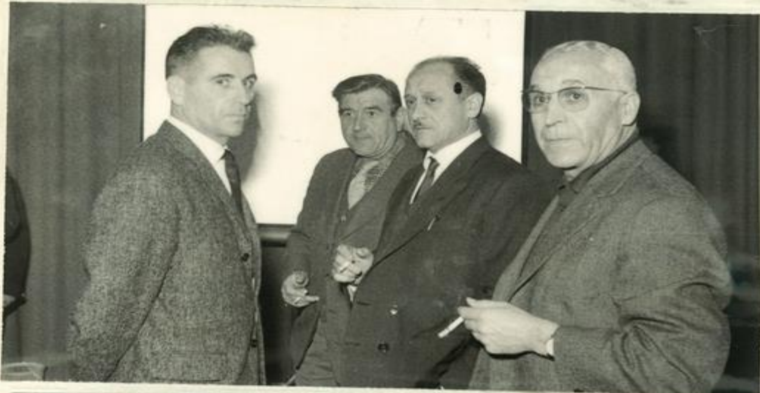
Coursier Paris Février 1964 Atome