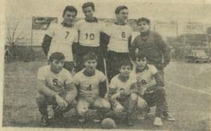
● Les cadets de Castelnaud-d'Aude qui participent au championnat de hand-ball C. I. S.