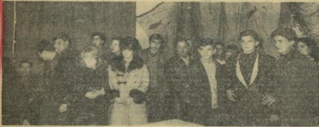
La nombreuse et juvénile assistance amplissant le Foyer, lors de la cérémonie marquant la relance de cette activité M. J. C. On peut remarquer l'original et ambiant « fond marin » qui tapisse les murs.

Les « moins de 17 ans » bénéficient à la Maison des Jeunes et de la Culture, d'une salle, au rez-de-chaussée, qui leur est exclusivement réservée, avec jeux appropriés dont la participation devient de plus en plus nombreuse.