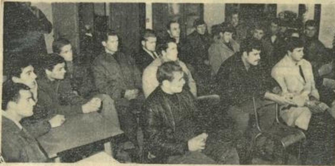
Une vue des stagiaires rassemblés dans l'auditorium de la M. J., durant la cérémonie d'ouverture.

Voilà qui sera susceptible, malgré le froid, d'attirer de nombreux curieux autour des barrières.