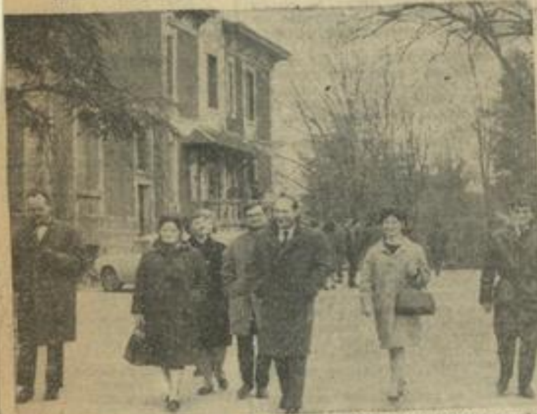
Sous la conduite de leurs hôtes, les membres de la délégation lézignanaise visitent les diverses installations M. J. de Romans, au cours de leur voyage félicite.

Le Conseil de Maison s'est déplacé à Romans pour y rencontrer leurs camarades Romanais. Chaleureusement accueillis, ils