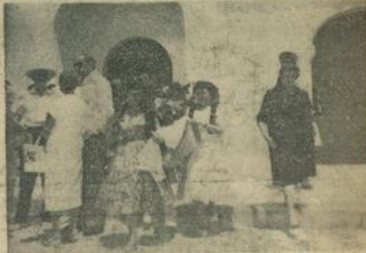
Repos, pêche, excursions : les vacanciers de la Maison des Jeunes à Ibiza n'ont pas failli aux devoirs du parfait touriste. Leur programme copieux comprenait la visite de tous les lieux de pèlerinage de la « perle des Baléares ». Les voici, à la sortie de la messe à la chapelle de San Antonio, mêlés à la foule des jeunes Espagnoles en mantilles et robes plissées.

San Eulalia est le premier village de l'île d'Ibiza, découvert par les gens de l'extérieur qui, il y a un demi-siècle environ commencèrent à s'intéresser à l'île. Aujourd'hui il partage, avec San Antonio, l'hégémonie touristique des Pityuses.