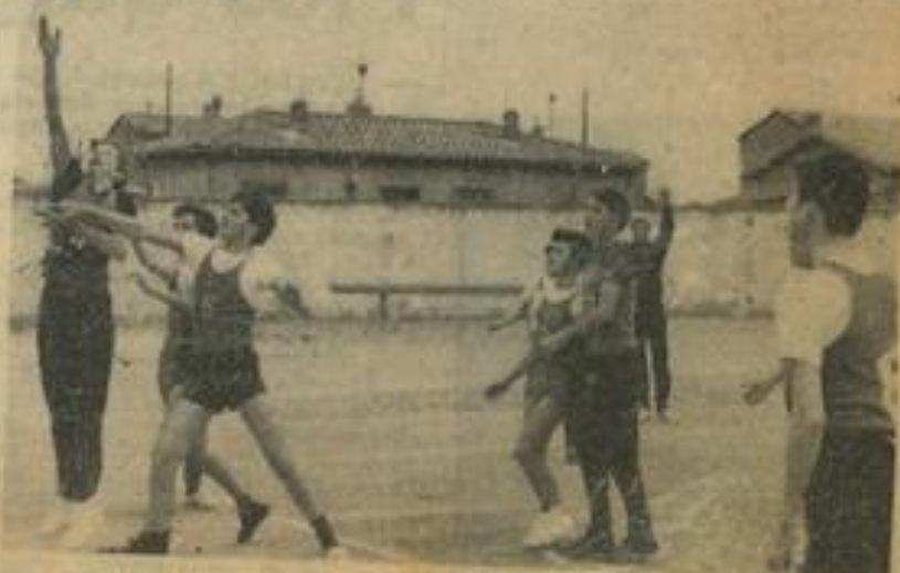
Une phase du match Léznagnan - Courson remporté par les minimes « vert et blanc », par 18 à 10, à l'issue d'une sévère et palpitante empoignade.