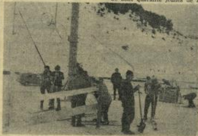
Le départ du téléski.