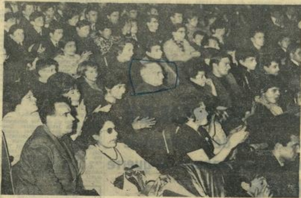
Presque autant de monde pour applaudir ces formations que pour Charles Aznavour.

Lundi, en soirée, se sont déroulées, au théâtre municipal de Carcassonne, les éliminatoires pour le championnat de France de guitare électrique.