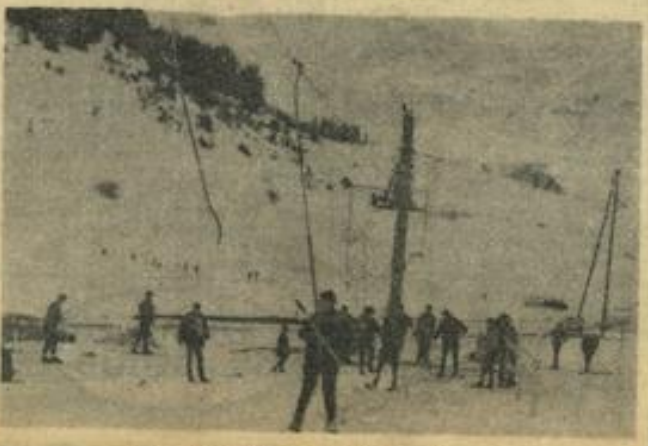
En route pour la grande pente.