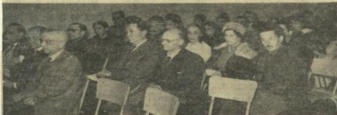
● Une vue d'ensemble de la nombreuse assistance qui garnissait, mercredi soir, la salle de réception de la mairie.