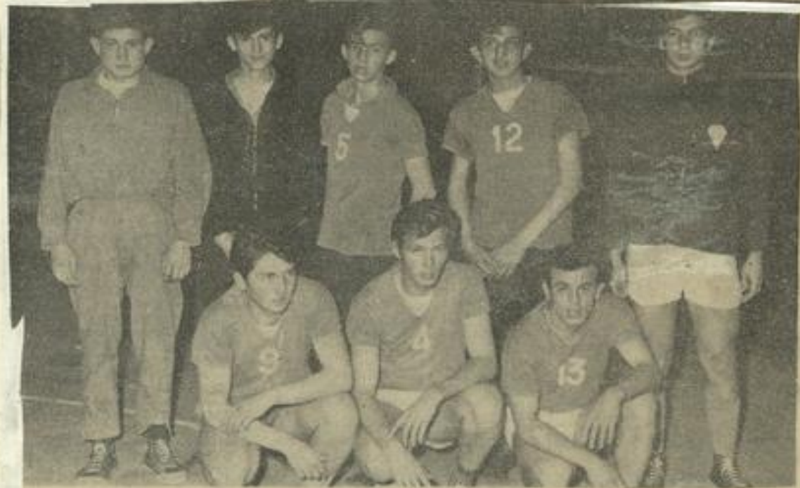
● Les deux équipes : — En haut : l'A. S. Police de Carcassonne. — En bas : Lézignan.