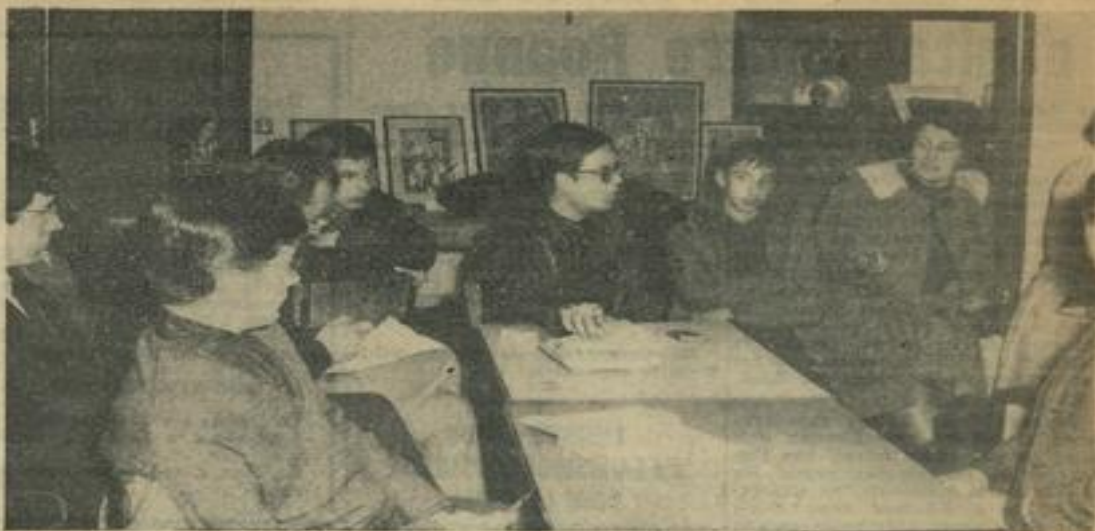
Voici, au cours d'une de leurs fructueuses séances, les jeunes membres du Conseil de Maison de la M. J. qui sont partis ce dimanche, à Romans, invités par la M. J. de cette ville.