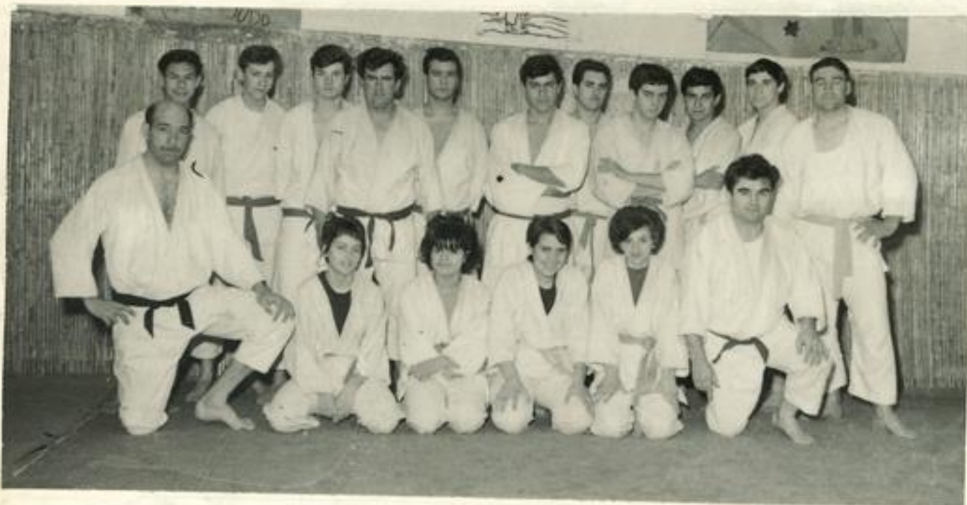
Lorca par M. D'ESTOUGUES