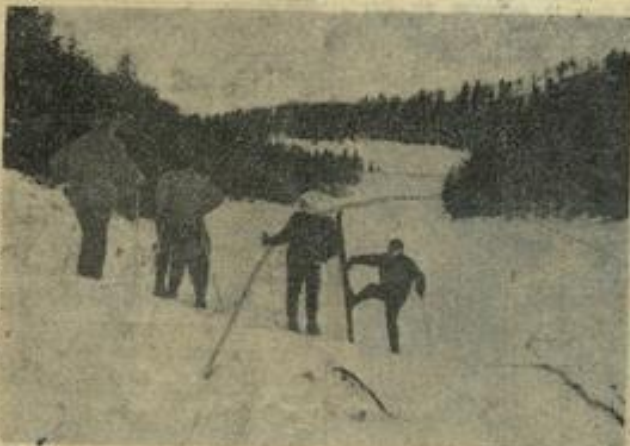
Premières leçons face à la piste.

Chaque participant devra verser la somme de 250 francs tout compris au départ de sa résidence.