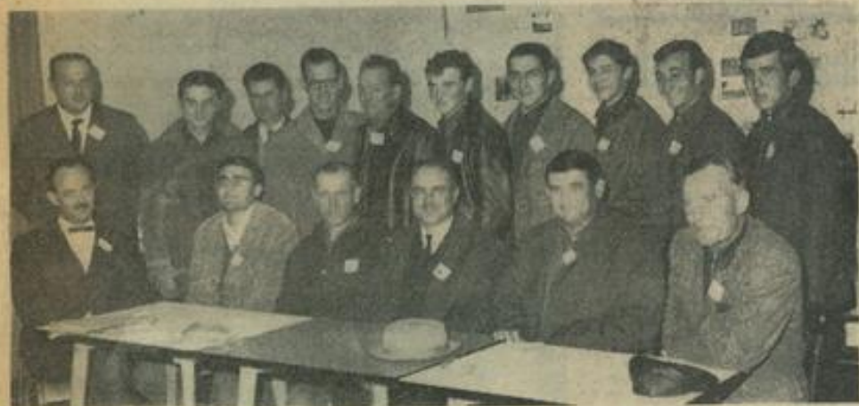
Le groupe des viticulteurs de Lézignan, réunis vendredi à la M. J. pour une ultime mise au point avant leur voyage.

Depuis le premier départ pour l'Allemagne, qui remonte en 1947, d'une délégation lézignanaise, la Maison des Jeunes et de la Culture a encouragé 114 jeunes et adultes de Lézignan et du canton à visiter ce pays. Voyages tantôt touristiques, tantôt sportifs, mais la plupart voyages d'études.