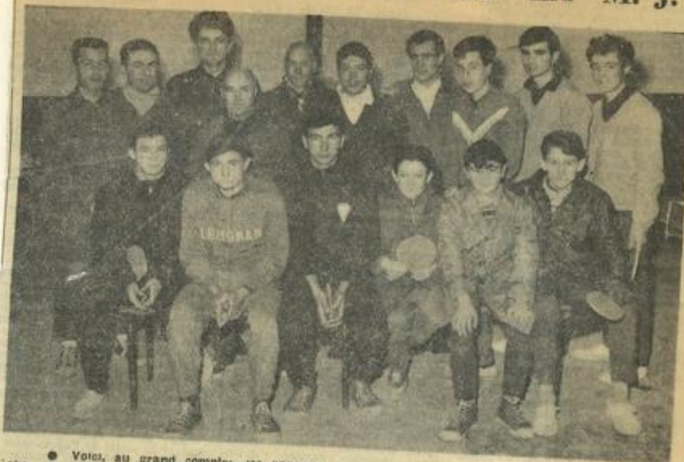
● Voici, au grand complet, les pongistes « vert et blanc » de la M. J., qui ont participé dimanche, aux championnats de l'Aude.