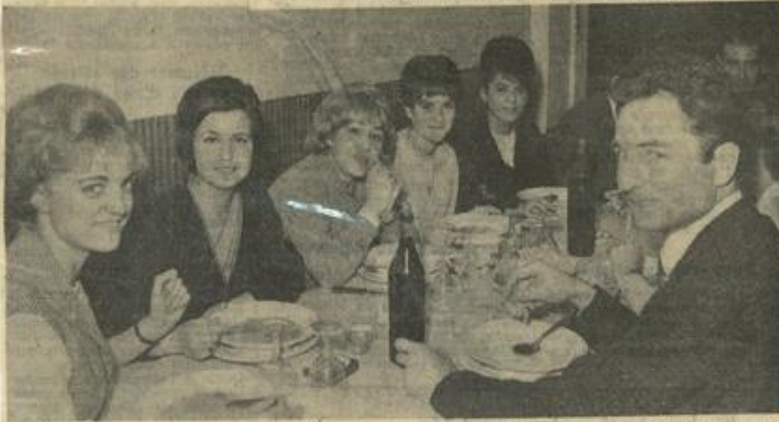
● Notre gracieuse jeunesse a également adopté la formule « D. D. ». En voici la preuve : les jeunes gens voisinant avec les moins jeunes à la table de ce dîner-débat servi au « Grand Soleil ». (Photos COSTESEQUE).

Au cours du repas, et après celui-ci, la discussion fut très animée. La formule « dîner-débat » crée une ambiance sympathique et personne n'hésite à donner son point de vue sur la question à l'ordre du jour. Pour M. Jouffroy ce fut une expérience personnelle, car c'était la première fois, qu'il animait un tel débat. Il a été enchanté, car par la diversité des questions posées élargit le sujet à traiter, ce qui est profitable à tous les participants