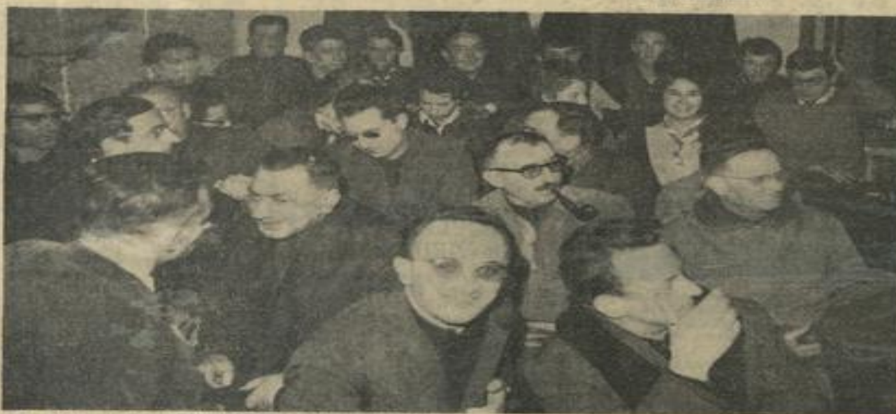
● Notre photo, une vue d'une partie de l'assistance avec au 1 er plan MM. les abbés aumôniers.

Un passionnant « libre-débat » s'engagea ensuite et clôtura la soirée à la satisfaction de tous et évidemment des membres de la 1 re de Lézignan.