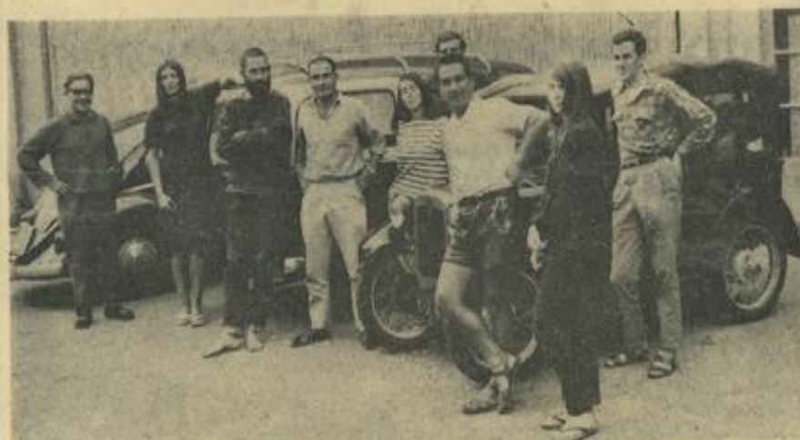
Avec un sourire largement optimiste, ces jeunes gens ont répondu à l'invitation de notre reporter photographe. Accourus de divers coins d'Europe, ils ébauchent déjà une vraie tour de Babel. Jugez-en par vous-même : un Français de Montereau (Seine-et-Marne), un Allemand d'Aix-la-Chapelle, un Polonais de Varsovie, deux Allemandes de Kassel et de Waldingen et un Anglais du Middtsex. Et ça ne