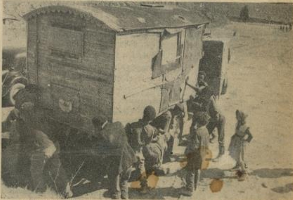
● D'ici la fin du mois présent, le « Stalag » sera libre. — Ici la mécanique est en proie à la défaillance, comme dans la fable : « Les femmes, les enfants, tous étaient descendus... »