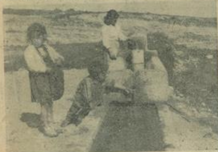
La borne-fontaine où l'eau claire coule en permanence est déjà fort utilisée. Et ces deux petits gitans semblent prendre beaucoup de plaisir à y toucher l'eau.

Tel qu'il a été réalisé, le relogement de nos gitans constitue un premier pas qui doit, si on y veille, avec bienveillance, certes, mais avec fermeté aussi, s'avérer concluant.