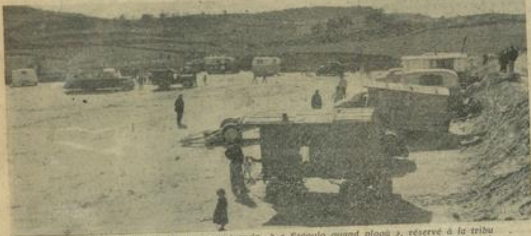
Une vue générale du nouveau terrain, à « Escoulo quand ploou », réservé à la tribu gitane. On voit que de nombreuses roulotte sont déjà installées.

La municipalité vient enfin de mener à bien la solution d'un problème extrêmement délicat à résoudre. Depuis longtemps, en effet, l'ouverture de la route de déviation et de l'extension qu'a prise la construction de cités nouvelles dans ce parage, assurément le plus pittoresque de notre ville, le campement gitane de « Stalag » cons-