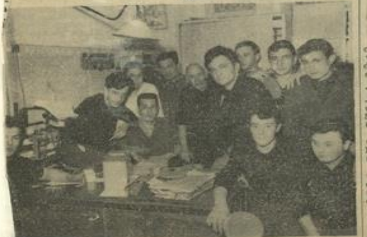
Les soirs d'entraînement, le bureau directeur de la M. J. se réunit en P. C. de nos pongistes dans lequel ces derniers préparent avec enthousiasme les moindres détails de leur grand tournoi régional.

SUIS VENDEUR Pipes alcool 6 hl Distillerie Marcerou Lézignan-Corbières (Aude)