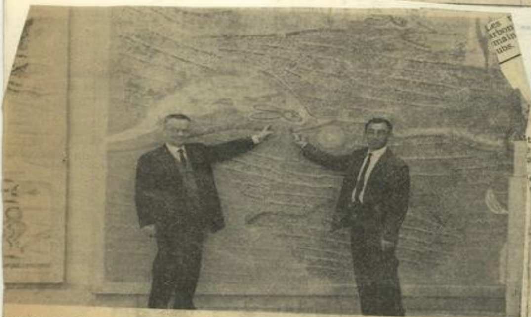
Les Arabes m'ont plu.

Surtout, elle s'est intéressée au problème de la jeunesse qui représente 52 % de la population et à qui l'Etat consacre 42 % de