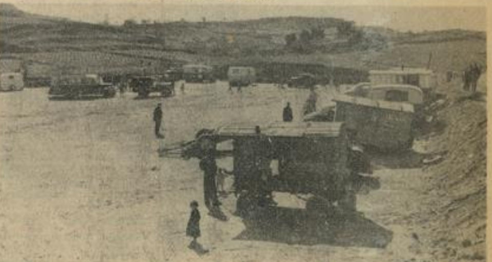
● Ainsi que nous l'annoncions hier mercredi à nos lecteurs, le terre-plein aménagé à « Escoulo Can Ploou » a reçu les premiers « campings » en provenance du « Stalag ». Voir le présent cliché.