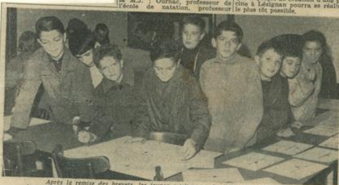
Après la remise des brevets, les jeunes « tritons » de l'école de natation admirent leurs diplômes. Photo Costesèque.)

Remercions M. Ournac qui se dépense pour apprendre à nager aux jeunes Léznagnanais et espérons que le projet de création d'une piscine à Léznagnan pourra se réaliser le plus tôt possible.