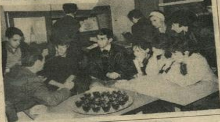
LES CADETS VIS