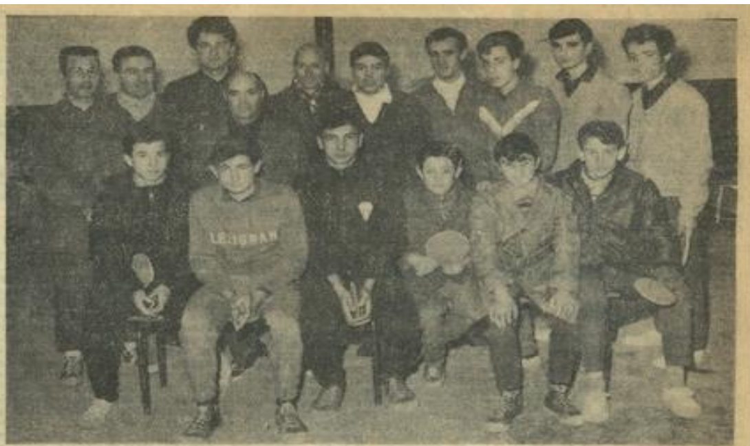
Voici, au grand complet, les pongistes « vert et blanc » de la M. J., qui ont participé dimanche, aux championnats de l'Aude.

Parmi les nombreuses toiles accrochées aux cimaises, nous avons noté des créations personnelles de l'auteur rapportant avec beaucoup de chaleur des paysages méditerranéens (quelques-uns narbonnais), côté d'une série de reproductions de tableaux de grand maître.