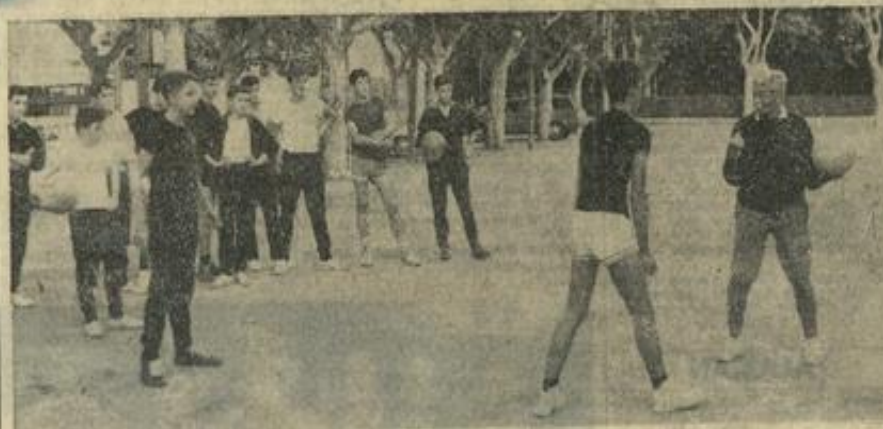
L'entraînement de lundi soir du Basket-Club avait réuni, malgré l'époque peu propice des vendanges, la presque totalité des équipiers. Dame ! c'est que pour la première fois, ce training était placé sous la direction de la prestigieuse internationale Ginette Mazel. Au cours de la séance, au square, les jeunes basketteuses écoutent attentivement les conseils techniques que la capitaine de l'équipe de France prodigue à l'une de leurs camarades.