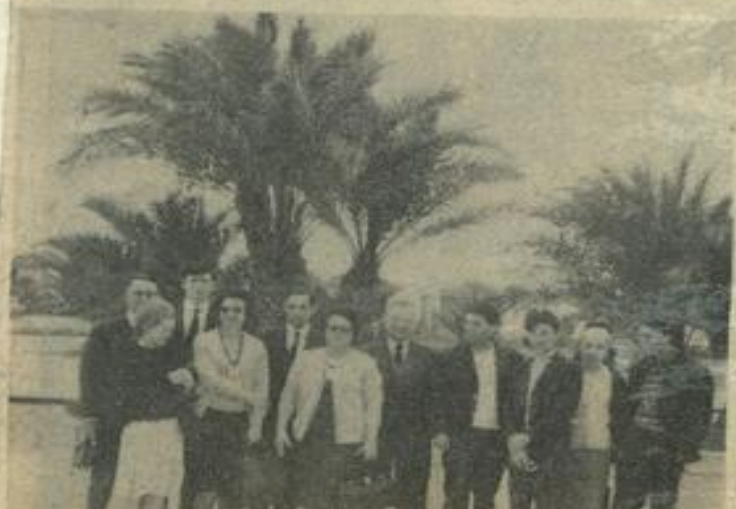
● Pour l'album-souvenir, devant la piscine du palais du président Bourguiba. (Reproductions Cotage)