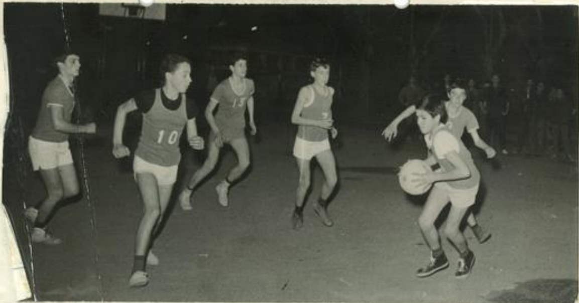
26/3/64 MJC Lézignan contre MJC Narbonne Nîmes