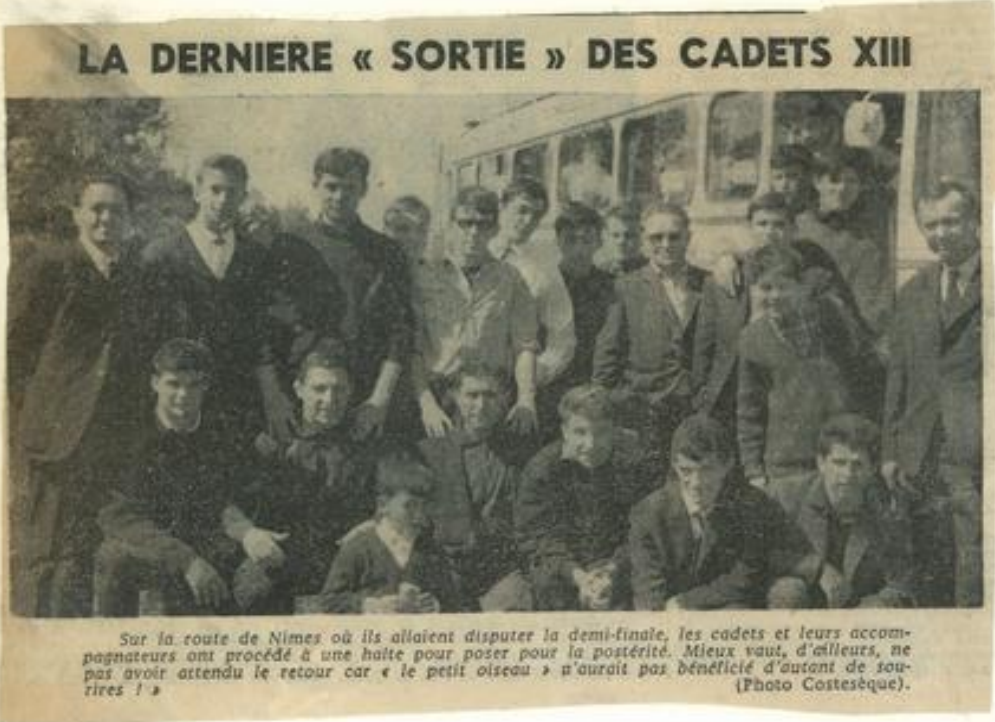
LA DERNIERE « SORTIE » DES CADETS XIII

Dans ce numéro, beaucoup de nouvelles des M.J.C. : Colombes, Lézignan, Dijon-Grésilles, Carcassonne, Tervilhe, etc. Le compte rendu du congrès algérien de l'agriculture montre d'autre part l'importance du problème agricole en Algérie et les buts à atteindre pour améliorer les rendements et les ventes.