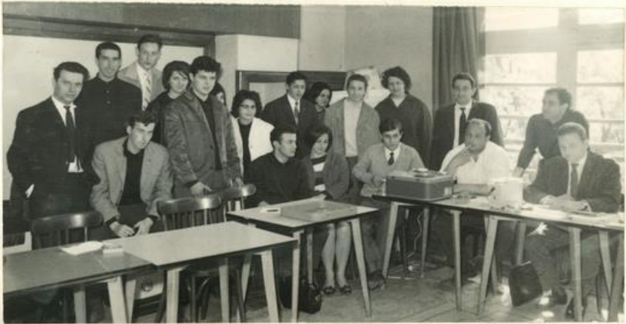
Week End « Connaissance de l'Aude » 9 et 10 Mai

dispositions à prendre. LA M.J.C. INVITEE A UN COLLOQUE INTERNATIONAL Du 25 au 30 mai, aura lieu un colloque international sur « Les Loisirs de la jeunesse non organisée », colloque où une trentaine de participants représenteront l'Allemagne, la Suède, la Suisse, le Danemark, la France. Parmi les six représentants de la France, une place a été réservée à notre Maison des Jeunes. COOPERATIVE