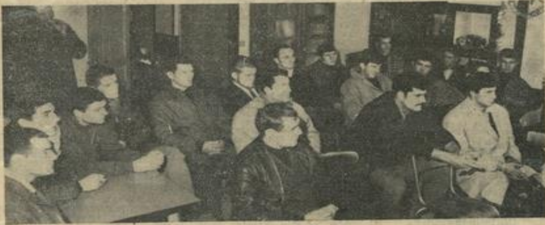
● Une vue d'ensemble de stagiaires présents au cours de la réception à la Maison des Jeunes.

A chaque quine, 1 JAMBON ou 1 poulet Venez nombreux encourager Salle chauffée par les soins