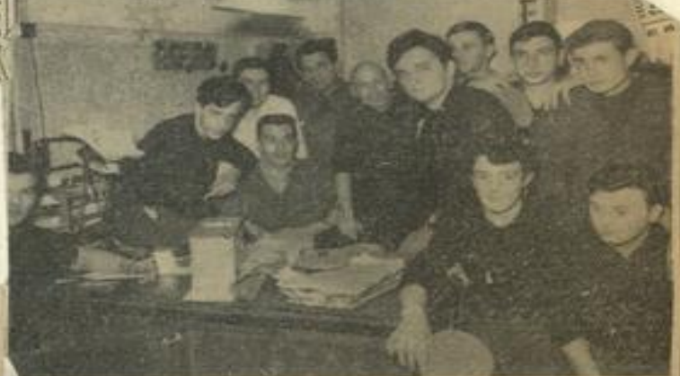
Les soirs d'entraînement, le bureau directorial de la M. J. se transforme en P. C. de nos pongistes dans lequel ces derniers préparent avec enthousiasme les moindres détails de leur grand tournoi régional.

C'est donc à une très grande journée pongiste, vouée à un succès certain, qu'abritera Léznigan le dimanche 12 avril.