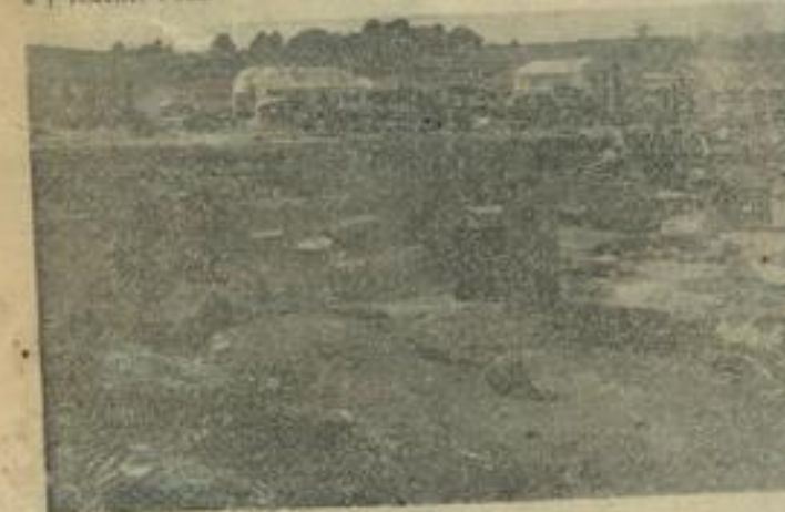
Il faudra que les futurs résidents gitans s'imposent une discipline quotidienne pour que leur camp n'offre plus cet aspect de saleté et d'abandon qu'on avait laissé « croître et embellir » au « Stalag ».