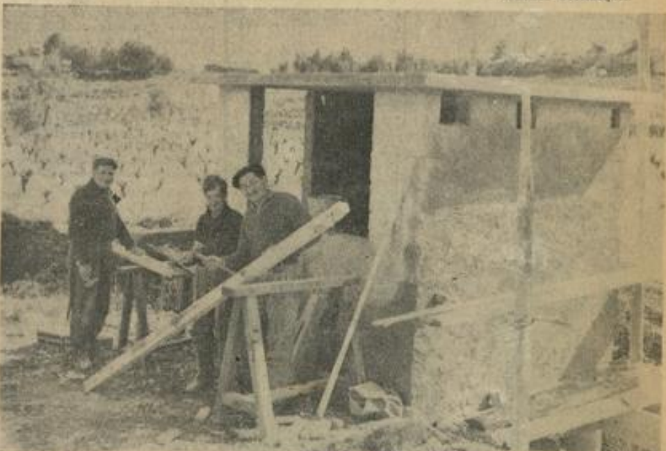
● Le camp « d'Escoulo Can Ploou » disposera d'un groupe sanitaire. Ce groupe, livré aux services municipaux, est actuellement en bonne voie de finition.